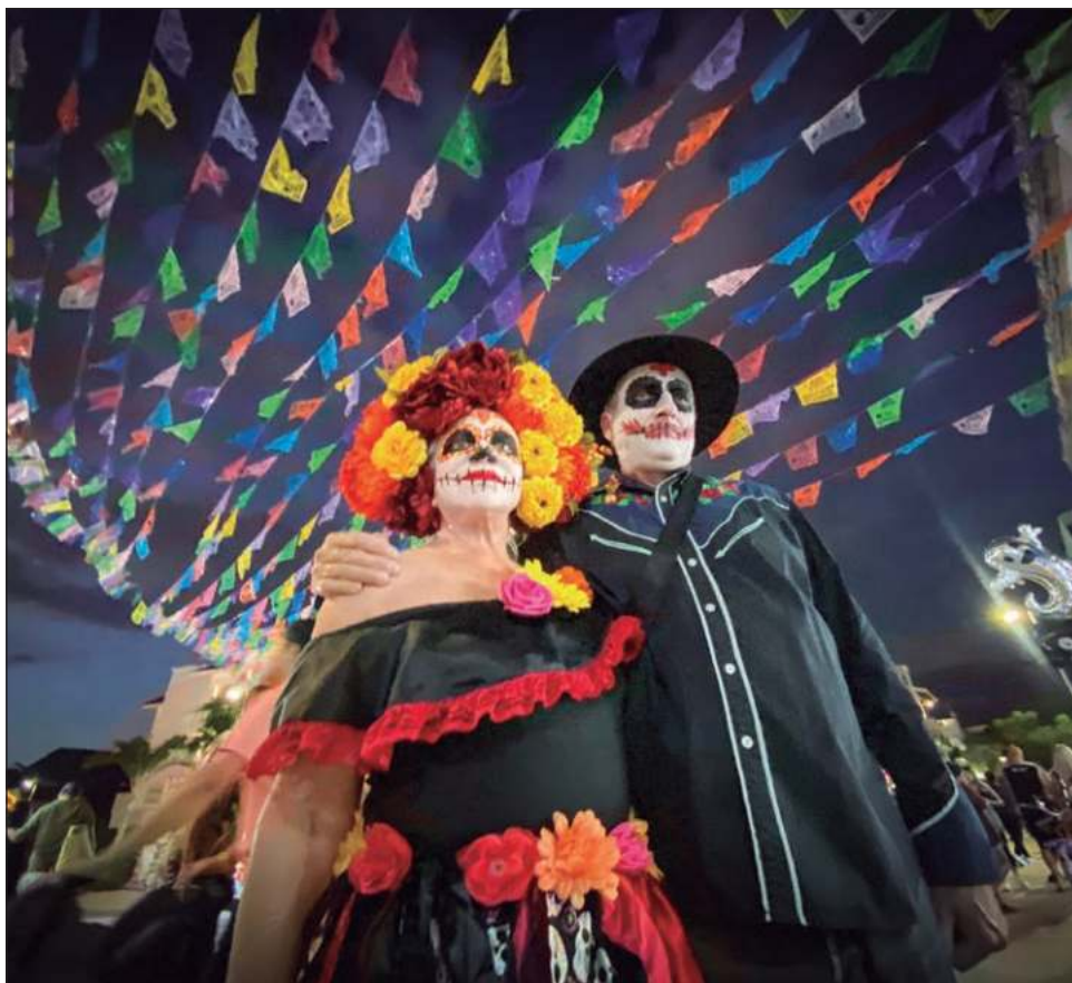
▲ La entidad será sede en octubre de eventos culturales y convenciones como el Cancún Travel Mart, el ATMEX 2024 y el Festival de Vida y Muerte.

A principios de noviembre se tendrá también el Festival de Vida y Muerte, en donde Quintana Roo juega un papel preponderante y una serie de eventos que estarán ayudando a la ocupación, al movimiento del turismo del estado y apuntalando con ello al fin de año.