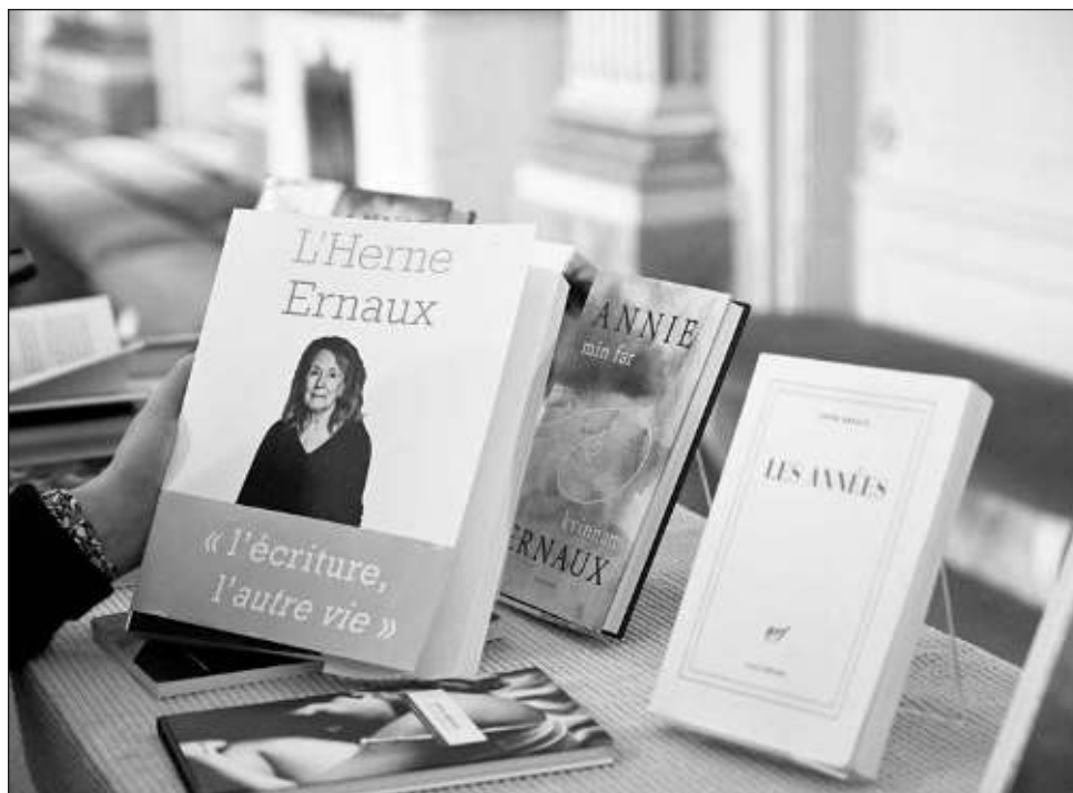
▲ Entre las predicciones de este año están Can Xue, Anne Carson y Liudmila Ulitskaya.

También, el japonés Kenzaburo Oé dijo en 1994 que llegar ese país le recordó la novela de su infancia: El maravilloso viaje de Nils .