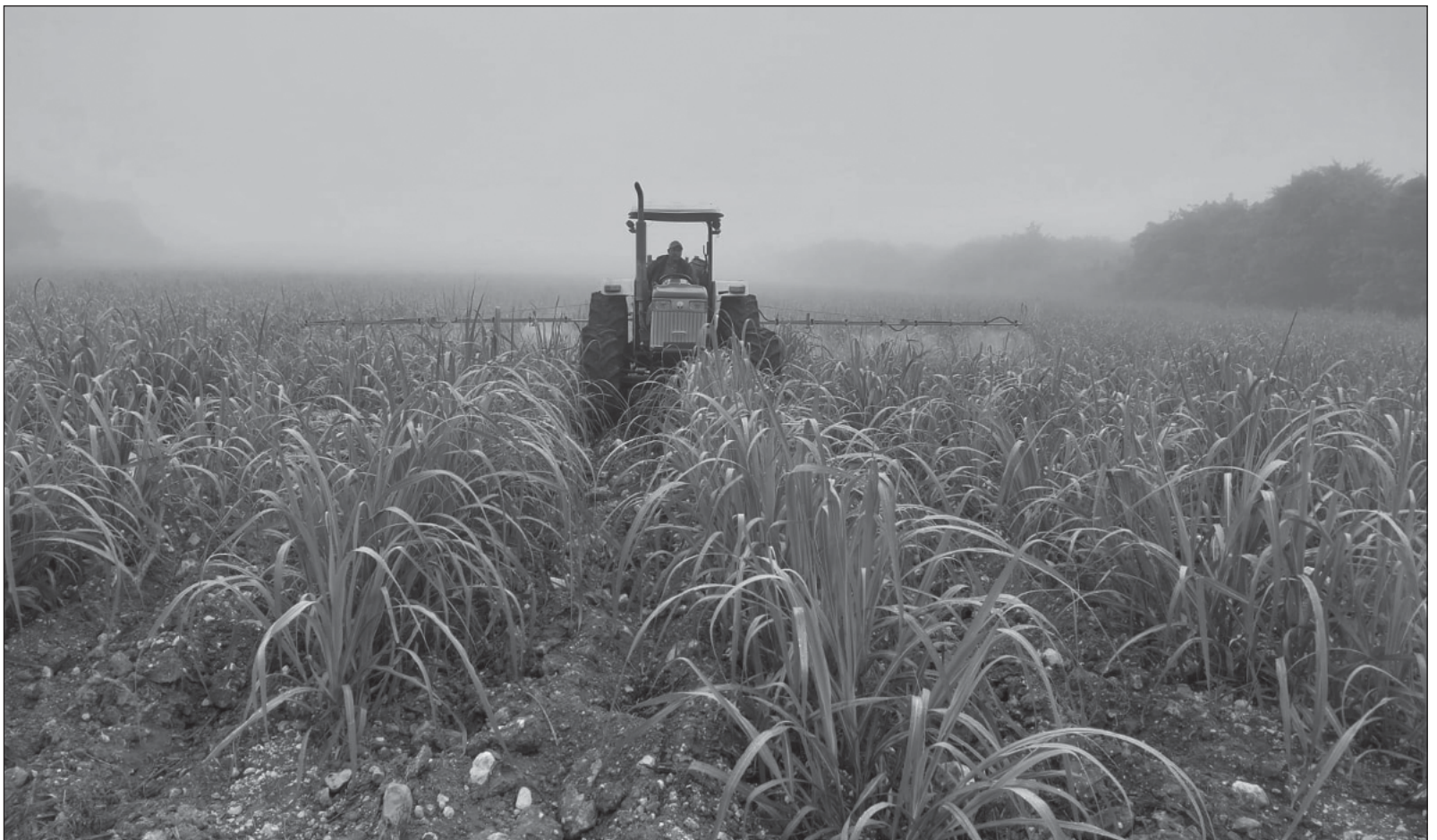
▲ "Imaginemos un programa estatal de alimentos escolares en el que se sirven alimentos producidos en la misma comunidad o región".