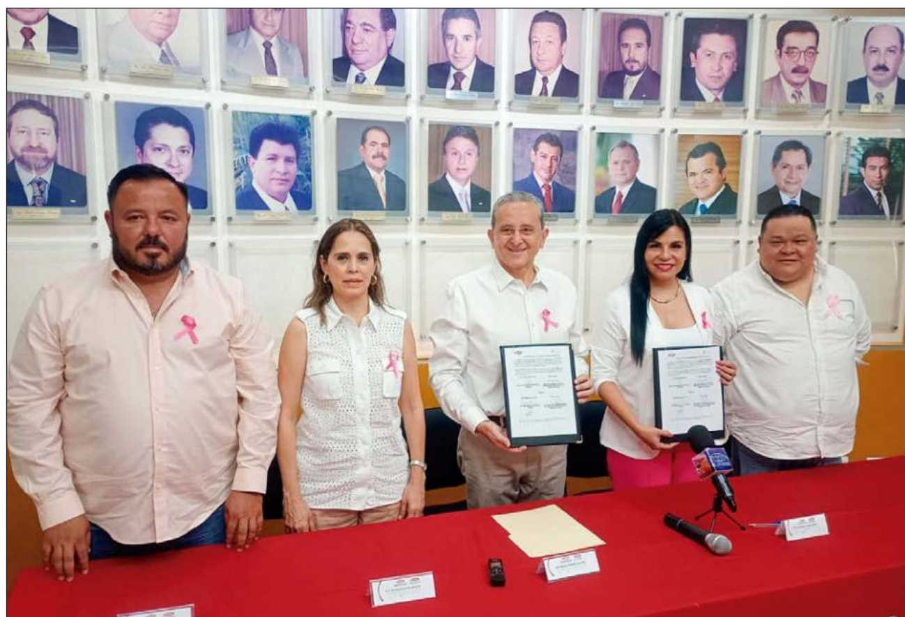
▲ La Fundación Tócate está dedicada a la concientización sobre el cáncer de mama y el cervicouterino en el país. Este tipo de cáncer sigue siendo la primera causa de muerte para la mujer en Yucatán, en México y en el mundo.

“La autoexploración es una práctica que hacemos con la mano de manera mensual. Y la mastografía es el estudio con el mastógrafo que hacemos de manera anual. ¿Cuándo se deben hacer las mujeres la mastografía? Después de los 40 años y el ultrasonido mamario antes de los 40 años”, expresó la presidenta. Estos estudios deben realizarse cada año. Para las mujeres aún menstrúan, se