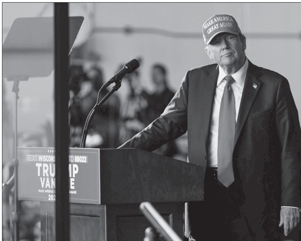
▲ Aumenta retórica proteccionista de comercio del candidato republicano.

En su momento, la entonces virtual presidenta de México, Claudia Sheinbaum, señaló veía que "muy difícil" que Estados Unidos impusiera aranceles a los automóviles.