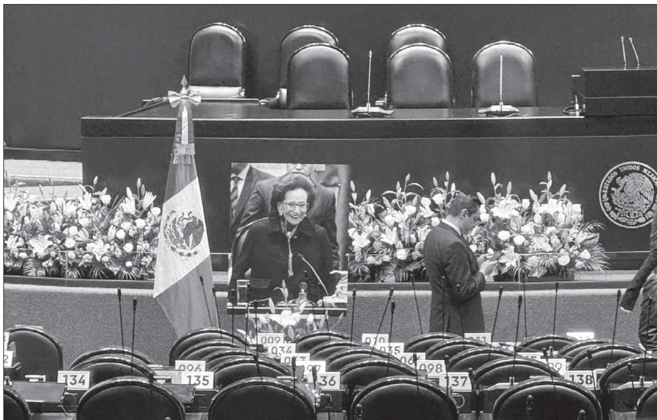
▲ El acto inició con apenas un centenar de los 628 legisladores –senadores y diputados– citados a la ceremonia; a personal de la Cámara de Diputados de distintas áreas se les instruyó a ocupar las curules para rellenar los huecos.

Minutos antes de las 12 horas, llegó la carroza fúnebre en la que fue trasladado el cuerpo de la ex legisladora. Fue recibido por dipu-