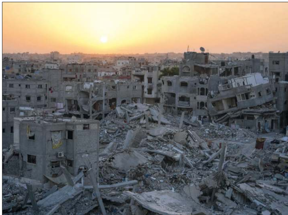
▲ El Estado judío culpa a Hamas por la destrucción. Aseguran que el ataque de ese grupo palestino contra Israel el 7 de octubre del año pasado —en el que murieron unas mil 200 personas y unas 250 fueron tomadas como rehenes— provocó el conflicto.

Israel culpa a Hamas por la destrucción. El ataque de ese grupo palestino contra Israel el 7 de octubre del año pasado —en el que murieron unas mil 200 personas y unas 250 fueron tomadas como rehenes— provocó la guerra. Israel dice que Hamas incrustó gran parte de su infraestructura militar, incluidos cientos de kilómetros de túneles, en áreas densamente pobladas donde se libraron algunas de las batallas más duras.