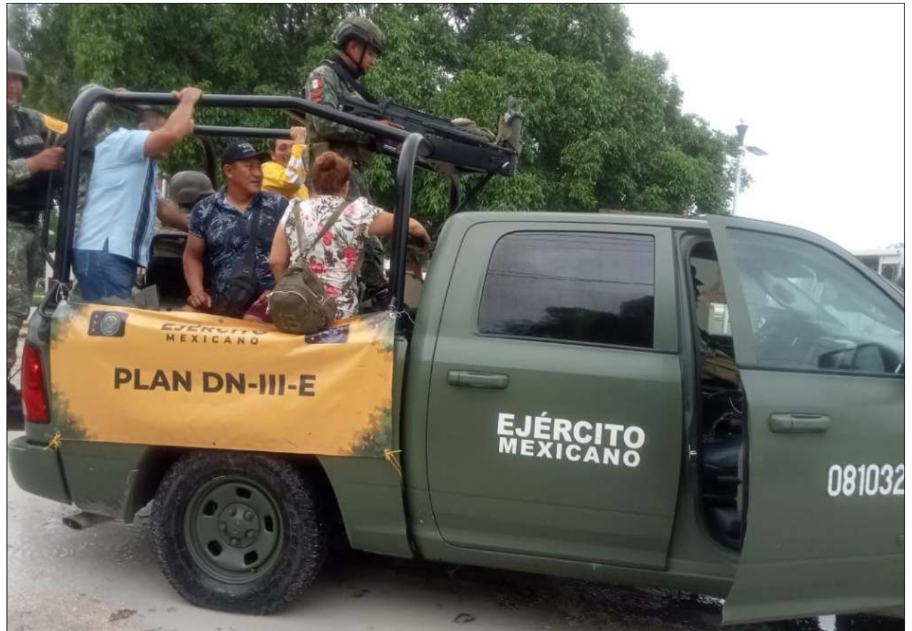
▲ Unas 2 mil personas fueron resguardadas ante las condiciones extremas por el paso de Milton.

Así como fue ella quien informó de la suspensión de labores y clases, fue la misma mandataria quien dio a conocer la evacuación que inició minutos antes del mediodía y la cual duró cerca tres horas mientras pobladores lograban recabar objetos personales de