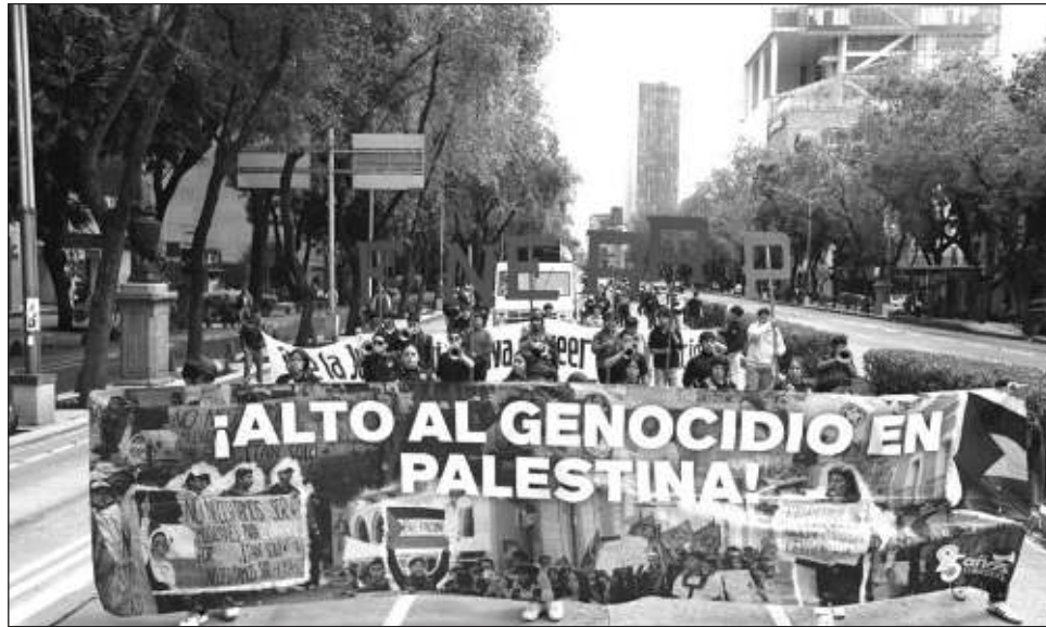
▲ La movilización inició liderada por su banda de guerra, seguida de un cartel con la leyenda "No necesitamos ser musulmanes para levantarnos por Gaza, tan solo necesitamos ser humanos".

Seguido se dio lectura a un poema y continuaron