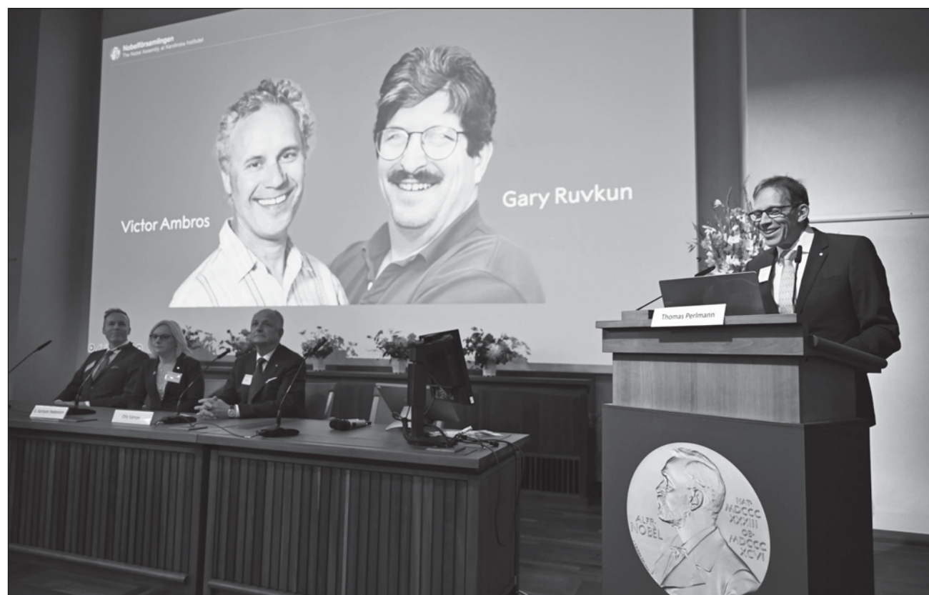
▲ Los dos investigadores, que colaboran juntos pero trabajan separados, llevaron a cabo sus proyectos a partir de un gusano redondo de un milímetro para determinar por qué y cuándo se producen las mutaciones celulares.

"¡Es increíble!", dijo por teléfono Ruvkun a Afp tras conocer la noticia, mientras su perro ladraba frente a la