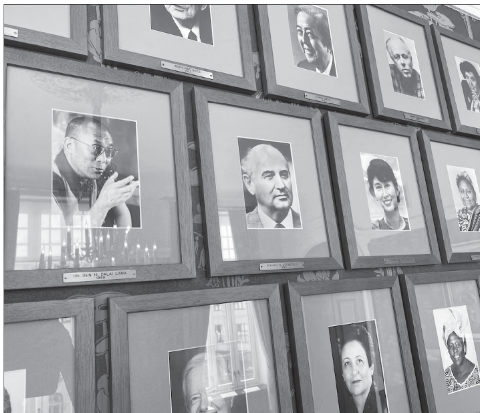
▲ Los célebres galardones de Medicina, Física, Química, Literatura, Paz y Economía se anunciarán a partir de este lunes y hasta el 14 de octubre en Estocolmo y Oslo.

El Nobel de la Paz, el más destacado de la semana, nunca ha sido tan difícil de predecir, con las catástrofes multiplicándose por todo el planeta. El premio, creado al igual que el resto –a excepción del de Economía–, por el célebre inventor sueco Alfred Nobel (1833-1896), será atribuido el 11 de octubre próximo.