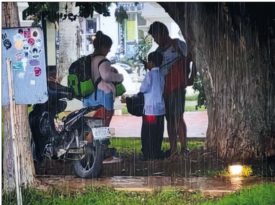
▲ Desde el sábado, la alcaldía de Campeche comenzó a colocar en calles y muelles las respectivas banderas para alertar a los ciudadanos del huracán.

En cambio, la alcaldía de Campeche desde el sábado comenzó a colocar banderas de alerta azul de peligro mínimo en la capital y en los muelles para tener avisados a los ciudadanos de la posible contingencia. Para las 9 horas del lunes, Seprocicam cambió a bandera verde, que significa peligro bajo, y en fase de acercamiento.