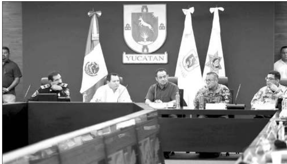
▲ Al corte de las 17 horas, aproximadamente 5 mil personas habían sido evacuadas de los municipios costeros, y se habilitaron 391 refugios en todo el estado.

A través de redes sociales, el gobernador Joaquín Díaz