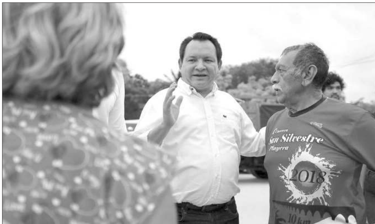
▲ “Soy de puerto y sé que es muy difícil que la gente decida irse porque tienes tus pertenencias, si hay inundación pierden a sus animalitos que tienen en su traspato, pero es importante salvaguardar en este momento la integridad de las familias”, destacó Díaz Mena.

El gobernador visitó los puertos de Celestún, Sisal, Progreso, Chuburná, Chelam, Chicxulub, Telchac y Dzilam de Bravo para constatar la habilitación de los