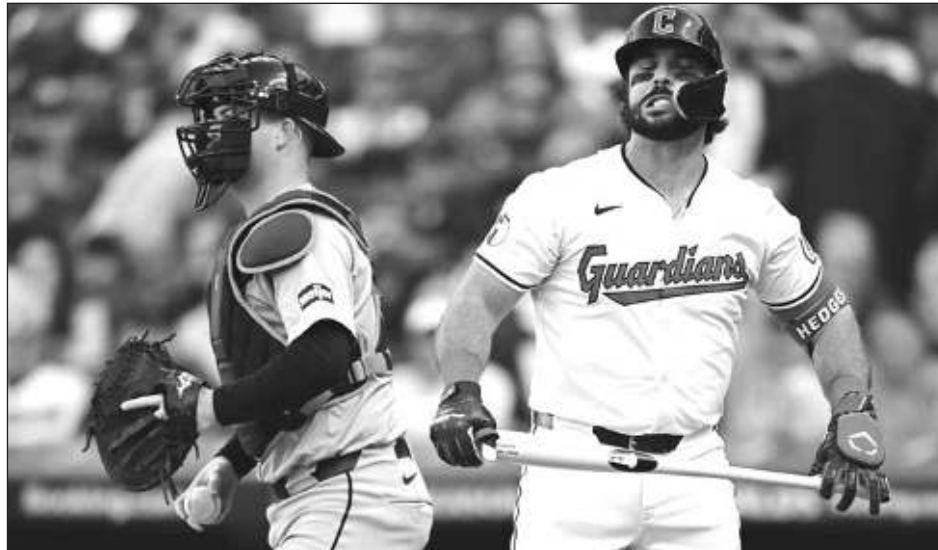
▲ Austin Hedges y los Guardianes fueron dominados por el estelar Tarik Skubal.

Jake Rogers conectó un sencillo con dos outs y Trey Sweeney prosiguió con otro sencillo. Carpenter, quien ingresó al partido en el octavo rollo como bateador emergente, demolió un pitcheo en