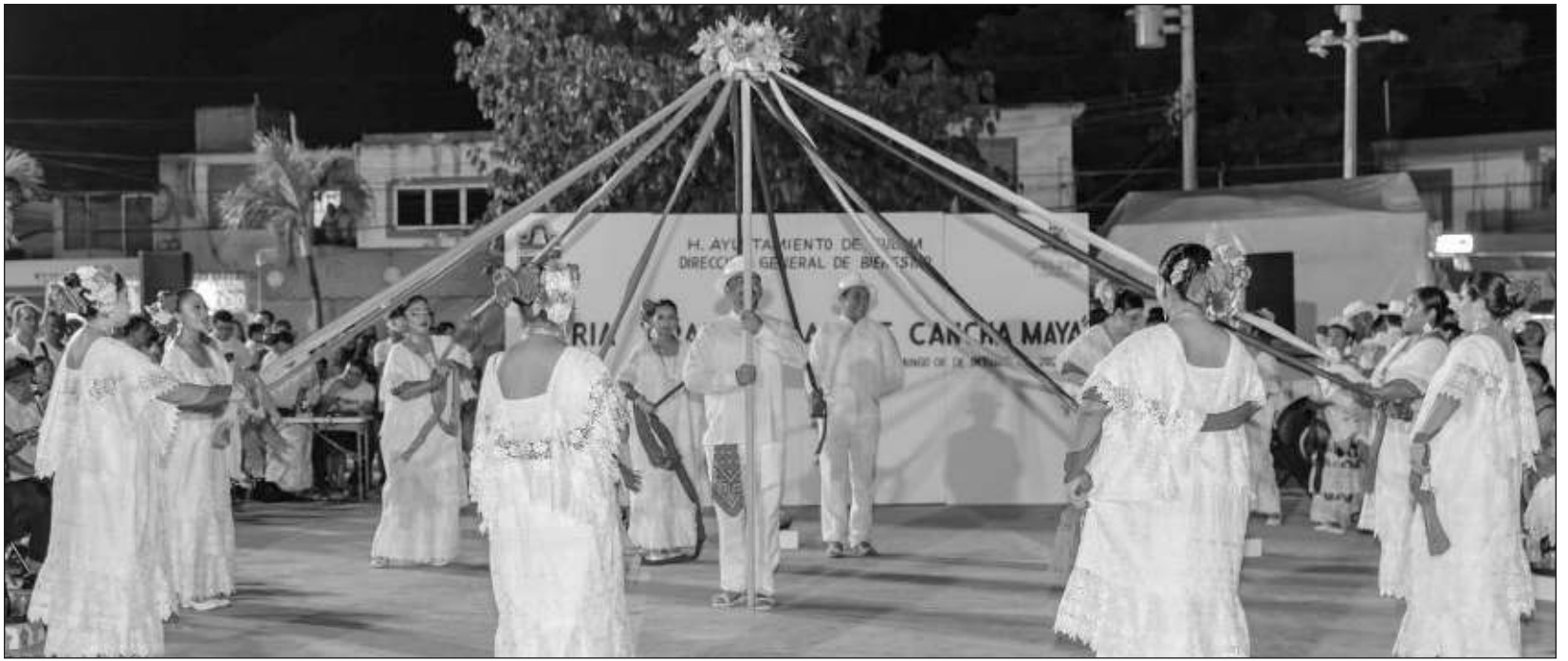
▲ La Fiesta Tradicional de la Cancha Maya reúne a gente local, turistas mexicanos y extranjeros, que disfrutan de los juegos de feria, antojitos y actividades tradicionales como bailes y el "matan", que consiste en preparar comida tradicional y obsequiarla a los habitantes del noveno municipio.