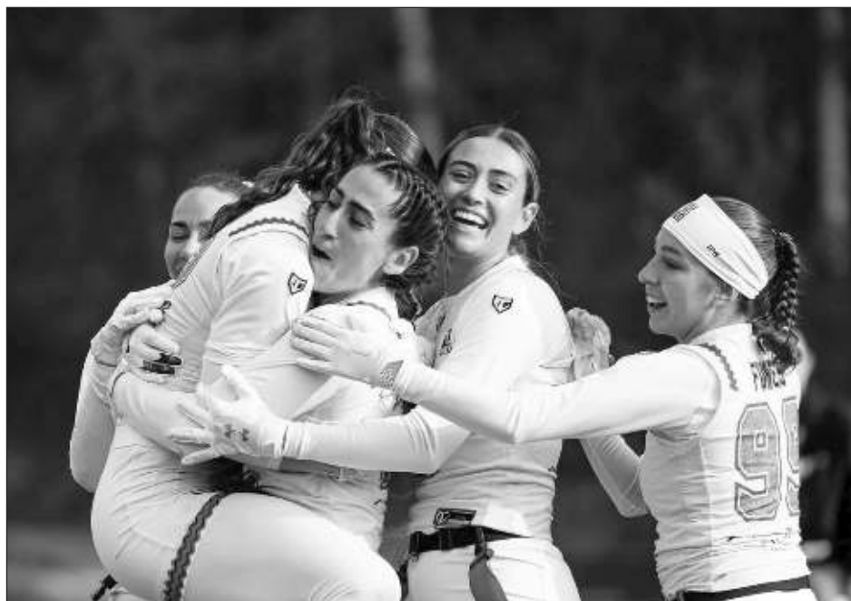
▲ La selección de “flag football” es la actual subcampeona del mundo.

“Es muy grato observar cómo el público en las gradas aumenta, hay mucho