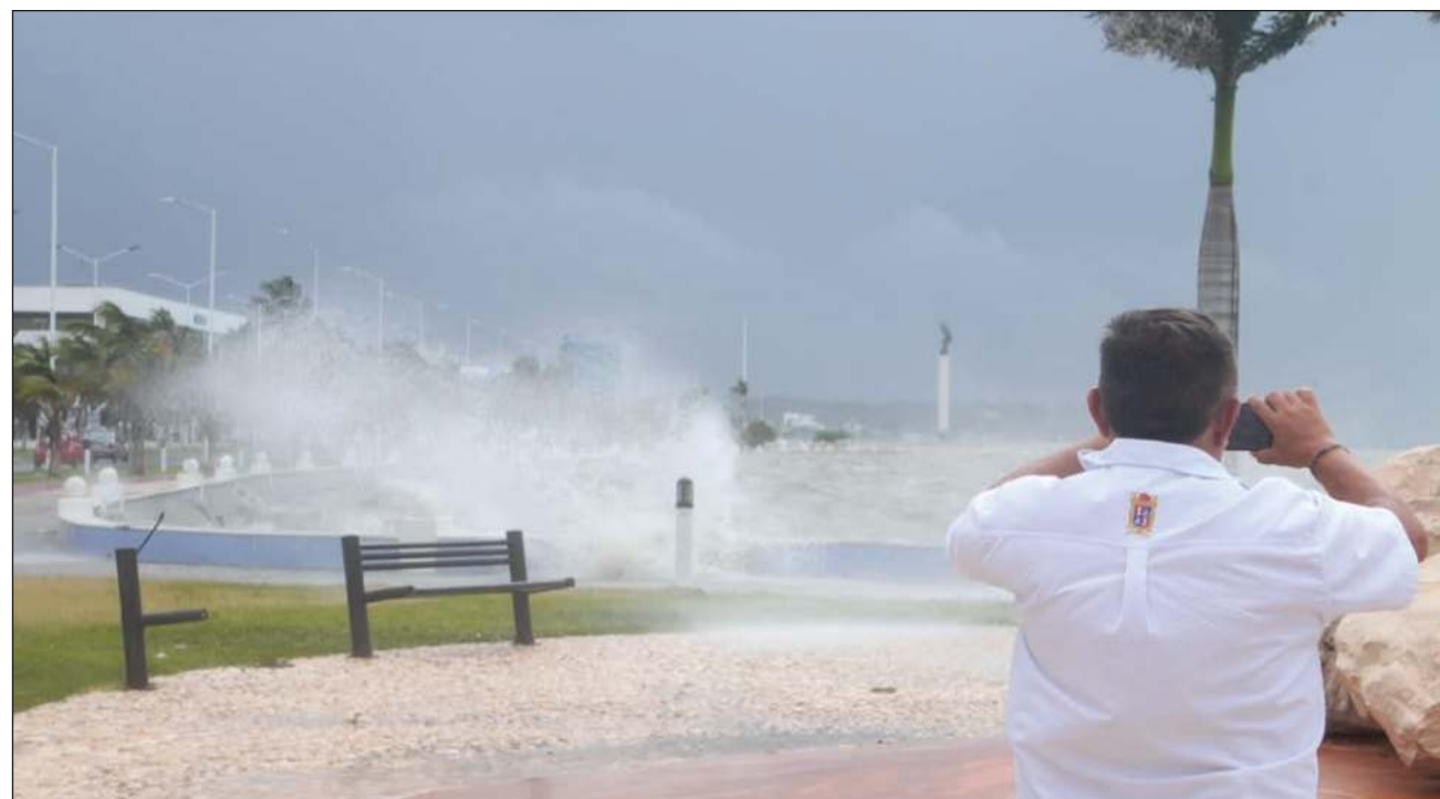
▲ La gobernadora de Campeche, Layda Sansores, informó ayer que los vuelos comerciales en el Aeropuerto Internacional Ingeniero Alberto Acuña Ongay "están cancelados (...). Se es-

pera que el día de mañana (hoy martes) se reinicien." El recinto permanecerá abierto y en operación para atender viajes de emergencia o de operatividad.