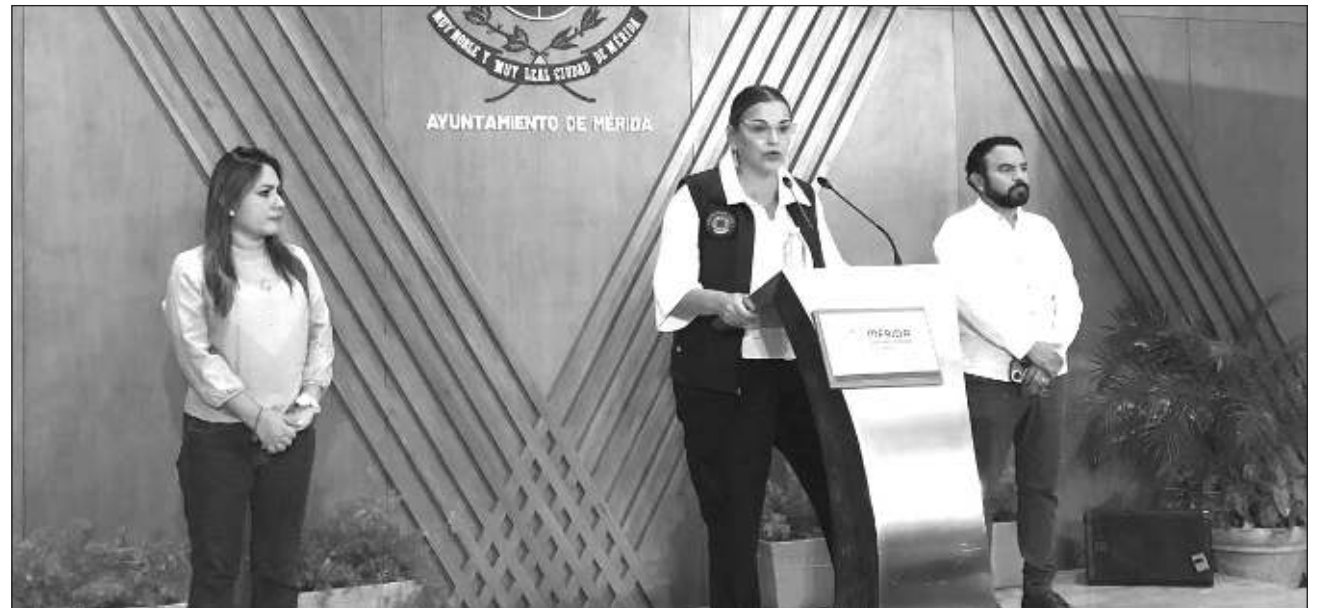
▲ Protección Civil municipal detalló que la Red de Refugios Temporales cuenta con 64 inmuebles para recibir a las personas que lo requieran, espacios que están disponibles para que las familias acudan incluso con animales de compañía.

Debido a su circulación, se esperan rachas de viento de 130 a 140 km/h hasta la madrugada de mañana martes 8 de octubre principalmente en la zona norte del municipio. También se espera lluvia de intensidad