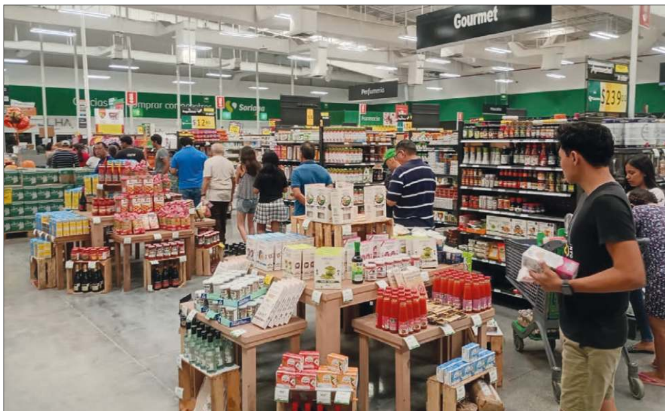
▲ Supermercados como el Chedraui de plaza Las Américas y el Soriana de Plaza Dorada lucieron abarrotados.

Del lado de la colonia Chenkú, las ferreterías tuvieron menos afluencia de personas. Los responsables de estos negocios explicaron que apenas les dio tiempo para prepararse y creen que la gente se vio tomada por sorpresa por el fenómeno meteorológico. En menor medida, también las purificadoras de agua tuvieron clientela, aunque poca.