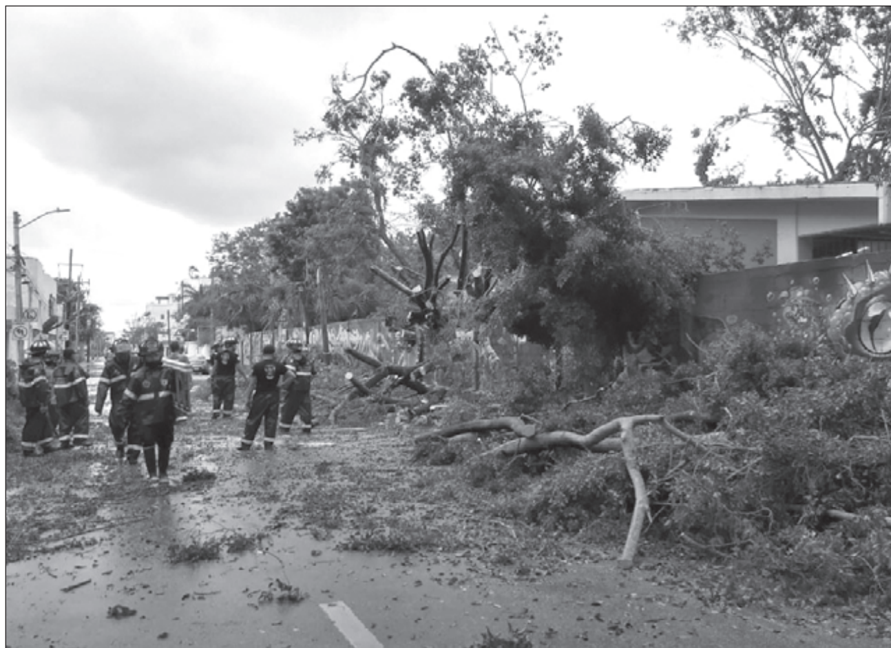
▲ Personal de Protección Civil y Bomberos se abocaron al corte, poda y retiro de árboles derribados.