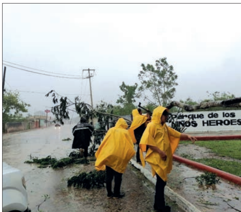
▲ Las autoridades reportan saldo blanco tras el meteoro por el estado de Yucatán, sin embargo, en varios municipios hubo encharcamiento y árboles derribados por las rachas de viento.