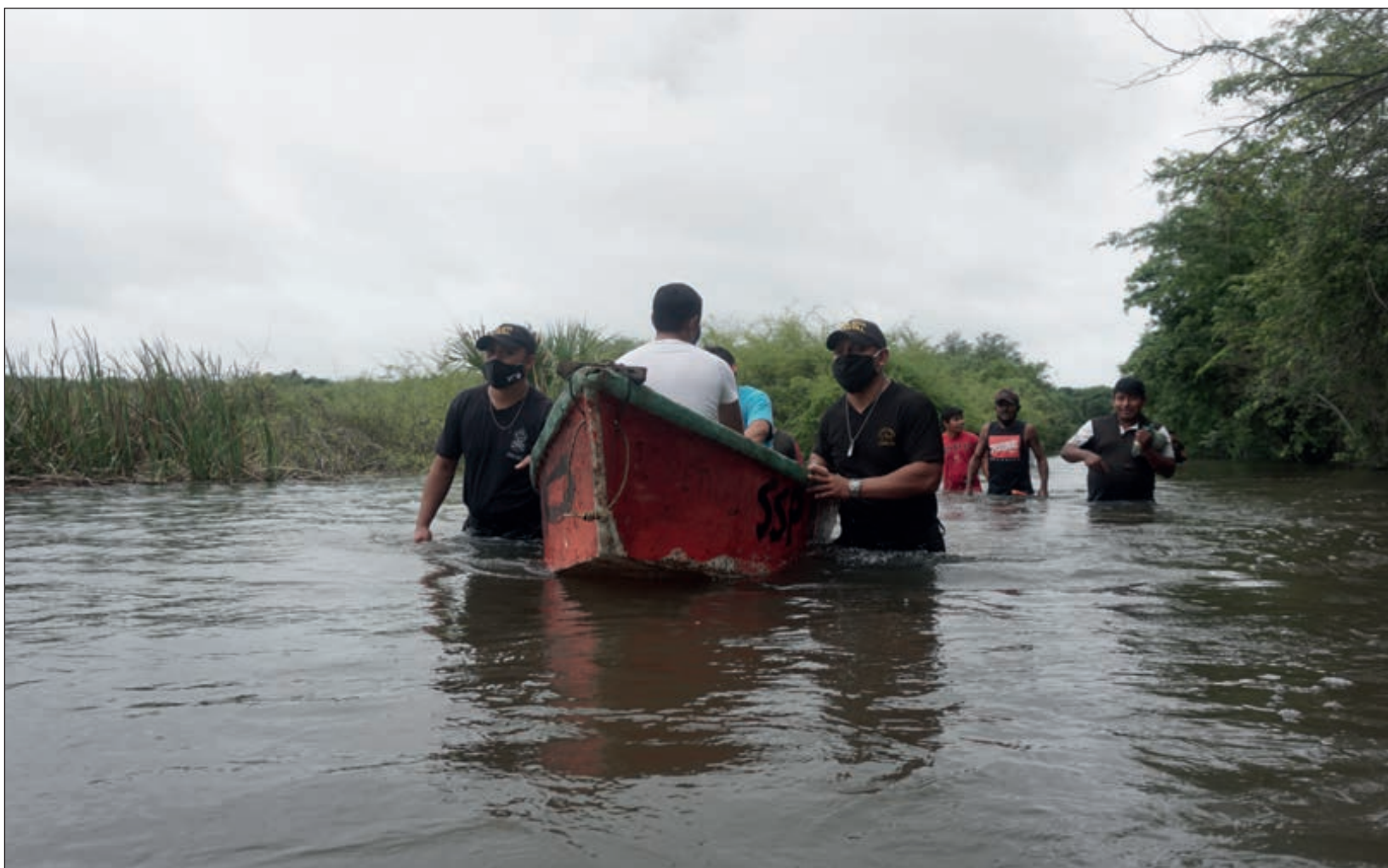
▲ En Chemblás, la carretera de acceso se inundó por la crecida de un riachuelo cercano, que acumuló aguas de la tormenta Gamma y ahora de Delta. El ingreso sólo fue posible mediante pequeñas embarcaciones.