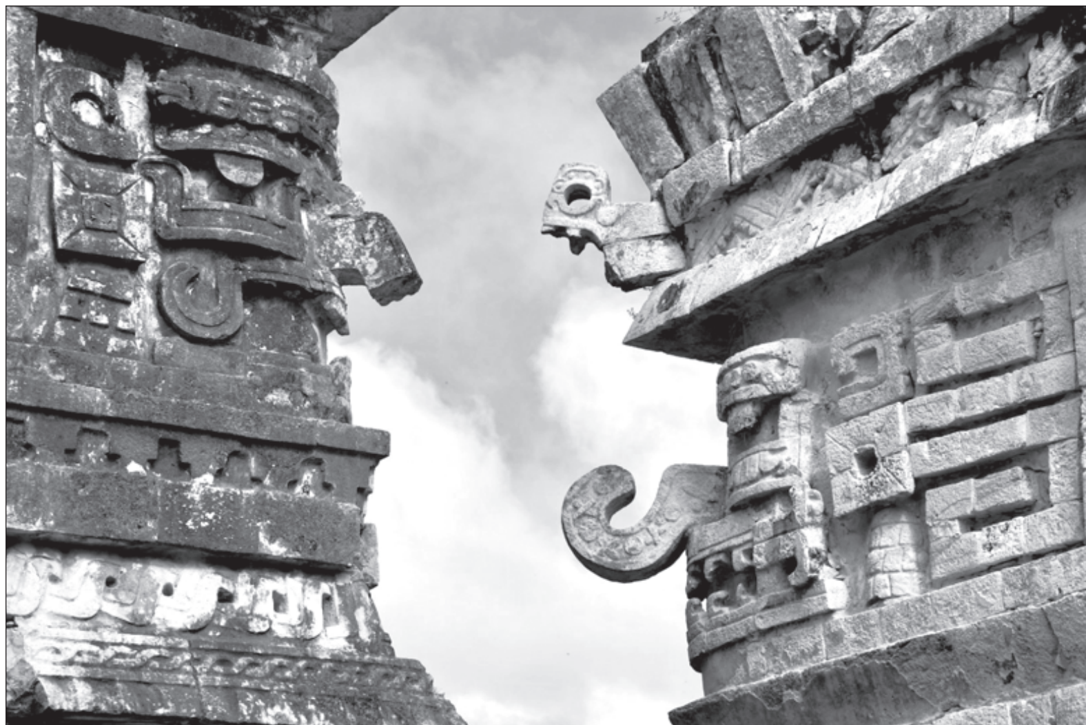
▲ Mascarones de Chaac dios de la lluvia en el conjunto de las Monjas, Zona Arqueológica de Chichén Itzá. Chaac es una deidad con rasgos humanos y de animal, se le representa como con larga nariz curva, posiblemente representa la trompa del tapir, sus ojos tienen símbolos solares, en la boca sobresalen los colmillos y la lengua o cuerpo de serpiente.