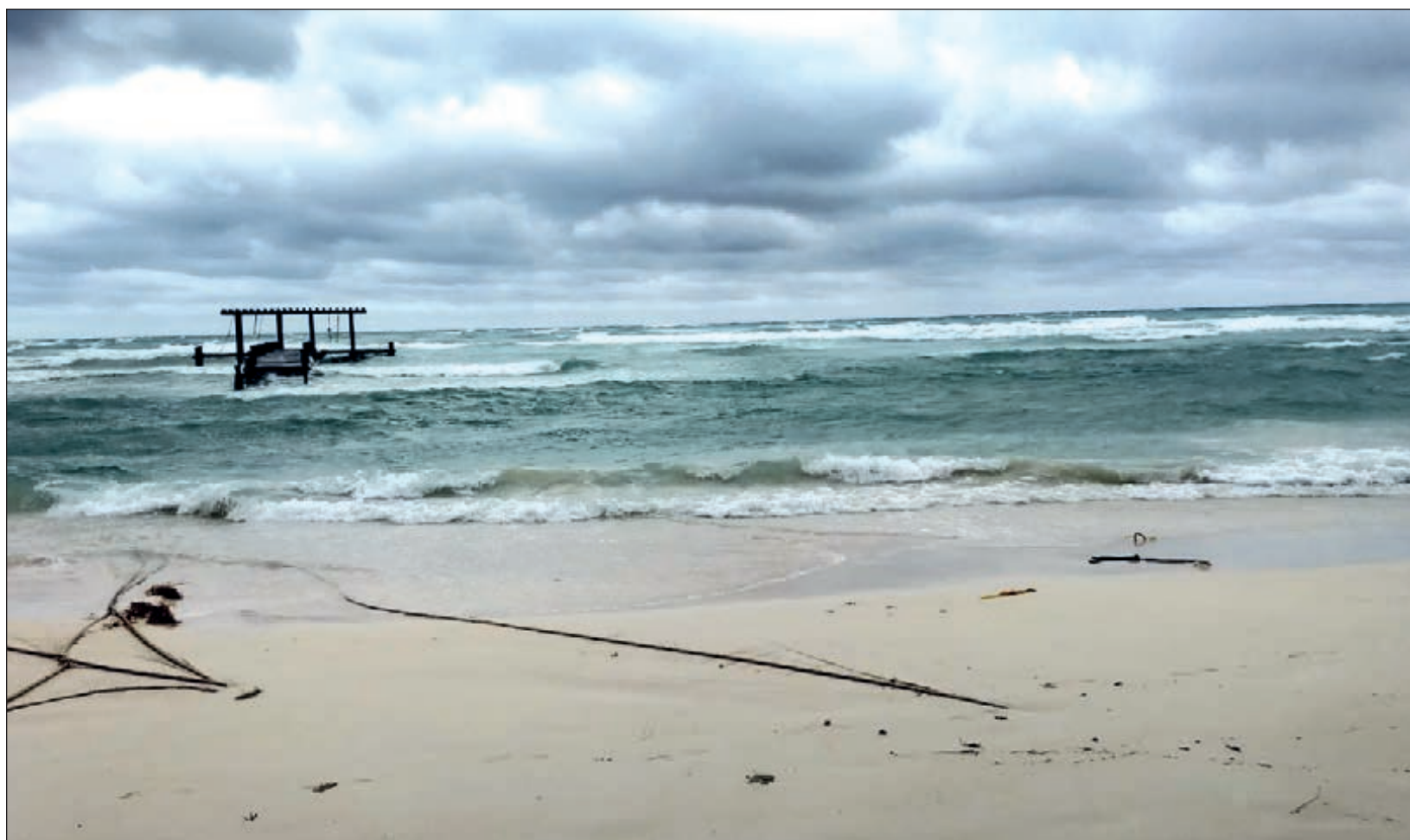
▲ La calma después de la tormenta: el paso de Delta dejó estampas de distintos colores en el norte y sur de Quintana Roo. Arriba, la bahía de Chetumal al amanecer. Abajo, la playa El Recodo, en Solidaridad.