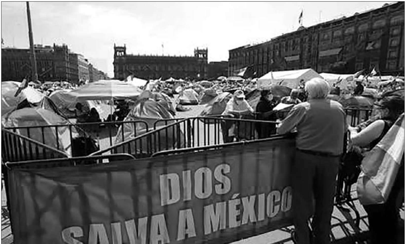
▲ México requiere una oposición nacionalista, con valores éticos y con propuestas reales, y no de casas de campaña vacías.