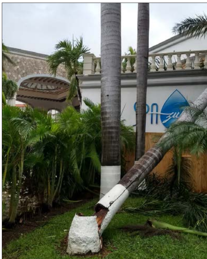
▲ Las fuertes ráfagas de viento por el huracán ocasionaron el derrumbe de árboles sobre vialidades y automóviles.