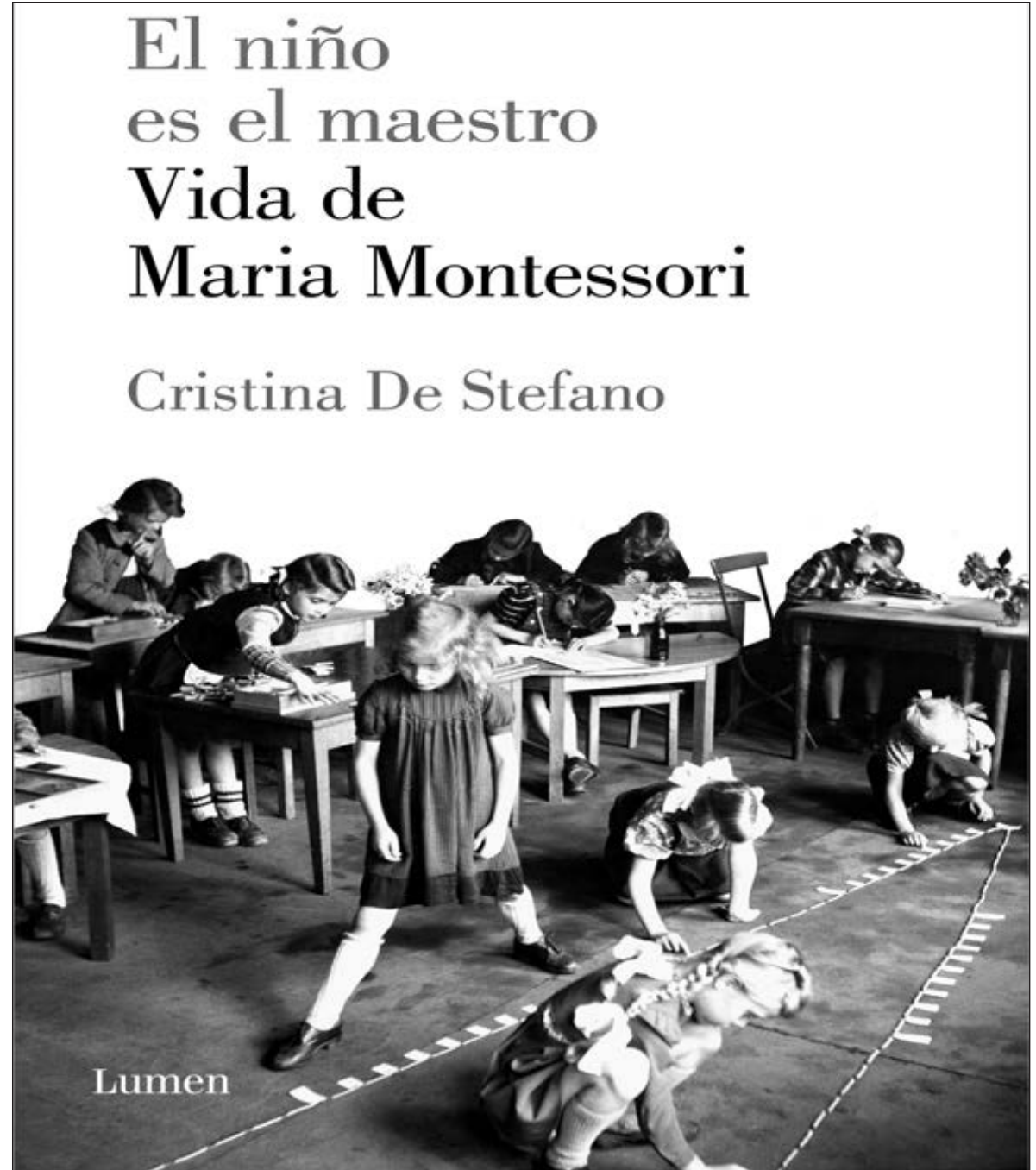
▲ El libro de Cristina de Stefano no pretende ser un ensayo teórico sobre la hasta hoy llamada Escuela Montessori. Es una biografía, tal como lo declara el subtítulo.

UNA DE LAS críticas al método que se hicieron en su día tuvo mucho que ver con su personal carácter, la negativa a permitir que nada se modificara sin estar