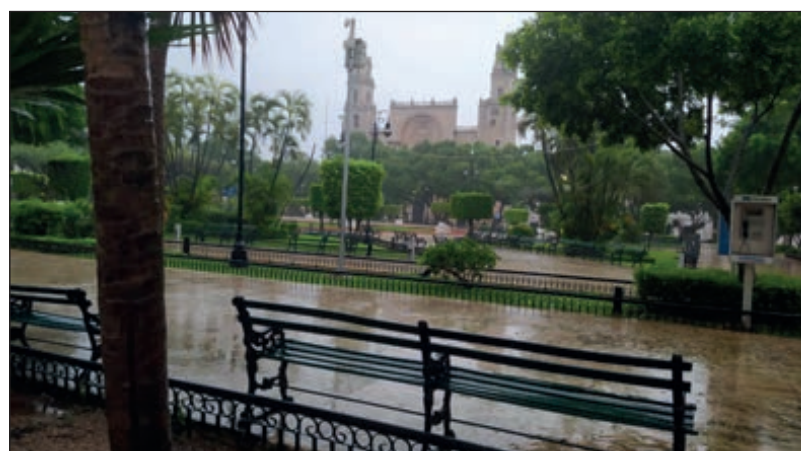
▲ El paso del huracán Delta dejó lluvia y afectaciones menores en la capital yucateca, la cual, por cierto, lució prácticamente desierta este miércoles 7 de octubre.