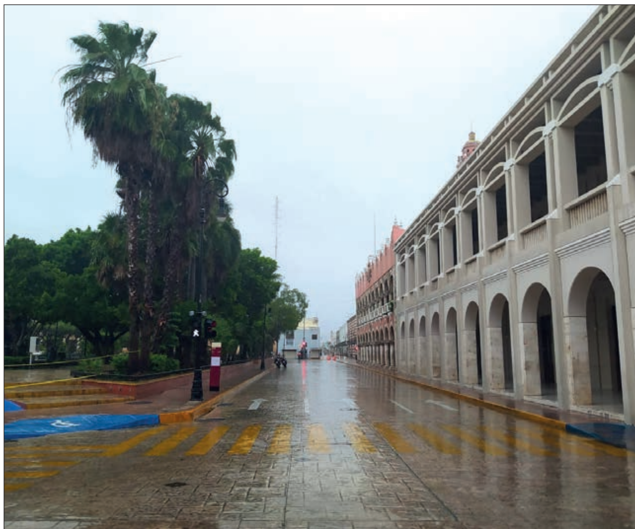
▲ En Mérida se reportaron inundaciones en algunas calles del centro, o en sitios donde la acumulación de agua tras las lluvias ya se ha hecho costumbre, como el “paso deprimido” en el cruce de Prolongación Montejo y Circuito Colonias.

Protección Civil de Mérida indicó que, a las 16 horas, el meteoro se degradó a categoría 1, localizándose a 100 kilómetros al noreste de Progreso y a 123 kilómetros al noreste del municipio de Mérida; presentaba movimiento hacia el noroeste a razón de 28 km/h, con vientos máximos sostenidos de 140 km/h.