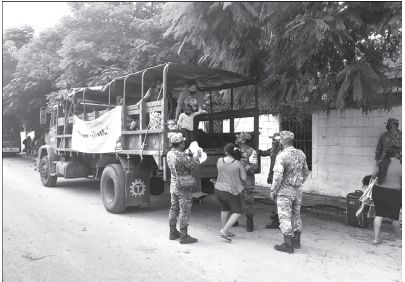
▲ La Secretaría de la Defensa Nacional aplicó el plan DN-III-E, que incluye conducir a la población a los refugios que dispongan las autoridades civiles, particularmente en los municipios del interior de Yucatán.

Desde temprano, el miércoles, el gobernador Mauricio Vila Dosal se trasladó a la Unidad de Monitoreo e