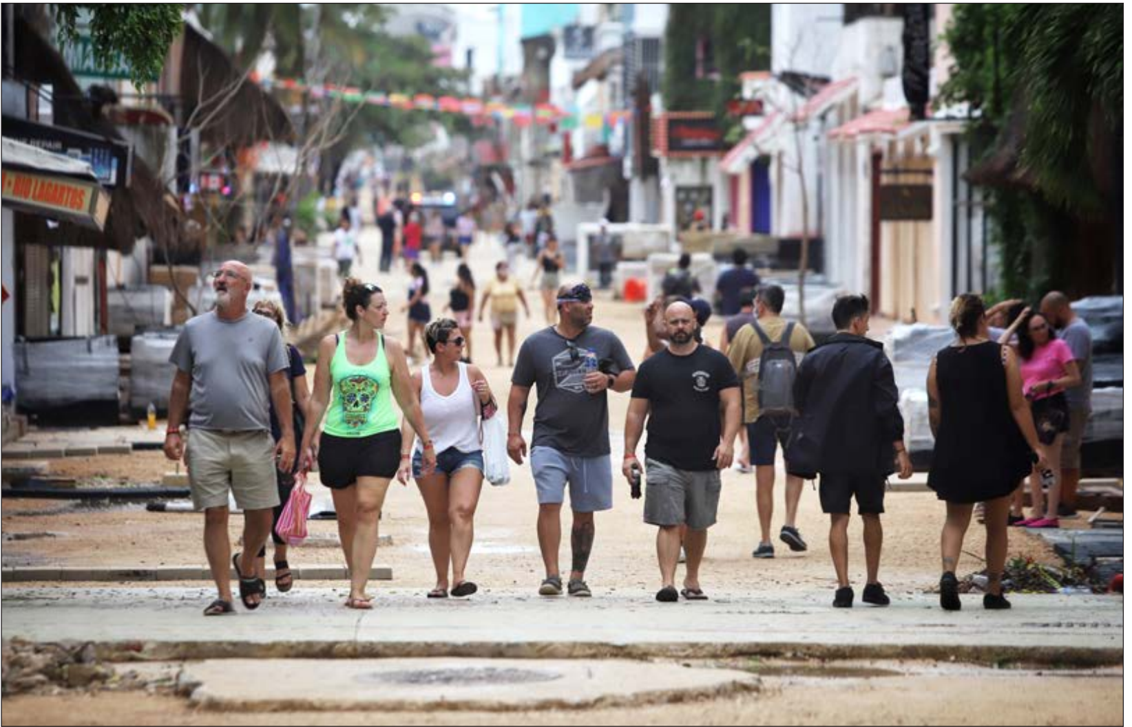
▲ A unas horas de que el huracán abandonó la península de Yucatán, los turistas aprovechan para recorrer las calles de Playa del Carmen.