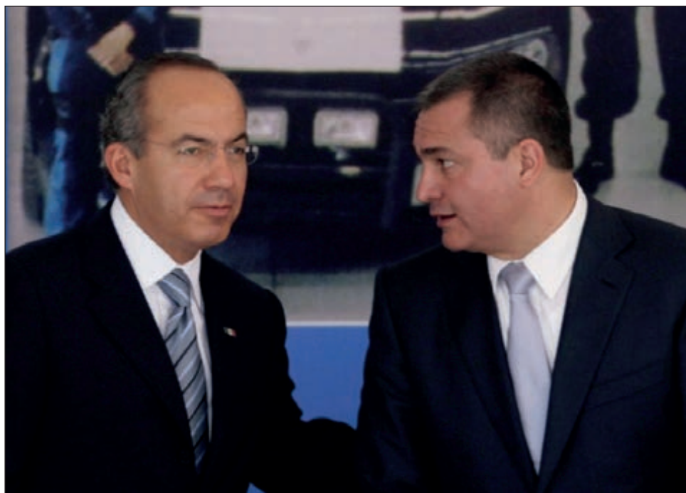
▲ Genaro García Luna se desempeñó como secretario de Seguridad en el sexenio de Felipe Calderón.

La audiencia fue suspendida brevemente minutos después de iniciar cuando periodistas y otros que podían escuchar el proceso por