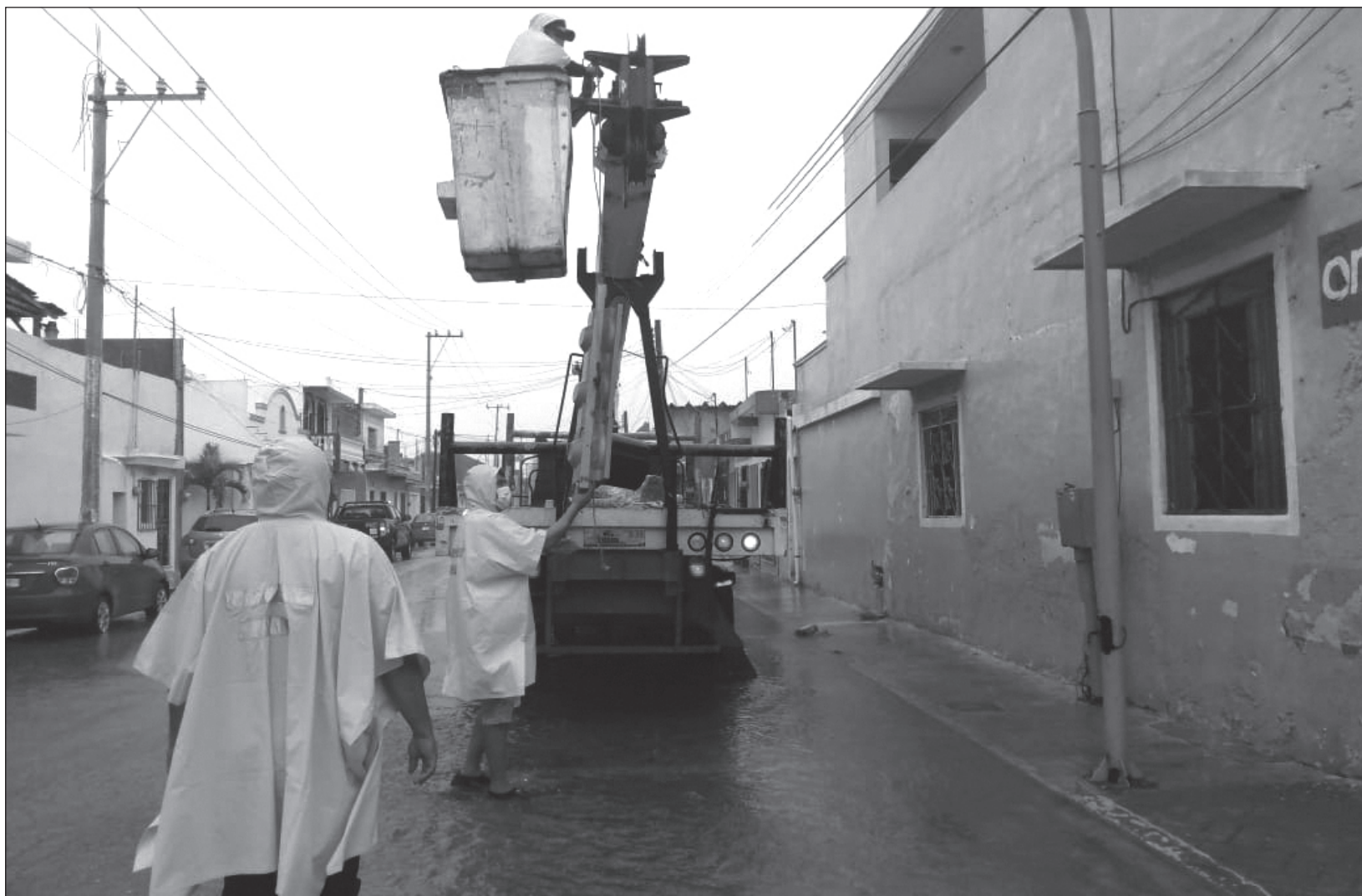
▲ El servicio de energía eléctrica fue una preocupación constante en todo el estado. Personal de la Comisión Federal de Electricidad se mantuvo reparando desperfectos causados por el meteoro, que afectaron a más de 375 mil usuarios.