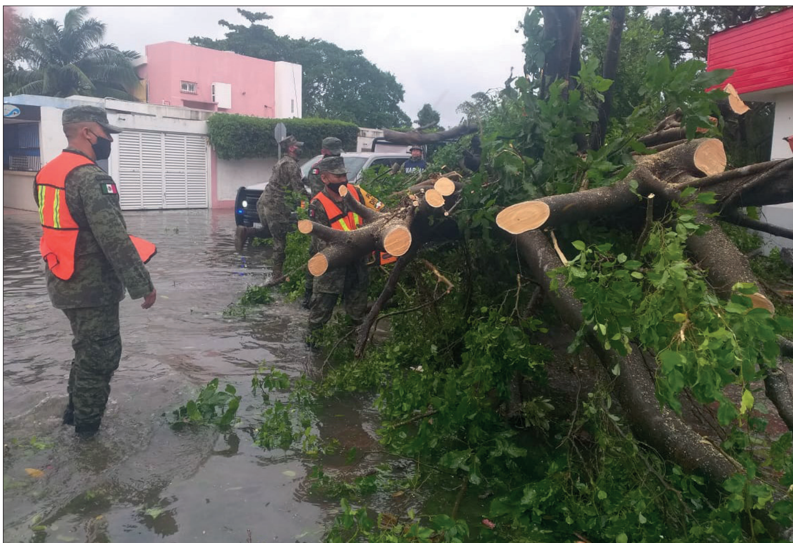
▲ En todo momento, personal de la Sedena estuvo al servicio de la población para ayudar con desalojos, remoción de árboles caídos y resguardo de la seguridad.