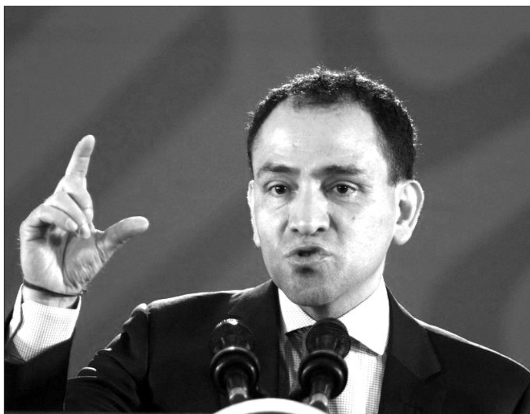
▲ La reforma permitirá reducir el subejercicio y agilizar la entrega de recursos, advirtió el secretario de Hacienda y Crédito Público, Arturo Herrera.

Tales resistencias, magnificadas en medios informativos y redes sociales, han llevado a que sectores de la opinión pública vean en la extinción de los fideicomisos creados por las administraciones anteriores una ofensiva contra la cultura, la ciencia, el deporte, la salud y hasta la protección civil, lo cual constituye una falacia en tanto, como ya se explicó, ninguno de los recursos dejará de entregarse a sus beneficiarios.