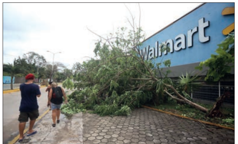
▲ El emblemático corredor turístico de Playa del Carmen sufrió algunas afectaciones, como inundaciones y anuncios caídos.