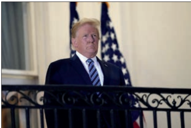
▲ El mandatario estadounidense señaló que se siente "fenomenal".

Los médicos de la Casa Blanca dicen que Trump dio positivo a un primer test el pasado jueves. No obstante, no han dicho cuándo se la había hecho el test anterior.