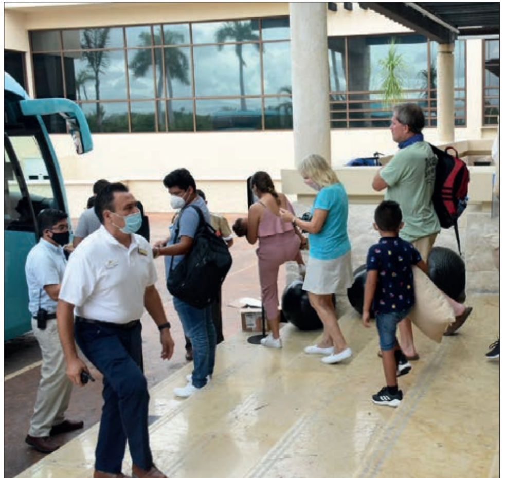
▲ Las autoridades reubicaron a cerca de 35 mil turistas; algunos hoteles cuentan con la anuencia de Protección Civil para ser autorefugios.

Detalló que el reporte oficial más reciente indica afectaciones menores, como caída de árboles, encharcamientos y cortes a la distribución de la energía eléctrica en zonas como Cancún, en el municipio de Benito Juárez y la isla de Cozumel, que la Comisión Federal de Electricidad (CFE) ya atiende.