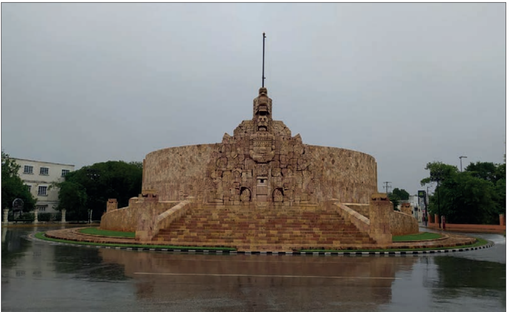
▲ La alerta de huracán logró que los meridianos permanecieran en casa, algo que no había sucedido incluso con las recomendaciones para evitar contagios de COVID-19.