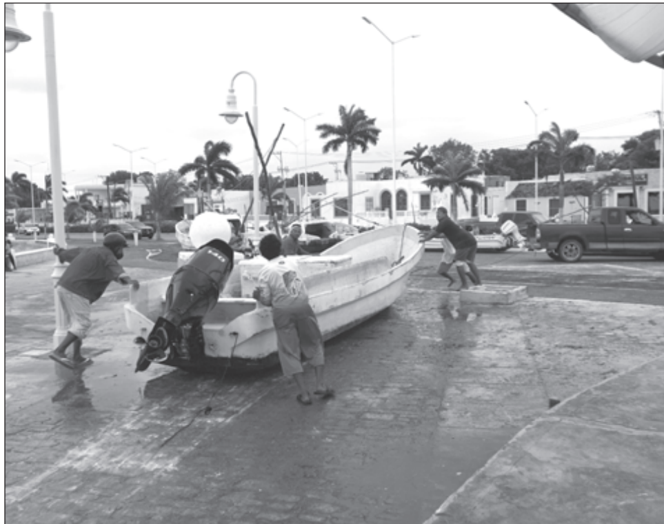
▲ Como medida precautoria, pescadores de todos los muelles aseguraron sus embarcaciones, particularmente los motores fuera de borda. En las comunidades de los alrededores de la capital, por las lluvias se perdieron las cosechas de hortalizas.

El Consejo Estatal de Protección Civil (CEPC) sesionó nuevamente ayer.