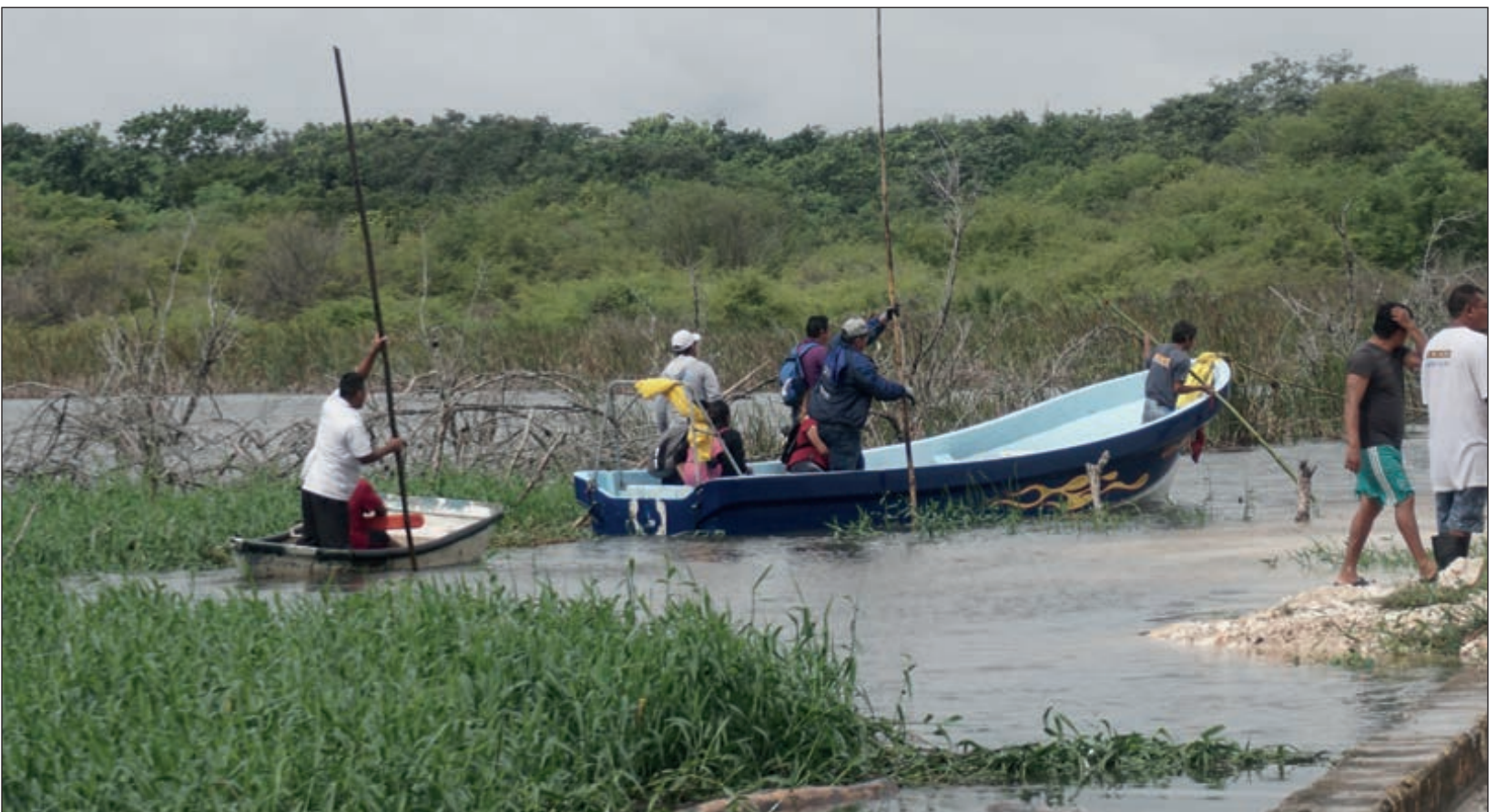
▲ El daño que dejó Delta fue más que nada en inundaciones y pérdida de cosechas. En varios lugares el acceso fue en lanchas.