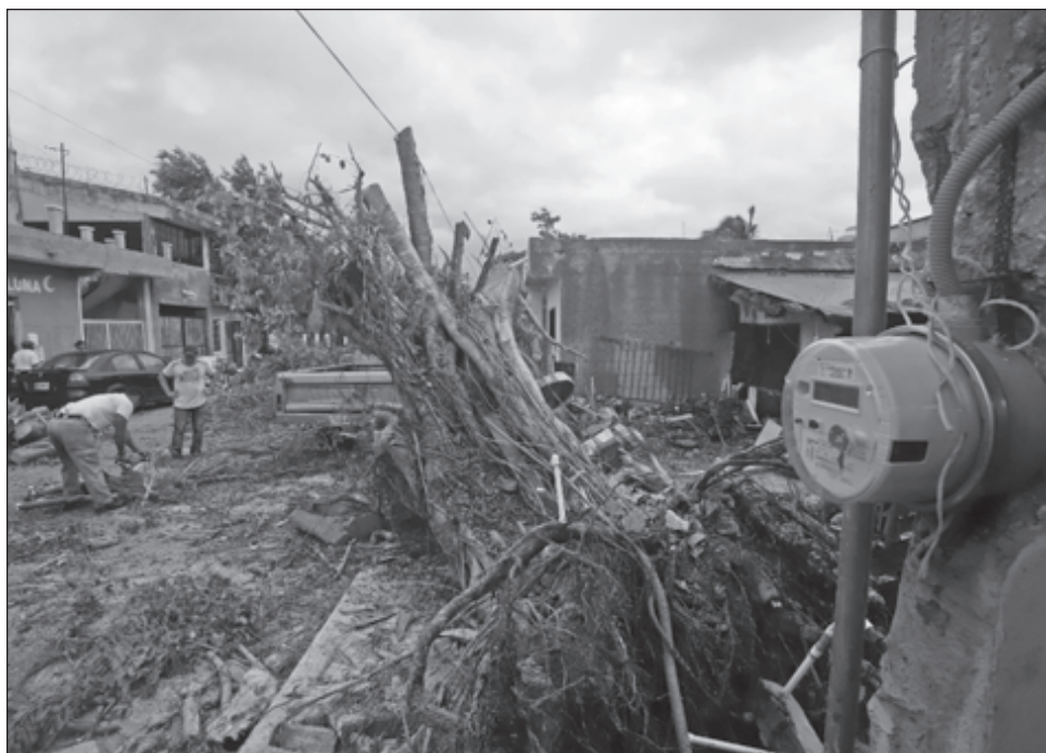
▲ El paso del huracán Delta dejó inundaciones y árboles caídos en varios municipios del estado.

Mientras que por el alto riesgo generado por el huracán Delta, la Declaratoria de Emergencia fue para los municipios de Buctzotz, Calotmul, Cenotillo, Cuncunul, Chankom, Chemax, Chichimilá, Chikindzonot, Dzilam de Bravo, Dzilam González, Dzitás, Espita, Panabá, Río Lagartos, San Felipe, Sucilá, Tekom, Temax, Temozón, Tinum, Tixcacalcupul, Tizimín, Uayma y Valladolid.