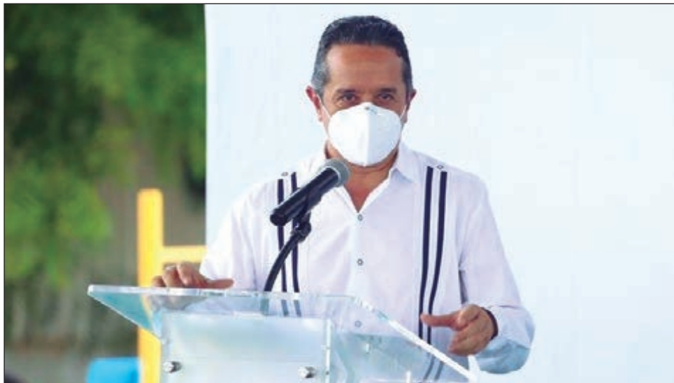
▲ El evento no tendrá invitados ni habrá concentración de personas.

A través de las redes sociales, Carlos Joaquín ha difundido algunos avances de lo que contendrá este Cuarto Informe de Gobierno: la entrega de cinco apoyos básicos (agua, luz, gas, alimentos y salud) durante la pandemia; el incremento de la infraestructura hospitalaria para atender a pacientes con COVID-19, y la reactivación económica de la entidad con la certificación de los protocolos de empresas y negocios, entre otros datos.