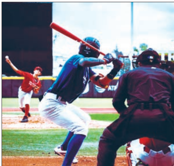
▲ La LPM está en su recta final y los playoffs comienzan el próximo martes 15.