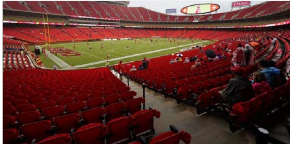
▲ La casa de los campeones Jefes será sede del duelo inaugural de la NFL.

“Vamos a tener que ser flexibles y adaptables”, dijo el doctor Allen Sills, jefe médico de la liga, quien en 2020 será probablemente el ejecutivo más visible de la NFL, por una buena razón. “Pienso que esto es algo que seguiremos rastreando y monitoreando. Si esto nos ha enseñado algo es que hacer proyectos con tres o cuatro semanas de adelanto puede ser algo dañino”. Los equipos entraron a la