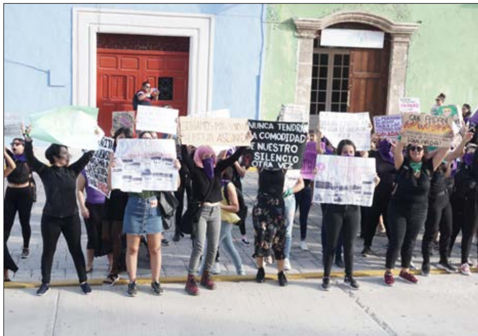
▲ Desde 2015 hay una recomendación de la CNDH para que las fiscalías estatales, transparenten el proceso informativo de los casos de desaparición de mujeres y niñas.

"Hay tres secuencias de edades importantes: de 12 a 15 años, de 16 a 20 y de 21 a 25, siendo las menores de edad las que tienen un mayor índice de desaparición, y aunque no lo queramos ver, hemos estigmatizado como algo normal esa violencia machista, al señalar que escaparon con el novio o que no tarda y regresa, etcétera; desde las primeras horas de sospecha de desaparición