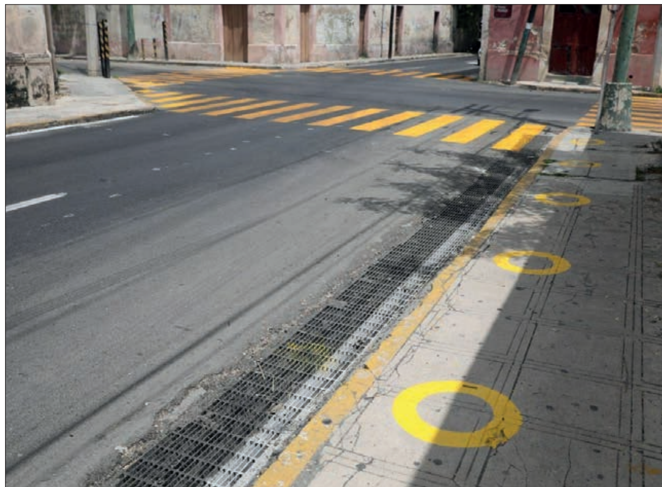
▲ Las acciones del plan de movilidad comprenden la delimitación de los cajones donde se reubicarán las áreas de ascenso y descenso de pasajeros y marcas de distanciamiento sobre las aceras para que los usuarios del transporte público mantengan la sana distancia.

Asimismo, este proyecto contribuirá a la reducción del ruido; así como de la exposición de los peatones, habitantes y residentes a