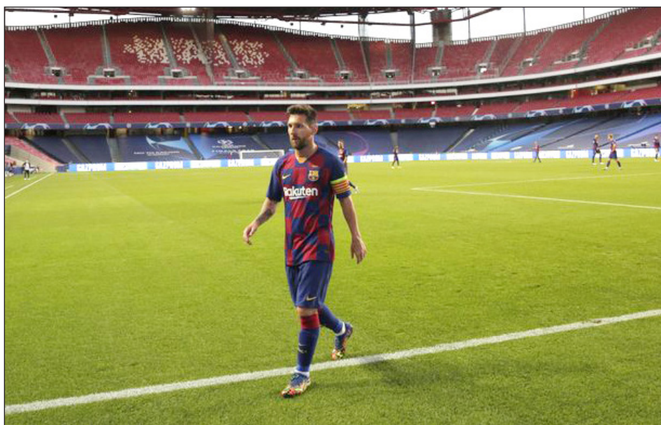
▲ Lionel Messi se desplaza en la cancha durante el partido contra el Bayern Múnich por los cuartos de final de la Liga de Campeones en Lisboa.

ferencia el 25 de agosto y no se apersonó para tomarse las pruebas obligatorias de COVID-19 hace una semana. Tampoco se presentó a la puesta en marcha de los entrenamientos. Fue el primero en llegar a la ciudad deportiva del club ayer.