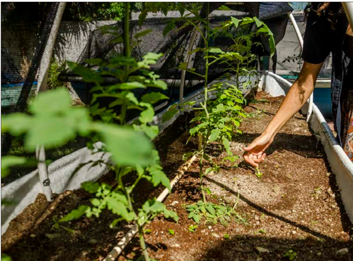
▲ Aguakan busca alternativas para crear un futuro más sostenible.

Pese a que se realizó una segunda autopsia a los restos del joven, que fue encontrado ahorcado en un predio baldío y se determinó que hubo rastros de tortura que la Fiscalía de Justicia yucateca desestimó, además de comprobarse documentos falsificados, en 2015 la CNDH concluyó las investigaciones del caso con la recomendación 34/2013, pero sin proveer de justicia a la familia porque la Fiscalía de Yucatán no cumplió con la conciliación que ordenaba integrar nuevamente la carpeta de investigación. En un oficio dirigido al entonces gobernador Rolando Zapata Bello, la CNDH informó sobre el caso y pidió su intervención, pero también fue omiso.