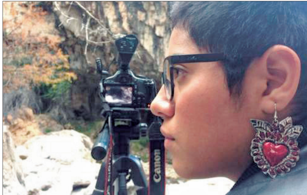
▲ La cinefotógrafa considera que las producciones deben regresar a las raíces, a la naturaleza.

La joven oaxaqueña afirma que contar las historias de los pueblos a través del cine es lo que le ha dado un valor humano a sus filmes, porque es justamente lo que se ha olvi-