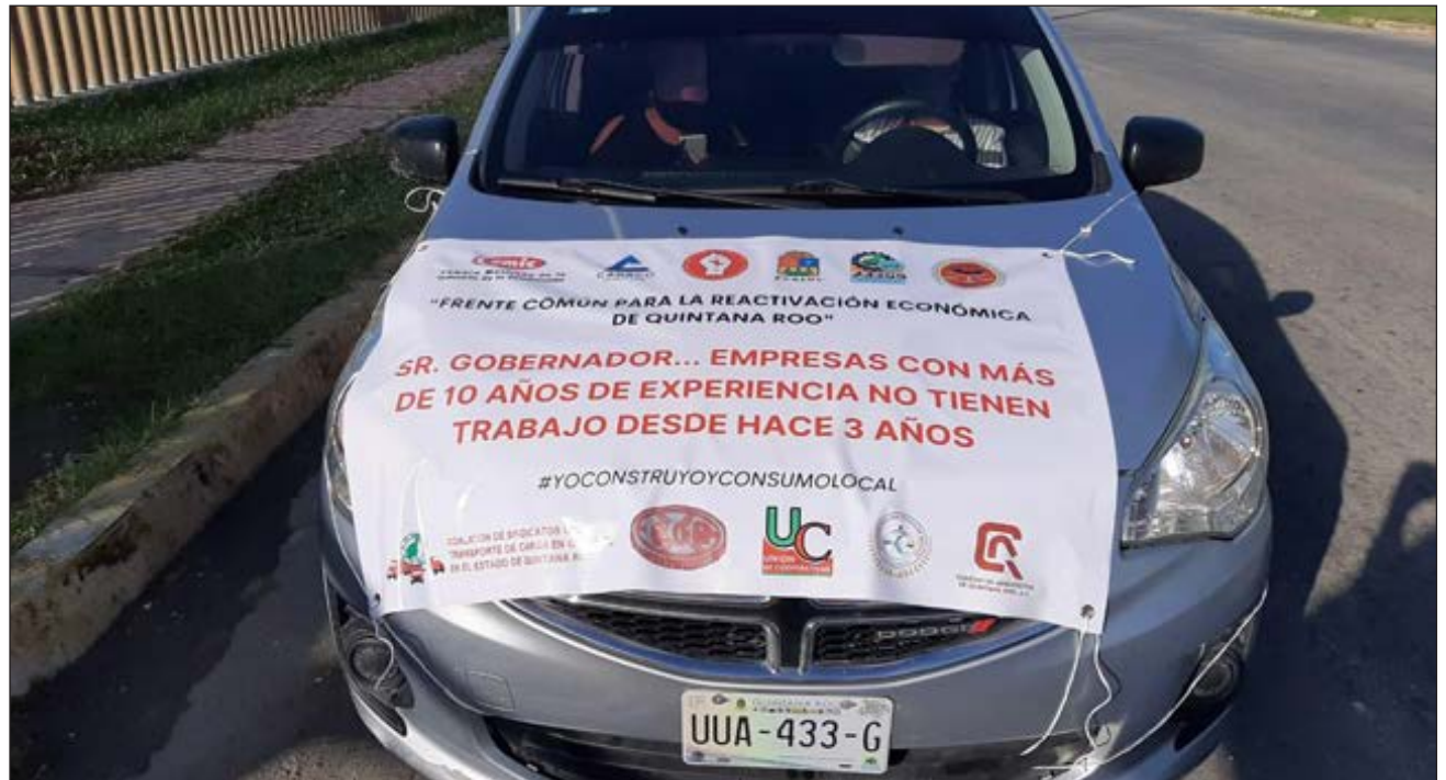
▲ Los inconformes realizaron una marcha pacífica en sus vehículos, y llamaron a las autoridades a contratar empresas locales en obra pública.

Transportados en volquetes, camiones y vehículos particulares partieron