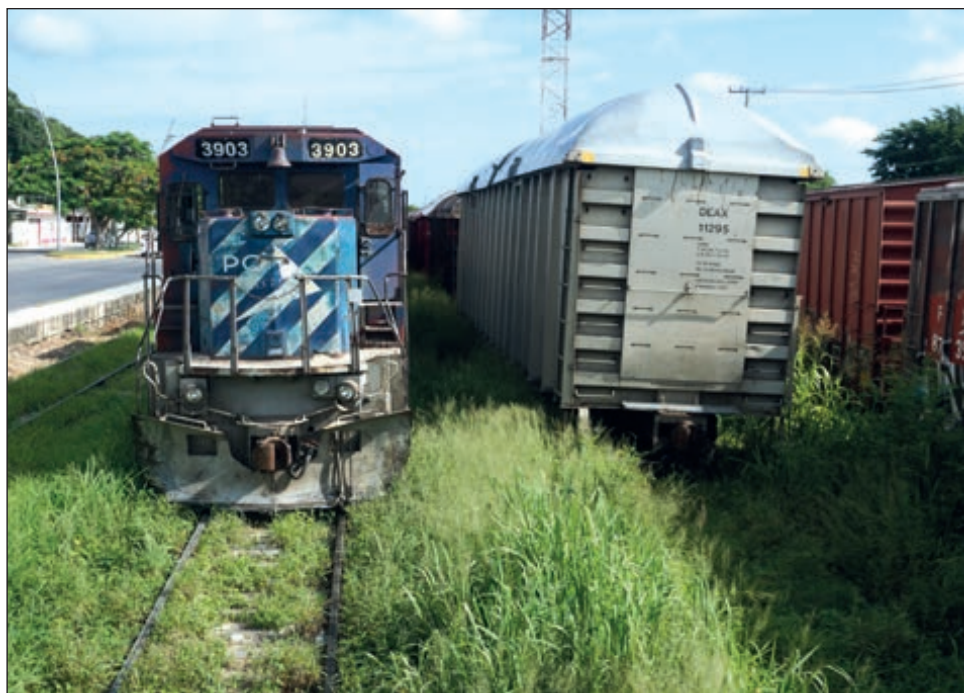
▲ El documento contiene además lineamientos de intervención urbanística para implementar medidas que mitiguen el impacto y potencien los beneficios.

En el caso de Mérida, la actualización del PMDU estaba prevista previo a la presentación del proyecto del Tren Maya, sin embargo se ha aprovechado para analizar su integración en el proceso de planeación, así como para revisar estudios y proyectos previos, además de leyes y reglamentos para la intervención urbanística