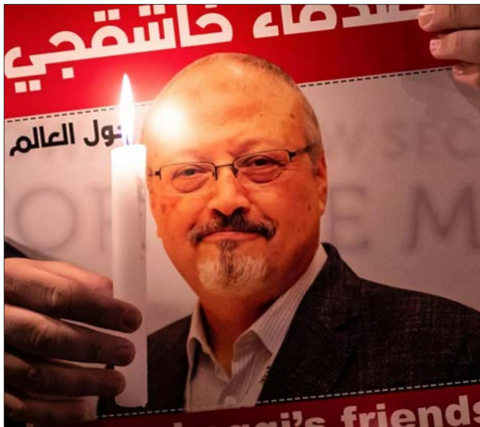
▲ El asesinato del periodista Jamal Khashoggi, en Turquía, provocó protestas internacionales.

Fiscal saudita ha realizado un nuevo acto en esta parodia de justicia, señala Agnès Callamard