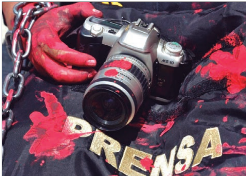
▲ De acuerdo con datos de Artículo 19 , aproximadamente cada 15 horas un comunicador es agredido en México.

estados más peligrosos para la prensa y lo ha sido en distintos niveles, pero desde 2016 hubo un salto de agresiones que se han mantenido”.