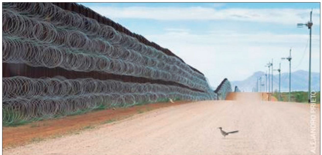
▲ Uno de los temas que aborda la exposición es el del medio ambiente y los desastres naturales, sobre el cual destaca la fotografía del mexicano Alejandro Prieto que muestra a un correccaminos en la frontera con Estados Unidos, imagen que mereció el segundo lugar en la categoría Naturaleza. Foto Alejandro Prieto

Ubicado en avenida Hidalgo 45, Centro Histórico, los horarios del museo son de martes a viernes de 11 a 16 horas y sábado y domingos, de 11 a 17 horas.