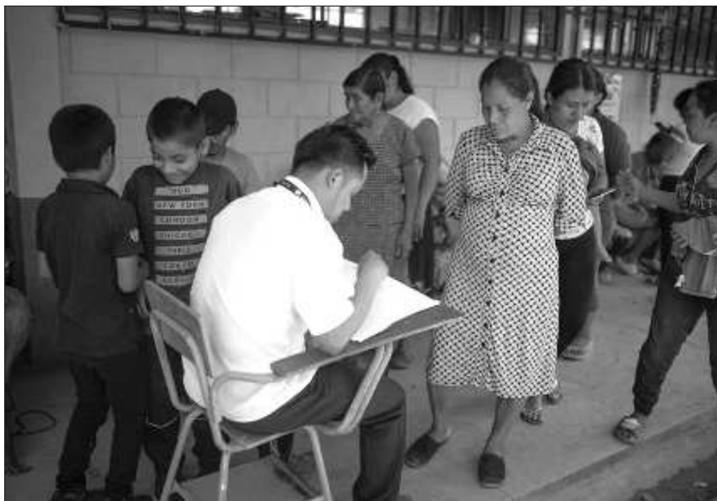
▲ Mientras exista la intención y posibilidad de retorno, no será éxodo; pero le corresponde a las autoridades crear las condiciones para que las familias desplazadas regresen a Chiapas.

Mientras exista la intención y posibilidad de retorno, no será éxodo; pero le corresponde a las autoridades crear las condiciones para que las familias desplazadas regresen a Chiapas en el menor tiempo posible y retomen su vida.