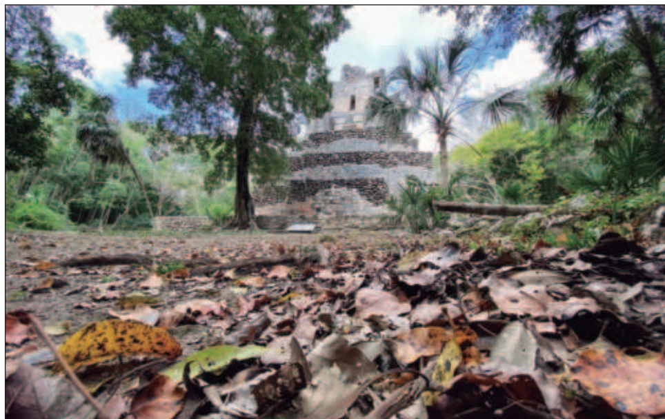
▲ De las 29 zonas arqueológicas contempladas en Promeza, 11 se encuentran en Quintana Roo, donde se están abriendo nuevas áreas y cambiando servicios.

“Las zonas van a tener sobre todo nuevos hallazgos que se están dando día con día, gracias a este presupuesto especial de Sedena, nos enfocamos a trabajar en eso, sobre todo por el bien de la historia prehispánica y mejorar las zonas”, abundó.