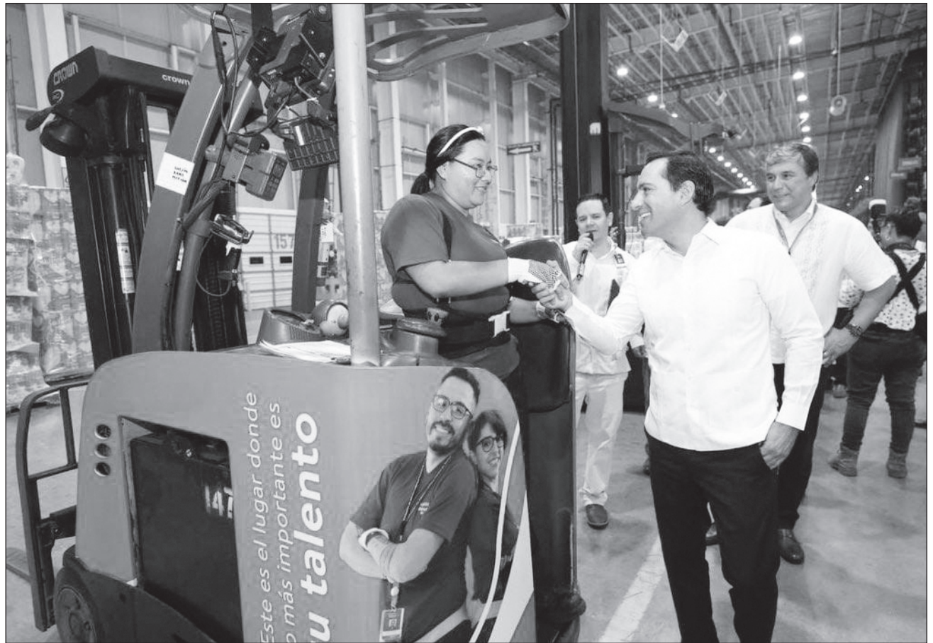
▲ Gracias a la atracción de más de 401 proyectos de inversiones en sectores como tecnologías de la Información, aeroespacial, inmobiliario, agroindustrial, construcción, logística, entre otros, se generaron 10 mil 911 nuevos empleos entre julio de 2023 y 2024.

Estas cifras son el resultado de la promoción a