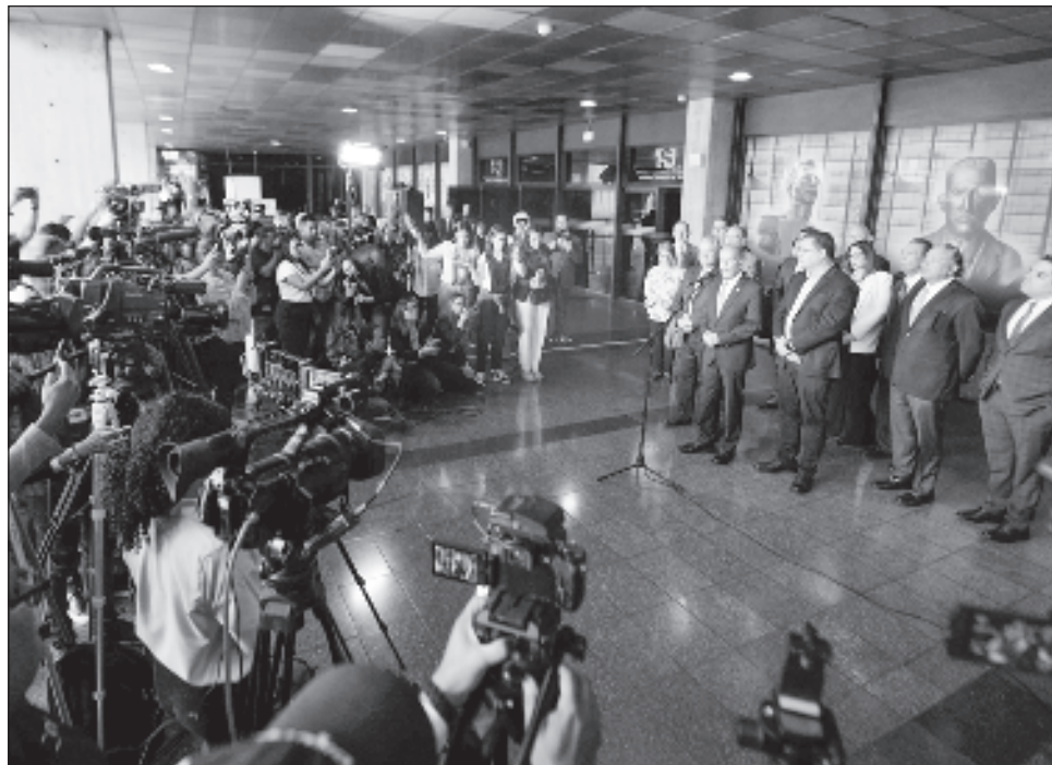
▲ Un sitio web difundido por actores de la oposición, dio a conocer actas electorales que muestran que Edmundo González obtuvo significativamente más votos en los comicios.

“Si acudo a la Sala Electoral en estas condiciones estaré en absoluta vulnerabilidad por indefensión y violación del debido proceso