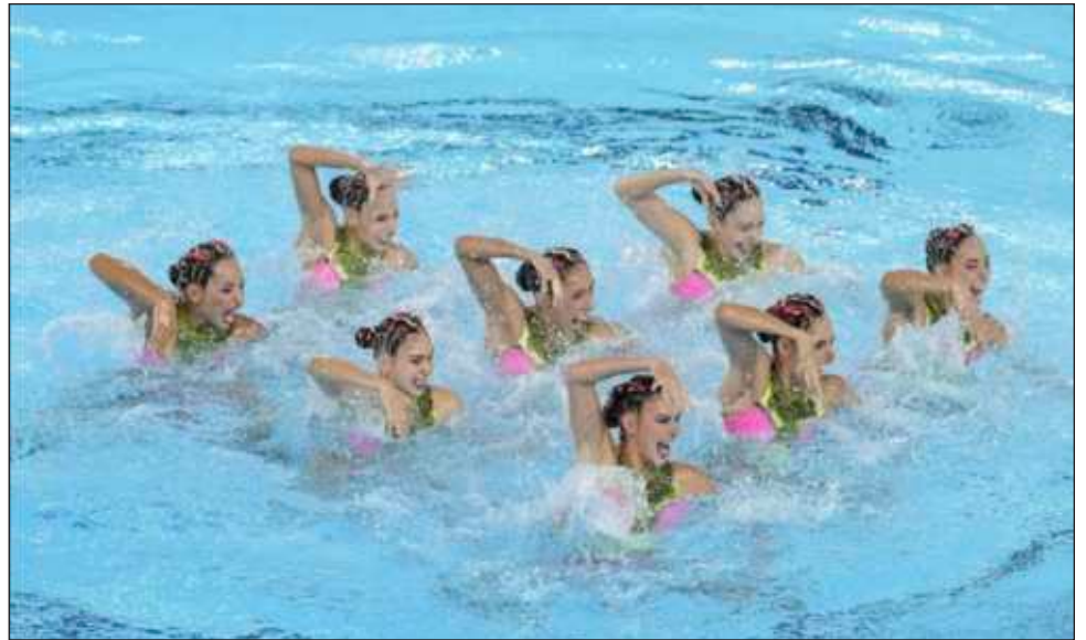
▲ La selección mexicana compite en la rutina acrobática de la natación artística, en Saint-Denis.

El arranque de la competencia no fue el mejor para las sirenas, ya que fueron penalizadas por un error el lunes en la rutina técnica y finalizaron octavas. La víspera remonta-