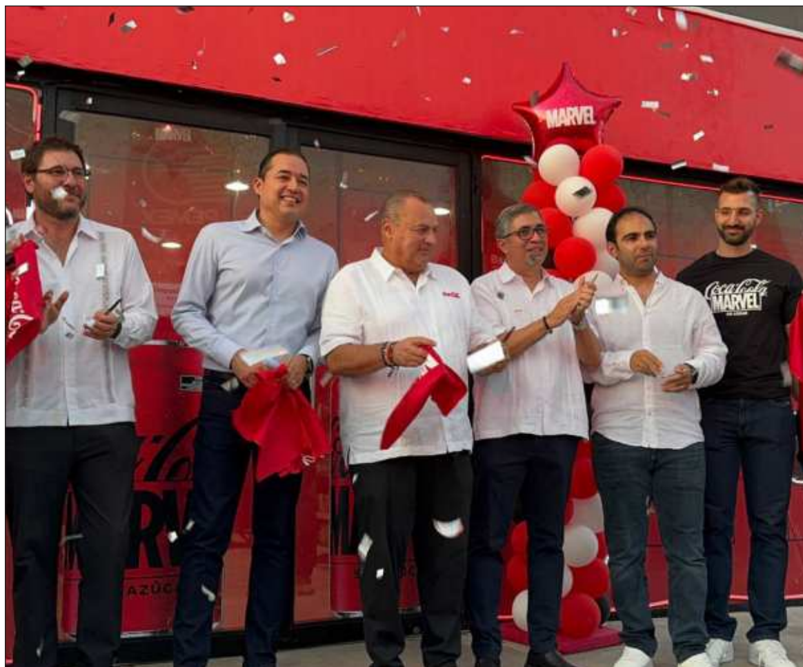
▲ En Mérida, esta colaboración con Disney se celebra con activaciones tales como la inauguración de la tienda 7-Eleven Xacanatún en la carretera Mérida-Progreso, decorada con la temática "El universo de Marvel Unido".