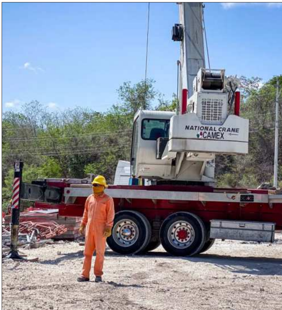
▲ El gasto federalizado incluye los recursos transferidos a las entidades federativas, municipios y la Ciudad de México compuestos por el Ramo 28 y Ramo 33.

El gasto federalizado incluye los recursos transferidos a las entidades federativas, municipios y la Ciudad de México compuestos por el Ramo 28 (Participaciones Federales) y Ramo 33 (Aportaciones Federales) que constituyen 87.5 por ciento.