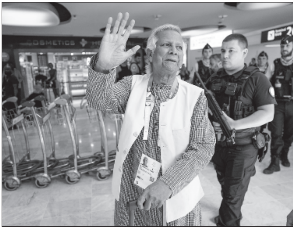
▲ Muhammad Yunus, Nobel de la Paz, felicitó a los estudiantes por “tomar la iniciativa para hacer posible nuestro Segundo Día de la Victoria”. Nombrado líder de un gobierno interino en días pasados, el activista será juramentado el jueves por la noche.