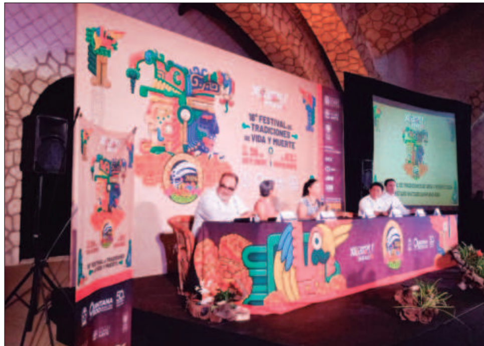
▲ El 18 aniversario del Festival de Vida y Muerte llega en el marco de los 50 años de Quintana Roo, por lo que el anfitrión será también el estado invitado.

Como parte de los talleres que se llevarán a cabo en esta ocasión, estará la cata de miel, un taller visual que servirá para identificar si la miel está adulterada,