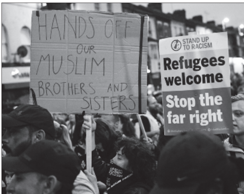
▲ La policía local ha estado en alerta tras circular por internet que 30 centros de inmigración en el Reino Unido podían ser blanco de ataques de grupos de ultraderecha.

“La situación en la región de Sumy es muy tensa” debido a los bombardeos, indicó a la televisión ucraniana.