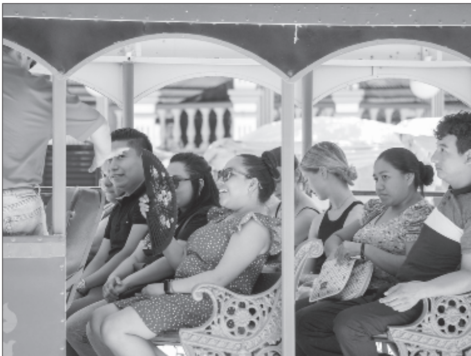
▲ Por primera vez los prestadores de servicios turísticos en Ciudad del Carmen tomarán la determinación de las estrategias de promoción que se llevarán a cabo.

Indicó que por primera vez los prestadores de servicios turísticos, en el caso de Ciudad del Carmen organizados en un Consejo Consultivo que ya fue actualizado, tomen la determinación de las estrategias de promoción turística que se realizarán.