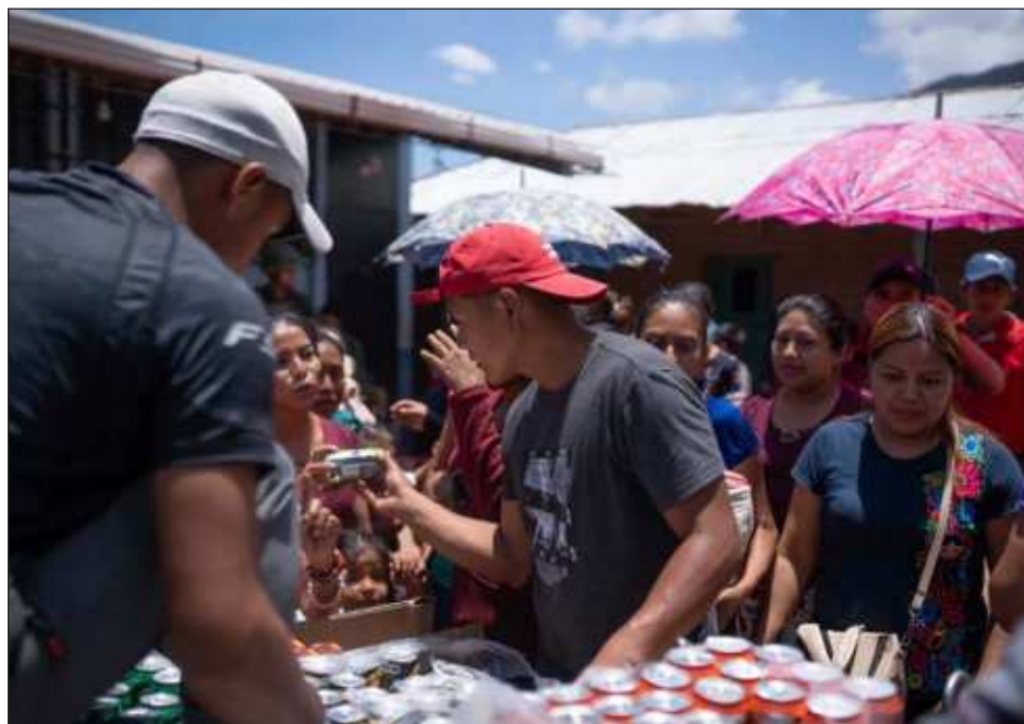
▲ El presidente Andrés Manuel López Obrador destacó que son entre 200 y 300 familias las que huyeron de sus comunidades por los conflictos entre grupos delictivos.

“Y hablábamos que en términos generales costó la refinería como 330 mil millones de pesos, 16 mil 800 millones de dólares, sin crédito, del presupuesto. ¿De dónde salió dinero? Pues es lo que hemos ahorrado en el gobierno por no permitir el huachicol. Cuando llegamos (al gobierno) se robaban 80 mil barriles (de Petróleo) diarios, en una asociación delictuosa entre la delincuencia y las autoridades”, destacó el mandatario.