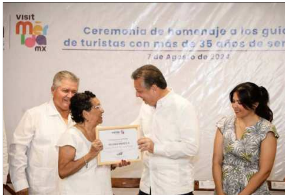
▲ Por ser embajadores del patrimonio cultural y natural, la alcaldía entregó un reconocimiento a las y los guías de turistas con más de 35 años de servicio.

En ceremonia realizada en el Centro Cultural