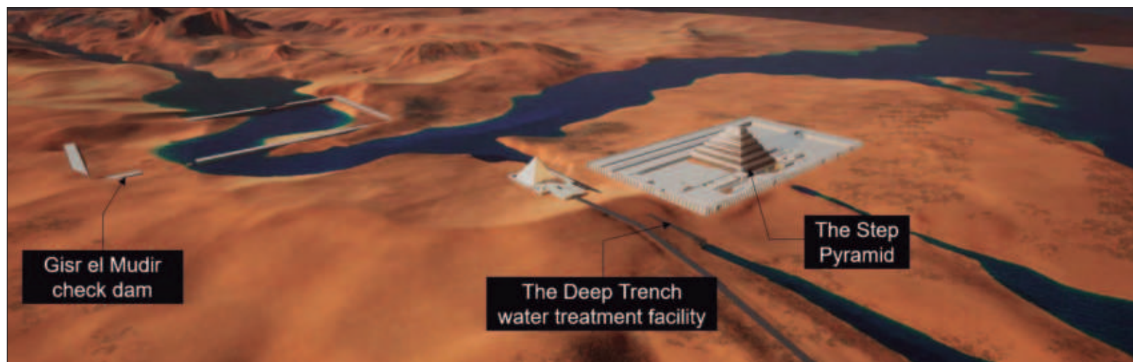
▲ Una estructura previamente inexplicada, habría funcionado como “presa de control” para capturar agua y sedimentos. Además, una serie de compartimentos excavados en el suelo fuera de la pirámide habrían servido como instalación de tratamiento de agua.

Los autores añaden: “Un esfuerzo conjunto ha permitido descubrir una presa, una instalación de tratamiento de agua y un ascensor hidráulico que habrían permitido construir la pirámide escalonada de Saqqara”.