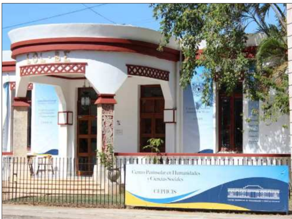
▲ El Cephcis ha impartido esta maestría desde hace más de 10 años y presume que los perfiles egresados han logrado colocarse en diversas áreas importantes.

El Cephcis acompaña de forma cercana a las personas que decidan comenzar el proceso de selección poniendo a disposición el correo posgrado.cephcis@cephcis.unam.mx para brindar respuestas personalizadas a cualquier duda.