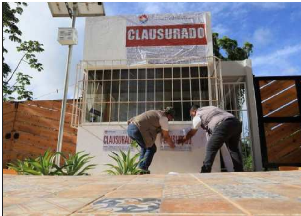
▲ Las autoridades municipales impusieron sellos de clausura a un desarrollo urbano irregular, que ofrece en venta terrenos en la zona este de la ciudad.

“Conforme sus atribuciones, la secretaria municipal de Ecología y Desarrollo Urbano, en conjunto con la secretaria general, la dirección de Ecología y la dirección de Protección Civil del ayuntamiento de Benito Juárez, así como la Procuraduría de Protección al Ambiente (PPA), impusieron sellos de clausura a un desarrollo urbano irregular, que ofrece en venta terrenos en la zona este de la ciudad, por incurrir en violaciones a la Ley de Asentamientos Humanos, Ordenamiento Territorial y Desarrollo Urbano del Estado de Quintana Roo”, indicó el comunicado.