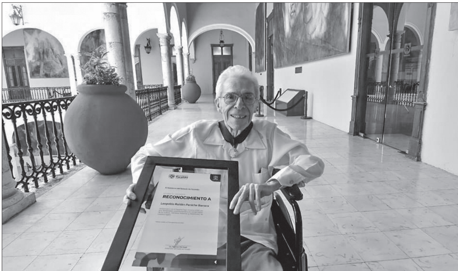
▲ "Quizás sus obras más conocidas sean sus novelas, en las que recreó ese imaginario cultural propio del Mayab".