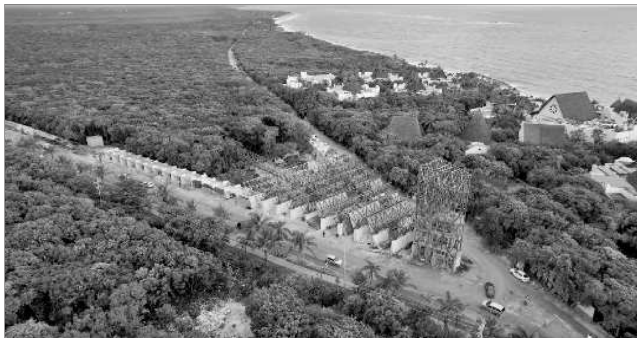
▲ En las zonas arqueológicas que están siendo intervenidas se realizan trabajos de investigación y conservación, señalética e infraestructura. En el tramo 5 se trabaja en El Meco, Tulum, Cobá, Muyil y el Corredor Ecoarqueológico Paamul II.

“Es sin duda alguna en estos tramos donde hemos encontrado la mayor cantidad de vestigios por lo que respecta a bienes inmuebles, albarradas, caminos, plataformas, unidades habitacionales, palacios y otra clase de construcciones que nos permiten asegurar que hubo una inmensa densidad de población en estos territorios y que ahora estamos recuperando materiales que nos habrán de ayudar a dar una visión nueva sobre el devenir de la civilización maya en nuestro territorio”, concluyó Diego Prieto.