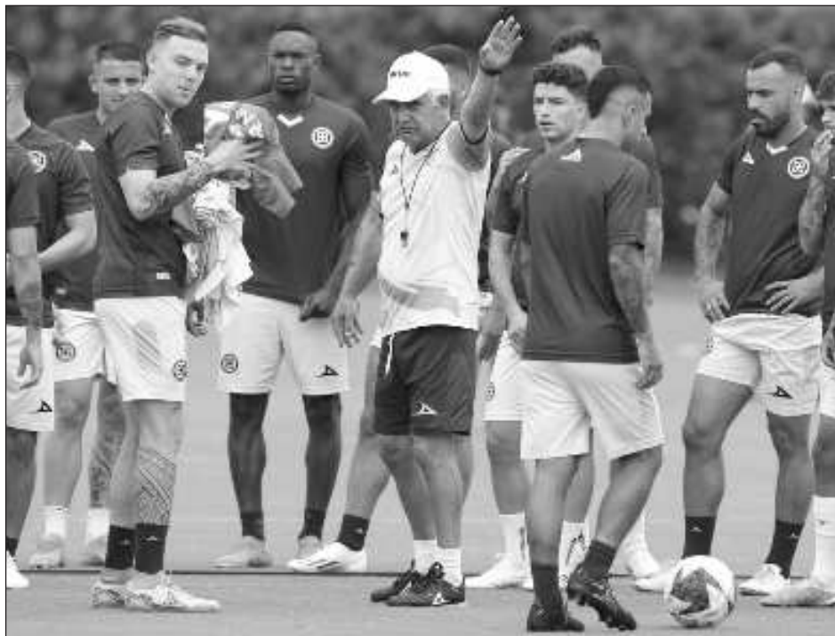
▲ El Cruz Azul comenzó mal en la Liga Mx y fue eliminado rápidamente en la Leagues Cup.

El equipo señaló que, por el momento, Joaquín