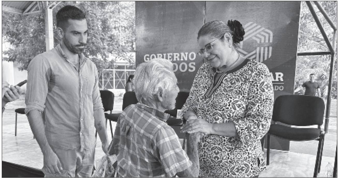
▲ La Secretaría del Bienestar está pagando de mensualmente 7 mil 500 pesos, y se deberán cubrir ciertos requisitos comprobables para acceder al programa, como la hoja de desempleo, cumplir con la edad, y destacar en algún oficio.

La Sebien está pagando de mensualmente por cada ciudadano dentro del programa 7 mil 500 pesos, y se deberán cubrir ciertos requisitos comprobables para acceder, como la hoja de desempleo, cumplir con la edad, y destacar en algún oficio. Además personal de Bienestar estará