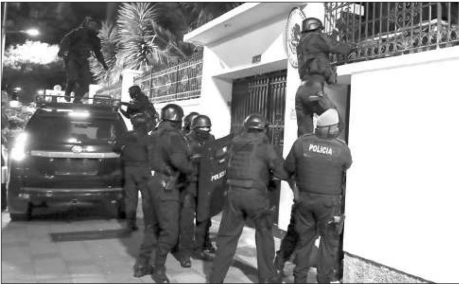
▲ La escritora chilena condenó el asalto a la embajada de México en Ecuador perpetrado el viernes.