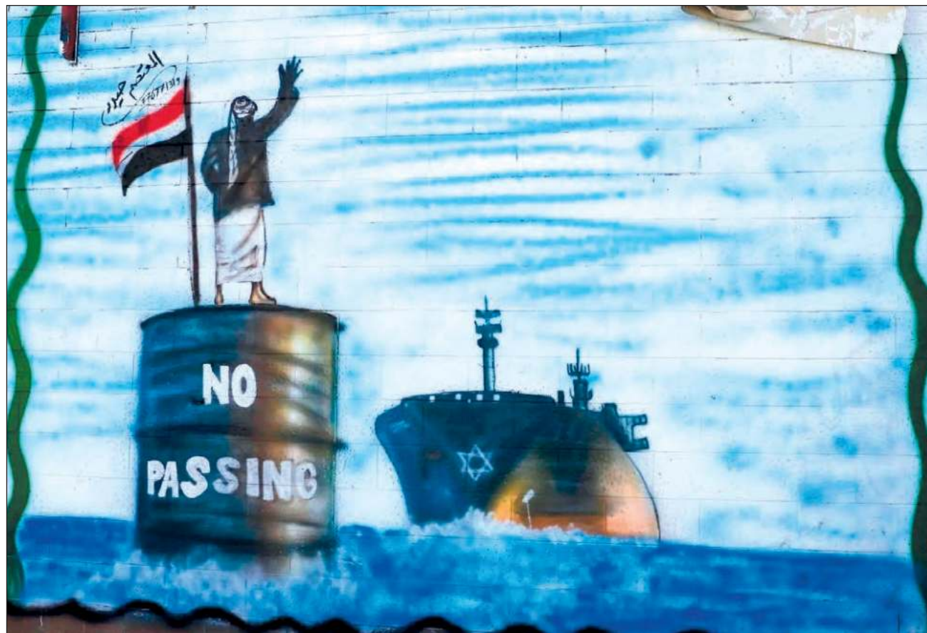
▲ De acuerdo con la Agencia de Seguridad Marítima de Reino Unido, "el misil impactó en el agua muy cerca" del barco, pero que no se reportaron daños y que la tripulación está a salvo. Un alto dirigente hutí y elogió el "valiente apoyo de la nación yemení.

El portavoz militar de los hutíes, Yahya Saree, afirmó que el grupo lanzó cinco operaciones en las últimas 72 horas, incluyendo un bombardeo con misiles contra un