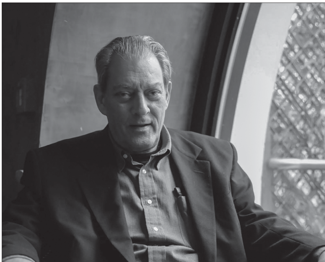
▲ Con Baumgartner, el escritor estadounidense Paul Auster (1947) regresa a la novela y muestra su genio literario.