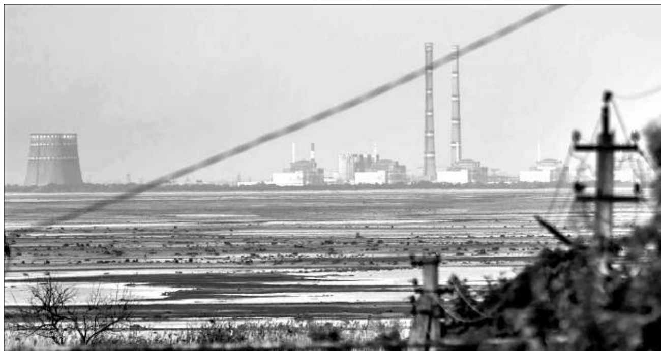
▲ El comunicado de la OIEA señala que "el daño en la unidad 6 no ha puesto en riesgo la seguridad nuclear, pero este es un incidente grave que tiene el potencial de socavar la integridad del sistema de contención del reactor".

De acuerdo con autoridades de la nucleoelectrica, no hubo daños graves ni muertes, y los niveles de radiación en las instalaciones se encon-