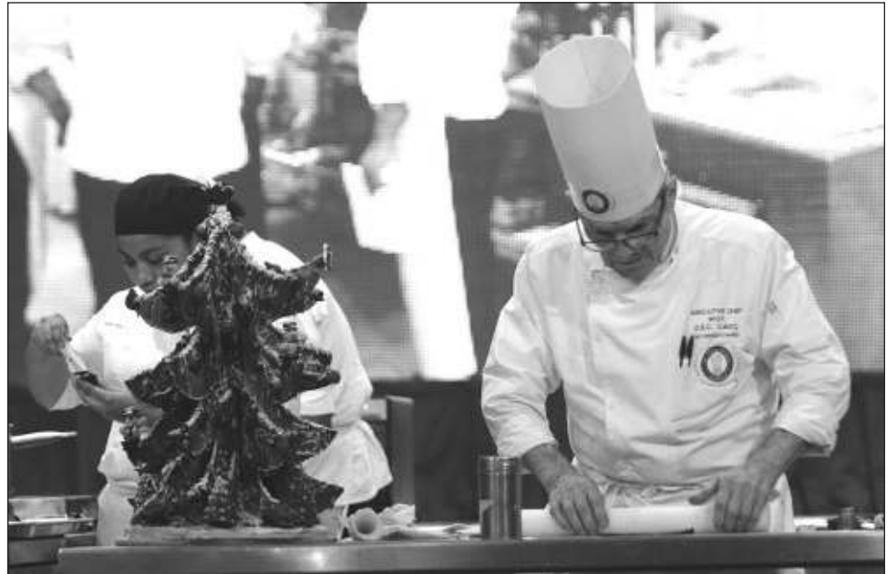
▲ El chef hizo énfasis en que el turismo gastronómico está permeando mucho, especialmente en la zona norte del estado, por lo que posiblemente el próximo año se convierta en la sede del cuarto festival gastronómico del Caribe.

“Seremos uno de los únicos estados (galardonados).