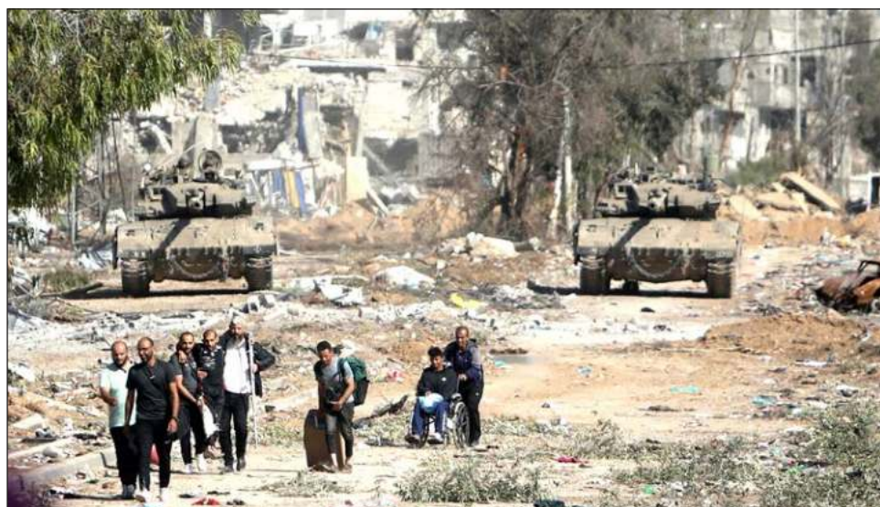
▲ En Rafah viven alrededor de 1,4 millones de personas, más de la mitad de la población de Gaza, por lo que la posibilidad de una ofensiva ha generado alarma en todo el mundo.

Israel ha prometido realizar una ofensiva terrestre en la ciudad de Rafah, en el extremo sur de Gaza, considerada el último bastión de Hamas, y el primer ministro Benjamín Netanyahu dijo el domingo