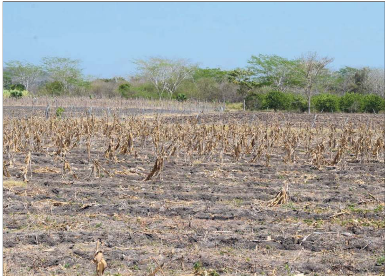
▲ México está cerca de contar sólo con la mitad del agua disponible para satisfacer todas las necesidades de una población en crecimiento, lo anterior debido a causas como la urbanización, el cambio climático y el uso agrícola.

El Monitor de Sequía de México exhibe que no sólo se extendieron los focos rojos por la falta de agua, sino que se intensificaron. Hasta el 31 de marzo del año pasado en estas entidades no había registro de municipios con un