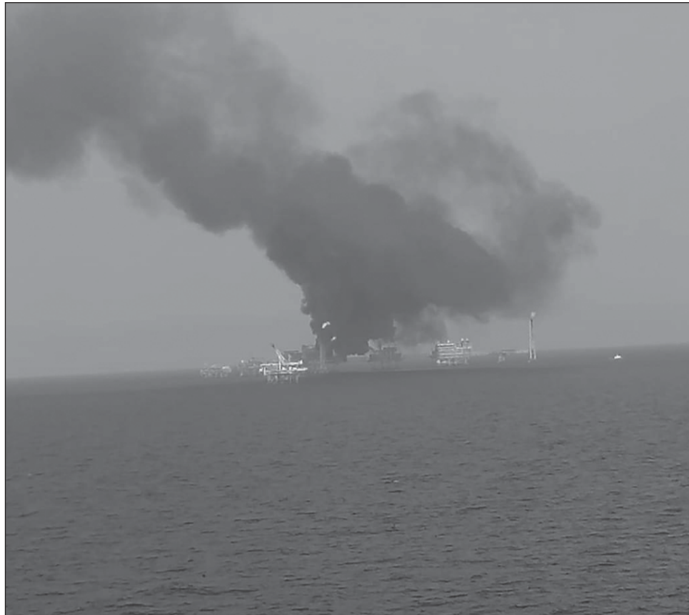
▲ En la zona se presentaron embarcaciones contraincendio para el apoyo de la contención del incendio y el traslado de los obreros a instalaciones seguras.

De acuerdo con la información relatada por los propios obreros, el accidente se registró aproximadamente a las 16:40 horas de este sábado, en la plataforma Akal B1, del Centro de Proceso Akal Bravo, en el área de tubería que conducen gas comestible.