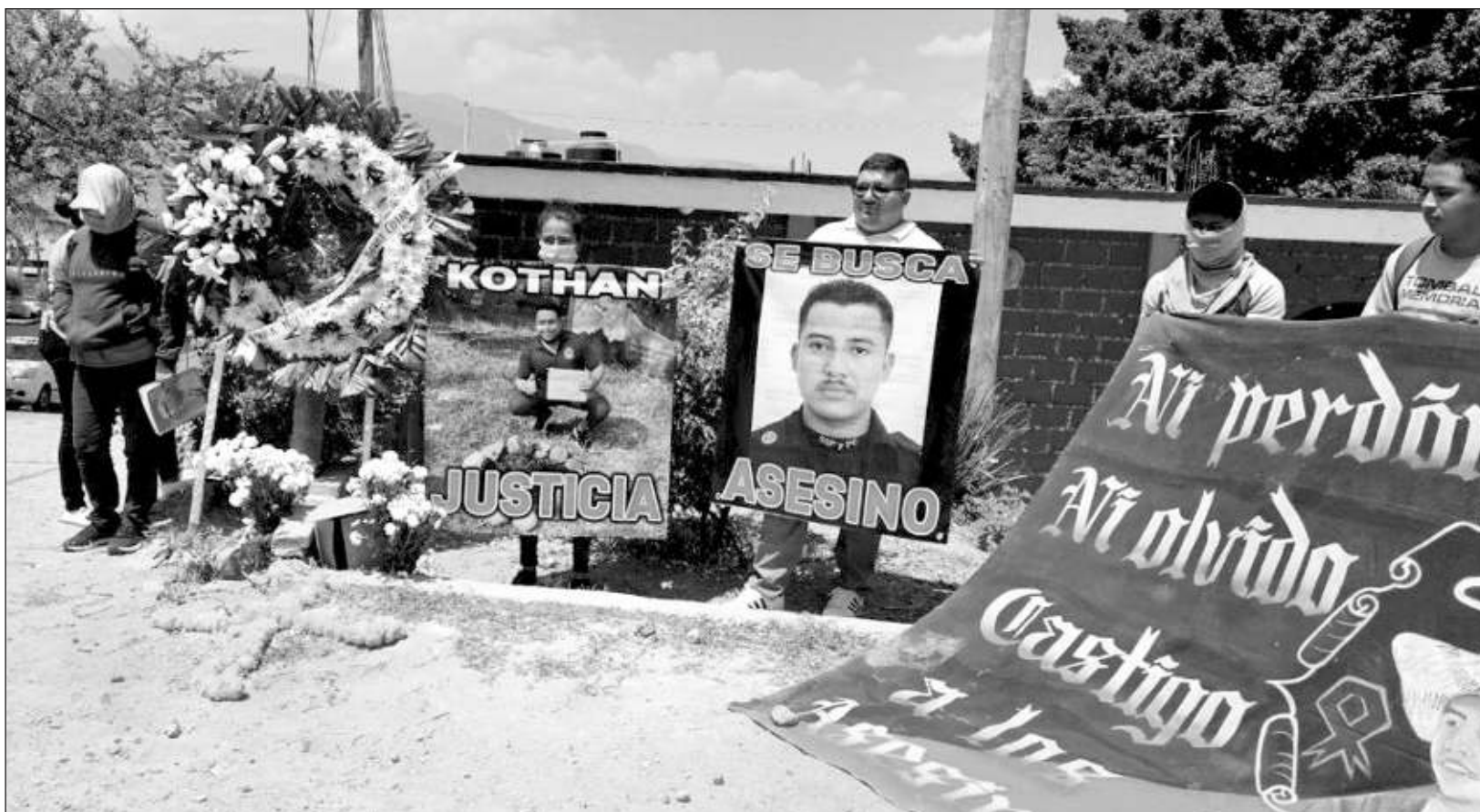
▲ Durante la protesta se demandó la reaprehensión del policía estatal, quien presuntamente habría asesinado al estudiante el 7 de marzo en Chilpancingo.