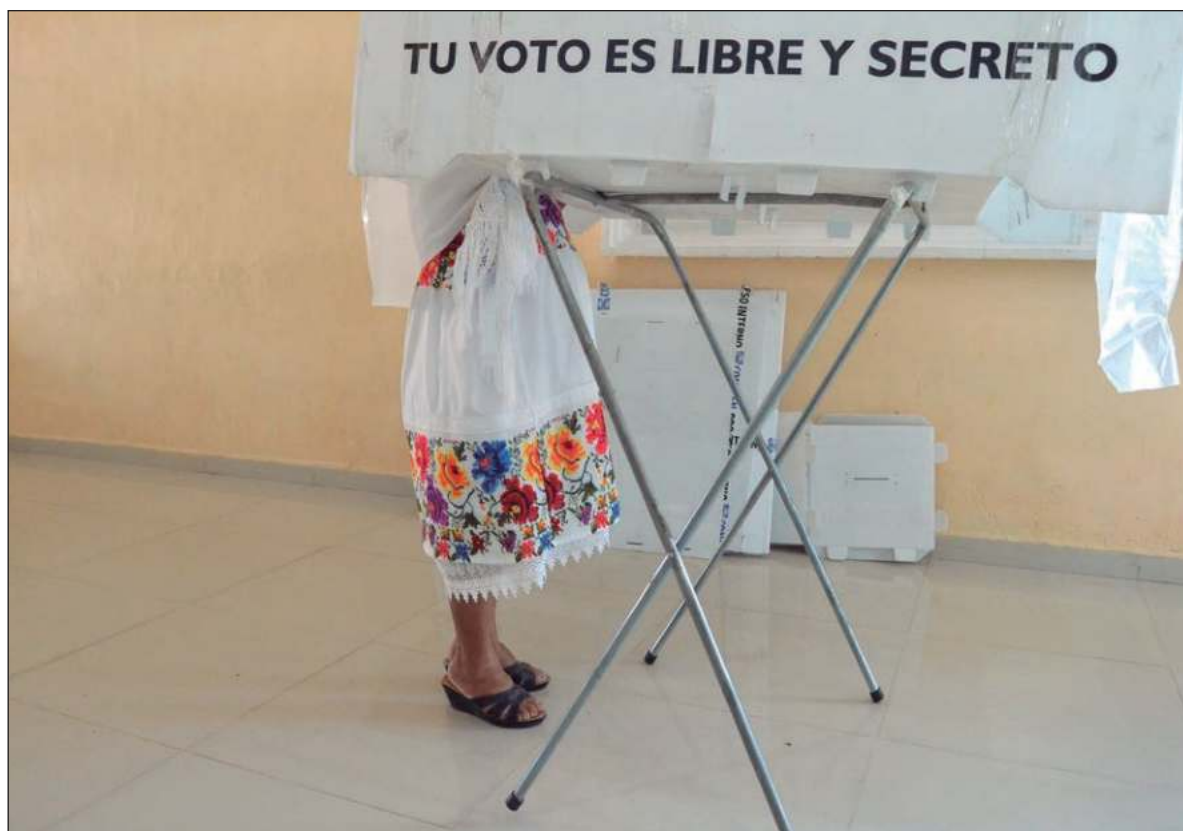
▲ “¿Cómo se hace posible la representación de todos en la toma de decisiones sobre el quehacer público, cuando al mismo tiempo existen procesos de usurpación de la representatividad de grupos originarios como el pueblo maya?”.