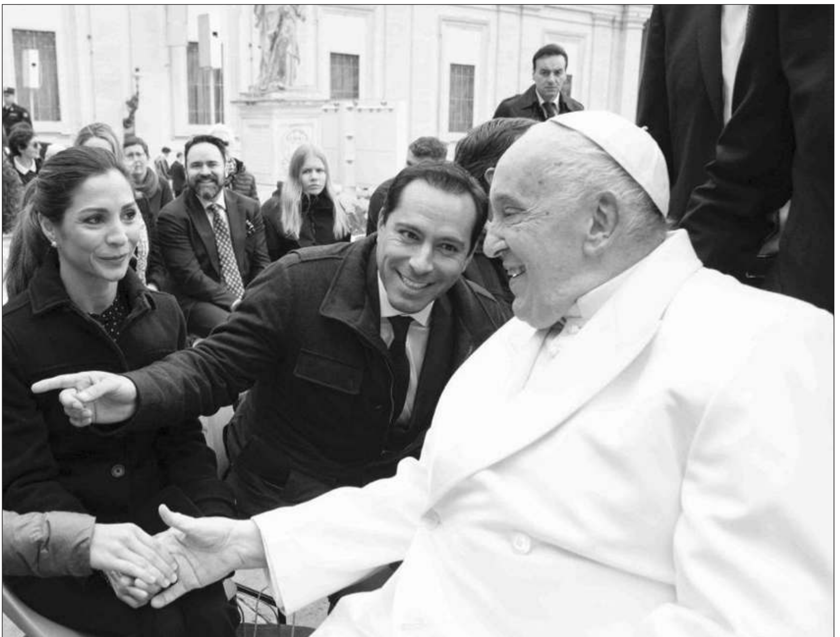
▲ Durante su encuentro con el Papa, el gobernador Mauricio Vila expresó el cariño y aprecio que el pueblo de Yucatán tiene por su Santidad.

Hay que recordar que, en junio de 2021, Vila Dosal, a nombre de los yucatecos, extendió una invitación al Papa Francisco para visitar Yucatán, a través de una carta dirigida al Pontífice y que entregó en esa ocasión al Cardenal Pietro Parolin, secretario de Estado del Vaticano, quien realizó una visita a la entidad.