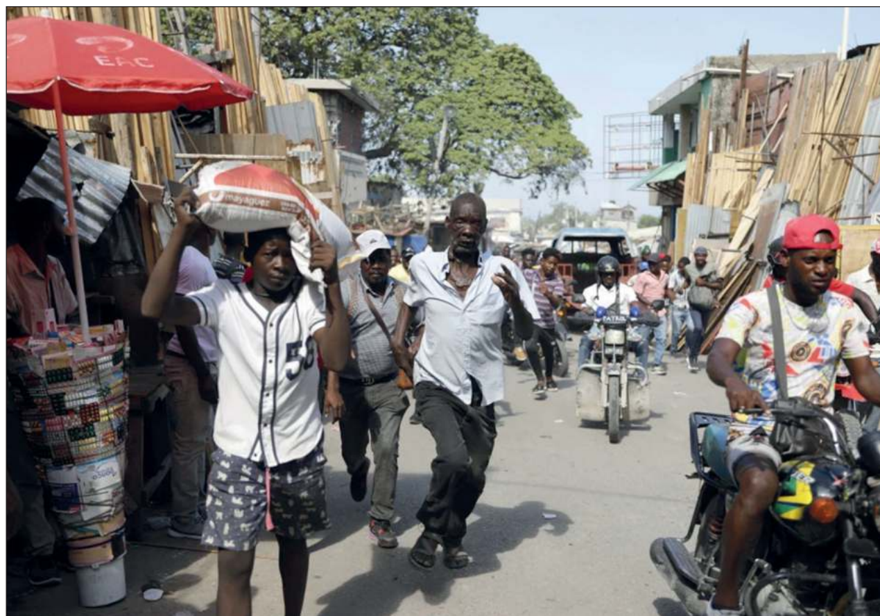
▲ Desde el pasado jueves no se han registrado los recurrentes enfrentamientos armados y el asedio a instituciones públicas registrados en las últimas semanas, lo que permitió a los ciudadanos a salir a las calles.

"La Pastoral les informa que los ataques directos de bandas armadas contra la Iglesia desde el domingo 24 de marzo continuaron y resultaron esta semana en el saqueo del templo".