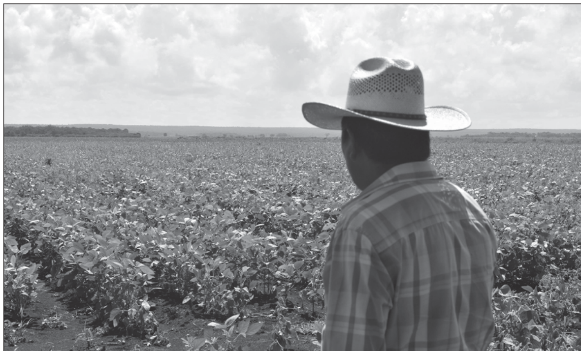
▲ "Aunque la mayor parte de los núcleos interpretativos contemporáneos se concentra en el 68, es preciso volver a repasar la movilización campesina de aquel primer lustro alrededor de 1919".

Así, entre 1959 y 1964, una ola intensa de movilización sacudió al mundo rural. Dispersa, muchas veces desorganizada y sin vasos comunicantes, ella permite entrever los principales motivos que luego reaparecerán bajo la fórmula de la transición. Fueron los