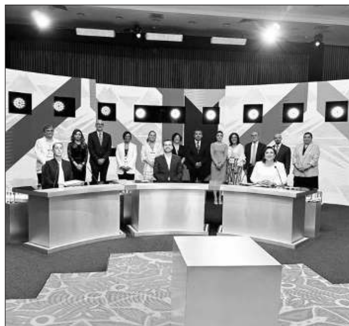
▲ Los temas que se perfilan para ser recordados son los calificativos de "fría y sin corazón" y "la mentirosa candidata del PRIAN".

Agreguemos que pocas personas llevan el registro de las promesas electorales. Por el contrario, en la memoria colectiva permanecen como aspectos destacados en los debates han sido ocurrencias, como la idea de cortarles la mano a los delincuentes, el incidente por el vestido de una edecán, o la frase "Ricky riquín canallín". El contraste de propuestas pasa a segundo o tercer término y por lo general se juzga el desempeño