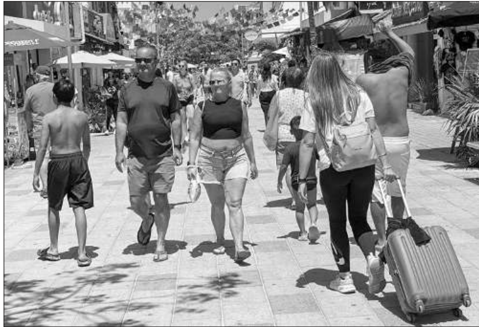
▲ Los cuartos ofrecidos en esta modalidad de alojamiento en Quintana Roo equivalen ya a la mitad de la renta formal, con 31 mil 447 unidades de los 64 mil 939 cuartos ofertados.

Algunos puntos a considerar y en donde se refleja esa “cancha dispareja” son