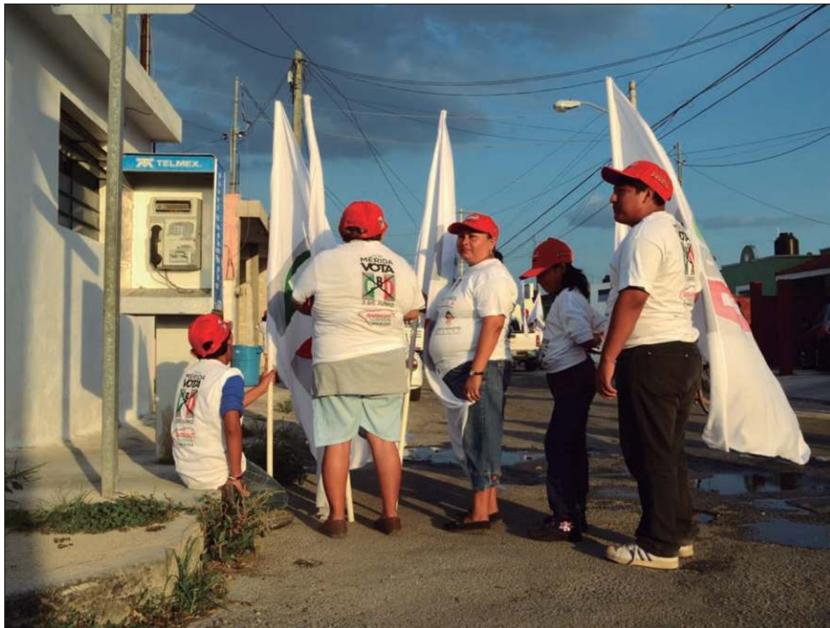
▲ "A priistas, panistas y los escasos perredistas que todavía quedan no les interesan los comicios. Se oponen con violencia inaudita a que se consolide un régimen de sufragio efectivo".

Sin embargo, hoy, cuando se está recuperando el sentido democrático del juego electoral, se presentan las mismas provocaciones obstaculizadoras que a lo largo del tiempo practicaban los políticos que hoy se identifican en la coalición PAN-PRI-PRD. Durante años, las elecciones fueron desdeñadas