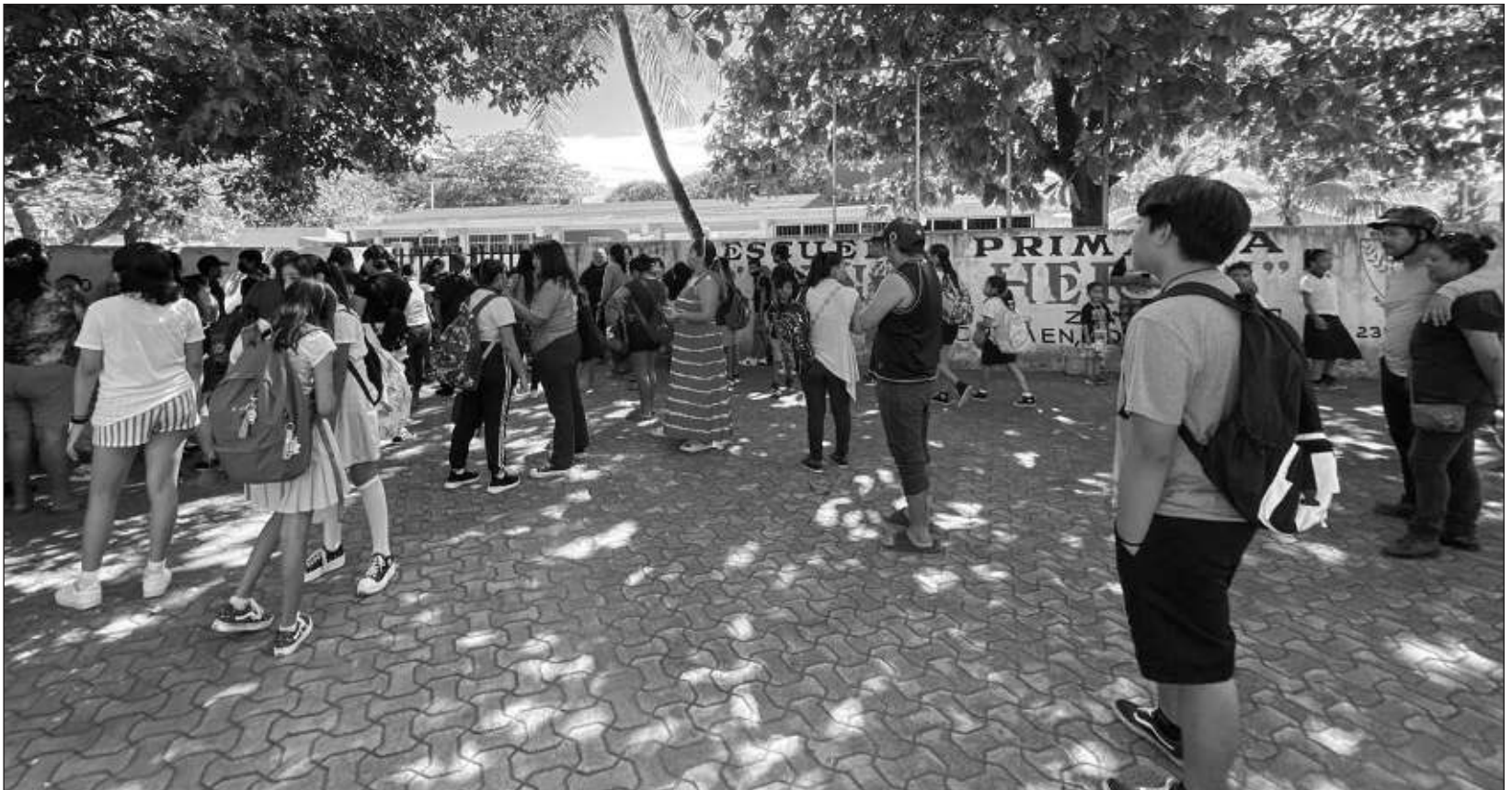
▲ Este retorno a clases se hace justo en el día del eclipse, por lo que incluso algunas personas habían especulado en redes sociales sobre la posibilidad de se otorgara un día más de vacaciones para que las y los alumnos pudieran disfrutar del fenómeno astronómico.