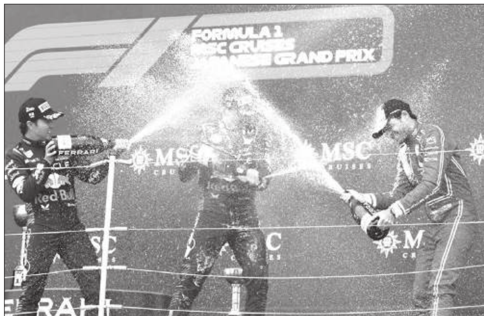
▲ Max Verstappen (centro) celebra con Sergio Pérez (izquierda) y Carlos Sainz

Al responder a una pregunta, Sainz dio a entender que Verstappen y Red Bull