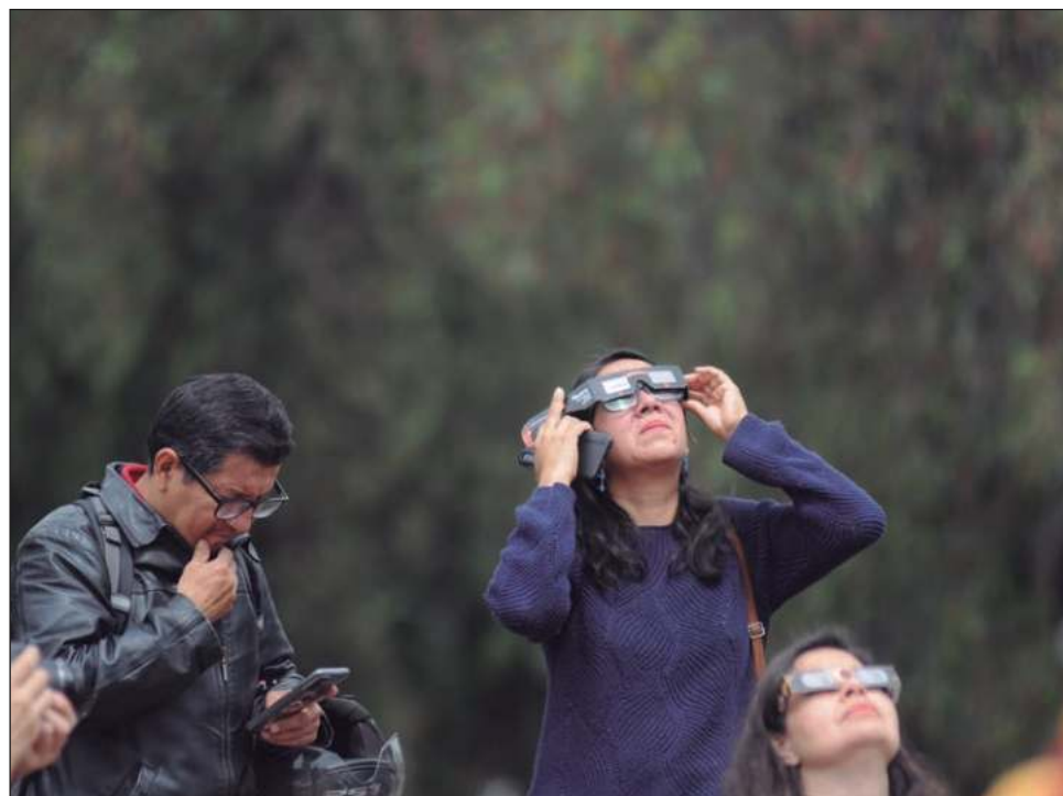
▲ Las autoridades distribuirán 250 mil lentes para observar el fenómeno astronómico.

Como parte de los preparativos, el Instituto Municipal de Cultura, Turismo