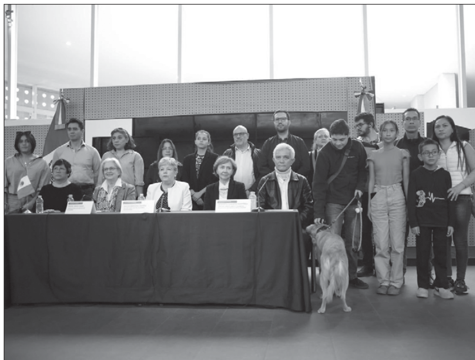
▲ En un mensaje desde el AICM, al dar la bienvenida al personal diplomático, Bárcena señaló que México se siente ultrajado por el atropello a la inviolabilidad de su embajada.

Raquel Serur afirmó en un mensaje en el Aeropuerto Internacional de la Ciudad de México (AICM) que el pueblo de Ecuador no se merece al gobierno de Daniel Noboa y aseguró que éste ordenó el allanamiento de la embajada mexicana, en flagrante violación del