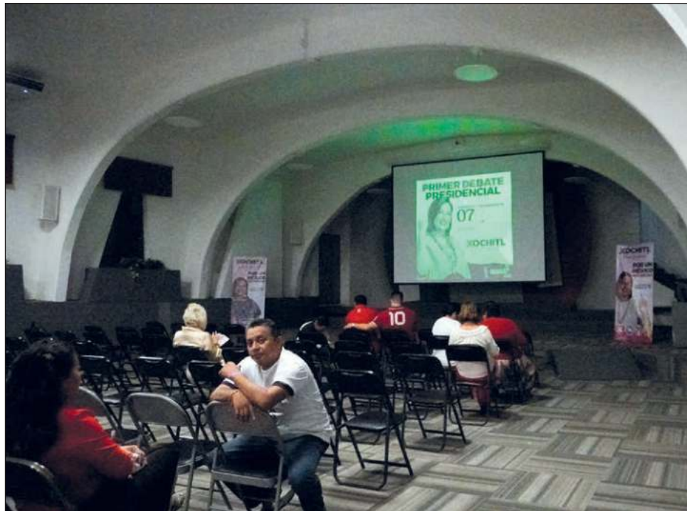
▲ Mientras que Gálvez expuso que quiere un país en el que “salir adelante sea un derecho, no un privilegio” y Sheinbaum aseguró que será la primera mujer en presidir la nación, Álvarez Máynez llamó a los ciudadanos a construir “un México nuevo”. En la imagen, auditorio del PRI en la capital campechana antes de la emisión del debate.

Enseguida, Gálvez enfocó sus argumentos en contra de