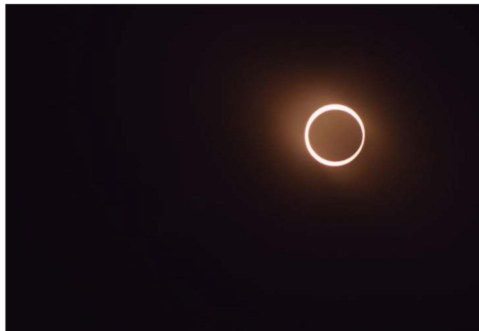
▲ Los maestros y directores coincidieron en que faltó una mejor planeación para hacer de este fenómeno astronómico único, una experiencia científica para millones de estudiantes.

Francisco Bravo, director de la escuela primaria Leonardo