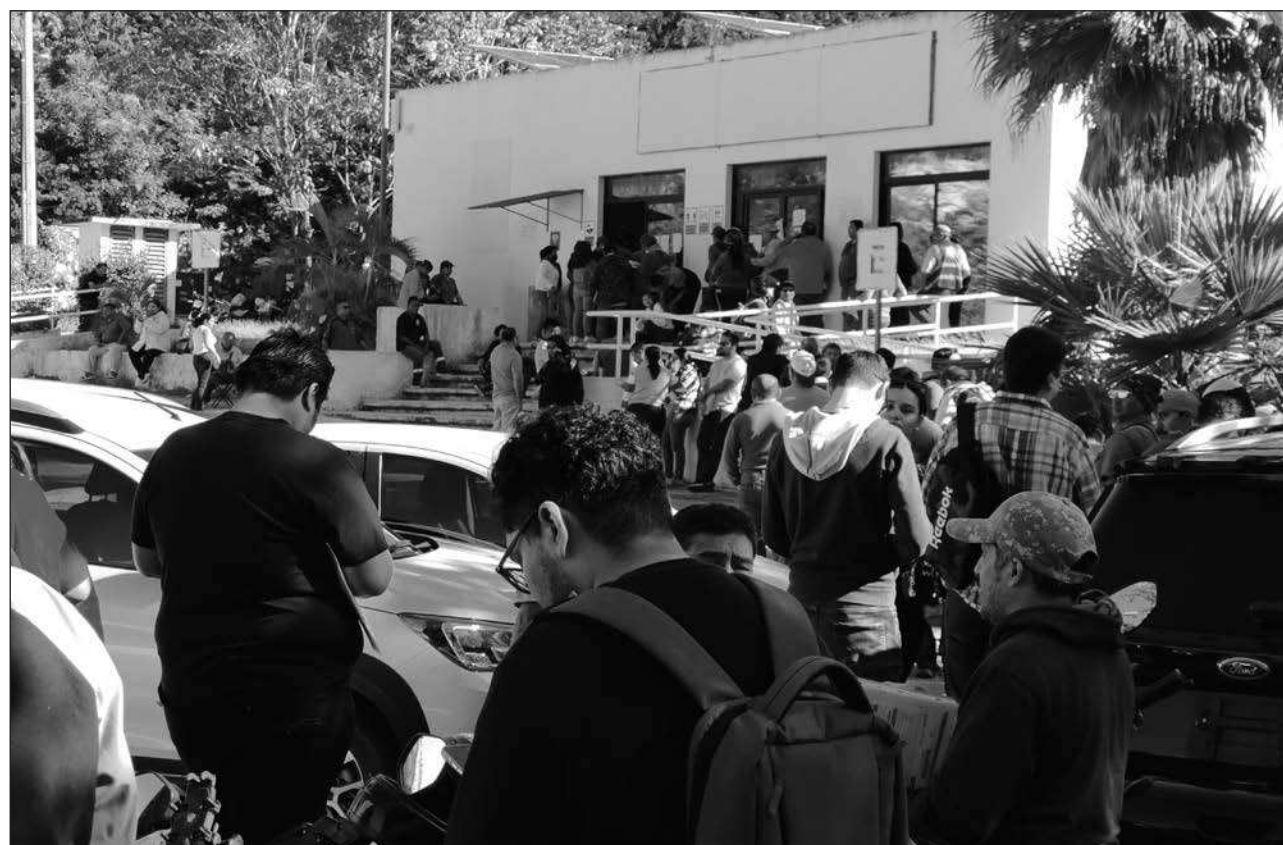
▲ El límite para realizar el trámite será hasta el 31 de marzo, ya que posteriormente aplicarán multas.

Así, para que sea más ágil y fluido el cambio de placas se instalará el mó-