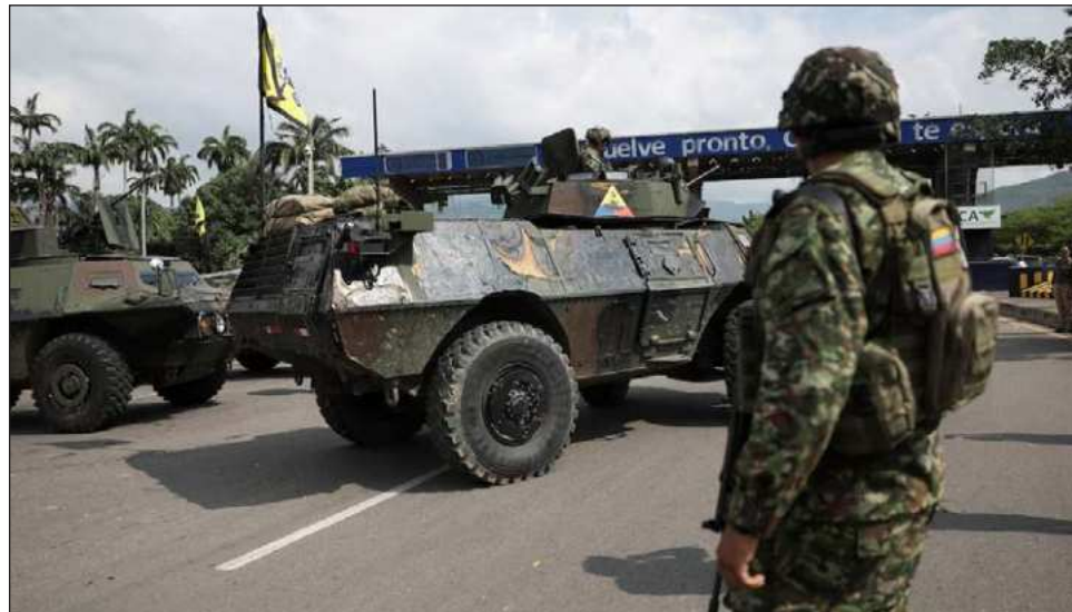
▲ "Le dije a Trump que quienes habían afectado la relación bilateral son políticos narcotraficantes que buscan sembrar de violencia el país", subrayó el presidente Petro.

Petro, además, divulgó que su canciller Yolanda Villavi-