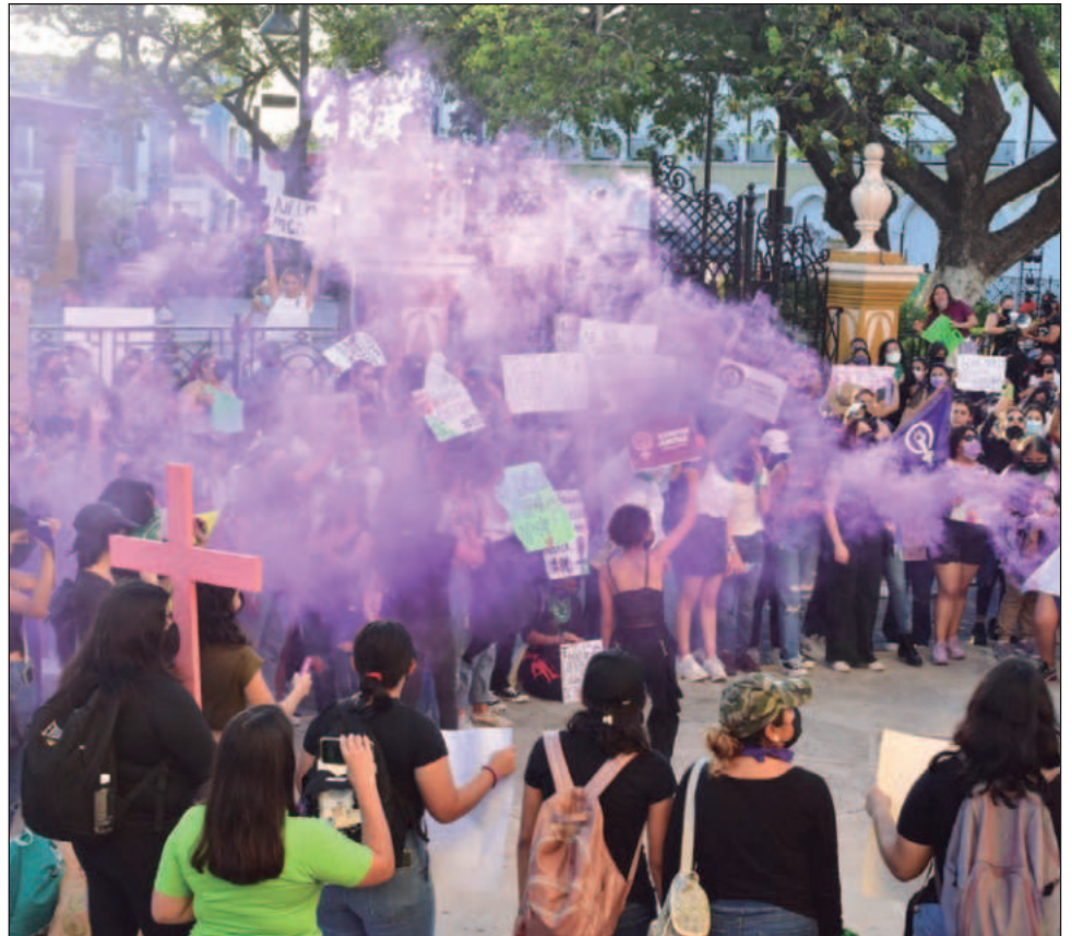
▲ En el delito de violación simple y equiparada Quintana Roo y Campeche se posicionan en segundo y tercer lugar, con 656 y 246 casos respectivamente.

En llamadas de emergencia por hostigamiento y acoso sexual Quintana Roo tiene 399 casos, Yucatán 209 y Campeche 47 hasta noviembre.