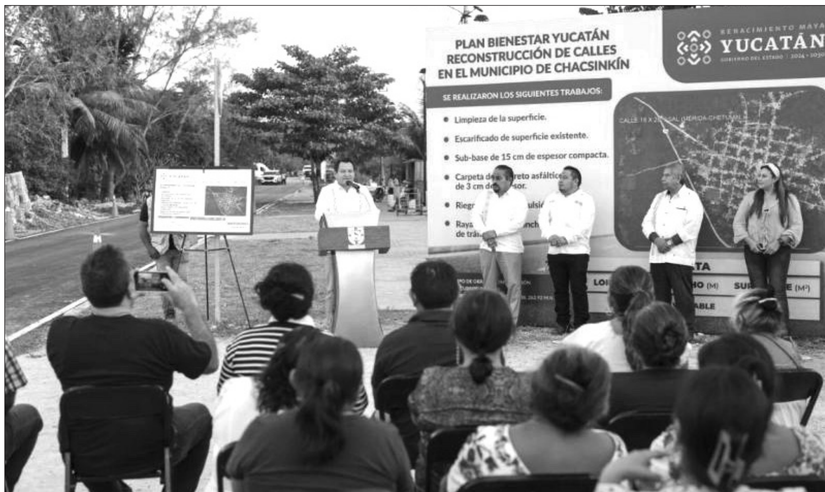
▲ Durante la entrega del plan, el mandatario estatal afirmó que contar con calles en buen estado transforma la vida diaria de la población y responde a una demanda histórica de comunidades que por décadas no recibieron mantenimiento adecuado en su infraestructura urbana.