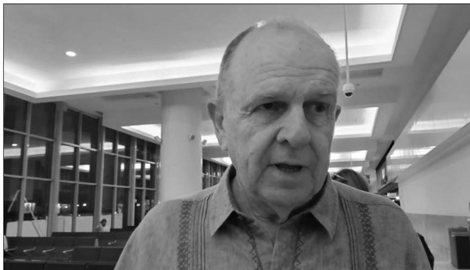
▲ Son varias las agencias de viajes, dijo Liman, que ya están por su cuenta armando paquetes hacia el destino mexicano, por lo que el aumento de turistas podría ser inmediato.

Son varias las agencias de viajes, dijo, que ya están por