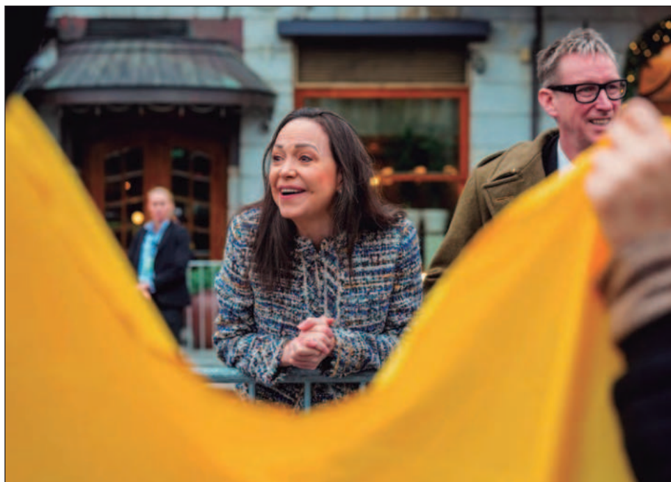
▲ Machado apoyó desde el inicio la presión militar estadounidense sobre Venezuela. Ha agradecido hasta el cansancio a Trump, con quien dijo no habla desde el 10 de octubre.

El apoyo de Washington a las denuncias de fraude de Machado y la reivindicación del triunfo de Edmundo González Urrutia quedaron de lado.