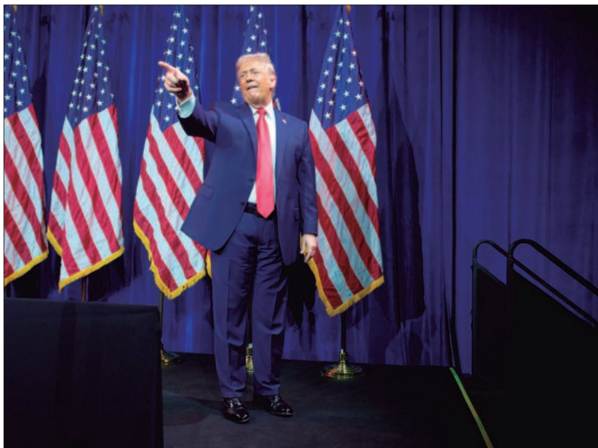
▲ “El fortalecimiento de las posiciones favorables a Trump y el avance de sus intereses en América Latina pone en riesgo a todas las demás naciones que la conforman, aunque la amenaza sigue permeando a todo el planeta”.

No puede negarse la crudeza de la realidad política del mundo ni la presencia del conflicto en la historia, pero los daños que gravitan sobre la humanidad junto con todos los organismos vivos son inconmensurables. Y aunque el espacio para albergar siquiera un optimismo moderado sea cada vez más reducido, sólo queda actuar con responsabilidad e invocar la lucidez que anida lejos del prejuicio, ante los poderes que alientan este panorama sombrío.