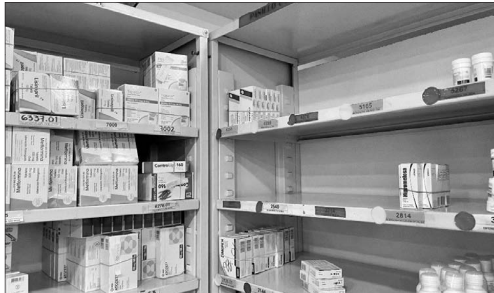
▲ El programa institucional de Birmex reconoce que las carencias de medicamentos y tratamientos esenciales se han originado por deficiencias en procesos de compra y distribución.

Entre las actividades contenidas en cinco objetivos, está la de promover la vinculación, transferencia tecnológica, de conocimiento e innovación entre instituciones y sectores, para la modernización y nuevas líneas de producción.