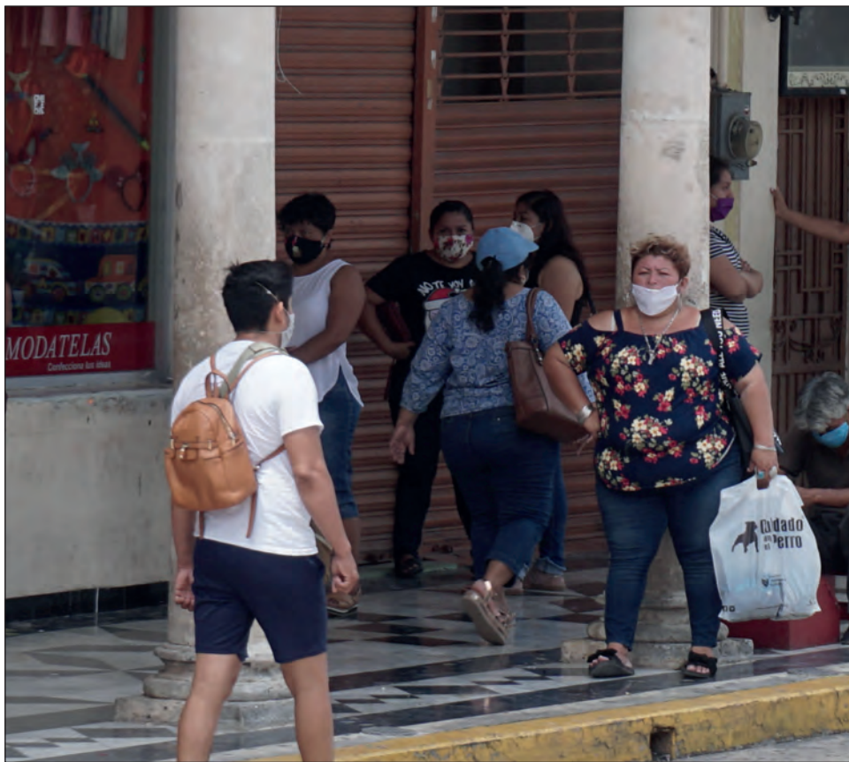
▲ Por el confinamiento, más personas han recurrido a auxilio profesional para depresión y ansiedad.

“En este periodo de pandemia, se ha desatado la incertidumbre por sobre todo y las cifras han bajado, pero la problemática persiste.”