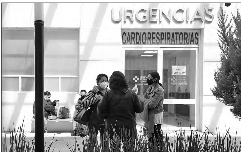
▲ Afuera del Hospital General Doctor Eduardo Liceaga, en la Ciudad de México.

Lo mismo ocurre en Hidalgo, que pasó de 39 a 59 por ciento en ocupación de camas generales, y de 21 a 32 por ciento con ventilador.