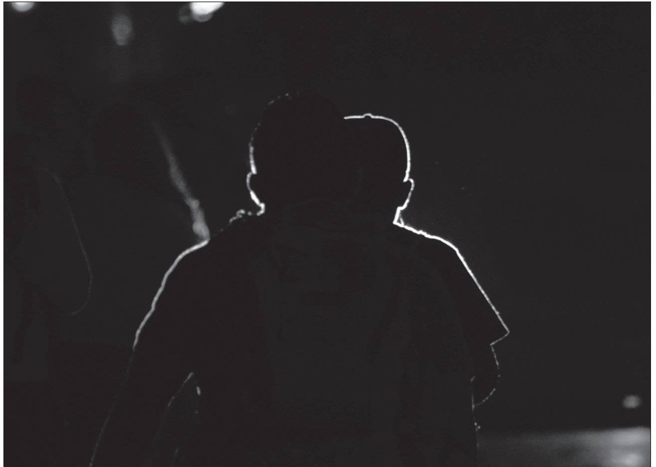
▲ Aislamiento, pérdida de interés, falta de concentración, deserción escolar, bajo rendimiento laboral, son algunos de los padecimientos de la depresión, que si no se tratan a tiempo, pueden derivar en el suicidio.