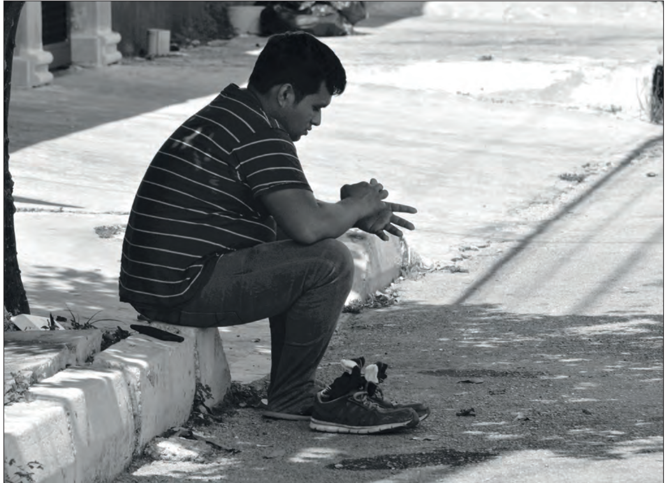
▲ El encierro generó roces con la pareja, los hijos y otros miembros de la familia. Muchos no han sabido cómo manejar la situación y reciben asesoría especializada a través del 911.

En el momento de mayor demanda esta red creció y