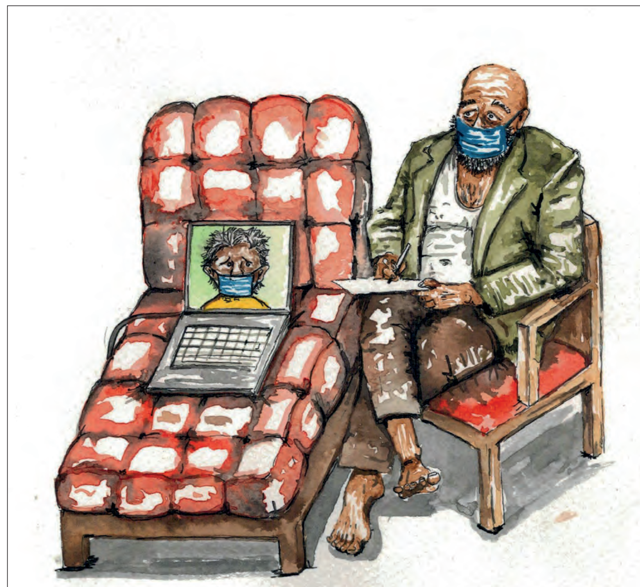
▲ ¿Cómo da terapia un profesional de la salud mental, cuando está atravesando por un proceso similar al de sus pacientes?

Patricia Gilí plantea que en medio de la pandemia tanto sicólogos como pacientes es-