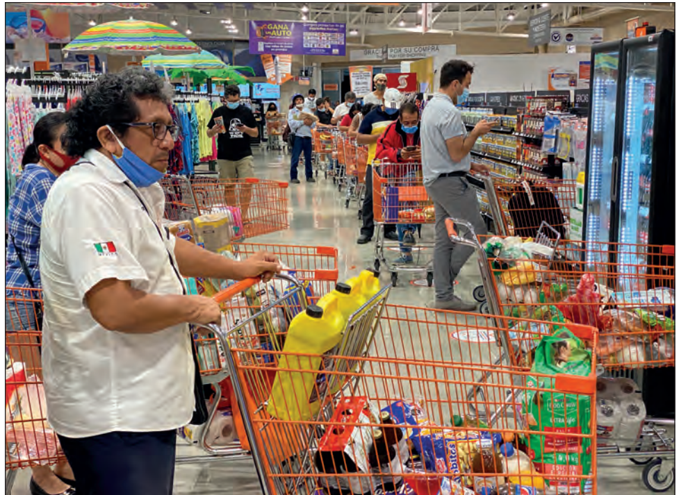
▲ Las autoridades sanitarias de la entidad detectaron un relajamiento social en los protocolos de higiene, como el uso de cubrebocas y la sana distancia.

Actualmente el norte del estado tiene un repunte de 1.14 en el riesgo de contagio cuando la semana pasada había bajado a .87. En el sur, el crecimiento llegó a 1.18, cuando estaba en .94.