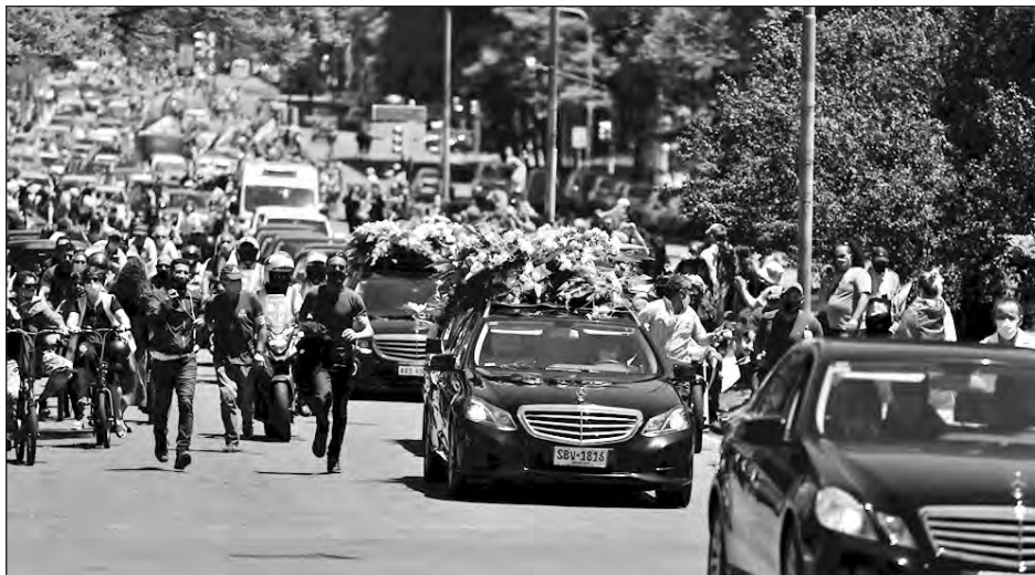
▲ El expresidente uruguayo murió este domingo a los 80 años aquejado de cáncer de pulmón.

El exmandatario falleció sobre las 3 de la madrugada del domingo, "mientras descansaba en su hogar, acompañado de algunos familiares y amigos", señaló Álvaro