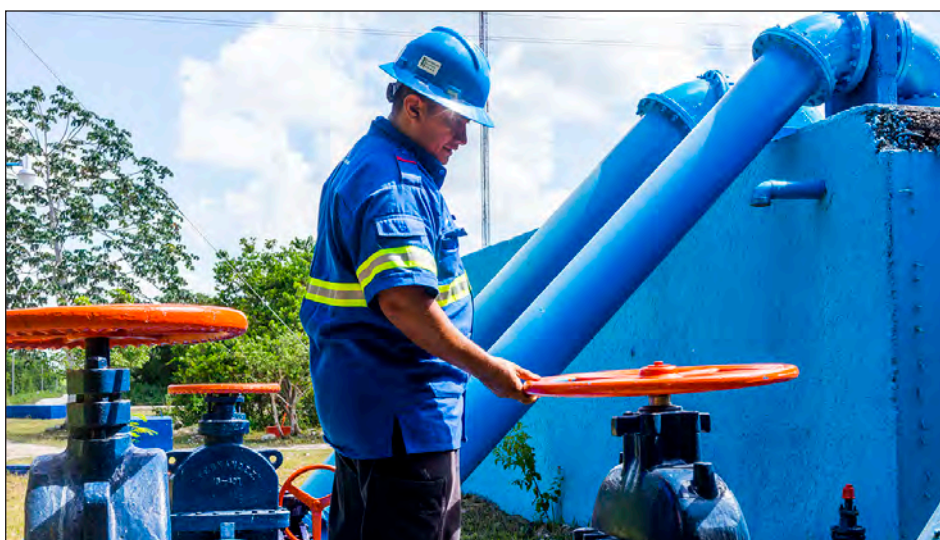
▲ Las labores previstas por parte de CFE iniciarán por la mañana del jueves.

La concesionaria recomienda a la ciudadanía