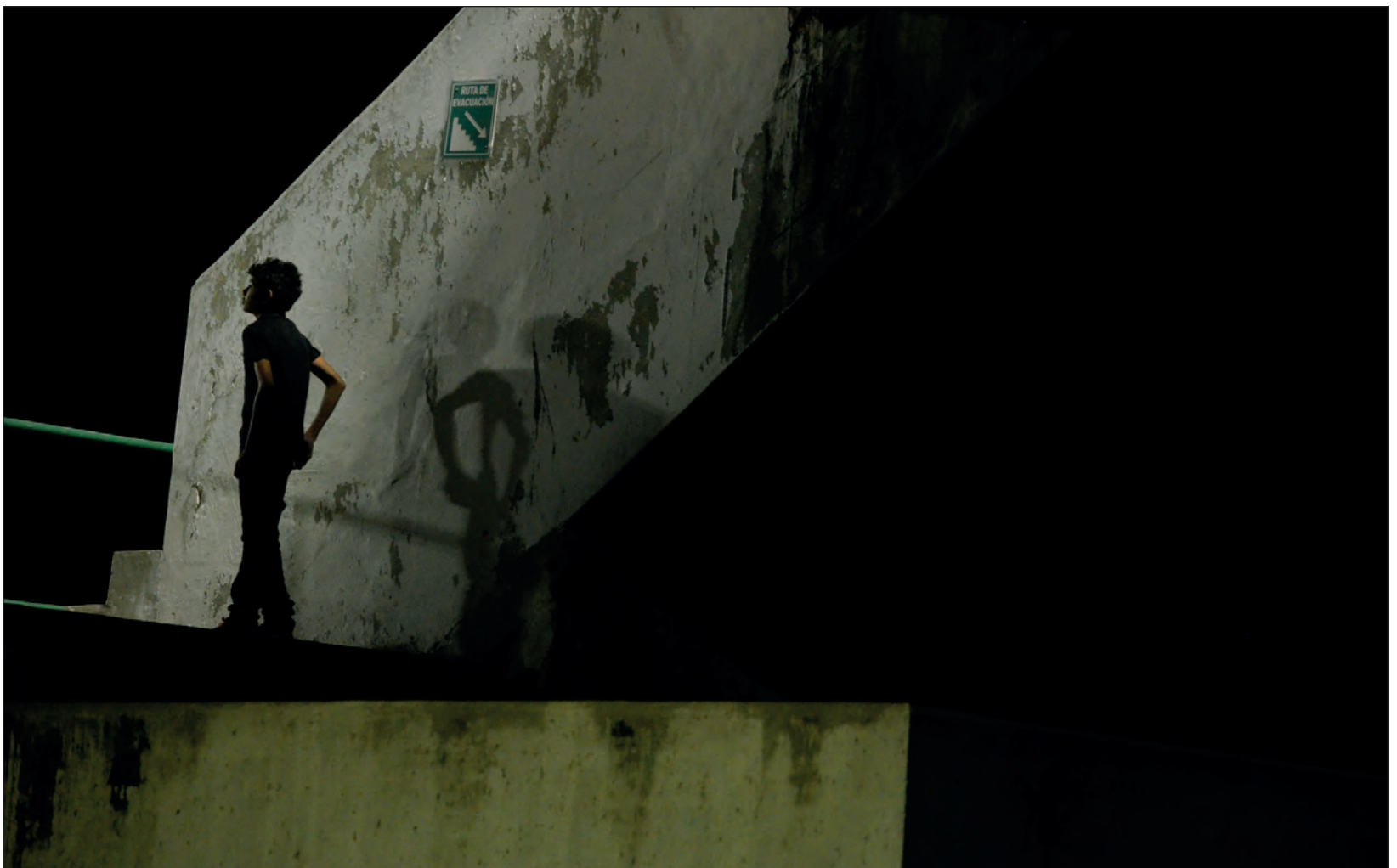
▲ La vigilancia de los padres al estar más tiempo en casa fue definitiva para que las llamadas de intentos de suicidio fueran a la baja.

Incluso dijo que no podría decir el porcentaje de la población en Campeche que sufre de algún problema de salud mental, ya que esto abarca más problemas, como el consumo de alcohol y otras drogas legales como el tabaco, situaciones a las que tampoco ligó a los demás trastornos ya que como mencionó al principio, “no todas las personas que se han suicidado están alcoholizadas o todos los que tienen problemas de alcohol tienen depresión”, dijo.