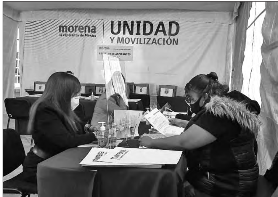
▲ Layda Sansores se registró al proceso por la candidatura al gobierno de Campeche, luego que lo hicieran Irasema del Carmen Buenfil y Rocío Abreu Artiñano.

Al proceso de inscripciones también arribó Renato Sales Heredia, ex comisionado nacional de Seguridad Pública y quien actualmente milita en el Partido del Trabajo (PT).