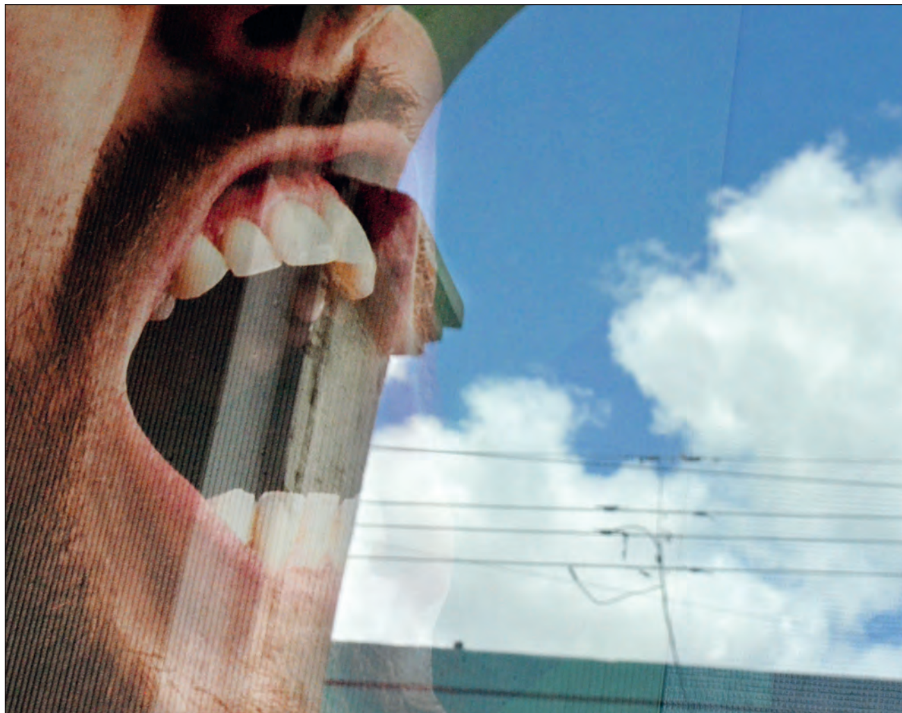
▲ En casos extremos, quienes enfrentan trastornos de ansiedad y depresivos requieren de medicación siquiátrica.

“Es una combinación de dos trastornos, con síntomas: el trastorno de ansiedad y el trastorno depresivo, esto por la pandemia; algunas crisis de angustia, también derivado de esta situación que se vive: gente que se quedó sin trabajo y que entra en crisis de angustia y que incluso hemos referido con siquiatria”.