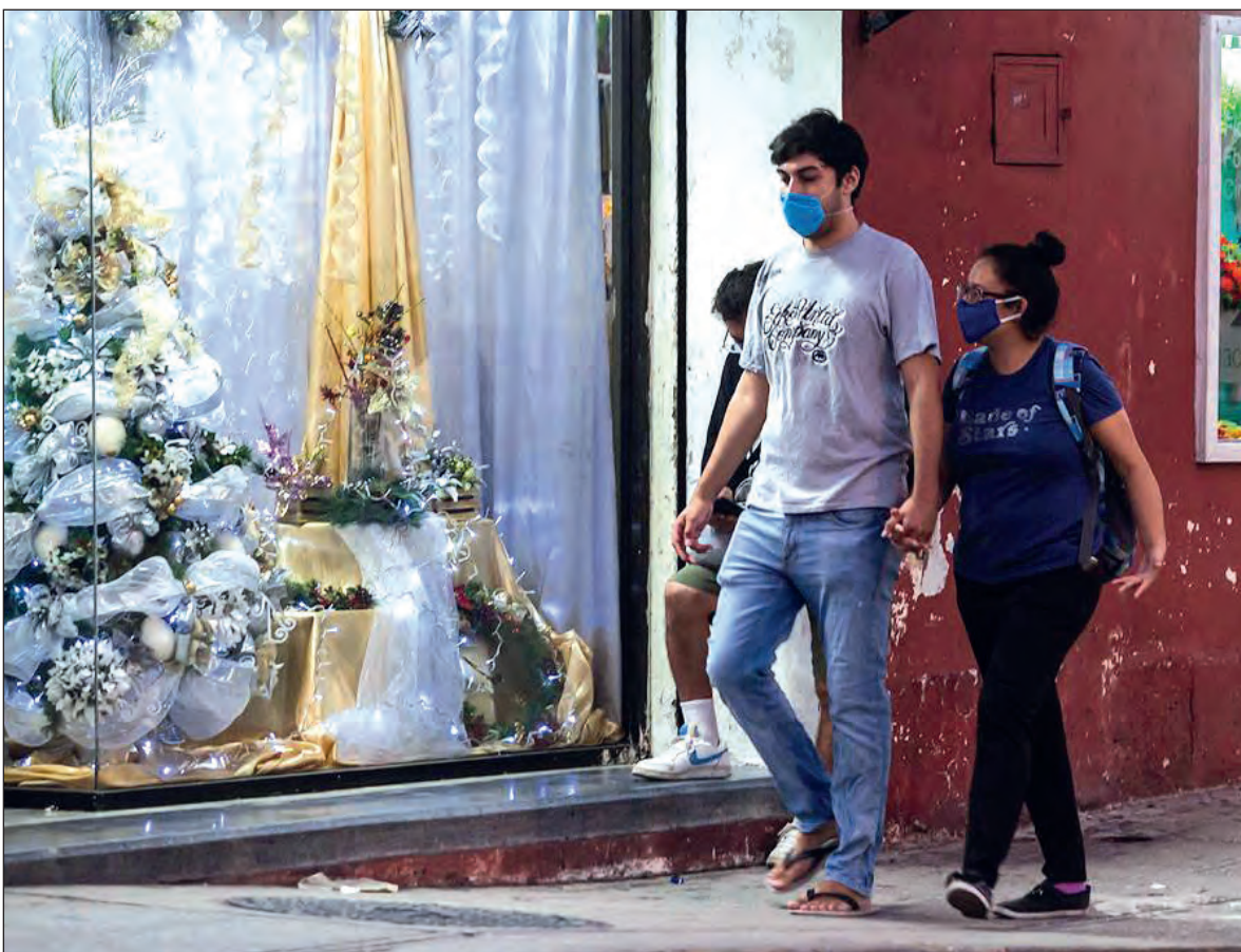
▲ En Mérida el Operativo Decembrino 2020, en el que participarán 400 elementos de la Policía Municipal, trabajará para contener las aglomeraciones en el primer cuadro de la ciudad.

Noviembre fue el segundo mes con más registros de contagios desde el inicio de la pandemia, con 175 mil 721