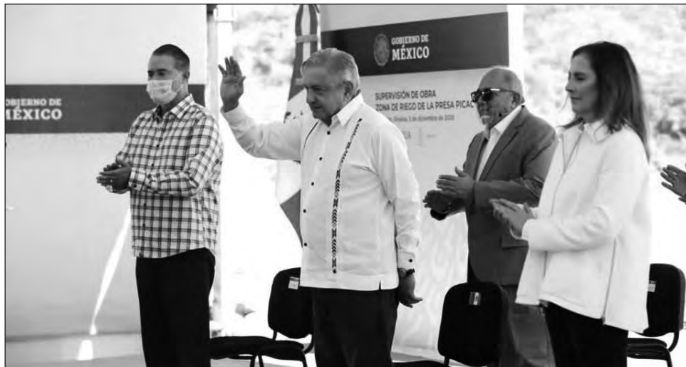
▲ Desde diciembre de 2019 se conminó a Felipa Obrador Olán y a su empresa Litoral Laboratorios Industriales a no seguir participando en las licitaciones de Pemex.

Por orden del presidente López Obrador se dejó fuera