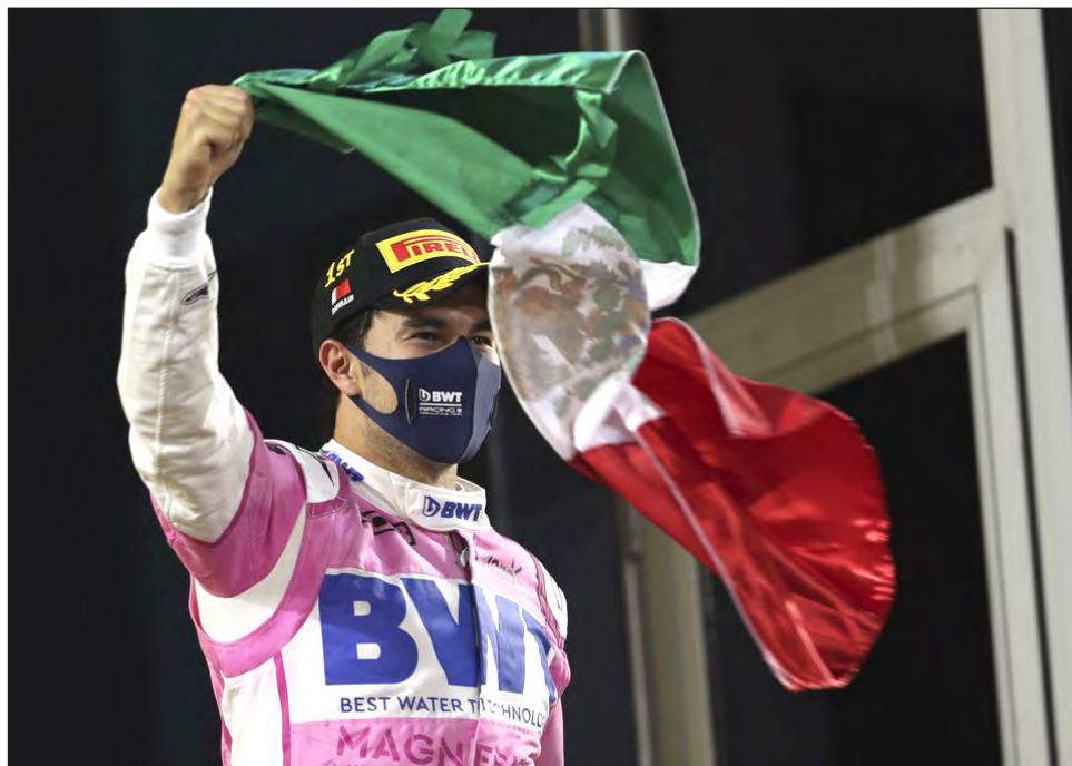
▲ Sergio Pérez (Racing Point) celebra tras conquistar el Gran Premio de Sakhir de la Fórmula Uno, ayer en Sakhir, Bahrein.

El piloto de Racing Point cruzó la meta con una ventaja de 10.5 segundos sobre el Renault de Esteban Ocon y de 11.9 por delante de su