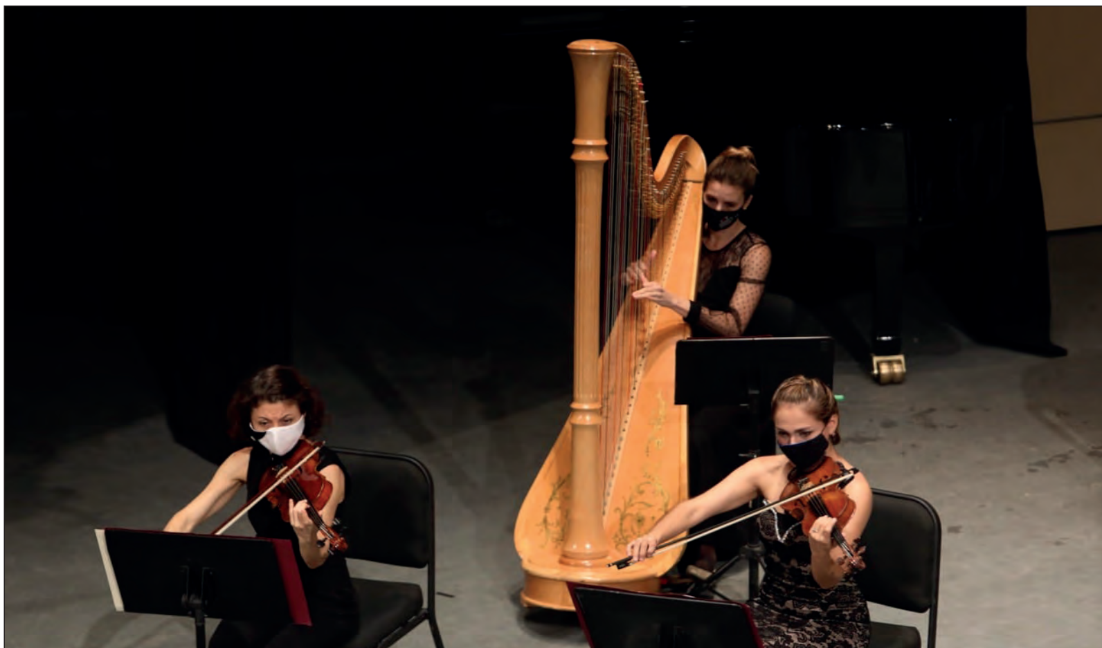
▲ La situación económica que enfrenta el gobierno del estado por los recortes presupuestales podría afectar las actividades e incluso la permanencia de la Orquesta Sinfónica de Yucatán.