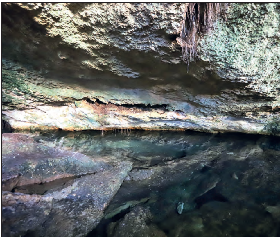
▲ Fonatur reconoció los problemas del suelo kárstico de la región, pero detalló que realizan estudios para evitar complicaciones.

Indicó que están en pláticas con Asur y las autoridades estatales y municipales para concretar un proyecto. “El fin es hacer un nuevo aeropuerto de primera con una zona logística a un lado, con todas las condiciones, y dejarle un terreno para el crecimiento urbano para la ciudad que los va a venir a enriquecer”, indicó.