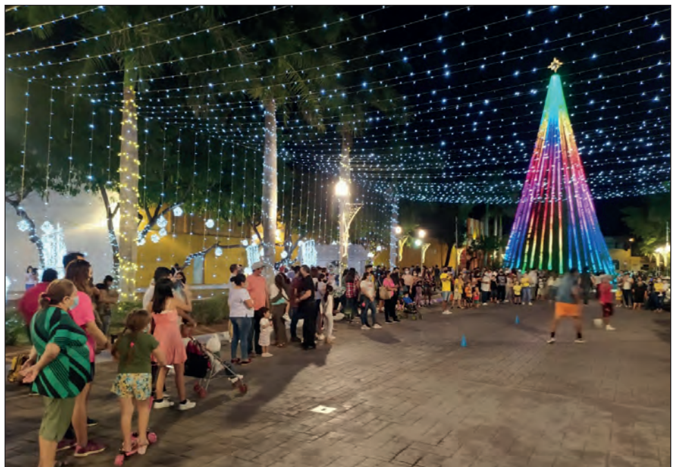
▲ El semáforo epidemiológico se encuentra en color naranja pero ello no fue impedimento para que cientos de personas se reunieran en el remate de Montejo.

Otro de los sectores beneficiados con la afluencia fue el de los vendedores ambulantes. El marquesitero no se daba abasto para atender.