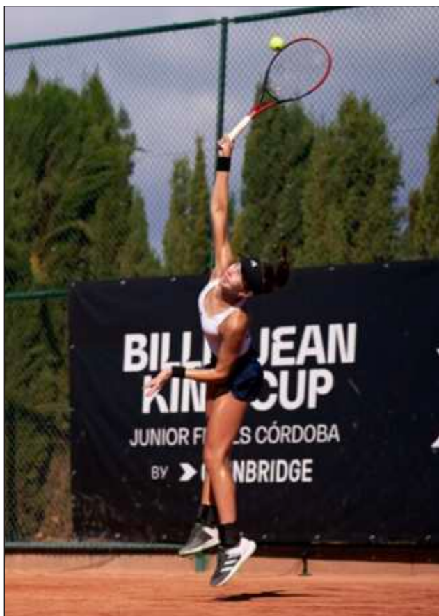
▲ Varios de los mejores tenistas juveniles del mundo estarán en la Copa Yucatán, que será inaugurada el próximo lunes 25.

Hace poco más de dos décadas, en 2002, compitieron cuatro "top" 10 en cada rama en el Campestre, donde desde 2014 vieron acción jugadores de la talla de Gauff, Taylor Fritz, Andrey Rublev,