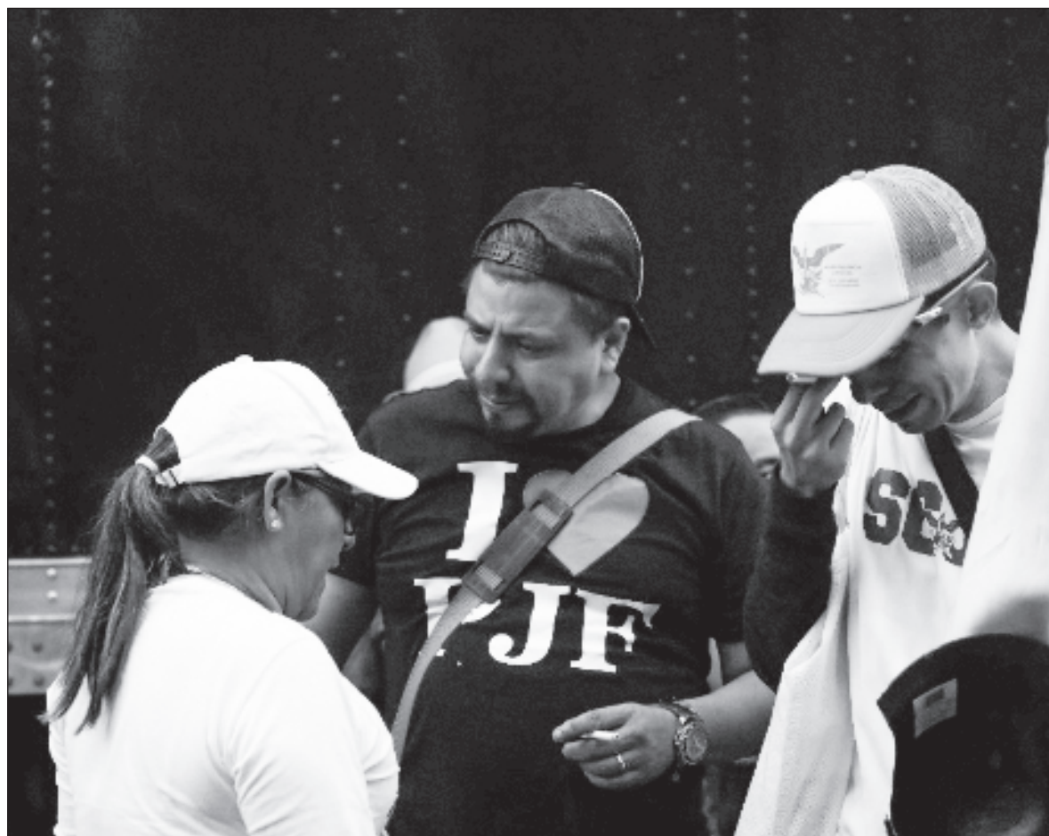
▲ "Para los ministros de la Suprema Corte que sufrieron una crisis de identidad y se sintieron legisladores. Si hubieran ido a la Facultad en aquellos tiempos, ¿los hubieran reprobado? No creo".

LOS CATEDRÁTICOS DE la Facultad de Derecho de la UNAM Mario de la Cueva (derecho constitucional), Jesús Reyes Heróles (teoría del Estado) e Ignacio Burgoa Orihuela (garantías y am-