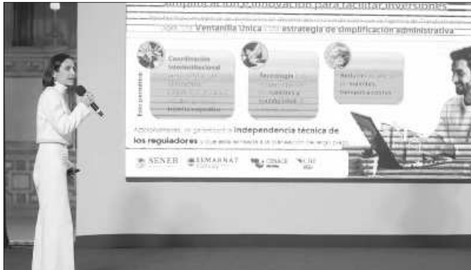
▲ Luz Elena González Escobar, titular de la Sener, comentó que el PNE es el resultado de muchos meses de trabajo, el cual da seguimiento al rescate que hizo el ex presidente López Obrador.

"Este rescate fue posible también gracias a la gran