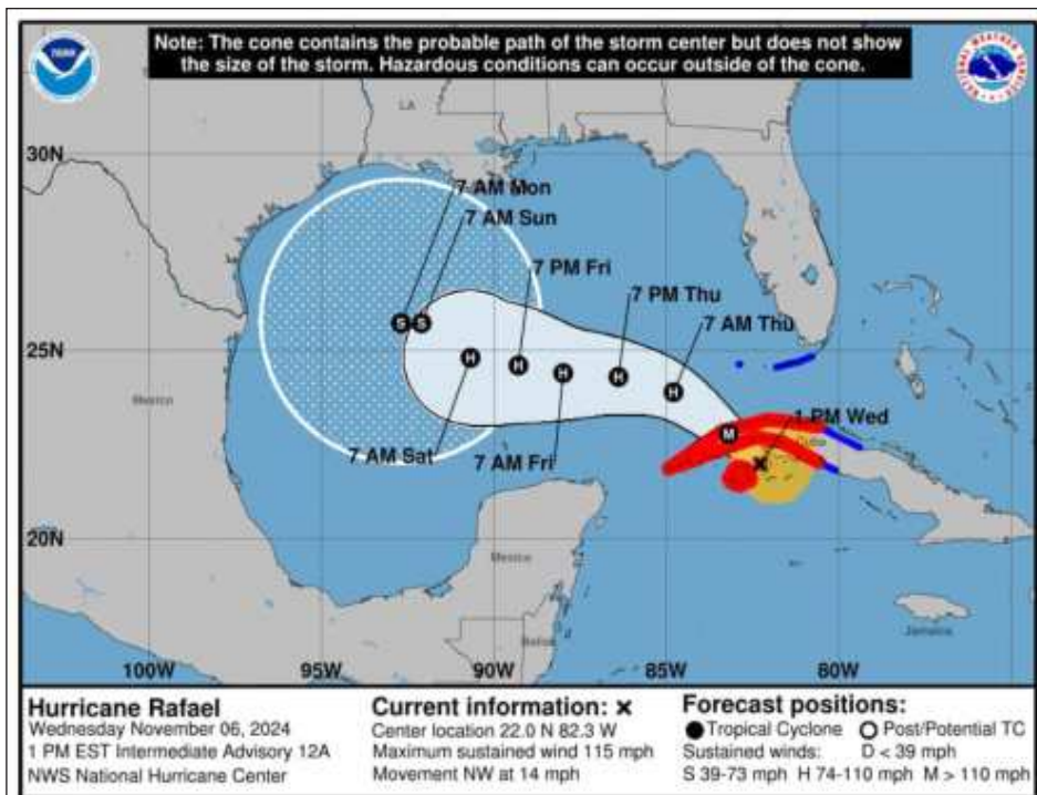
▲ Por su ubicación y trayectoria, el huracán Rafael no representa peligro para las costas de Quintana Roo, pero las autoridades continúan con su monitoreo.

Rafael tiene vientos máximos de 185 kilómetros por hora (km/h), con rachas de hasta 225 km/h y su despla-