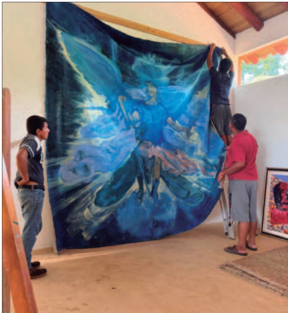
▲ Con motivo de su cumpleaños 80, la artista inaugurará la sucursal de El Aire Centro de Arte y organiza un concurso de papalotes con creadores locales, en honor a Francisco Toledo, quien hacía estos objetos volantes.

Apoyar al Museo Arqueológico de la Costa Grande, en Zihuatanejo, que se logró restaurar, es otro proyecto en el que está involucrada Parra, quien estudió antropología. El edificio había tenido varias funciones, in-