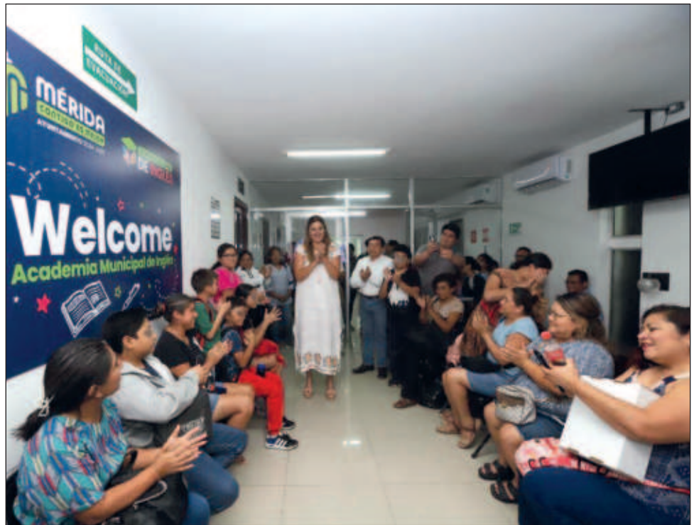
▲ La presidenta municipal visitó la Academia Municipal de Inglés y llamó a los estudiantes a aprovechar las ventajas que ofrece el dominio de este idioma.

Al final del curso los alumnos realizan una exposición frente a un grupo de maestros en el idioma e invitados, donde ponen en práctica el dominio de las cinco habilidades: gramática, comprensión de la lectura, comprensión auditiva, expresión escrita y expresión oral.