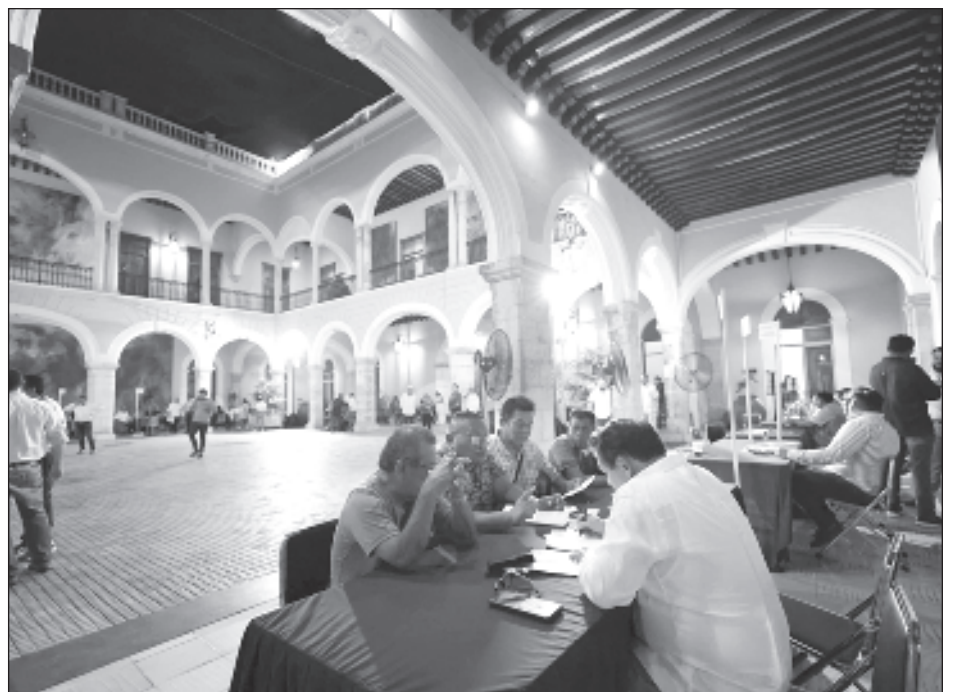
▲ Las consultas también se realizarán a través de una página web que se habilitará en los próximos días para que participen todas y todos los yucatecos.

“Se presentará a finales de marzo de 2025, de manera tal que integre nuestros compromisos de campaña, las ideas que cada funcionario haya puesto sobre la mesa y todo lo que los ciudadanos aporten y se lleve a cabo el análisis de la viabilidad social, económica y política. Mi compromiso es que ese plan será un proyecto de todos y para todo el pueblo de Yucatán plasmando nuestra visión humanista y proponiendo acciones concretas que respondan a las necesidades y sueños de nuestra gente para lograr el mejor Yucatán de nuestra historia”, declaró Díaz Mena.