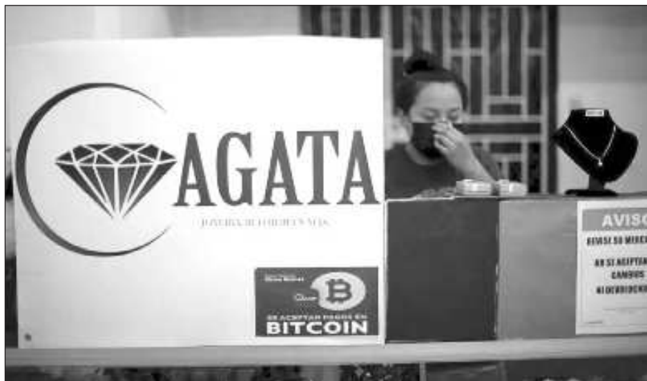
▲ En el centro de San Salvador, que se caracteriza por su alto movimiento comercial, son pocos los pagos en criptomonedas que reciben los comercios, tanto formales como informales.

En estos 12 meses, el gobierno supuestamente compró 2 mil 381 bitcoins por más de 100 millones de dólares, lanzó una billetera digital para entregar un bono a sus usuarios, anunció la construcción de Bitcoin City y la colocación de mil millones en bonos respaldados por la criptomoneda, pero de casi todo esto la informa-