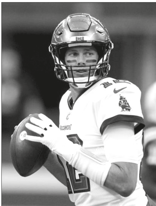
▲ Tom Brady y Tampa Bay visitan a los Vaqueros este domingo, en la primera jornada de la NFL.

Por su parte, Carolina adquirió a Baker Mayfield, de Cleveland, luego de seleccionar a Matt Corral, de Mississippi, en la tercera ronda del draft. Corral se desgarró un ligamento del pie izquierdo en un duelo de pretemporada, y se perderá todo el año. Mayfield quedó como titular, tras