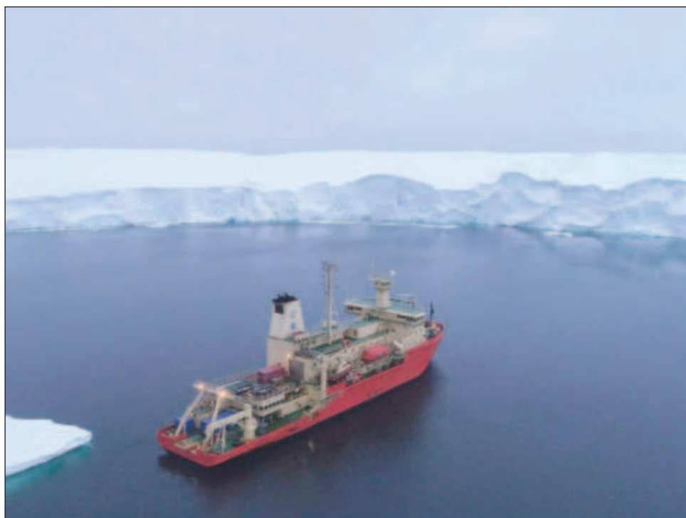
▲ En el mar de Amundsen, el glaciar Thwaites se encuentra en una fase de rápida retirada, según revela el estudio de imágenes del fondo marino.

La investigación añade motivos de preocupación tras cartografiar una zona crítica del fondo marino frente al glaciar que permite saber la rapidez con que se retiró y movió en el pasado.