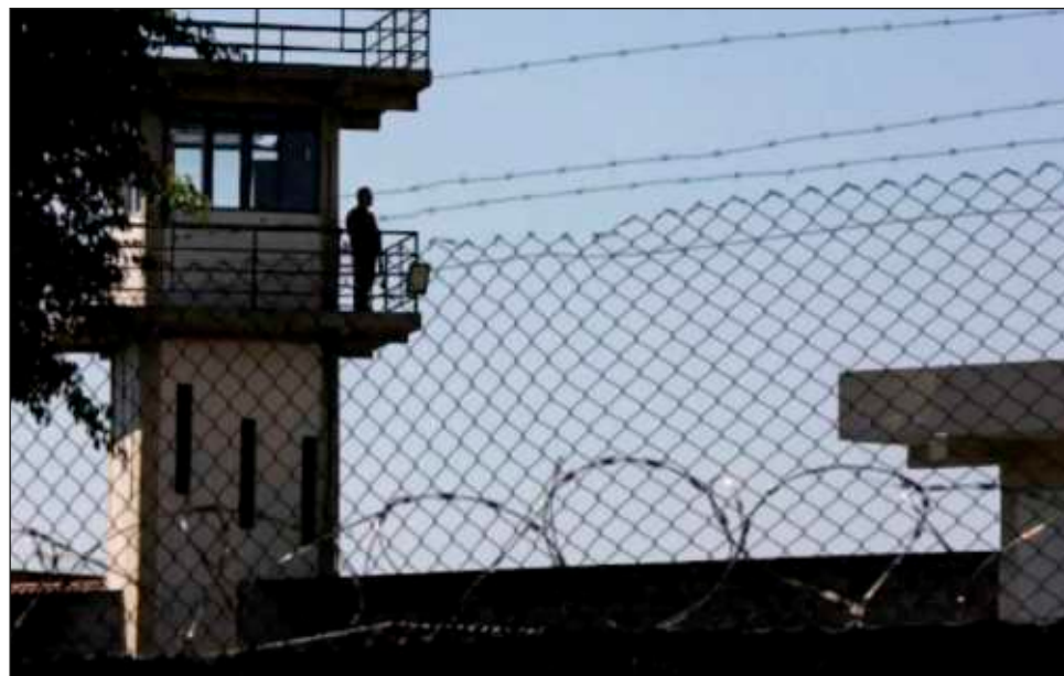
▲ Interrogado sobre las personas que están tras las rejas aun siendo inocentes o porque fueron torturadas para inculparse, el Presidente señaló que esto “es responsabilidad de la corrupción” en el sistema de justicia; y se comprometió a buscar otros mecanismos.

“Imagínense ustedes, independientemente que el po-