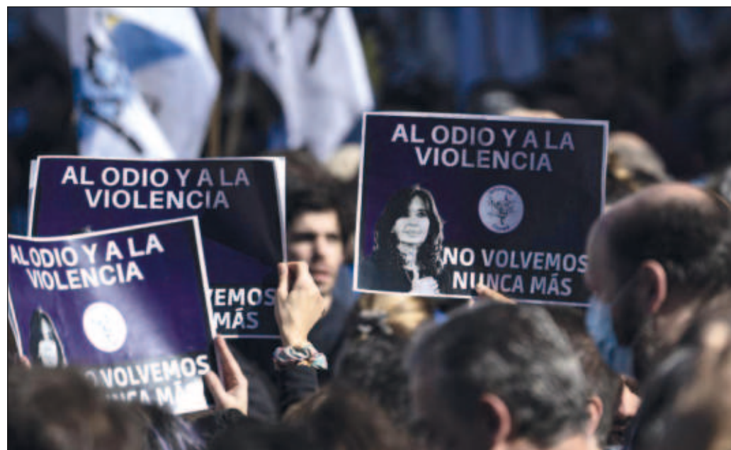
▲ La pesquisa ha sido manchada por contradicciones y actos equívocos que podrían ser resultado de una extremada torpeza policial o de un afán de encubrimiento y desviación de la justicia.

En tal circunstancia, no pocas voces de la oposición han buscado presentar el fallido atentado contra Fernández de Kirchner como un "montaje" o un "autoatentado" y han minimizado la posibilidad de que sea resultado de una conjura política criminal. Los errores e inconsistencias de la investigación fortalecen la segunda de esas sospechas.