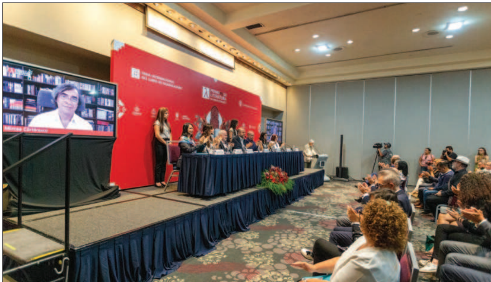
▲ “En los poemas de Cărtărescu se aprecia la ingenua alegría de un prosista de cepa aventurándose en la resbaladiza lírica, y él mismo lo reconoce: ‘Yo no sé escribir poesía. A veces puedo escribir, pero yo no sé escribir. Y, si alguien me pregunta qué reglas sigo, no puedo decírselo’”.