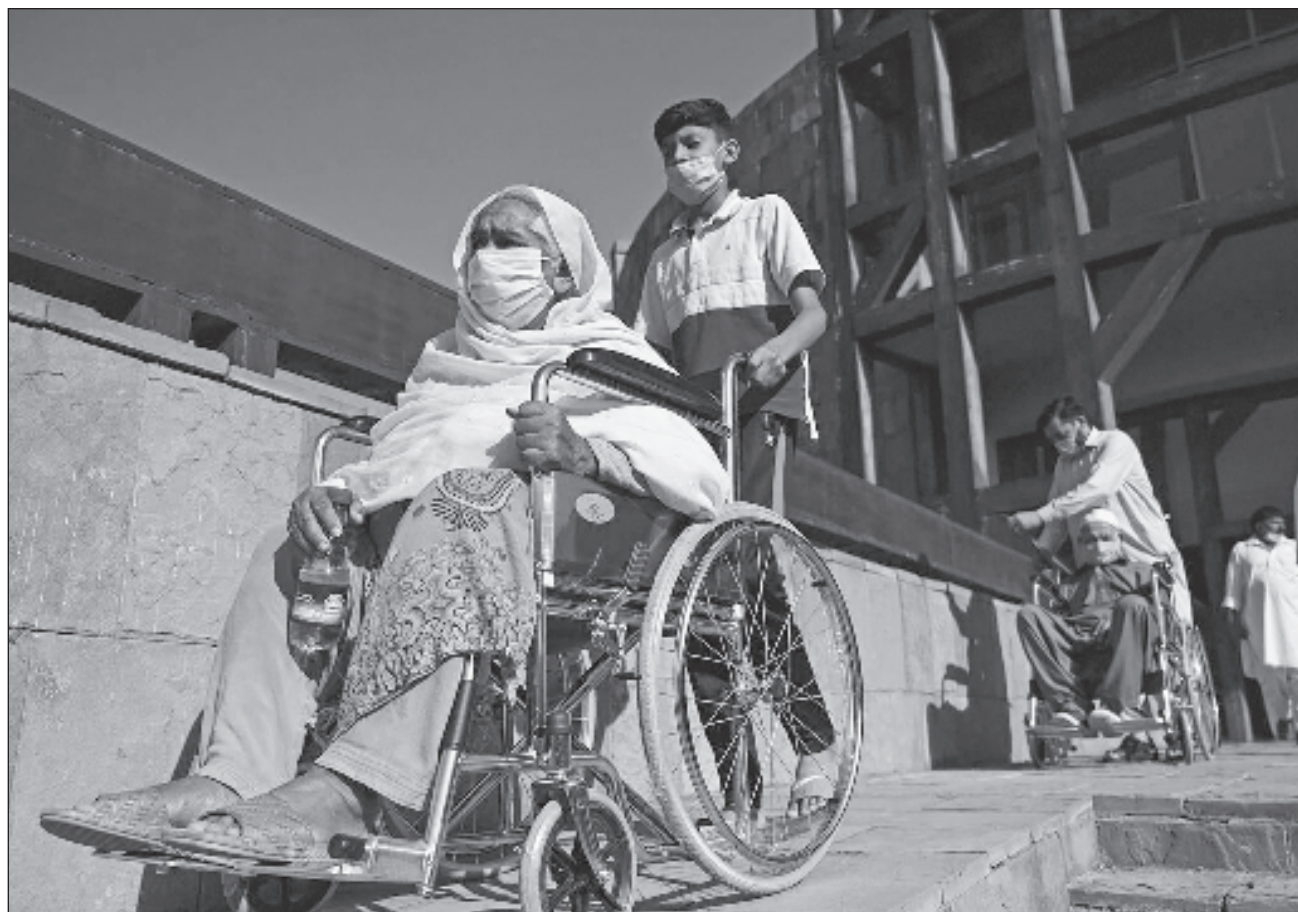
▲ La vacuna de CanSino Biologics es más fácil de almacenar y se administrará por vía nasal a través de un aerosol.

Desde 2020, China ha aprobado ocho vacunas contra el Covid-19 desarrolladas localmente pero aún no ha permitido que se utilicen vacunas extranjeras en su territorio.