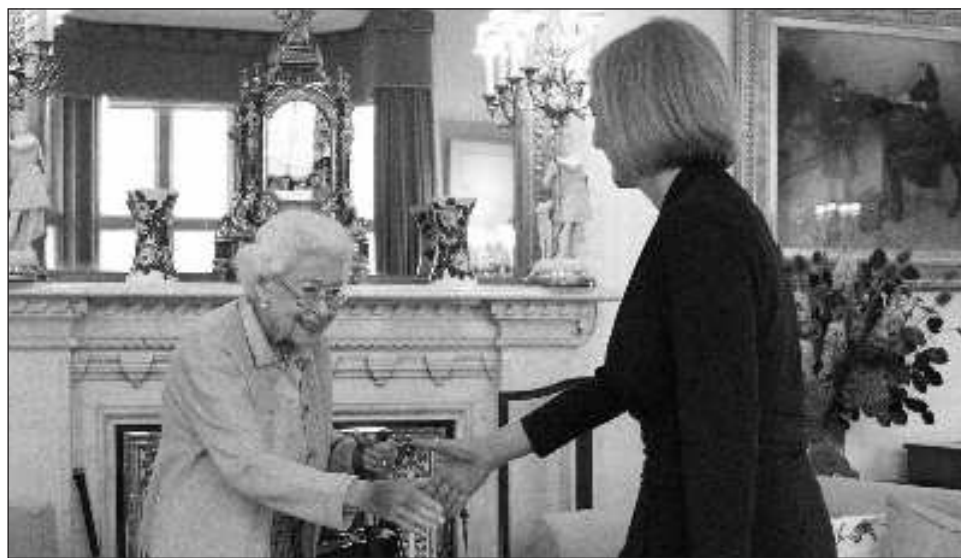
▲ Liz Truss es la tercera mujer en encabezar el Ejecutivo británico, tras Margaret Thatcher y Theresa May; el encuentro protocolario con Isabel II duró apenas media hora.

El martes viajó a la residencia escocesa de Isabel II en Balmoral, donde, en un encuentro protocolario de apenas media hora, la reina y jefa de Estado le en-