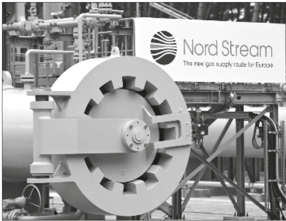
▲ Siemens Energy alega que la fuga de aceite que reportó la rusa Gazprom no afecta el funcionamiento de las turbinas y tampoco es razón para cerrar el gasoducto.

Siemens Energy, con sede en Múnich, Alemania, dijo el martes que no comprendía la presentación de la situación por parte de Gazprom.