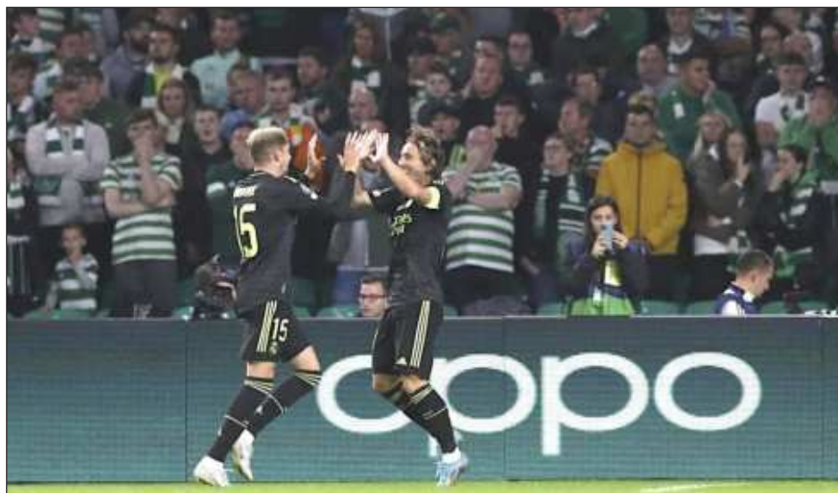
▲ Luka Modric (derecha), del Real Madrid, festeja con su compañero Federico Valverde, durante el partido de la Liga de Campeones ante el Celtic Glasgow.

Aun así, los tantos de Vinícius Júnior, Luka Mo-