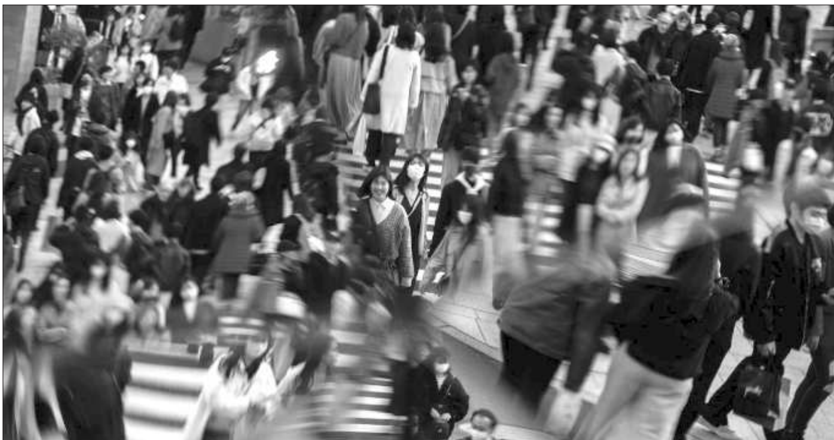
▲ El objetivo de las jornadas Compartiendo Esperanza fue informar acerca de las instituciones que trabajan con el suicidio.