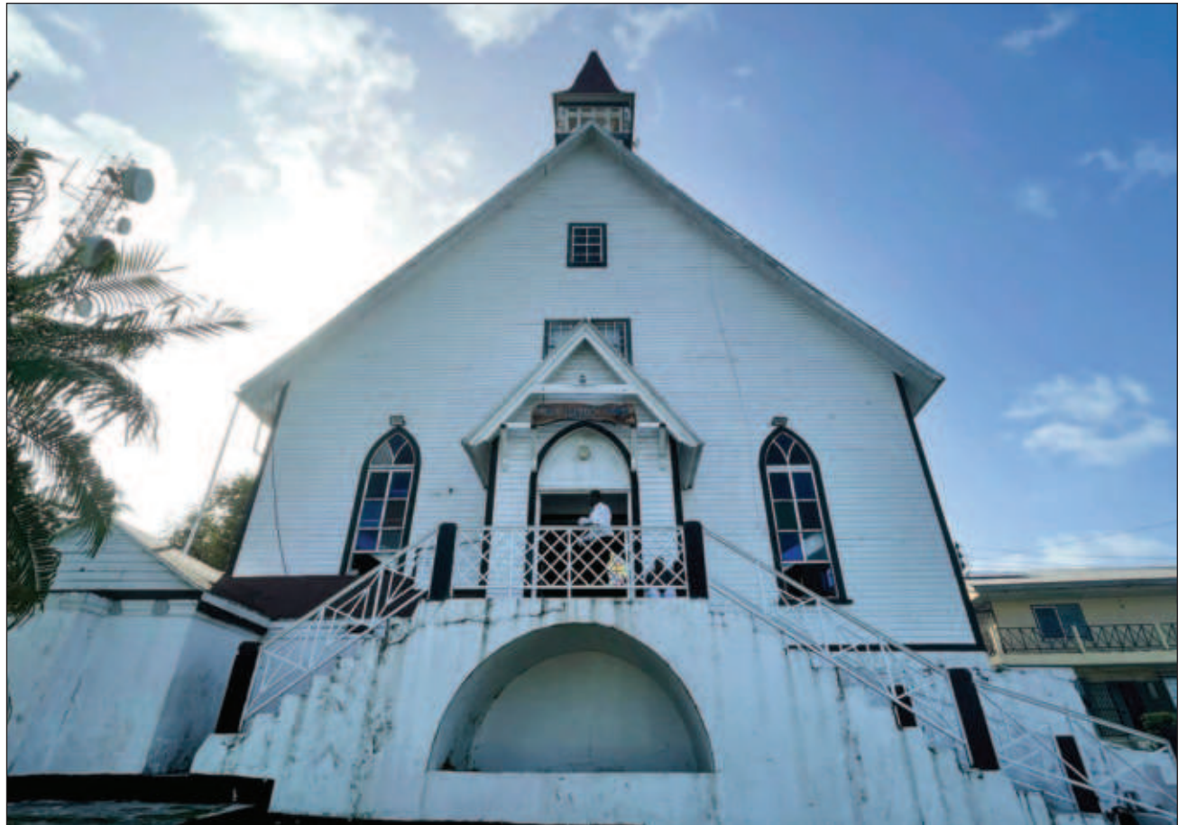
▲ La iglesia es crucial en la historia de esta isla colombiana, y la institución social más importante del archipiélago.

“Es como dice Marcus Garvey”, aludiendo a un nacionalista jamaicano de principios del siglo XX. “Un pueblo que no conoce su historia, su origen y su cultura, es como un árbol sin raíces. Esta iglesia ha sido un pilar” de la comunidad.