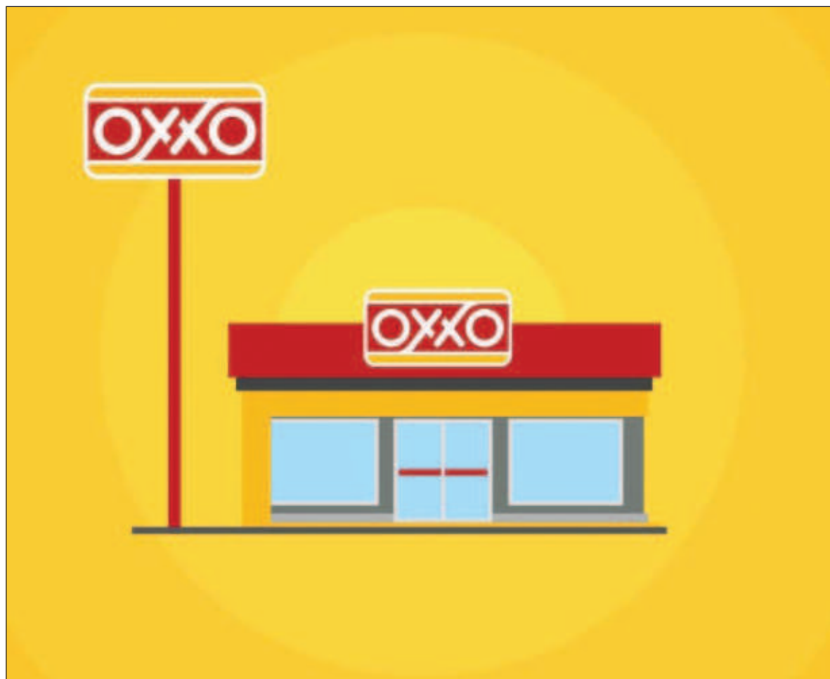
▲ “El riesgo de que echen atrás la figura de la PPO es que se instale una cadena de Oxxos de la Justicia en los juzgados y los tribunales, en los que la mercancía serían los autos de libertad que dicten los jueces”.

SI HAY CERTEZA jurídica y un entorno de confianza, la iniciativa privada agrupada en la Coparmex y la Caintra invertiría 20 por ciento del producto interno bruto (PIB) del país, lo cual sería un motor de “la débil” economía mexicana. ¿Cumplirían? El 20 por ciento del PIB representa una cifra mayor a 250 mil millones de dólares. En primer lugar, es dudoso que los tengan disponibles. En segundo, una inversión de ese tamaño intoxicaría la débil economía y provocaría mayor inflación. En tercer sitio, ¿certeza jurídica y confianza según quién? ¿Iberdrola y empresas que han llevado a México a un panel del T-MEC? Lo que quieren, también lo manifiestan, es que del presupuesto federal salgan más contratos para sus agremiados, no sólo para las obras principales del gobierno federal.