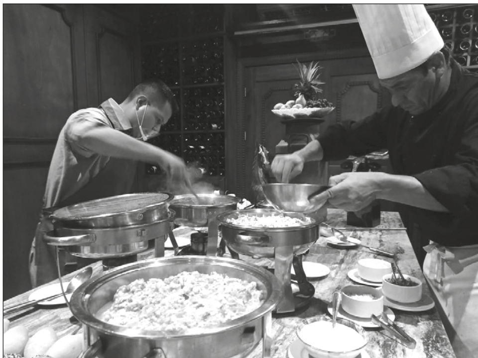
▲ En la entidad hay 7 mil establecimientos de alimentos y bebidas, sin tomar en cuenta a los centros de hospedaje que también suman con la oferta gastronómica.

Un segundo punto son las cadenas de valor para fomentar el tema de caminos a la cosecha, generar un programa de factoraje como que la piña se vaya a Ciudad de México y de allí regrese, aunado a un programa educativo, para que todo tenga una base y enseñanza básica.