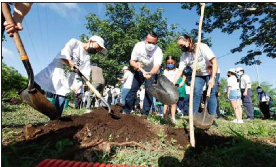
▲ Programas como Cruzada Forestal, Adopta un Árbol y Arbolízate se busca que la ciudad de Mérida y las comisarías municipales sean cada vez más arboladas.

Finalmente quienes quieran sumarse a estas acciones para mitigar el cambio climático y contribuir con el crecimiento de la infraestructura verde, pueden seguir las redes oficiales del municipio para las próximas campañas y sedes donde se realizarán.