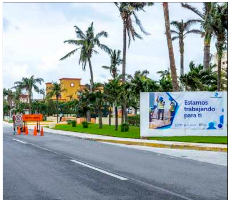
▲ Las labores, que consisten en la renovación de colectores, dieron inicio el pasado lunes 29 de agosto en el kilómetro 20.5.

Con estas acciones la concesionaria busca incrementar la calidad en el servicio así como la solución integral y eficiente del sistema de recolección de agua residual, garantizando así el correcto funcionamiento de la red sanitaria.