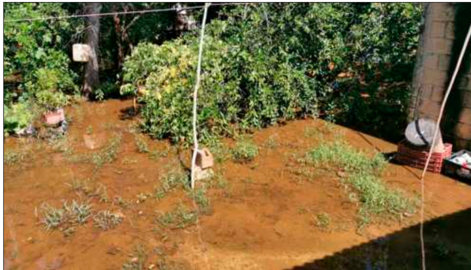
▲ Hobomó fue creado durante el gobierno de Carlos Sansores, y los pobladores reclaman que hoy que su hija encabeza el Ejecutivo de Campeche se les tiene en el olvido.

Desde que se intensificaron las lluvias comenzaron los problemas para los