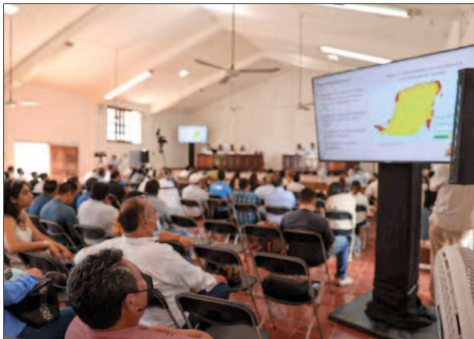
▲ La Manifestación de Impacto Ambiental Modalidad Regional para el tramo 6, elaborada por la UNAM, fue presentada este martes en el ejido X-Hazil de Felipe Carrillo Puerto.

Durante la exposición a ejidatarios, comuneros y población en general de los municipios de Tulum, Felipe Carrillo Puerto, Bacalar y Othón. P. Blanco, comprendidos en el tramo 6, se explicó que el tren correrá paralelo a la carretera federal 307 Cancún-Chetumal