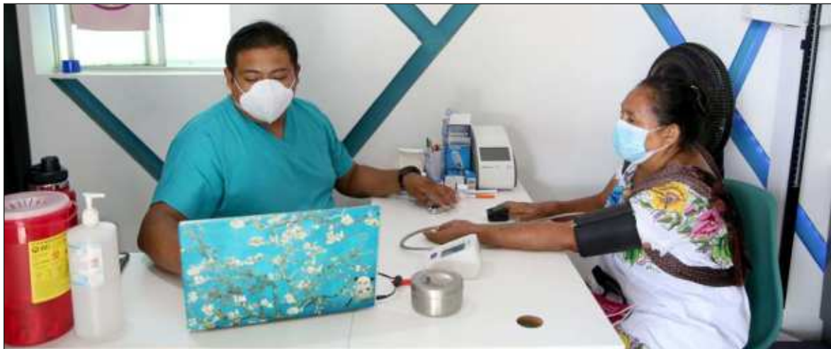
▲ Entre los servicios que ofrece la Ruta de la Salud Kekén está la consulta médica en lengua maya, la medición de glucosa, pruebas para detectar diabetes e hipertensión, así como medicamentos para estos males.

Añadió que acudieron a la Ruta de la Salud porque se enteraron de la atención en su lengua materna y para realizarse gratuitamente la medición de glucosa. Destacó que la unidad cuenta con rampas para