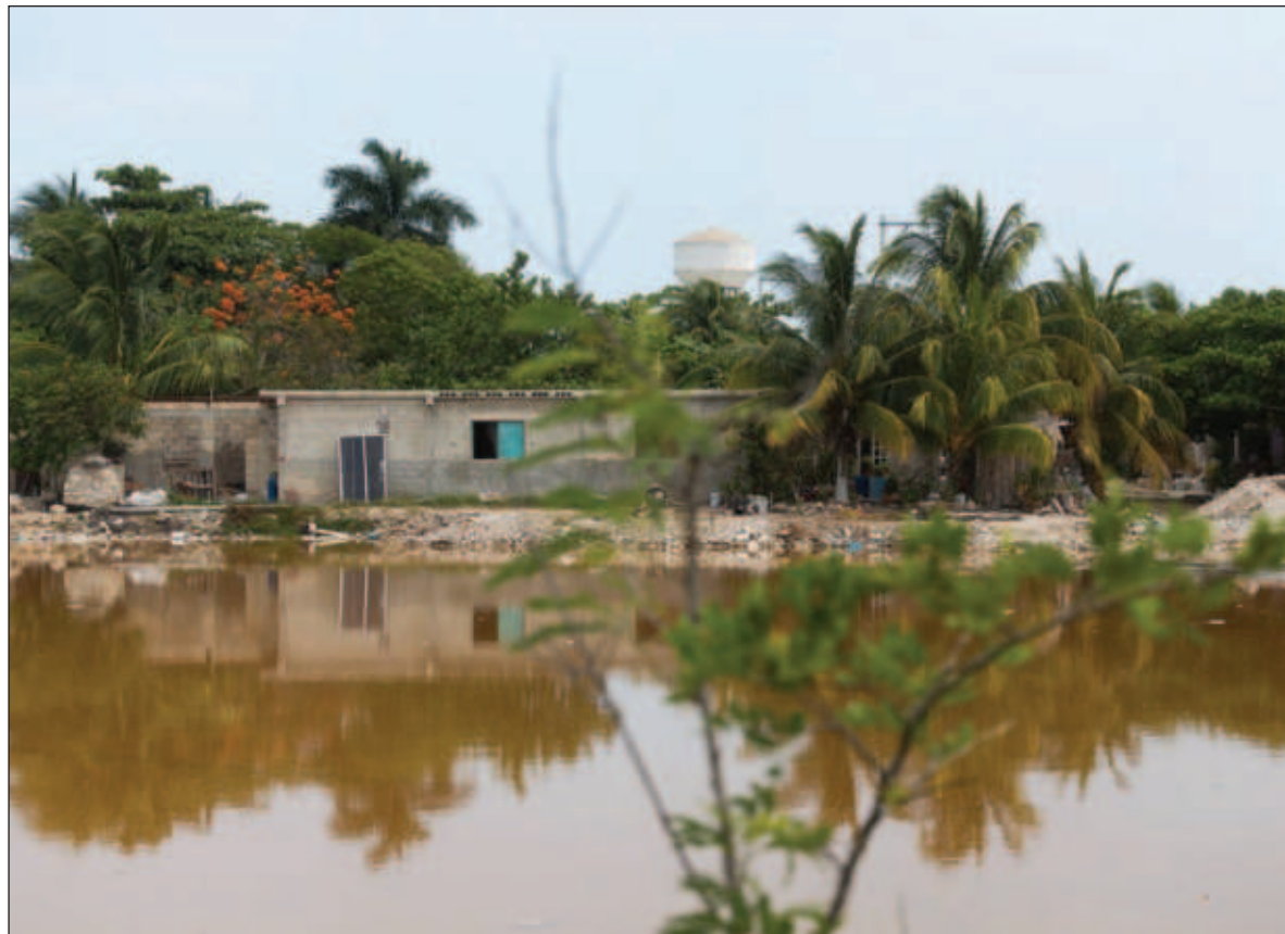
▲ "El agua del mar no se ensucia solita, son las descargas de las aguas residuales urbanas/pecuarias/industriales que al no tener filtrado/tratamiento correcto contaminarán ríos, acuíferos o los mares".

Los organismos filtradores tienen un papel ecológico impor-