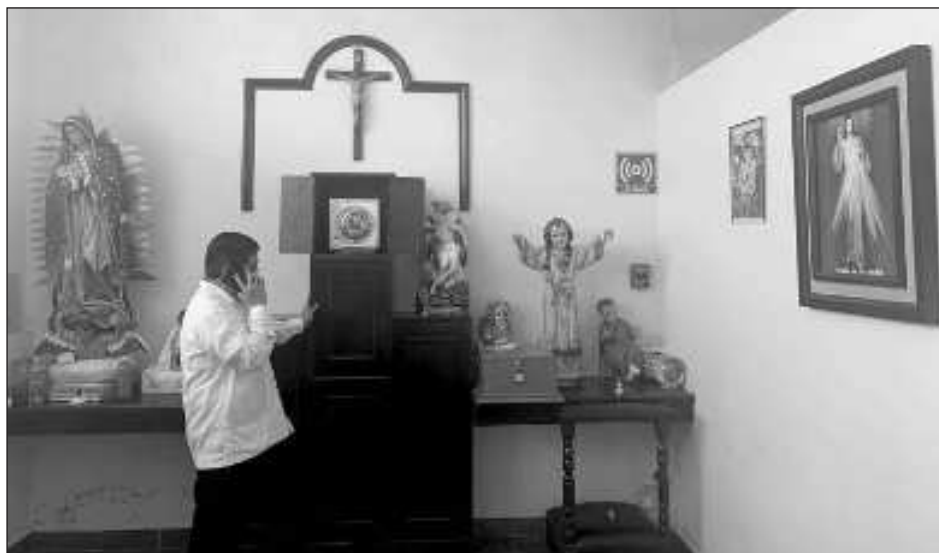
▲ El obispo pidió no politizar temas de religión, pues mencionó que todos tienen derecho a opinar, pero deberían acercarse a quienes saben lo que sucedió para no errar.

El obispo pidió no politizar temas de religión, pues mencionó que todos tienen derecho a opinar, pero deberían acercarse a quienes