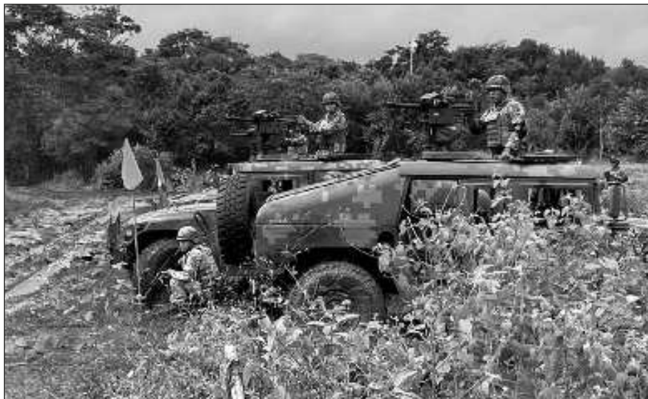
▲ El Presidente acusó que sus adversarios han emprendido una campaña de desprestigio porque hablan de que "vamos a militarizar al país y eso no es cierto. Vamos a seguir defendiendo la Guardia Nacional, como sucede en Francia, Italia, España".

Durante su conferencia, el mandatario insistió en la necesidad de que tanto el Ejército como la Marina son