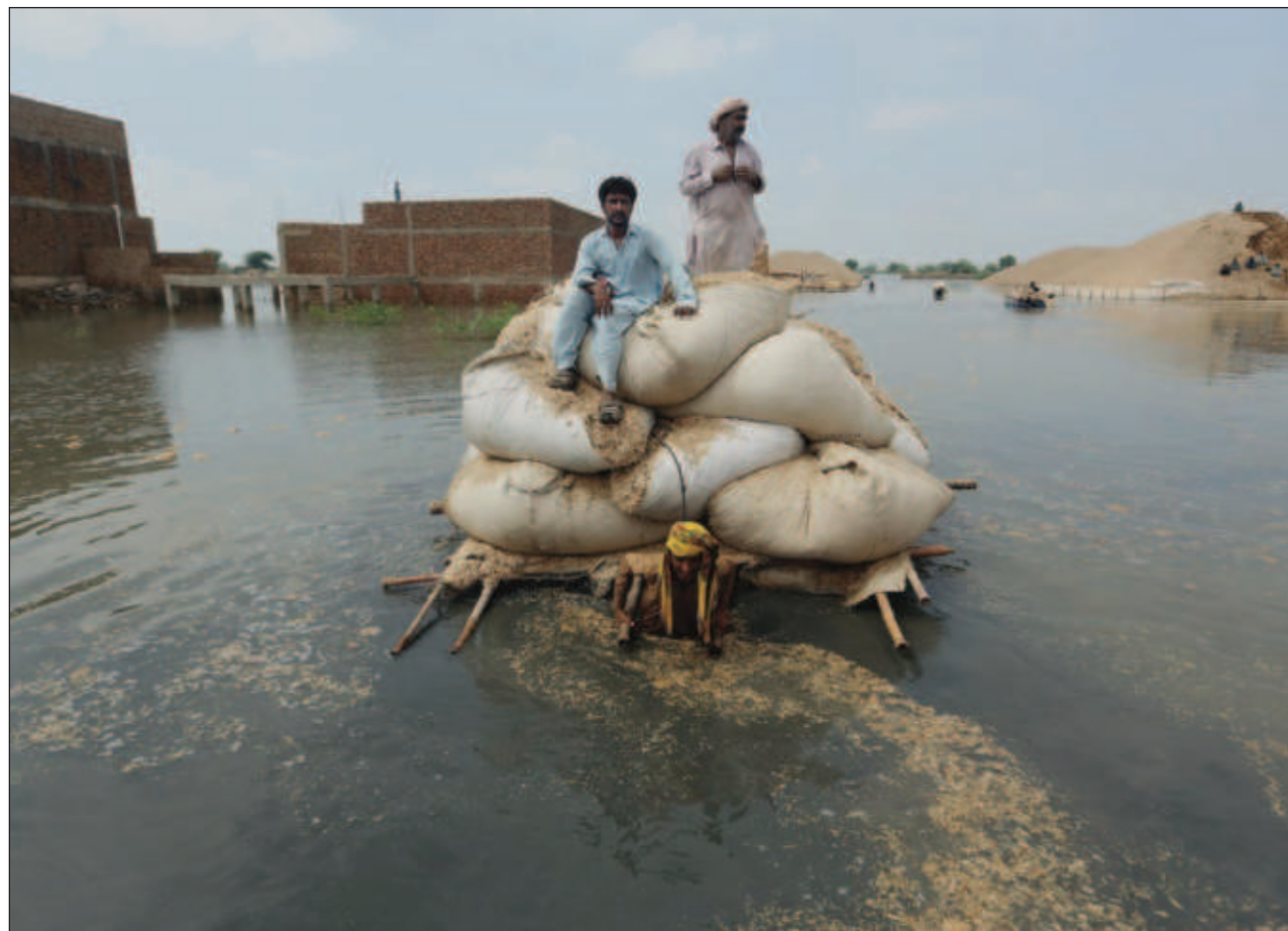
▲ Los intensos aguaceros e inundaciones han devastado gran parte del país, causando al menos mil 325 muertes.

“Varios muros grandes, que fueron construidos hace casi 5 mil años, se han desplomado debido a las llu-