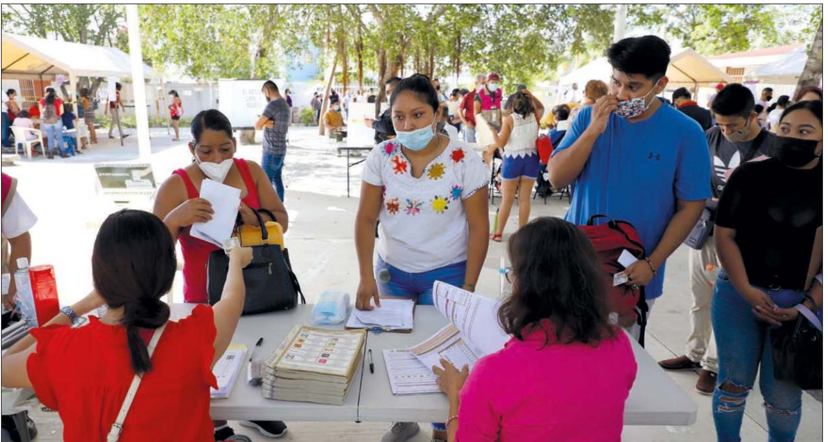
▲ En algunos puntos de Playa del Carmen, la votación fue lenta a lo largo del día.