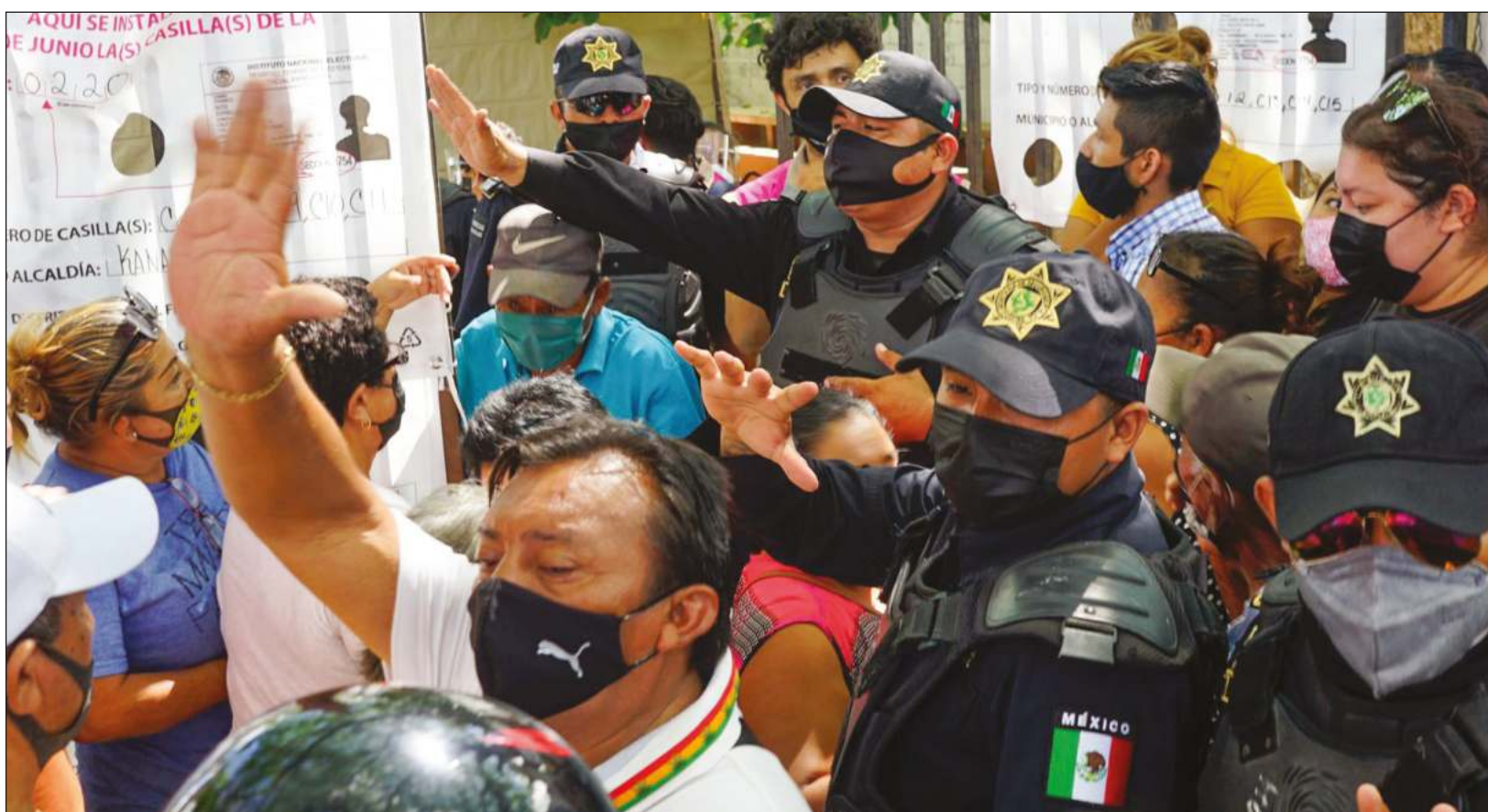
▲ Pese a algunos incidentes de gritos y empujones, la participación ciudadana fue copiosa.