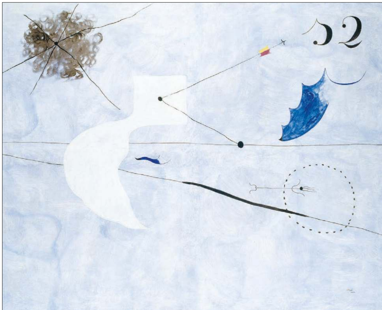
▲ La siesta (julio 1925-septiembre 1925). Óleo sobre lienzo. 113 x 146 cm.

La exposición consta de 17 cuadros, 31 dibujos y nueve libros de poesía