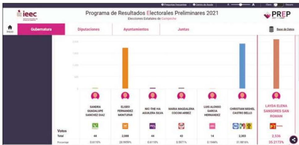
▲ Se espera una elección reñida entre los tres candidatos punteros por la gubernatura.