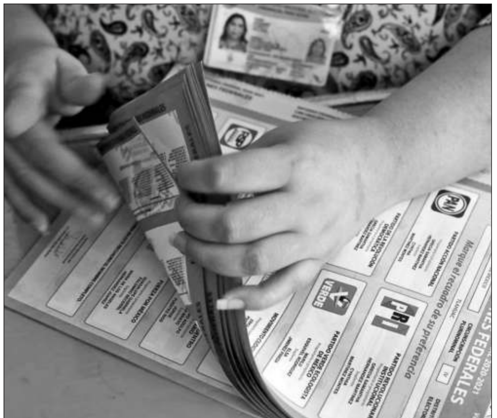
▲ Para esta elección se logró instalar el 99.95 por ciento de las 162 mil 540 casillas programadas para todo el país.