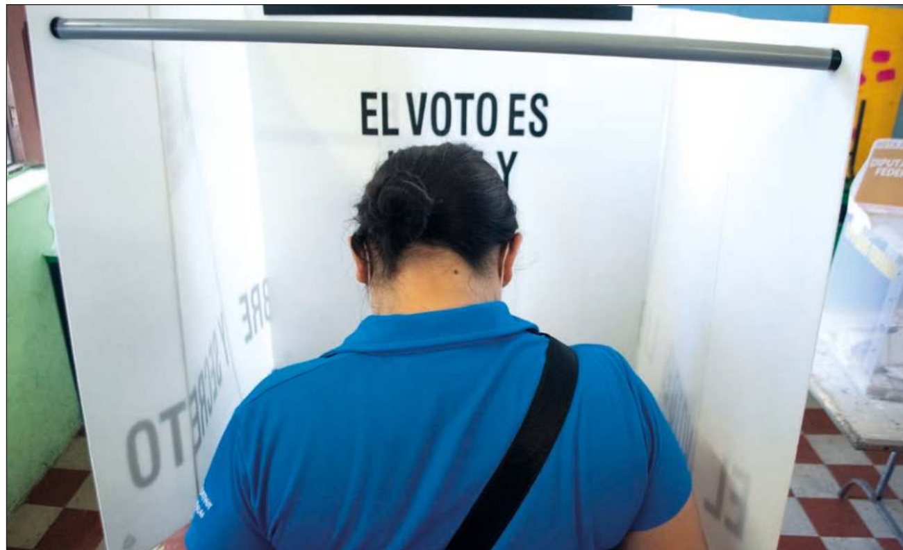
▲ A pesar de las versiones de que hubo más de 50 intervenciones de las fuerzas del orden por conatos de bronca en las casillas, los campechanos participaron en la fiesta electoral.

Al cierre de esta edición no se tenía un reporte en materia de seguridad, relativo a las intervenciones de la Policía