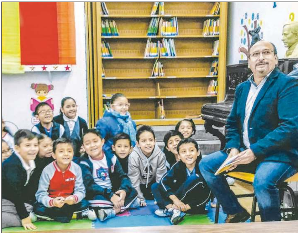
▲ Publicado por Ediciones del Ermitaño, el libro consta de 13 cuentos en los que cada protagonista tiene una edad que avanza de manera cronológica.

-Se sale de la primaria, cambian los amigos, las expectativas; a veces se cambia de colegio, te empiezan a inquietar las niñas. Se tiene la vida por delante, se sientan las bases de la personalidad, se puede ser feliz cada día. A los 13 años se atraviesa el portal de la inocencia, y lo que sigue a partir de entonces es la vida. Antes de los 13 la existencia puede ser el paraíso, o por lo menos la travesura, el juego, la risa desbordada, y si no lo es, los adultos tendríamos que trabajar para que así fuera para todos los niños. A esa edad el mundo es el universo.