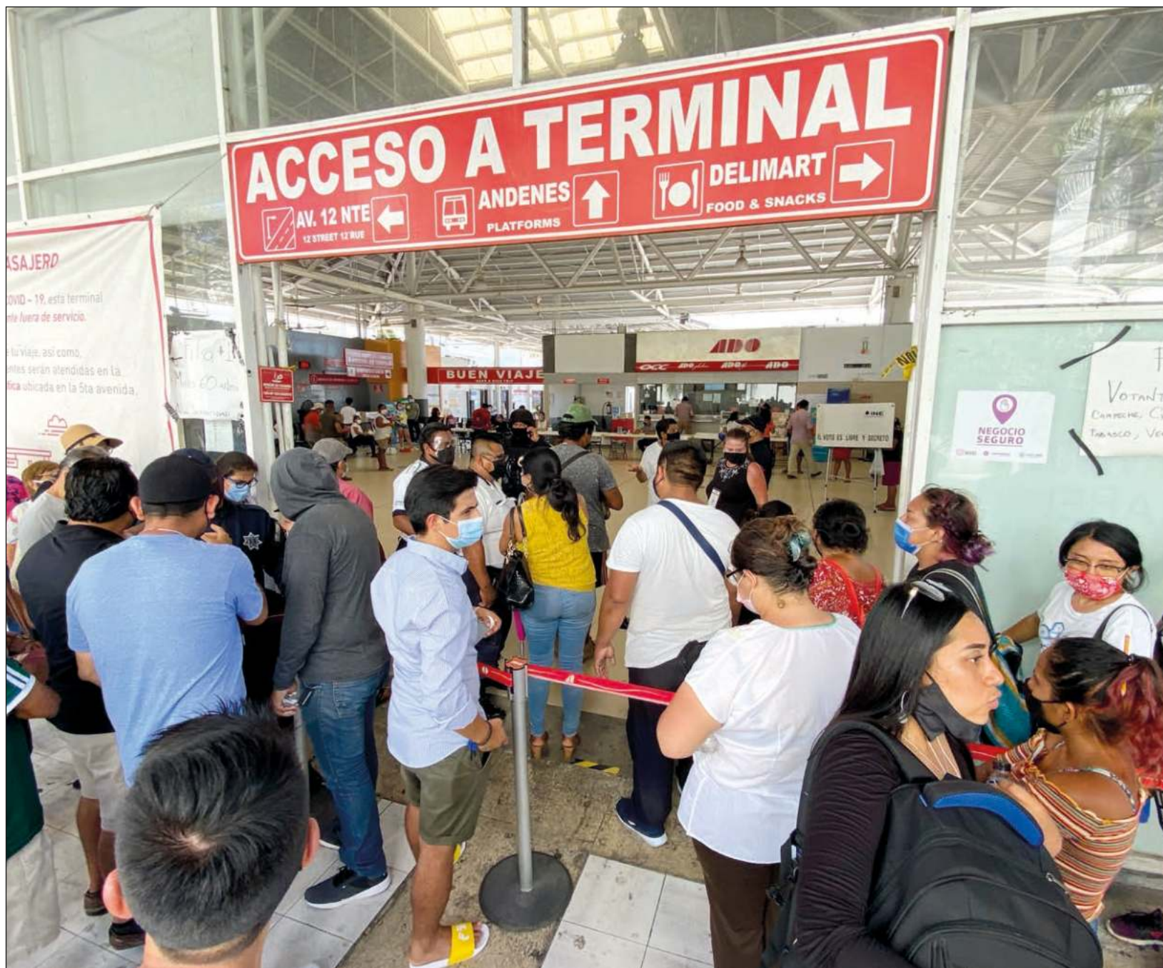
▲ En Playa del Carmen, hubo una gran afluencia en la casilla especial instalada en la terminal foránea de ADO, en la avenida 20, donde las personas olvidaron la sana distancia.