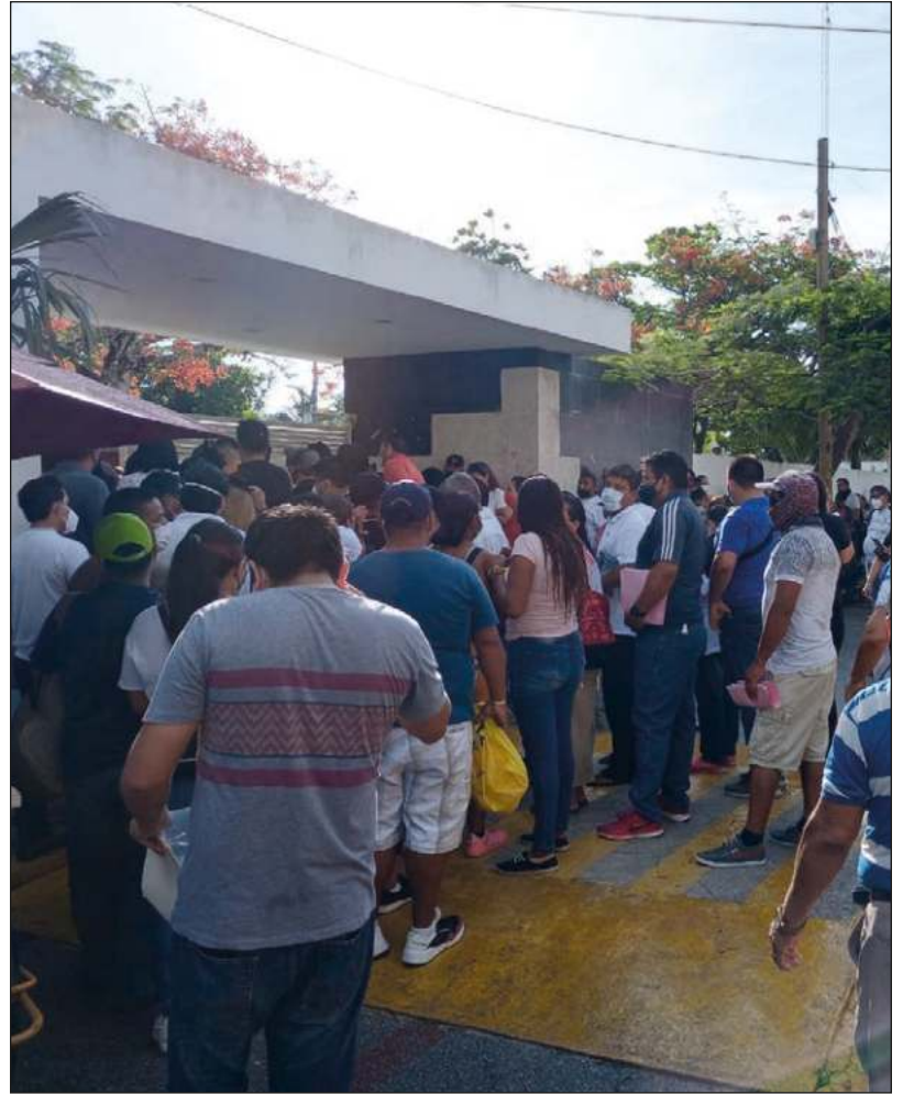
▲ En la mayoría de las casillas, los votantes no respetaron la sana distancia.