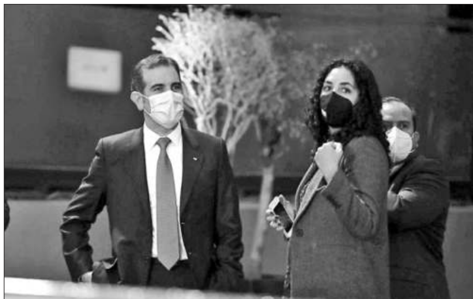
▲ Según indicó el consejero presidente del INE, Lorenzo Córdova, Morena obtuvo entre 34.9 y 49.8 por ciento de la votación para diputados federales.

Por partido, Acción Nacional tiene un rango de curules de entre 106 y 117; el