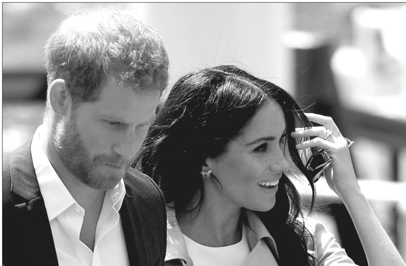
▲ La hija de la pareja fue nombrada en honor a la reina, y a su difunta abuela, la Princesa de Gales.

La pequeña nació el viernes y pesó 3.5 kilos; es el segundo vástago de la pareja