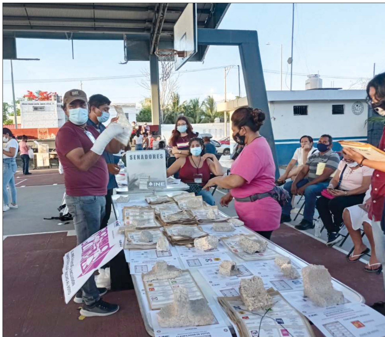
▲ La votación en general estuvo marcada por la inasistencia de muchos funcionarios de casilla. En la imagen, aspecto de la jornada en el municipio de Solidaridad.

En algunas casillas, como en la zona continental de Isla Mujeres, en Rancho Viejo, se registró una fila de más de 700 personas que no podían ejercer su voto ante el retraso de la apertura, lo que originó la llegada de elementos de la policía estatal para el control del orden, pues los ciudadanos violaban las disposiciones sanitarias.