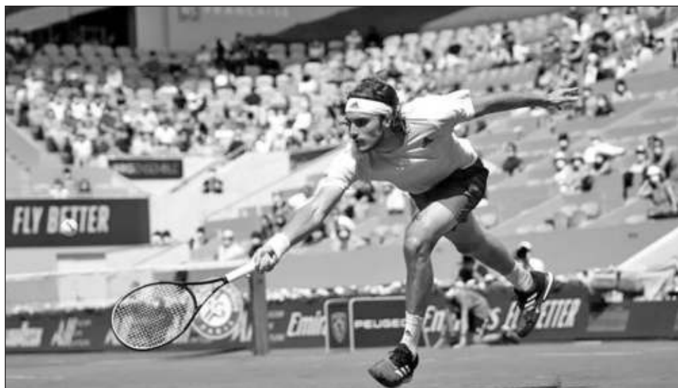
▲ Stefanos Tsitsipas devuelve un saque de Pablo Carreno Busta, en choque de octavos de final.

La derrota de Williams se produjo apenas horas después que Federer tomó la decisión de retirarse del torneo, explicando que necesitaba recuperarse físicamente tras una extenuante victoria en la tercera ronda. Wimbledon — torneo que Federer ha conquistado en ocho ocasiones y Williams siete — arranca el 28 próximo.