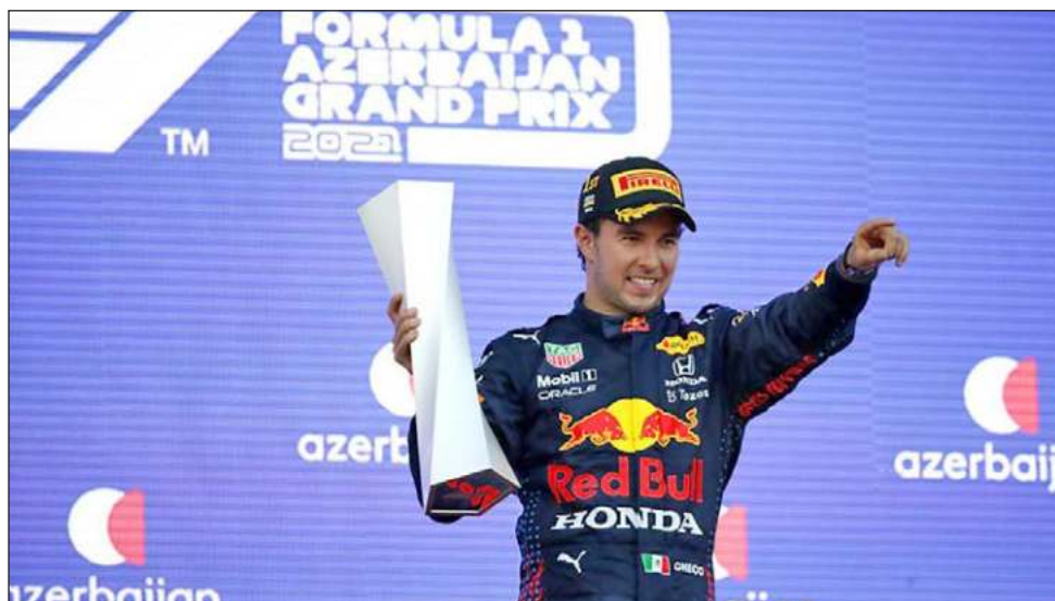
▲ Sergio Pérez celebra en el podio su victoria en el Gran Premio de Azerbaiyán.

Verstappen se encontraba a cuatro vueltas de llevarse su tercera victoria del campeonato. Pero su Red Bull embistió fuertemente la barrera con un pinchazo