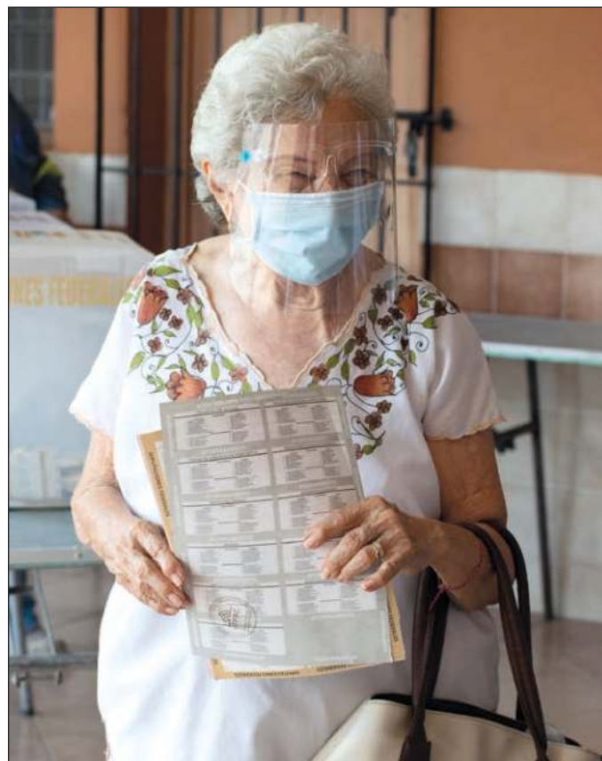
▲ A los ciudadanos les interesa participar en el rumbo del país, sin necesidad de campañas rupestres que se lo digan.

Las campañas necesitan evolucionar, porque la ciudadanía es distinta y dispone de más canales para informarse y definir su opinión, desde las redes sociales hasta la claridad de que el país está en una coyuntura histórica. Las campañas pre-pandemia ya son cosa, literal, de otro siglo; es tiempo