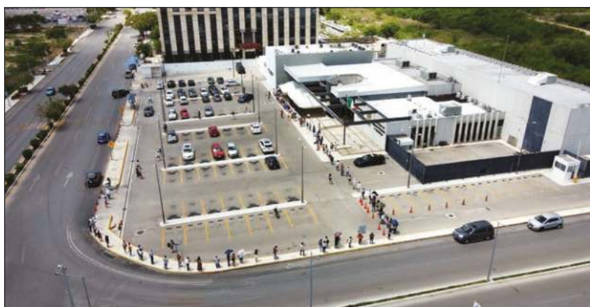
▲ Hubo largas colas en las casillas especiales.