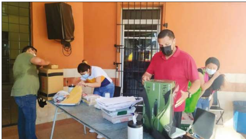
▲ Buena parte de las casillas abrió con retraso.