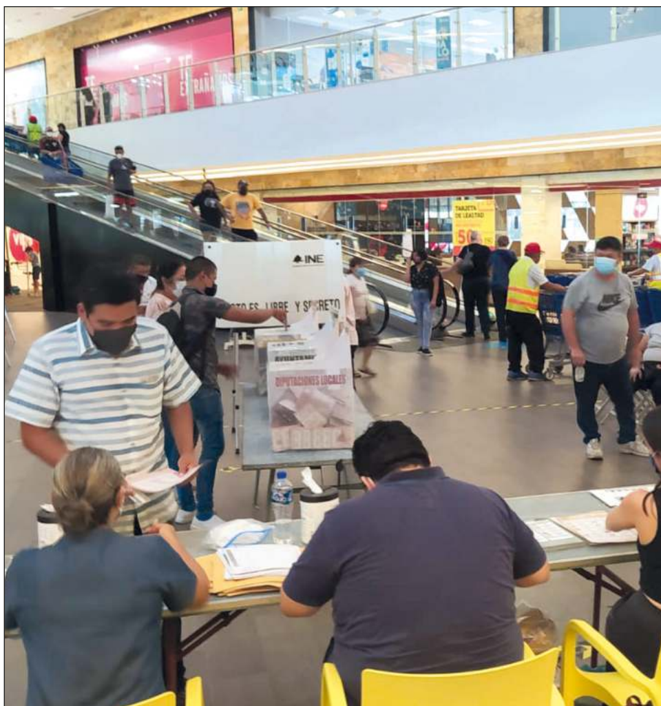
▲ Hubo casillas en lugares como plazas comerciales.