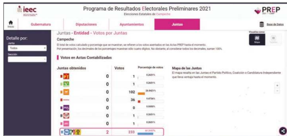
▲ Los candidatos de Morena tienen ventaja en dos distritos federales. Gráficas IIEC/PREP