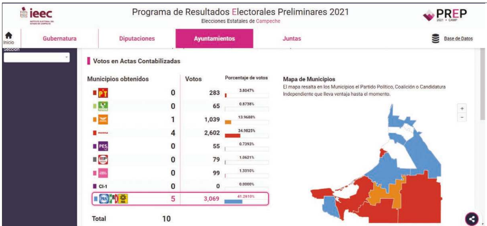
▲ Cerca de la medianoche, el Programa de Resultados Preliminares apenas contaba con poco más del 2% de las actas electorales.