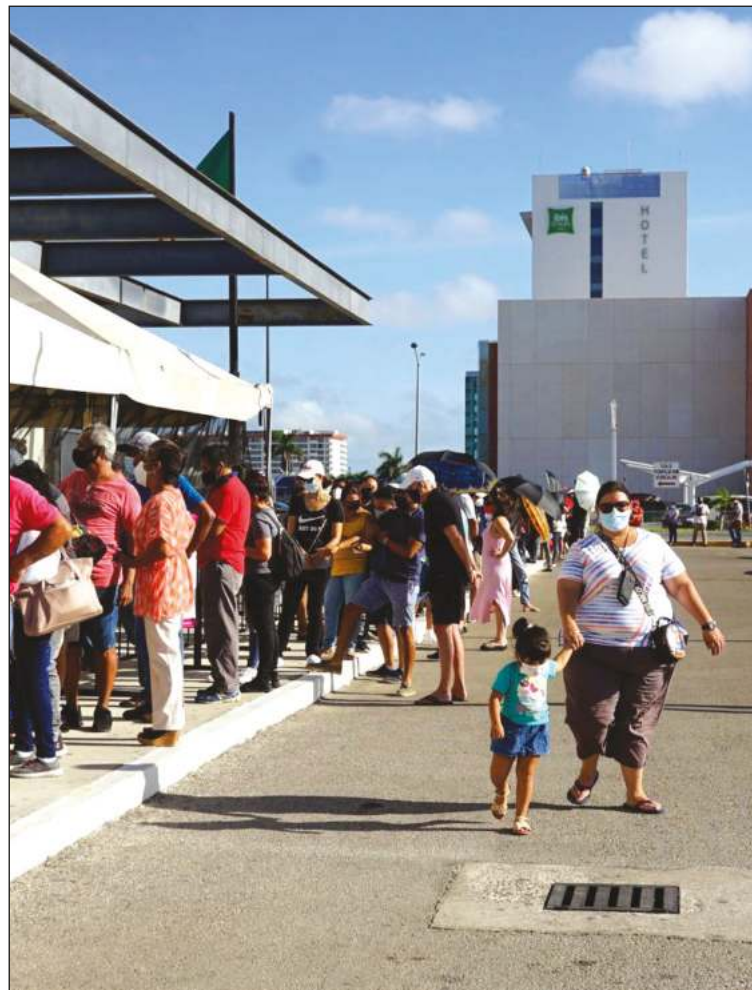
▲ La sana distancia fue tal vez la gran perdedora.