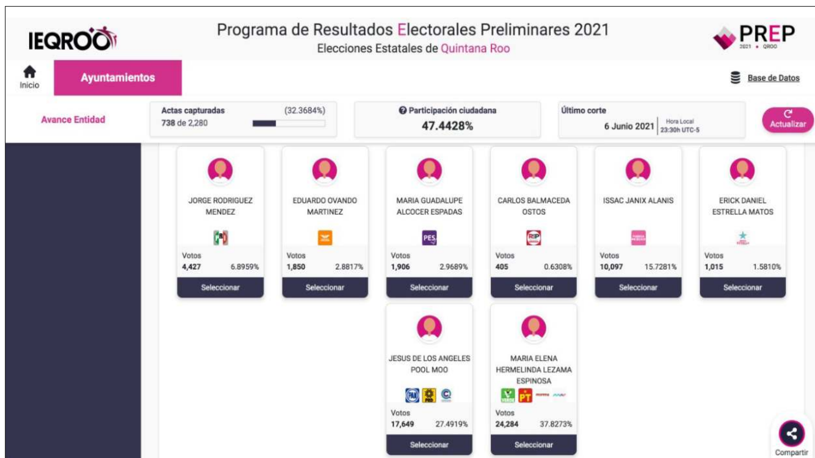
▲ El partido Morena refrendó sus triunfos en Cancún y Chetumal, y se agenció los dos municipios de la zona maya.

Por último, en Puerto Morelos, con el 35.30% de los sufragios contados, Blanca Tziu Muñoz, de Juntos Haremos Historia , aventaja con 44.09%.