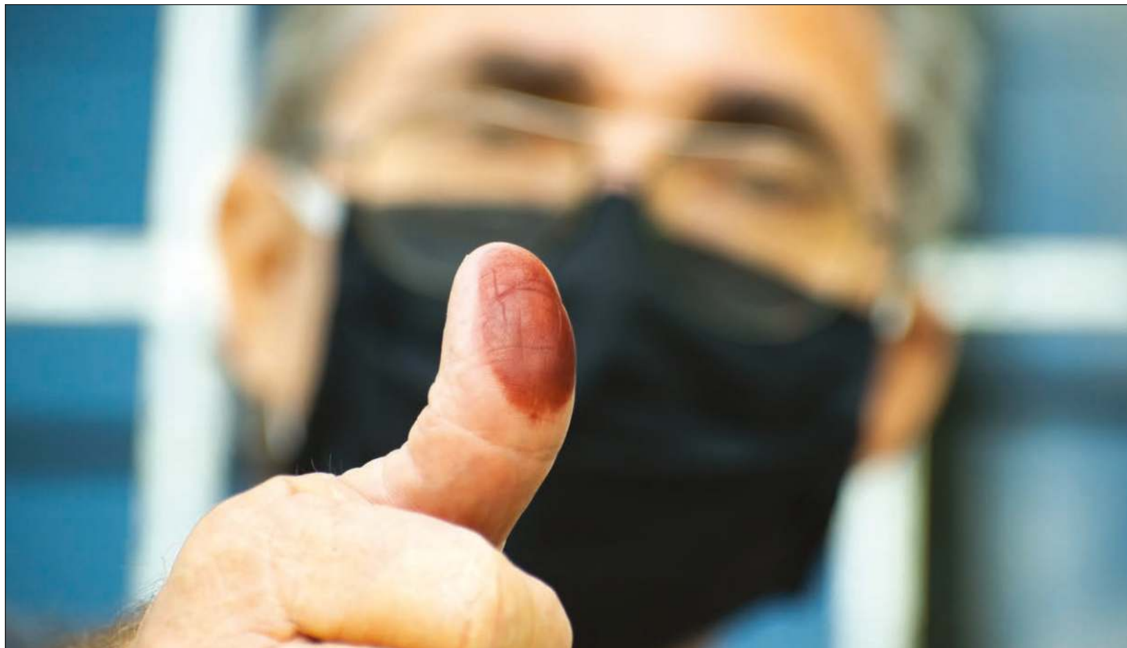
▲ Aunque los ánimos "se calentaron" en algunas casillas, la jornada electoral transcurrió sin incidentes de gravedad en Yucatán.

Por su parte, el candidato del PRI-PRD, Jorge Carlos Ramírez Marín condenó la mala organización de la jornada. En su casilla, en el parque Sanjuanistas, refirió que un importante porcentaje de casillas no se había instalado.