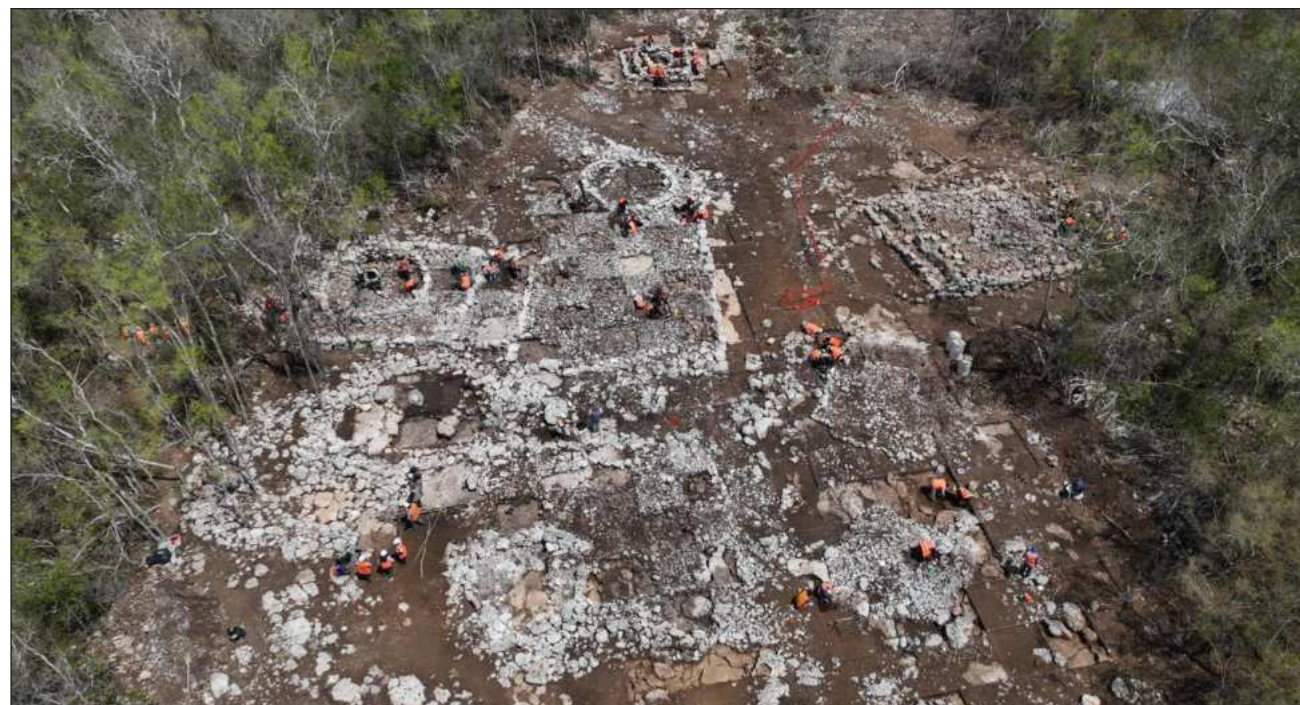
▲ El conjunto doméstico fue explorado por especialistas y personal capacitado durante el acompañamiento que el Instituto Nacional de Antropología e Historia realiza en la construcción del servicio ferroviario de carga del Tren Maya.