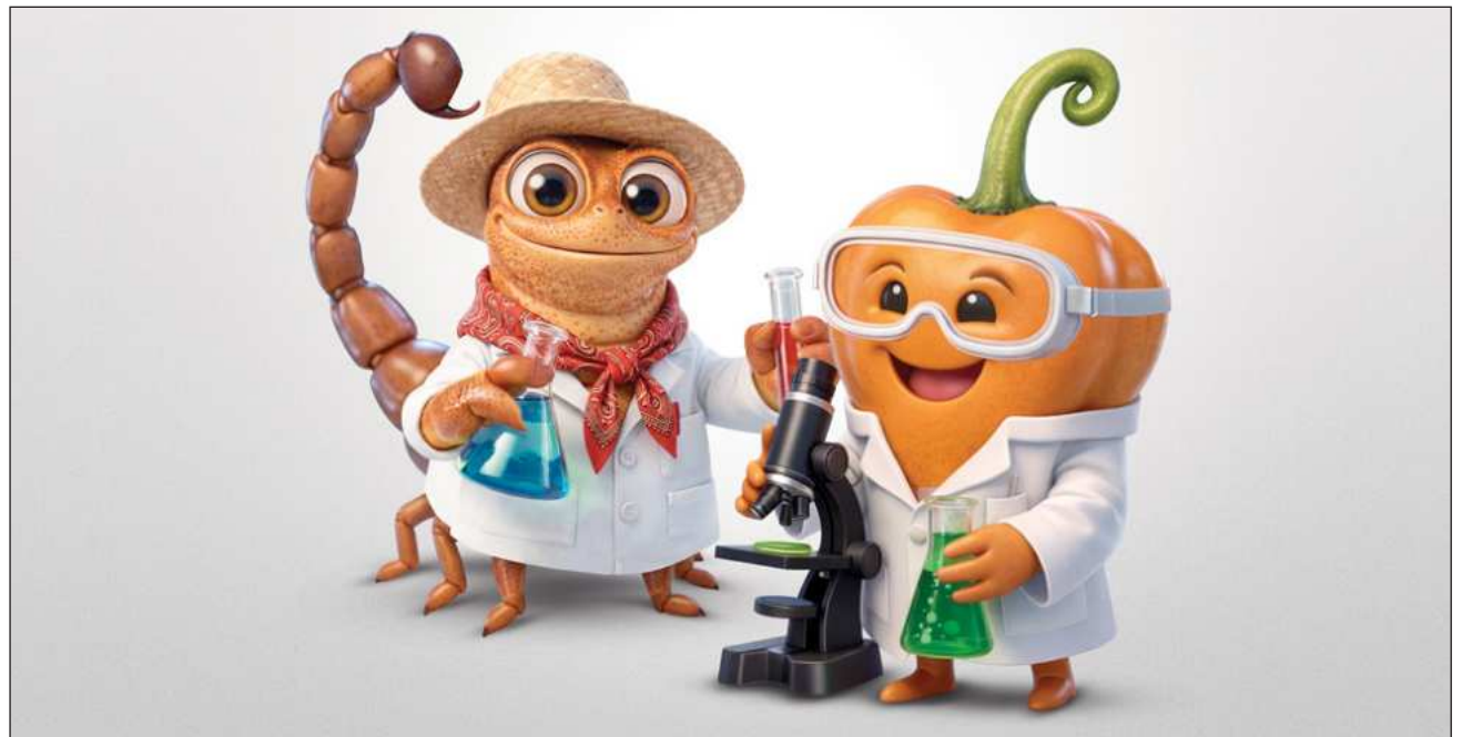
▲ Logran elaborar dos antibióticos eficaces contra tuberculosis, neumonía, septicemia, meningitis, endocarditis y osteomielitis.