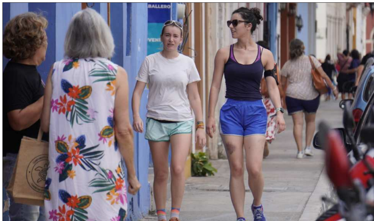
▲ Reprochan que mientras los empresarios hoteleros pagan impuestos, personal de limpieza, administrativo, en algunas ocasiones contable externo y de vigilancia, quienes son socios de la aplicación Airbnb no tienen esta responsabilidad.

Mencionó que mientras los empresarios hoteleros pagan impuestos, personal de limpieza, administrativo, en algunas ocasiones contable externo y de vigilancia, quienes son socios de la aplicación Airbnb no tienen esta responsabilidad.