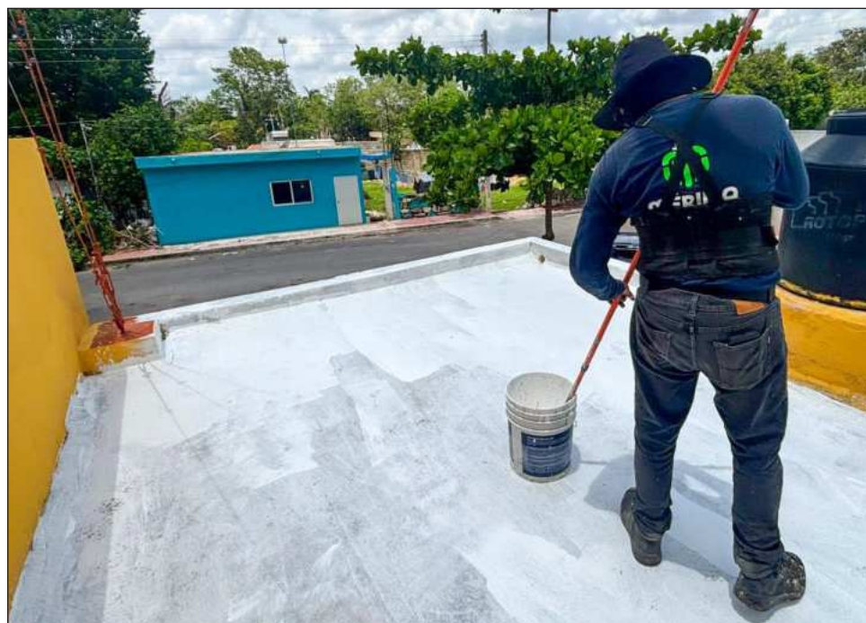
▲ La presidenta municipal Cecilia Patrón especificó que el apoyo incluye la entrega de un bote de 19 litros de material que tiene una duración de cinco años.

Detalló que se entrega un bote de 19 litros de material que tiene una duración de cinco años y para obtenerlo es necesario presentarse en el punto fijo ubicado en la Dirección de Desarrollo So-