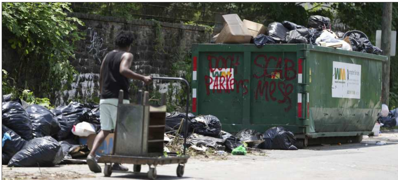
▲ De acuerdo con los datos más recientes (2022), a nivel global se generan 2 mil 600 millones de toneladas de residuos; y alrededor de 30 por ciento no se recogen, lo que agrava los riesgos para las economías locales, la salud pública y el medio ambiente.

De acuerdo con los datos más recientes (2022), a nivel global se generan 2 mil 600 millones de toneladas de residuos; y alrededor del 30 por