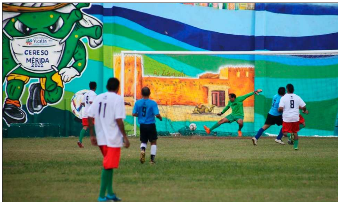
▲ A meses de dar inicio al Mundialito , las y los internos se encuentran preparándose para los encuentros.

Esto quiere decir que participarán en la ceremonia de inauguración, en la creación de la mascota oficial, el diseño de coreogra-