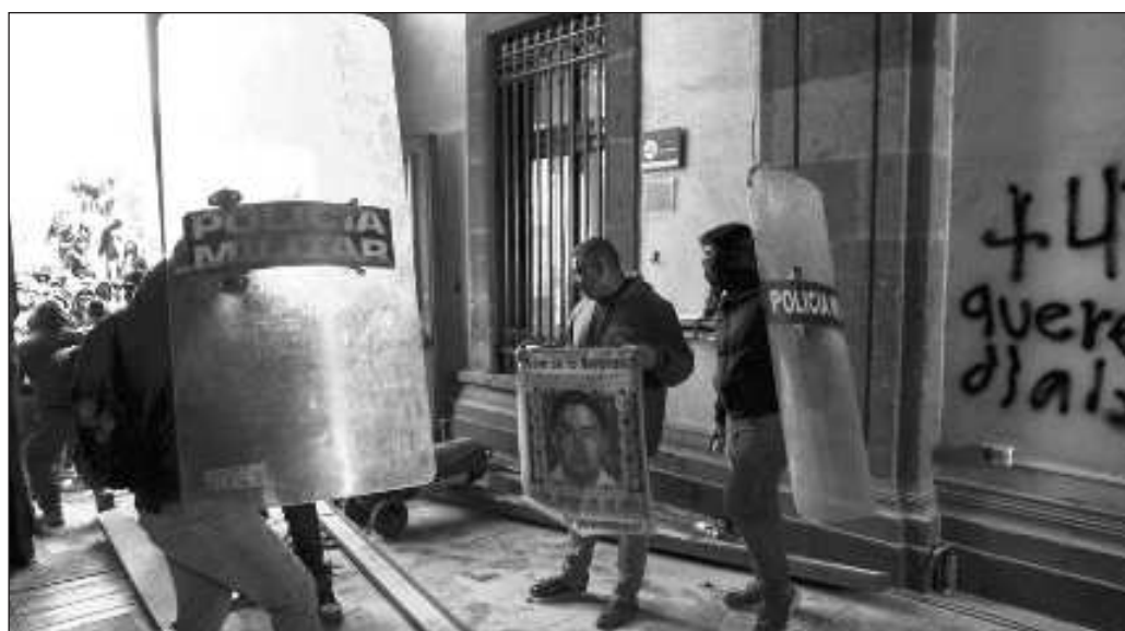
▲ El presidente Andrés Manuel López Obrador manifestó que está dispuesto a reunirse con los padres de familia y estudiantes de Ayotzinapa en 15 días.

Quedan entonces muchos claroscuros antes de llegar a la conclusión tanto del conflicto como de las investigaciones. Pero la clave está en que éstas dejen satisfechas a las víctimas, que son los padres y madres de familia, quienes tampoco han recuperado la totalidad de los restos de sus hijos; la justicia pasa también por saber lo que ocurrió en realidad con cada uno de ellos. En tanto, no habrá explicación que deje satisfecho a nadie y la conclusión se antoja de película, con alguien pronunciando que la neta es chida pero inalcanzable, al menos en este caso.