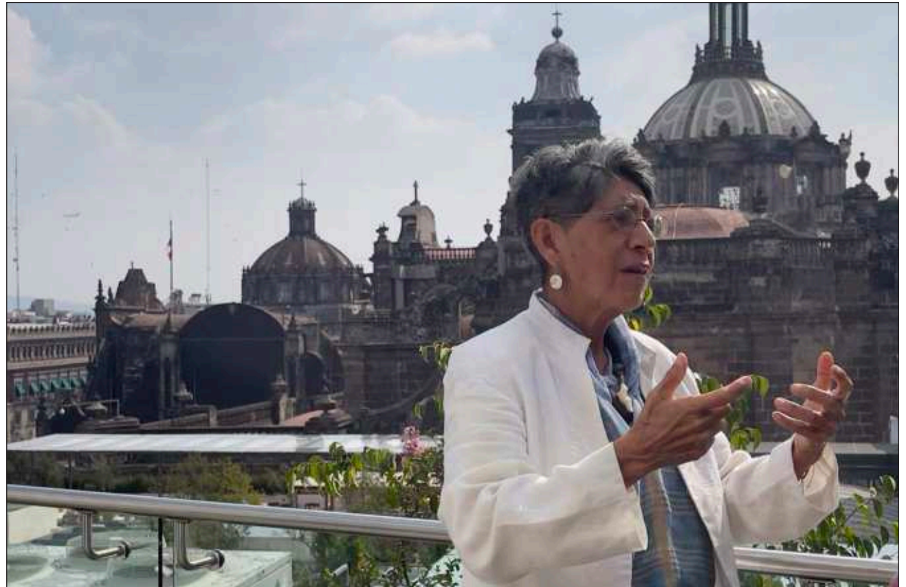
▲ Uno de los objetivos de la también colaboradora de esta casa editorial es la creación del CECI, el Consejo Estatal de Ciencia e Innovación y atender el rezago educativo a través de programas sabatinos de asesorías.

La idea es que los gobiernos estatales recurran, al menos de manera consultiva, al equipo de científicas y científicos que forman parte de la academia para