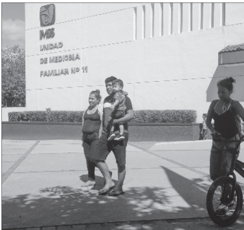
▲ La creación de empleo en los dos primeros meses del año suma 265 mil 424 puestos nuevos, de los cuales 60.5 por ciento corresponde a empleos permanentes.

Yucatán repuntó con 3.9% en la novena posición y Campeche registró 2.9% en el lugar 17