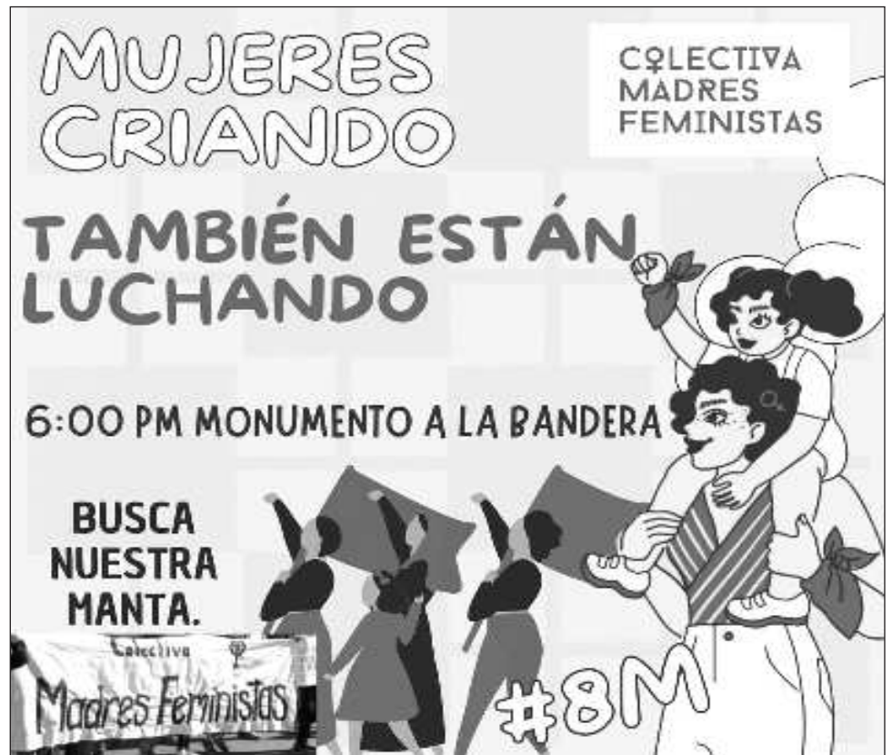
▲ La Colectiva Madres Feministas Yucatán también emitió una convocatoria para que las mujeres criando se unan al contingente de madres e infancias.

La marcha del 8M suele estar acompañada de actividades grupales, artísticas y culturales.