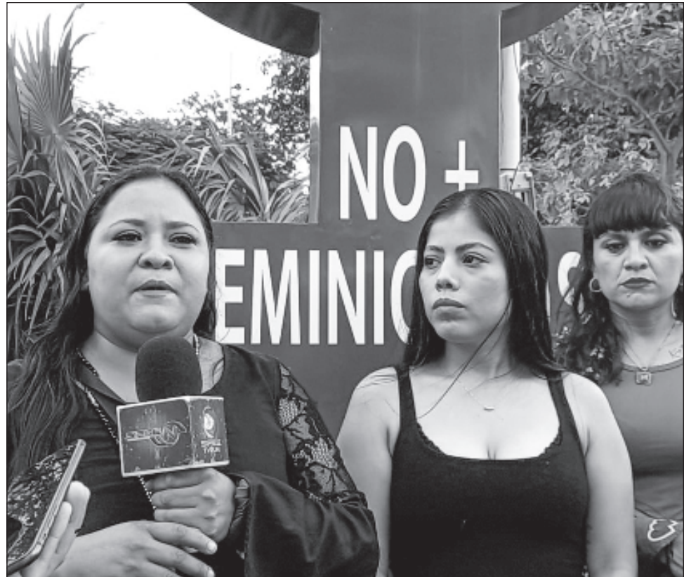
▲ Se trata de una marcha “para todas las mujeres en todas nuestras expresiones” en la que “vamos a salir a gritar una vez más”, señalaron las activistas.