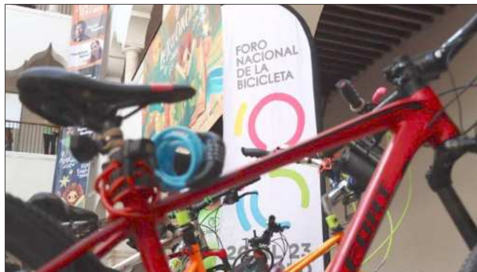
▲ El Foro Nacional de la Bicicleta es un espacio para la discusión e intercambio de ideas, conocimientos y experiencias exitosas en torno a la movilidad sostenible.

Resaltó que tiene como objetivo impulsar una movilidad