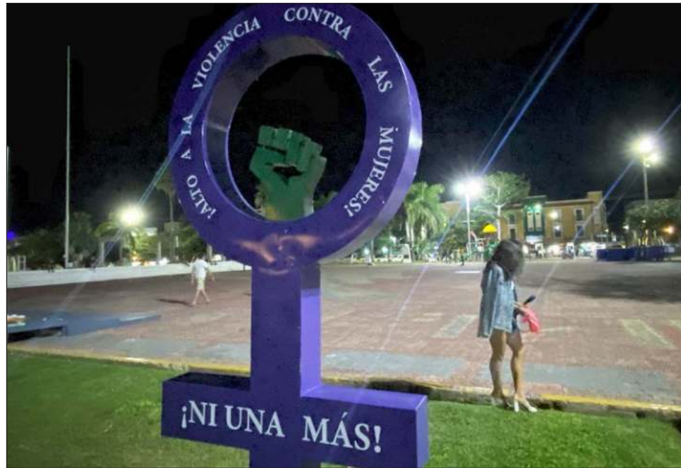
Las activistas resaltaron que “ese símbolo visibiliza todas las violencias, opresiones, discriminaciones, racismo y que la lucha continúa” en las regiones indígenas.

“Le estamos mandando un mensaje al Estado diciéndole que esta anti-monumenta es una visibilización pública de cómo nos ha fallado el sistema, además de una reparación simbólica para las víctimas de feminicidio. Que se ponga en la zona maya, es decir, que las mujeres indígenas hemos