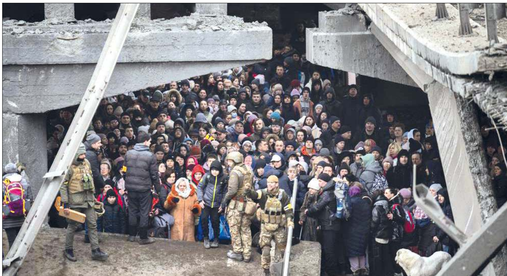
▲ La población civil ucraniana avanza entre los destrozos que dejan los bombardeos, en busca de un lugar seguro. Hallarlo incluye refugiarse en un sótano con extraños, o pasar por distintos puntos de revisión; incluso contemplar los escombros del antiguo lugar de trabajo.