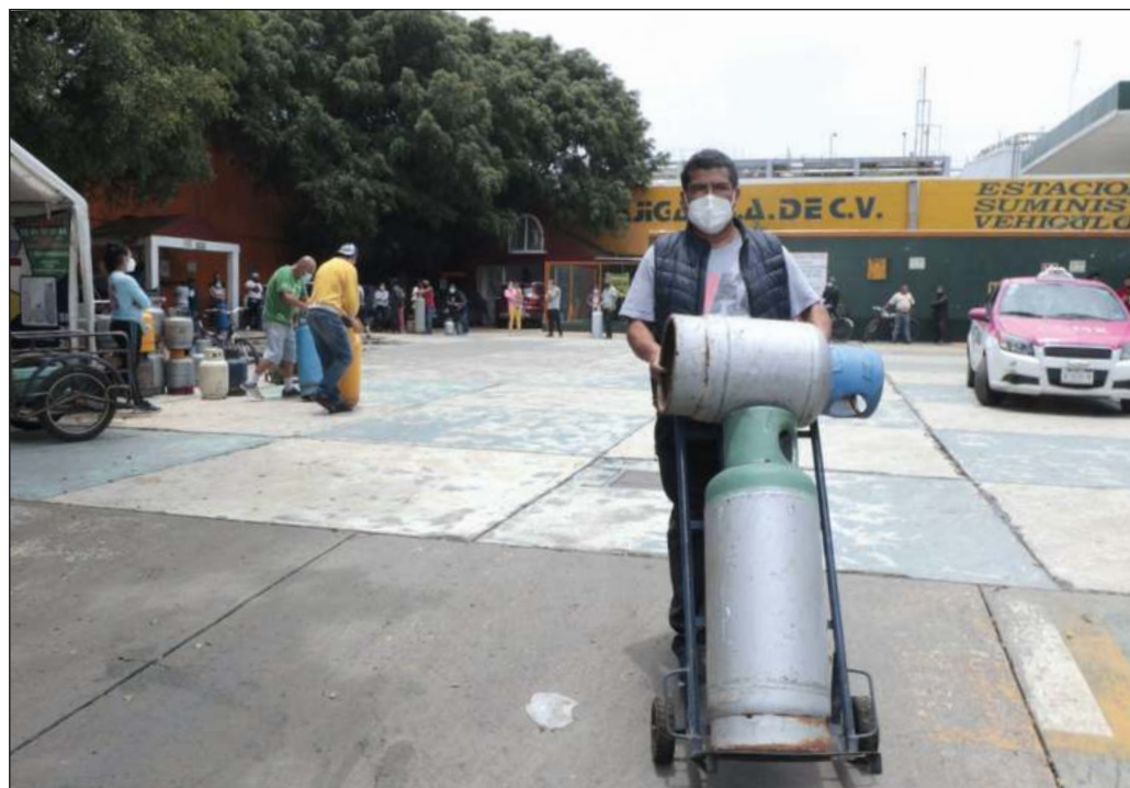
▲ El alza en los precios de energéticos afecta de manera desproporcionada a los sectores más vulnerables de la población.

No puede haber ninguna duda de que la principal razón para poner fin a cualquier guerra es el intolerable costo en vidas y el sufrimiento humano causado por el recurso de las armas para dirimir diferencias o imponer intereses. Si a ello se suman las consecuencias económicas, tanto para los directamente involucrados como para las naciones del todo ajenas al conflicto, sólo queda hacer votos por que la comunidad internacional empuje todas sus capacidades en buscar una salida pronta y pacífica a las hostilidades.