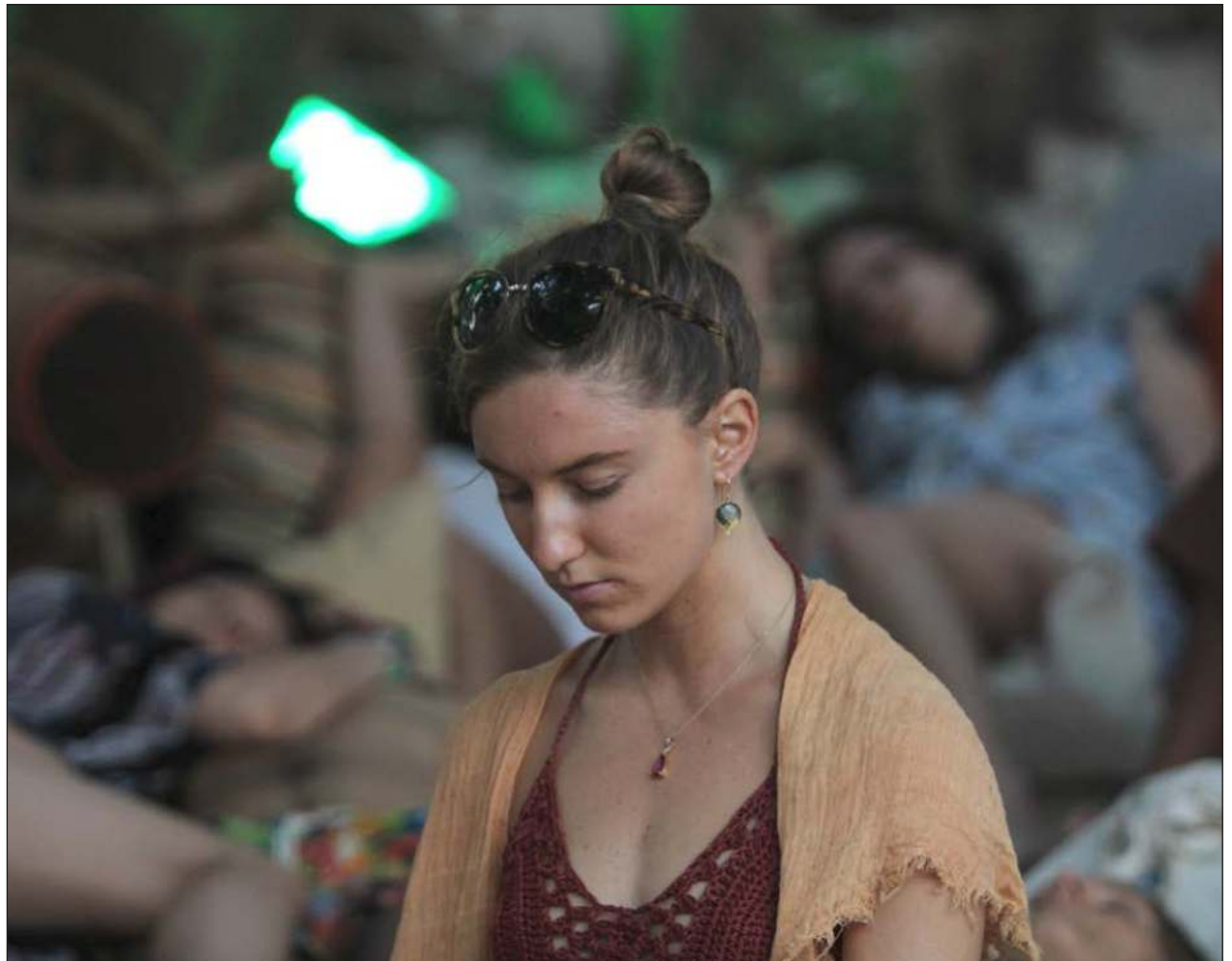
La combinación de la filosofía y técnicas del yoga y la meditación funciona tanto para prevenir agresiones como para sanar las huellas que han dejado algunas del pasado.

Además afirmó que no estará dedicada a la venganza o la competencia, pues su moral va más allá de un lucha de poderes, su función estará basada en el respeto y apegado al derecho de todos los ciudadanos.