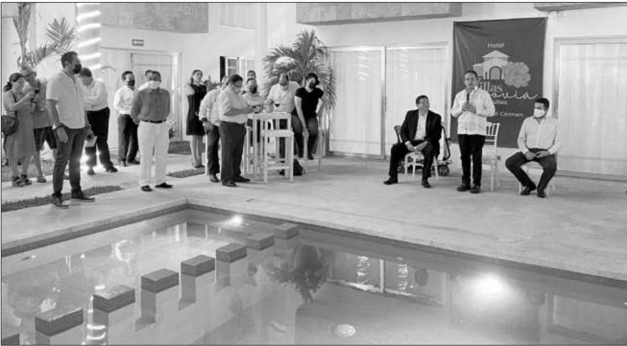
▲ El gobernador Carlos Joaquín asistió a la inauguración del centro de hospedaje y afirmó que este turismo especializado puede convertirse en algo muy importante para el número de visitantes y la recuperación de la economía.