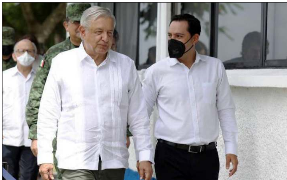
▲ El presidente Andrés Manuel López Obrador y el gobernador Mauricio Vila Dosal supervisaron los avances de la construcción del Tramo 3 del Tren Maya, el cual va de Calkiní, en Campeche, a Izamal.