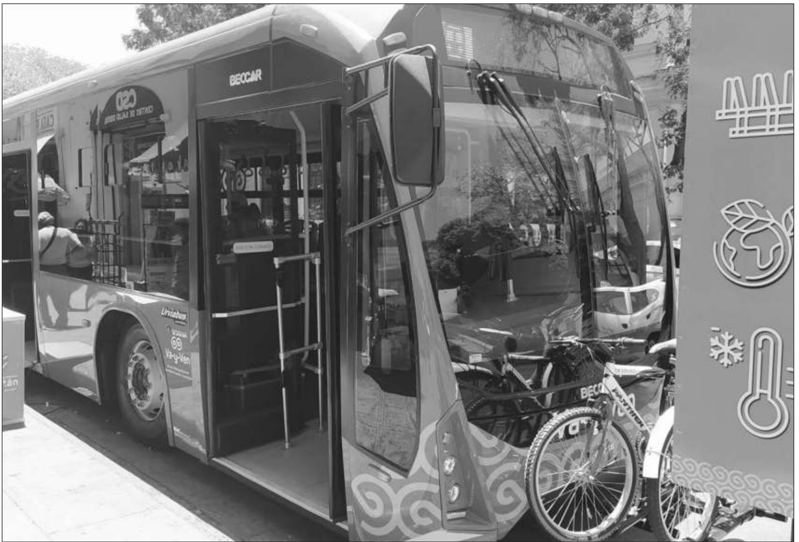
▲ El gobernador Vila Dosal destacó que está en marcha un nuevo Sistema de Transporte Público, el "Va y Ven", que ya opera su primera ruta.