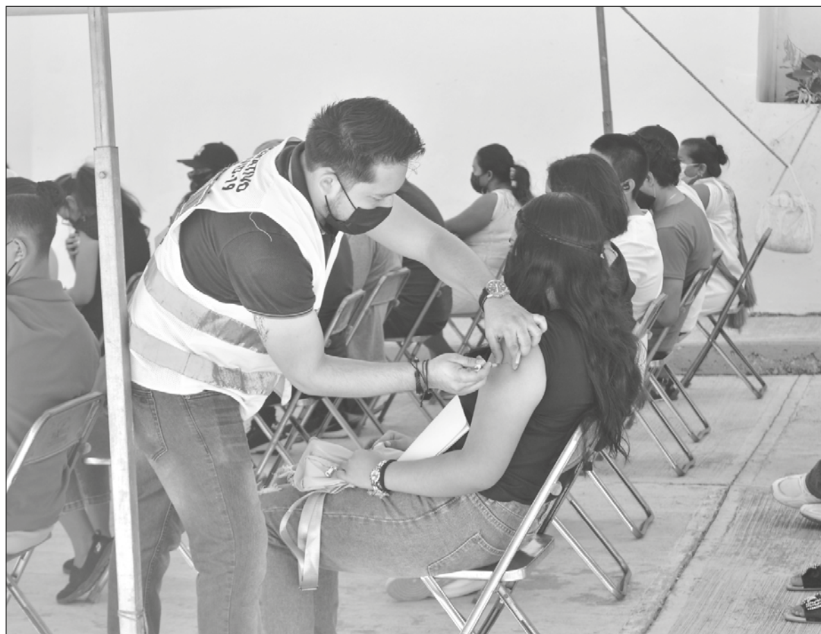
▲ Para la OMS, nos encontramos en pleno proceso de pasar de un escenario de pandemia a uno de endemia.

EN YUCATÁN EL 01 de agosto de 2020 tuvimos uno de esos días llamados “trágicos”, se reportaron 468 nuevos contagios y 16 muertes, ese día se alcanzó una punta al alza en contagios con un rango de decesos del 3.41%; unos meses después, ya con un avance sustantivo en el ejercicio de vacunación se dio un nuevo día puntero