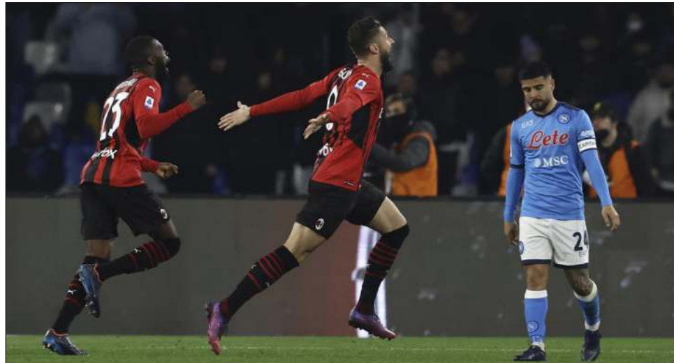
▲ Olivier Giroud le dio tres puntos de oro puro al Milán.

La Juventus se encuentra siete puntos debajo del líder y mantuvo con vida sus pocas es-