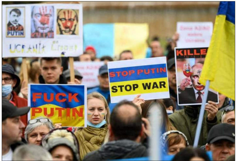
▲ En Barcelona, España, los manifestantes marchaban detrás de una gran bandera ucraniana con retratos del presidente ruso manchados de sangre.

Eso cambió el viernes, cuando el presidente ruso Vladimir Putin bloqueó Facebook y Twitter, además de promulgar una ley que penaliza la difusión intencionada de lo que Moscú considera noticias "falsas".