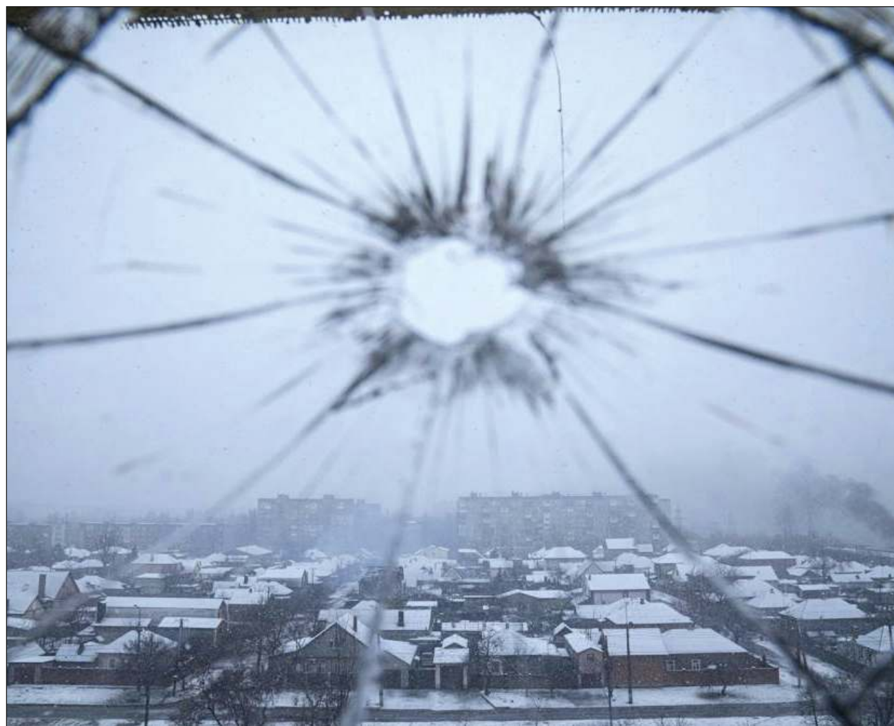
▲ Las afueras de Kiev, Chernígov en el norte, Mykolaiv en el sur y Járkiv, la segunda ciudad más grande del país, enfrentaban intensos bombardeos la noche del domingo, indicó el asesor de la presidencia Oleksiy Arestovich.

El presidente ucraniano Volodymyr Zelenskyy reiteró su pedido de que la comunidad internacional imponga una zona de prohibición de vuelos sobre Ucrania. La OTAN hasta ahora ha descartado esa posibilidad por temor a que ello la arrastre a la guerra.