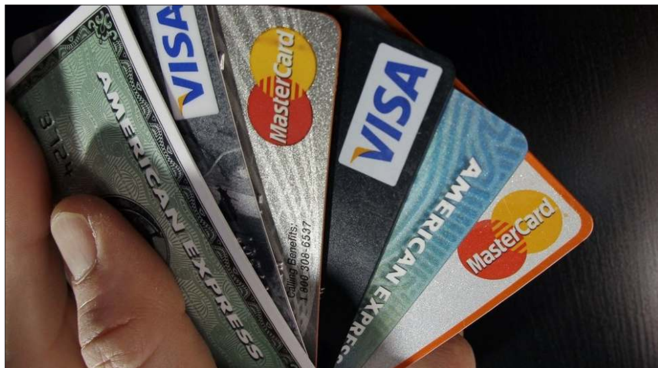
▲ La decisión de las tres plataformas de crédito al consumo acentúa la desconexión rusa del sistema financiero internacional.

"Todas las transacciones iniciadas con tarjetas Visa emitidas en Rusia ya no funcionarán fuera del país y las tarjetas Visa emitidas por instituciones financie-