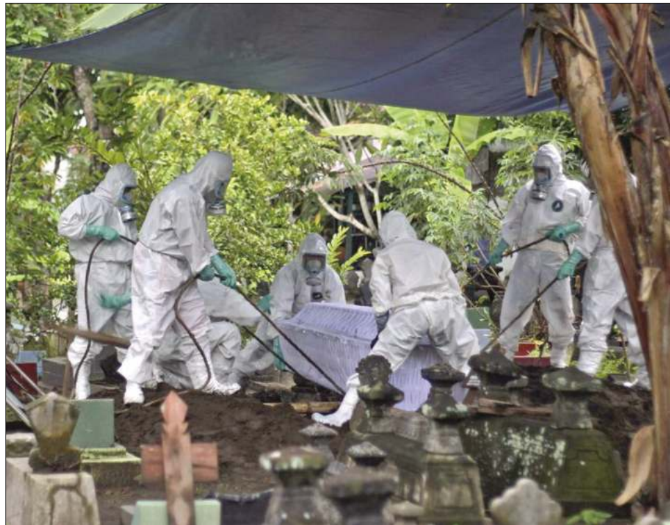
▲ El hito es un recordatorio trágico de la naturaleza implacable de la pandemia, incluso cuando las personas se están quitando los cubrebocas.

Hong Kong, que está experimentando un aumento vertiginoso de las muertes, está evaluando a toda su po-