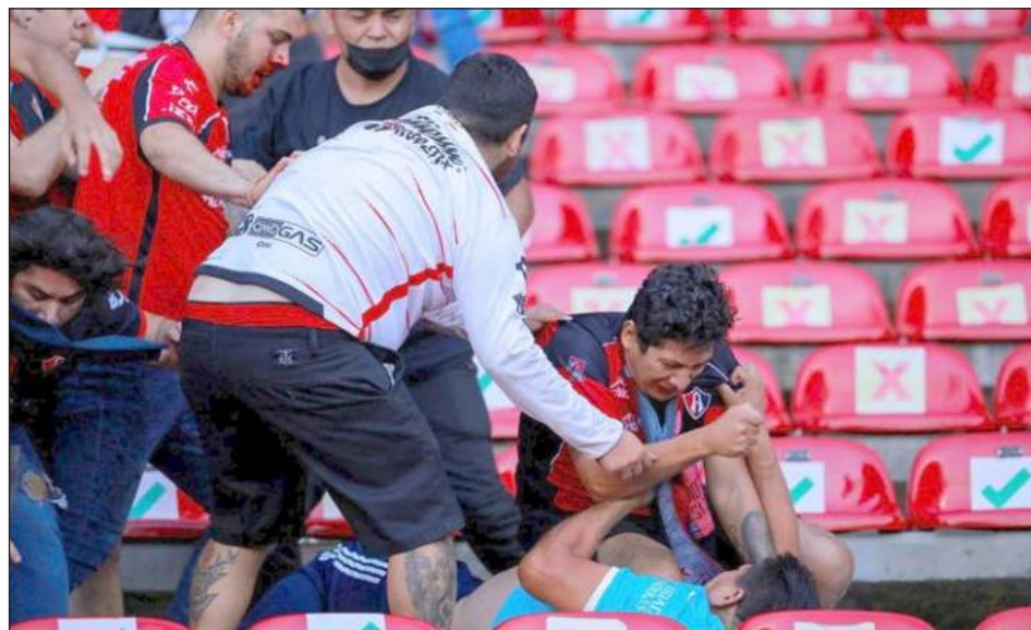
▲ El fútbol mexicano vivió uno de sus capítulos más oscuros el sábado en Querétaro.