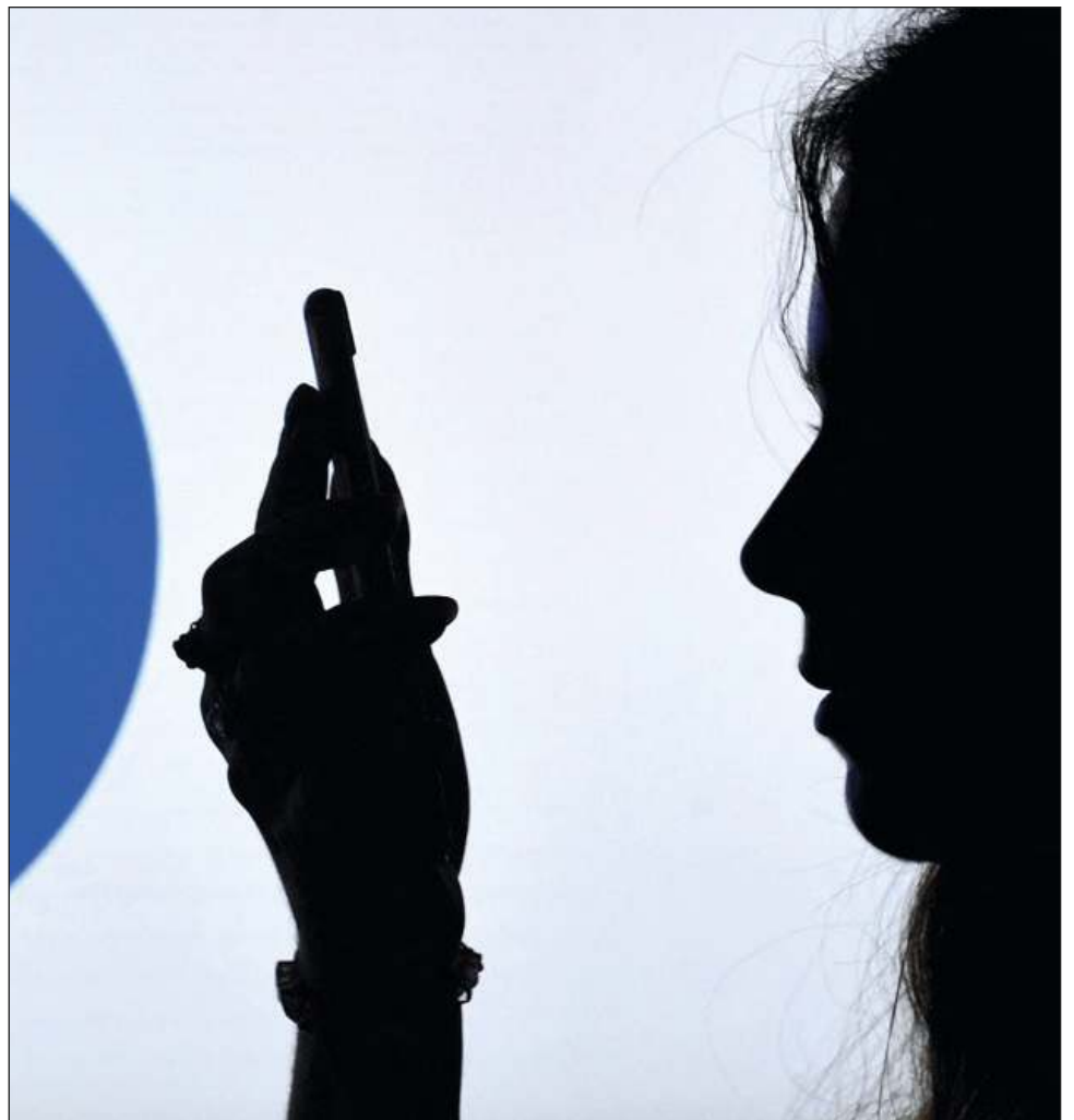
▲ Según Roskomnadzor, las restricciones en las redes sociales “violaban los principios clave de la libre difusión de la información rusa”.

Según Roskomnadzor, esas restricciones “violaban los principios clave de la libre difusión de la información y de un acceso sin trabas de los usuarios a los medios rusos sobre las plataformas de internet extranjeras”.