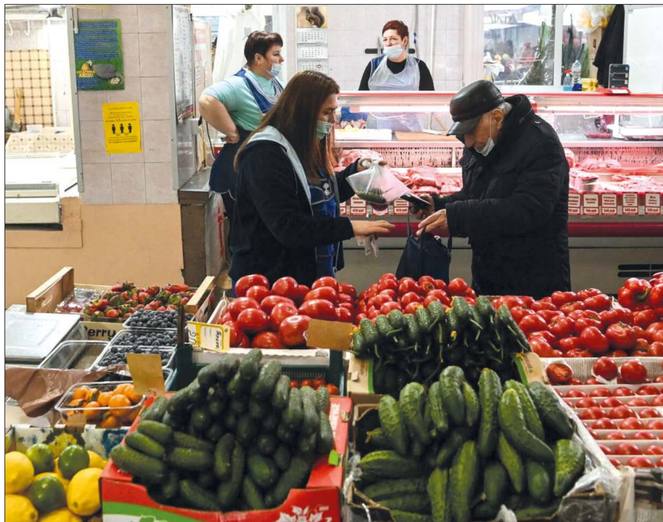
▲ El gobierno ruso respalda las medidas de racionamiento que han aplicado las redes de supermercados federales y regionales en ese país, a fin de evitar la reventa de alimentos.

Las sanciones económicas contra Rusia han provocado una caída del rublo y la retirada del mercado de varios suministradores extranjeros, lo que podría alimentar la inflación y el riesgo de generar penurias.