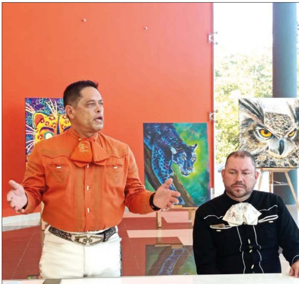
▲ En el Teatro de la Ciudad se llevarán a cabo las galas, y actividades como exposiciones y talleres se realizarán en la plaza 28 de Julio.

"A partir de las 3 de la tarde habrá un escenario donde habrá concursos, conferencias con expertos en el tema y mariachis. Pretendemos instituir este evento y celebrarlo dos veces por año", señaló Juan Carlos Maza.