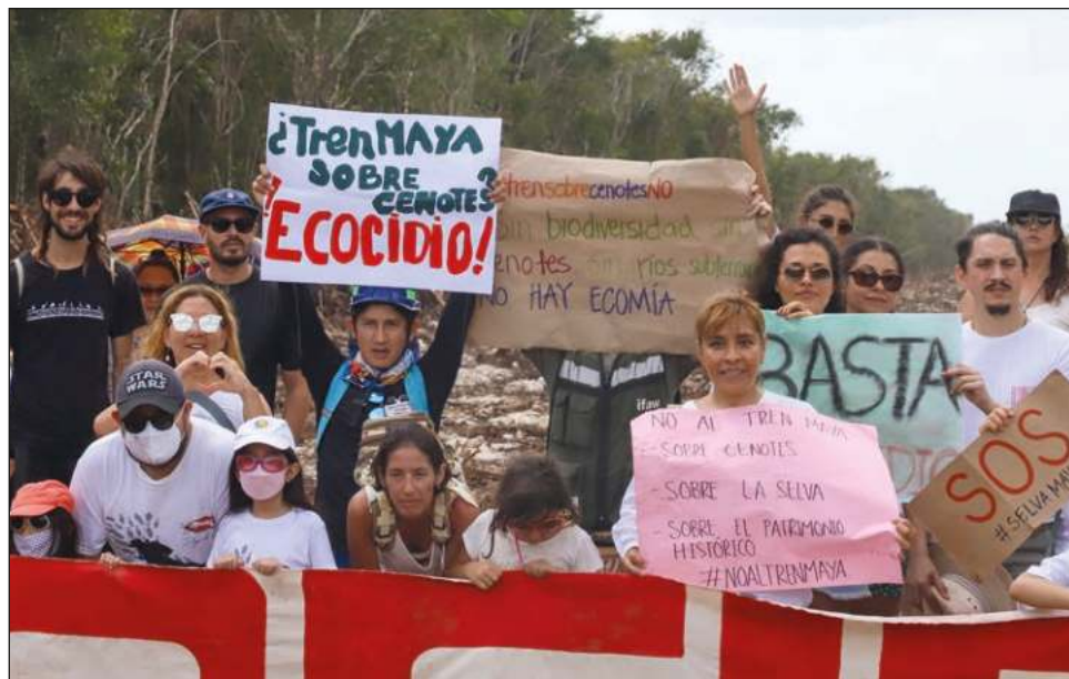
▲ Los manifestantes acudieron al área donde ya se ha talado una gran extensión de selva, ubicada a 4 kilómetros del residencial Real Marsella.

"Es un sentir sobre la biodiversidad de Quintana Roo... estamos tristes, afectados y molestos por la forma como se están haciendo las cosas, nos dicen de un día para otro que el trazo del tren ahora estará en la selva y que además va a pasar encima de los ríos subterráneos que hay en