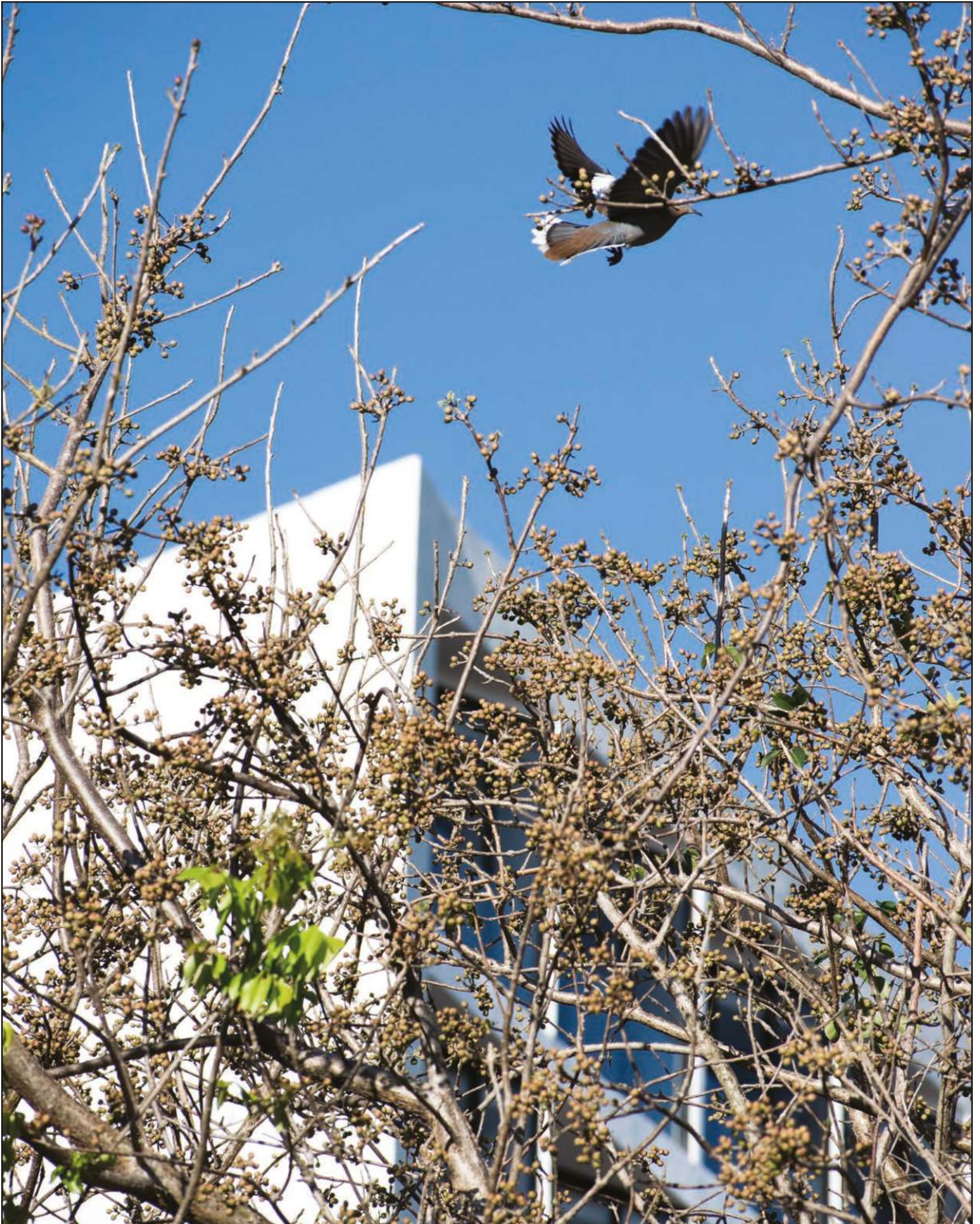
En esta colonia, todo es tan grande, parece tan terminado y sólido que da la impresión de que lleva años construyéndose. ▲