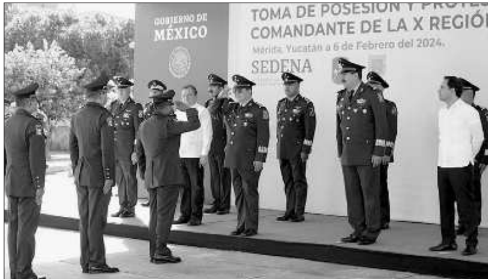
▲ El nuevo mando llega a Yucatán procedente de Guerrero, donde se desempeñó como Comandante de la IX Región Militar de Acapulco, Guerrero.

Tras el pase de revista al personal, comandantes y titulares de las unidades o áreas adscritas hicieron su presentación ante el nuevo mando militar, con 45 años al servicio de la nación, que asume esta encomienda