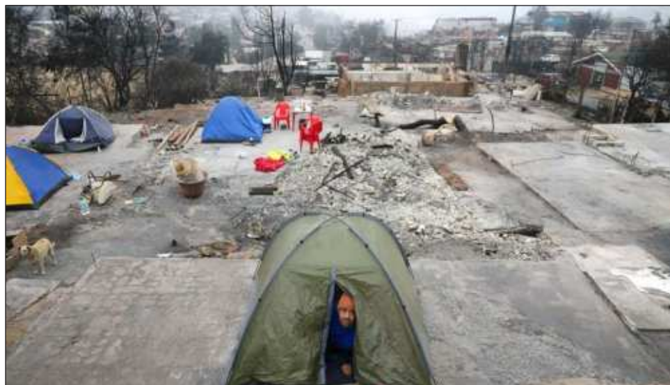
▲ La cifra total de damnificados aún no está clara, sin embargo, el número de viviendas dañadas podría llegar a 15 mil; se estima que aún hay un centenar de desaparecidos.

El levantamiento de cadáveres, además, está siendo lento porque hasta el domingo había muchos focos aún activos.