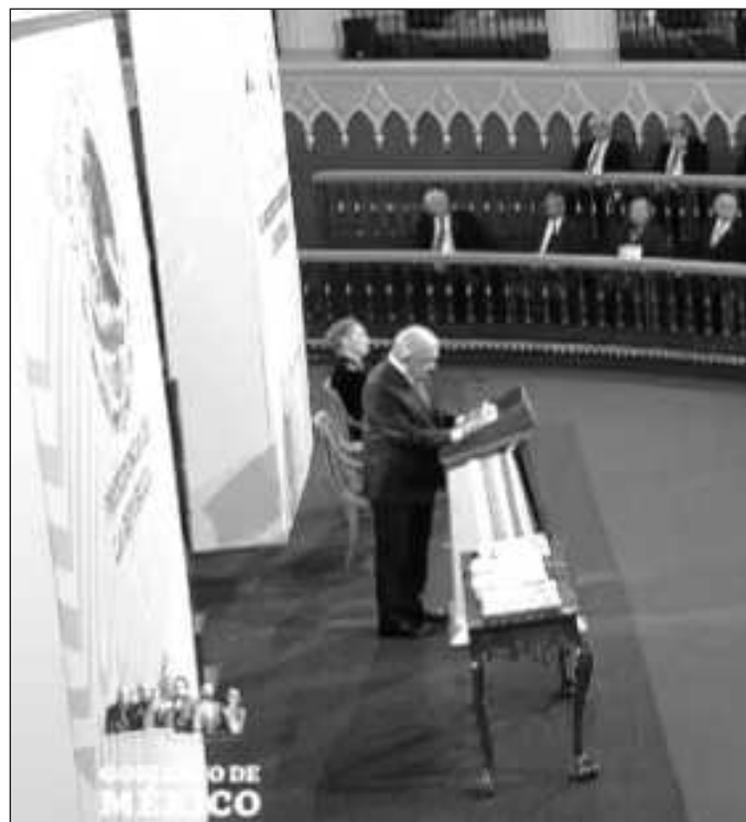
▲ El propio Presidente reconoció el martes que envió estas iniciativas a ocho meses de concluir su mandato "porque hasta ahora se dieron las condiciones".

La pregunta sería de lo más pertinente si no fuera por el tiempo electoral. El propio Presi-