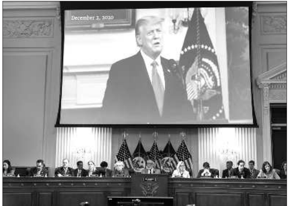
▲ El caso en Washington es uno de los cuatro procesos que afronta Donald Trump.

La decisión marca la segunda vez en otros tantos meses que los jueces han rechazado los argumentos de inmunidad de Trump y han sostenido que puede ser procesado por acciones realizadas mientras estaba en la Casa Blanca y en el período previo al 6 de enero de 2021, cuando una turba de sus partidarios irrumpieron en el Capitolio de Estados Unidos. Pero también sienta las bases para apelaciones adicionales del ex presidente republicano que podrían llegar a la Corte Suprema de Estados Unidos y provocar más demoras.