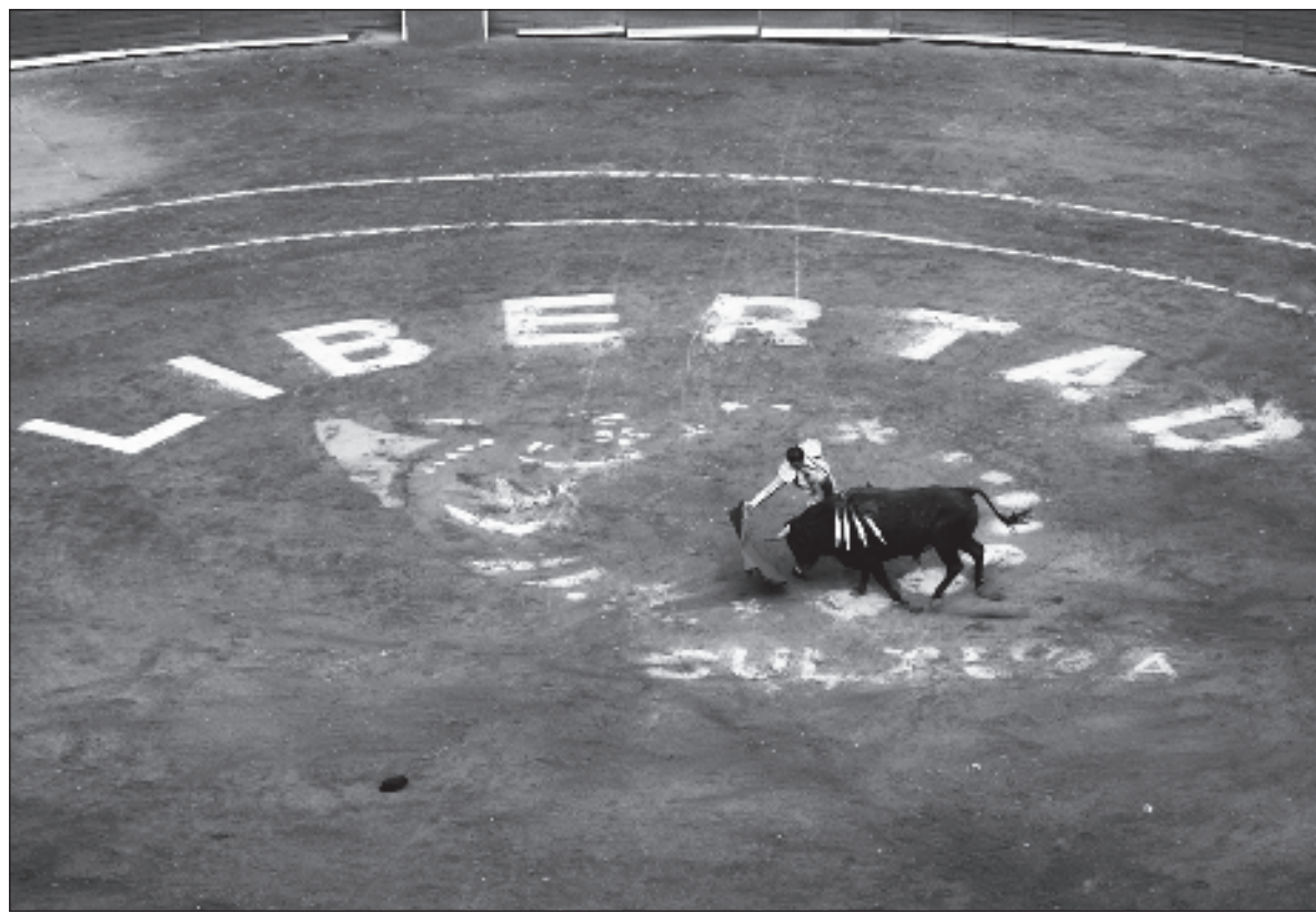
▲ “En cuanto a las corridas de toros, aclaro de entrada que no me gustan, a pesar de que mi madre me llevó de niño a varias de ellas, en la monumental plaza México. Dejé de asistir en cuanto inicié el uso de mi razón, y no volveré”.

Podría sumar otros ejemplos, como la cacería para la obtención de trofeos, o los orangutanes, pero requeriría un espacio más extenso que el que podré dedicar a esta nota. Comenzaré pues por el tema de las calesas. El caballo figura entre las primeras especies domesticadas, en nuestra vastísima historia de relaciones con el resto de los