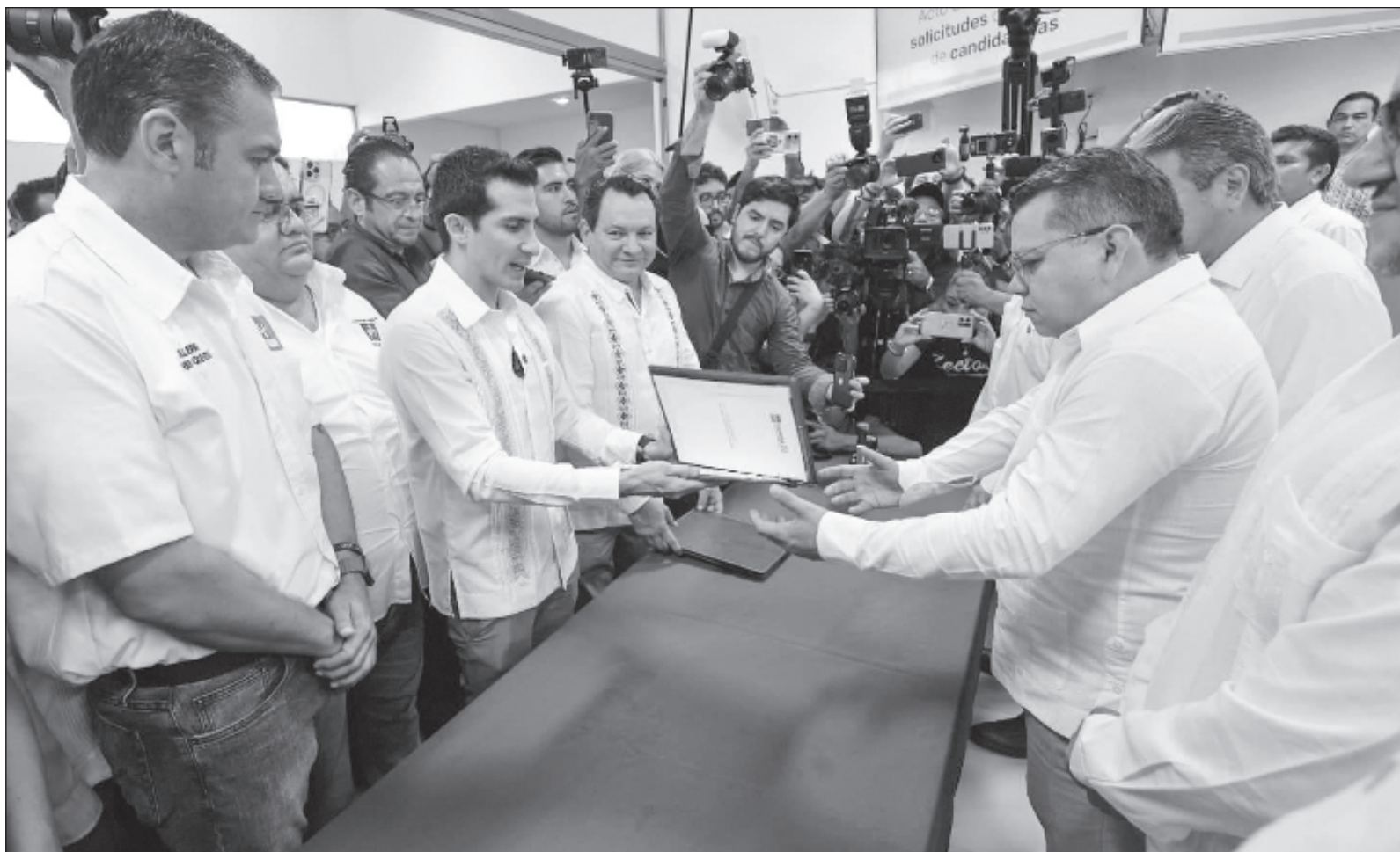
▲ “Morena Yucatán hace implosión; los militantes fundadores denuncian que ex panistas y ex priistas los han relegado”.