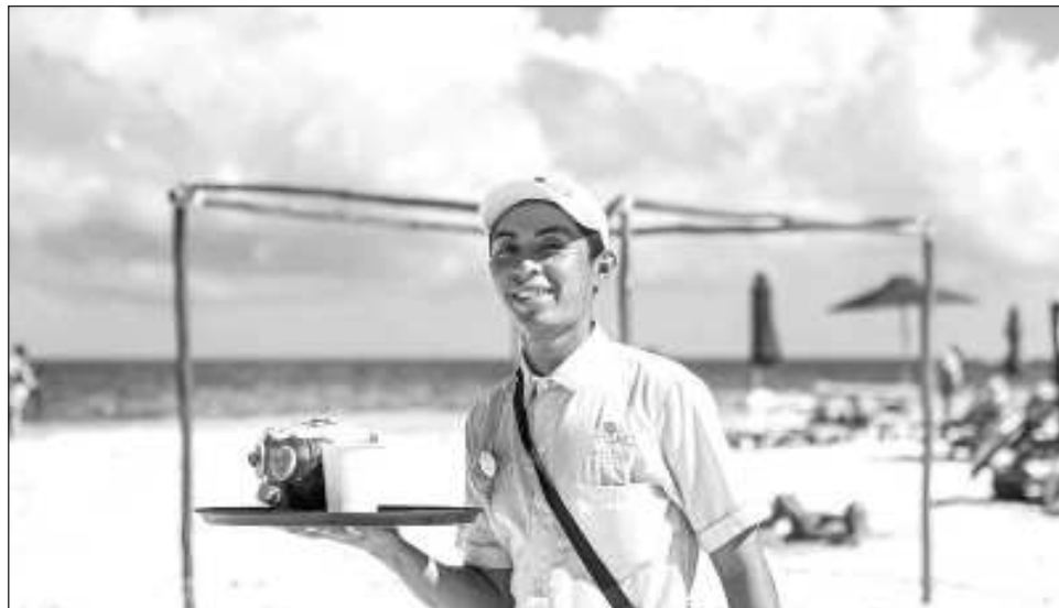
▲ La presidente de Coparmex Cancún dijo que “estamos a favor, pero de manera paulatina, no tengo el dato exacto, pero podrían ser cuatro años, como se proponía con las vacaciones”.

Expuso también que auna empresaria en el área de seguridad relató que estaba pensando en cambiar de giro, porque una modi-