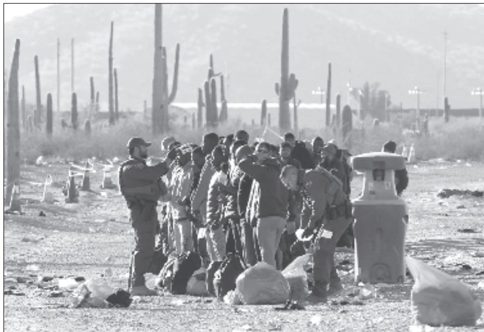
▲ “La gente no sale por gusto de sus pueblos. México tiene que destinar 4 mil millones de dólares al año para atender temas migratorios. Estamos ayudando en todo lo que podemos, lo vamos a seguir haciendo pero hay que atender las causas”, puntualizó Andrés Manuel López Obrador.

“Dijimos de manera muy respetuosa que íbamos a hablar, porque el presidente Biden nos ha tratado bien, como