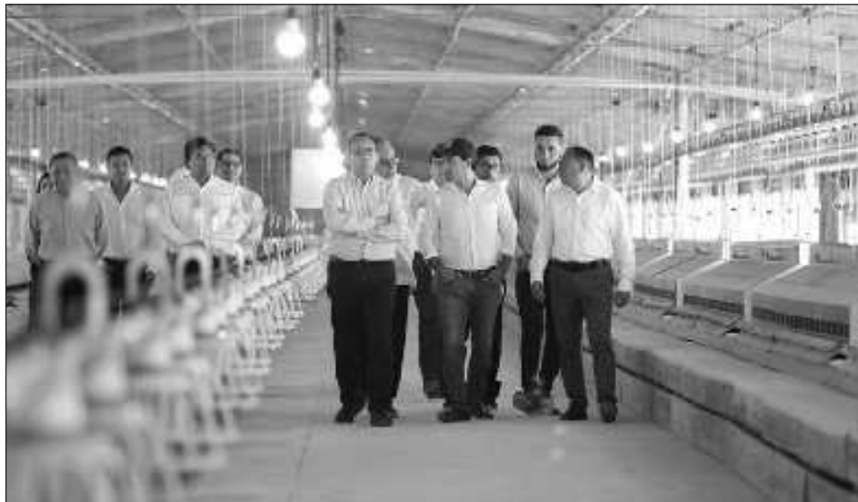
▲ Acompañado del alcalde de Peto, Renán Jiménez Tah, y los gerentes de la Unidad de Negocio Peninsular, Hugo Monterrey y de Operaciones de Granjas Reproductoras de Bachoco, Saúl Herrera, el gobernador realizó el corte de listón inaugural del nuevo complejo.

En gira de trabajo por este municipio, Vila Dosal realizó la entrega de los trabajos de rehabilitación de la Casa Ejidal de Peto, de certificados de vivienda, realizó la distribución de apoyos del programa de Seguridad Alimentaria y supervisó el registro de beneficiarios al programa Peso a Peso .