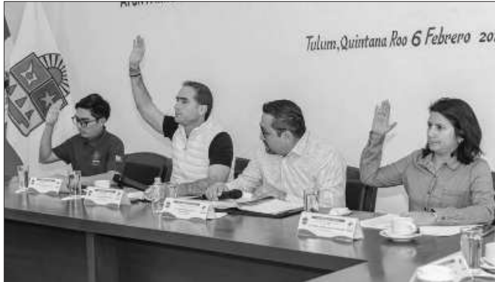
▲ En cuanto a las acciones que serán realizadas con recursos propios, el Cabildo validó invertir 60 millones 60 mil pesos en beneficio de toda la comunidad, a través de obras sociales como la modernización de la avenida Cobá Sur, tercera etapa.

Asimismo, alumbrado público de la avenida La Selva, primera etapa; construcción de pozos de absorción pluvial, en la localidad de Tulum; rehabilitación y ampliación de la casa de salud de Chemuyil; rehabilitación y remodelación de las casas de salud de Manuel