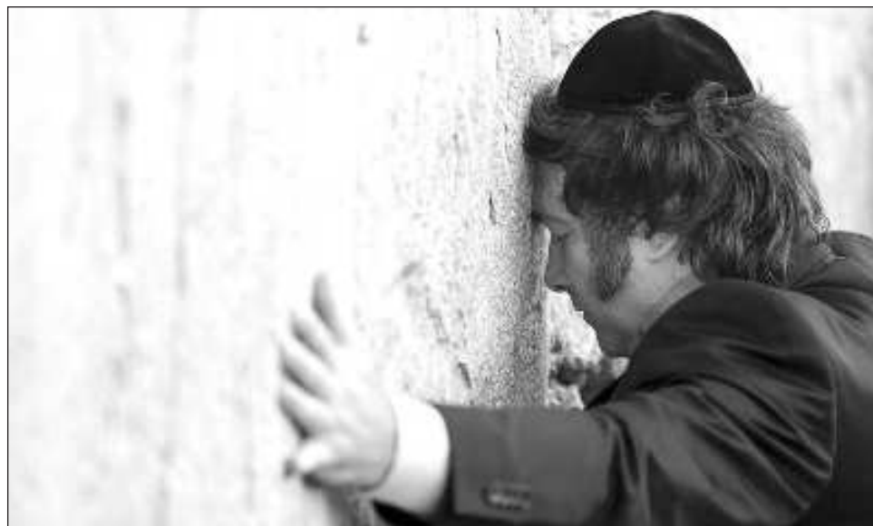
▲ Si el presidente Javier Milei lleva a cabo su promesa, Argentina se convertiría en uno de los pocos países que tienen su principal misión diplomática en Jerusalén, en lugar de Tel Aviv.

La oficina del primer ministro israelí Benjamin Netanyahu acogió con satisfacción el anuncio de Milei,