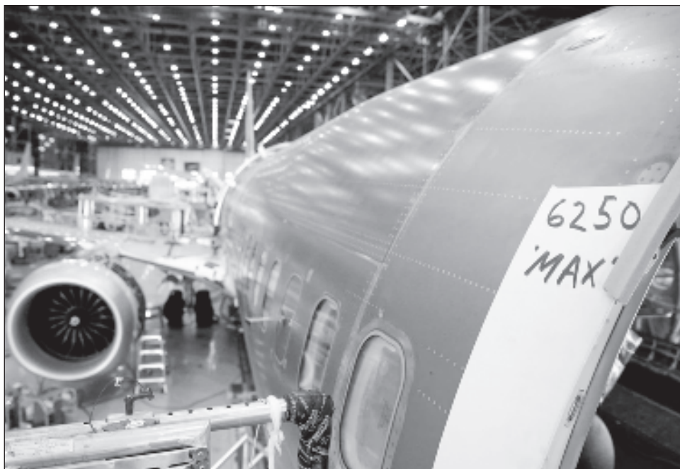
▲ "A partir de ahora, tendremos más personal sobre el terreno para examinar y supervisar de cerca las actividades de producción y fabricación", dijo Whitaker.

Ante las preguntas de los legisladores, el responsable también animó a los empleados de Boeing a informar a la FAA sobre cualquier problema de seguridad, puesto que, como aseguró, es la "prioridad número uno" de la agencia.