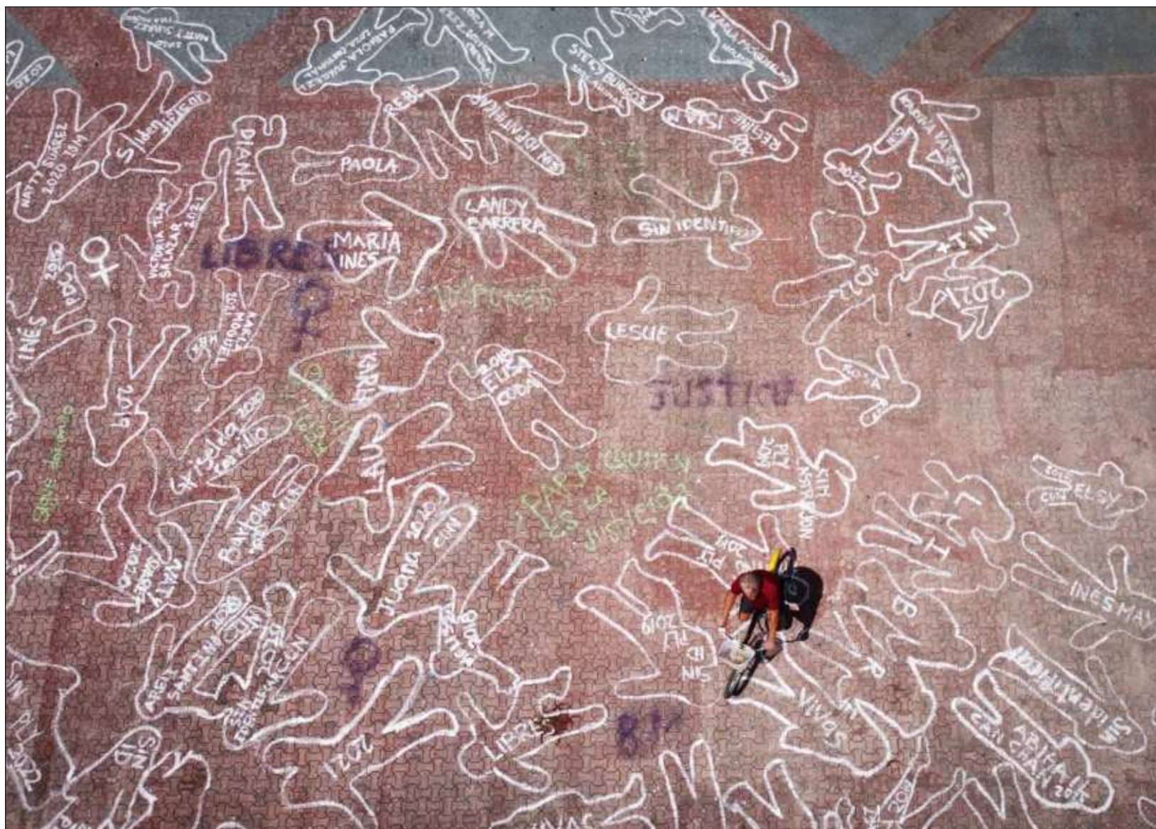
▲ A comparación de los otros estados peninsulares, Campeche sobresale en violación equiparada, la cual se refiere a la cópula con menores de 15 años sin su consentimiento o sin que tengan la capacidad de comprender el significado del hecho o que por cualquiera otra causa no puedan resistirse.