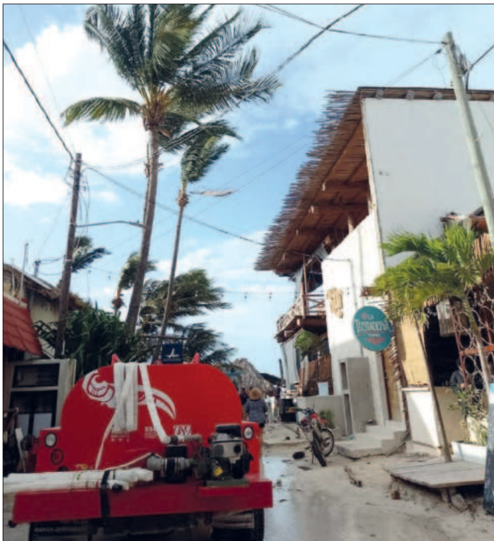
▲ El lugar más impactado fue Holbox, cuyos residentes serán evacuados por las autoridades municipales para evitar más afectaciones y damnificados.

Para este miércoles y jueves se espera que al amanecer se registren temperaturas mínimas aproximadas de entre 13 y 14 grados, por lo que exhortó a los ciudadanos a tomar medidas preventivas por este descenso de los termómetros.