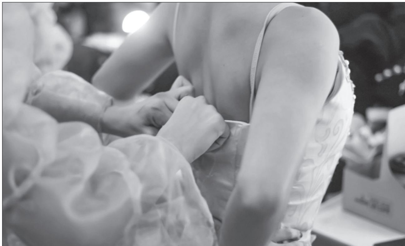
▲ El pasado mes de septiembre presentaron este espectáculo en el teatro Armando Manzanero con buena aceptación, por lo que repetirán en otros sitios, llegando al estado de Campeche también.

La compañía surge a partir de la necesidad de continuar