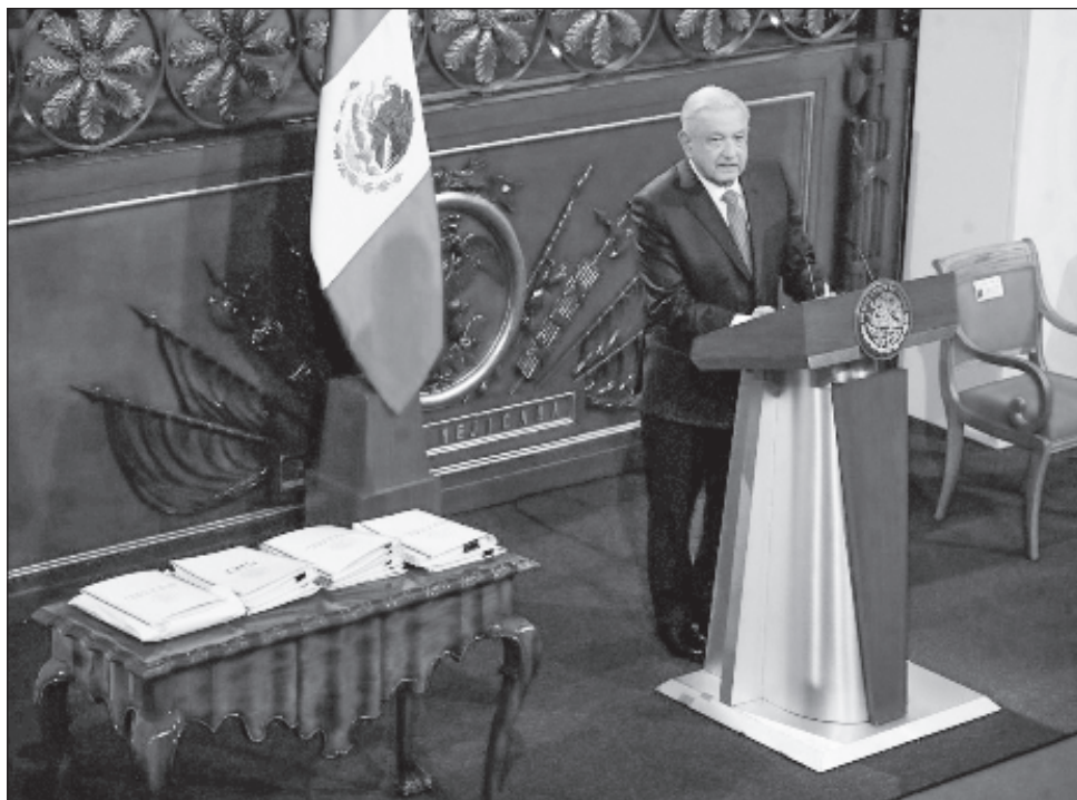
▲ En la mañana, ante la pregunta expresa de por qué hasta ahora envió estas propuestas al Congreso de la Unión a ocho meses del cierre de su mandato, el presidente López Obrador señaló: “Porque hasta ahora se dieron las condiciones y además porque vienen las elecciones y el pueblo va a decidir”.