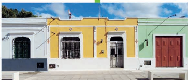
El Ayuntamiento de Mérida inviertió en la pintura en las fachadas de las viviendas que rodean al Parque de la Plancha.