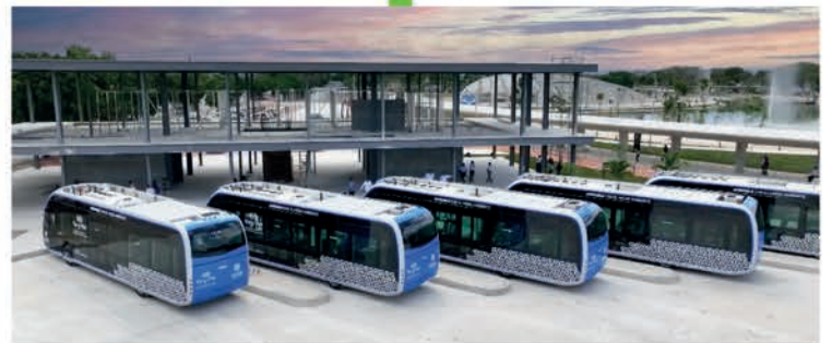
Se construye la estación del IETRAM en el Parque la Plancha, para 3 rutas de este transporte público 100% eléctrico y único en su tipo en Latinoamérica.