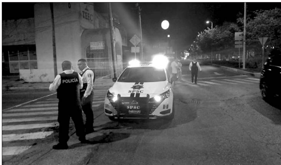
▲ El fiscal explicó que en el caso de los feminicidios que se han registrado en la entidad, todos se encuentran esclarecidos, quedando pendiente la complementación de algunas órdenes.

Destacó que Campeche tiene uno de los índices más altos del país de resolución