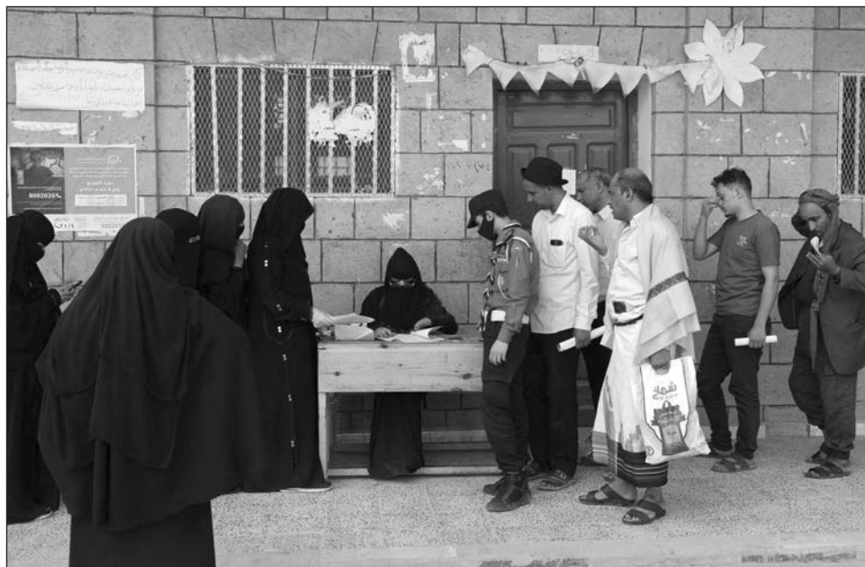
▲ “Esta difícil decisión, tomada en consulta con los donantes, se produce después de casi un año de negociaciones durante las cuales no se llegó a ningún acuerdo para reducir el número de personas atendidas de 9,5 millones a 6,5 millones”, indicó el PMA.

En las zonas del sur y sureste, controladas por el Gobierno internacionalmente reconocido del Yemen, el PMA sí continuará distribuyendo alimentos, de forma más reducida debido a una serie de ajustes de recursos que la organización anunció el pasado agosto.