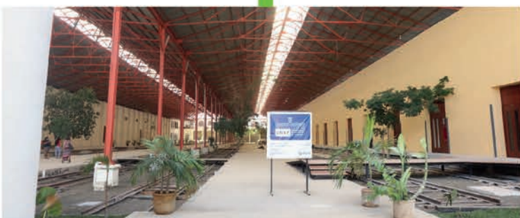
La Universidad de las Artes, UNAY , que ahora es la más importante del sureste del país, se está ampliando para aumentar su capacidad y recibir hasta 2 mil alumnos.

ESTAS SON LAS NUEVAS OBRAS QUE GENERAN GRANDES BENEFICIOS PARA TI Y TU FAMILIA