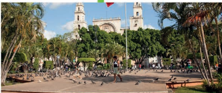
Realizaremos la remodelación de la Plaza Grande