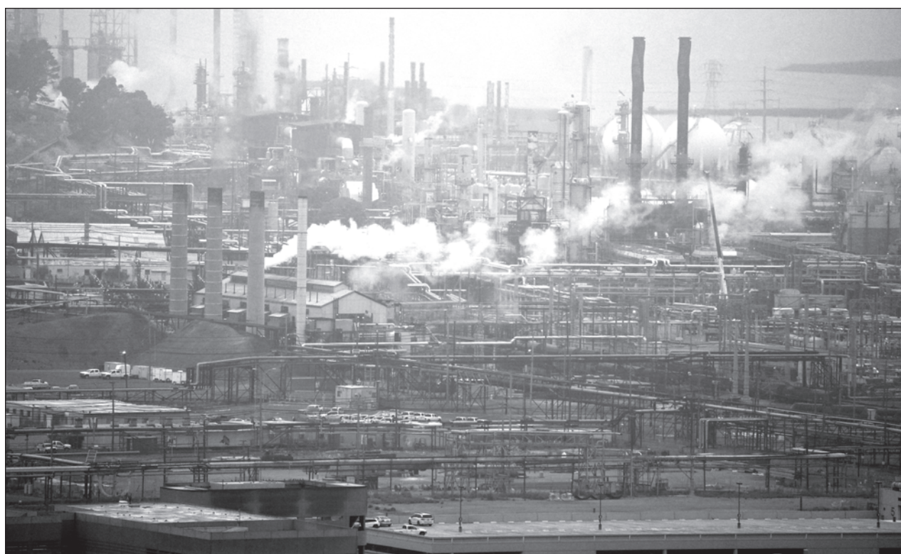
▲ El estudio del Global Carbon Project, presentado en la Conferencia de Naciones Unidas sobre el Clima en Dubái, advierte que las emisiones de CO2 procedentes del carbón, gas o petróleo alcanzarán un nuevo récord en 2023.

Otras dos personas perdieron la vida en una colisión entre un auto y un camión articulado en la autopista A8 en la Alta Baviera. Según la policía, su coche patinó y se metió bajo la parte trasera del camión, que se había parado en la carretera durante la noche debido a la lluvia helada.