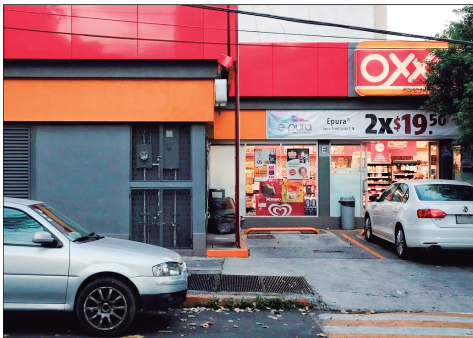
▲ Según el anuncio dado por la empresa de autoservicio, no será necesario hacer una compra mínima, aunque los bancos recordaron que se cobra una comisión adicional.