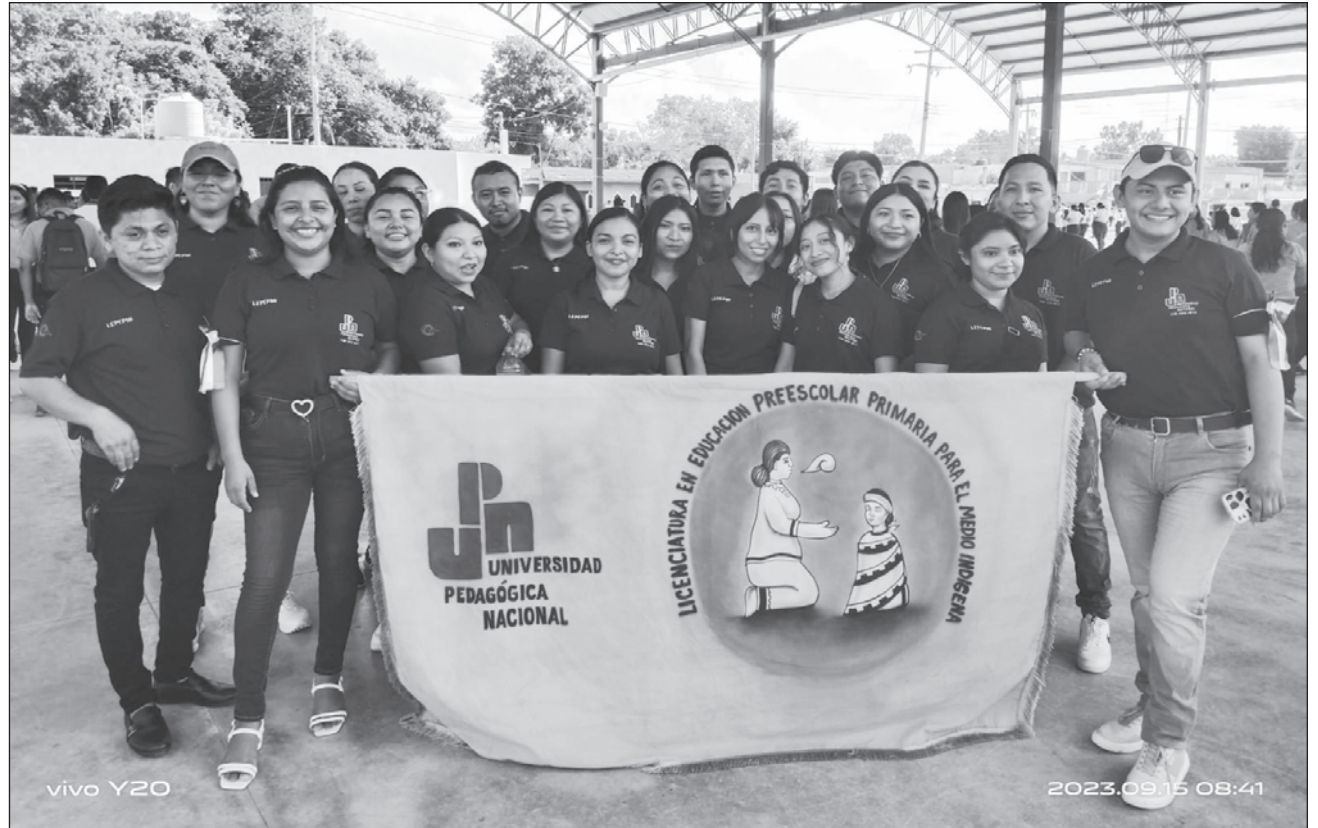
▲ Los estudiantes afectados esperan su título para poder ejercer su profesión.

“Nos dijeron que el 15 de diciembre estaba lista, pero hace unos días le dijeron a la respon-