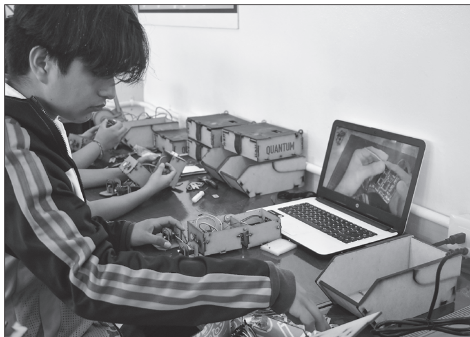
▲ La OCDE destacó que hubo un descenso en los resultados obtenidos sobre los 81 países en general; la pandemia hizo mella y la caída con respecto a 2018 fue muy fuerte.

México sacó 395 puntos en la materia de matemáticas. Con esto retro-