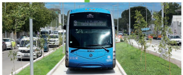
Construcción de vías en donde transitarán las unidades del IETRAM, además de construcción de banquetas y guarniciones, señalética, sistema de iluminación y pozos pluviales.