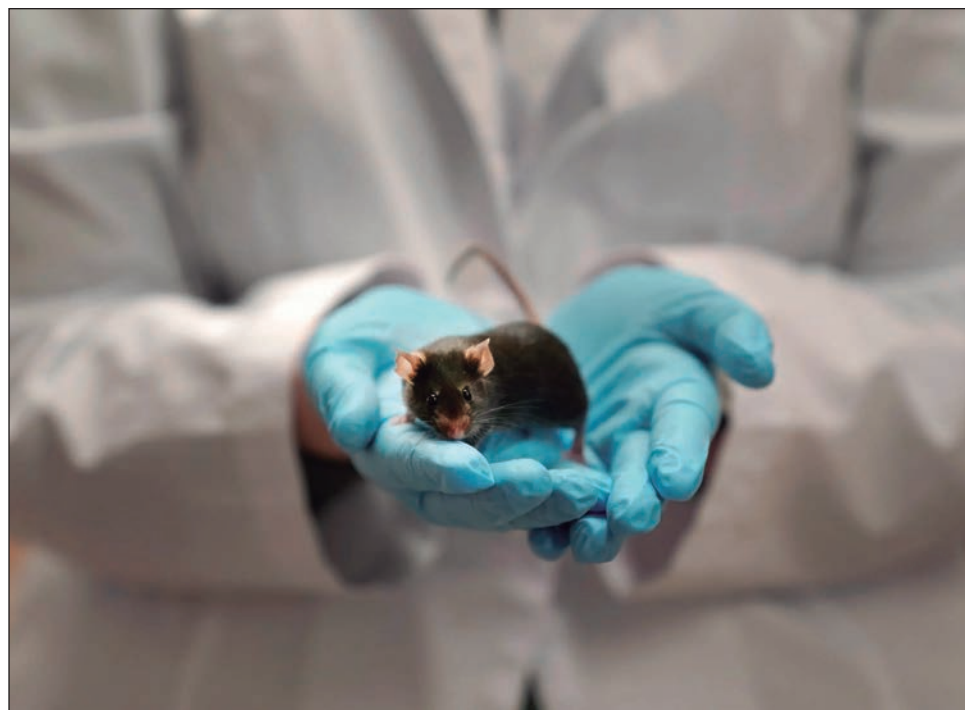
▲ Con esta investigación, los científicos de la Universidad de Texas han tratado de arrojar luz sobre los mecanismos neuronales que se producen en el autorreconocimiento.

La conclusión fue que los ratones detectaban cambios en su apariencia, pero solo en determinadas condiciones, por ejemplo aquellos que estaban más familiarizados con los espejos pasaban mucho tiempo acicalándose la cabeza frente a ellos (no así con otras partes del cuerpo) cuando se les marcaba con