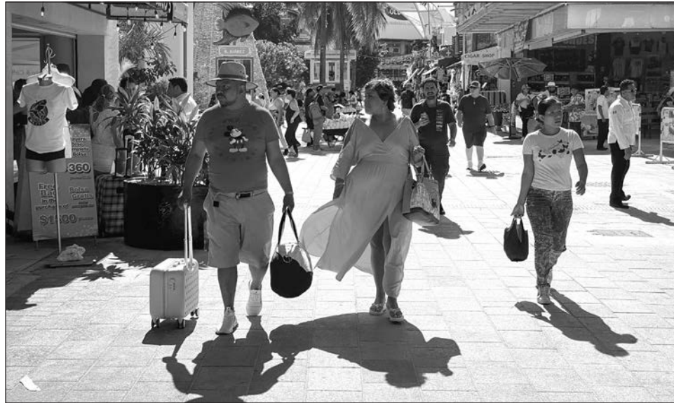
▲ El Caribe Mexicano acapara 62 por ciento del total de los paquetes ofrecidos por Azabache, mayorista de productos turísticos para agencias de viajes.

Azabache, como mayorista de productos turísticos para agencias de viajes, tiene ya 11 años de trayectoria con base en Mérida, Yucatán, y cuenta con presencia en