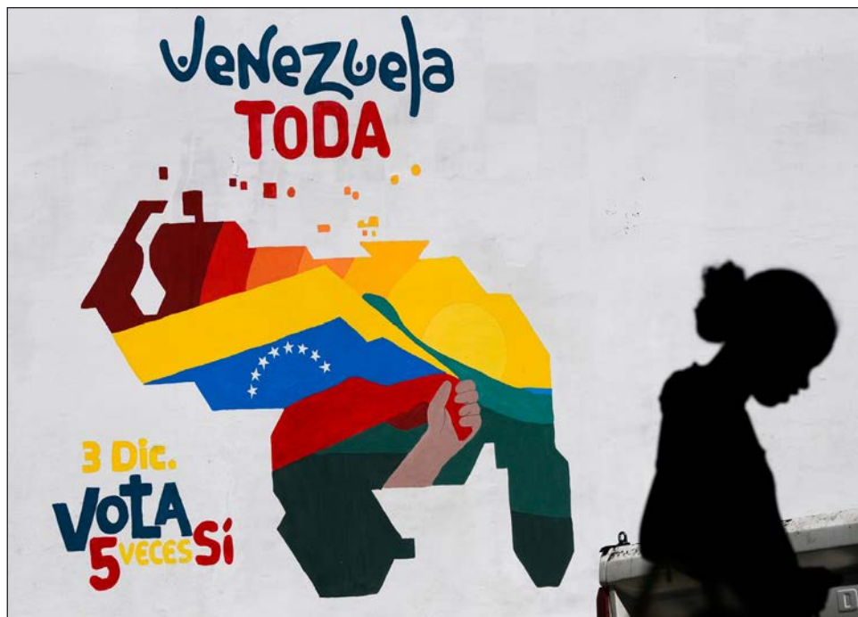
▲ El pasado viernes, la Corte Internacional de Justicia ordenó al gobierno venezolano "abstenerse de cualquier acción que modifique la situación actualmente vigente".

Caracas argumenta que el río Esequibo es la frontera natural, como en 1777 cuando era colonia de España, y apela al acuerdo de Ginebra, firmado en 1966 antes de la independencia de Guyana del Reino Unido, que sentaba las bases para una solución negociada y