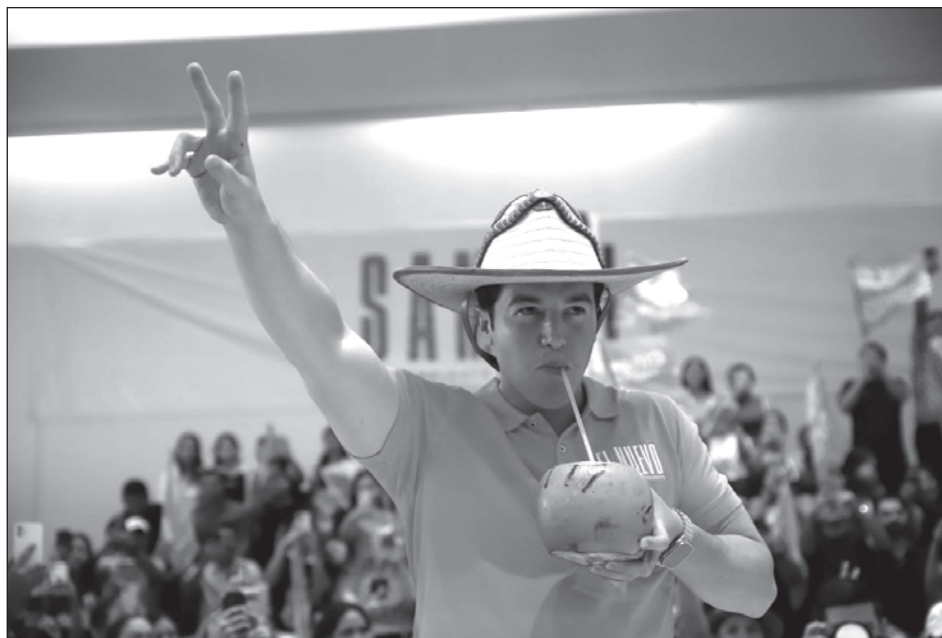
▲ El jefe del Ejecutivo confió en que todo vuelva a la normalidad y reiteró que mantendrá su buena relación con el gobernador neoleonés.

Si bien, dijo, no ha hablado aún con el mandatario estatal, "todo (está) normal, todo bien".