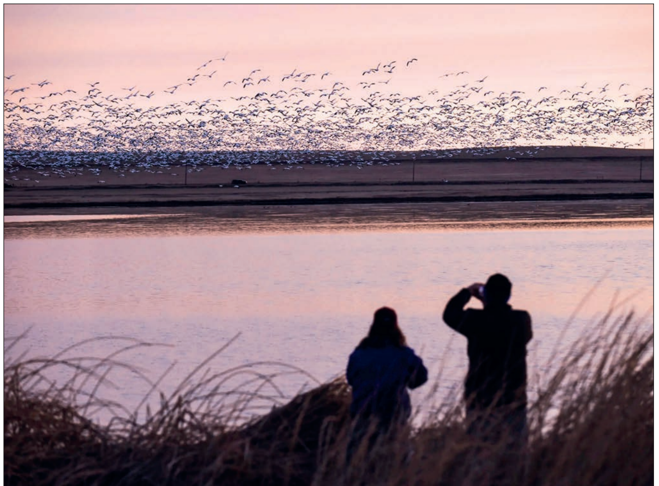
▲ UKu kíimilo'ob tumen ku kóojolo'ob ti' noj kaajo'ob ma' no'o'jan u ti'alo'obi' tumen ku p'úuchulo'obi'.

Xaak'al jo'olbesa'an Universidad de Colorado ts'o'ok u ketik maanal 10 miyoonesil ch'úuktajil beeta'an yéetel u yáantajil radares meteorológicos, tu'ux ila'ab jach bix yanik ba'al te'el kúuchilo', ts'o'oke' jach sáasil ba'ax chíikpaji: le seten sáasilo'ob yaane', u ka'ap'éel ba'axil beetik u kúimil ch'íich'o'ob ku máano'ob táatanxel kaajo'ob.