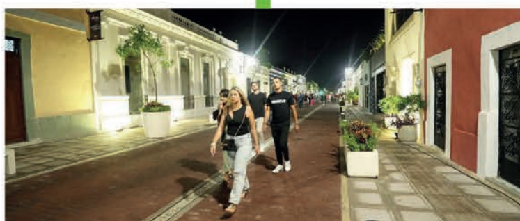
Estamos realizando el Corredor Turístico - Gastronómico de la calle 47 y 60 para conectar a la Plaza Grande, el Parque de Santa Lucía y de Santa Ana con el nuevo Parque la Plancha, en conjunto con el Ayuntamiento de Mérida.