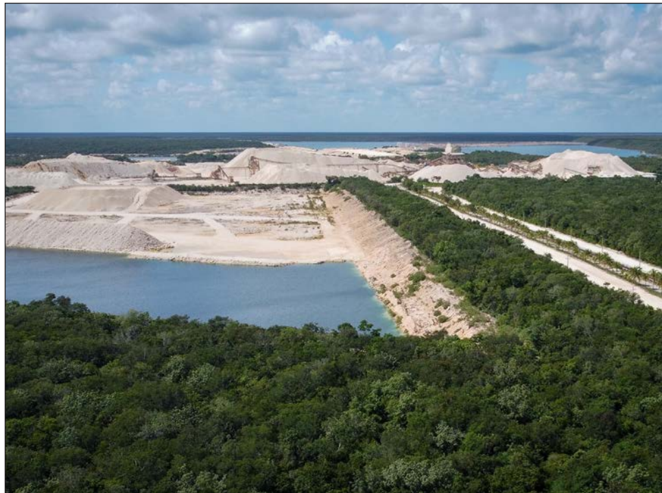
▲ La solicitud de amparo interpuesta por la filial de Vulcan Materials Company argumentaba que la creación del APFF violaba artículos de la Constitución mexicana.

De acuerdo con los estrados del Juzgado Octavo de Distrito en el Estado de Quintana Roo, con residencia en Cancún, el 30 de noviembre pasado la filial de Vulcan Materials Company interpuso una solicitud de amparo contra la declaración de un Área Natural Protegida, argumentado que esto violaba los artículos 1, 14, 16, 17 y 27 de la Constitución mexicana, la cual fue desechada. Los hechos están asentados en el expediente número 1062/2023.