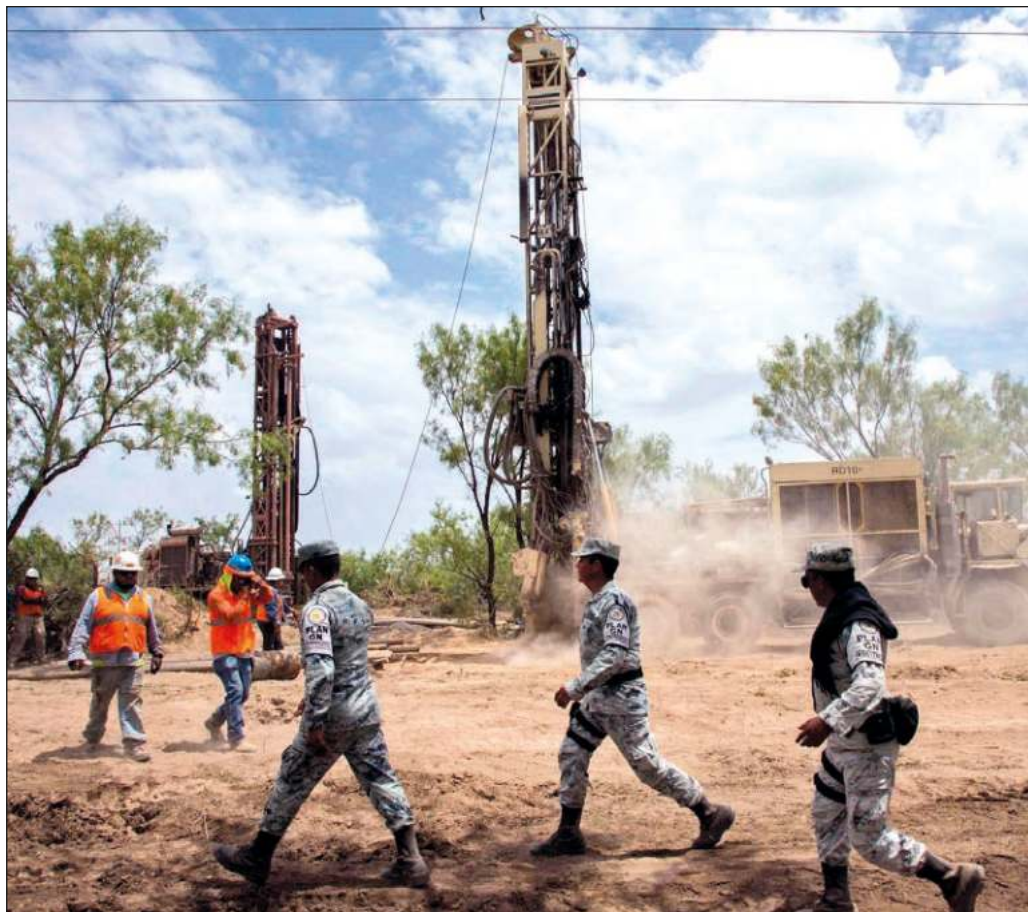
▲ Las explotaciones mineras, incluso cuando cuentan con los permisos y concesiones pertinentes, suelen operar con un marcado déficit de medidas de seguridad laboral y ambiental.

Cabe esperar que en esta ocasión se haya decidido formular imputaciones penales contra los presuntos responsables sea el principio del fin de la larga impunidad de empresas que en aras de maximizar sus ganancias han omitido elementales medidas de protección para sus trabajadores y han desdeñado la precaución que debe observarse a fin de no dañar el medio ambiente.