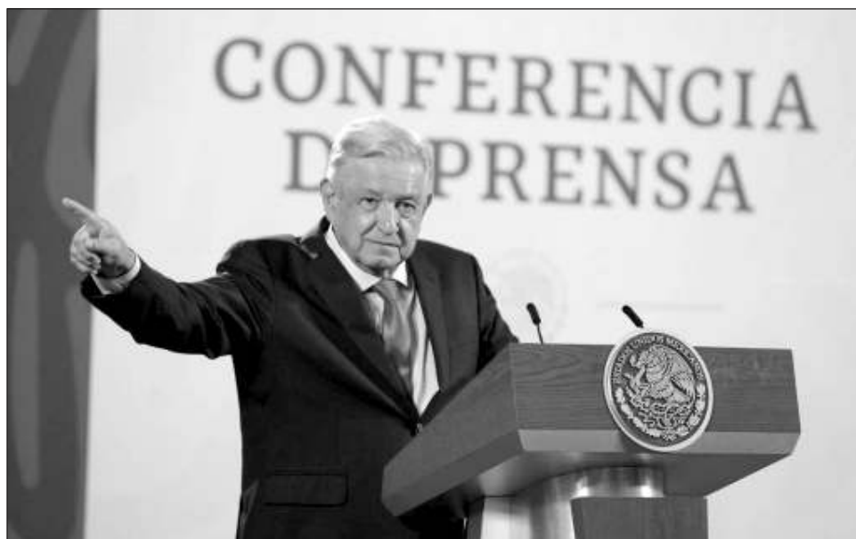
▲ El Presidente señaló que los ministros “se fascinan con la defensa de los grupos de intereses creados, su mundo es el de los abogados (...) no todos, desde luego, pero hay esa tendencia”.

Consideró que en caso de que la Corte suprima esa medida cautelar, con lo que modificaría el artículo 19 constitucional, representarían “una invasión” a las facultades del Legislativo, por lo que correspondería a este poder buscar una alternativa para que se cumpla con el principio del equilibrio y la separación de poderes.