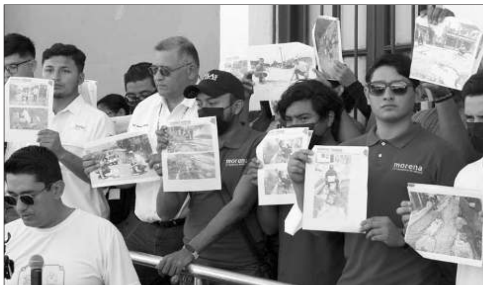
▲ Cada oficio ingresado a la Dirección de Participación Ciudadana y a la de Servicios Públicos, tiene anexadas fotografías y ubicación de los baches contabilizados por brigadistas.

Aunque dichos oficios fueron ingresados recién