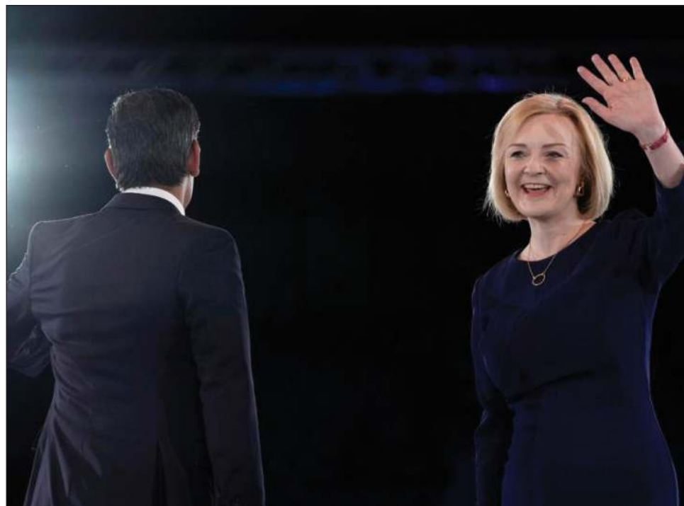
▲ Liz Truss se ha ganado el apoyo de muchos conservadores con su fervor a Margaret Thatcher, ya que busca retroceder la intervención estatal y recortar los impuestos.

La reina Isabel II tiene previsto nombrar formalmente a Truss como primera ministra de Gran Bretaña el martes. La ceremonia tendrá lugar en la propiedad de la reina en Balmoral en Escocia, donde la monarca pasa el verano,