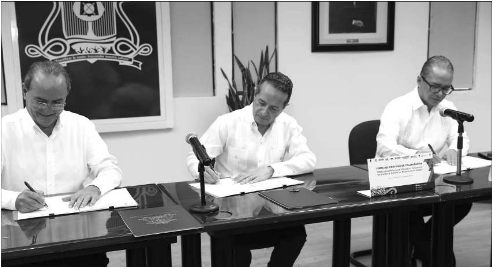
▲ El gobernador Carlos Joaquín fue testigo del acuerdo realizado entre la Fiscalía General y la Universidad Autónoma de Quintana Roo.