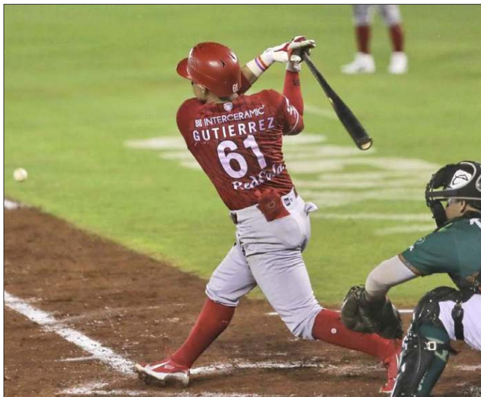
▲ En un comunicado, los Diablos aseguran que no hicieron nada malo, pero no mencionan a Miguel Ojeda, su director deportivo, suspendido por la LMB.

En un comunicado la liga concluyó que la irregularidad fue un hecho aislado en los dos enfrentamientos en el estadio de los Diablos, y aseguró que no existen evidencias de robo de señales por parte de los pingos, a pesar de lo cual le aplicó una multa económica al club por una cantidad no divulgada. La liga investigó a los escarlatas, a pedido de sus rivales en la serie de campeonato, los Leones, que solicitaron abrir una averiguación por una supuesta manipu-