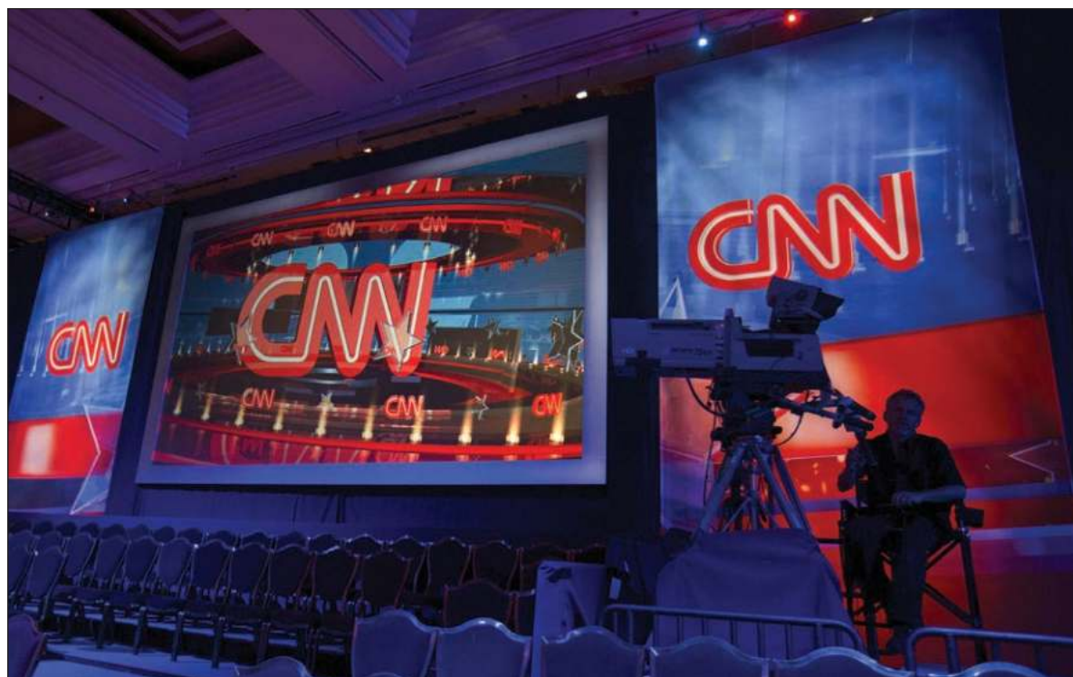
▲ "Self-censorship can be dangerous if it prevents journalists from calling things as they are"

IT WAS WATCHED by world leaders to find out what their embassies could not about friend and foe. It