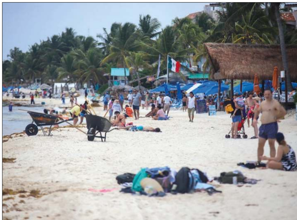
▲ El Caribe Mexicano recibió hasta 400 mil turistas diarios.

En rueda de prensa conjunta con el Consejo de Promoción Turística de Quintana Roo (CPTQ), Cueto Riestra presentó varias gráficas de los datos obtenidos durante la temporada de verano, en la que se recibieron 3 millones 757 mil 775 visitantes, 20% de incremento con respecto a la misma temporada de 2019.