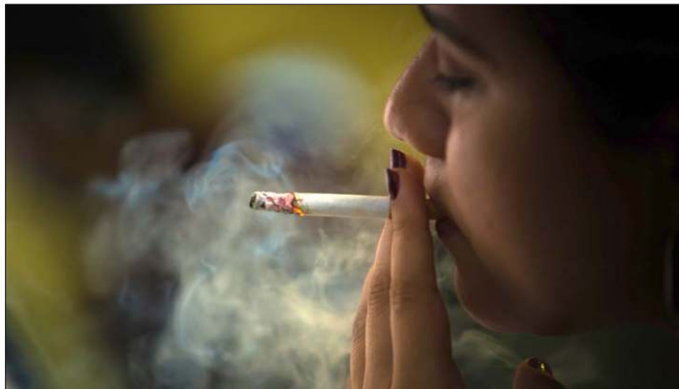
▲ Las autoridades señalaron que prevenir va más allá de darles información y decirles que no deben consumir sustancias, sino brindarles alternativas y frenar las incoherencias del entorno.

Apuntó que, con datos del Inegi, las personas de 0 a 29 años representan 48.9 por ciento de la población del estado, 51.5 por ciento de estas personas, son jóvenes entre 15 y 19 años, destacó. "Durante la última década en Yucatán las personas de