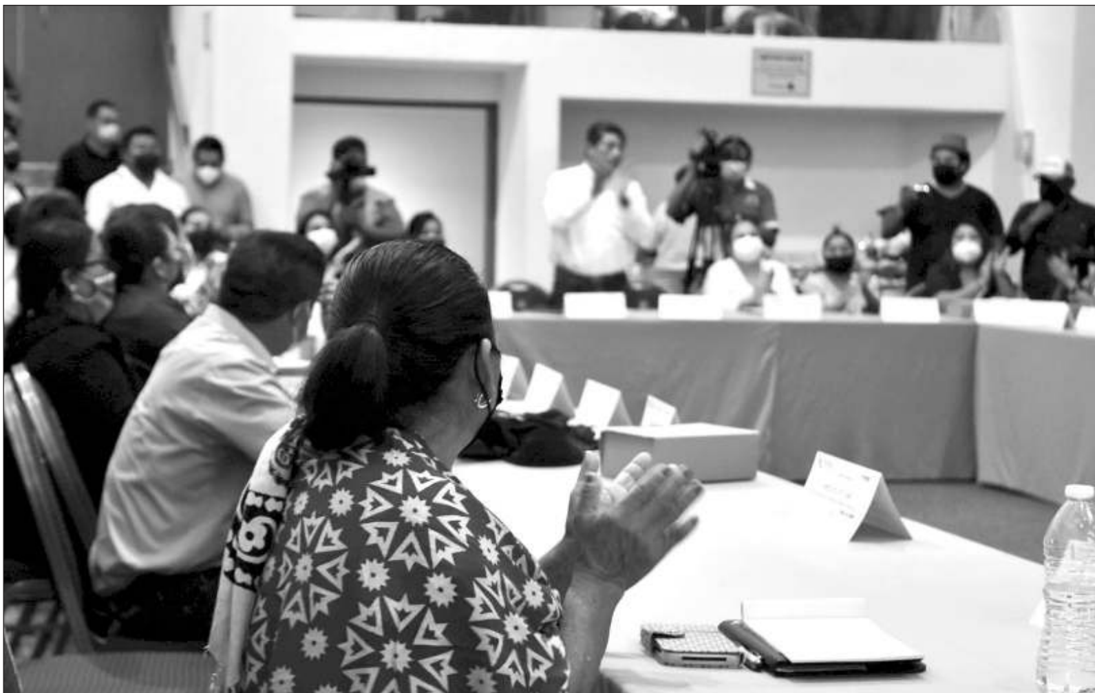
▲ “La efectiva participación ciudadana conlleva a lograr un clima de paz, altamente importante para el desarrollo de cualquier región”.