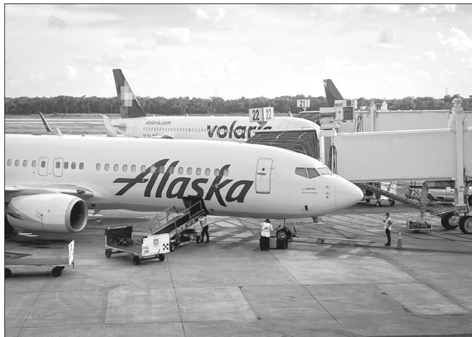
▲ El mercado estadounidense ha tenido la mayor presencia en los destinos de Quintana Roo, con un aumento de hasta 33.67 por ciento en comparación con 2019.

Esto es el preámbulo de la conectividad que se tiene ya prevista para el invierno 2023, temporada en la que el mayor generador de turistas, que es Estados Unidos, sigue fuerte, pero en la que además se