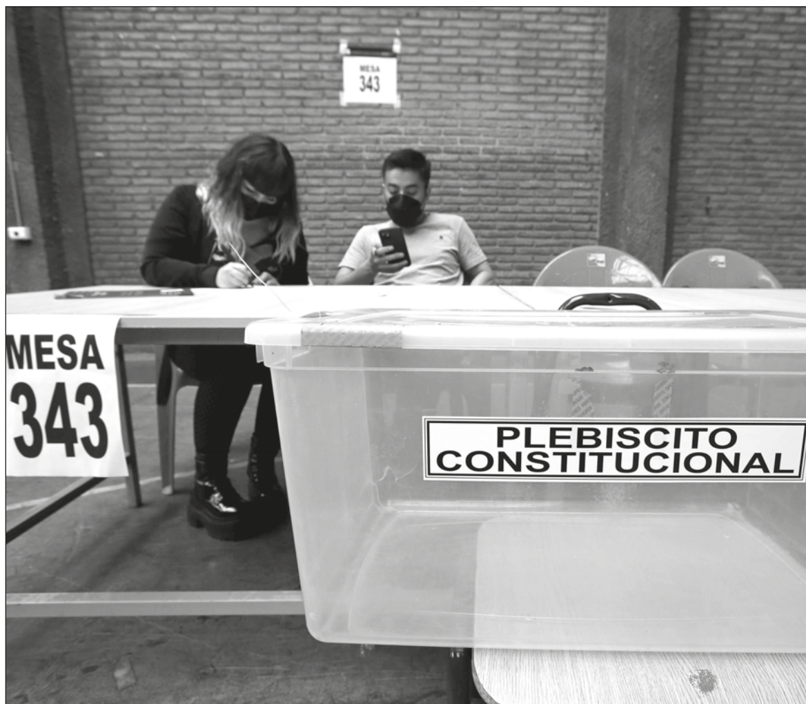
▲ “La derrota de esa izquierda, reivindicatoria del allendismo, fue notablemente mayor a las estimaciones. Esa izquierda debería leer, entender y atender con mucho cuidado el 61.9 contra la nueva Constitución”.

EN EL FONDO, la batalla chilena fue entre los grupos de derecha, que promovieron la idea de repeler el comunismo y el castrochavismo, y el movimiento progresista llegado al poder federal, pero aherrojado por el aparato