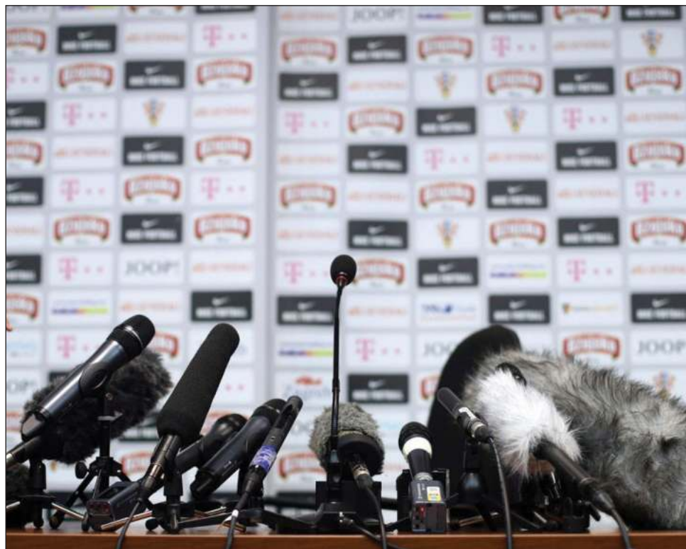
▲ Meyajo'ob ku beeta'al ti'al u k'a'aytal péektsilo'obe' tu bin u k'éexel; máaxo'ob beetike' unaj xan u kaniko'ob u jeel ba'alob ti'al u xímbal meyaj tu beel.

Rosental Alves: Jxaak'al ts'aaj péektsilo'obe' mantats' tu bisiko'ob talamil ichil América Latina, yáax táanile' tumen te' petlu'uma' anchajan ka'ap'éeel jejeláas jts'aaj péektsilo'ob: le ku ta'akajo'obo' (ich inglesé lapdog) yéetel jkalaano'ob (Watchdog).