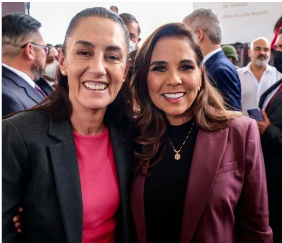
▲ A la toma de protesta acudieron personajes como el secretario de Gobernación, Adán Augusto López, y la jefa de gobierno de la Ciudad de México, Claudia Sheinbaum.

A la toma de protesta acudieron los secretarios de Gobernación, Adán Augusto López; de Relaciones Exteriores, Marcelo Ebrard, y la jefa de gobierno de la Ciudad de México, Claudia Sheinbaum, funcionarios del gobierno federal, gobernadores en funciones y electos, así como autoridades y ciudadanos que celebraron el inicio de una nueva etapa para Hidalgo, en la que se pondrá al centro de las decisiones a los seres humanos.