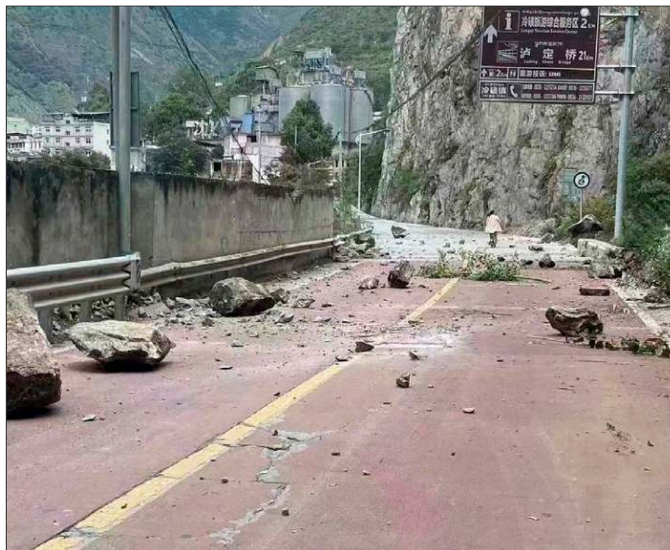
▲ El movimiento telúrico afectó la zona montañosa de la provincia de Sichuan.