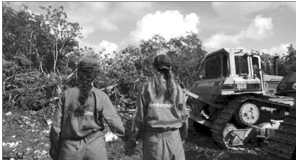
▲ Greenpeace instó a las autoridades federales a dejarse de "simulaciones y protejan la Selva Maya", en los tramos del ferrocarril que atraviesan Quintana Roo.

La organización explicó que, junto a especialistas, revisó "minuciosamente" las Manifestaciones de Impacto Ambiental (MIA) de estas rutas y encontró que, una vez más, "el Fondo Nacional de Fomento al Turismo (Fonatur) presenta información insuficiente, falsa y poco