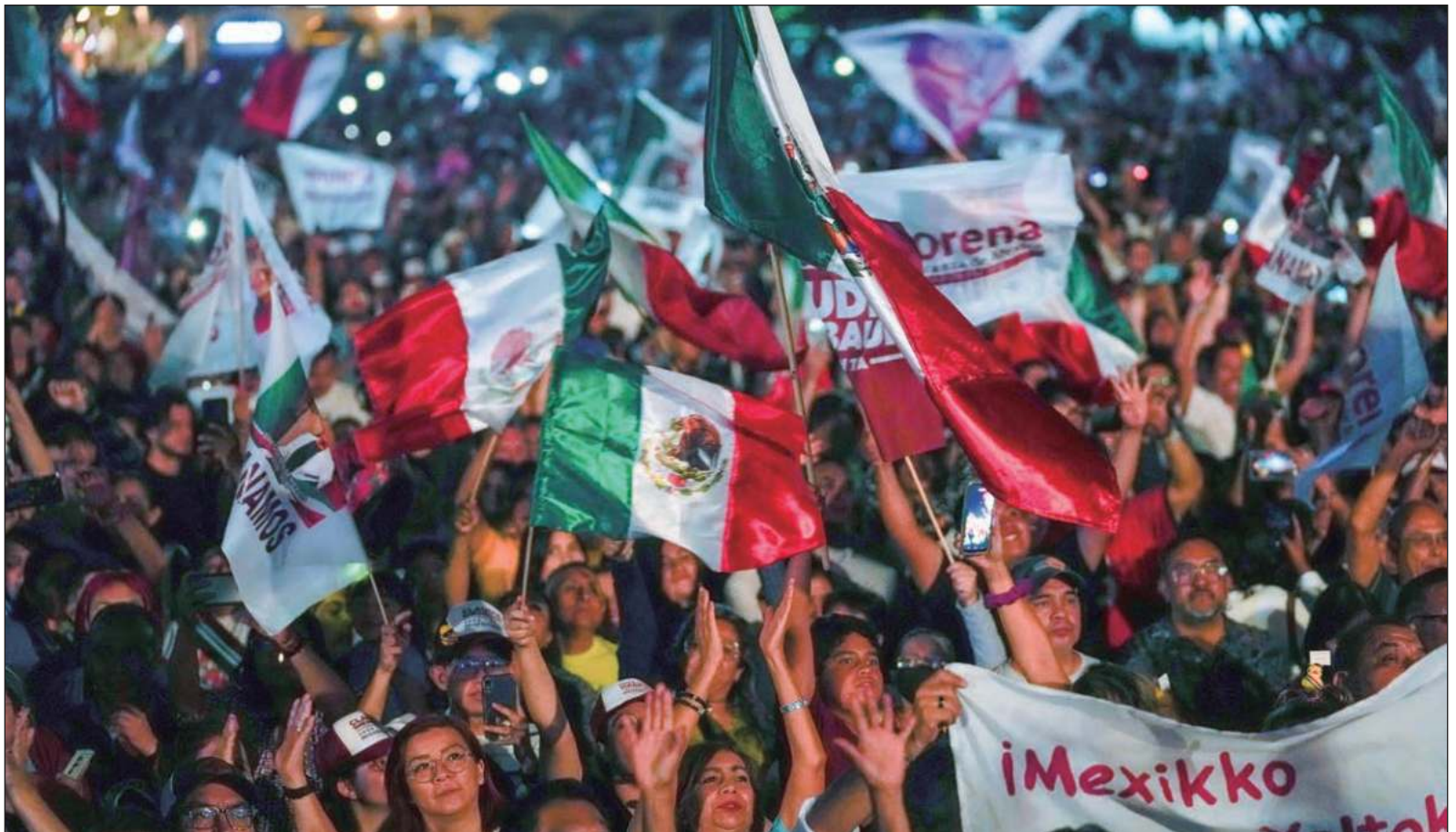
▲ "Por Sheinbaum votaron la mayoría de hombres, mujeres, personas con menores ingresos, los de mayores ingresos, clasemedieros, profesionistas".