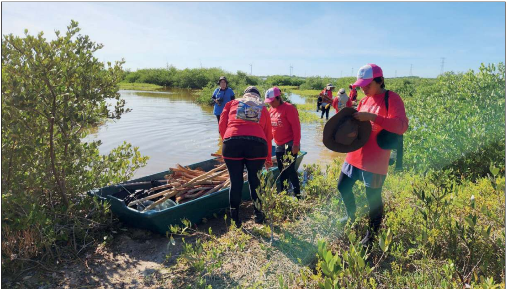
▲ En el voluntariado se harán las actividades de desazolve de canales, así como su apertura, colecta de basura, y observación de aves. Se recomienda llevar zapatos que se puedan ensuciar o mojar; camisa de manga larga y gorra; protector solar y repelente; guantes y pala (de ser posible).

Algunas de las partes negativas respecto a esta labor, es el poco apoyo del gobierno. Para subsanar estas faltas, el Cinvestav ha conseguido recursos como del Programa de Pequeñas Donaciones del Programa de las Naciones Unidas para el Desarrollo (PNUD), que asigna un monto para estos trabajos.