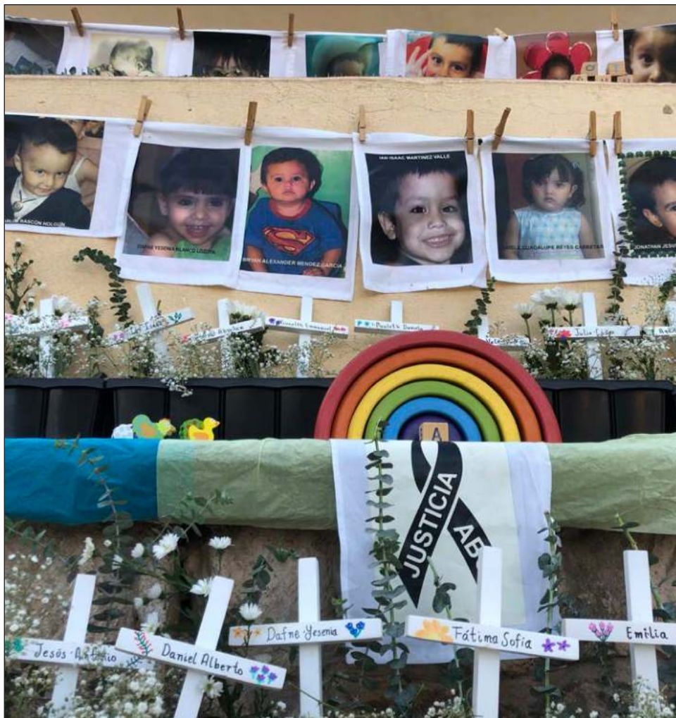
▲ Las 24 niñas y los 25 niños que perdieron la vida el 5 de junio de 2009 durante el incendio en la guardería ABC tenían entre cinco meses y cinco años de edad.

La organización invitó a la ciudadanía a reflexionar sobre la importancia de garantizar un desarrollo adecuado para la primera infancia y crear espacios que no vulneren sus derechos.