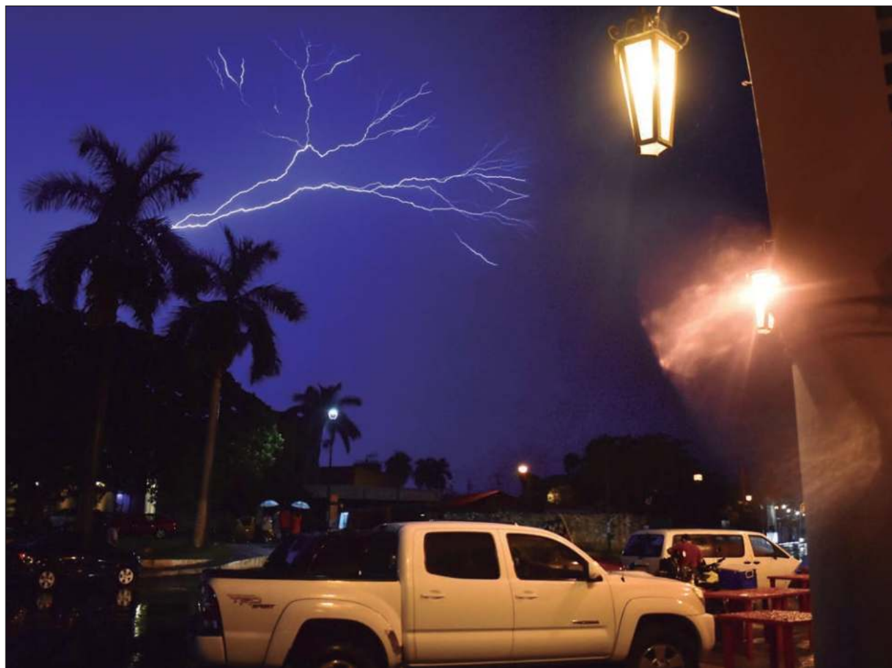
▲ El pasado 1 de junio inició la temporada de ciclones en la región del Atlántico, por lo que las autoridades hicieron un llamado a la población a estar atenta a los avisos y boletines meteorológicos, así como tomar las medidas de mitigación necesarias.

Autoridades ofrecen curso mensual del Sistema de Alerta Temprana para Lluvias y Ciclones