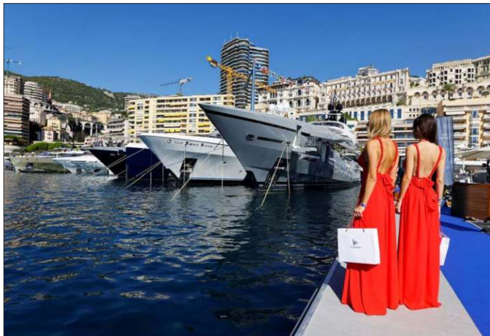
▲ El número de ricos en el mundo, que para Capgemini son aquellos cuyo capital disponible supera el millón de dólares, aumentó en un año un 5.1%, hasta alcanzar los 22.8 millones en 2023, indicó el gabinete en su estudio, titulado World Wealth Report .

El aumento de estas riquezas obedece, sobre todo, al crecimiento en las Bolsas de todo