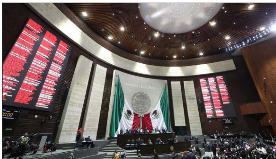
▲ Si los números son confirmados, los diputados de Morena y sus aliados podrán aprobar reformas constitucionales sin la necesidad de los votos de la oposición.

La Secretaría de Gobernación presentó en la rueda de prensa diaria del presidente Andrés Manuel López Obrador un informe sobre los resultados del PREP, sistema del Instituto Nacional Electoral