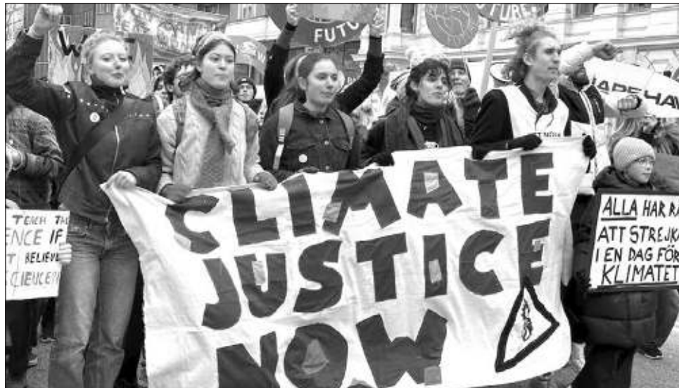
▲ Miles de científicos y expertos coincidieron en el Acuerdo de París (firmado en 2015) que limitar el aumento de la temperatura promedio global anualmente a no más de 1.5 grados Celsius ayudaría a evitar las peores consecuencias ambientales y a mantener un clima habitable.

De hecho, el alto representante de la ONU ha adelantado que la OMM infor-