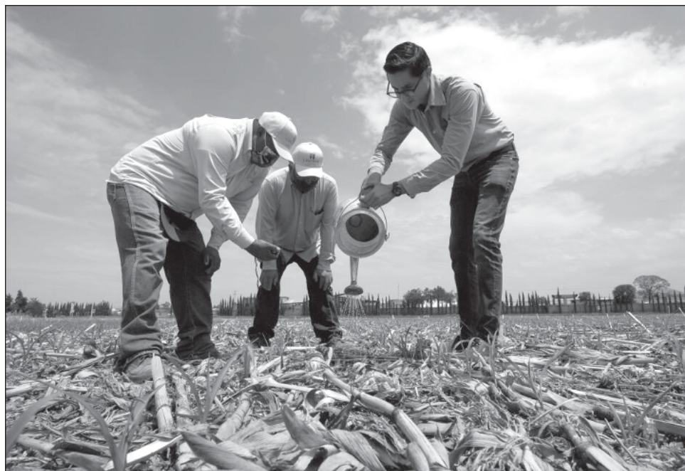
▲ Adoniram Sanches, coordinador subregional de FAO en Mesoamérica, puntualizó que “algunos métodos agrícolas, forestales y pesqueros causan pérdidas de biodiversidad en el mundo”, y que “los costos externos globales de estas malas prácticas pueden ser considerables”.

El funcionario de FAO resaltó la importancia de utilizar más métodos de producción