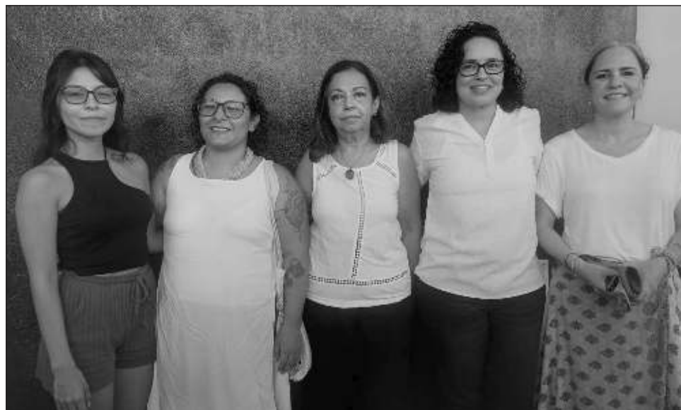
▲ Ha habido un incremento en denuncias de violencia de género en la entidad: hay más cultura y las autoridades identifican mejor los casos: Gobernanza MX.

“El feminicidio, que antes ni siquiera era un delito o al menos no de tipo penal en Quintana Roo, desde que se identificó como grupo penal hace unos 10 años aproximadamente, ya tenemos un mayor seguimiento de ese fenómeno; nos llama la atención que también están au-