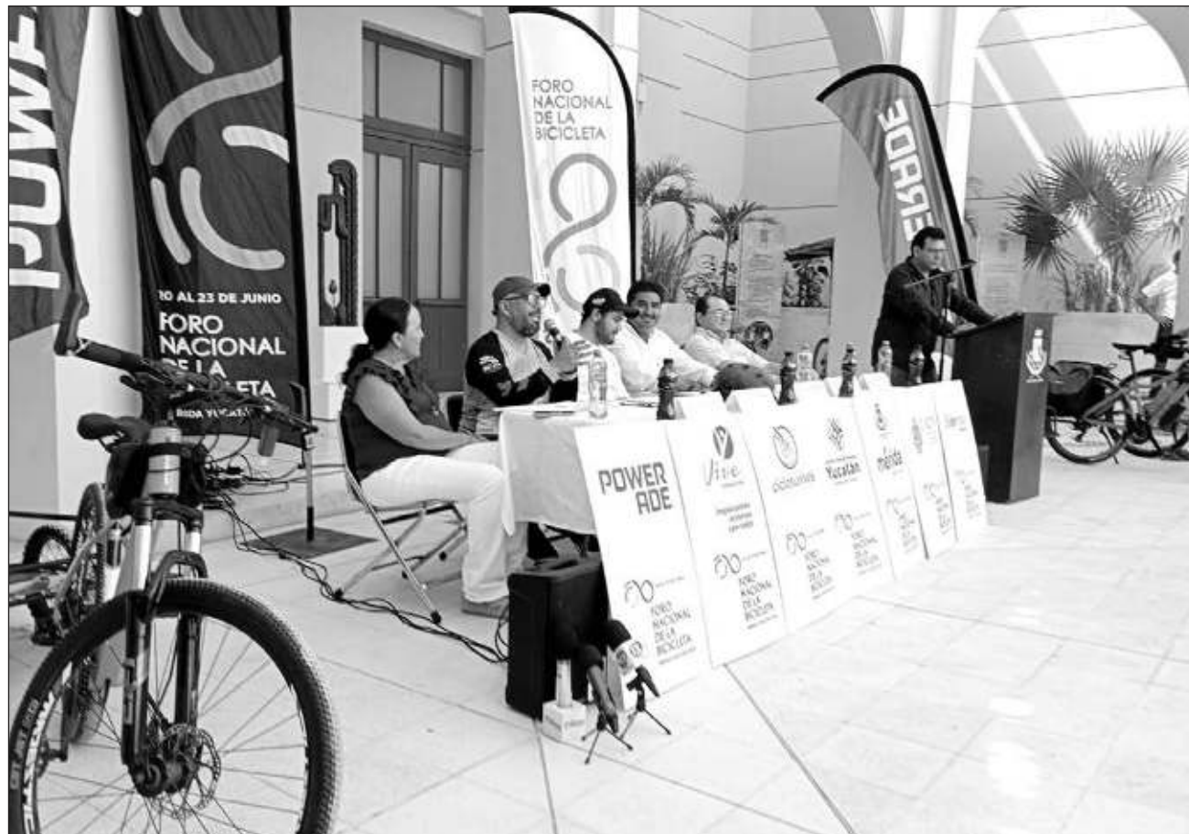
▲ Dentro de las sedes donde se desarrollarán las actividades del foro está la sala de conciertos del Palacio de la Música, la Universidad de la Artes de Yucatán (UNAY), el Edificio Central de la UADY, entre otras.

La iniciativa es impulsada por varias empresas, instituciones y asociaciones civiles como Powerade, Bepensa, Fundación Vive, el Gobierno del estado de Yucatán y el ayuntamiento de Mérida, así como la UADY y Cicloturixes. Dentro de las sedes donde se desarrollarán las actividades