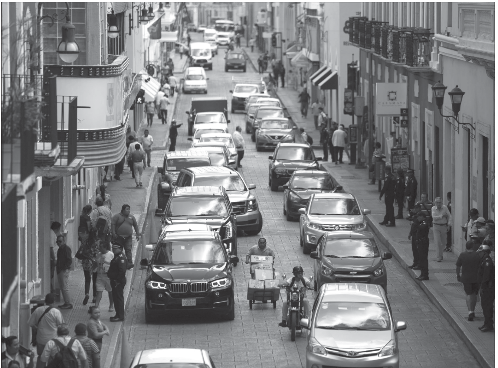
▲ A nivel nacional van 45 mil 103 automóviles robados en los primeros cuatro meses de este año; la cifra negra tiene un margen corto.

La cifra negra en este registro, es decir, los robos no denunciados, tiene un margen corto debido a que los autos robados llegan a ser utilizados para actividades delictivas y es responsabilidad del dueño sobre el que tenga el registro el auto.