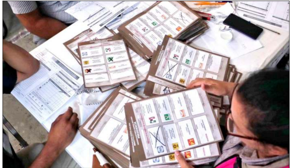
▲ "Estamos seguros del resultado y de que hubo, como todos lo vieron, una elección libre, pacífica y democrática", señaló la virtual presidenta electa.

Recordó que inició el proceso de cómputo distrital, donde los candidatos que