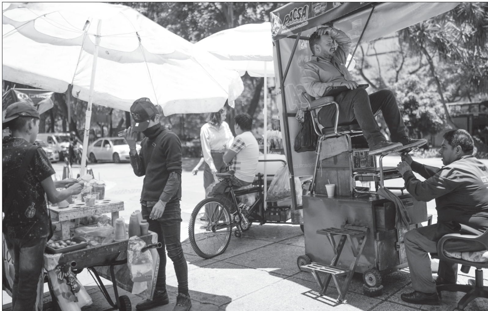
▲ “Debemos poner los pies bien firmes en la tierra para así poder palpar las necesidades inmediatas de nuestros pueblos, ya sea de forma interna o externa, ya que México debe continuar tejiendo lazos de unidad latinoamericana mientras pone freno a la injerencia imperialista”.