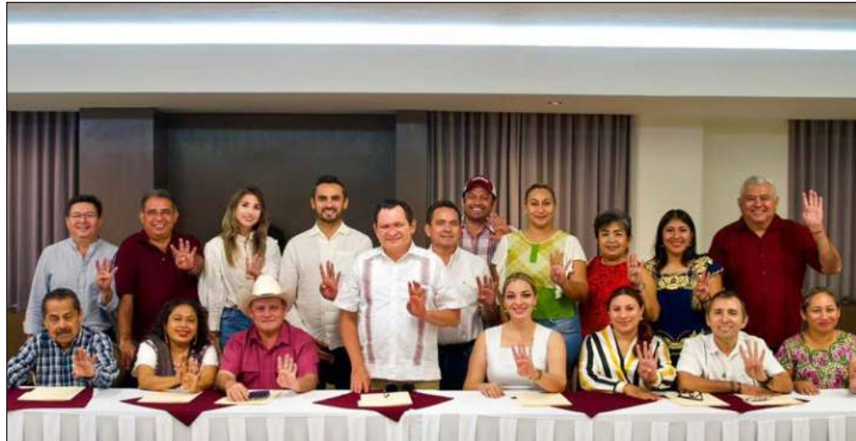
▲ Los futuros legisladores agradecieron al gobernador electo por el respaldo que les dio al caminar con ellos por todo el territorio yucateco y ayudarlos a convencer a la ciudadanía.

El próximo gobernador de Yucatán estableció una mesa de trabajo con las y los 16 virtuales diputados de MORENA, PT y PVEM quienes serán representantes del pueblo en la próxima legislatura del congreso del estado.