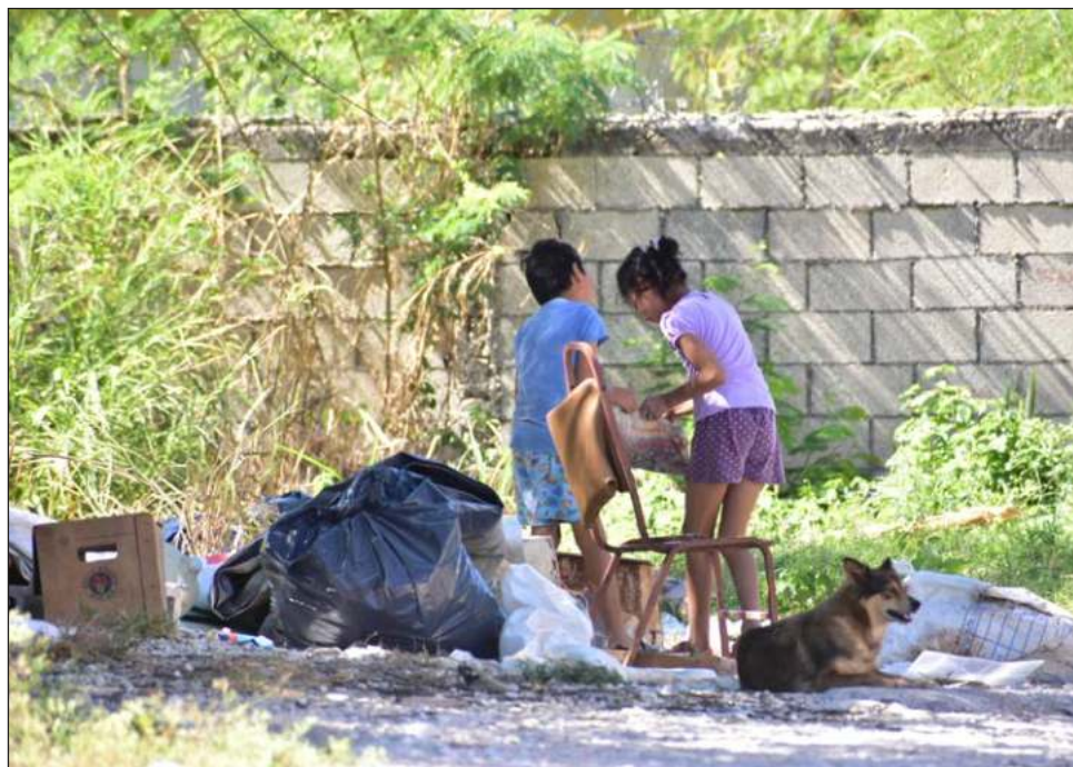
▲ La semana pasada, el Congreso aprobó la reforma que busca sancionar el matrimonio infantil o la cohabitación forzada, un delito que se castiga hasta con 15 años de cárcel.

“Casi siempre es contra su voluntad, porque es cambiada por algún bien para la familia, ‘llévatela porque nosotros estamos en pobreza a lo mejor tú nos puedes ayudar económicamente’ o porque es la situación comunitaria normalizada o porque hay crimen organizado involucrado, entonces hay