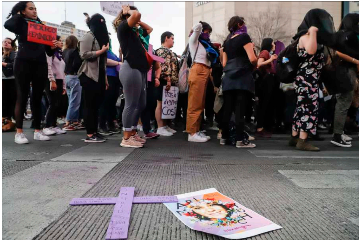
▲ “Será clave que, al revisar los delitos del pasado, que fueron clasificados como homicidio, se reconozca en las sentencias que se trata de feminicidios desde la perspectiva que se incluye ya en los códigos penales”.