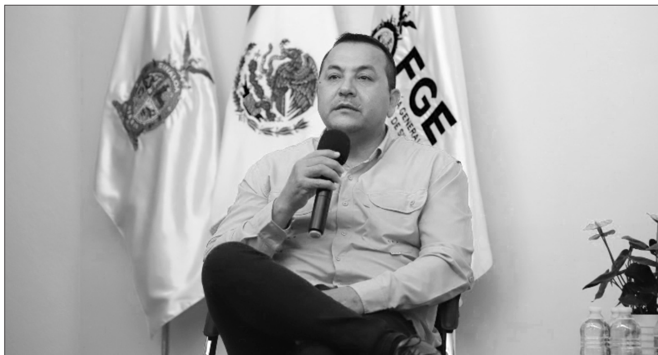
▲ Dámaso Castro es uno de las 10 mexicanos que el gobierno de Estados Unidos señaló por presuntos vínculos con Los Chapitos .

La Fiscalía General del Estado de Sinaloa confirmó que Dámaso Castro Zaavedra, vicefiscal general del estado, presentó una licencia sin goce de sueldo al cargo que ocupaba desde 2021 y manifestó que se pondrá a disposición para atender cualquier requerimiento institucional que le sea formulado por las vías legales. El funcionario es uno