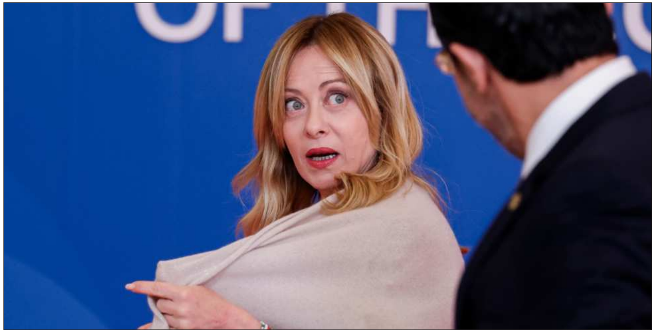
▲ "Verificar antes de creer, y creer antes de compartir. Porque hoy me pasa a mí, mañana le puede pasar a cualquiera", subrayó Meloni.

También mostró el mensaje original del usuario que distribuyó el contenido -cuyo nombre fue pixelado-, en el que se leía: "Que una primera ministra