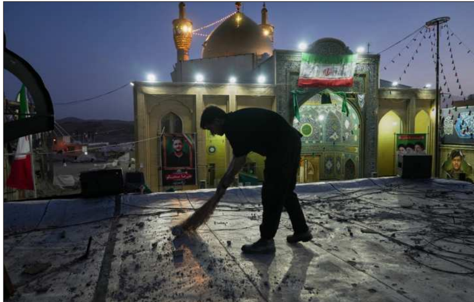
▲ La guerra que estalló en febrero con ataques israelíes y estadounidenses contra Irán.

El petróleo subió el lunes en el comercio asiático con un alza de 1.86 por ciento en