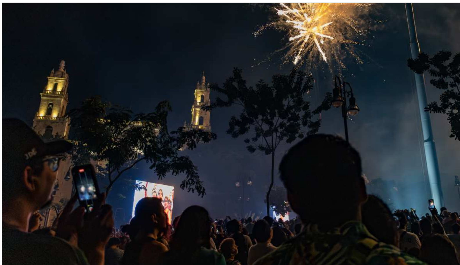
▲ "La gente espera las vacaciones de Semana Santa y la de Pascua, para volar destapados a la playa. Lo ideal sería darnos el tiempo de reflexionar".