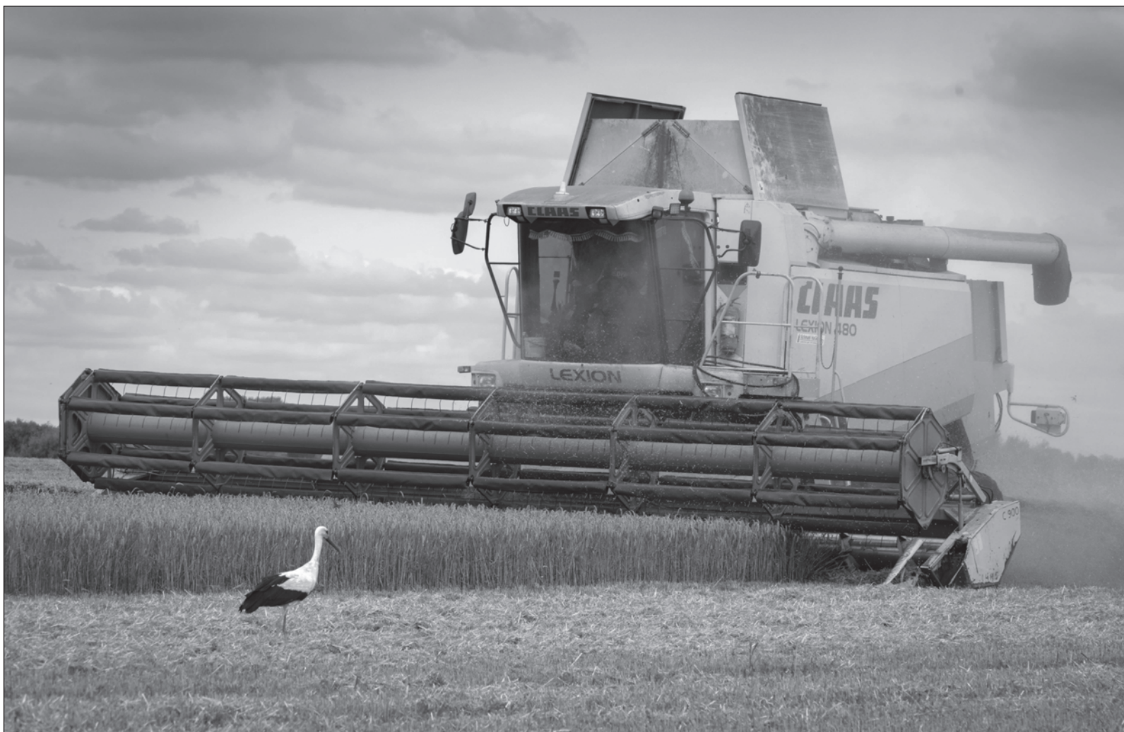
▲ "La demanda alimentaria de un planeta con casi 8 mil millones de habitantes no debe ser justificación para continuar la dependencia a energía fósil".