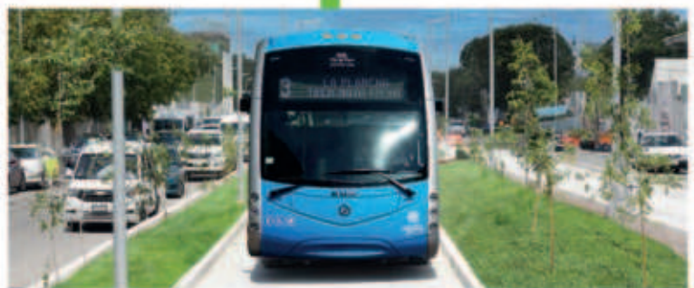
Construcción de vías en donde transitarán las unidades del IETRAM, además de construcción de banquetas y guarniciones, señalética, sistema de iluminación y pozos pluviales.