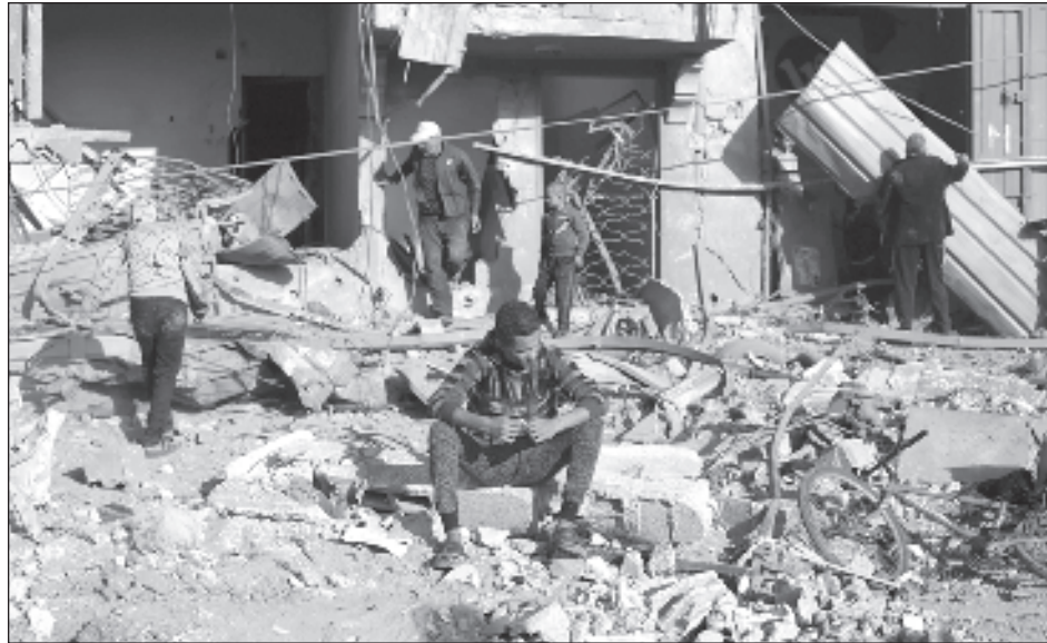
▲ "Debido al estancamiento en las negociaciones, y siguiendo instrucciones del primer ministro, Benjamín Netanyahu, el jefe del Mosad, David Barnea, ordenó al equipo negociador en Doha que regrese a Israel", señala un comunicado del jefe de gobierno.

Según la fuente, Hamas tampoco está mostrando flexibilidad para liberar a más rehenes y "no respondió a las peticiones del gobierno