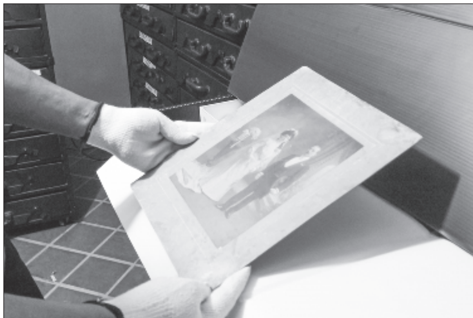
▲ Como parte de las celebraciones, se presentan las exposiciones Otros mundos , de Nicolás Niarchos, y Cámaras antiguas: Un recorrido por el tiempo .

La Fototeca de Veracruz se inauguró el 27 de noviembre de 1998. Conserva archivos de gran relevancia, como el fondo Casasola, y algunas copias de la fotógrafa Mariana