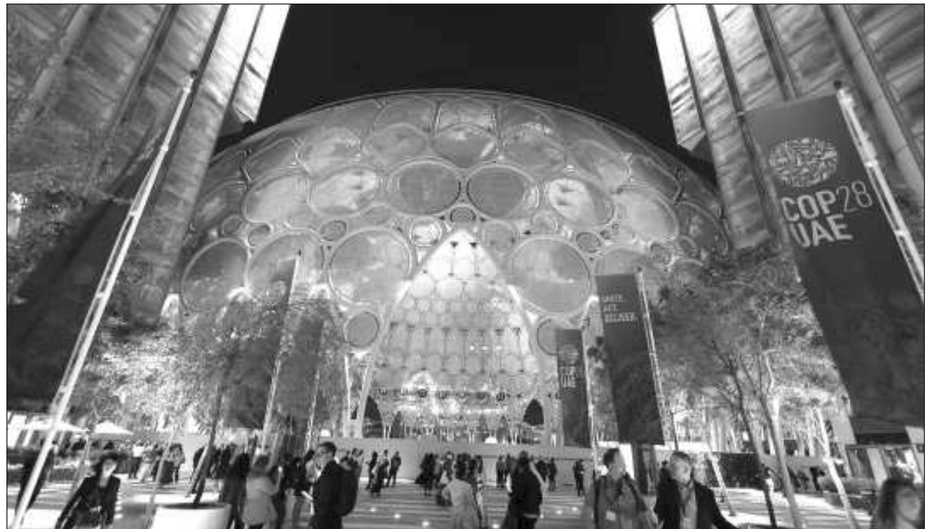
▲ En el encuentro, el gobernador Mauricio Vila será orador para la Cumbre de Acción Climática Local.

Además se busca compartir experiencias y lecciones aprendidas con otros gobiernos subnacionales de otros países para identificar nuevas