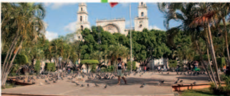
Realizaremos la remodelación de la Plaza Grande