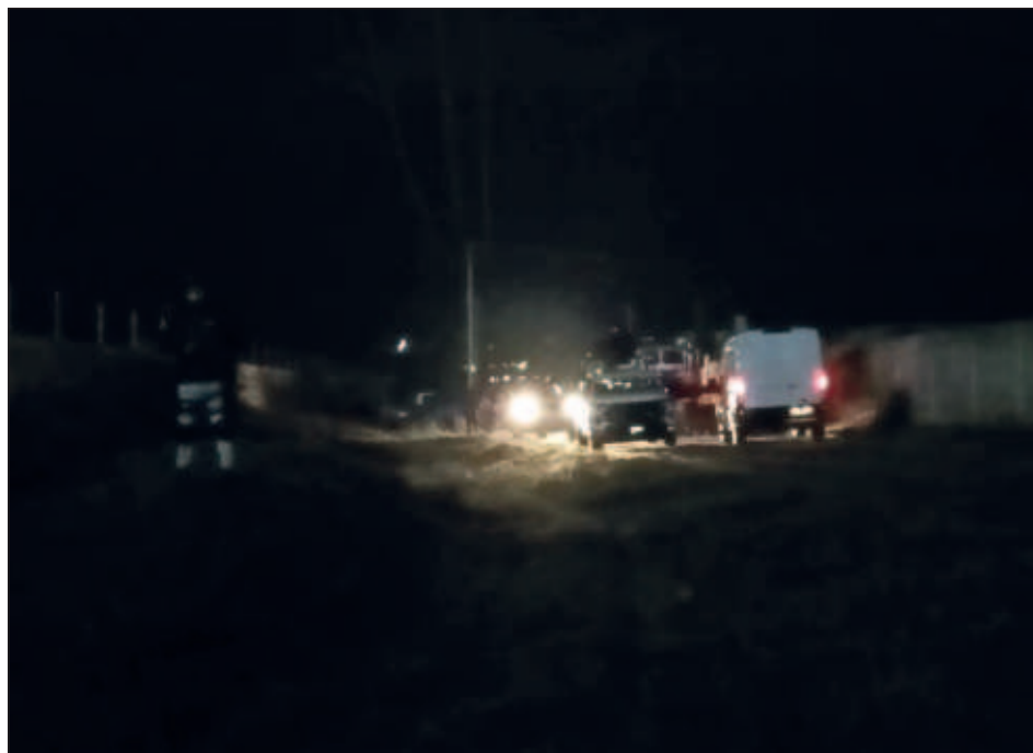
▲ Los cuerpos sin vida de los jóvenes fueron localizados dentro de un auto en las inmediaciones del campus Celaya de la Universidad de Guanajuato.

Por otra parte, la Universidad de Guanajuato precisó que las víctimas no son estudiantes, ni trabajadores de la máxima casa de estudios.