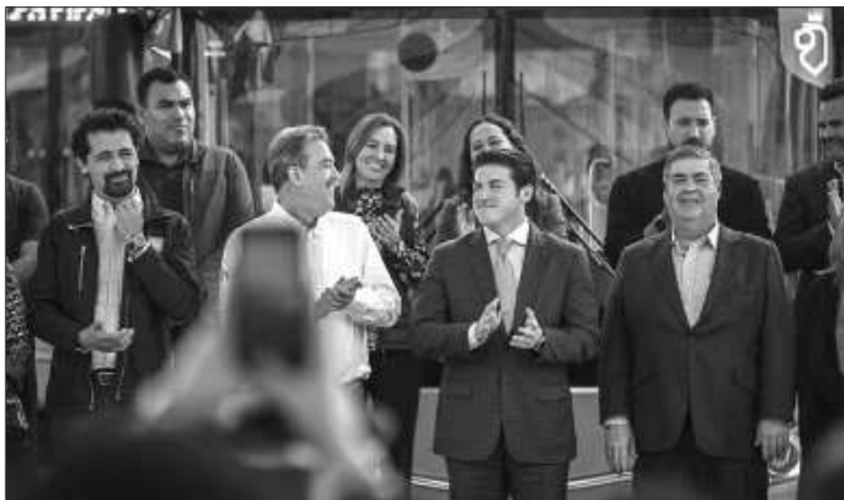
▲ AMLO cuestionó la embestida de la oposición en contra de García e hizo difundir el video en donde el ex aspirante presidencial denunciaba los excesos de los opositores.

Cuestionó la embestida de la oposición en contra de García e hizo difundir el video en donde el ex aspirante presidencial denunciaba los excesos de los opositores en