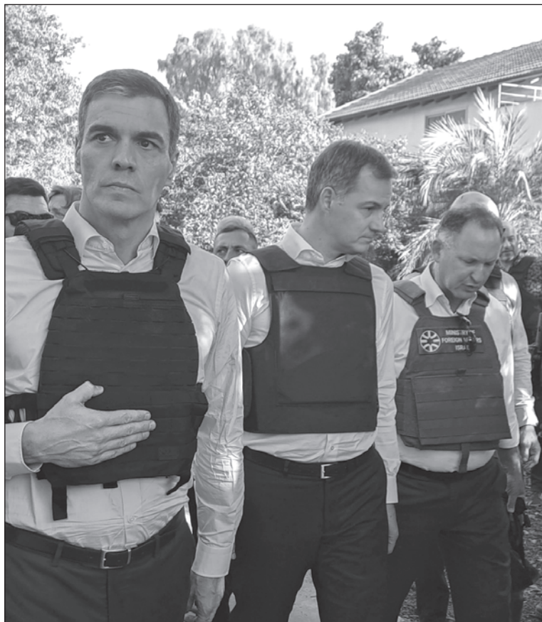
▲ "Spanish opposition parties and many observers criticized Sanchez for playing party politics with a sensitive international issue".

SPANISH OPPOSITION PARTIES and many observers criticized Sanchez for playing party politics with a sensitive international issue. Mr. Sanchez's cabinet includes a Minister of Youth born in the Palestinian territory. She strongly and publicly supported Hamas's terrorist action the day after it