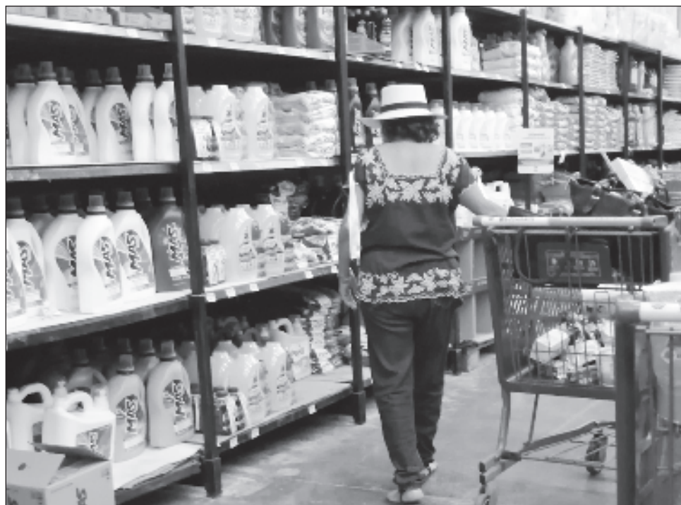
▲ El consumo de bienes de origen importado creció 1.8 por ciento, mientras que los nacionales crecieron 0.8 por ciento, según el IMPC del Inegi.

Por componente, en septiembre de este año y con datos ajustados por estacionalidad, el consumo de