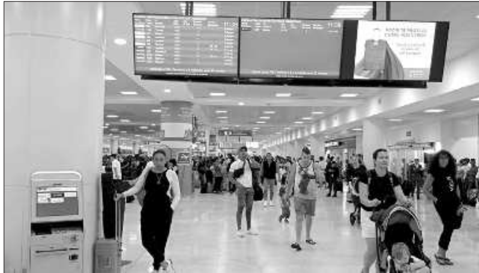
▲ En los primeros diez meses del año, la llegada de turistas estadounidenses vía aérea alcanzó 11 millones 21 mil, superando 3.4 por ciento más lo registrado en enero-octubre de 2022.

Durante enero-octubre de 2023, al aeropuerto de Cancún arribaron 8 millones 157 mil turistas internacionales, un incremento de 5 por ciento respecto a los primeros diez meses de 2022; al AICM llegaron 3 millones 501 mil turistas, 1.7 por ciento más respecto al periodo enero a octubre de 2022; y el aeropuerto de Los