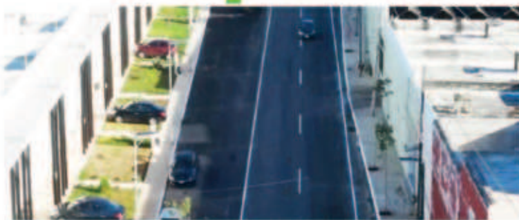
Construcción y repavimentación de más de 3.8 kilómetros de calles que abarcan la 46, 43 y 55. Adicionalmente se realizará la construcción de banquetas y guarniciones, señalética, sistema de iluminación y pozos pluviales.