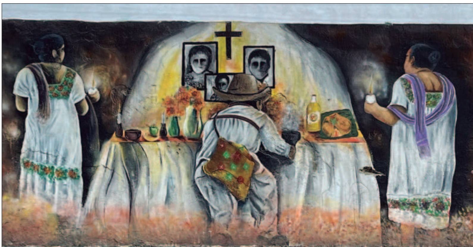
▲ "A pesar de que existen una gran variedad de tradiciones funerarias en todo el mundo, por lo general, todas ellas requieren ciertas normas".