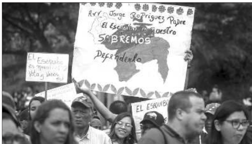
▲ CNE aseguró que se trató de una "participación sin precedentes", con la que el pueblo venezolano expresó su "voluntad absoluta" en la defensa de la zona disputada, rica en recursos naturales.

Amoroso precisó, en su primer boletín de resultados, que hubo una participación de más de 10 millo-