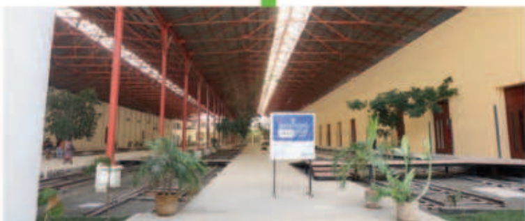
La Universidad de las Artes, UNAY, que ahora es la más importante del sureste del país, se está ampliando para aumentar su capacidad y recibir hasta 2 mil alumnos.

ESTAS SON LAS NUEVAS OBRAS QUE GENERAN GRANDES BENEFICIOS PARA TI Y TU FAMILIA