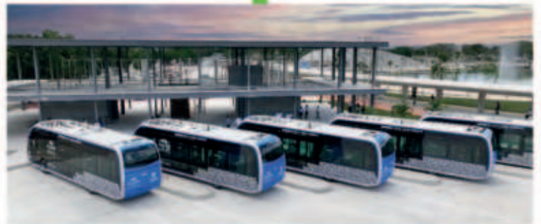
Se construye la estación del IETRAM en el Parque la Plancha, para 3 rutas de este transporte público 100% eléctrico y único en su tipo en Latinoamérica.