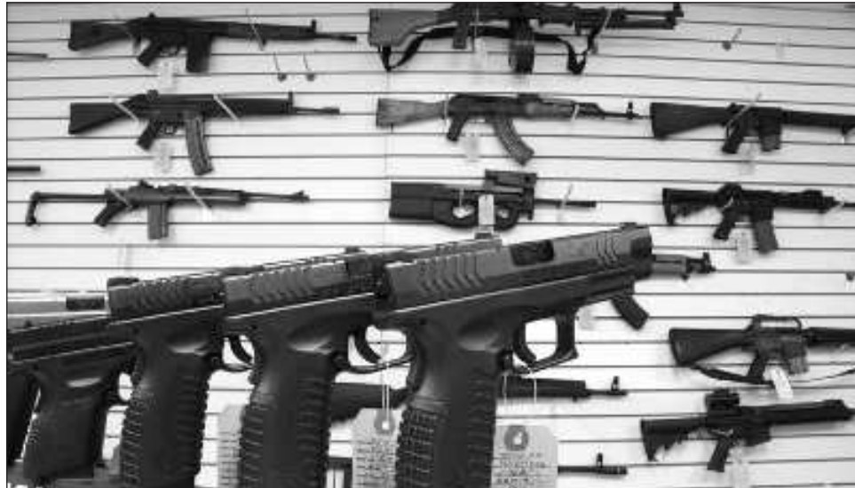
▲ Desde el inicio de la Operación Southbound, el número de investigaciones sobre tráfico de armas de fuego hacia México ha aumentado 40% y el número de incautaciones subió 11%.

“Reconocemos, el presidente Biden y yo también que, para confrontar, combatir este tráfico de armas se necesita trabajar como socios. También el presidente López Obrador lo ha dicho, que ese es parte del reto”, sostuvo ante los participantes en la reunión, donde asistieron funcionarios de las secretarías de Seguridad y Protección Ciudadana (SSPC), de