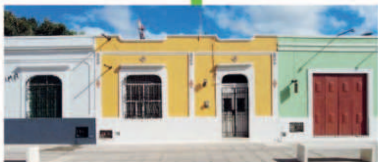
El Ayuntamiento de Mérida invirtió en la pintura en las fachadas de las viviendas que rodean al Parque de la Plancha.