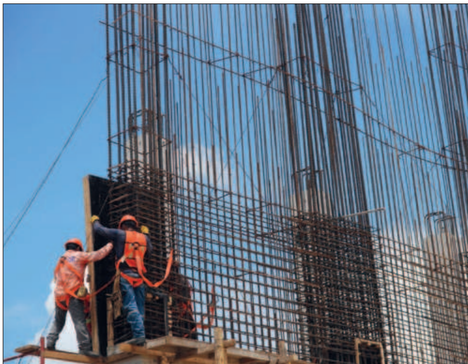
▲ La encuesta del Inegi revela que en cuanto a generación de empleos, el año pasado fueron registrados 553 mil, un aumento de 7.4 por ciento con respecto a 2021.

El objetivo de la EAEC es brindar estadísticas básicas sobre el comportamiento económico de las principales variables del sector Construcción del país.