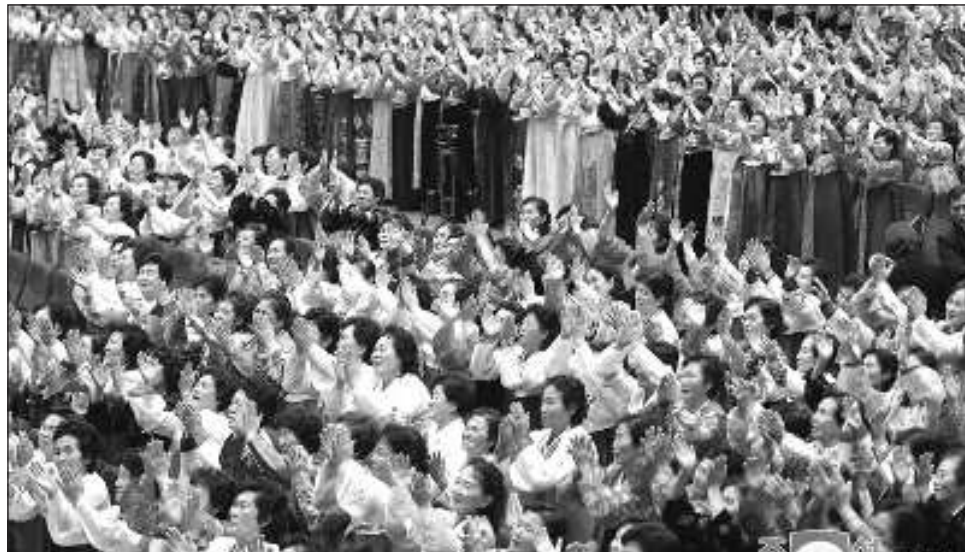
▲ La tasa de fertilidad en el país cayó de forma brusca tras una hambruna a mediados de la década de 1990 que se estima mató a miles de personas, indicó el Instituto de Investigación Hyundai.

“Detener el declive de la tasa de natalidad y pres-