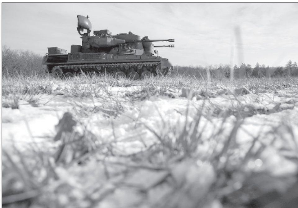
▲ El republicano Mike Johnson insistió en que los republicanos quieren supeditar cualquier ayuda a Ucrania a cambios reales en la política estadounidense a lo largo de la frontera sur con México para poner freno a la llegadas de inmigrantes ilegales.

Insistió asimismo en que los republicanos quieren supeditar cualquier ayuda a