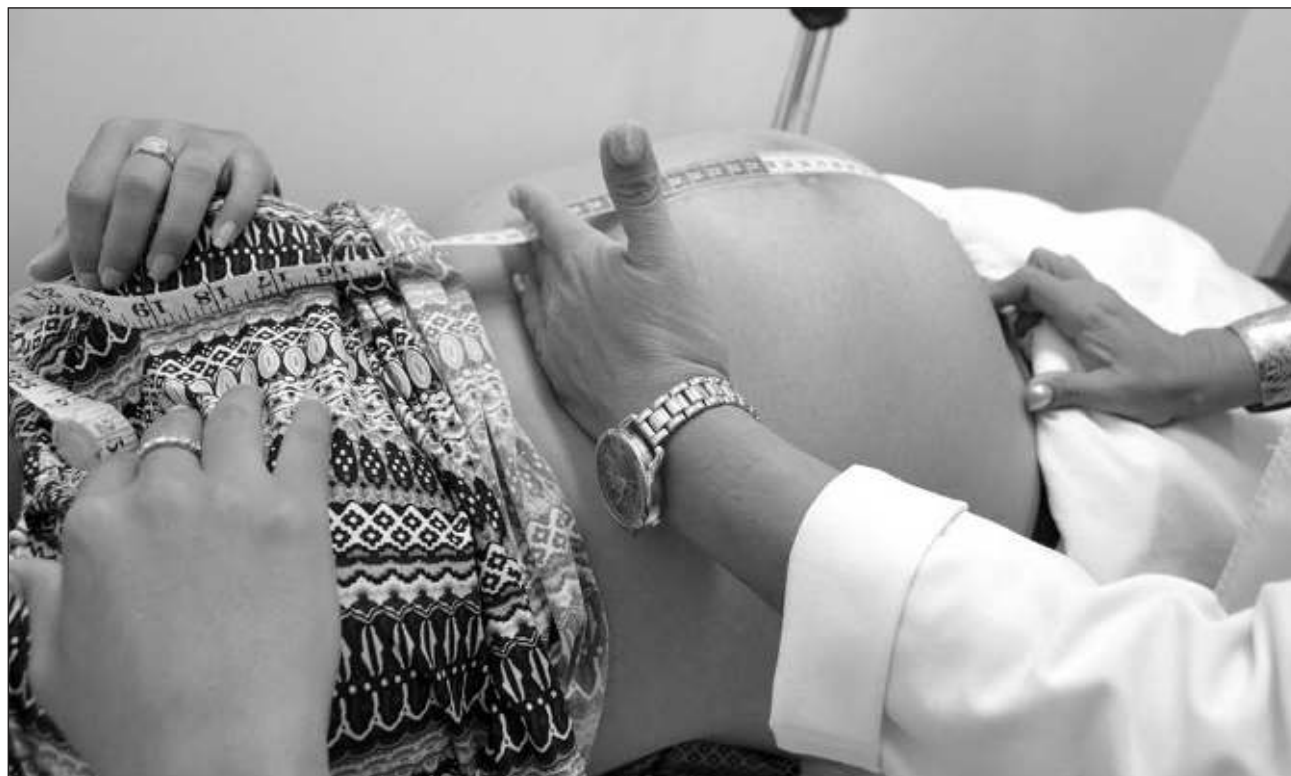
▲ ENDIREH 2021 indica que el maltrato en la atención obstétrica entre las mujeres en los últimos cinco años fue mayor en quienes se sometieron a una cesárea con 45.2 por ciento, y 28.4 por ciento en mujeres que tuvieron un parto natural.

De las mujeres que sufrieron maltrato durante su cesárea, según detalla el INEGI, el 33 por ciento fue víctima de tratamientos médicos no autorizados y el 27 por ciento de maltrato psicológico y/o físico. En tanto, las mujeres que tuvieron un