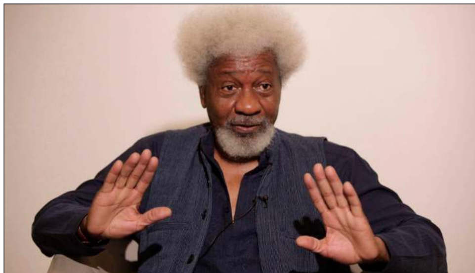
▲ El autor nigeriano de 88 años fue arrestado en 1967 por su militancia política y por las críticas que hizo al gobierno de su país, "la corrupción es una toxina de la que no nos libraremos", lamentó.

El primer escritor africano en recibir el Nobel de Literatura, en 1986, afirmó que la única literatura que puede tener significado e influencia sobre cómo se concibe al poder es la ridícula, pues la sátira es un mecanismo de supervivencia de la sociedad. Sobre por qué la literatura puede ser tan amenazante, Soyinka respondió: "Así como el poder, la corrupción también es una toxina de la cual nunca nos podremos librar como sociedad. No tengo esperanza de que desaparezca, aunque combatir la corrup-