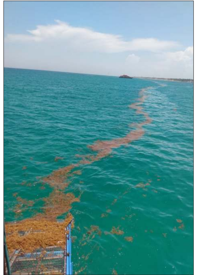
▲ El Instituto Oceanográfico del Golfo y Mar Caribe realizó una evaluación para cuantificar los recales que pudieran arribar a las playas del estado de Quintana Roo.

De esta manera, como resultado de un trabajo conjunto, la Semar, Semarnat, el gobierno del estado de Quintana Roo y sus municipios costeros reafirman su compromiso de implementar acciones de manera permanente que contribuyan a disminuir la arribazón de sargazo en las playas del Caribe mexicano, disponiendo de los recursos humanos, materiales y financieros necesarios en coordinación con los tres órdenes de gobierno, concesionarios y sociedad civil.