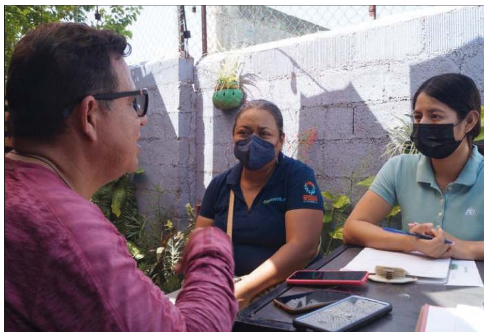
▲ Hay más desconocimiento de la importancia de recursos naturales y ecosistemas marino-costeros en el centro-sur del estado, quizá porque la población no se siente tan relacionada con ellos.