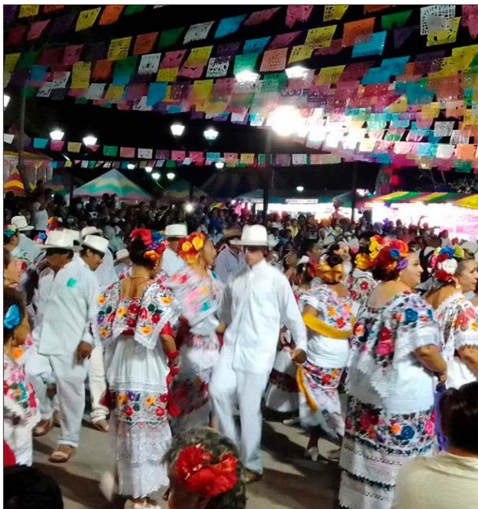
▲ Para la jarana no hay edad, ni condiciones. Eso sí, exige condición para zapatear hasta casi el alba, cuando se anuncia la llegada del ceibo, para marcar el fin de la vaquería.