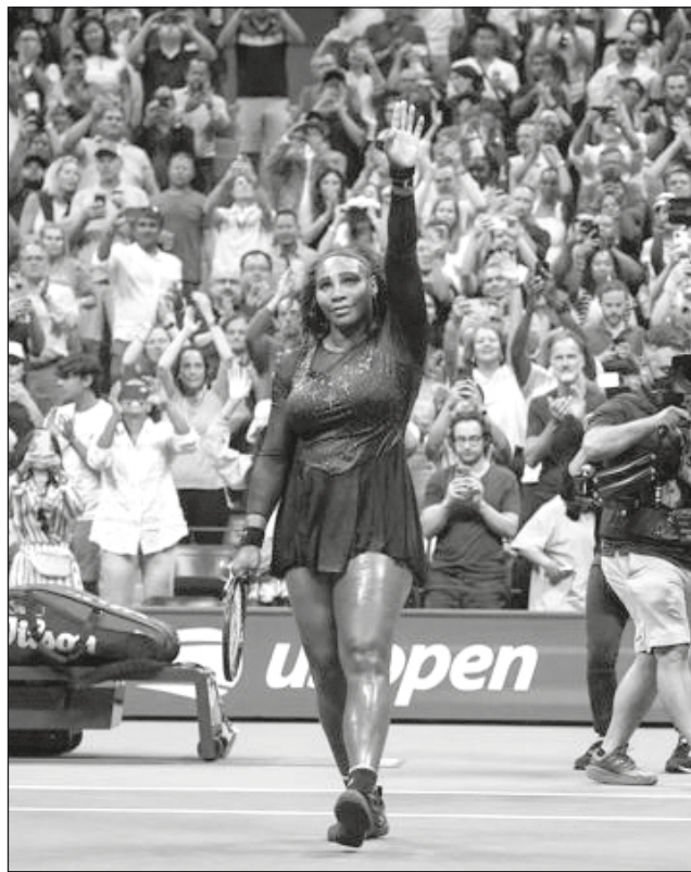
▲ Serena Williams, tras su duelo ante Ajla Tomljanovic, en la tercera ronda del abierto estadounidense.

Williams cumplirá 41 años este mes y dijo recientemente al mundo que está lista para