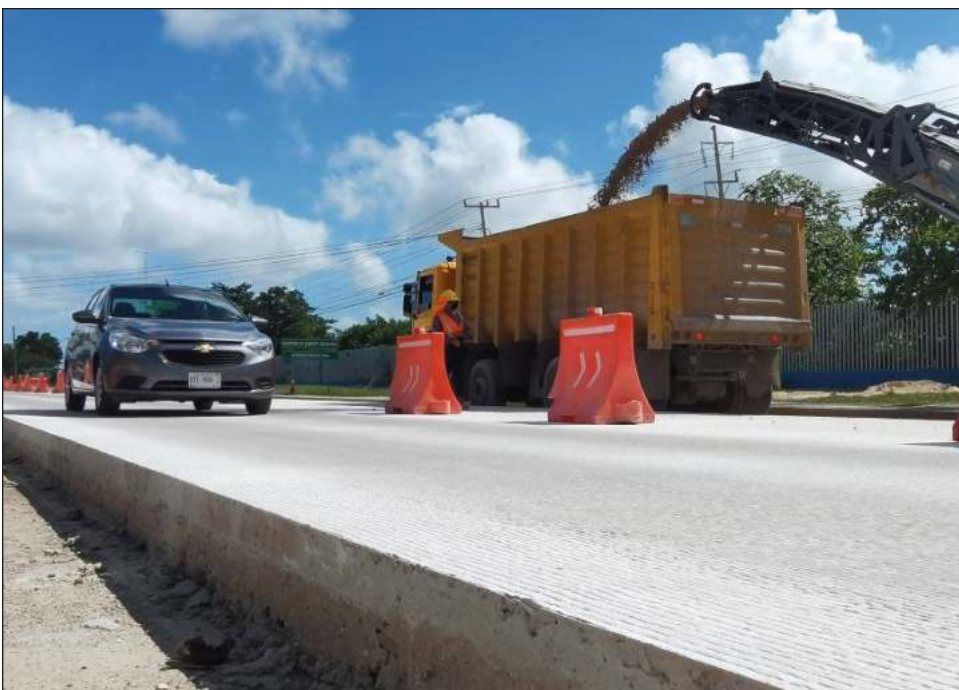
▲ Desorden, poca tolerancia y falta de cultura vial es lo que ha prevalecido durante el primer mes de obras en las inmediaciones del bulevar Colosio.

*Periodista ambiental, miembro de la Red Mexicana de Periodistas de Ciencia