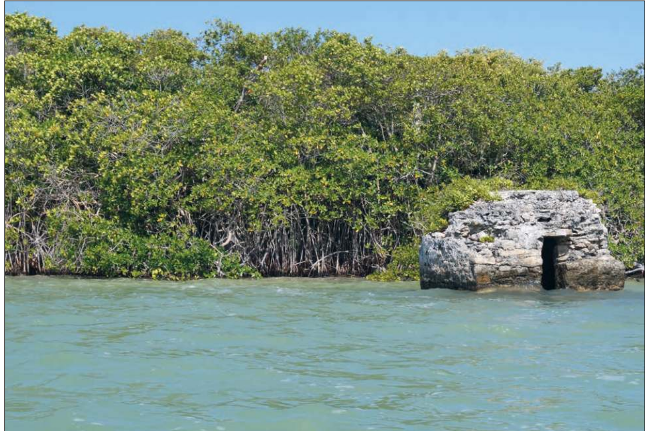
▲ Las entrevistas tomaron en cuenta a ciudadanos como pescadores, buzos, prestadores de servicios turísticos, docentes, investigadores, activistas, ONG's y servidores públicos de siete localidades de Quintana Roo.

Las entrevistas tomaron en cuenta a ciudadanos diversos,