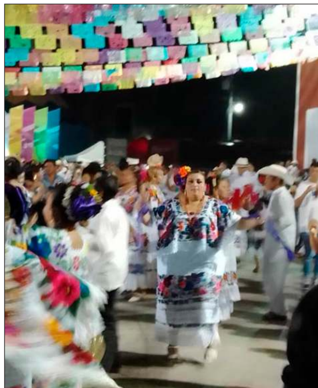
▲ Los bajos del palacio municipal recuerdan los versos de Aires del Mayab: "Vámonos a la jarana, vamos a ganar lugar, que hoy en la noche y mañana tenemos que zapatear"... Pero uno concluye que la canción está equivocada al decir "ponte tu terno bonito". Porque este atuendo, multicolor y sus finas puntadas, no puede ser menos que espectacular, y no se pone o se viste: se luce, y punto.