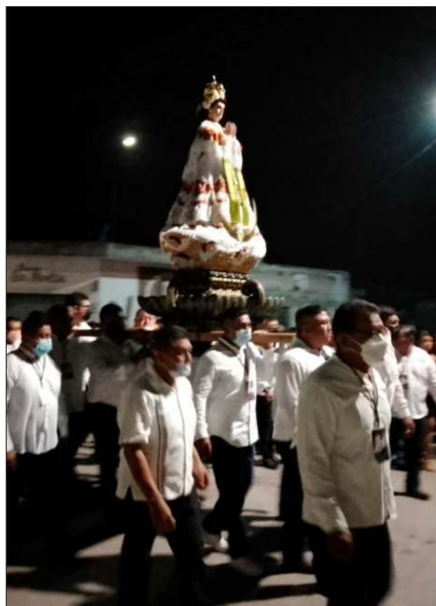
◀ El tronar de los voladores advierte, y las notas lastimeras del himno Oh, María se escuchan por las calles de Sucilá, Yucatán. Ya se acerca la procesión con la Virgen de la Natividad, cuya imagen encabeza la vaquería que da inicio a su fiesta tradicional, este 3 de septiembre. La festividad vuelve, después de dos años de no poder celebrarse. Este 2022 reunió a centenares de familias y visitantes.