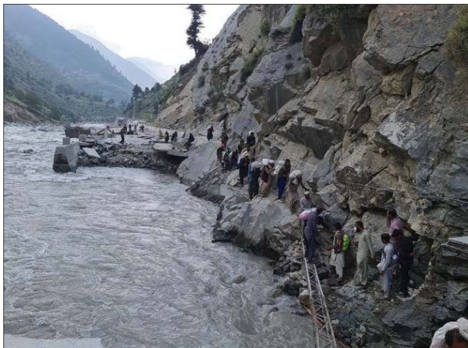
▲ Las inundaciones en Pakistán han dejado mil 300 muertos y millones de personas sin hogar. En la imagen, residentes atraviesan parte de la carretera destruida por las inundaciones en el Kalam.

Las autoridades habían abierto un hueco en el dique para permitir que escapara algo de agua y llegara al Indus, señaló el administrador del distrito