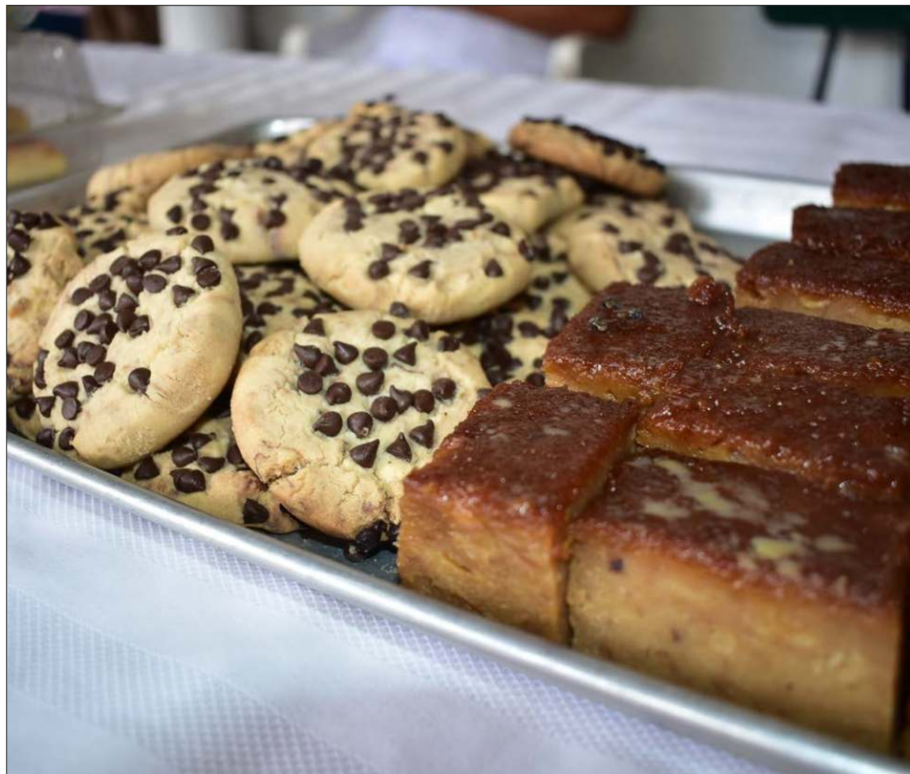
▲ La inflación en alimentos fue de 14.54 por ciento durante la primera quincena de agosto, y continúa con una trayectoria al alza; por ejemplo, se observó un incremento de 21 por ciento anual en el pan dulce.

En cambio, los estados con menor inflación fueron Querétaro (7.1 por ciento), Aguascalientes (7.5 por ciento), Ciudad de México (7.6 por ciento, Tabasco (7.8