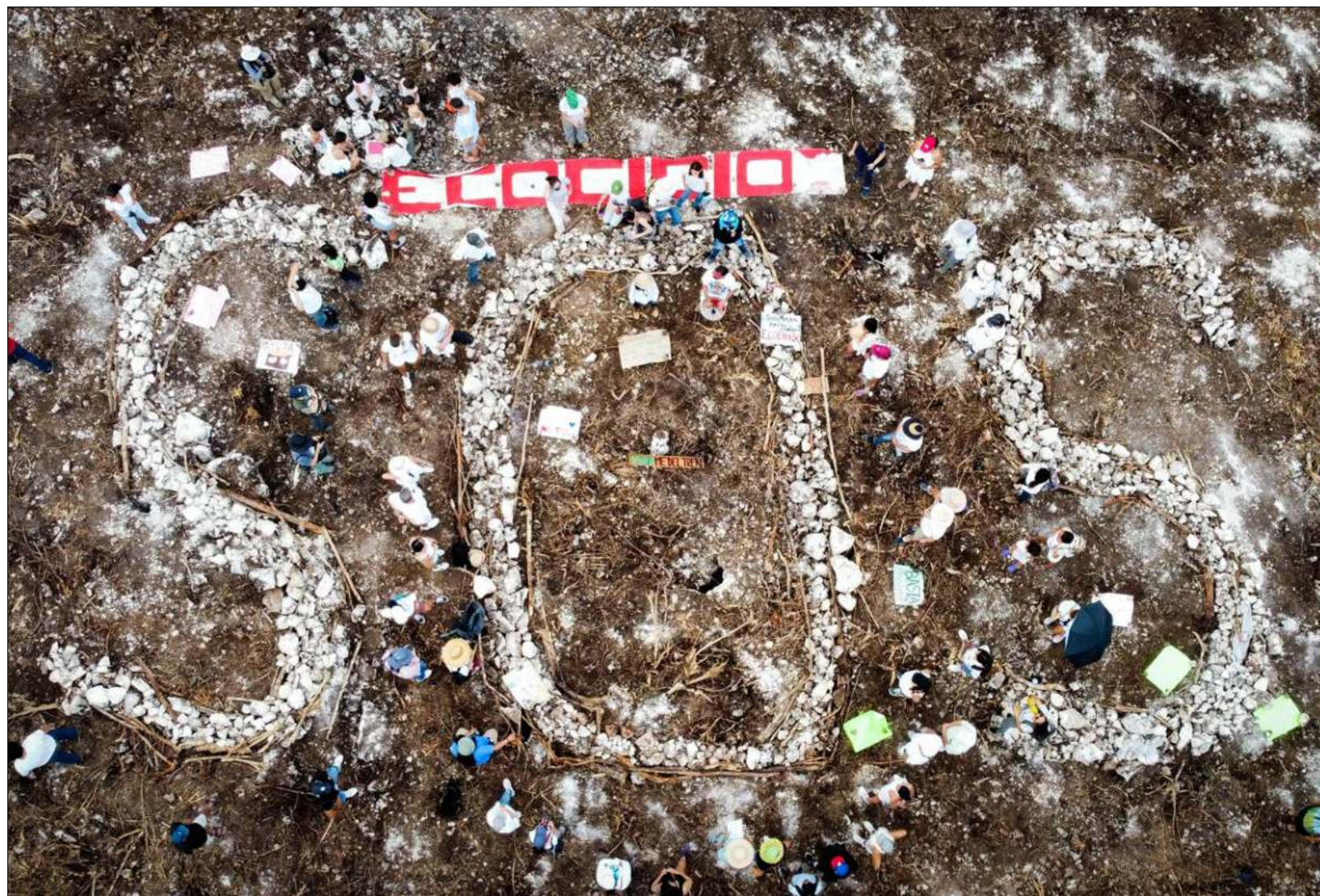
▲ Las sesiones se llevarán a cabo en X-Hazil, municipio de Felipe Carrillo Puerto en Quintana Roo, y Escárcega en Campeche.

El objetivo de la reunión es que Fonatur "informe y exponga los aspectos técnicos ambientales del documento, los posibles impactos y riesgos ambientales que se ocasionarían y las medidas de prevención y mitigación".