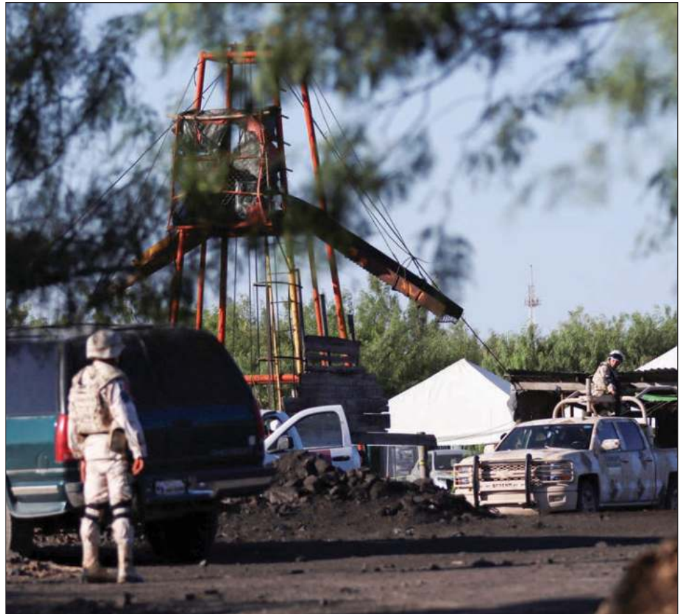
▲ Un derrumbe en la mina de El Pinabete dejó a 10 mineros atrapados.

El pasado 11 de agosto la fiscalía solicitó audiencia judicial por los hechos ocurridos en El Pinabete, a la cual se citó a Solís y sus dos coacusados, quienes no acudieron a comparecer ante el juez, por lo cual se solicitó al juez que librara las órdenes de aprehensión.