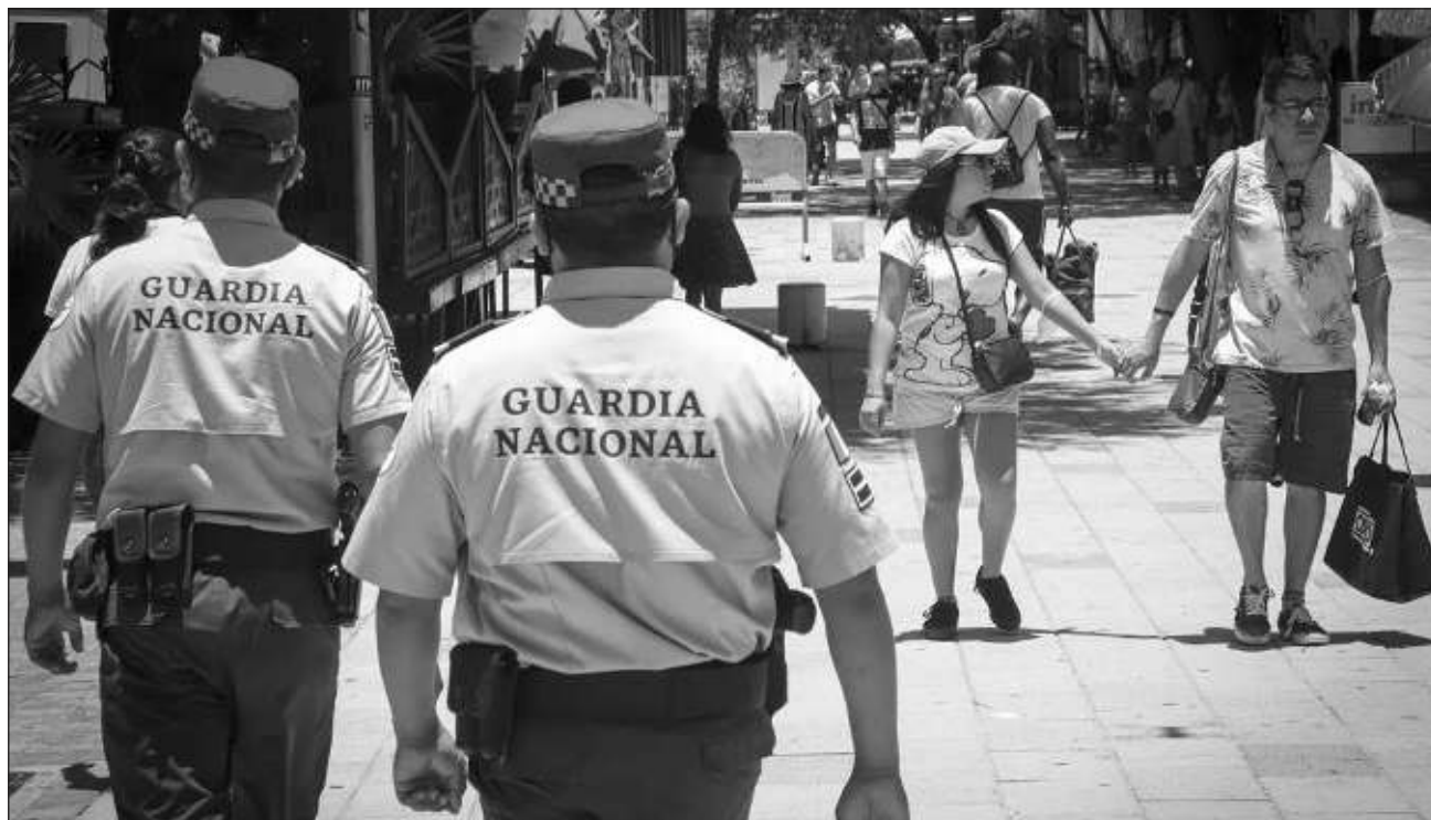
▲ La creación de la Guardia Nacional, consideró el nuevo presidente del Consejo Coordinador Empresarial del Caribe, se pudo hacer con una intención buena pero es muy difícil identificar resultados a corto plazo.

Algunas cosas, reconoció, son complejas y deben revisarse, tal es el caso del aumento en el costo para la realización de la Refinería de