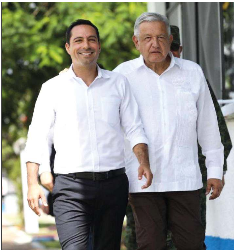
▲ El Presidente y el gobernador de Yucatán se comprometieron a continuar trabajando, impulsando el desarrollo del estado y del Sureste de México.

Con respecto al parque de La Plancha, que visitaron con titulares de la Sedena, Luis Cresencio Sandoval, y de Semarnat, María Luisa Albores González, recordaron que se convertirá en un atractivo turístico, siendo un pulmón verde.