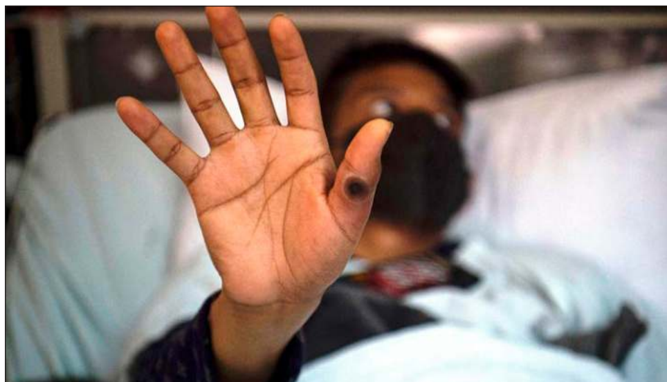
▲ La RepaVIH pidió asegurar el acceso a la prueba diagnóstica temprana para hombres gays y bisexuales y garantizar la confidencialidad, así como los apoyos necesarios.

El comunicado de Gaylatino también exige información transparente y oportuna sobre los pacientes infectados con la enfermedad