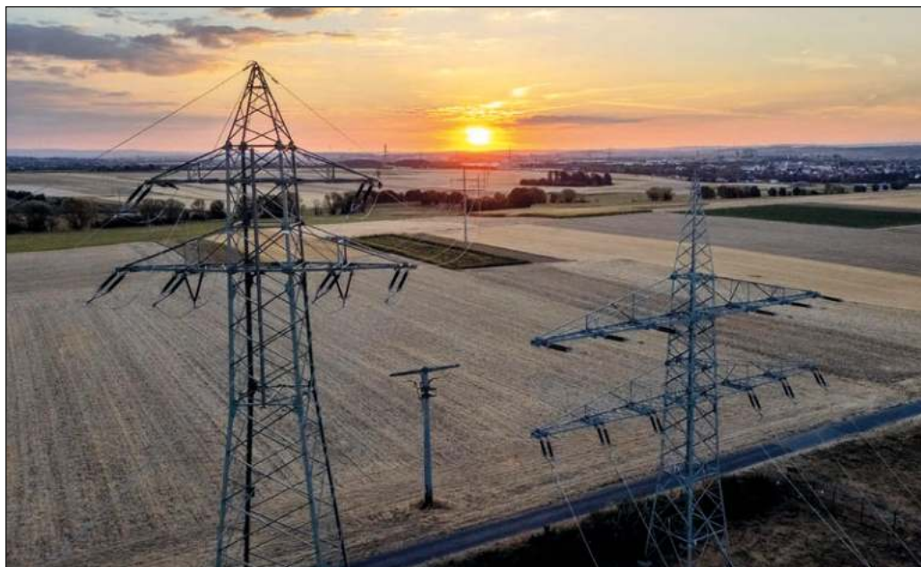
▲ En España, el gobierno intenta aliviar la situación mediante sucesivas reducciones fiscales: ya había bajado el IVA a la electricidad a 5 por ciento, y ahora establecerá la misma tasa al gas.

La comunidad internacional debe conminar a las partes involucradas a cesar una actitud que no ha traído sino muerte y sufrimiento, deponer las posturas maximalistas y buscar con honestidad una salida negociada al enfrentamiento geoestratégico que tiene lugar en el Este europeo, pero que repercute en el resto del mundo.