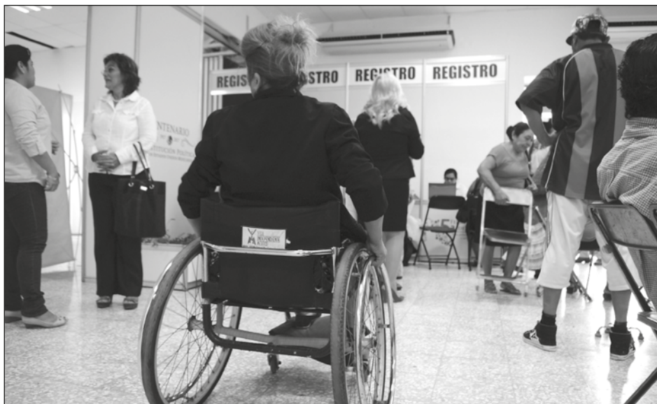
▲ El director del Icatcam Carmen sostuvo que si en cada una de las empresas de la Isla se promoviera la contratación de una persona con discapacidad, se daría un fuerte impulso para alcanzar una cultura de la inclusión en el municipio.

"En el Icatcam nos hemos dispuesto a capacitar a las personas con discapacidad en las diferentes ramas de cursos que se imparten en la institución, para lo cual, se les ofrece que estos son completamente gratuitos para ellos y con ello puedan obtener las