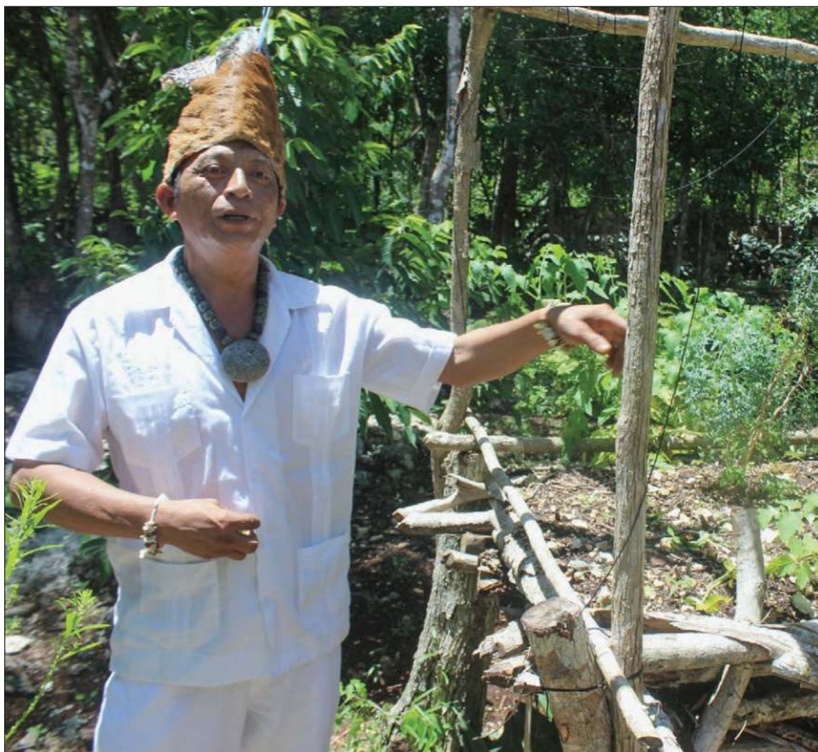
▲ “La población indígena ha sabido hacer frente a las crisis históricas (...) y probablemente los seguirá enfrentando. No por ello hemos de normalizar las estructuras históricas que endurecen su entorno”.

EL PUEBLO MAYA transmite desde la oralidad cómo crisis sanitarias vividas en tiempos arcaicos o presentes, son seguidas de duras escaseces, instando a tomar hoy medidas preparatorias. Estudios como los de Paola Peniche (2010) o Wendy Pérez Amézquita (2020) dan cuenta de calamidades sanitarias o climatológicas que ocasionaron hambrunas, agudizadas por el acaparamiento de alimentos por autoridades civiles, lo que diezmó a la población indígena y llevó a los sobrevivientes a vivir en penuria y sobreexplotación. Hubo quienes hicieron de las selvas y montes su refugio, donde se abastecieron de raíces, vegetales y miel.