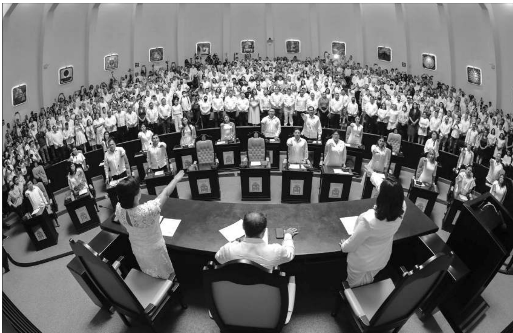
▲ La presidencia de la Mesa Directiva de la XVII Legislatura será ocupada el primer año por Morena y el segundo por el PVEM.