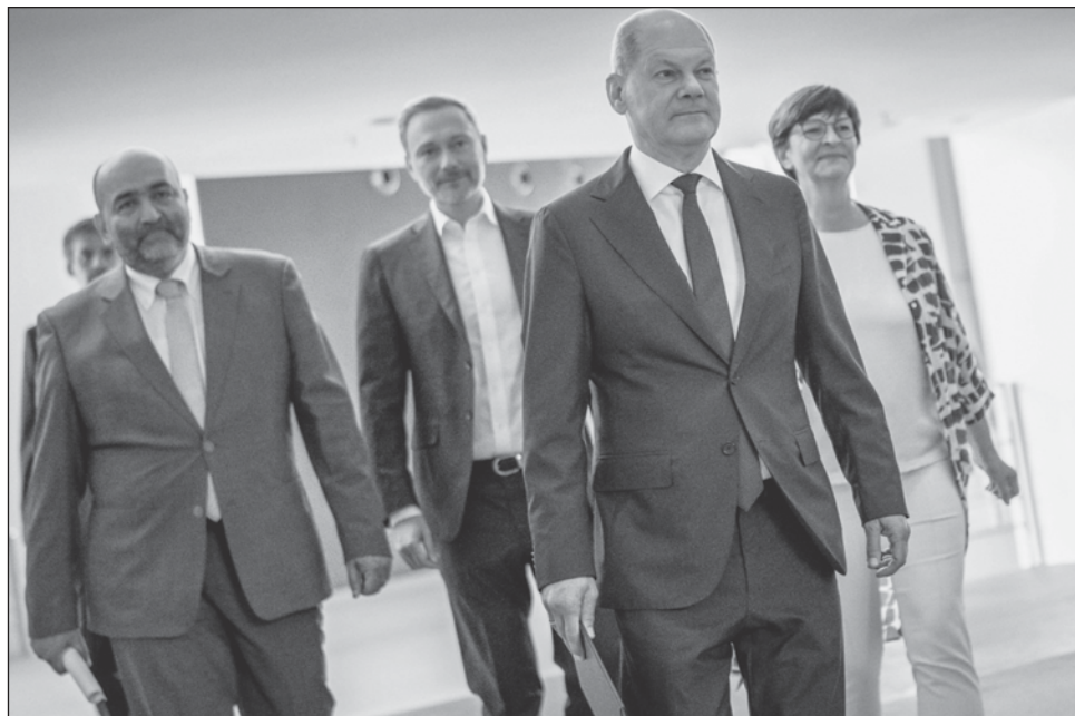
▲ El socialdemócrata Olaf Scholz, quien lidera una coalición formada con ecologistas y liberales, prometió enfrentar la "especulación" en el mercado energético.

El jefe del Banco Central alemán, la Bundesbank,