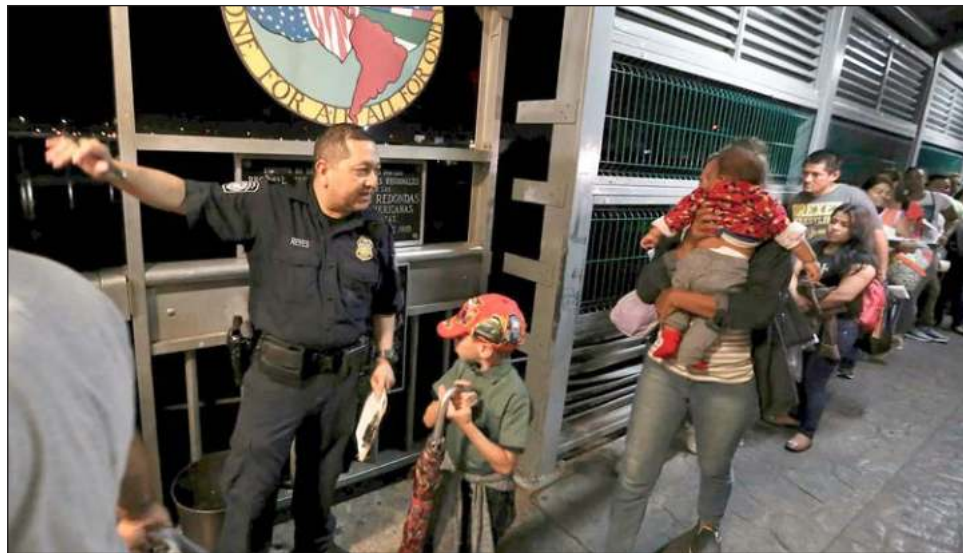
▲ En plática telefónica, Joe Biden, presidente de Estados Unidos, y Andrés Manuel López Obrador, de México, abordaron el tema migratorio y la forma de reducir los flujos de personas.

Al hablar, una vez más, de los temas que tocó con su homólogo estadounidense, Joe Biden, durante la conversación telefónica que sostuvieron el viernes pasado, aseveró que no hablaron del conflicto entre Rusia y Ucrania, pero sí se profundizó sobre todo en migración y en las formas de hacer frente para reducir los flujos.