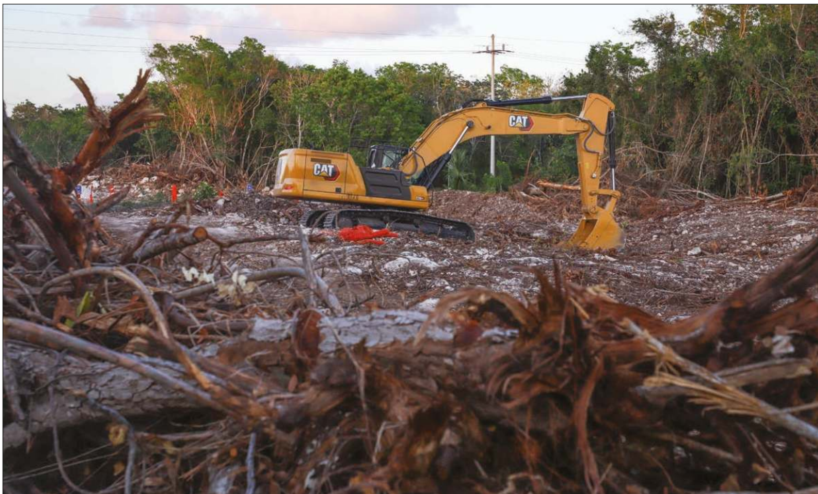
▲ "Hoy Fonatur sólo se dedica a una cosa: construir el tren. Todo lo demás les representa una pérdida de tiempo".