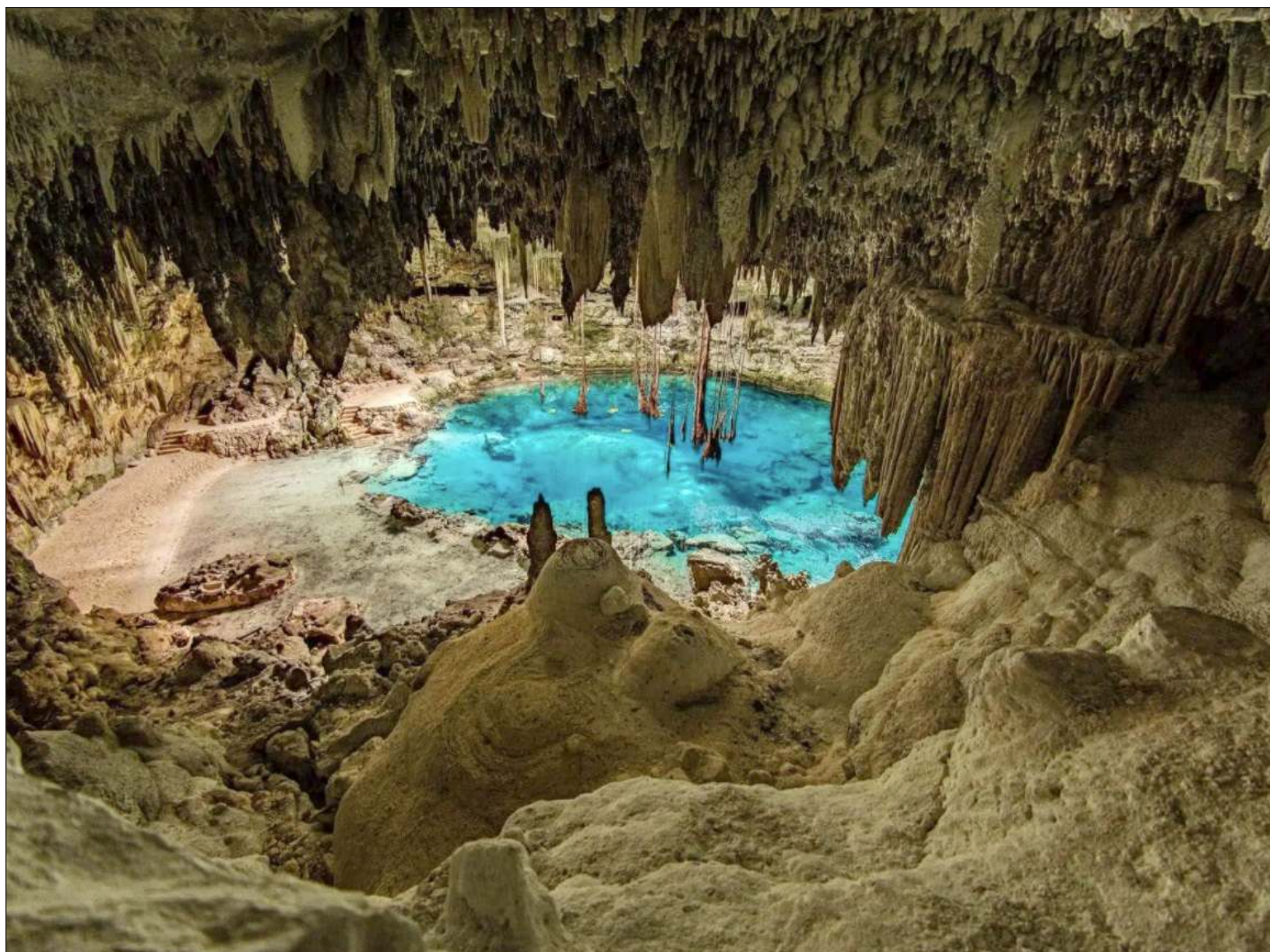
▲ El pasado 2 de mayo, la titular de la Semarnat afirmó que Grupo Xcaret “prefiere pedir perdón que pedir permiso”, con respecto a sus proyectos.

Sólo por indicaciones de un juez, precisó, el gobierno estatal volvería a revisar estos permisos autorizados a nivel local.