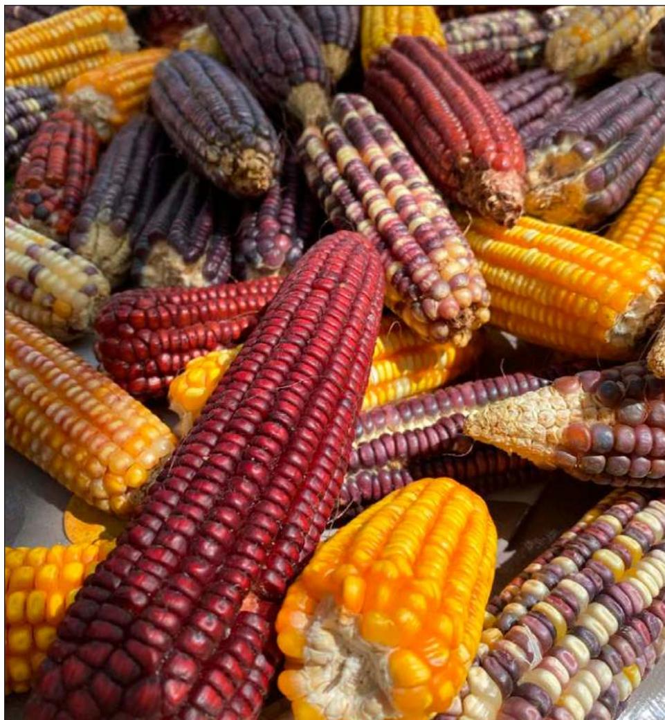
▲ La irregularidad de las lluvias conlleva el riesgo de que los agricultores se queden sin semillas para los siguientes ciclos, pues tienen que volver a sembrar tras una pérdida.

Ante esta situación, indicó que es necesario regular la manera en que se produzca más con la