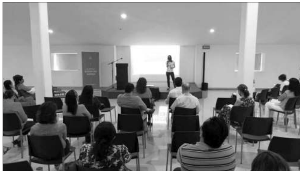
▲ Durante la jornada se abordará el tema sobre la importancia de enseñar a niñas, niños y adolescentes a reconocer, comprender y expresar sus emociones.

Este año, bajo la temática Inteligencia Emocional: clave para el desarrollo socioemocional de los hijos brindarán herramientas