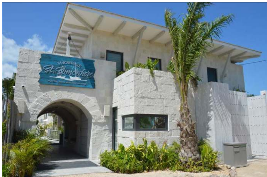
▲ El centro de hospedaje Margaritaville St. Somewhere by Karisma Punta Coco utiliza insumos que provienen de seis distribuidores localizados en la isla de Holbox; asimismo, mantienen contacto con panaderías, heladerías y marisquerías locales.