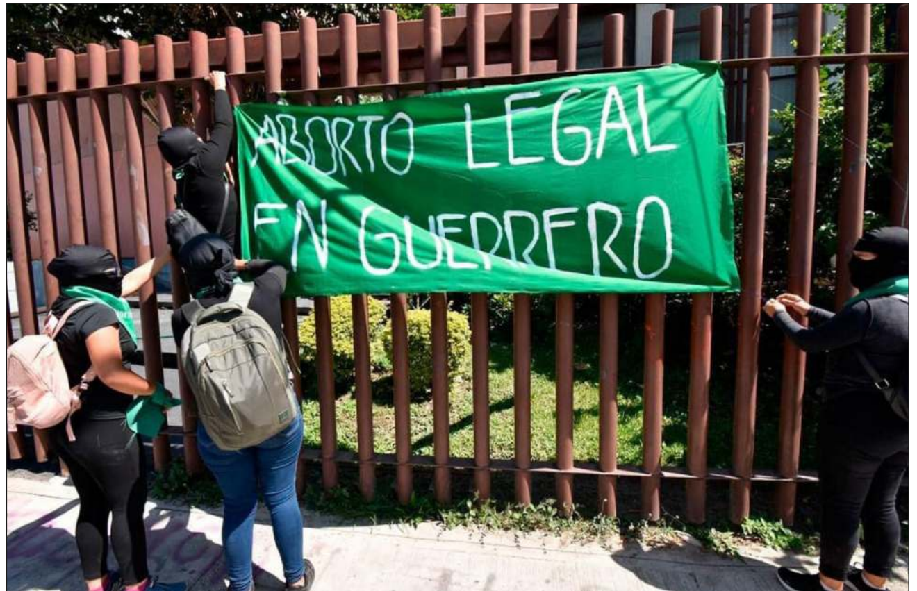
▲ Medios locales reportaron la presencia de grupos anti aborto en las inmediaciones del congreso de Guerrero, mientras que en redes sociales se realiza un "pañuelazo virtual" a favor de la iniciativa.

Esta iniciativa regularía la interrupción legal del embarazo y erradicaría la criminalización de las personas gestantes. "Su discusión y aprobación por parte del Pleno del Congreso, puede traducirse en un histórico avance en la garantía de los derechos humanos de las mujeres, adolescentes y niñas guerrerenses", señaló el Inmujeres.