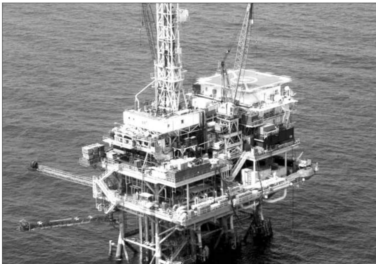
▲ Disidentes lamentan que las empresas que ofrecen servicios de alimentación y hotelería ofrezcan comida en mal estado a obreros a bordo de las plataformas marinas en la Sonda de Campeche, y que autoridades sindicales lo avalen.

En el caso de Dzitbalché, Herrera Mass en un principio tuvo acercamientos con la sección sindical correspondiente, vinieron los despidos y desconoció a la sección y posteriormente al sindicato, “hasta ahora no nos ha recibido y ahí son 24 los trabajadores afectados, por lo que ambos casos podrían venirse los plantones y posteriormente el estallamiento de huelga”.