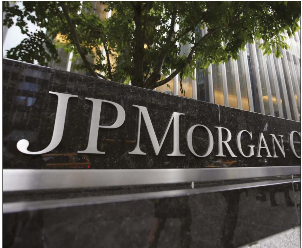
▲ En 2013, JP Morgan recibió en Estados Unidos una sanción de 13 mil millones de dólares por malas prácticas hipotecarias, relacionadas con el desastre que dejó sin casa a millones de familias.

LA GOBERNADORA DEL Banco de México, Victoria Rodríguez Ceja, lo había anticipado en la reunión que tuvo con los senadores de la Comisión de Hacienda: va