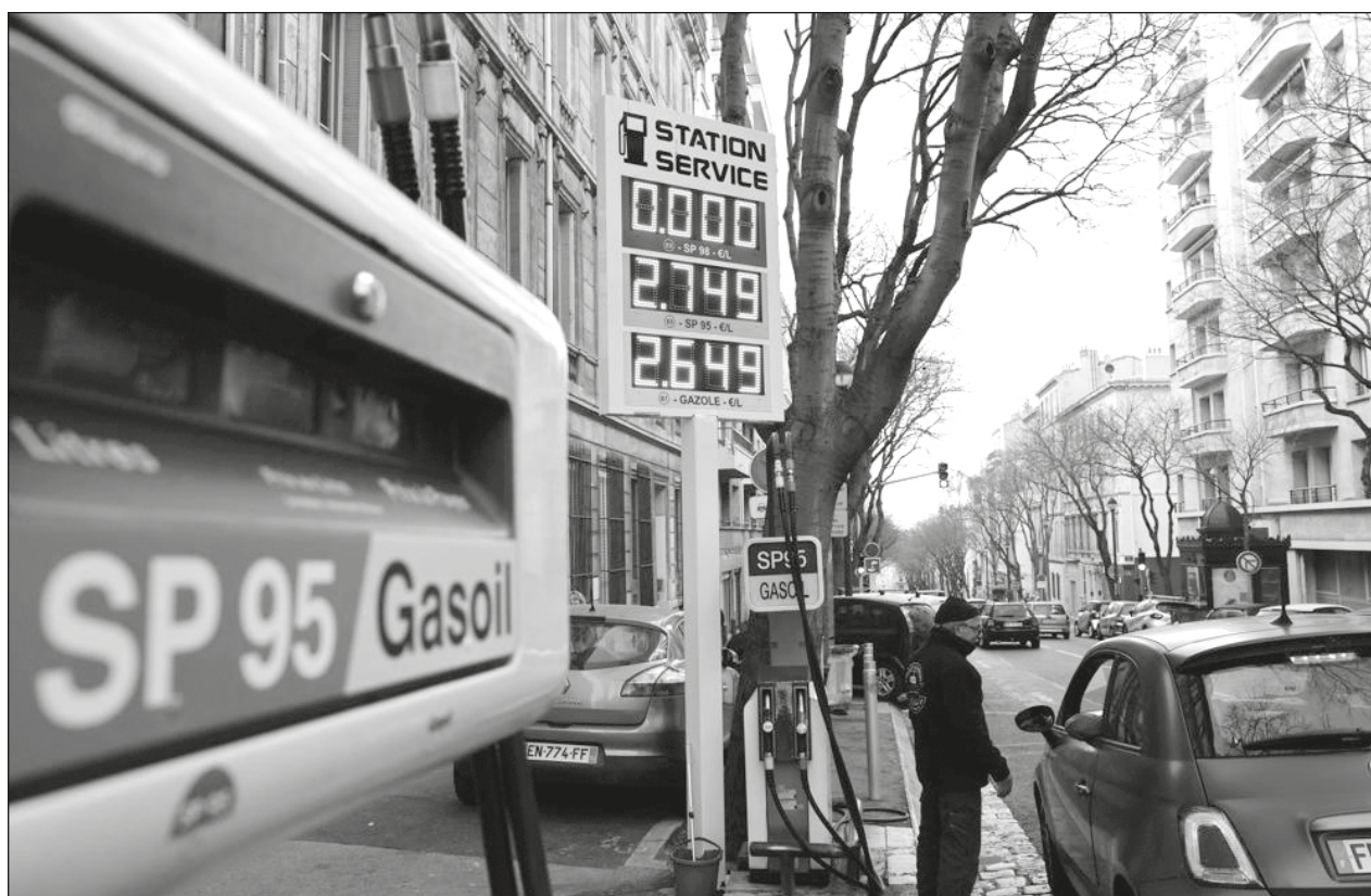
▲ Las sanciones que propone la UE contemplan eliminar la importaciones de crudo en seis meses.

“No sé responder a la pregunta de si es correcto abastecer a los ucranios, lo que está claro es que en esa tierra se están probando las armas. Los rusos saben ahora que los tanques son poco útiles y están pensando en otras cosas. Las guerras se libran por eso: para probar las armas que hemos fabricado”, afirmó.