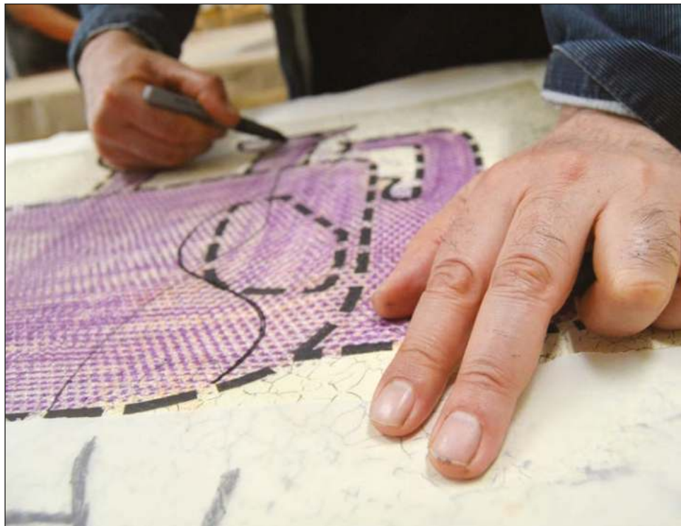
▲ La excelencia en el diseño se alcanza trabajando de forma interdisciplinaria a través de la escucha y el diálogo con gente de diversas profesiones.

El diseño interpreta esos escenarios, tiene la capacidad de dar aportaciones útiles y óptimamente realizadas desde el punto de vista técnico. Más aún, durante la formación de