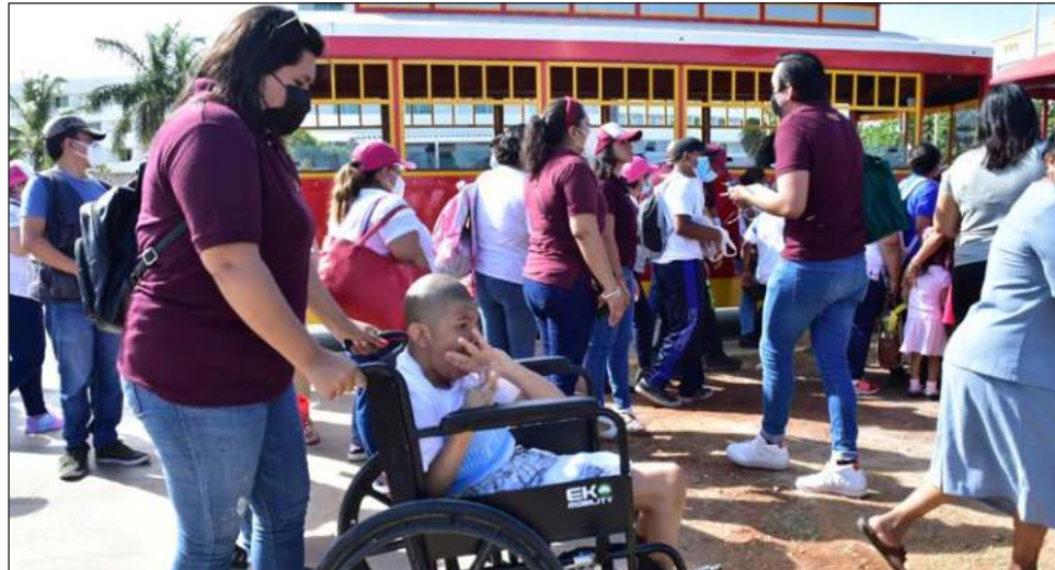
▲ La Ley del Trabajo del Estado de Campeche establece que 2 por ciento de la plantilla de las empresas debe conformarse por personas con alguna discapacidad; ya sea motriz, neuronal o intelectual. Deben ser inspeccionadas las clasificadas como grandes y los supermercados

Sin embargo, aunque esta ley es vigente, y debe regularse bajo la estricta vigilancia de la Secretaría del Trabajo y Previsión Social (STPS), no se cumple; la funcionaria lamentó esta situación, aunque la justificó refiriendo la falta de un meca-