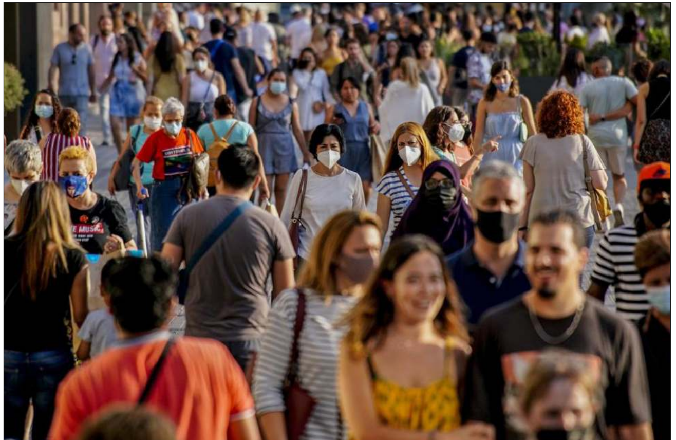
▲ En el acumulado desde el inicio de la crisis sanitaria hace más de dos años, se han registrado 511 millones de casos de Covid-19 en el planeta, de los que 6.2 millones fueron mortales, lo que constituye la peor pandemia desde la gripe de 1918.

La cifra supone una reducción del 17 % con respecto a los contagios registrados en la anterior semana (18-24 de abril), según la OMS, que insiste en su informe epidemiológico semanal que debido a la reducción de test en muchos países esta caída debe ser interpretada con cautela.