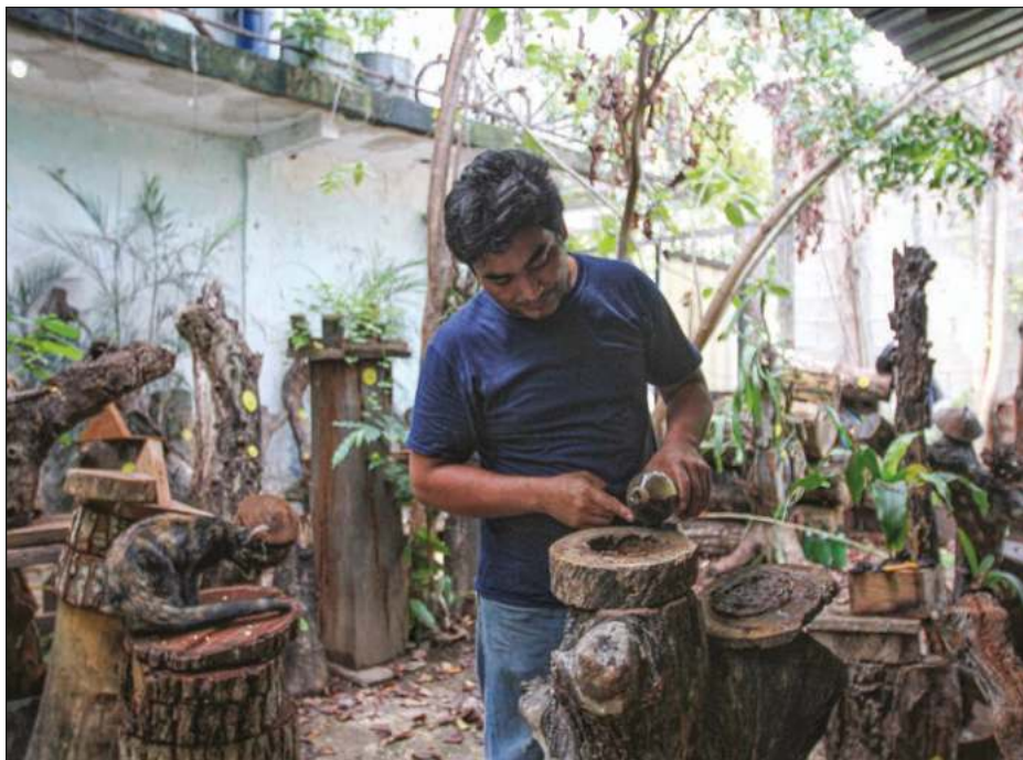
▲ Se contempla la creación de un comité apicultor en la entidad.

Las algas que llegan al estado provienen del océano Atlántico. De acuerdo con biólogos, su reciente abundancia se debe a la variabilidad climática, así como a otros procesos naturales.