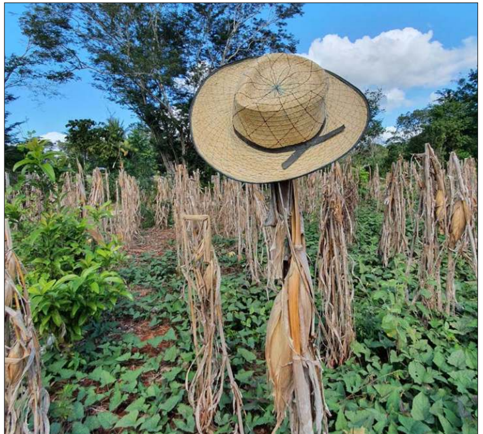
▲ Kex tumen ojéela'an koolé' jump'éel meyaj no'o'jan yéetel uts ti'al u yantal ba'al ti'al u tséentikubáaj kaaje', yaan ya'abach ba'alo'ob jelbesik yéetel k'askúuntik; bajla'e' ts'o'ok

Yóok'lal le je'elo', ku tukultike' k'a'anan u jeets'el bix kéen k'a'abéetkunsak k'áax yéetel lu'um, ti'al u ya'abkunsal xan uláak' tu'ux je'el u páajtal u beeta'al paak'al yéetel kool.