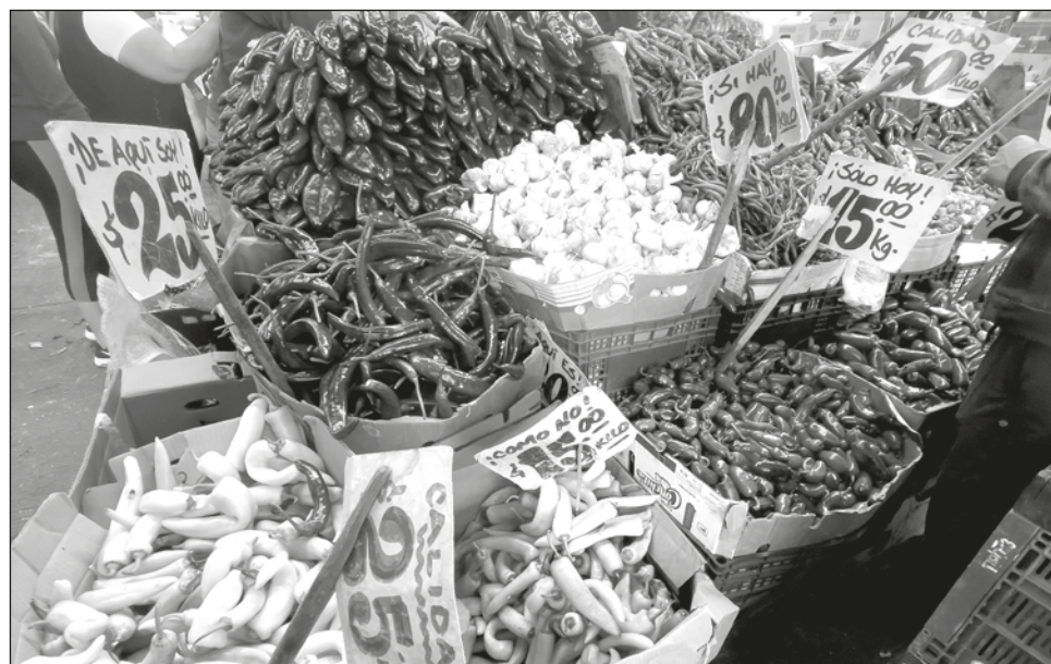
▲ En el caso de América Latina y el Caribe, más de 12 millones de personas vivieron una grave crisis de inseguridad de alimentos en 2021, especialmente en Nicaragua y Haití.

La cifra ha seguido aumentando desde 2016, fecha de la primera publicación de este informe realizado por