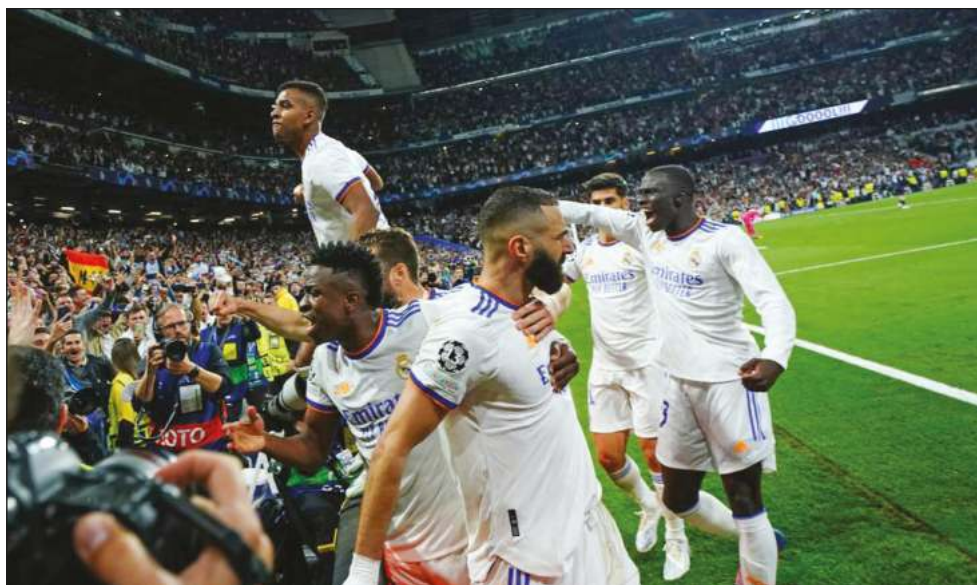
▲ Karim Benzema (centro), del Real Madrid, celebra luego de anotar el tercer gol ante el Manchester City, que selló el boleto de los merengues a otra final.

"La grandeza de este club es esto. Es un club que no te per-