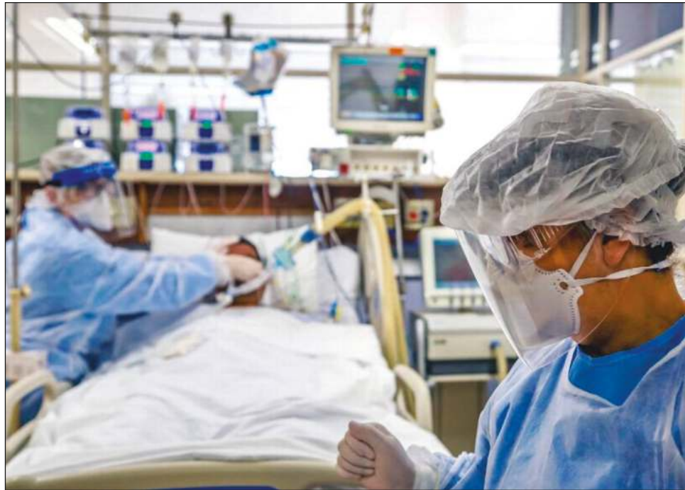
▲ Los resultados del estudio mostraron que las secuelas cognitivas de la infección grave por Covid son semejantes a las que produce el envejecimiento sufrido entre los 50 y 70 años.

Los participantes se sometieron a pruebas computarizadas detalladas cada seis meses en promedio después de su enfermedad. Los especialistas midieron diferentes aspectos de las facultades mentales como la memoria, la atención y el razonamiento, en que se les pedía asociar, por ejemplo,