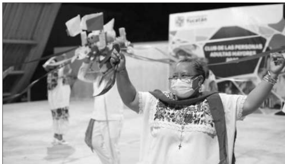
▲ Entre música y baile, iniciaron actividades presenciales los Clubes para Personas Adultas Mayores de 34 municipios, que opera el Sistema para el Desarrollo Integral de la Familia (DIF).