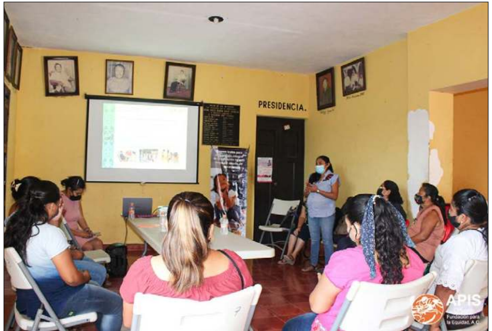
▲ Muchas de las mujeres víctimas de violencia han sido canalizadas a refugios por las propias instituciones municipales o estatales, ya que no cuentan con un centro adecuado.

Asimismo, dijo que muchas de las mujeres han sido canalizadas a su refugios por las propias instituciones municipales o estatales, ya que no cuentan con un centro que las pueda mantener en resguardo y porque han sido mujeres a las que les han dicho que podrían estar con nosotras.