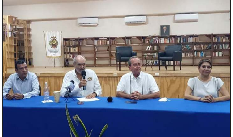
▲ La meta es concretar un centenar de actividades en los 11 municipios del estado, y concluir con un magno evento el 24 de noviembre, en Felipe Carrillo Puerto.

El 6 de mayo se tendrá la exposición pictórica Guerra de Castas en José María Morelos; el 12 de mayo, la conferencia de la escritora Georgina Rosado Rosado, autora del libro María Petrona Uicab, La Santa Patrona de Tulum , así como la ceremonia maya