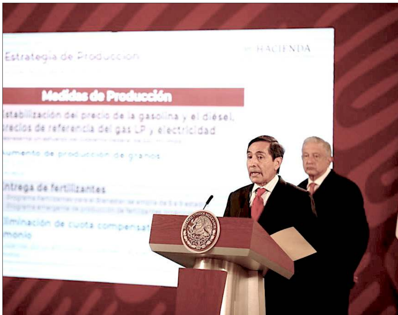
▲ El secretario de Hacienda explicó que se promoverá la producción de granos -en particular maíz, trigo y arroz— y se buscará abaratar el costo de importar fertilizantes, cuya oferta se ha limitado al ser Rusia uno de los mayores productores.