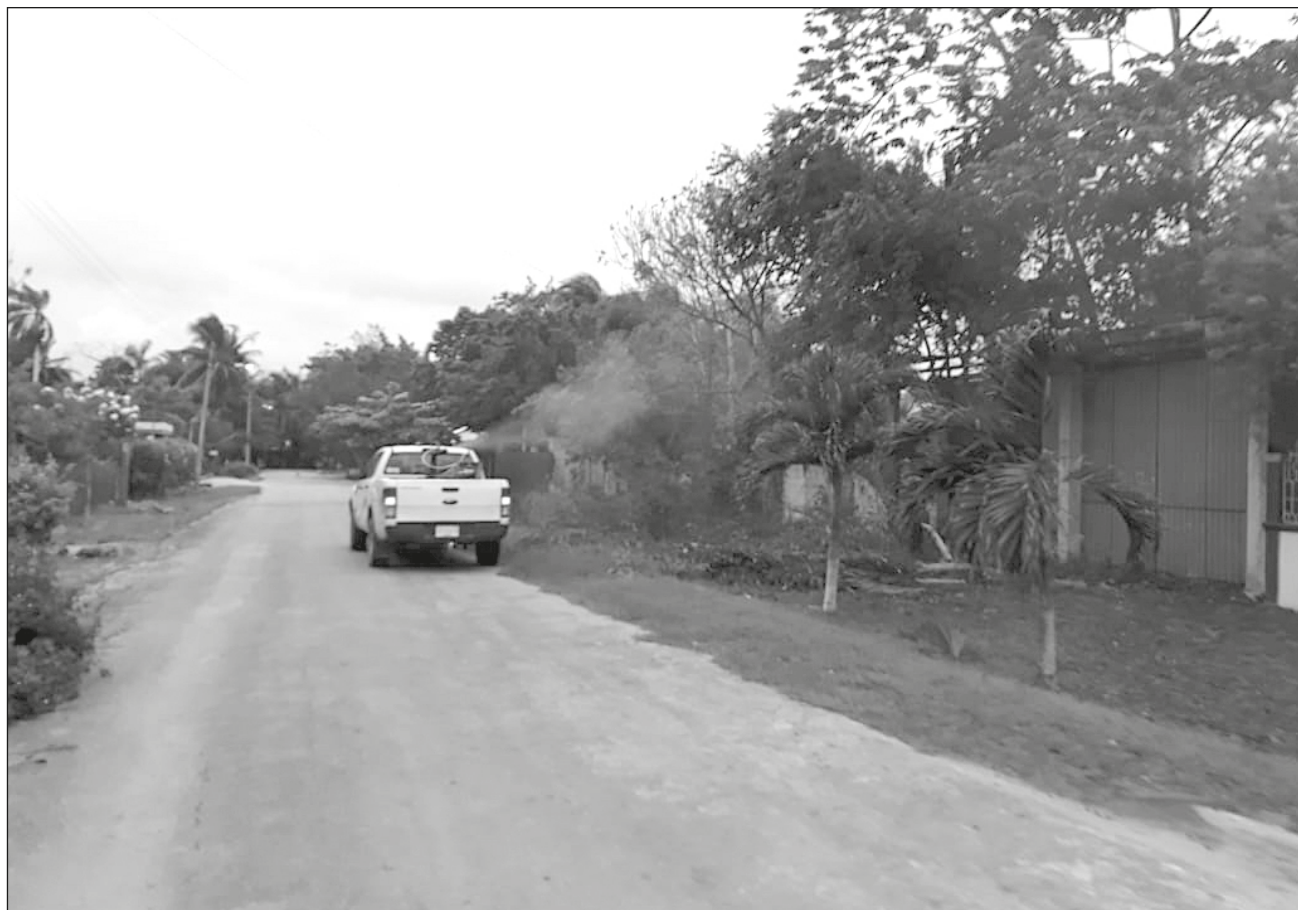
▲ Residentes de localidades como San Antonio Soda y Guillermo Prieto esperan que con la decisión del juzgado federal, puedan acceder a infraestructura necesaria para el acceso a la movilidad.