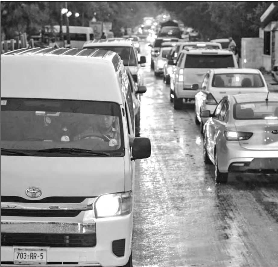
▲ Las medidas anunciadas propiciarán mejorar la imagen del destino y favorecer la fluidez de vehículos y personas sobre esta vialidad.