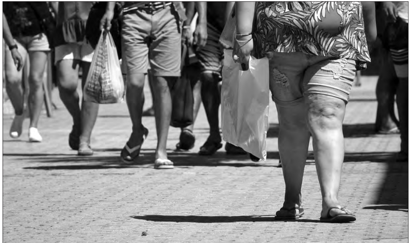
▲ Por la pandemia, las autoridades no serán tan coercitivas con la aplicación de la Ley, pero recomiendan a los empresarios cambiarse a alternativas más amables con el medio ambiente.

En junio de 2020 sería su entrada en vigor en todo