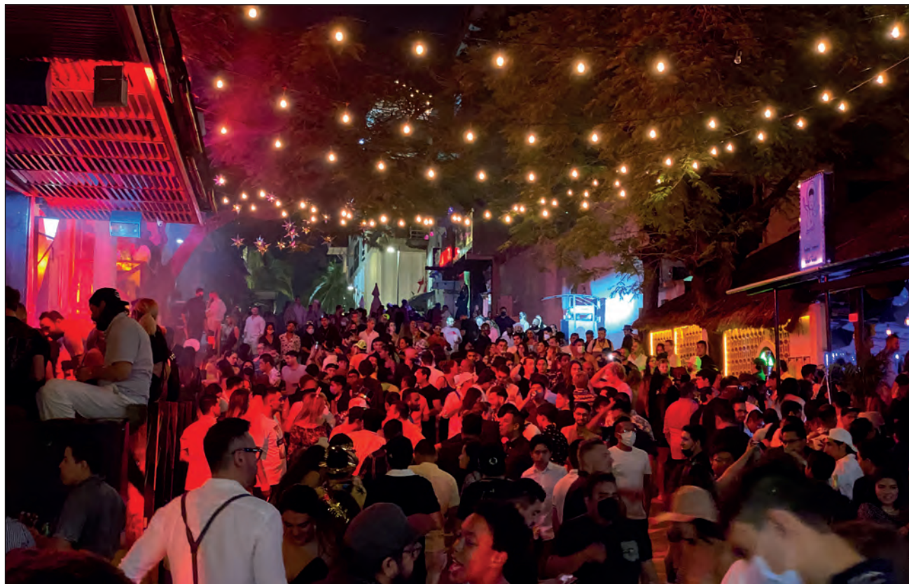
▲ La Cofepris aclaró que las congregaciones en las calles no son de su competencia; le corresponde directamente a los respectivos ayuntamientos.

Aclaró que las congregaciones en las calles para los festejos de año nuevo no