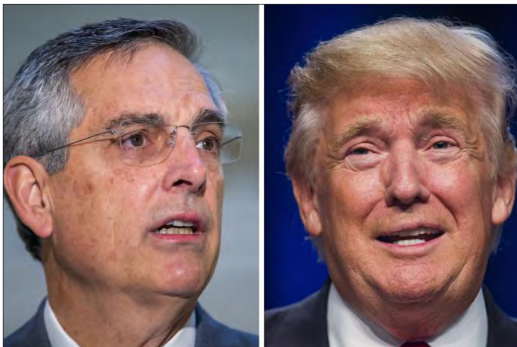
▲ Donald Trump intentó convencer al funcionario electoral de Georgia, Brad Raffensperger, de encontrar los 11 mil 780 votos que le permitirían revertir el resultado de los comicios en esa entidad.

Se difundieron antier fragmentos de una conversación telefónica en la cual el presidente Donald Trump intenta convencer al secretario de Estado y principal funcionario electoral de Georgia, Brad Raffensperger, de encontrar los 11 mil 780 votos que le permitirían revertir el resultado de los comicios en esa entidad, tradicionalmente republicana, cuyo viraje fue clave en la victoria del candidato demócrata, Joe Biden.