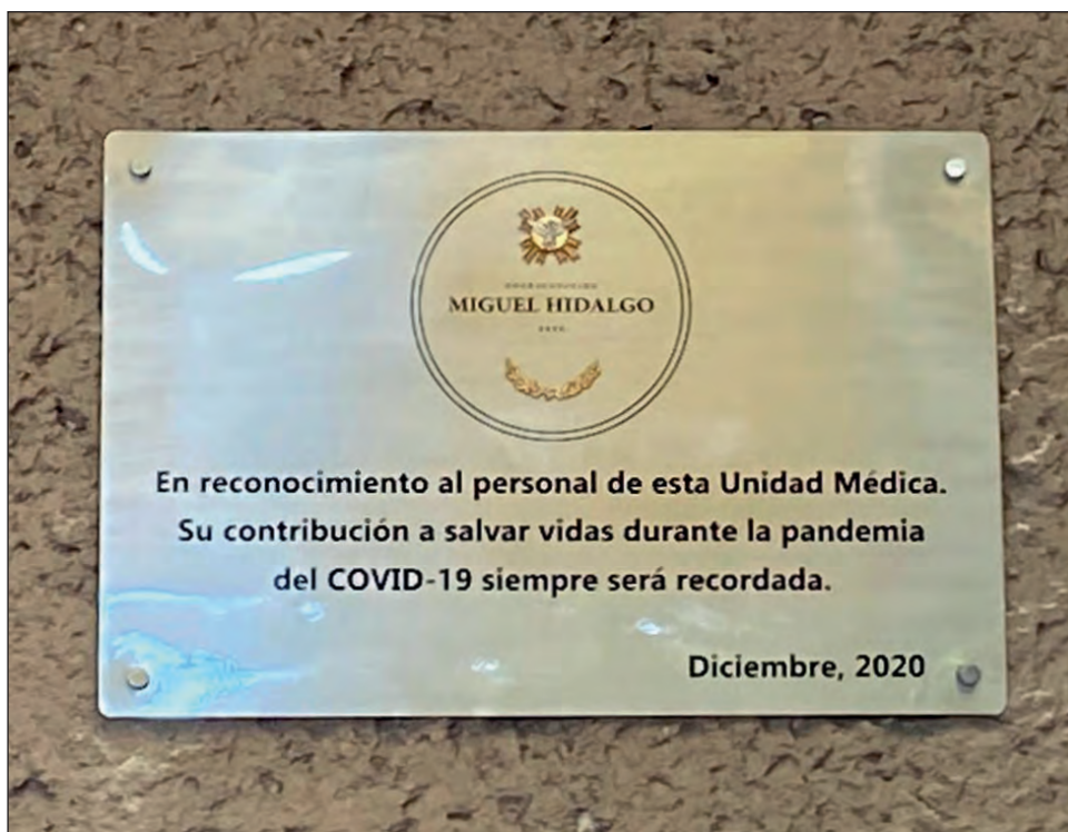
▲ El esfuerzo del personal de Salud motivó el reconocimiento del Estado mexicano.

En la inscripción de la placa se lee: "En reconocimiento al personal de esta Unidad Médica. Su contribución a salvar vidas durante la pandemia del COVID-19 será siempre recordada. Diciembre, 2020".