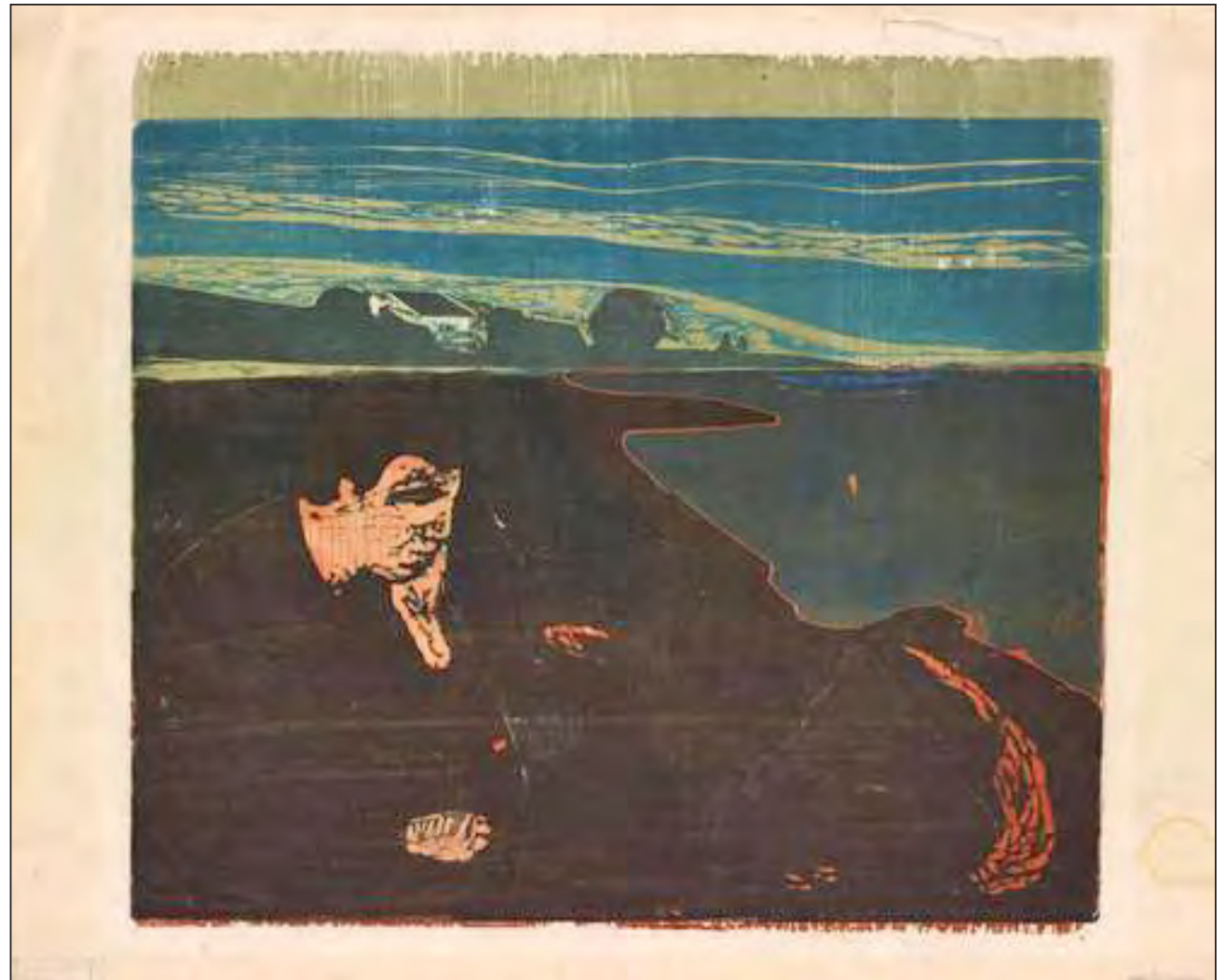
▲ La colección del Muchmuseet está constituida por más de 28 mil piezas, así como documentos, cartas, fotografías y objetos personales. En la imagen, una pintura de la serie Melancolía, creada por el también grabador entre 1891 y 1983.

Edvard Munch inició su formación entre el ascenso del impresionismo y posimpresionismo. Deambuló entre Francia, Alemania y los países nórdicos. Es considerado un gran simbolista y precursor del expresionismo alemán. Sin