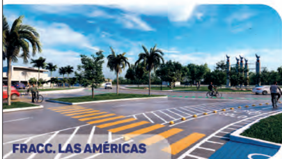
FRACC. LAS AMÉRICAS