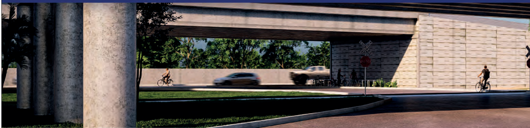
DISTRIBUIDOR VIAL DZUNUNCÁN

La pandemia del coronavirus nos ha exigido trabajar más juntos que nunca en acciones que cuiden la salud de la población. Por eso, estamos trabajando en conjunto Gobierno del Estado y Ayuntamiento de Mérida para mejorar la movilidad.