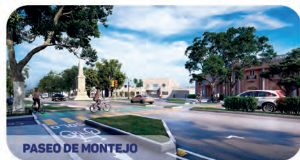
PASEO DE MONTEJO