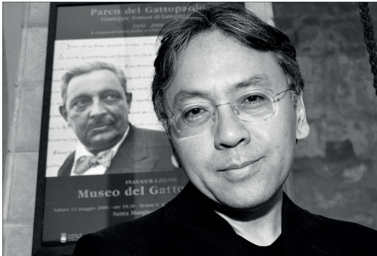
▲ Estuve enfatizando lo minúsculo y lo privado, porque en esencia es de esto de lo que trata mi trabajo, refiere el escritor japonés.

Klara y el sol será publicado en Reino Unido por la editorial independiente Faber & Faber, en Estados Unidos por Alfred A. Knopf y en Canadá por Knopf.