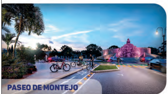
PASEO DE MONTEJO