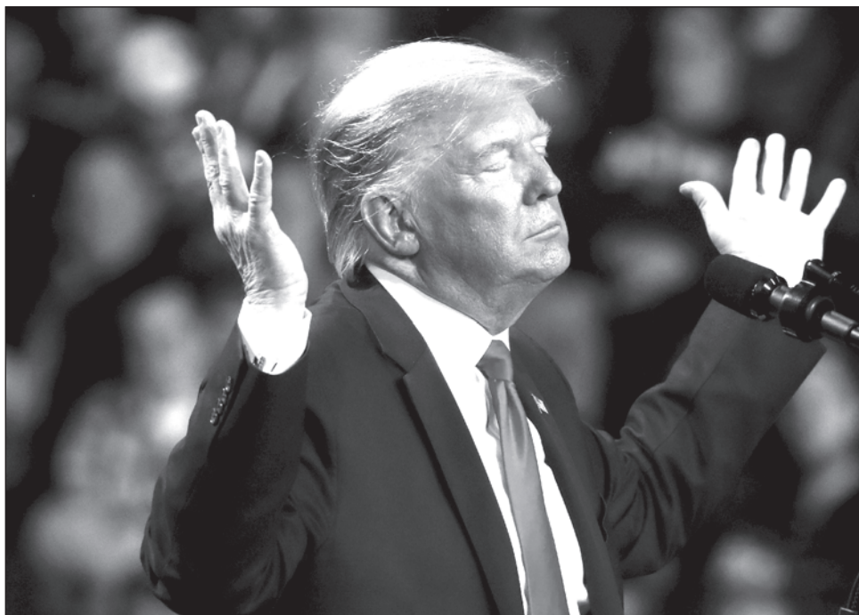
▲ El desprecio de Trump por la democracia ha quedado al descubierto, comentó el congresista demócrata, Adam Schiff.

El presidente tuiteó por la mañana que habló con Raffensperger el sábado y trató cuestiones como el resultado en el condado de Fulton o “el fraude en la votación en Georgia”. En un tuit, añadió: “Él no quería, o podía, responder a preguntas sobre el fraude de los votos bajo la mesa, la destrucción de