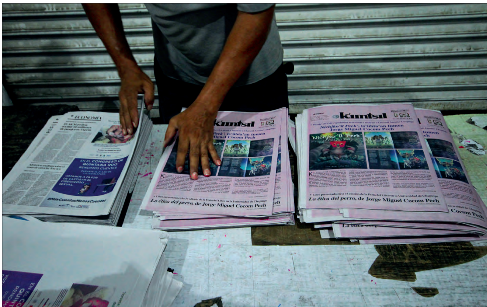
▲ Más que la desaparición de los periódicos, podríamos enfocarnos en que no desaparezca el periodismo.