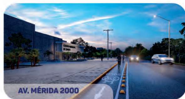
AV. MÉRIDA 2000