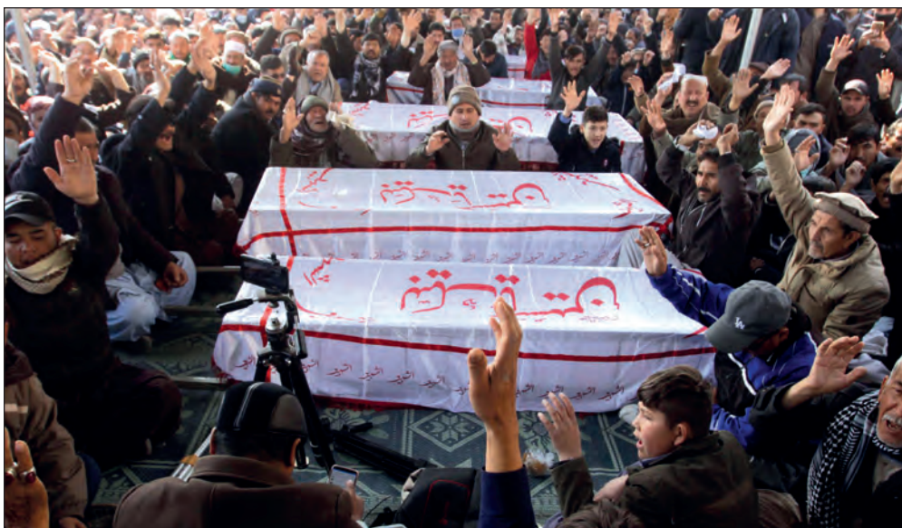
▲ Los familiares de los hazaras muertos en Mach prometieron continuar con su protesta fúnebre mientras los culpables del “martirio” no sean llevados ante la justicia.

Cada uno de nosotros tiene un sueño, un objetivo y una meta en nuestro corazón, que es cambiar la imagen de los hazara en el mundo y, especialmente, en Pakistán”, agregó el joven de 20 años, que se convirtió el año pasado en el primer ganador de una medalla en karate en los Juegos de Asia.