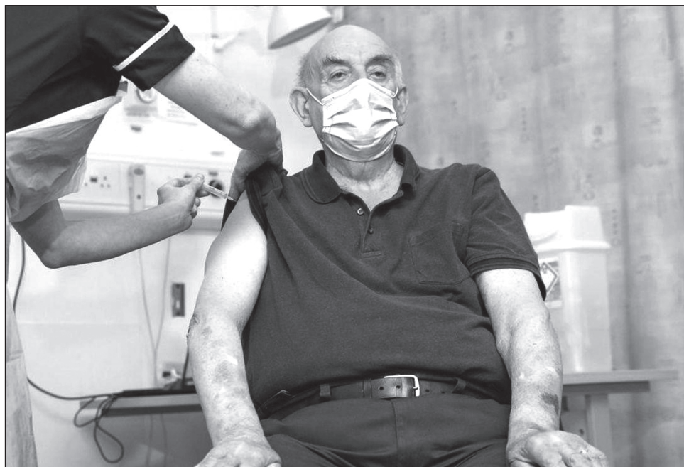
▲ Más de 75 mil personas han muerto en Reino Unido a causa del COVID-19, por ello la urgencia para proteger a la población.

"Estoy muy contento de recibir la vacuna COVID y