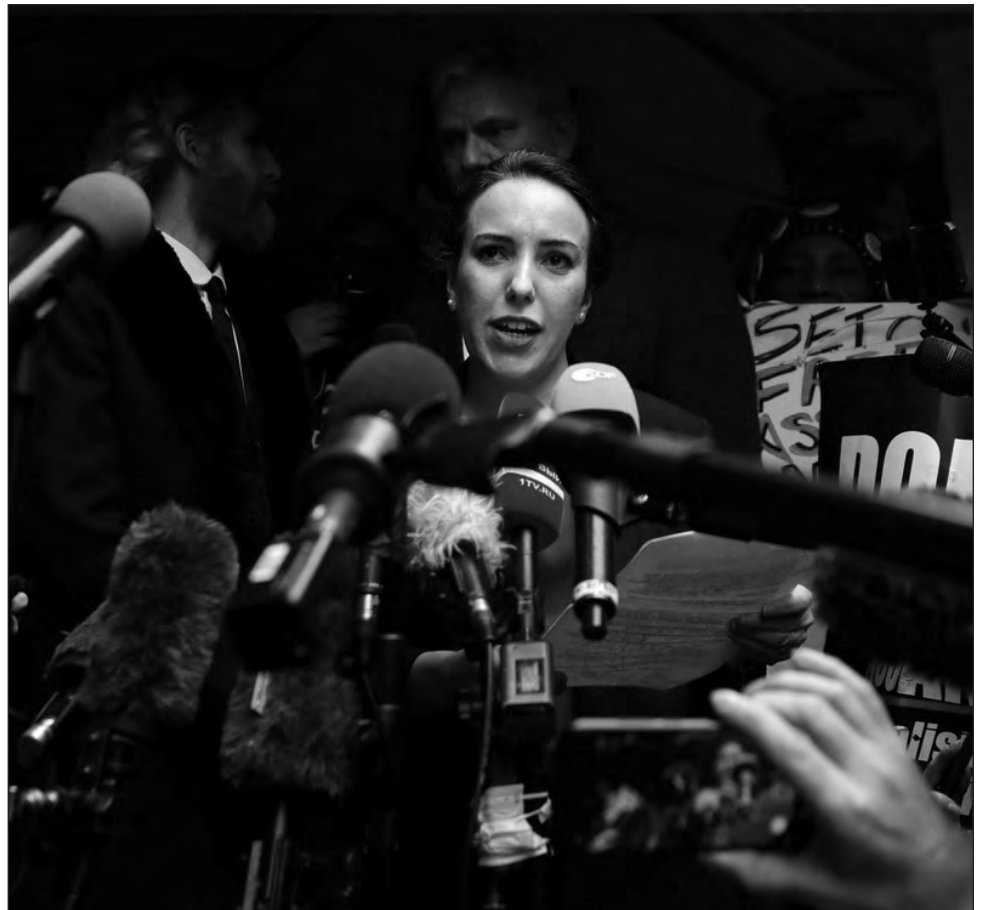
▲ La jueza Vanessa Baraitser señaló que probablemente el fundador de Wikileaks se suicidará si es enviado a Estados Unidos.

Negativa debe marcar "el fin" de los intentos de llevar a Assange a Estados Unidos, señala Edward Snowden