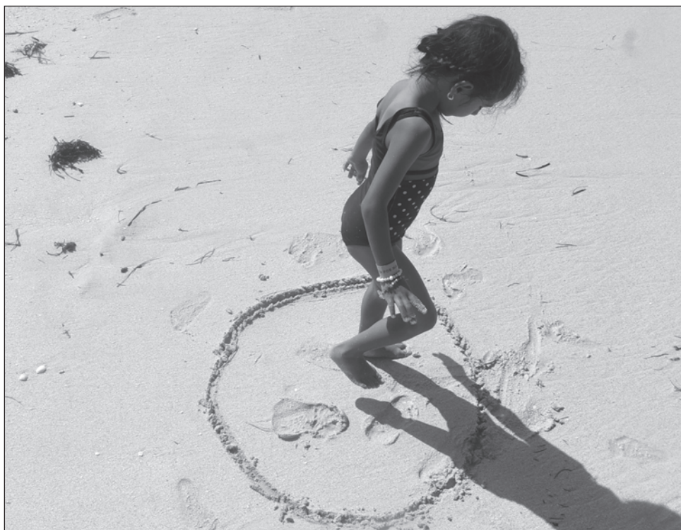
▲ Las generaciones actuales han perdido la sensibilidad de observar todo lo que acontece a nuestro alrededor, lamentó el colectivo Xook K'iin.

Una tercera fase va del 25 al 30 de enero, que representa dos meses cada día; y la última, el 31 de enero, por