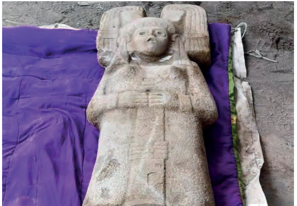
▲ La escultura es semejante a otras de la cultura huasteca.

Especialistas del INAH consultados por La Jornada señalaron que para determinar si el monolito de Hidalgo Amajac es prehispánico se debe realizar un dictamen que en ocasiones tarda días o semanas, pues se deben recabar varios datos científicos, ya que no se determina su procedencia y antigüedad a simple vista.