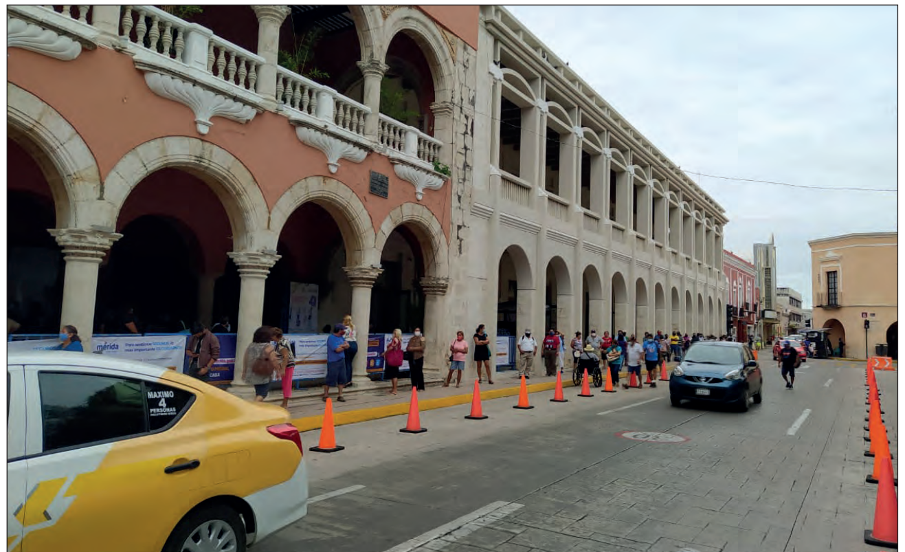
▲ El hábito y la desconfianza en los pagos por Internet produjeron una larga fila en el Palacio Municipal de Mérida. Eso sí, con sana distancia.

En vísperas de Año Nuevo, el Ayuntamiento