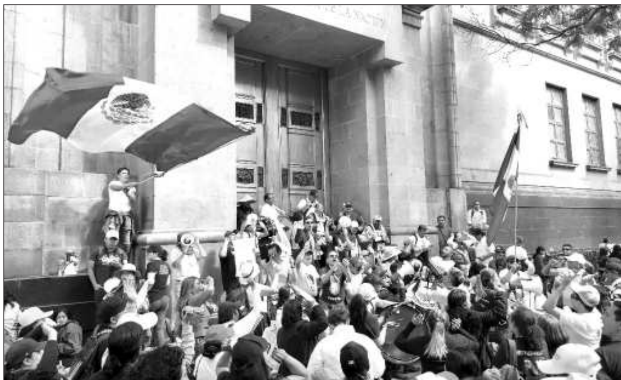
▲ Entre quienes declinaron al proceso están algunos de los que han tramitado cientos de amparos para frenar la reforma, y jueces autores de sentencias controvertidas, como a favor de narcos y de los implicados en el caso Ayotzinapa.

La intención, dijeron, es "hacer que retumbe nuestro grito de justicia por aquellas que ya no pueden hacerlo, por aquellas voces que ya no pueden hacerlo, aquellas voces silenciadas a manos de cobardes" y, recalcan, para que el feminicidio no se vuelva una tradición.