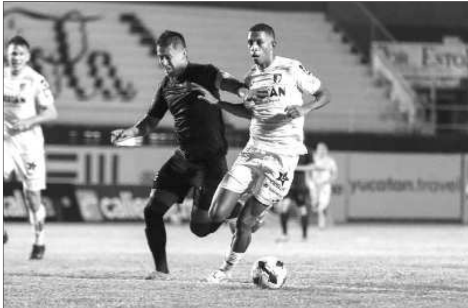
▲ Yucatán goleó a los Leones Negros en la última jornada de la fase regular.

El choque del viernes en el Estadio Carlos Iturralde Rivero ofreció intensidad desde los primeros minutos.