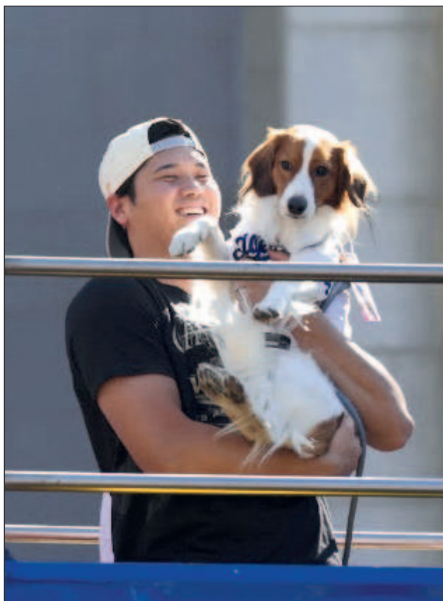
▲ Shohei Ohtani y su perro Decoy, durante el desfile de los Dodgers, campeones de la Serie Mundial, en Los Ángeles.

Los peloteros intercambiaron abrazos y palmadas en el escenario mientras llovía confetti azul y blanco al compás de la canción "I Love LA". Los hijos de algunos jugaban en el campo.