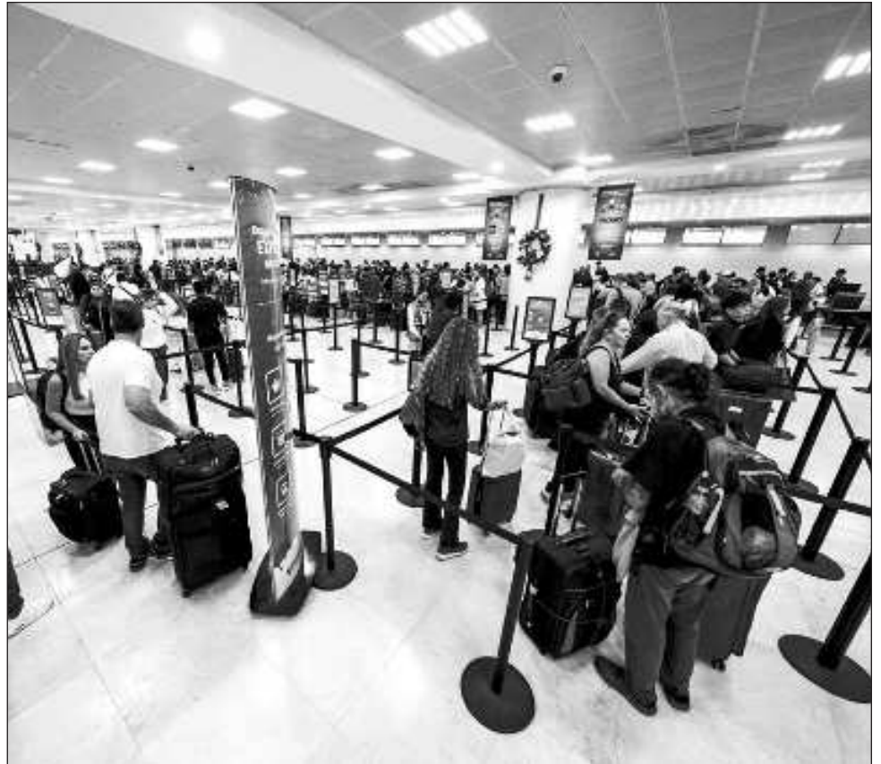
▲ Desde su inauguración, la IATA proyectó que el aeropuerto de la selva maya operaría 4 mil 500 vuelos en su primer año; actualmente, el recinto acumula casi 8 mil.

Desde su inauguración, la Asociación Internacional de Transporte Aéreo (IATA) proyectó que el Aeropuerto Internacional de Tulum Felipe Carrillo Puerto recibiría 700 mil pasajeros anualmente y operaría 4 mil 500 vuelos en su primer año. Sin embargo, ha superado estas expectativas, acumulando ya más de 7 mil 790 operaciones y alcanzando la cifra de un millón de pasajeros.