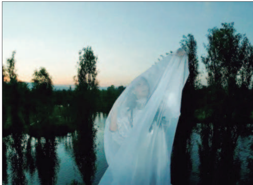
▲ En la tradición prehispánica, el espanto podía hacer que una persona perdiera el alma o que se volviera loca; incluso, podía morir por esta impresión tan fuerte.

Durante la charla, moderada por la hispanista