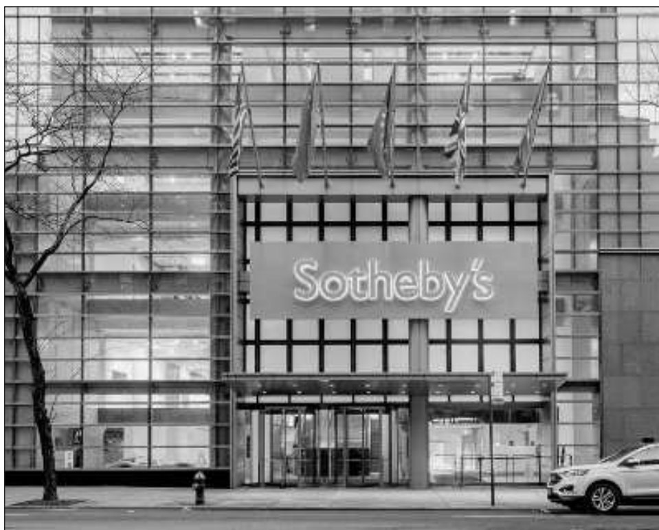
▲ La pintura La Virgen María con el Niño Jesús entronizado se pondrá a la venta en la subasta de Sotheby's con un valor de lote de hasta 3 millones de libras esterlinas.

El diario agregó que la subasta tendrá lugar la semana que viene.