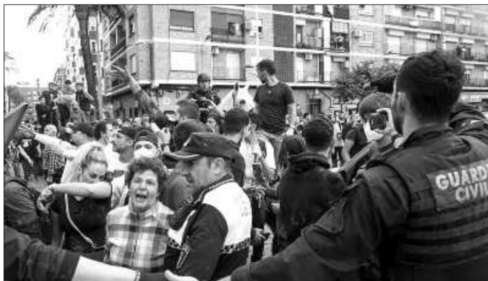
▲ “Hay que entender el enfado y la frustración de muchas personas por lo mal que lo han pasado”, dijo Felipe VI. Mientras que Sánchez condenó “cualquier tipo de violencia”.

Con Sánchez evacuado por su equipo de seguridad, y el presidente regional valenciano, Carlos Mazón, también desaparecido a media visita, Felipe VI insistió durante bastante rato en dialogar con la gente, prote-