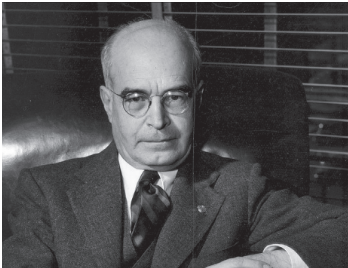
▲ “El ejemplo del físico mexicano Manuel Sandoval Vallarta, quien nunca se dio por vencido. Fue discípulo destacado de grandes científicos, a quienes se les ha catalogado de genios, entre ellos, Albert Einstein”.

Así sucede cuando existen estímulos para seguir por la ruta de la ciencia. No importa si para un alto porcentaje de estudiantes, incluso de autoridades o de la población en general, aparentemente, las ciencias llamadas exactas, como las matemáticas, no son lo suyo.