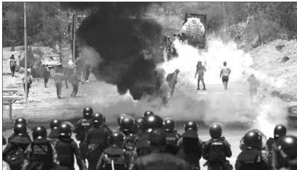
▲ El presidente Luis Arce subrayó que “la toma de una instalación militar por grupos irregulares en cualquier lugar del mundo es un delito de traición a la Patria”.

A esa misma región, el gobierno boliviano envió a las Fuerzas Armadas para apoyar a la policía en el despeje de carreteras bloqueadas por los partidarios de Morales.