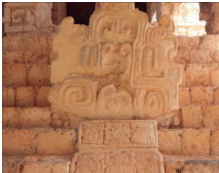
▲ "Hace como 15 años dejó de llegar ese turismo al pueblo, porque se hizo una carretera que iba directamente a la zona arqueológica y, por desgracia, el camino no pasó por nuestro pueblo".

-Yo lo veo precioso... -Porque todo lo ve bonito, pero mire, la gente aquí es muy humilde; por eso yo vengo como presidente del municipio de Temozón, comisaría de Ek Balam, a solicitar que se dé seguimiento a la urbanización del pueblo. Queremos tener una plaza central, un anfiteatro para el juego de pelota y un estacionamiento en la parte céntrica del pueblo. También necesitamos un centro de salud. -¿Cuántos habitantes son? -Como 800... -¿Hay escuela para niños?