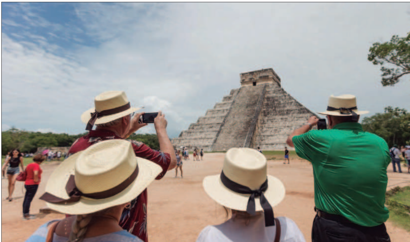
▲ "Otro periodo surge con la apropiación de bienes y entornos históricamente resguardados por los mayas del extremo oriente peninsular".