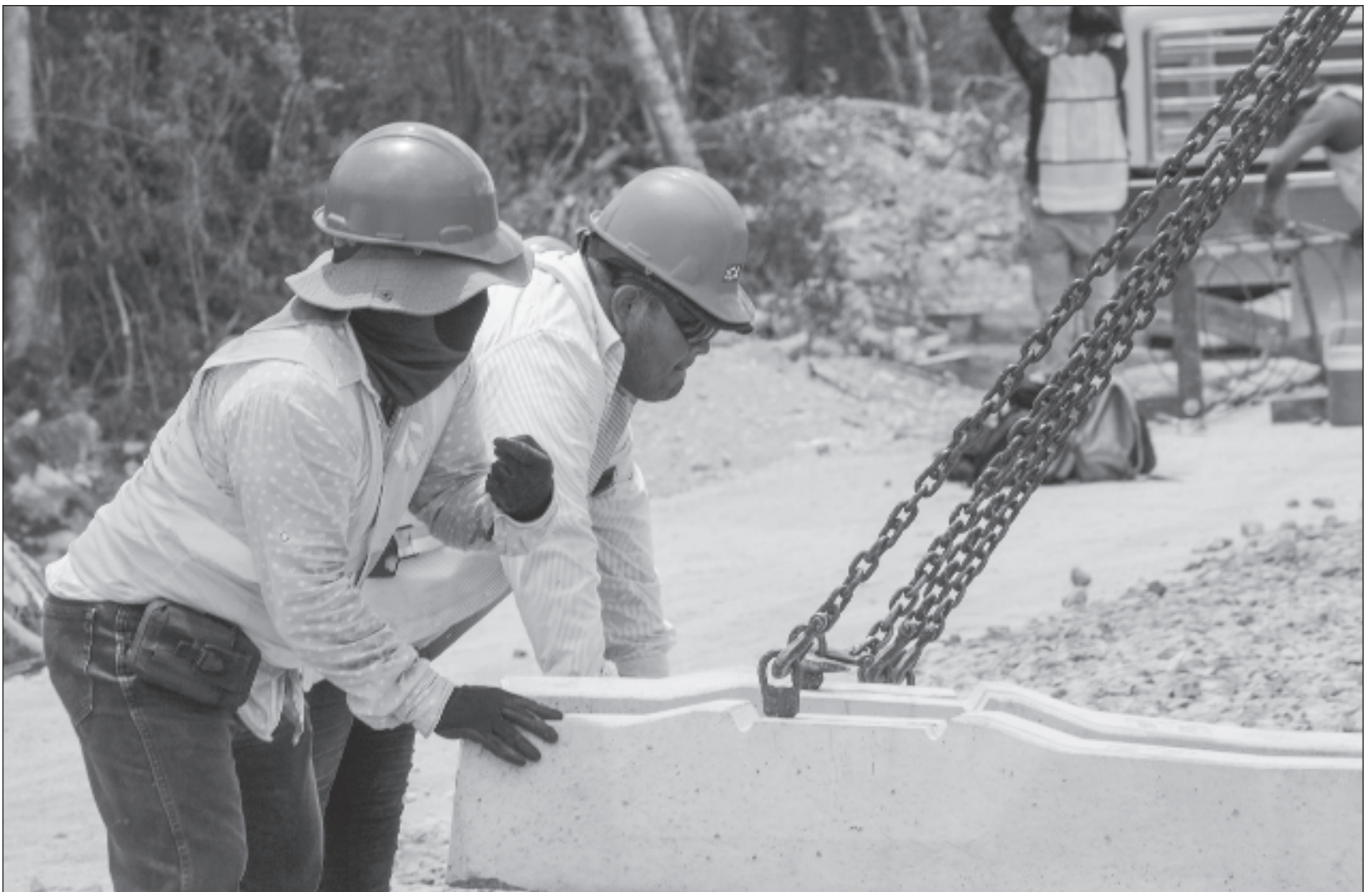
▲ La mayoría de las personas ocupadas laboralmente —41.5 millones, 69.9% del total— operó como trabajadoras o trabajadores subordinados y remunerados al ocupar una plaza o puesto de trabajo, y casi 13 millones trabajaron de manera independiente o por su cuenta sin contratar empleadas o empleados.

bajadores subordinados y remunerados al ocupar una plaza o puesto de trabajo, 12.9 millones (21.7 por ciento) trabajaron de manera independiente o por su cuenta sin contratar empleadas o empleados, 3.1 millones (5.1 por ciento) fueron personas empleadoras, y 2 millones de personas (3.3 por ciento) se desempeñaron en los negocios o en las parcelas familiares, es decir, contribuyeron de manera directa a los procesos productivos, pero sin un acuerdo de remuneración monetaria, detalla el Inegi.