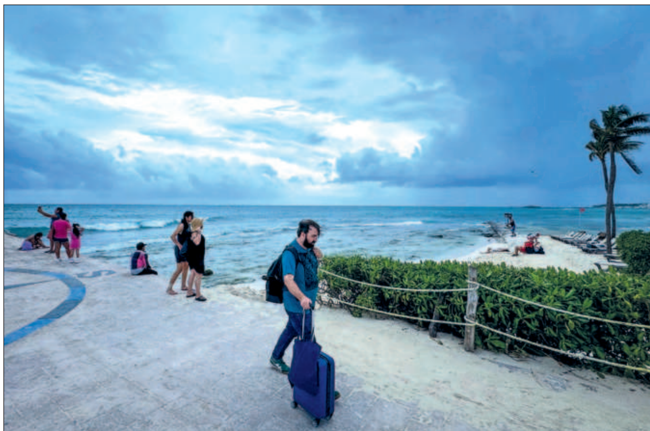
▲ Los pronósticos señalan, al cierre de esta edición, que el potencial ciclón tropical 18 se fortalecerá a medida que avanza por el Caribe occidental, se convertirá en tormenta tropical este lunes.

“Seguimos monitoreando muy de cerca el fenómeno” y sus probables efectos: Mara