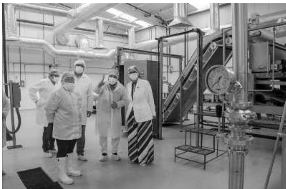
▲ Al adherirse al programa Entornos Laborales Seguros y Saludables, el personal de esta empresa que siembra y produce aloe desde la capital campechana se beneficiará directamente, al igual que sus familias.

En la planta de producción ubicada en la capital del estado que proporciona materia prima a la industria alimentaria, cosmética y farmacéutica, recibió el distintivo del IMSS, la gerente de con-