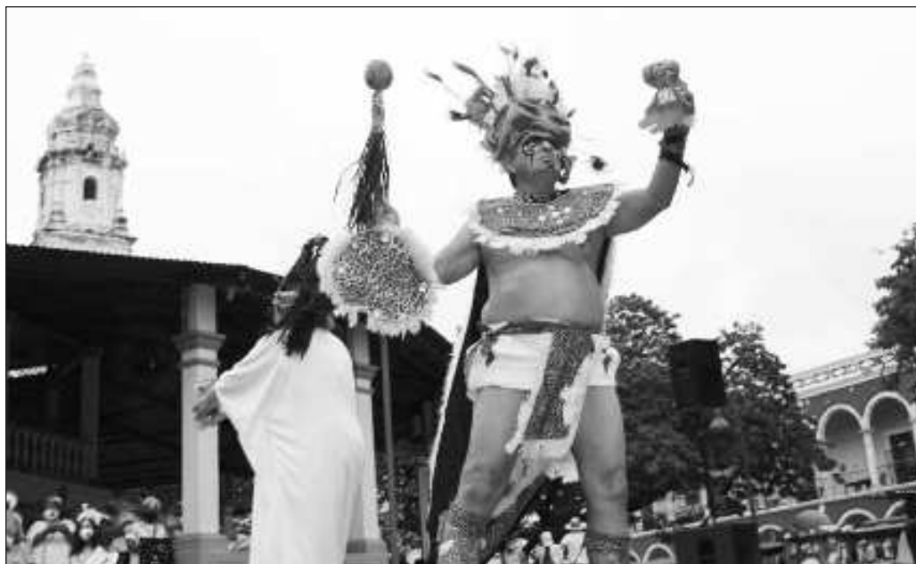
▲ Ya se marca una diferencia con el gobierno anterior y debiera ser suficiente para decir que la Cuarta Transformación pretende hacer algo novedoso en el rubro cultural.

Entonces, con Fidencio y María Elisa, puede decirse que el Renacimiento Maya ha puesto una pica en Flandes. Ambos han hecho mucho por evidenciar que los mayas pertenecen al actual momento histórico, que no son comunidades detenidas en el tiempo y que, por el contrario, que el maya es un pueblo que no solamente ha sobrevivido sino que tiene mucho más por brindar al mundo. La apuesta es grande, y seguramente habrá resultados sumamente significativos.