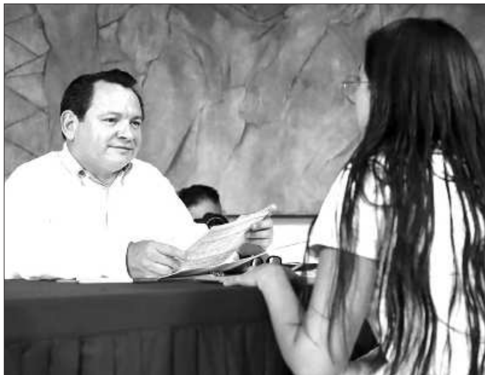
▲ Cientos de solicitudes fueron recibidas y canalizadas a las diferentes áreas de la administración estatal, entre las que destacan atención a la salud o apoyos para estudiantes y deportistas.

En este primer ejercicio de Audiencias con el Pueblo, que se realizó a lo largo de toda la semana hasta escuchar todas y cada una de las peticiones de audiencia, se atendieron solicitudes de los municipios de Abalá, Acanceh, Buctzotz, Celestún, Conkal, Chemax, Dzemu, Homún, Hochtún, Halachó, Kanasín, Umán, Hunucmá, Izamal, Opichén, Mérida, Mama, Maxcanú, Oxkutzcab, Progreso, Yaxcabá, Cuzamá, Motul, Tekantó, Peto, Sanahcat, Sacalum, Seyé, Tekal de Venegas, Teabo, Tekax, Temax, Tetiz, Ticul, Timucuy, Tixkokob, Tizimin, Tzucacab, Yaxkukul y Valladolid.