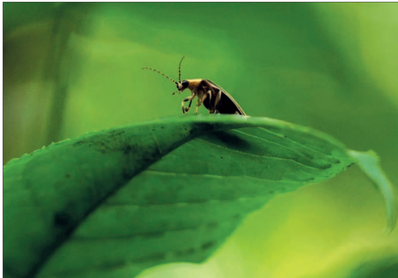
▲ La presencia de luciérnagas en las ciudades es rara, no es sólo por la contaminación lumínica que aleja a estos escarabajos de las urbes, sino otros factores como la pérdida de hábitat y el uso de pesticidas.

Su bioluminiscencia corresponde a un efecto bioquímico que implica a cuatro partes de su constitución anatómica: el fotoma, que es el órgano que se enciende, los fotositos, las células que reciben