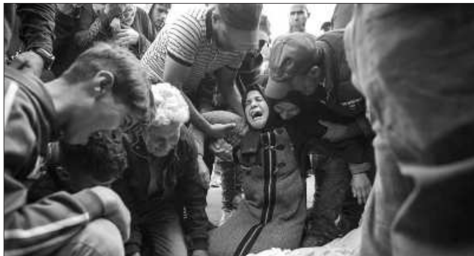
▲ Varios bombardeos golpearon ayer la región de Baalbek, bastión de Hezbolá en el este de Líbano, después de que el ejército israelí emitiera una advertencia de evacuación de la zona.

Varios bombardeos golpearon el domingo la región de Baalbek, bastión de Hezbolá en el este de Líbano, después de que el ejército israelí emitiera una advertencia de evacuación de la zona, según