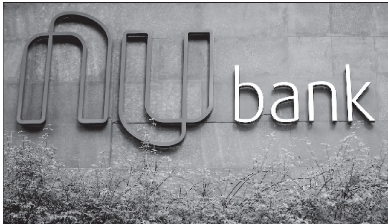
▲ A finales de 2023, algunas entidades financieras como Nu, Stori, Ualá ABC, Mercado Pago o Hey Banco comenzaron a ofrecer a sus clientes tasas de rendimiento de hasta 15 por ciento; dichos retornos llamaban la atención pues superaban los niveles de inflación y eran mayores a los que ofrecen los Certificados de la Tesorería.

El gigante brasileño Nu, uno de los mayores competidores del ecosistema financiero digital que en México opera como Sociedad Financiera Popular (Sofipo) comenzó a ofre-