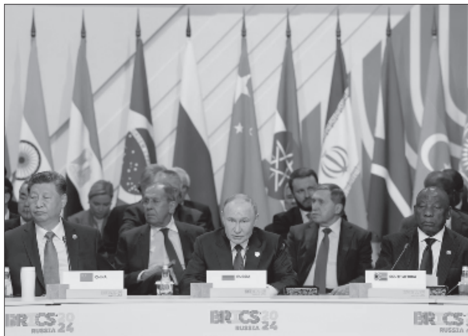
▲ El ministro de Asuntos Exteriores ruso, Serguéi Lavrov, expresó la confianza de que Brasil, que asumirá la presidencia del bloque el próximo año, continuará este trabajo.

Según Lavrov, Estados Unidos hará todo lo posible para conservar su hegemonía, por lo que una tarea común de los Estados miembros del grupo BRICS es mantener su seguridad