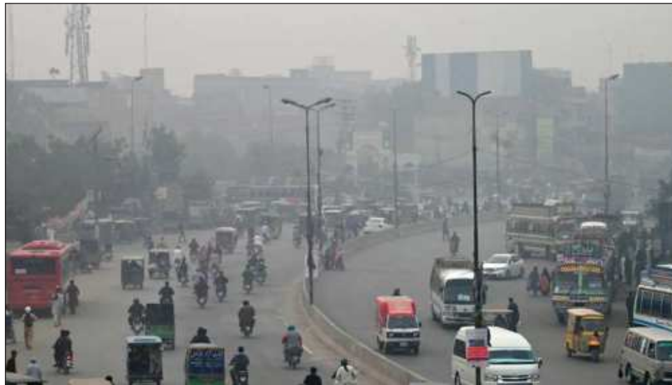
▲ La contaminación atmosférica en Lahore, la segunda ciudad de Pakistán, alcanzó el sábado un récord muy superior al nivel máximo considerado como aceptable por la OMS.

“Todas las clases” para niños de hasta 10 años, “públicas y privadas, bajo la jurisdicción de la ciudad de Lahore, deben permanecer cerradas durante una semana a partir del lunes”, manifestó una decisión del gobierno local consultada por AFP.