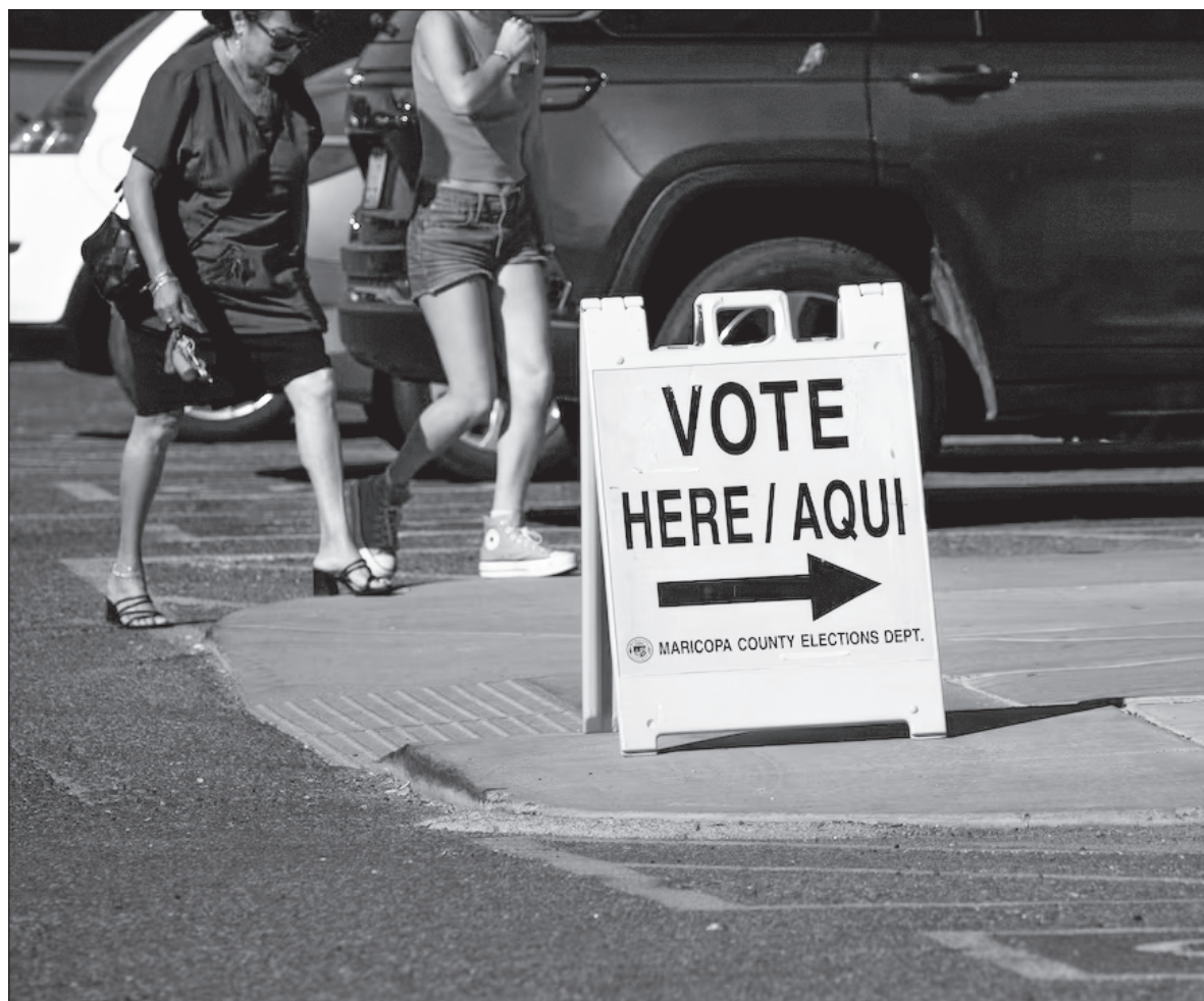
▲ “En tiempos electorales, hablarle o dirigirse a los latinos resulta ser un dilema complicado. Éstos ya no quieren oír hablar de migración, pero para los políticos como Trump es el tema fundamental”.

A su vez, los hispano-latinos de raza negra o mulata no quieren ser identificados como negros, aunque la corriente los lleve en ese sentido. Una historia publicada hace años narraba que dos balseros cubanos amigos, vecinos y del mismo equipo de fútbol, al llegar a Florida uno, que era blanco, se fue al barrio blanco y el otro, al barrio negro,