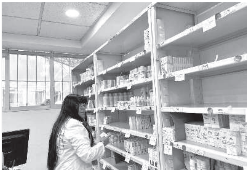
▲ El sector farmacéutico asumió el compromiso de intercambiar datos y estadísticas para resolver posibles cuellos de botella en la cadena logística de medicamentos.

El gobierno de Sheinbaum se comprometió a que el proceso se desarrolle con transparencia