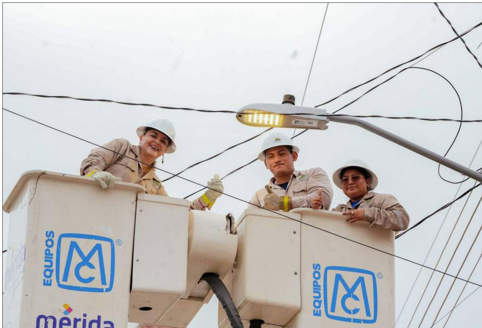
▲ La presidenta municipal de Mérida constató el trabajo que realiza el ayuntamiento en la Emiliano Zapata Sur III.

Para concluir Cecilia Patrón destacó que con este inicio de acciones tendrá como meta hacer el cambio de más de 80 mil lámparas de vapor de sodio a través de licitaciones que ofrezca precio y calidad, “hoy hay un 13 por ciento de avance de lámparas con luz led en avenidas principales, pero ahora vamos a entrar a las colonias en donde más se necesita”.