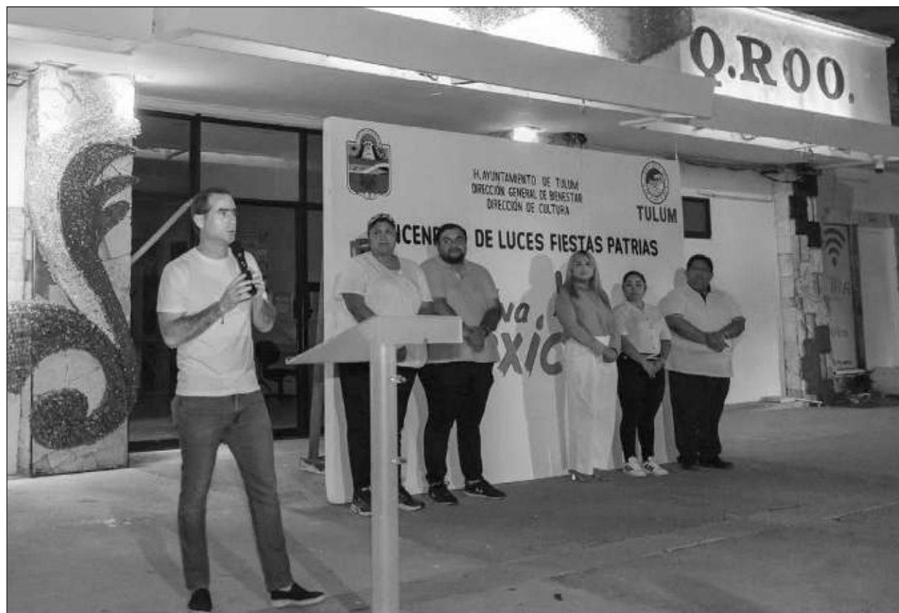
▲ El alcalde anticipó que septiembre "será un mes lleno de actividades y proyectos relevantes (...) El municipio se prepara para avanzar en su desarrollo y seguir fortaleciendo la colaboración con las instancias de gobierno".

Añadió que este mes quedará marcado en materia de obras que implementó el presidente de México, Andrés Manuel López Obrador, toda vez que inaugurarán el Parque del Jaguar y las estaciones del Tren Maya, dos proyectos