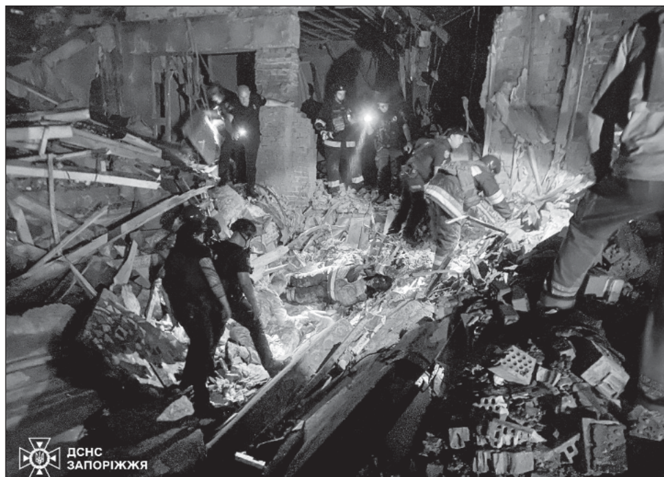
▲ Rescatistas inspeccionan los escombros de un hotel destruido después de un ataque dirigido por Rusia en Zaporizhzhia, en medio de la invasión a Ucrania.

De acuerdo con datos preliminares, dados a conocer horas más tarde por Filip Pronin, jefe de la administración militar de la región