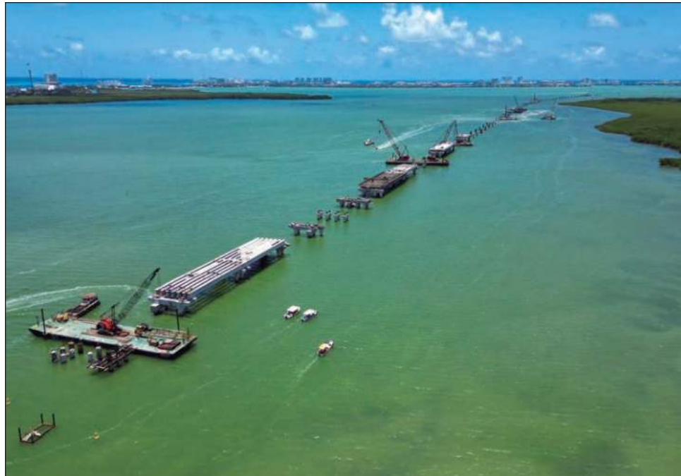
▲ Los empresarios quintanarroenses ven en la figura de Andrés Manuel López Obrador a un mandatario que ha invertido en el destino “como ningún presidente lo ha hecho antes”, lo que será traducido en bienestar para la entidad.

Añadió que, sin embargo, hay muchos otros temas, como en materia de seguridad y salud, en los cua-