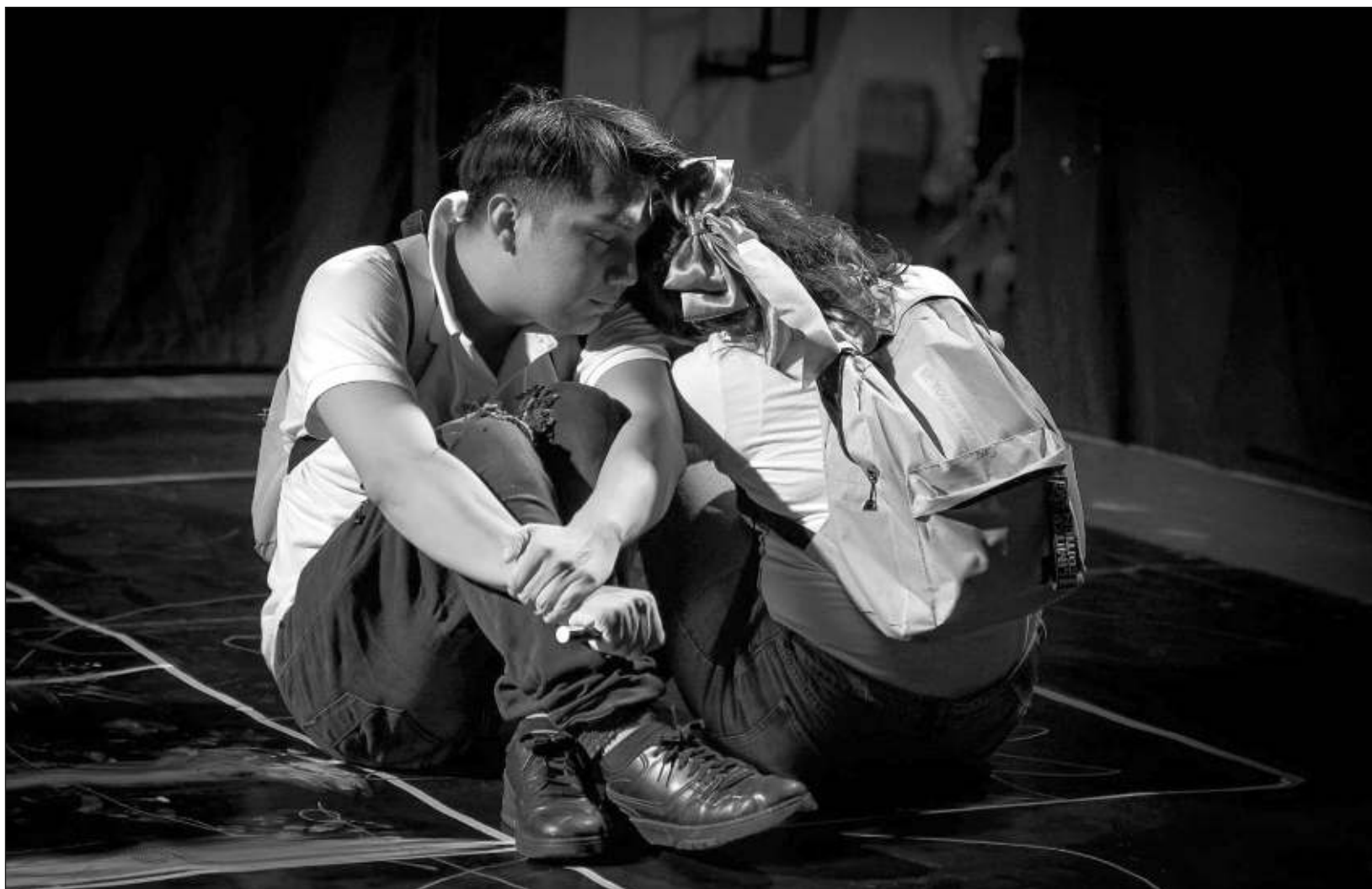
▲ Viernes de mezclilla parte de la relación de dos adolescentes que se conocen desde quinto de primaria y atraviesan juntos la preparatoria, en este vínculo sucede algo que hace que uno de ellos se cuestione sobre lo que considera correcto e incorrecto.

Viernes de mezclilla tendrá su estreno este viernes 6 de septiembre en Teatro Casa Tanicho a las 20 horas, y habrá una función más el domingo a las 12 del día. Los boletos pueden conseguirse en taquilla, con un costo de 150 pesos general y 100 pesos a estudiantes e Inapam.