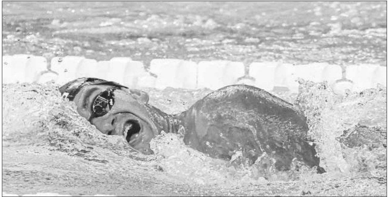
▲ “Cuarto lugar en unos Juegos Paralímpicos, bajar mi tiempo y hacer récord americano me tienen contento”, sostuvo.

“Yo creo que ese cuarto lugar estaba destinado a mí a lo mejor el fin de semana que compita pueda colgarme otra medalla más. El balance es más que positivo