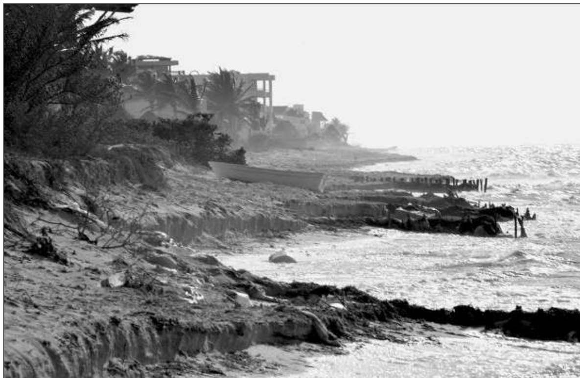
▲ “Cabe preguntarse de qué artimañas se han valido inversionistas que se ostentan propietarios de los terrenos, cuando en el mejor de los casos son simples usufructuarios; y no estaría mal saber qué funcionario de la Sedatu les ha facilitado el camino”.

Remover la vegetación de la duna costera tiene varias implicaciones, a cuál más grave. Las dunas son asiento de buena parte de la biodiversidad de los litorales peninsulares, y alojan no solamente las plantas con flores, hongos, mamíferos, aves, reptiles, crustáceos, arácnidos, anfibios e insectos que caracterizan el paisaje de nuestras costas, sino que incluyen entre ellos importantes ejemplos de especies endémicas consideradas amenazadas y en peligro de extinción, como las kuka ( Pseudophoenix sargentii ), chiit ( Thrinax radiata ) y la biznaga de nombre Mamillaria gaumeri , para mencionar únicamente algunos