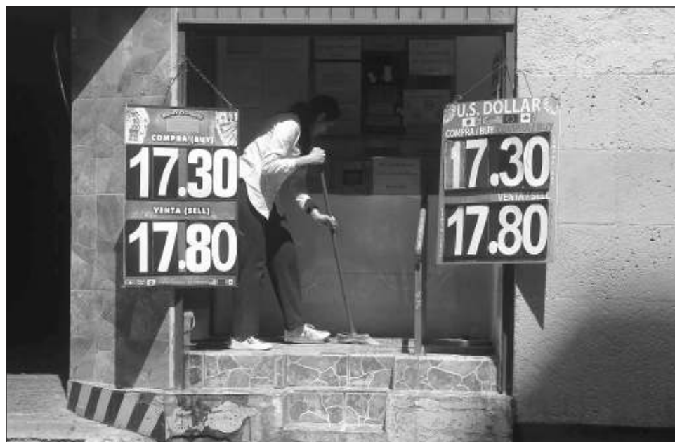
▲ Los pagos digitales son considerados el método de pago más rápido entre siete de cada 10 remitentes y destinatarios mexicanos, que mandan o reciben recursos.

“Las remesas son un sustento para muchas personas en México y son de vital