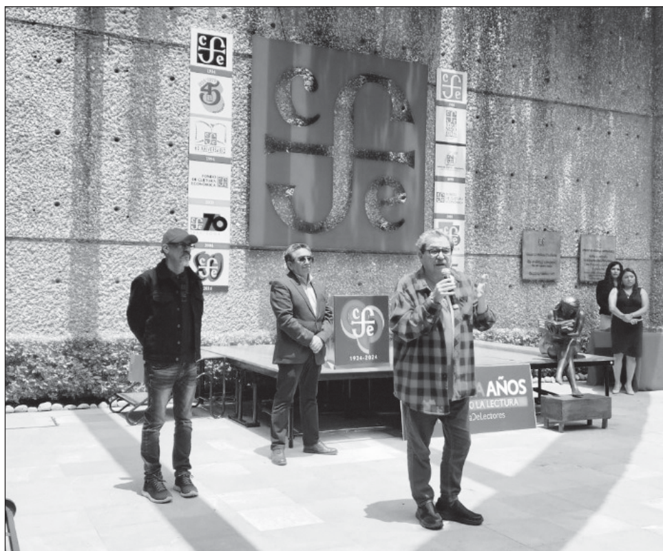
▲ El FCE, sostuvo Paco Ignacio Taibo II, “sí es muy Cuarta Transformación, muy con una lógica del libro para el servicio de la mayoría de la población”.

Taibo II comentó que el balance de su administración es bueno: “hemos transformado el Fondo. Lo sacamos del mausoleo en el que se encontraba, del bisne y la lógica de favores; bajamos el precio de los libros, mejoramos las cadenas de distribución, llegamos a lugares donde no lo hacíamos y realizamos un trabajo muy sólido de fomento de la lectura y de comunicación.