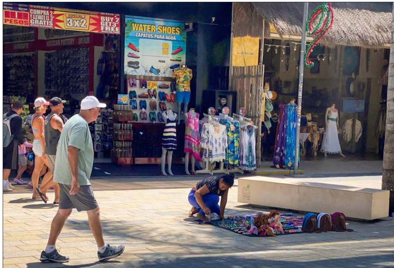
▲ En el primer trimestre de este año el Valor Agregado Bruto de la economía informal alcanzó 5 mil 695.4 mdp.

El VAB del sector informal aumentó 5.9 por ciento a