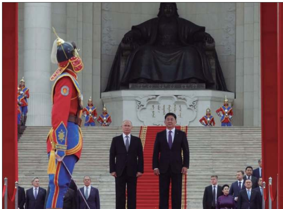
▲ Luego de muchos años de comunismo, en la década de 1990 Mongolia hizo la transición a la democracia y ha establecido relaciones con Estados Unidos, Japón y otros nuevos socios. Pero sigue dependiendo económicamente de sus dos vecinos, Rusia y China.

El mandatario ruso fue recibido en una ceremonia en la plaza principal de la capital, Ulán Bator, por una guardia de honor ataviada con brillantes uniformes rojos y azules al estilo de los de la guardia personal