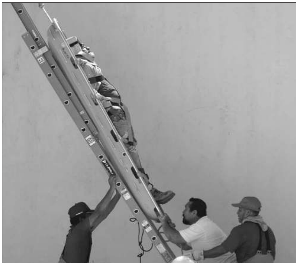
▲ El domingo pasado, al rendir su sexto y último informe de gobierno, AMLO sostuvo que el sistema de salud de México no era igual al de Dinamarca, sino que hasta lo había superado.

El domingo pasado, ante un repleto Zócalo de la Ciudad de México, donde rindió su sexto y último informe de gobierno, el jefe del Ejecutivo sostuvo que el sistema de salud de nuestro país no era igual al de Dinamarca, sino que hasta lo había superado.