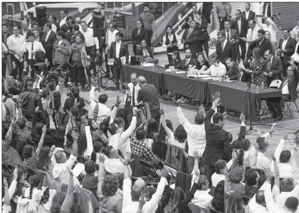
▲ A pesar de la postura de Morena en contra, el presidente en turno de la cámara, Sergio Gutiérrez Luna, concedió el receso para permitir el ingreso del panismo.