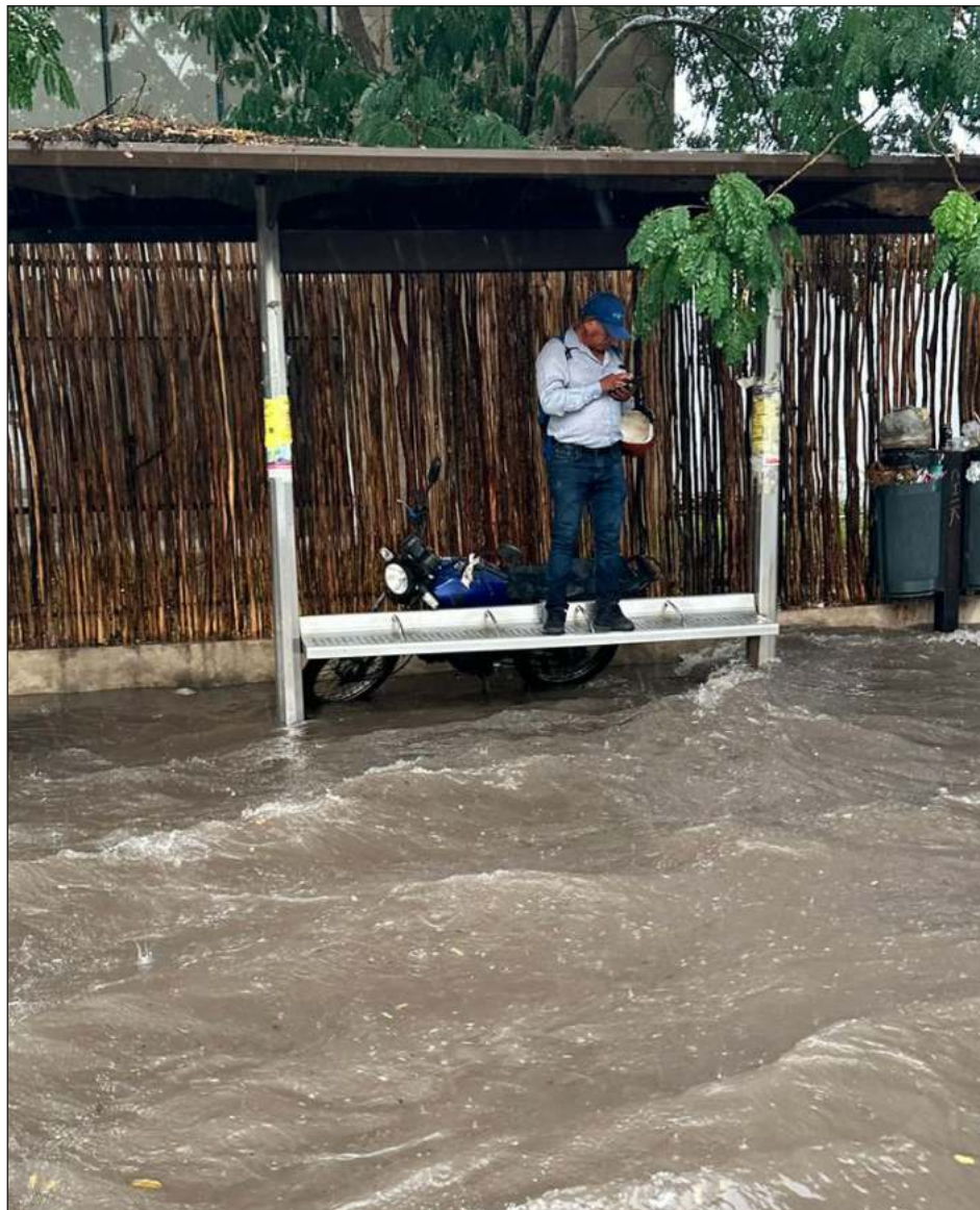
▲ Prociv alertó que del 7 al 9 de septiembre habrá lluvias con actividad eléctrica.

El lunes, las lluvias más intensas se registraron en el centro de Mérida. Según los datos pluviométricos de la Red de Monitoreo Atmosférico Peninsular, la capital yucateca registró una caída de lluvia de hasta 64 mm.