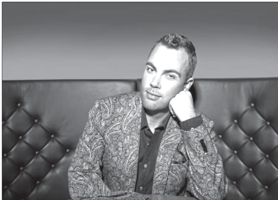
▲ Nacido en 1989, sin la mano derecha, el pianista ha desafiado las expectativas y barreras para convertirse en el único pianista con su condición en graduarse del Royal College of Music.

Nacido en 1989, sin la mano derecha, el pianista ha desafiado las expectativas y barreras para convertirse en el único pianista con su condición en graduarse del Royal College of Music en sus 130 años de historia. Su