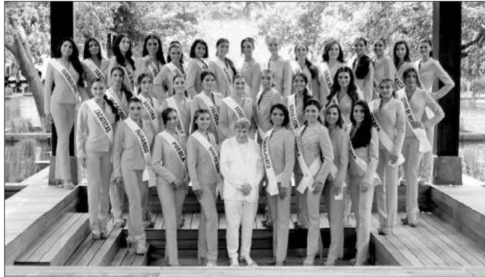
▲ Las 33 concursantes llegaron a Cancún desde el fin de semana para realizar diversas actividades previas al certamen y fueron presentadas en conferencia de prensa.

"La verdad es que a nosotros nos ha ido muy bien en nuestra ocupación, cuando se dio el aviso de que el hotel iba a ser sede de las participantes tuvimos muchos visitantes de muchos estados, como saben hay gente que sigue a las participantes a todos lados, entonces tuvimos muy buena participación