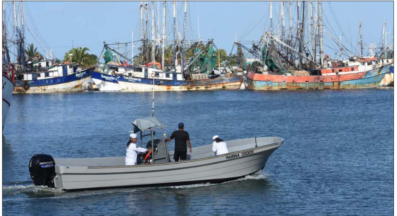
▲ Hasta el momento, no se sabe con exactitud cuántos de los pescadores podrán sumarse a la temporada de captura.

La veda debió levantarse el 15 de agosto pasado; el presidente de la Cámara Nacional de la Industria Pesquera y Acuícola (Canainpesca) en Campeche,