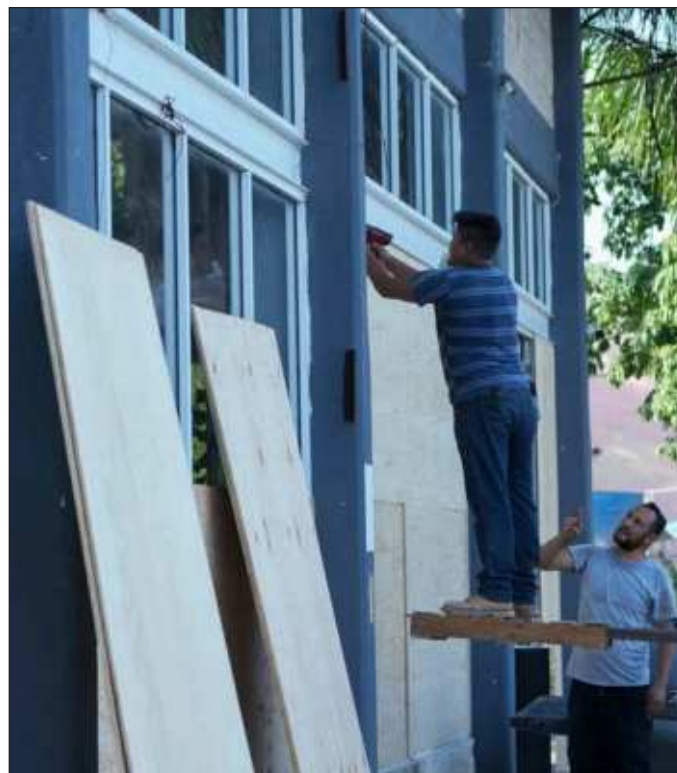
▲ Habrá quienes resulten afectados por el paso de Beryl (...) pero nos corresponde estar atentos a las indicaciones, para que un fenómeno natural no termine convirtiéndose en tragedia familiar o estatal.

Debe reconocerse, sin embargo, que la mayor parte de la población yucateca ya incorporó a su vida diaria alguna medida de prevención aplicable durante la temporada de ciclones. Hace falta todavía fomentar hábitos que fortalezcan una cultura cívica que implique dar aviso de pozos colectores obstruidos (y que estos no se tapen por la acumulación