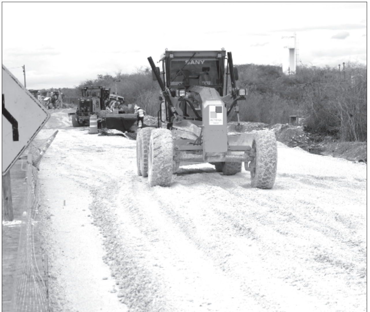
▲ El objetivo de esta iniciativa es no permitir que gobiernos opositores bloqueen o suspendan los trabajos de obras que tendrán un impacto social y económico benéfico para el estado y los ciudadanos alrededor de estas.

En este sentido, los diputados del Partido Revolucionario Institucional (PRI) y Movimiento Ciudadano se opusieron a la iniciativa destacando precisamente las afectaciones a la ciudad descritas anteriormente, por no presentar un proyecto ejecutivo, tal como ocurrió con el Tren Maya, ya que hoy varias comunidades se inundan por no contar con los drenajes ofrecidos.