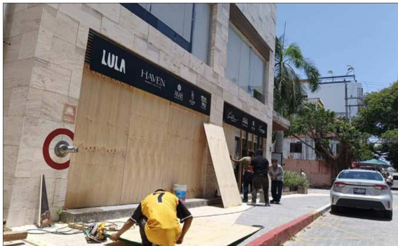
▲ Beryl ocasionará lluvias intensas a puntuales torrenciales, rachas fuertes de viento y oleaje elevado en la península.

“Conforme vayan pasando las horas tendremos información más clara”, mencionó la