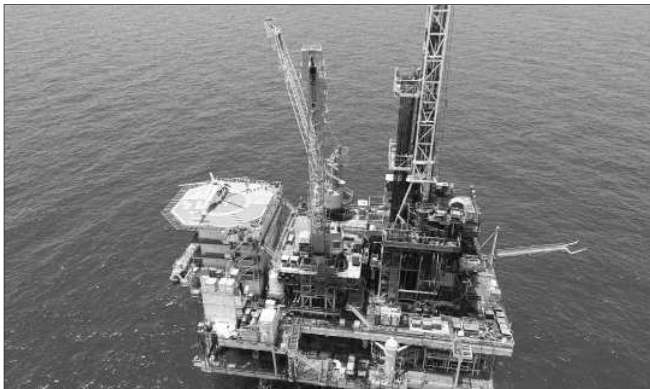
▲ El desalojo se determinará una vez que se confirme si la trayectoria de Beryl impactará las instalaciones marinas, se realizaría para evitar que se ponga en riesgo la integridad de los trabajadores que se encuentran a bordo.

El desalojo se determinará una vez que se confirme si la trayectoria del huracán impactará las