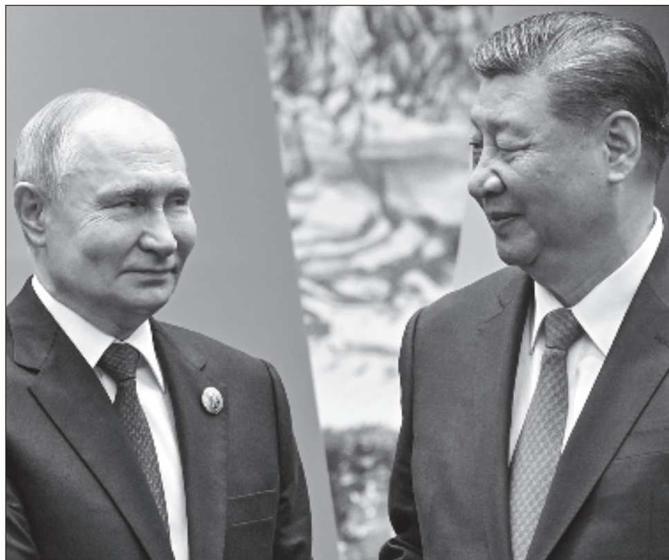
▲ "La interacción ruso-china en los asuntos mundiales es uno de los principales factores estabilizadores en la arena internacional", afirmó el presidente ruso durante el encuentro de la cumbre de la OCS.

Se trata la segunda reunión entre Putin y Xi en menos de dos meses, tras