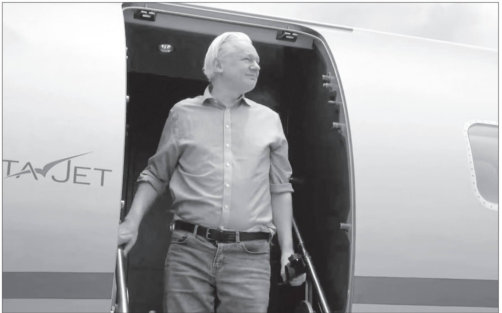
▲ “Ante el impacto que alcanzó la figura de Julian, Fidel Castro expresó en 2010: ‘el audaz desafío no provenía de una superpotencia rival; de un Estado con más de cien armas nucleares; o de una doctrina revolucionaria capaz de estremecer los cimientos al Imperio (...) era sólo una persona’”.