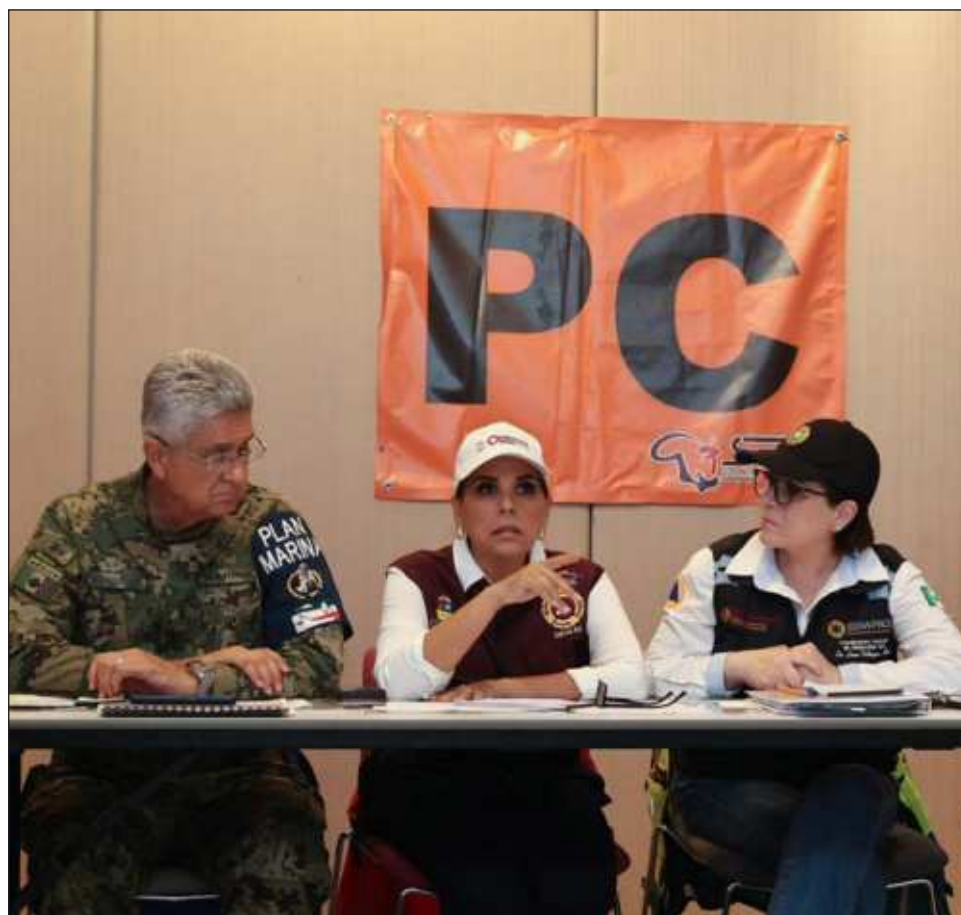
▲ La funcionaria federal informó que se mantienen los recorridos por todo el litoral quintanarroense, desde el río Hondo, en el sur, hasta Holbox, en el norte, para informar a la población acerca de las medidas preventivas que deben adoptar para su protección.

Se mantienen los recorridos por todo el litoral quintanarroense, desde el río Hondo, en el sur, hasta Holbox, en el norte, para informar a la población acerca de las medidas pre-