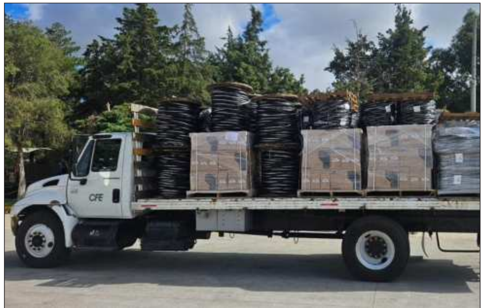
▲ La dependencia federal aseguró que a través del Sistema Nacional de Protección Civil, está coordinada con la Sedena, la Semar, Conagua, Ssa, gobiernos estatales y municipales, para la atención de la posible contingencia.

“La CFE cuenta con planes específicos para la atención de emergencias, los cuales tienen como prioridad establecer los mecanismos para la toma oportuna de decisiones, en caso de la afectación al suministro eléctrico ocasionado por ciclones tropicales, o cualquier otro fenómeno natural. Con la aplicación de los protocolos, se han reforzado los recursos humanos y materiales para atender la contingencia en las mejores