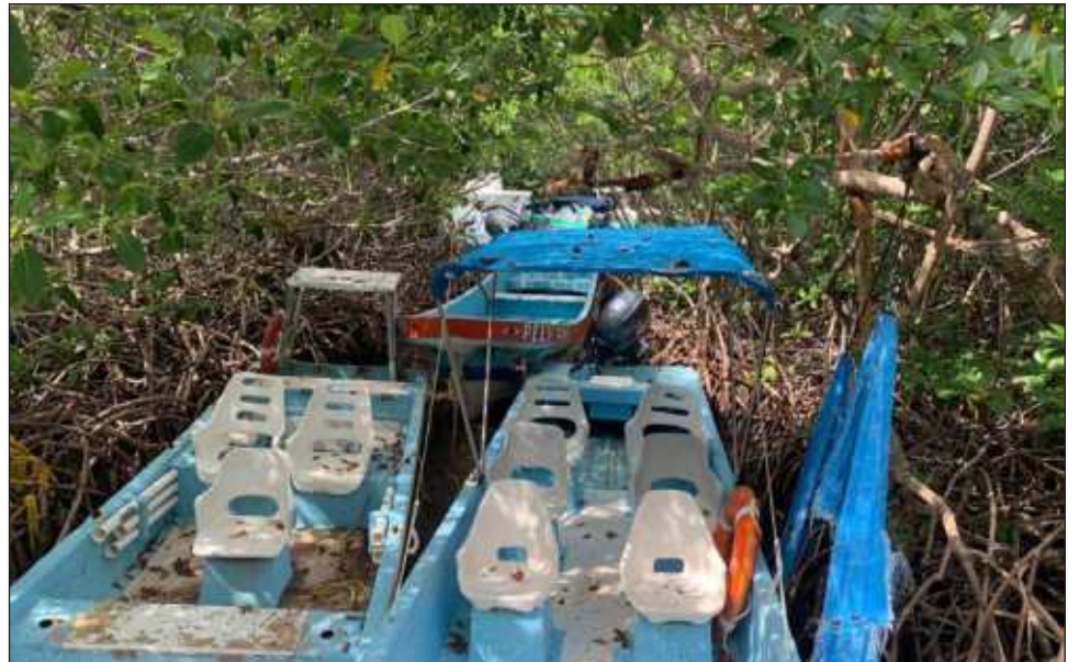
▲ El manglar es la protección natural para los pescadores ante los fenómenos hidrometeorológicos, por lo que es ahí donde estacionaron sus embarcaciones.

Antes de partir los pescadores resguardan sus embarcaciones, muchas de las cuales dejaron dentro del manglar, que es la protección natural para ellos ante los fenómenos hidrometeorológicos. El resto de la población abandonará Punta Allen entre ayer miércoles y hoy jueves.