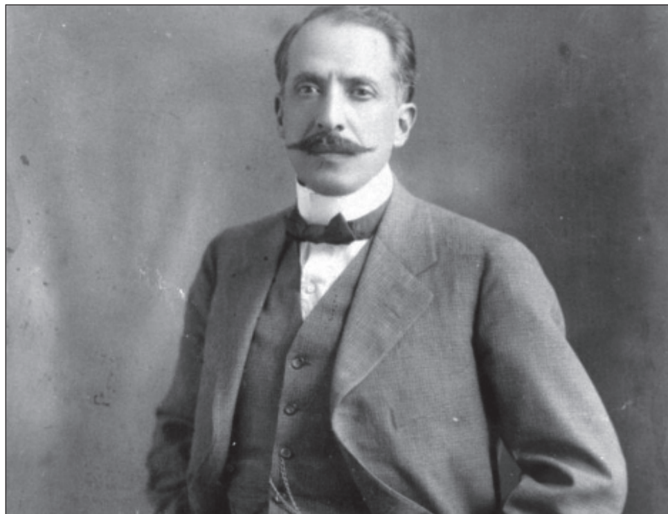
▲ El artillero Ángeles fue un héroe popular de la Revolución mexicana que, según las crónicas de su fusilamiento, mantuvo la entereza en ese último momento, eligió el lugar de la ejecución y se negó a que le vendaran los ojos.

En su volumen, Gilly (Buenos Aires, 1928-CDMX, 2023) mostró los rasgos del