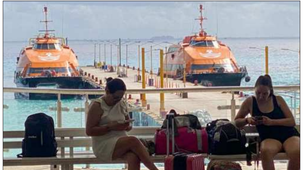
▲ La Apiqroo informó que hasta ayer los muelles de Isla Mujeres, Puerto Juárez, Punta Sam, Playa del Carmen y Cozumel estaban abiertos a la navegación de la ruta federal de pasajeros.

Transcribe, naviera responsable del traslado de automóviles y mercancías desde Punta Venado hacia Cozumel, anunció la suspensión de sus actividades el jueves y viernes, reanudándolas el sábado 6 de julio a medida que las condiciones del clima lo permitan. Sus últimas salidas fueron este miércoles, a las 4 horas saliendo de Punta Venado y a las 9:30 horas partiendo de