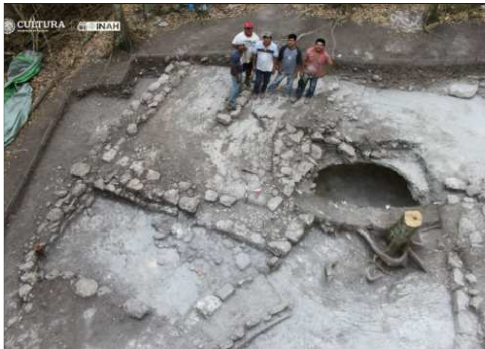
▲ Descubren restos óseos humanos, así como de varios animales, al fondo de una cavidad que, después de servir como depósito de agua, fue convertida en lugar de enterramiento.