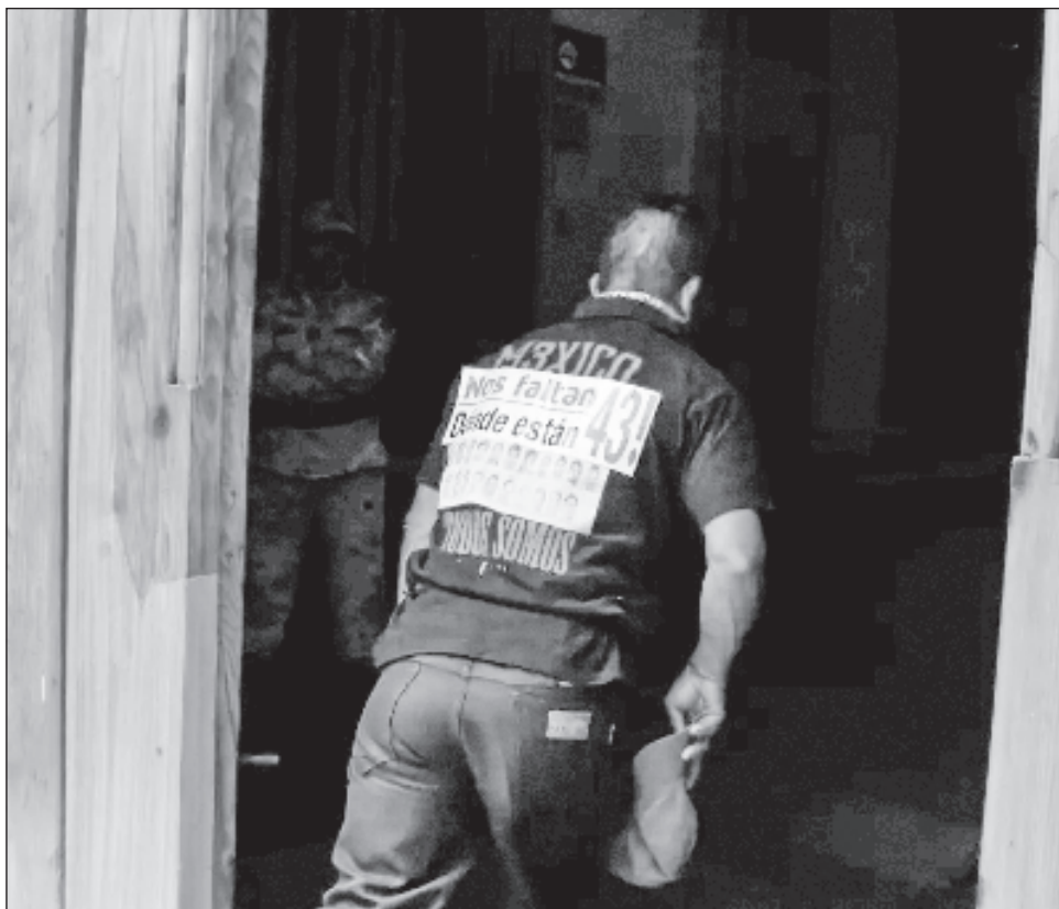
▲ Los familiares de los 43 jóvenes normalistas de Ayotzinapa ingresaron a Palacio Nacional poco después de las 11 horas para reunirse con el presidente López Obrador.