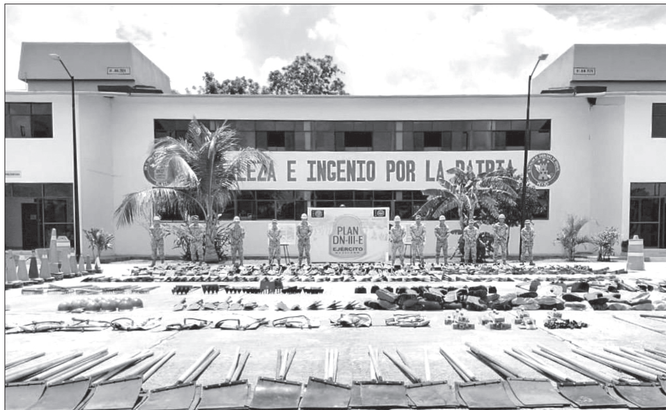
▲ Casi cinco mil elementos de la Secretaría de la Defensa Nacional estarán listos para atender a la población afectada.

De igual forma, un avión C-130 Hércules de la Fuerza Aérea Mexicana trasladará del Centro Estratégico de Acopio de la Secretaría de la Defensa Nacional ubicado en la Base Aérea Mi-