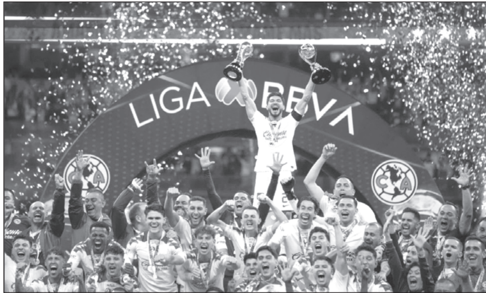
▲ El delantero yucateco Henry Martín es clave para los bicampeones de la Liga Mx.