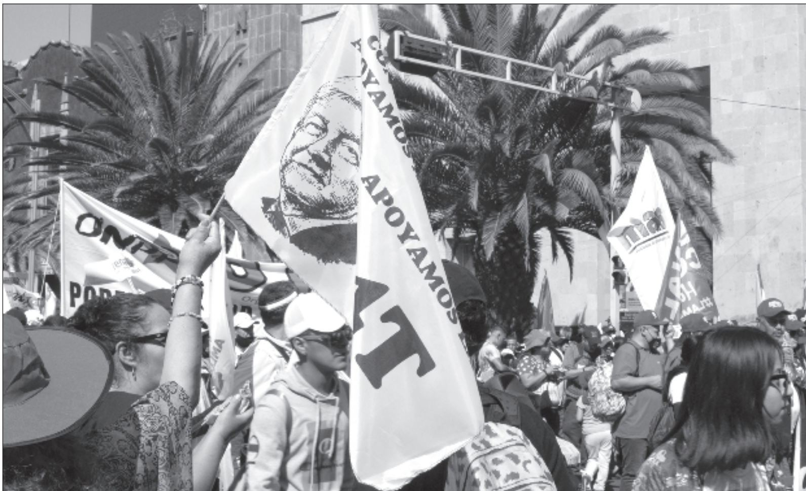
▲ "Abundan ejemplos de corrupción y soberbia de gente empoderada sin valores, sin trayectoria, sin pericia, sólo usufructuarios de la popularidad de López Obrador, quien ya se va Urge una oposición con gente de mayor calidad que sus élites actuales, para fortalecer la competencia política con Morena y sus aliados, por bien de México".