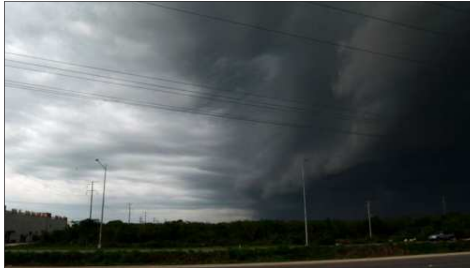
▲ El transporte público en Mérida dará servicio hasta el último minuto del jueves; sólo continuará con el apoyo para el traslado a unidades médicas, hospitales o servicios de emergencia.

Además, se determinó suspender las actividades económicas no esenciales, primero en los municipios del oriente y Cono Sur del estado, que serán los primeros en recibir el impacto del ciclón. La suspensión aplica en Chichimilá, Peto, Kaua, Dzitas, Chikindzonot, Chemax, Chankom, Chacsinkín, Yaxcabá, Valladolid, Uayma, Tzucacab, Tixcacalcupul, Tinum, Tekom, Tahdziú, Cun-