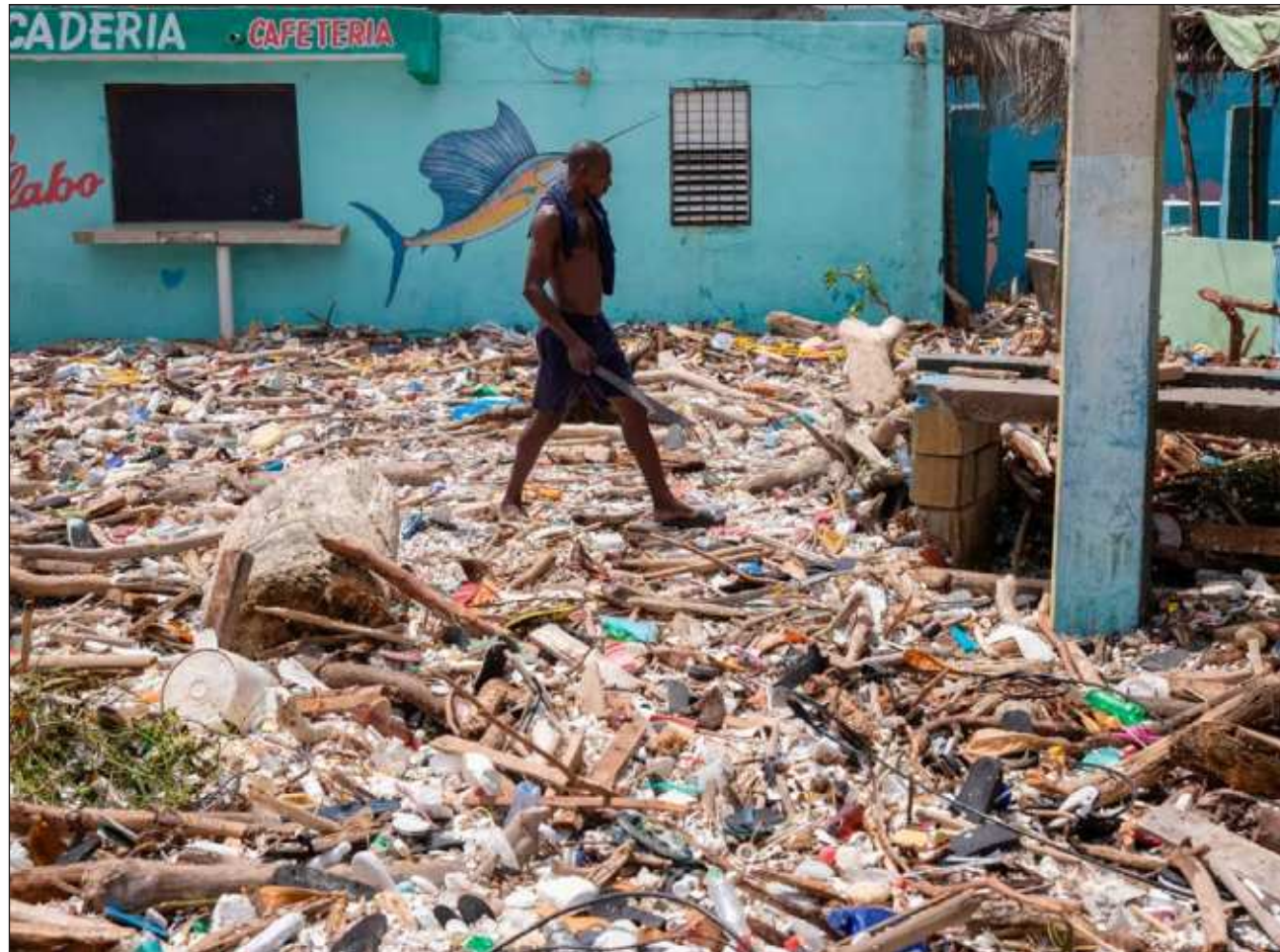
▲ Según el último boletín de la agencia meteorológica de Jamaica, están previstas precipitaciones totales de 100 a 200 milímetros y peligrosas marejadas ciclónicas que elevarán los niveles del agua hasta dos o tres metros.

Por su parte, el primer ministro de Jamaica, Andrew Holness, informó que una orden de evacuación está vigente para áreas propensas a inundaciones