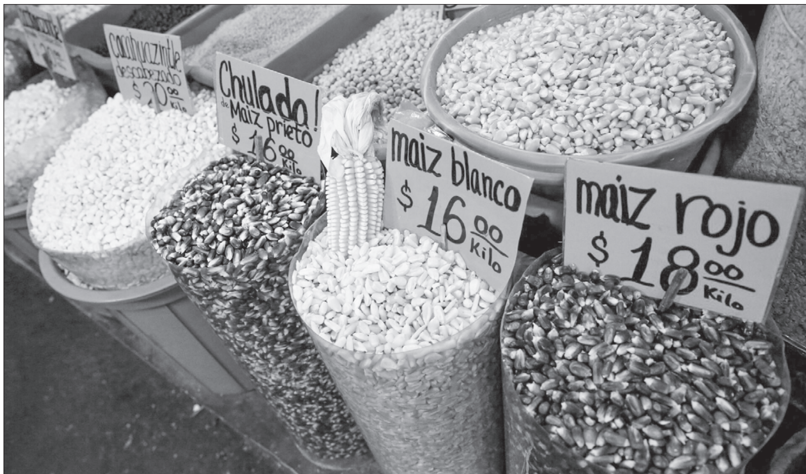
▲ "El recién nombrado secretario de Agricultura y Desarrollo Rural, Julio Berdegú, ha indicado que, además de impulsar el bienestar alimentario (...) anuncia desde ahora frenar el maíz transgénico y sustituir el glifosato en los cultivos con la intención de estar en sintonía con el proyecto del segundo piso de la 4T".