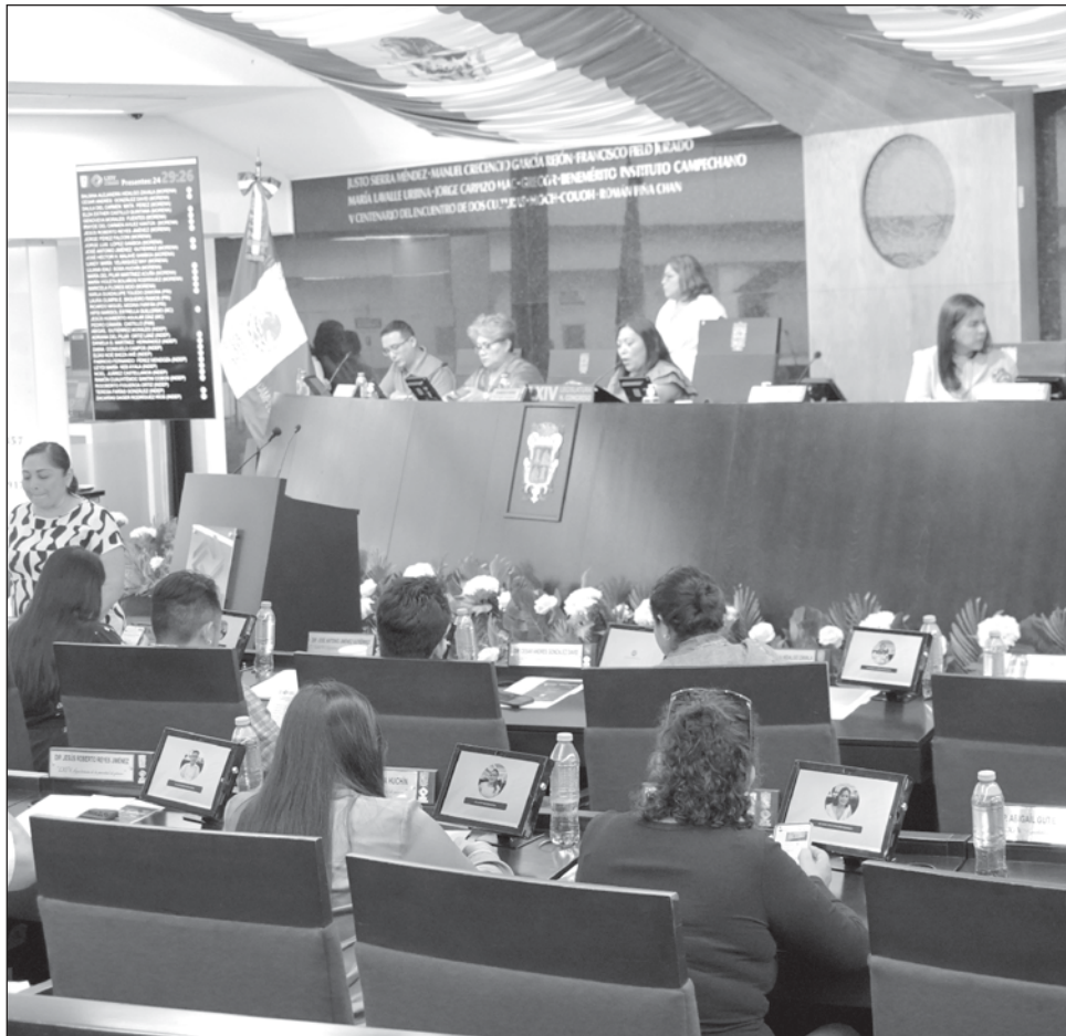
▲ Los resultados propician a que las curules plurinominales se queden en Morena y Movimiento Ciudadano, pues no habrá otra fuerza política en el Legislativo de Campeche.

Los virtuales ganadores han publicado en sus perfiles de Facebook mensajes de agradecimiento y compromiso para los siguientes tres años de administración pública y que arrancarán el próximo 1 de octubre.