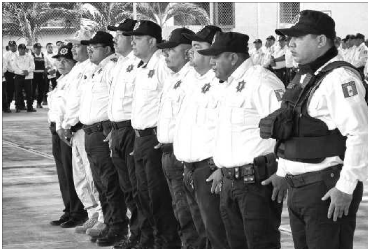
▲ El martes por la noche el director jurídico de la SPSC entregó dos circulares o avisos a los inconformes para que los agentes estén enterados de la designación de la Academia de Policía como sede alterna.

Por lo anterior la Semabicece indicó: "En tan sólo una semana se generaron más puntos de calor que en los últimos tres meses, por lo que emitimos una recomendación a los ayuntamientos de promover el trámite de aviso de quema, y a las y los productores a tomar las medidas preventivas para evitar que la preparación de su terreno derive en un incendio forestal".