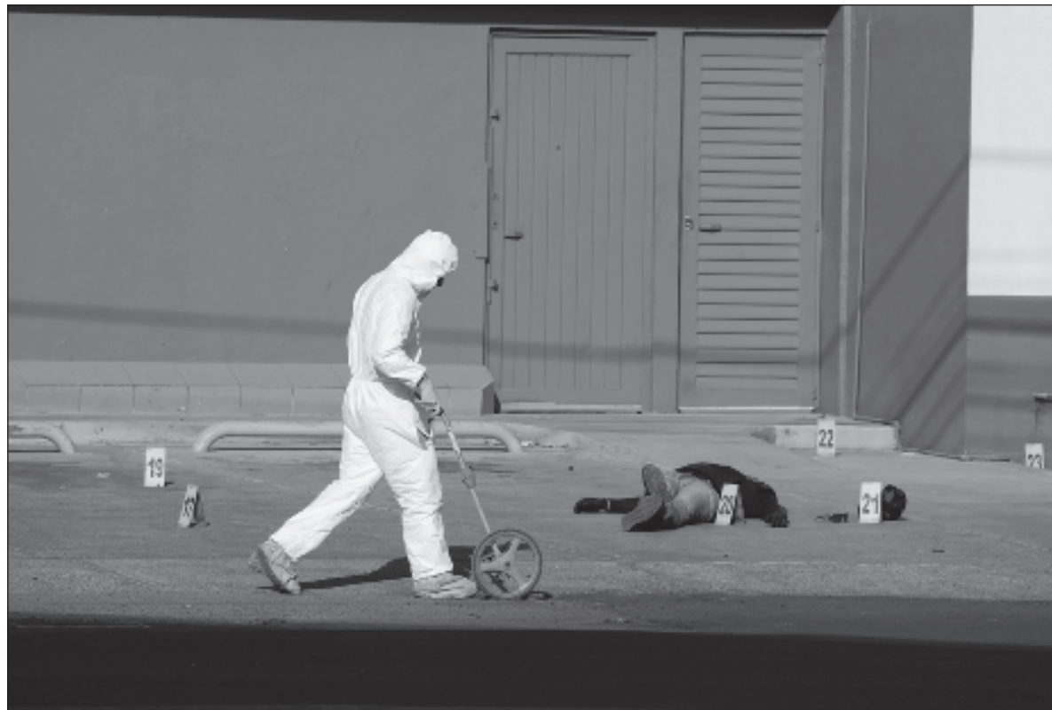
▲ “La premisa del proyecto es que ‘en México, la violencia electoral se ha convertido en herramienta del crimen organizado para influir en la vida pública de estados y municipios’.

“De 2018 a lo que va de 2024 se han registrado en México mil 755 ataques, asesinatos, atentados y amenazas contra personas que se desempeñan en el ámbito político, gubernamental o contra instalaciones de gobierno o partidos”, reportan el equipo de investigación de Data Cívica y del Programa para el Estudio de la Violencia (PEV) del CIDE en el micrositio Votar entre Balas , proyecto de documentación en