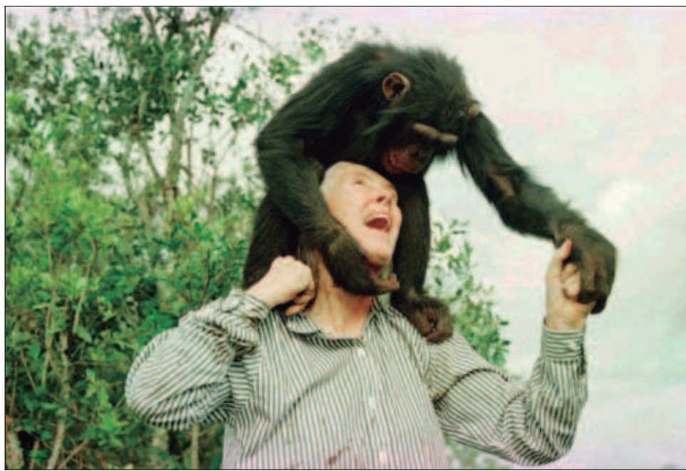
▲ El emotivo abrazo que recibió de Wounda, una chimpancé a la que devolvió la libertad en 2013 en el Congo y que, poco después de salir de la jaula, la miró y abrazó en gesto de gratitud, es un símbolo de la vida de entrega que Goodall ha ofrecido a esos animales.

El destino la colocó en el camino del antropólogo Louis Leakey (1903-1972) en Nairobi, con el que viajó como asistente a la garganta de Olduvai, popularmente llamada "la cuna de la humanidad", en busca de fósiles de homínidos.