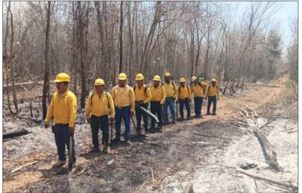
▲ El CEMF detalló que en Tulum el incendio se presentó en Los Tres Cenotes y a la fecha se registra una superficie afectada de 35 hectáreas, con 50% del fuego liquidado.

En Bacalar el siniestro se reportó en el norte de la comunidad de Caanán, teniendo a la fecha 20 hectáreas arbustivas afectadas con un control del 70 por ciento y liquidado en un 50 por ciento; informaron también que el lunes se liquidó otro incendio forestal en