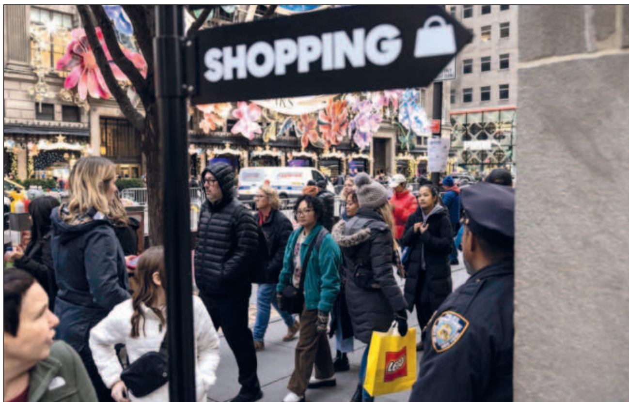
▲ Las naciones de bajos ingresos han resistido peor de lo previsto, señala la gerente del fondo, Kristalina Georgieva.

Según Georgieva, el Producto Interior Bruto (PIB) de los países de bajos ingresos está hoy 10 por ciento por debajo de lo proyectado antes de la pandemia y la mayoría tiene “altos niveles de endeudamiento”, que consumen “13 por ciento del PIB”. “Lo que me preocupa especialmente es que, dado que el crecimiento es lento, sus posibilidades de ponerse al día en realidad empeoran”, apuntó.