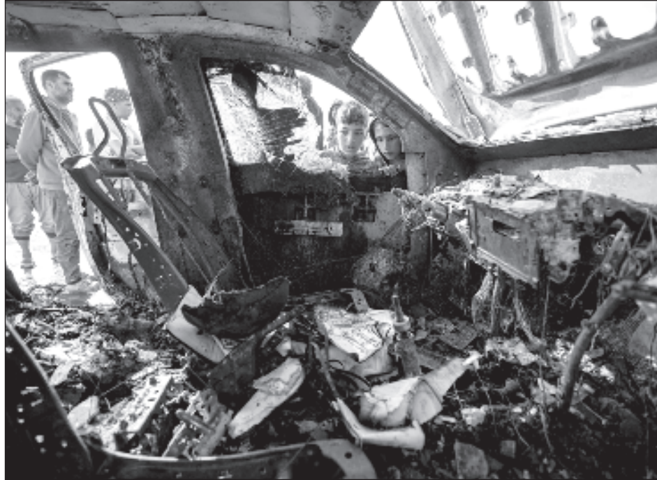
▲ Los integrantes de World Central Kitchen murieron cuando su comitiva fue alcanzada poco después de que supervisarán la descarga de 100 toneladas de alimentos llevados a Gaza por mar.

En una entrevista en vídeo, Andrés afirmó que el grupo benéfico World Central Kitchen (WCK), fundado por él, mantenía una clara comunicación con el ejército israelí, que, según el chef, conocía los movimientos de sus cooperantes.