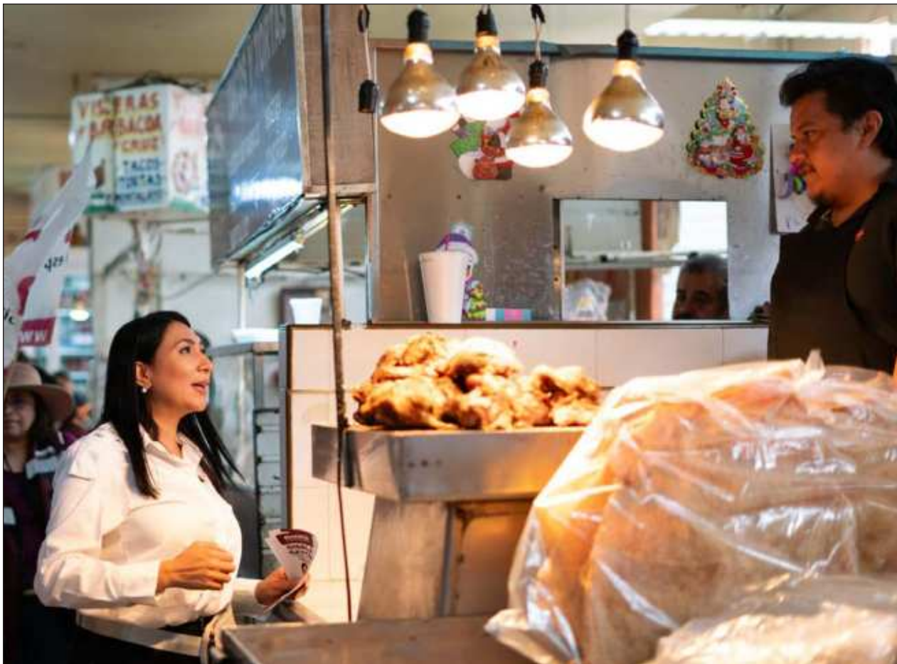
▲ Gisela Gaytan, la candidata de la alianza Seguiremos Haciendo Historia a la alcaldía de Celaya, Guanajuato, fue asesinada a balazos el lunes mientras realizaba actividades proselitistas durante su primer día de campaña.

“No entiendo cuál fue la razón -para no asistir-, pero creo debieron estar ahí, vamos a cumplir con invitarlos a participar a las reuniones y esperamos que puedan participar”, externó.