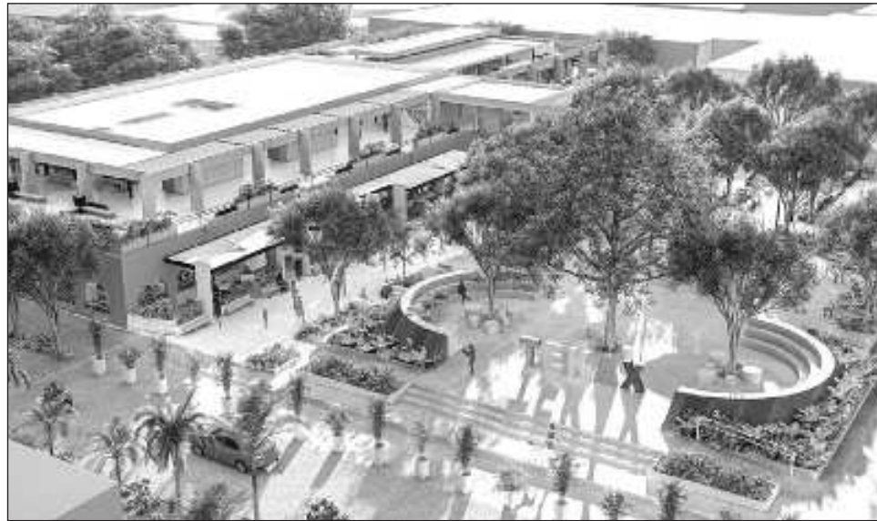
▲ El gobernador constató la entrega de certificados de Certeza Patrimonial, la nueva imagen de la Casa Ejidal y la construcción del nuevo mercado municipal.

También, se equipó con sillas, mesas, archivero, bo-