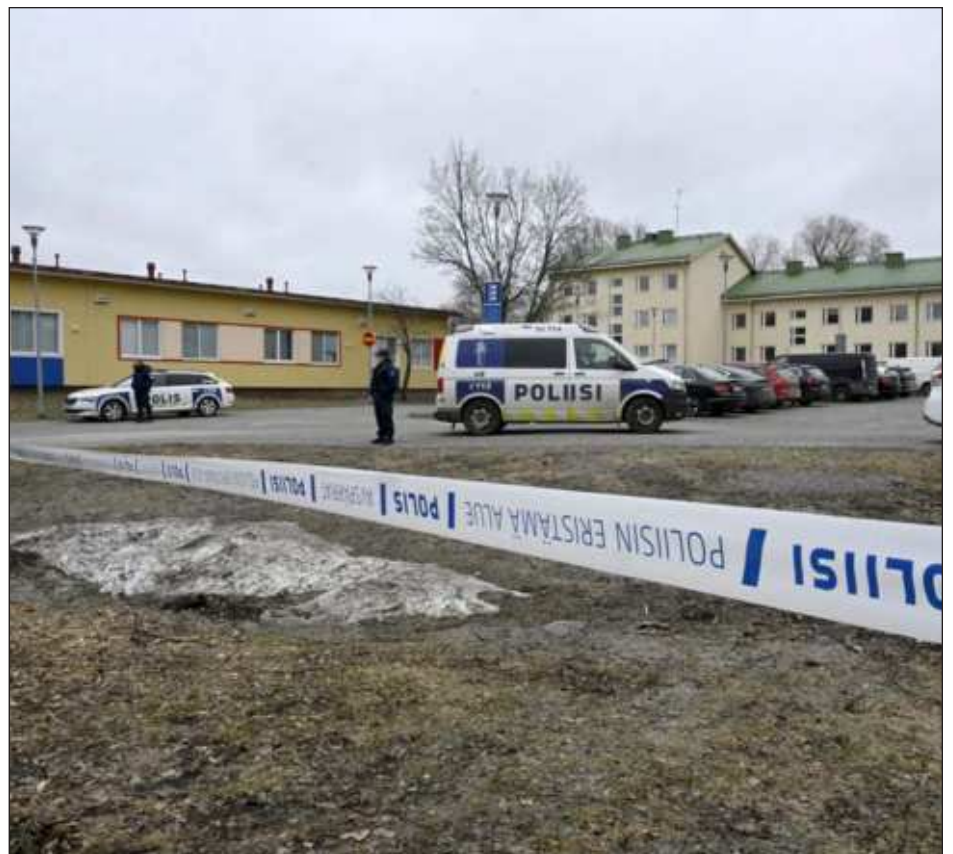
▲ El tiroteo se produjo este martes poco después de las 9 horas, y el sospechoso fue después aprehendido por la policía sin ofrecer resistencia a unos kilómetros del lugar del crimen.

El primer ministro finlandés, Petteri Orpo, se comprometió este martes en una rueda de prensa a que las autoridades realizarán una investigación exhaustiva de la tragedia y aseguró que su gobierno abordará el problema de la violencia escolar una vez se conozcan sus conclusiones.