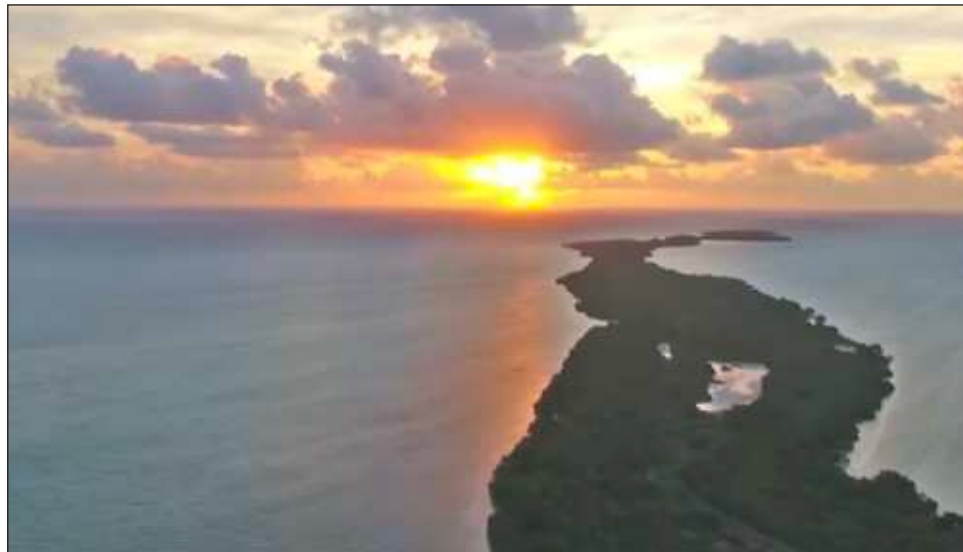
▲ La inmobiliaria europea Iad España puso a la venta esta isla que se encuentra dentro del territorio del municipio de Felipe Carrillo Puerto.

Advirtió a los posibles compradores interesados en adquirir propiedades legítimas en el estado, porque podría tratarse de un fraude o publicidad engañosa, ya que no se está ofertando la propiedad de un particular, sino un patrimonio del Estado mexicano. En los últimos días ha causado revuelo la oferta de venta en la web de esta ínsula, que aunque se publicita como parte de la Riviera Maya, está ubicada