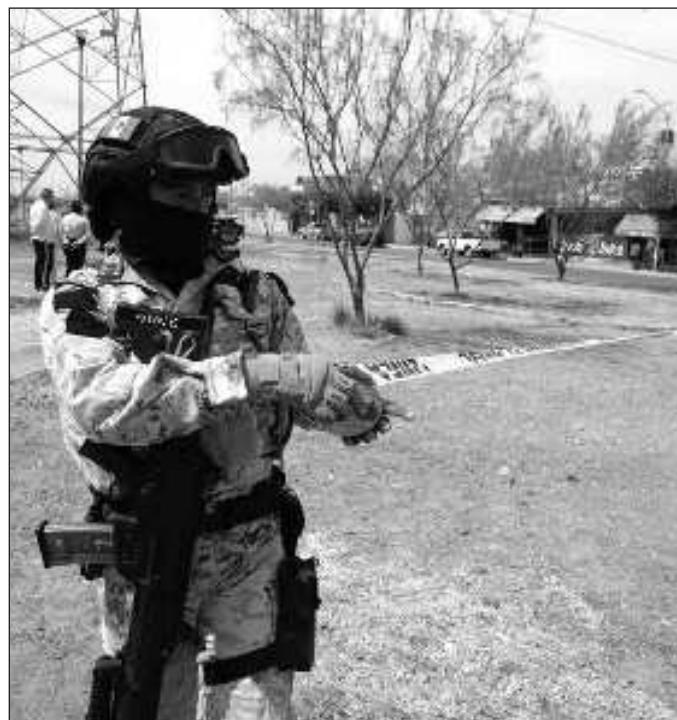
▲ Para llegar al extremo de violencia que actualmente se vive en el proceso electoral se debieron dejar pasar otras expresiones.

Para llegar al extremo de violencia que actualmente se vive en el proceso electoral se debieron dejar pasar otras expresiones agraviantes que se dejaron crecer al extremo de dejar de reconocer en el adversario a alguien que también desea mejoras para el municipio, el distrito, el estado o el país, y en cambio sí como alguien que merece reci-