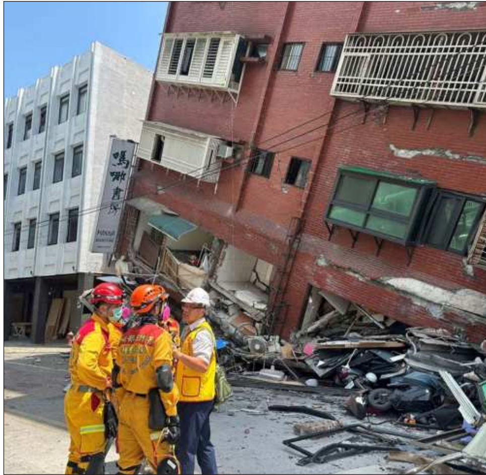
▲ De acuerdo con el cuerpo de bomberos local, todos los fallecimientos ocurrieron en el condado de Hualien, el punto más cercano al epicentro del sismo en el este de la isla.

En Ciudad Nueva Taipéi, en el norte, un almacén se derrumbó, pero más de 60 personas salieron con vida de los escombros, dijo el alcalde.