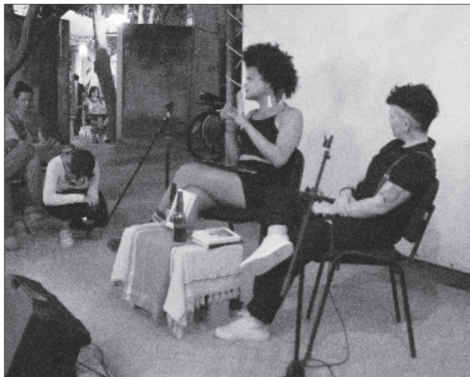
▲ En El feminismo ya fue , Mikaelah cuestiona los mandatos normativos y homogeneizantes que señalan que el movimiento es uno creado desde la perspectiva eurocentrista.

El feminismo ya fue nace desde diversos cuestionamientos de los mandatos normati-