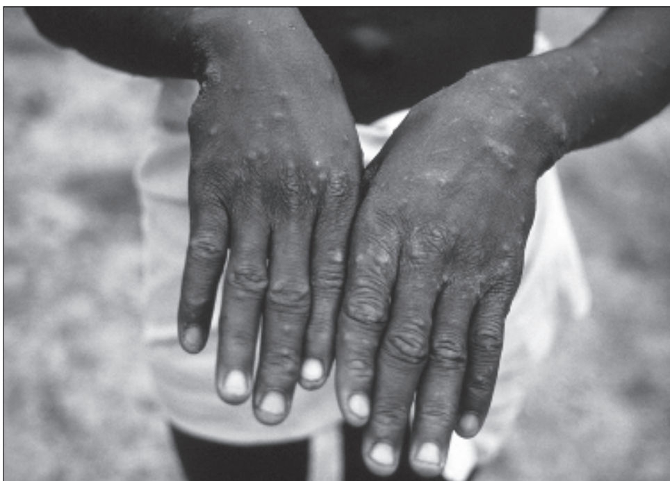
▲ Los brotes en el país africano son causados por la rama 1 del virus, presente en la República Democrática del Congo desde hace décadas, informó la OMS.