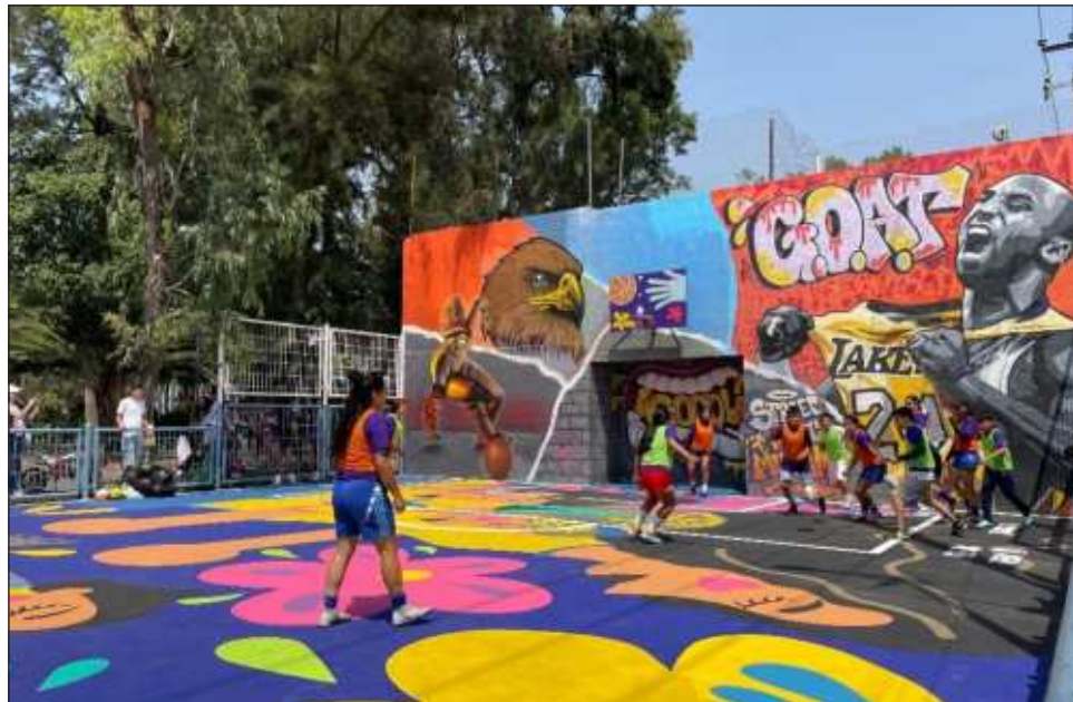
▲ El campo de juego fue restaurado por el club América y la asociación civil Blue Women Pink Men y tiene obras de la artista venezolana Ariana Weibezahn.

Ver todo el crecimiento que ha tenido el fútbol femenino, no sólo para nosotras