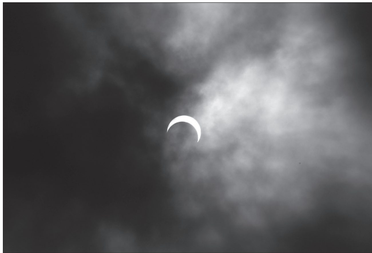
▲ El eclipse solar ocurre cuando la Luna se interpone entre el Sol y la Tierra, ocultando parcialmente su disco.

El eclipse solar ocurre en el momento que la Luna se interpone entre el Sol y la Tierra, ocultando parcialmente su disco. Es fundamental recordar que observar el Sol durante un eclipse sin protección puede causar daños irreversibles en los ojos, por lo que se recomienda utilizar lentes o filtros solares certificados bajo la Norma ISO