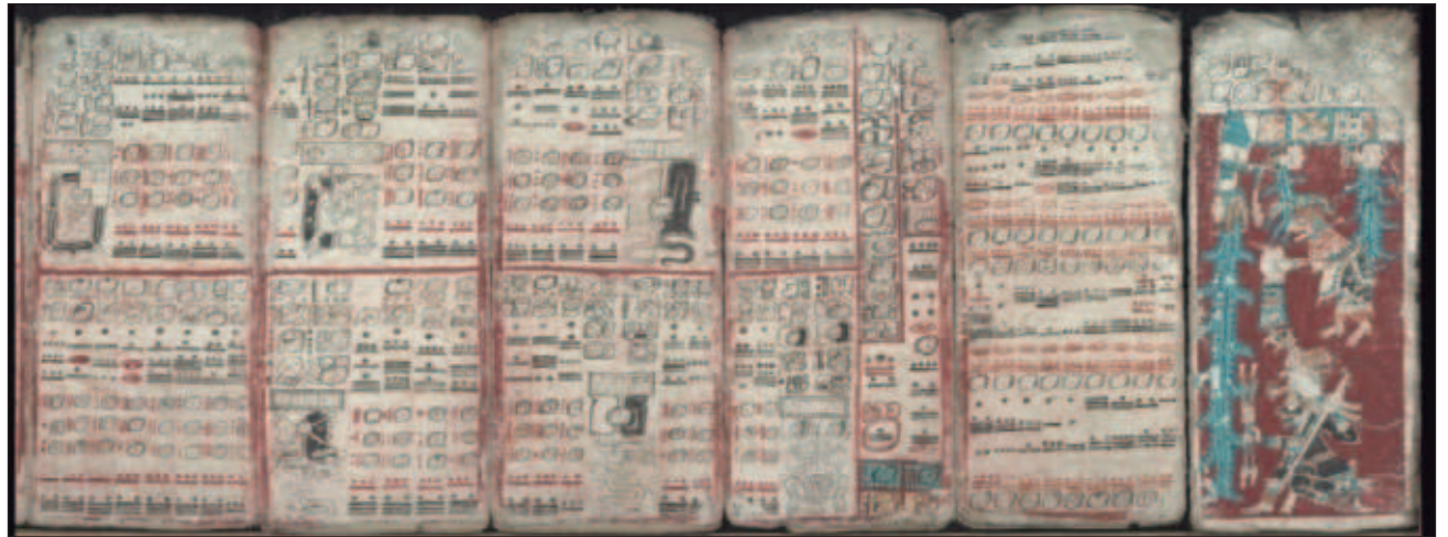
▲ El interés de los pueblos de Mesoamérica por la observación de la bóveda celeste quedó plasmado en códices, inscripciones en edificios y en esculturas. La imagen corresponde a fragmentos del Códice Dresde.

Galindo Trejo, doctor en astrofísica teórica por la Universidad Ruhr de Bochum, Alemania, mostró el Códice Telleriano-Remesís, que corresponde a 1531. En él se observa un disco solar, con una parte oscurecida, en un fondo