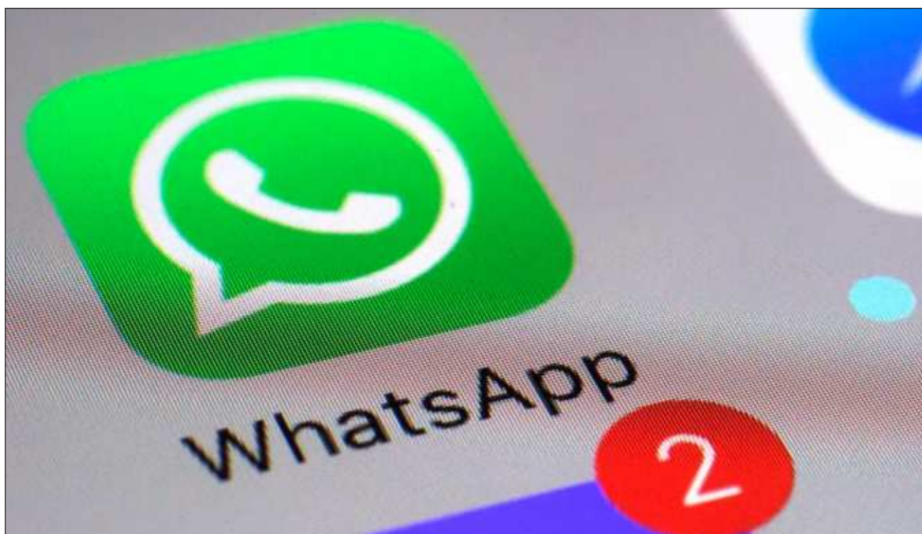
▲ WhatsApp, propiedad de Meta Platforms, dejó de funcionar este miércoles para miles de usuarios, según el sitio web de seguimiento de interrupciones Downtetector.com. Hubo más de 17 mil incidentes de usuarios que informa-

ron de problemas con la plataforma de mensajería, según Downtetector, que rastrea las interrupciones recopilando informes de estado de varias fuentes, incluidos los errores enviados por los usuarios a su plataforma.