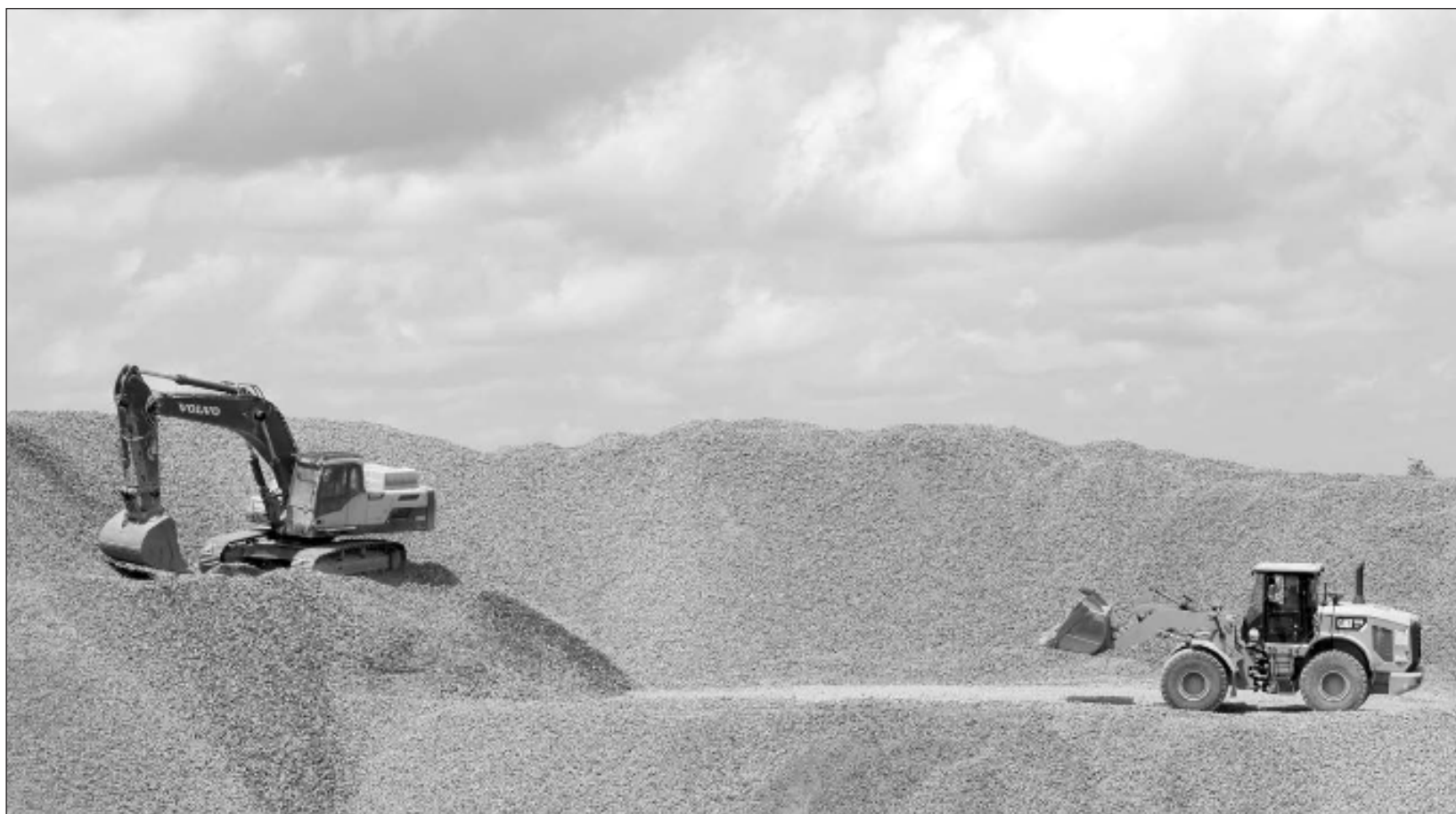
▲ “No puedo mencionarla, pero una señora que presenta denuncias y denuncias, que mis hijos (están) metidos en negocios vendiendo balasto. ¡Falso!”, subrayó el tabasqueño, haciendo referencia a la candidata de la coalición Fuerza y Corazón por México , Xóchitl Gálvez.

unos días una denuncia ante la Fiscalía Anticorrupción por la asignación de contratos para la compra de balasto para el Tren Maya, en la que solicitó investigar los posibles vínculos de los hijos del mandatario y de funcionarios federales.