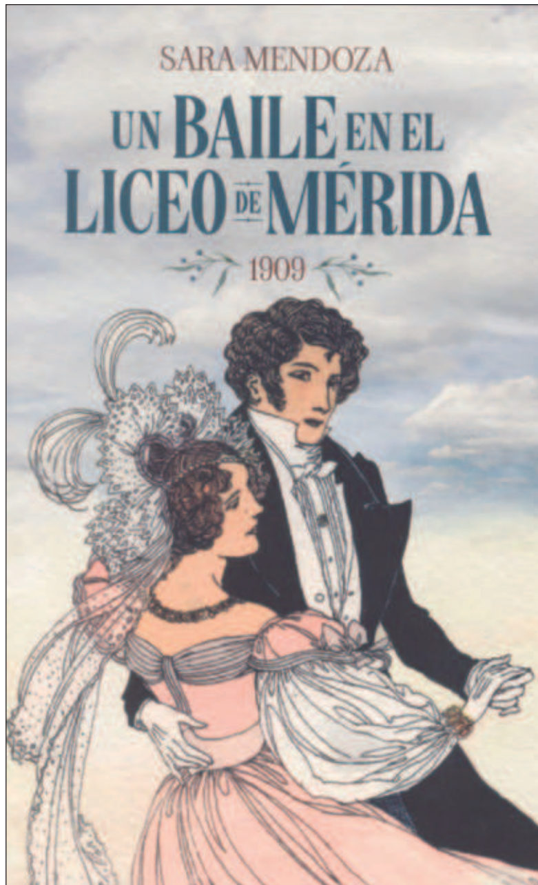
▲ “Un baile en el Liceo de Mérida reafirma cualidades expresivas de amenidad y fluidez, recrea costumbres arraigadas en suelo yucateco y describe el sistema de dominación que aseguró el consumo ostentoso de la clase social”. Foto Facsímil de portada

Se aceptaba que las mujeres tuvieran a su alcance textos prescritos para reforzar sus ins-