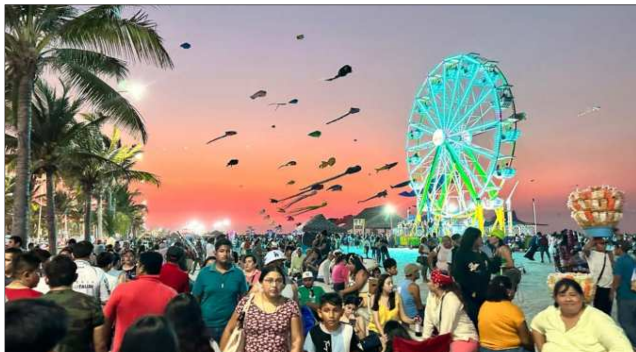
▲ Durante el fin de semana, las más de cinco mil habitaciones disponibles en la Isla resultaron insuficientes.