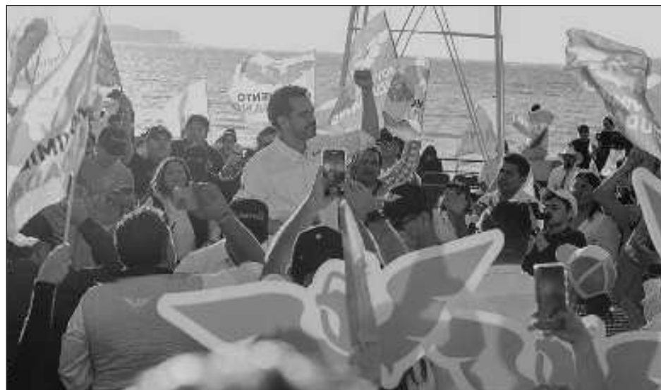
▲ La muestra de la fallida política de seguridad en el país y en dicha entidad son los “baños de sangre”, recriminó el candidato presidencial por MC.