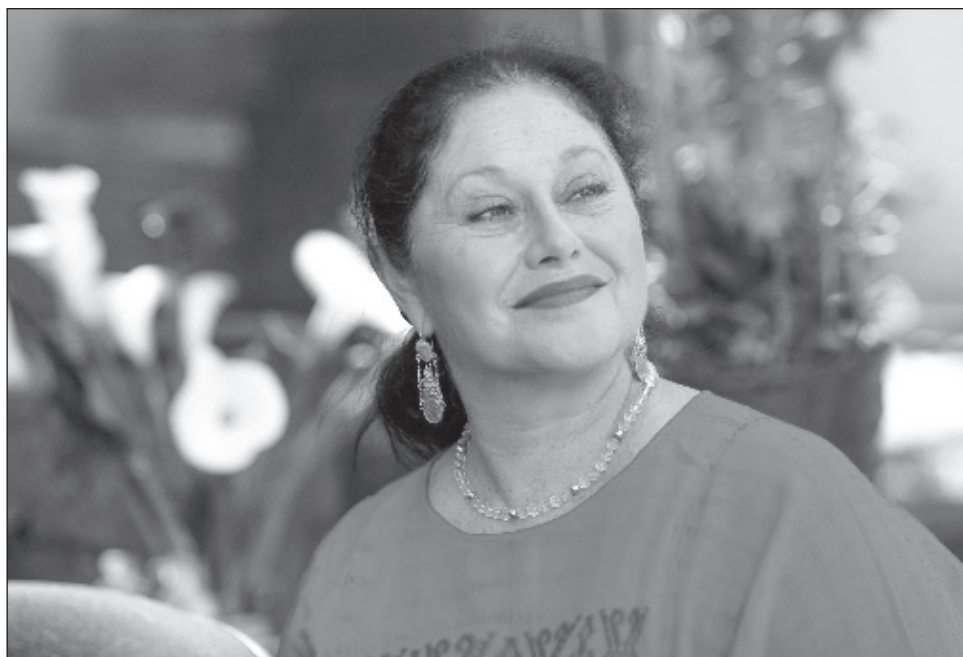
▲ Pocas actrices tienen la voz privilegiada de Angélica Aragón, pocas se apasionan por la formación de un público inusual sin acceso a las artes escénicas.