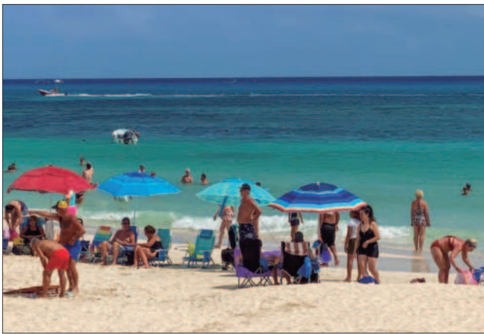
▲ Para este periodo vacacional por el natalicio de Benito Juárez, se prevé que la derrama de hospedaje sea de cuatro mil 667 millones de pesos.

La Secretaría de Turismo precisó que esperan que se hospeden en alojamiento de economías colaborativas, que se ofrecen en plataformas digitales, otros 281 mil turistas, tanto nacionales como extranjeros.