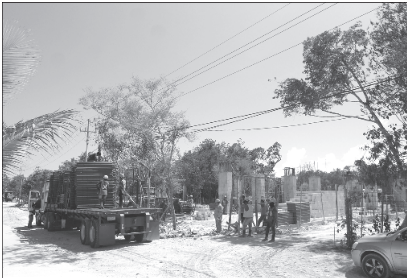
▲ En Cancún las mayores alzas de plusvalía se encuentran en el centro, por lo atractivo del uso de suelo, así como la zona hotelera por cotizarse en dólares; por el contrario, en el sur se mantiene baja por temas de inseguridad.

En Cancún las mayores alzas de plusvalía se encuentran en el centro, por lo atractivo del uso de suelo, así como