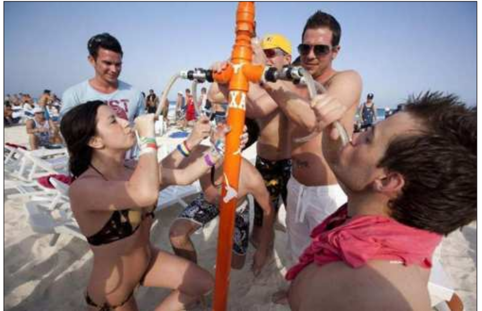
▲ Hay hoteles que se especializan en captar este mercado, jóvenes de varias partes del mundo que viajan a destinos de playa y sol para las vacaciones de marzo.

“Cancún está como el número uno en México y en segundo lugar está Playa del Carmen, entonces todavía los destinos de Quintana Roo siguen posicionándose como el número uno en todo México, entonces bueno, yo creo que esto es lo importante y seguir trabajando en coordinación y pues seguir manteniendo estas cifras y estos porcentajes de ocupación hotelera”, enfatizó.