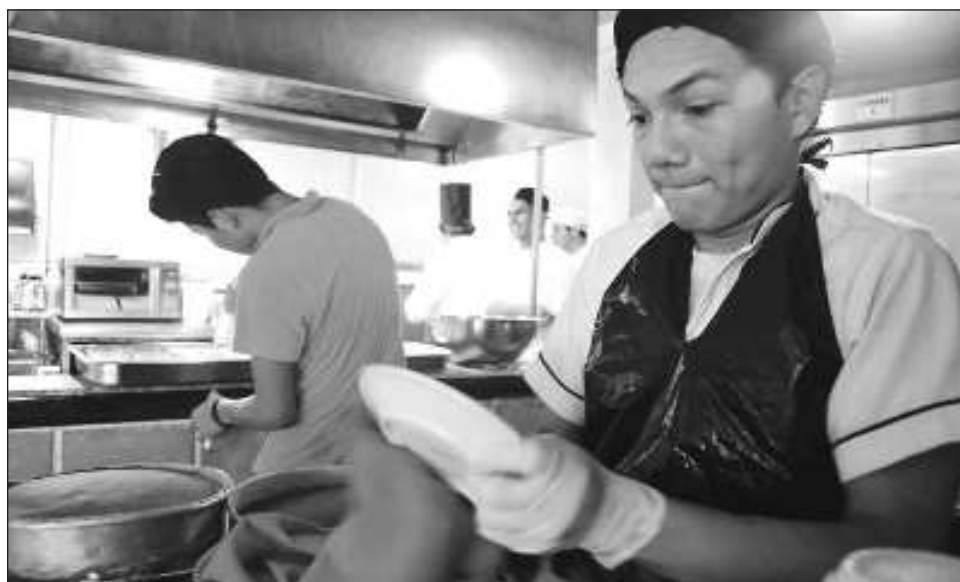
▲ El pasado 28 de febrero, la Comisión de Trabajo y Previsión Social del Senado de la República aprobó el cambio para que el pago se eleve de 15 a 30 días.

“Si esto es aprobado ya finalmente y aumenta, tendríamos que producir en las empresas un mes más de trabajo para poder pagarlo, es decir, se trabajan 12 meses en un año y tendríamos que cubrir 13 meses. Es una realidad que para muchas pequeñas y medianas em-