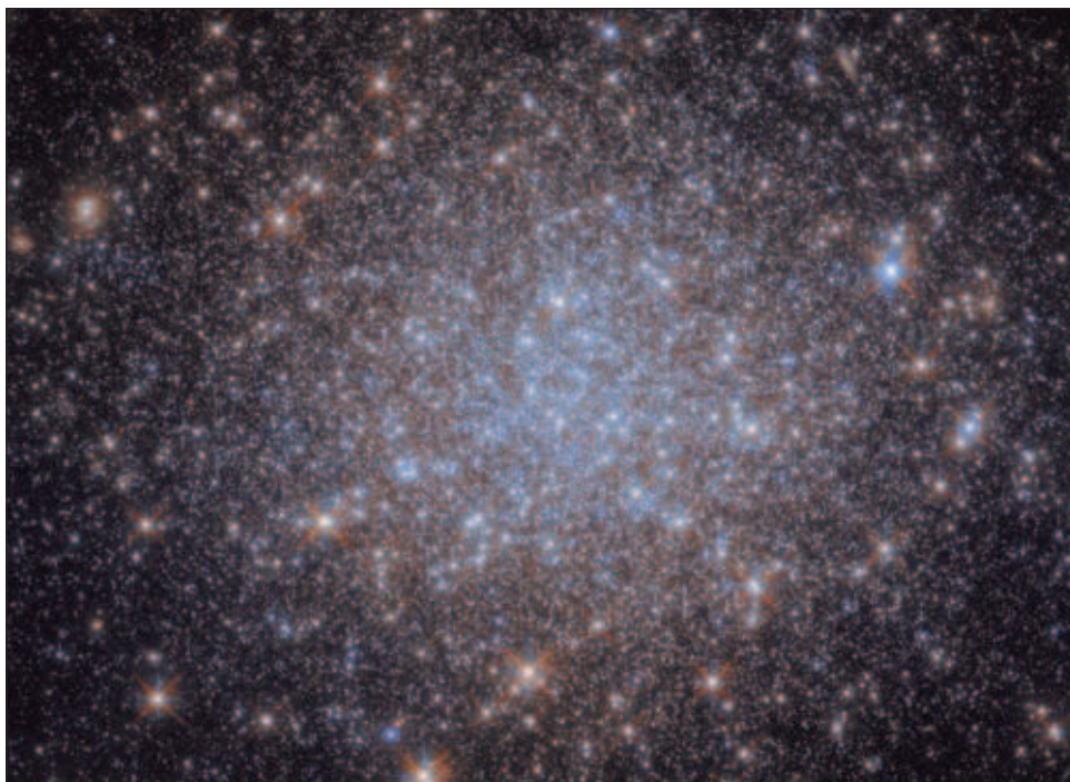
▲ Observaciones cada vez más sofisticadas revelan que las poblaciones estelares y las características de los cúmulos globulares son variadas y complejas.

Los cúmulos globulares como NGC 1841 pueden proporcionar información sobre la formación estelar muy temprana en las galaxias.