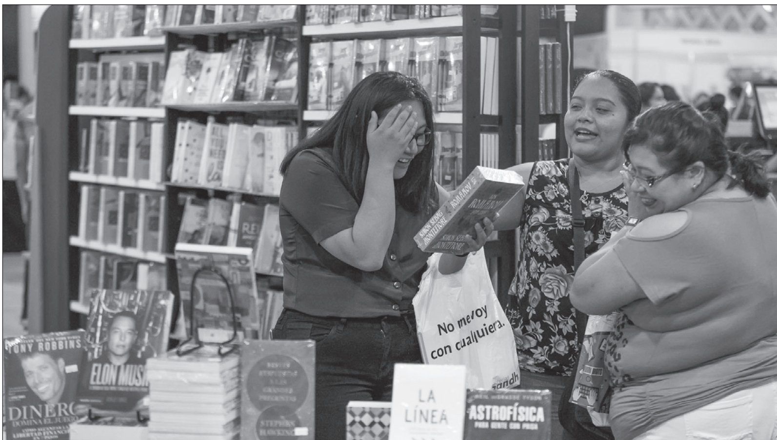
▲ "El programa Filey 2024 es impresionante y rebasa nuestra posibilidad de promoción. En más de 600 actividades, el equipo organizador hace magia".