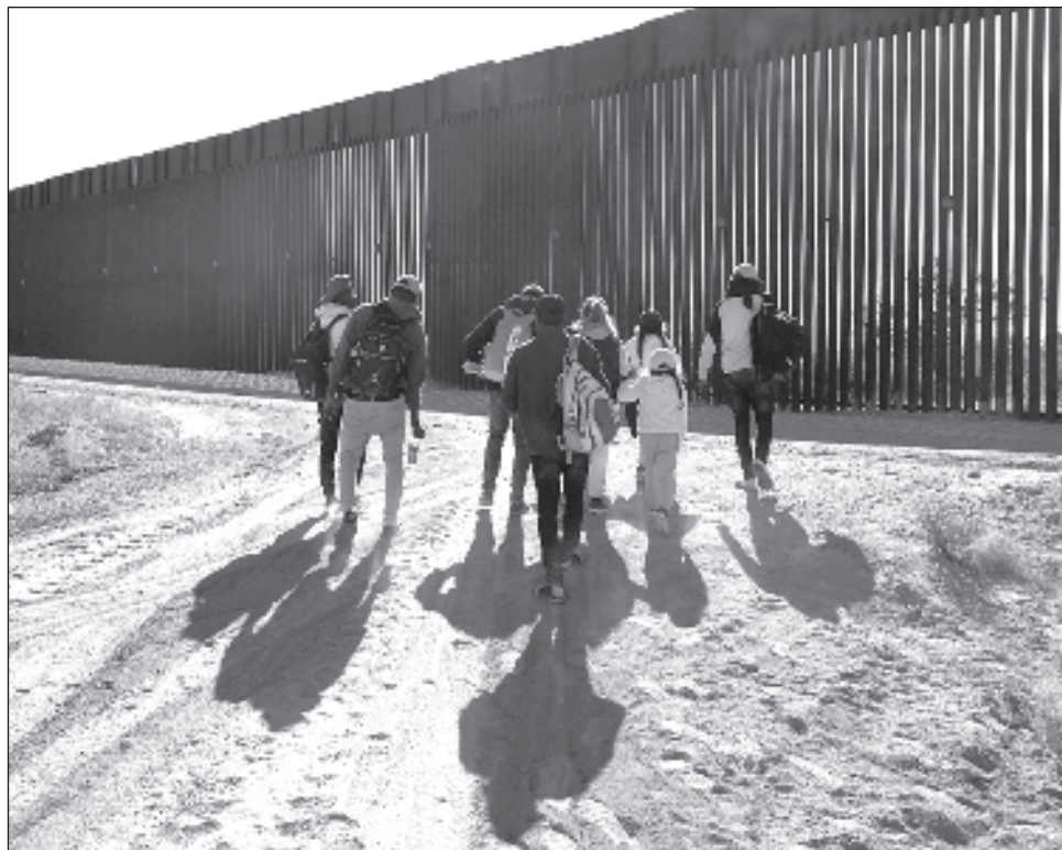
▲ Los refugiados y solicitantes de asilo en EU han ampliado la fuerza laboral legal.

“La economía estadounidense se ha beneficiado de la inmigración. En el último año una gran parte de la historia del mercado laboral recuperando el equilibrio se explica por la inmigración retornando a niveles prepandemia”, explicó el presidente de la Fed, Jerome Powell, en una entrevista con el programa 60 Minutes , de CBS News, en febrero. Señaló que los inmigrantes tienden a ser más jóvenes y su participación en la fuerza laboral es más alta que la de trabajadores locales.