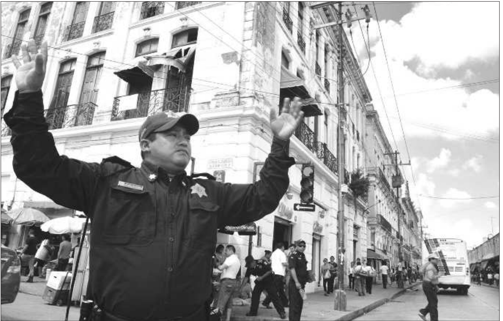
▲ Mediante el programa Yucatán Seguro, el gobierno del estado está dotando de equipamiento, tecnología y fuerte capacitación a la policía.