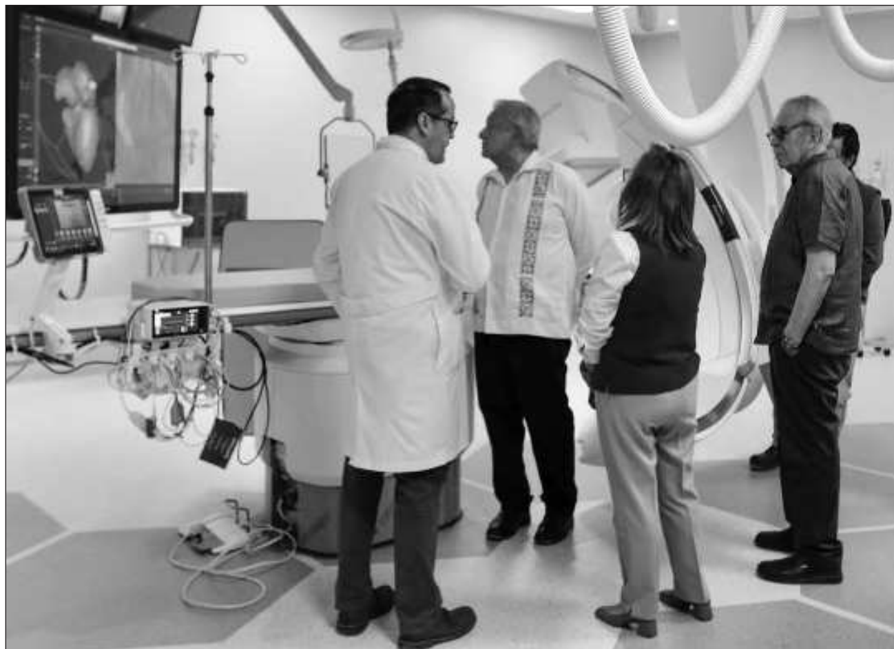
▲ El presidente Andrés Manuel López Obrador anunció el viernes pasado de una gira por al menos 23 estados y que el fin de semana estaría en Veracruz, Hidalgo, Tlaxcala y Puebla sólo para ver el tema de salud.

Agregó que “en lo curativo es indispensable contar con salas de hemodinamia y hemodiálisis; en eso estamos”. Durante la visita a Puebla y Tlaxcala estuvo