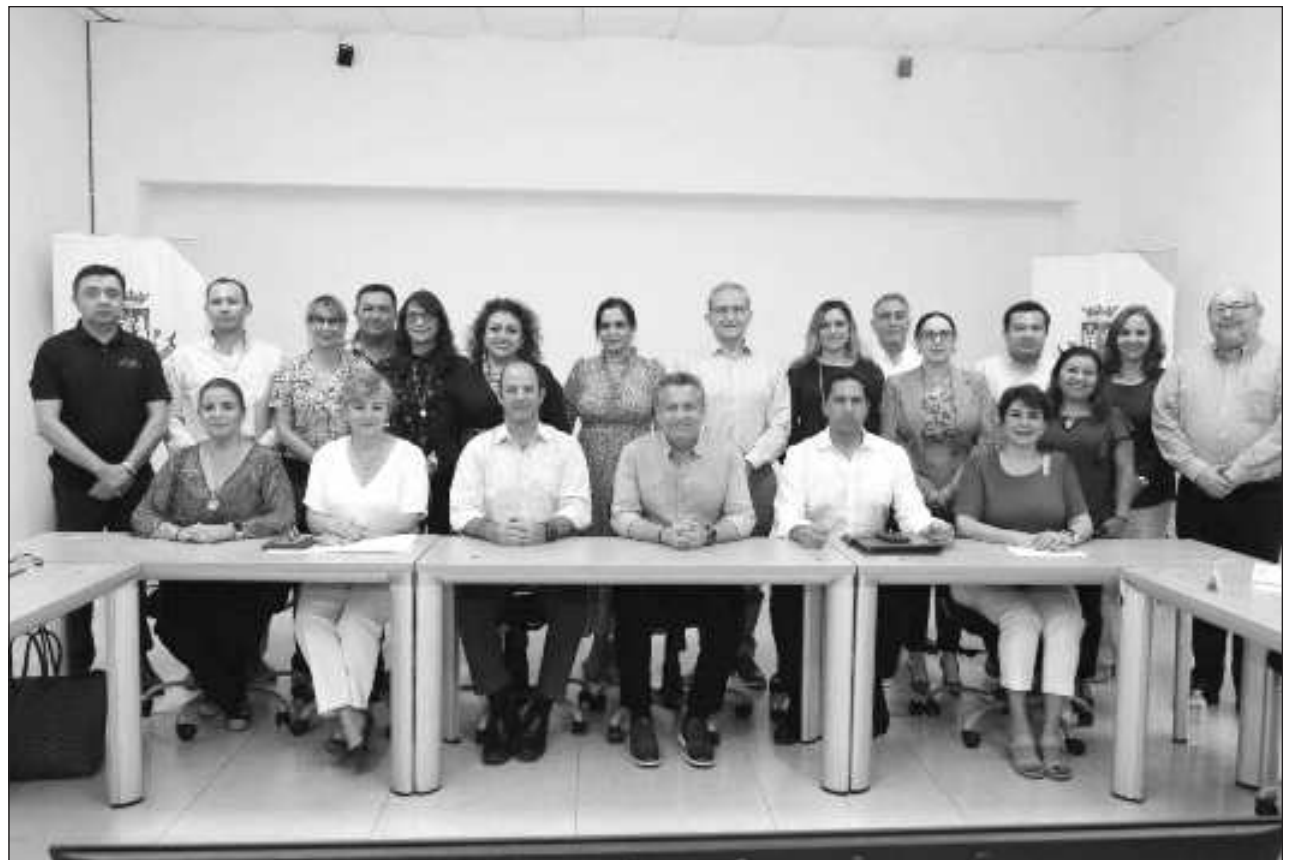
▲ El Consejo Consultivo del Presupuesto y Ejercicio del Gasto del Municipio de Mérida está integrado por 22 elementos: 10 funcionarios Públicos Municipales y 12 representantes de cámaras, colegios, instituciones y ciudadanos.

El Consejo Consultivo del Presupuesto y Ejercicio del Gasto del Municipio de Mérida está integrado por 22 elementos: 10 funcionarios Públicos Municipales y 12 representantes de cámaras, colegios, instituciones y ciudadanos, es decir un poco más del 50 por ciento de sus integrantes son parte de la sociedad civil.