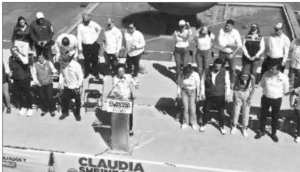
▲ La candidata presidencial morenista encabezó un mitin en la Plaza de la Liberación, donde se encuentra una estatua que representa la abolición de la esclavitud.

"Aquí es la plaza de la liberación, donde el padre de la patria decidió acabar con la esclavitud, rompió las cadenas, pues aquí se van a romper las cadenas de la corrupción en Jalisco y se van a seguir rompiendo las cadenas para que no re-