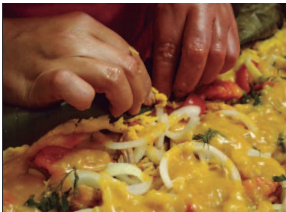
▲ Mondongo ministro, chocolomo, pulpo en su tinta, alcaparrado y vaporcitos son algunas delicias que recorre Cocina yucateca. Crónicas de infancia y recetas de mi madre .

Mondongo ministro, chocolomo, pulpo en su tinta,