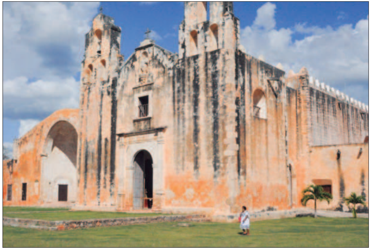
▲ “En este sitio donde confluyen muchos mundos (...) radican también otros tiempos: temporalidades que aprecian con calma la hechura de un bordado, o recorridos pausados por la localidad”.

ES POSIBLE QUE proyecciones estéticas, desde relatos estandarizados y acartonados, generen expectativas y experiencias igual-