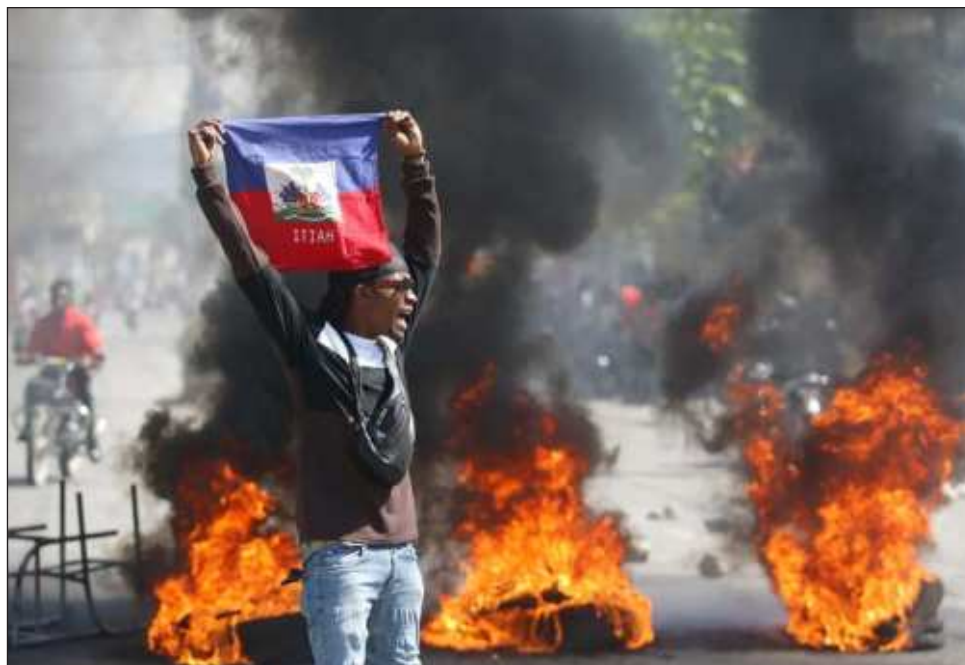
▲ La fuga marca un nuevo punto en una ola de violencia en Haití y ocurre cuando las pandillas toman un mayor control sobre la capital, mientras que el asediado primer ministro Ariel Henry se encuentra en el extranjero tratando de obtener apoyo.

El domingo por la mañana, se podían ver los cadáveres baleados de tres personas cerca de la entrada de la prisión, que estaba abierta de par en par, sin guardias a la vista. En los patios de la cárcel, usualmente hacinados, había sandalias de plástico, ropa y ventiladores eléctricos. En otro vecindario, los cuerpos ensangrentados de hombres, con las manos atadas a su espalda, estaban boca abajo, mientras los residentes pasaban frente a puestos de