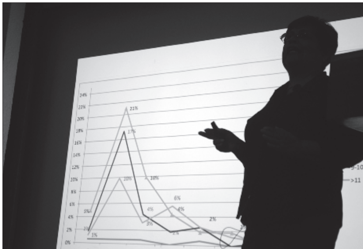
▲ “Políticos y analistas suelen usar así el término ‘dato duro’ para asegurar su veracidad, ya que se basan en mediciones concretas y objetivas de algún rubro. Por tanto, se trata de información mensurable y verificable”.

NO OBSTANTE, LA distinción común que tenemos hoy entre “datos duros” o cuantitativos y “datos blandos” o cualitativos, como equivalente a la distinción entre objetivo y subjetivo, es más reciente. Es justamente en la gestación de la ciencia moderna donde nace esta idea. Por