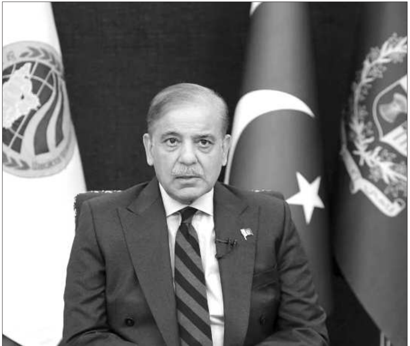
▲ Señalan que para haber podido regresar al poder, Shehbaz Sharif y su partido, la Liga Musulmana de Pakistán, tuvieron que concluir un acuerdo de coalición con su rival histórico, el Partido Popular de Pakistán de Bilawal Bhutto Zardari, y otros pequeños partidos.

A cambio, el ex presidente Asif Ali Zardari (2008-2013), fue designado por el PPP como candidato conjunto a la presidencia.