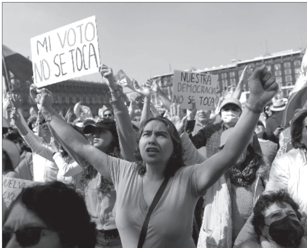
▲ “Después de nueve meses de haber iniciado el proceso comicial mexicano, las autoridades electorales no han encontrado mayores ilegalidades que justifiquen su intervención para hacer severas sanciones”.

Una campaña negra que, por cierto, sólo enrarece al territorio de la Ciudad de México. En el resto de la República, donde se va a decidir la elección presidencial e integración del Poder Legisla-