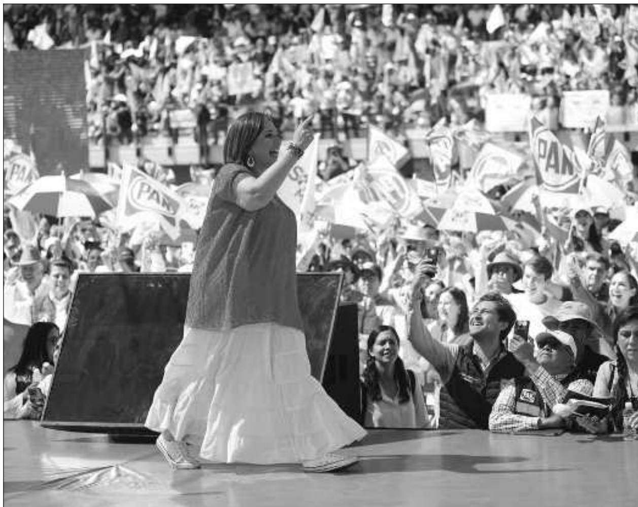
▲ La candidata presidencial de la coalición Fuerza y Corazón por México, sostuvo que la elección del 2 de junio es entre dos proyectos, pero aprovechó para insistir: "Morena representa el miedo, representa la muerte, representa el narco".

Gálvez Ruiz estuvo por la tarde del domingo en la sede del Comité Directivo Estatal del PRI en el estado de México. Este lunes ofrecerá conferencia de prensa en la Ciudad de México, antes de viajar a Yucatán.