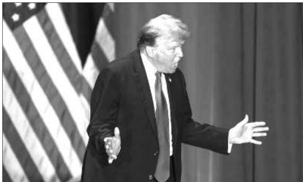
▲ El ex mandatario Donald Trump va con impulso creciente en su búsqueda por la nominación republicana para competir por la presidencia de la convención del partido en julio.

Trump va con impulso creciente hacia la nominación republicana de la convención del partido en julio, y se espera que el martes prácticamente garantice el resultado.