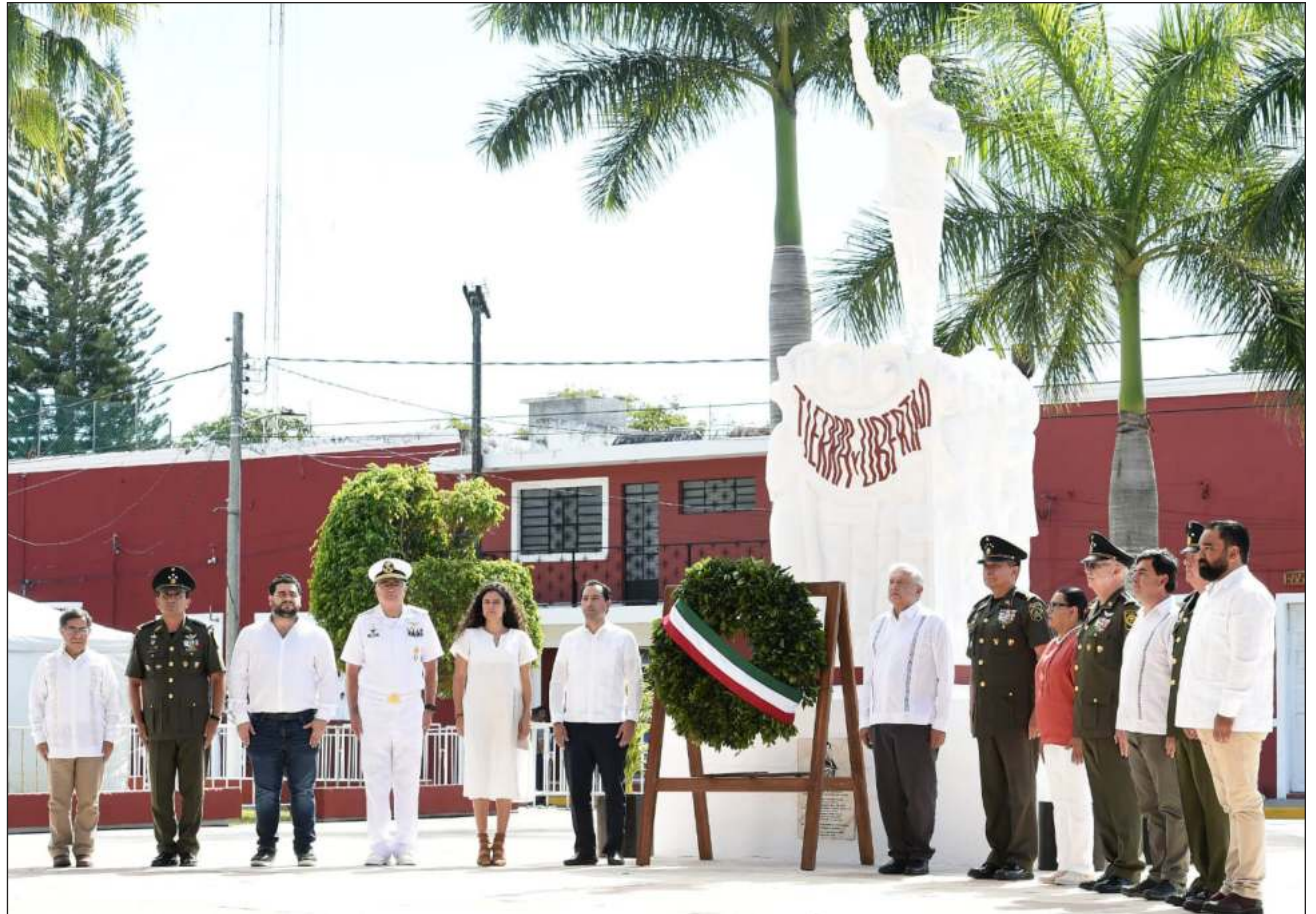
▲ La placa, que reconoce la labor de Felipe Carrillo Puerto por los mayas y las mujeres, fue colocada a un costado de la estatua del dirigente social yucateco que se encuentra en su natal Motul, municipio de Yucatán.

Vila Dosal reconoció que el líder revolucionario social sentó las bases para tener un mejor Yucatán al luchar por la igualdad de los pueblos mayas, promover la educación con la creación de lo que hoy es la Universidad Autónoma de Yucatán (UADY),