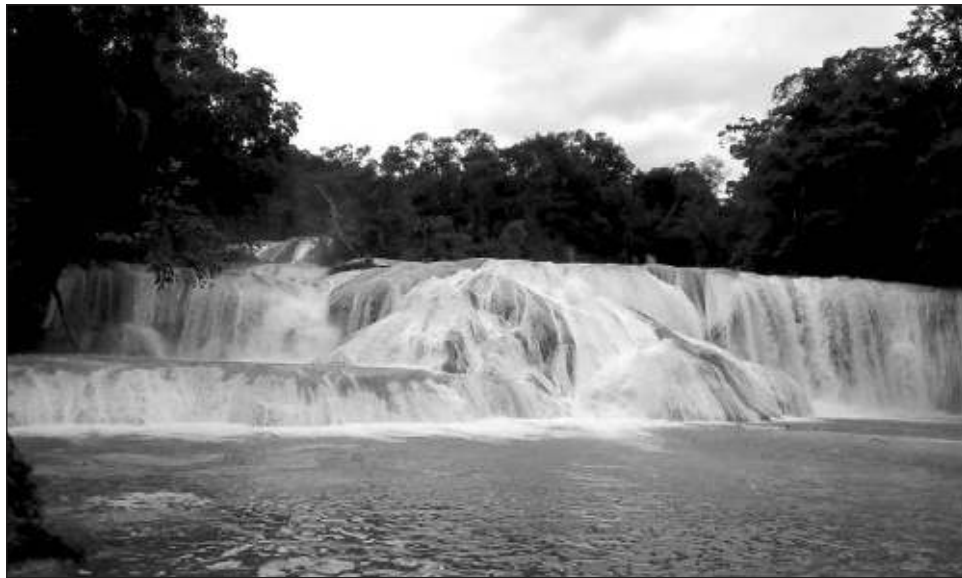
▲ “Lo recibimos (al Tren Maya) con mucha emoción, con bastante alegría. La verdad que estamos muy contentos de que por fin este proyecto se vea realizado y que Palenque sea una de las tantas ciudades beneficiadas de este megaproyecto del presidente Andrés Manuel López Obrador”: delegado.

En cuanto a estadísticas, precisó que Palenque cerró el 2023 con 900 mil visitantes, lo que generó una importante derrama económica, pero ahora se pretende que con la llegada del Tren Maya e incluso con el enlace aeroportuario que ya se abrió con los vuelos de la aerolínea Mexicana a la Ciudad de México incre-