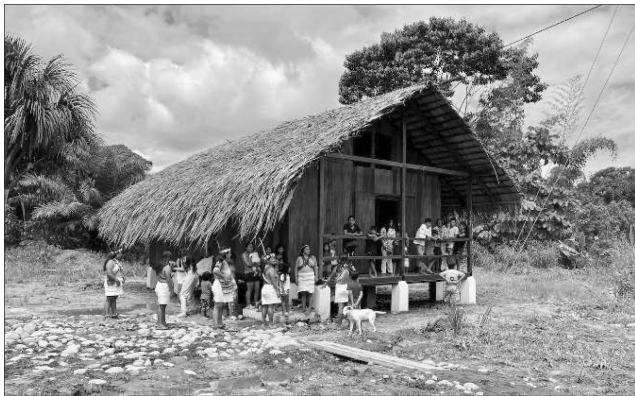
▲ La arquitectura vernácula constituye parte del patrimonio cultural material, y tiene un componente identitario del colectivo o grupo social que transforma un entorno, por lo que se relaciona íntimamente con el patrimonio cultural inmaterial.

Éstas se sometieron a un proceso de revisión por un jurado que valoró el enfoque de sostenibilidad, innovación y preservación de edificaciones mediante la aplicación y rescate de técnicas constructivas tradicionales que surgen de la implantación de una comunidad en su territorio, explicó el INPC.