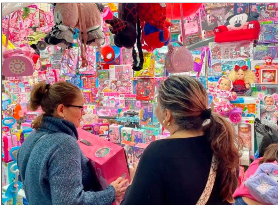
▲ Este año los juguetes serán nuevamente los productos más demandados, seguidos muy de cerca por artículos electrónicos como videojuegos, tabletas, celulares y computadoras.