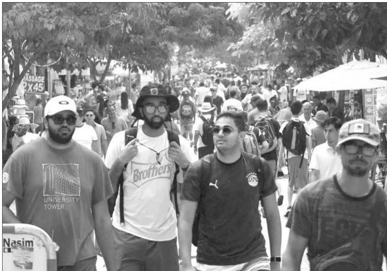
▲ La ocupación hotelera en Cancún se mantuvo encima de los 80 puntos porcentuales durante todo el mes de diciembre, terminando los últimos días del 2023 con 91.2% cubierto gracias a los eventos de gama internacional.

Otro rubro tecnológico en el que también están trabajando es en el prototipo del sistema de información turística de Quintana Roo, un tema relevante porque es básicamente el poder recopilar, sistematizar y hacer pública la información de la actividad turística en Quintana Roo, es decir, se podrá consultar toda la estadística de todos los destinos, comparar datos y descargar información consolidada en un solo sitio. Especificó que no sólo es saber el comportamiento de la demanda, sino conocer toda la oferta turística estatal.