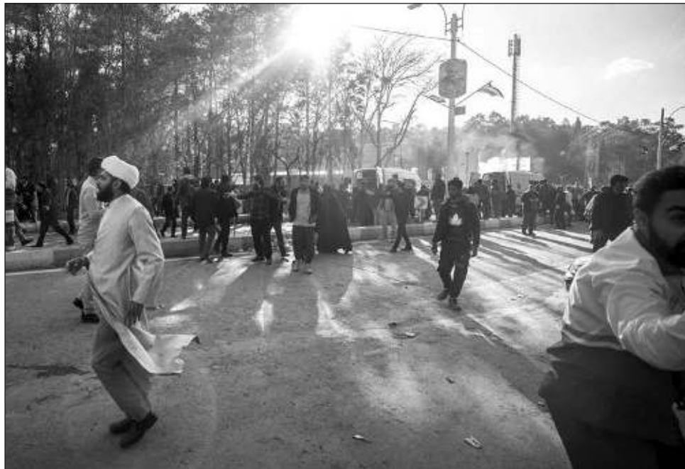
▲ El ataque ocurrió cuando miles de personas se concentraban en el cementerio para conmemorar la muerte del teniente general Qassem Soleimani, considerado en Irán un mártir de la revolución y que falleció en 2020 en un ataque estadounidense con drones en Bagdad.

Servicios médicos citados por la televisión iraní PressTV indicaron que la cifra de fallecidos por las explosiones es muy probable que aumente, dado en número de heridos en condición crítica que están llegando a los hospitales de la ciudad.