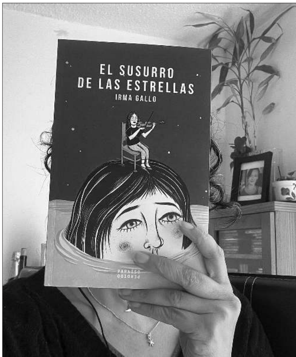
▲ “A veces se piensa que cuidar es la obligación de las abuelas cuando la mamá no puede o falta. De ninguna manera lo es y, sin embargo, agarran tiempo y fuerzas quién sabe de dónde para hacerse cargo”.