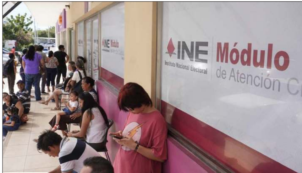
▲ Autoridades señalaron que en todo el estado participan las instituciones que conforman el sector salud como el IMSS Ordinario, IMSS Bienestar, ISSSTE y la Secretaría de Salud.

"El 22 de enero es el último día para que la ciudadanía pueda acudir a tramitar y obtener su credencial de elector, y con ello asegurar su participación en las elecciones que habrán de celebrarse el próximo 2