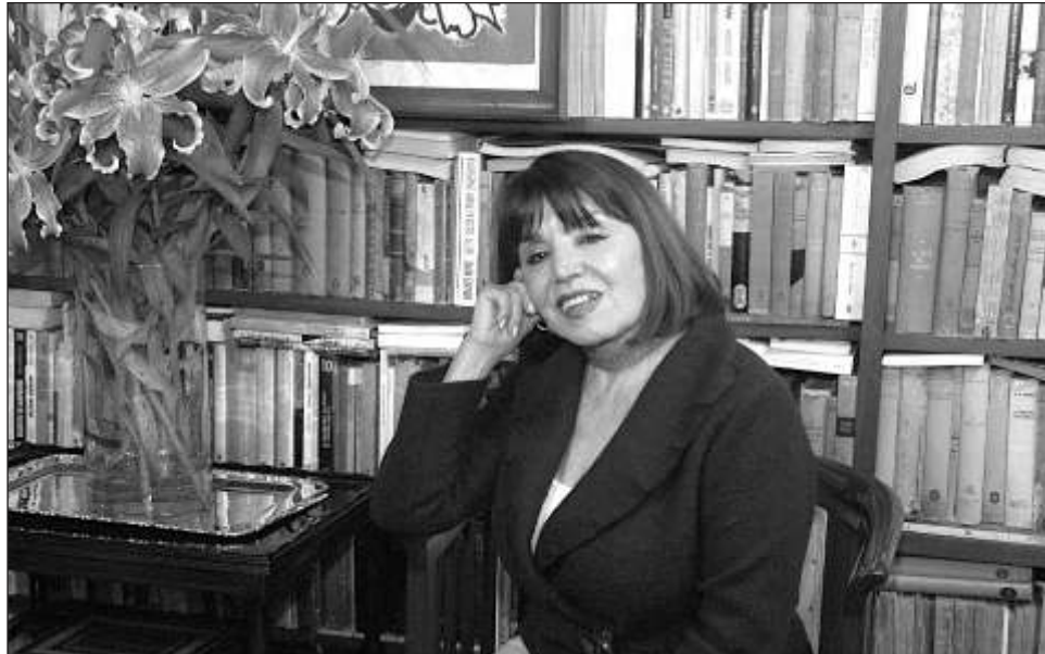
▲ Para Espejo (Veracruz, 1939), el Premio Nacional de Artes y Literatura 2023 es una gran satisfacción que le da una enorme felicidad “que no sé si merezco, pero me siento muy agradecida. Me siento muy contenta de tenerlo. Siempre lo ansié”, destacó en entrevista.

Además, se dijo contenta porque escribe su autobiografía. “Más que por mí —que no tengo gran interés personal—, por los escritores que he conocido a lo largo de mi vida, hombres y mujeres”.