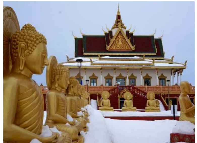
▲ "The creation of God in man's image has led to countless wars. Many of the problems we are seeing today stem from religious differences".

INDIA'S HINDU NATIONALISTS , led by Prime Minister Modi, believe in the supremacy of Hinduism and seek to eliminate the hundreds of millions of non-Hindus from the sub-continent.