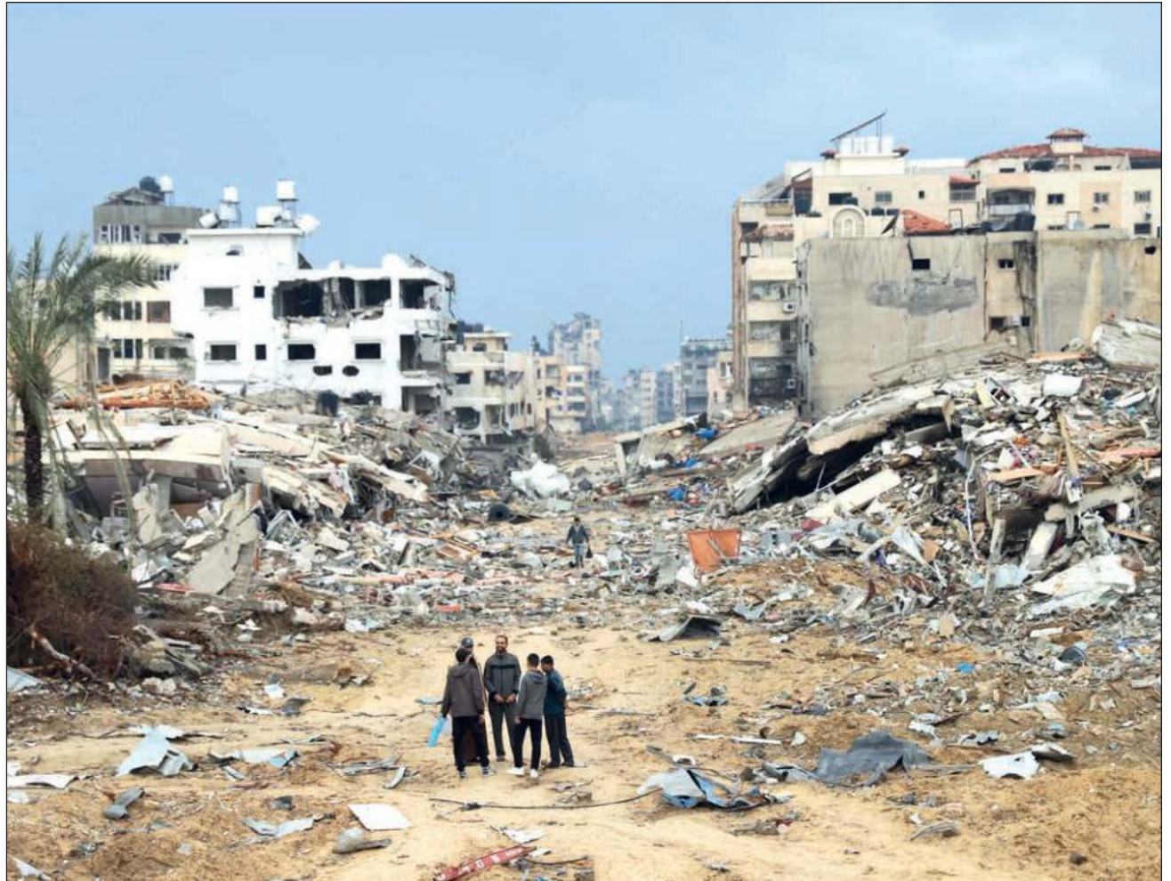
▲ De acuerdo con el director general de la Organización Mundial de la Salud, Tedros Adhanom Ghebreyesus, en el último ataque en la Franja de Gaza murieron al menos cinco civiles, incluido un bebé de cinco días de nacido.

El jefe de la OMS reclamó el cese de los ataques contra instalaciones y personal sanitario, a los que protege legalmente el derecho internacio-