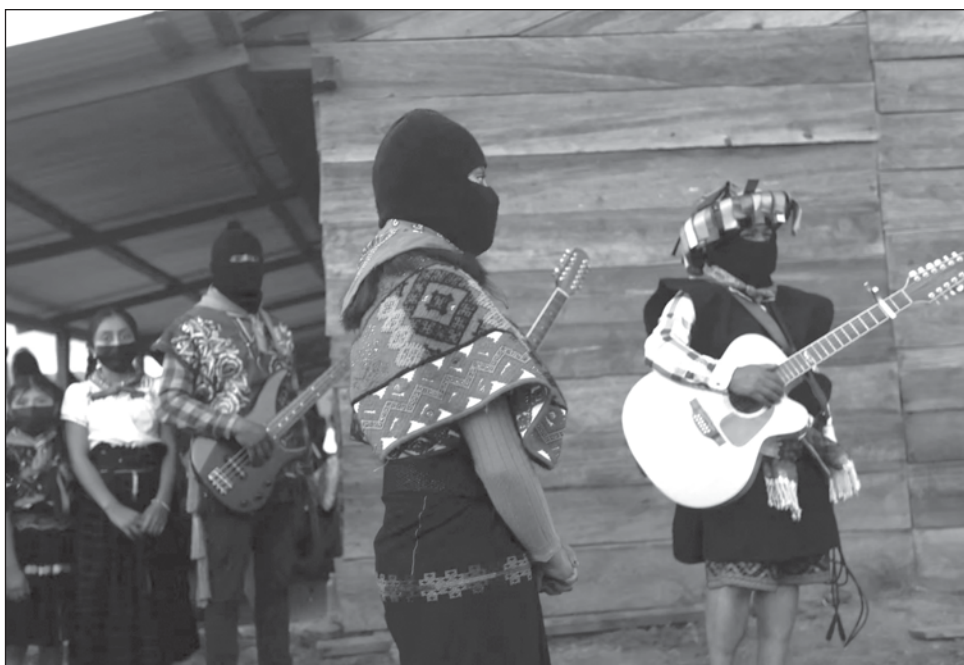
▲ La socióloga atestiguó que las comandantas Ramona, Susana, Esther, entre otras mujeres dotadas de una polifonía virtuosa, abrieron brecha en las demandas feministas.

Con su sensibilidad y conocimiento acumulados, la socióloga atestiguó que las comandantas Ramona, Susana, Esther, entre otras mujeres zapatistas dotadas de una polifonía virtuosa, utilizaron sus narrativas en favor de sus derechos individuales y colectivos, pero a la vez abrieron brecha en las demandas feministas. “Todas estuvieron inspiradas y, mejor dicho, ‘construidas’ subjetivamente por las formas comunitarias de la cosmogonía zapatista”.