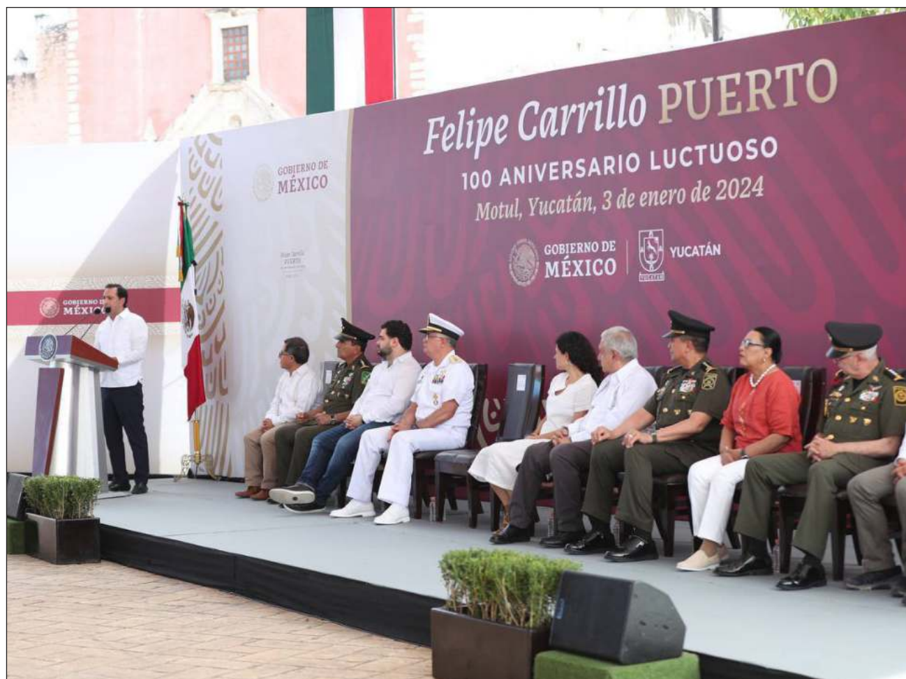
▲ López Obrador señaló que el estado es un ejemplo de paz y se mantiene como el más seguro del país.

El mandatario estatal resaltó que Yucatán se encuentra en el primer lugar del Índice de Paz, es el estado con la menor incidencia delictiva, registra cero saqueos, tiene el menor número de víctimas de homicidios dolosos y no se reportan secuestros.