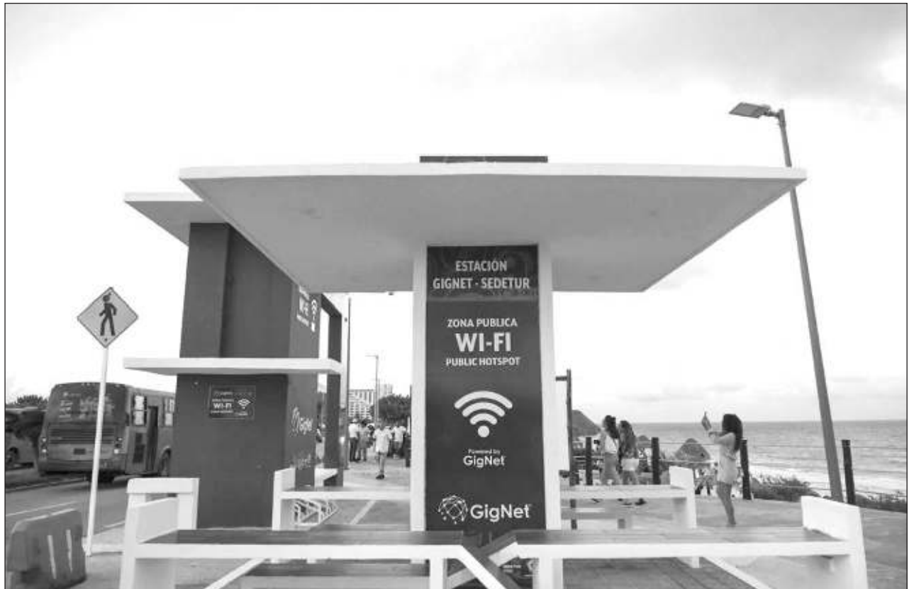
▲ Durante el 2023 el Instituto Quintanarroense de Innovación y Tecnología se enfocó en la revisión de algunos puntos para su reapertura, logrando la consolidación de ocho más, aunado al apoyo de la CFEIT y de proveedores locales.

El avance que se ha tenido en información y conocimiento ha sido exponencial, ejemplificó, pues tan sólo en los 80 cuando él comenzó a especializarse en la comida mexicana, no había prácticamente ningún libro de comida contemporánea y de la tradicional solamente había dos.