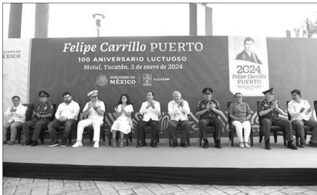
▲ Hoy, Felipe Carrillo Puerto cuenta con una placa más. Otra vez hay un año con su nombre (...) y su figura sigue siendo lugar común en la política, más que objeto de análisis histórico. Nuevo altar, misma liturgia.

Hoy, Felipe Carrillo Puerto cuenta con una placa más. Otra vez hay un año con su nombre (primero fue 1974, a medio siglo de su asesinato), y su figura sigue siendo lugar común en la política, más que objeto de análisis histórico. Nuevo altar, misma liturgia.