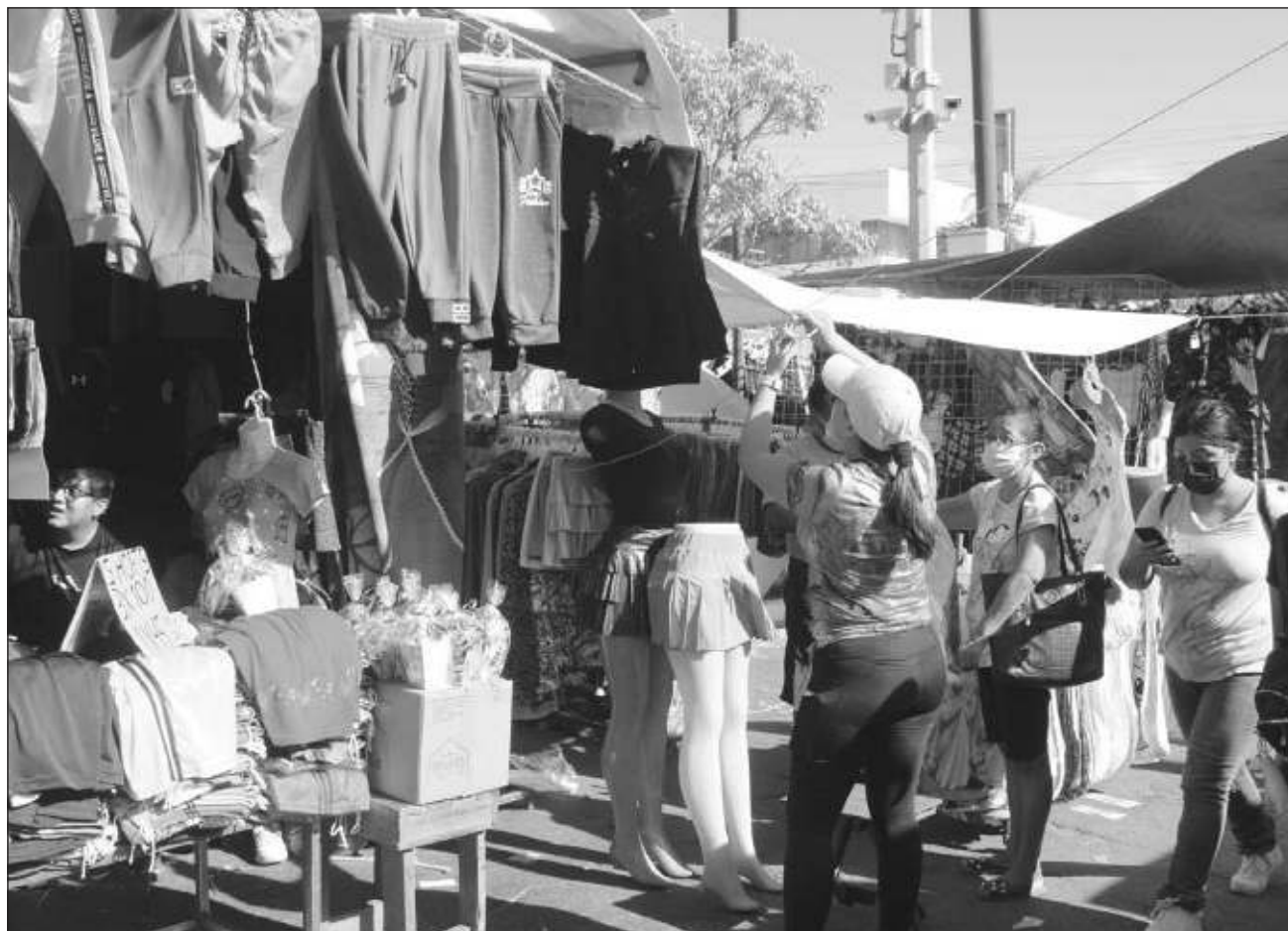
▲ La directora de Turismo y Desarrollo Económico señaló que estiman alcanzar buenas ventas para este año, principalmente porque los Reyes Magos acudirán a realizar sus compras para llevar los regalos a los niños.

Explicó que como en ocasiones anteriores se contará con diversos paradores fotográficos, así como la venta de juguetes, ropa, zapatos, biberón, además de alimentos y bebidas entre otros.