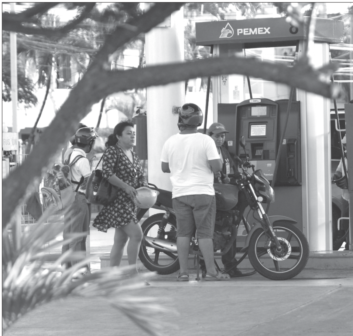
▲ “Desde antes del último día de 2023 circularon videos de presuntos comunicadores que ‘anunciaban’ un ‘brutal gasolinazo ’ a partir del inicio de 2024, atribuido al gobierno de López Obrador”.

POR SUPUESTO, ALGUNOS empresarios con la misma falta de empatía social que los propagandistas de la derecha neoliberal, sacaron a relucir su codicia y a título personal aumentaron los precios durante el tiempo que duró el efecto de la mentira, hasta que AMLO aclaró que no hay ningún gasolinazo .