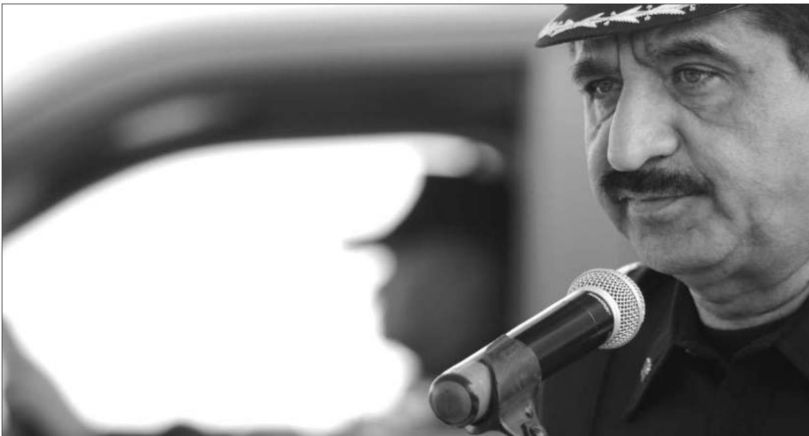
▲ "La seguridad en Yucatán no puede ni debe depender de un solo hombre (...) La entidad debe contar con una institución capaz y con cuadros suficientes para afrontar la dinámica siempre cambiante de la inseguridad y de las organizaciones criminales que azotan al país, a pesar de un relevo al frente".