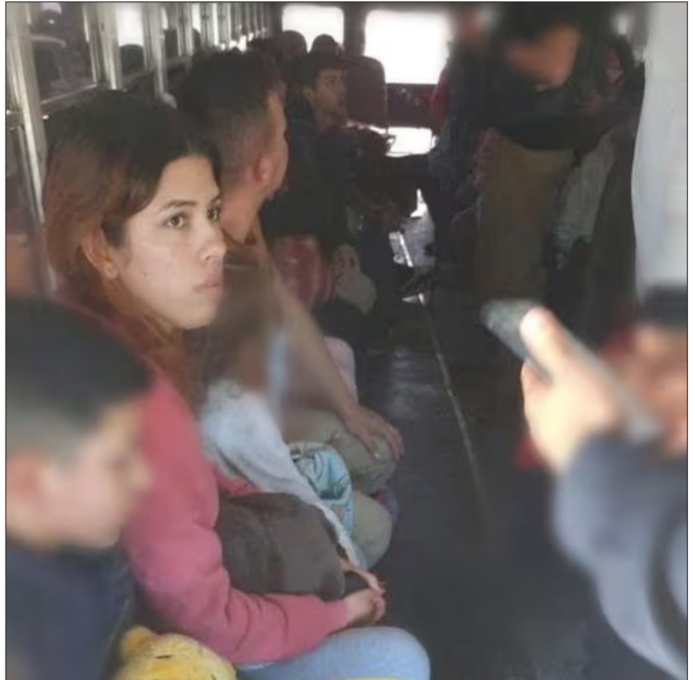
▲ A pesar de las denuncias que se han realizado desde hace tiempo sobre el secuestro de migrantes en esa región de Tamaulipas, la secretaria de Seguridad Rosa Icela Rodríguez justificó que se trata de un evento “atípico” durante la conferencia de prensa.

“Vimos cuáles eran las colonias donde se presume que están siendo buscados, esperamos encontrar rápidamente la ubicación de las víctimas. Hay que decir que este tipo de eventos se daba con uno, dos, tres migrantes, pero este número en esa zona es atípico, no es una cuestión que se esté dando frecuentemente, es una cuestión, pero nosotros tenemos confianza en que el operativo de búsqueda tendrá resultados. Esperemos más pronto que tarde los buenos