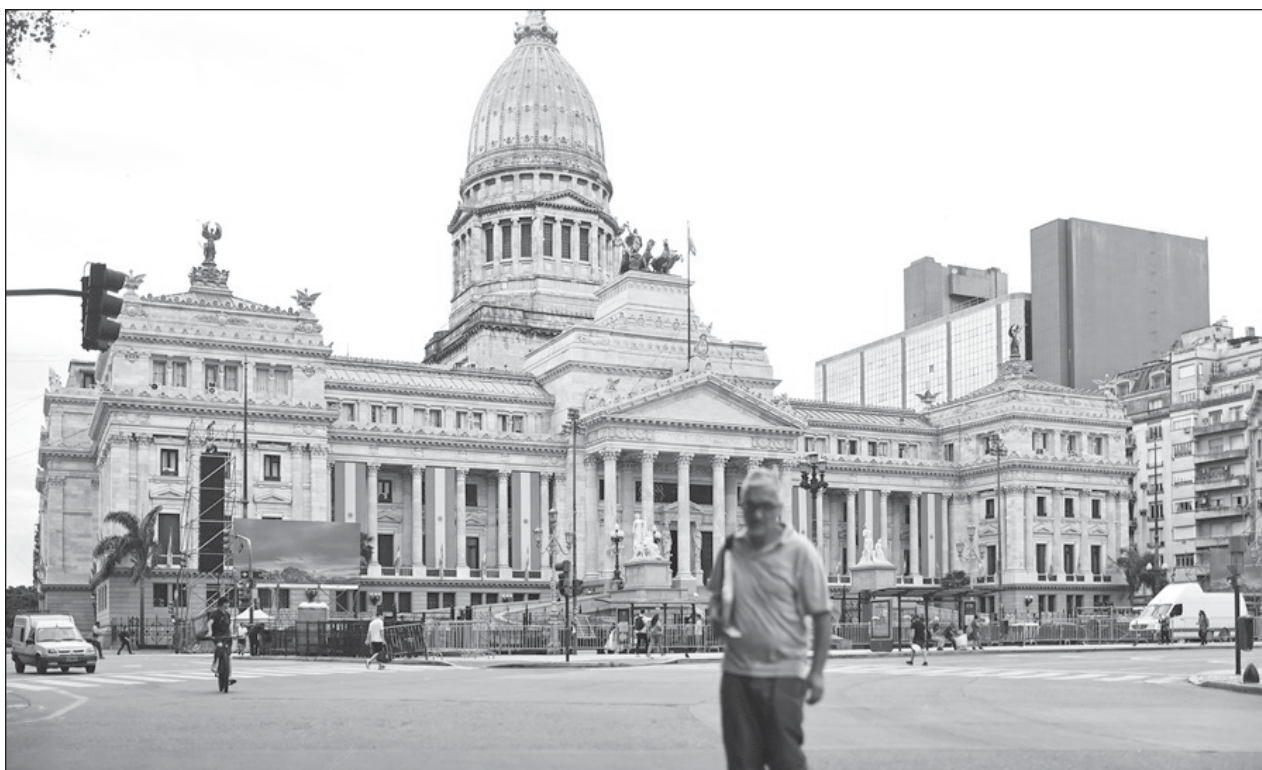
▲ Las detenciones fueron producto de una investigación realizada por detectives de la PFA, junto con agentes de la Dirección Nacional de Inteligencia Criminal del Ministerio de Seguridad y de la Policía de Seguridad Aeroportuaria.

Los médicos recién titulados ganan 15.53 libras (19.37 dólares) la hora —el salario mínimo en GB es de poco más de 10 libras— aunque los sueldos suben rápido.