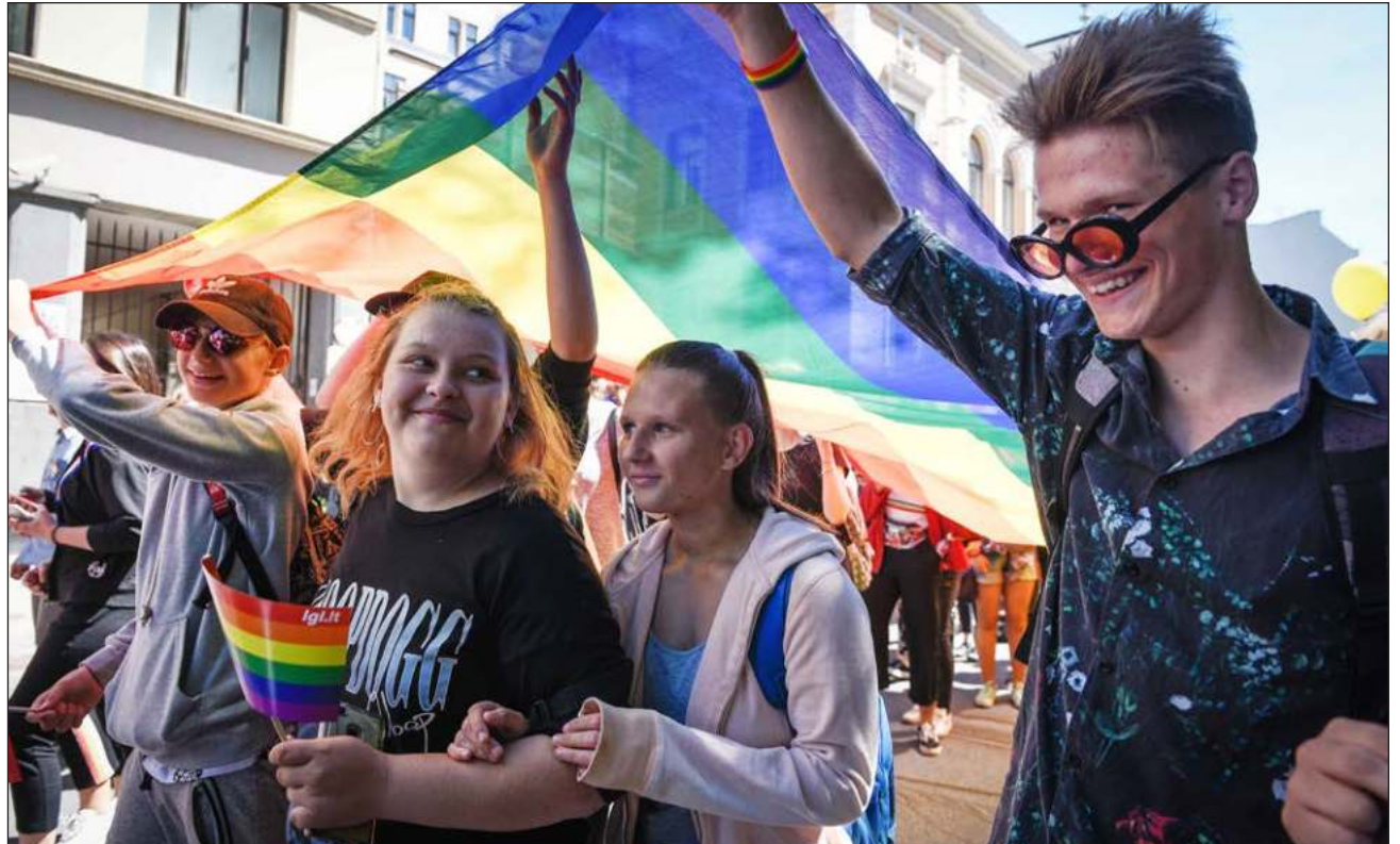
▲ Este 1 de enero, Estonia se convirtió en el primero de los países que formaron parte de la Unión Soviética y en el segundo de los antiguos estados del bloque comunista, por detrás de Eslovenia, en permitir los matrimonios del mismo sexo.

La ley correspondiente fue aprobada por el Parlamento o Riigikogu en junio del año pasado, con 55 votos a favor y 34 en contra.