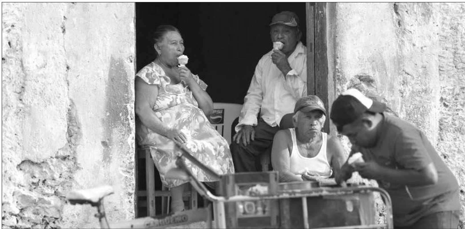
▲ Luego de formalizar las modificaciones al Código Nacional de Procedimientos Penales, queda establecido que en caso de tener alguna discapacidad, se realizarán los ajustes al método penal que sean necesarios para salvaguardar los derechos de los más vulnerables.