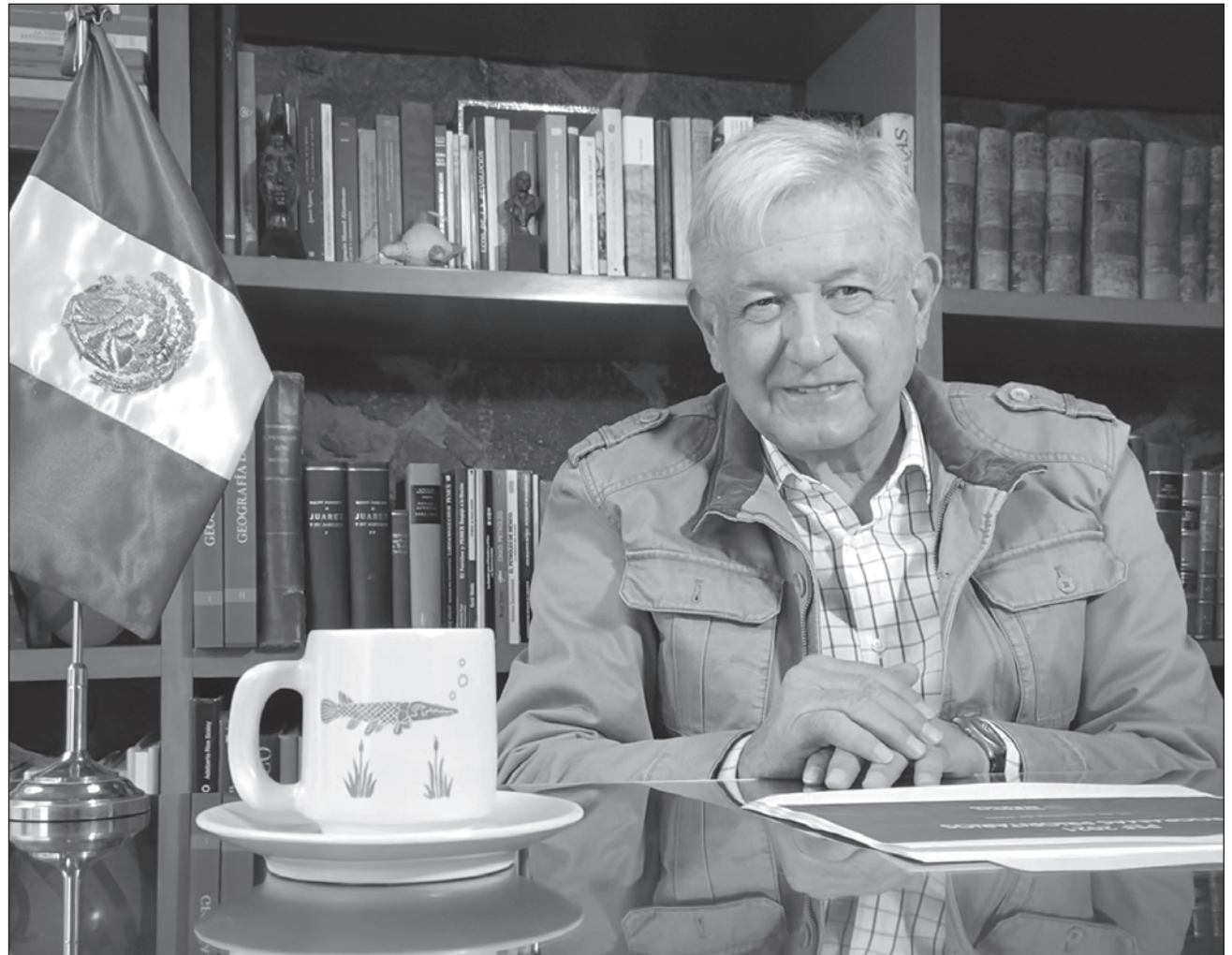
▲ En su mensaje a través de YouTube, el Presidente resaltó que México es el primer país de Latinoamérica en comenzar el proceso de vacunación contra el COVID-19.