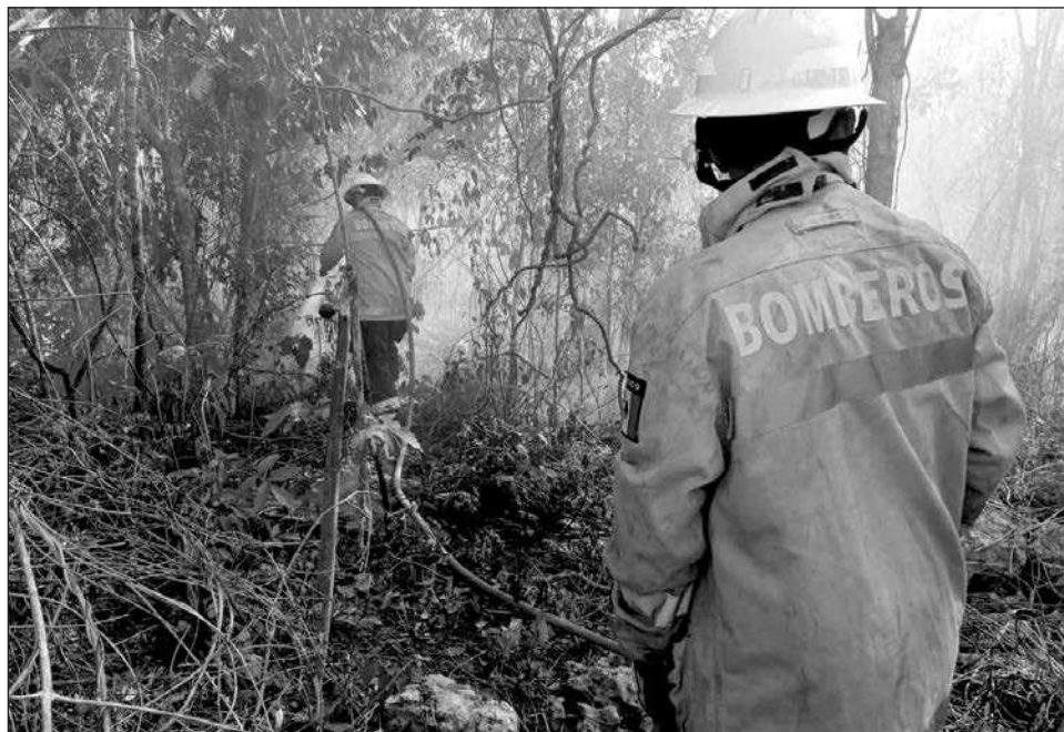
▲ El objetivo del estudio es garantizar que todos los municipios trabajen bajo los mismos lineamientos de prevención ante fenómenos hidrometeorológicos.

La Coordinación Estatal de Protección Civil, dijo, ha reforzado un plan integral para actualizar, homologar y fortalecer estos Atlas, una estrategia que responde a la