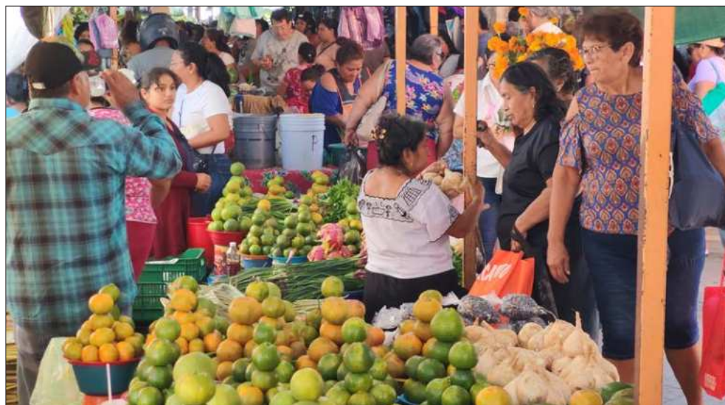
▲ Al momento de pagar por el mismo trabajo, las desigualdades se hicieron evidentes y por algún tiempo se tomaron como algo normal (...) la corrección de esta injusticia sigue como una demanda.

El crecimiento de la economía remunerada, y formal, es indispensable para mejorar la calidad de vida en México. Atendiendo a las mujeres, y ampliando su participación, el beneficio se traducirá en un incremento sustancial del Producto Interno Bruto (PIB), que a su vez debe ser equivalente a la superación de desigualdades en acceso a oportunidades, servicios y seguridad.