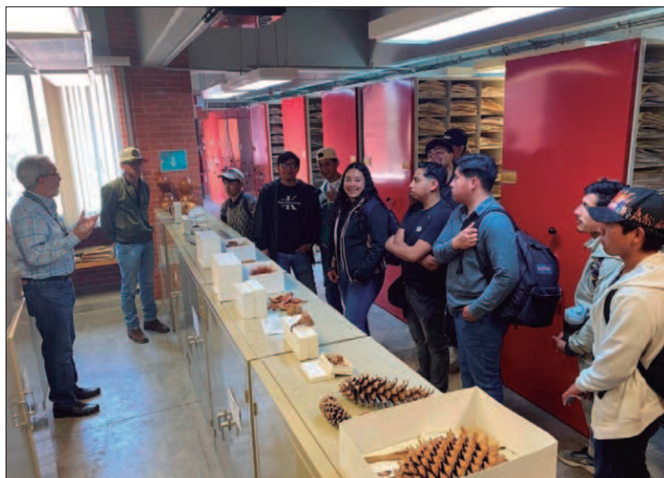
▲ En la actualidad, MEXU es una referencia primaria para el desarrollo de investigaciones sobre ecología, fitogeografía, etnobotánica y conservación.

Martínez Salas recordó que hace 50 años, "cualquier persona que quería estudiar las plantas mexicanas debía ir al Museo Nacional de Historia Natural de Estados Unidos porque ellos tenían medio millón de plantas en su colección y nosotros apenas 150 mil".