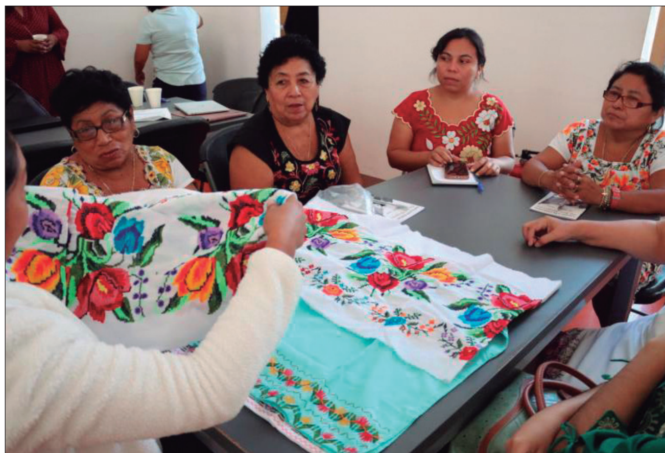
▲ Hasta el 5 de diciembre, las artesanas se reunirán en el Gran Museo del Mundo Maya para participar en diversas actividades orientadas al fortalecimiento de sus proyectos productivos, lo cual les permita certeza económica.

El Encuentro del Consejo Estatal de Bordadoras da seguimiento al proceso