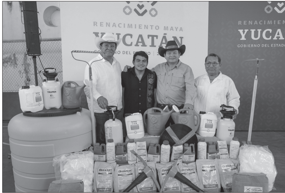
▲ El gobernador explicó que con el esquema Caminos Renacimiento , las unidades de producción agropecuaria podrán estar mejor conectadas y, con ello, las y los productores tendrán mayores facilidades para desplazarse y trasladar sus cosechas.

En la cancha multiusos de esta localidad, y en compañía del alcalde anfitrión, Galdino Poot Moreno, el