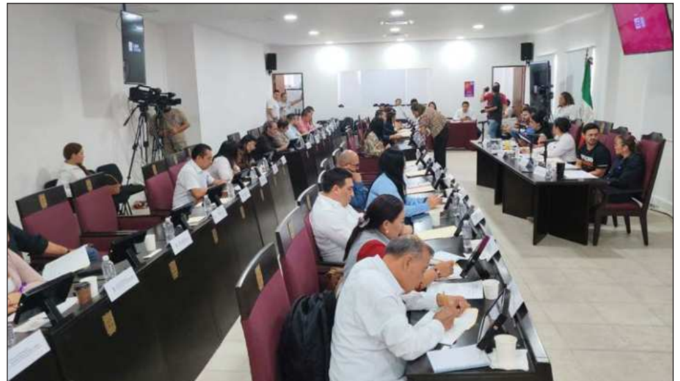
▲ Las dirigencias del PRI, MC, PAN y sectores empresariales habían apostado a que la propuesta de la Ley de Ingresos 2026, que incluye un crédito por mil millones de pesos, sería aprobada.