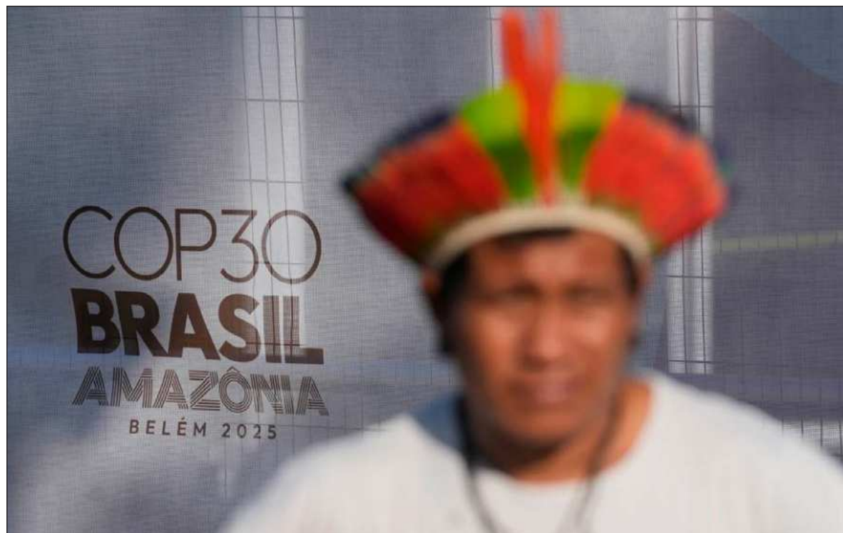
▲ “Una vez más, esta COP nos ha dejado con un sabor a fracaso. No parece haber una vía que convoque la voluntad global para hacer lo que se tiene que hacer para evitar que siga aumentando la temperatura del planeta”.

Creo que todos sabemos, al menos en nuestro fuero interno,