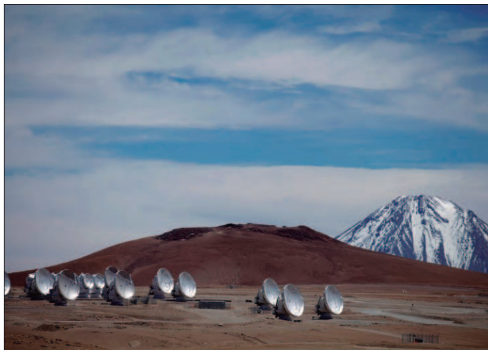
▲ Una treintena de científicos aseguraron que el Atacama es el mejor lugar del planeta para la astronomía, gracias a sus cielos oscuros, atmósfera estable y clima favorable.

“Tal como está concebido actualmente, el proyecto representa una amenaza inminente para algunas de las instalaciones astronómicas más avanzadas de la Tierra, que están operando bajo uno de los últimos cielos oscuros y prístinos del mundo”, indicaron en la carta firmada a mediados de noviembre y publicada el martes.