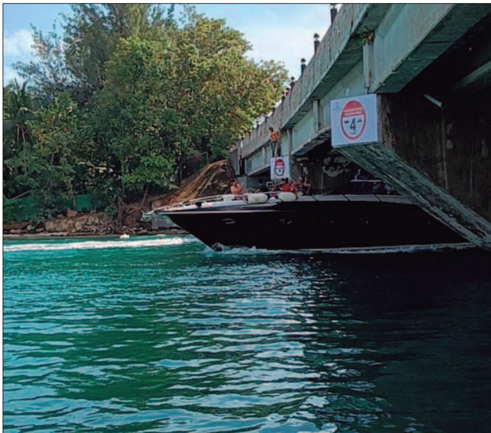
▲ “Cada año todas las embarcaciones formales renovamos sus certificados de seguridad marítima, son inspeccionadas por la Capitanía de Puerto”, subrayó la asociación.

“Estas son las que realmente generan este tipo de problemas y los accidentes han surgido principalmente en estas embarcaciones que no están siendo reguladas. Es ahí donde reconocemos el papel importante de Protección Civil en tierra y en todas las zonas bajo su jurisdicción”, enfatizó.