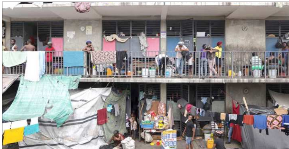
▲ Haití celebró por última vez unas elecciones generales en 2016 y no ha tenido un presidente desde que Jovenel Moïse fue asesinado en su residencia privada en julio de 2021.

“Debemos finalmente ofrecer al pueblo haitiano la oportunidad de elegir libre y responsablemente a quienes los liderarán”, escribió en X. “Al dar este paso decisivo, mientras seguimos plenamente comprometidos con la restauración de la segu-