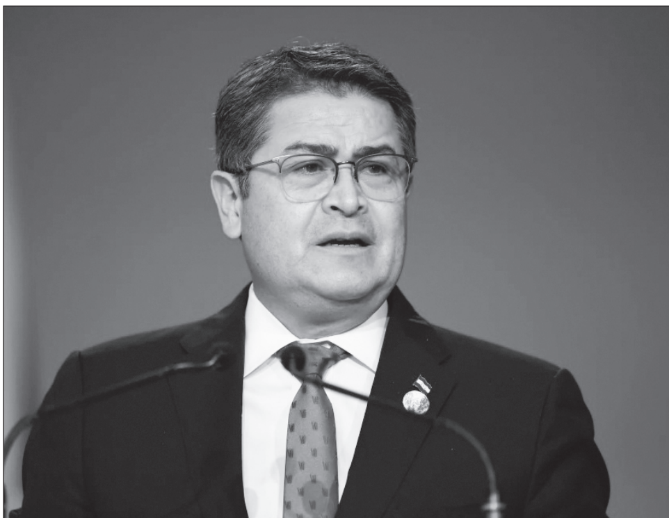
▲ El indulto y la liberación de Juan Orlando Hernández ocurren en medio del despliegue estadounidense en el mar Caribe y el Pacífico, así como la presión de Trump a favor del candidato conservador Asfura en las elecciones presidenciales del domingo.

Desde inicios de septiembre, Estados Unidos lleva a cabo una operación contra el narcotráfico en el Caribe que ha dejado 83 muertos en el bombardeo de al menos 20 supuestas narcolanchas.