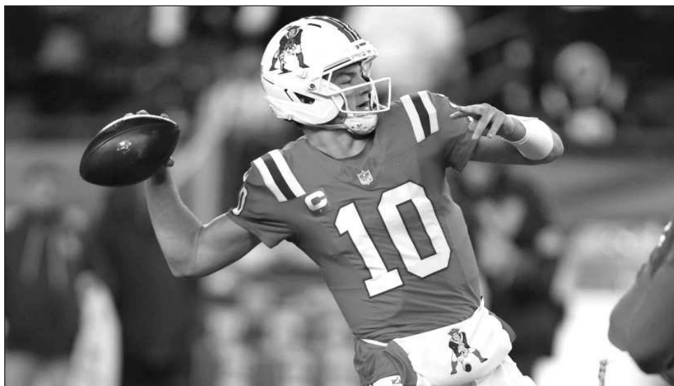
▲ Drake Maye, quarterback de los Patriots, durante el triunfo ante los Gigantes de Nueva York.

a sus jugadores que no hay nada garantizado cuando retomen las prácticas. Esta temporada, los equipos tienen un récord de 16-12 tras su semana de descanso.