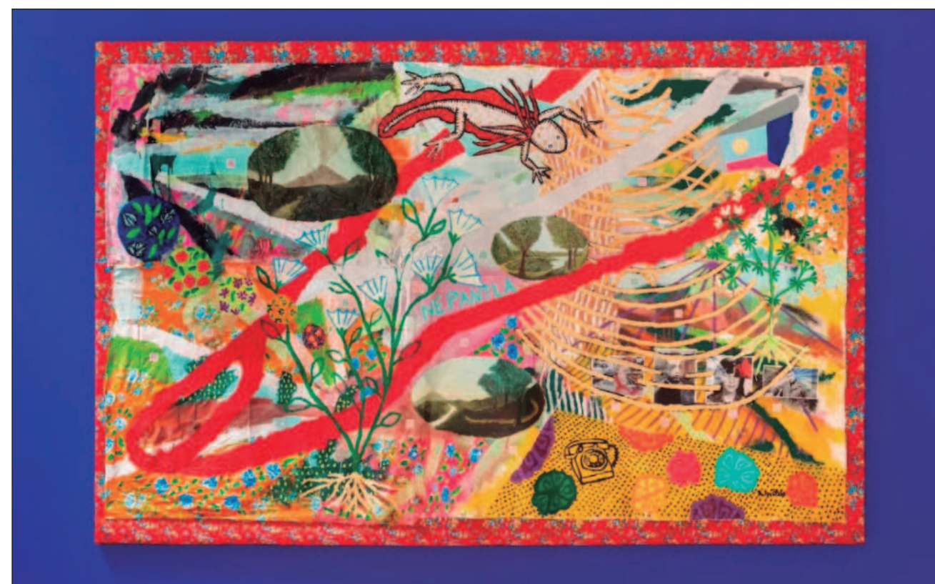
▲ Más que un homenaje, el proyecto es un viaje que permitirá al público introducirse en el amplio espectro pictórico de las obras de Antonio Ortiz y su dedicación a las luchas sociales, “una invitación a gozar lo que hizo en vida”.

“No lo llamaría homenaje, porque a los pocos días de su partida una gran comunidad de amigos, gestores culturales y artistas de diversas disciplinas realizaron un tributo de ma-