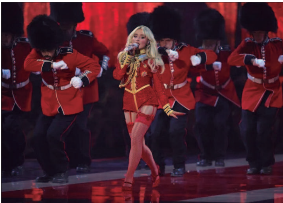
▲ La cantante Sabrina Carpenter arremetió este martes contra la Casa Blanca por utilizar su canción viral Juno en un video "malvado y repugnante" que muestra redadas migratorias y pidió que no la involucren en lo que calificó como una "agenda inhumana".