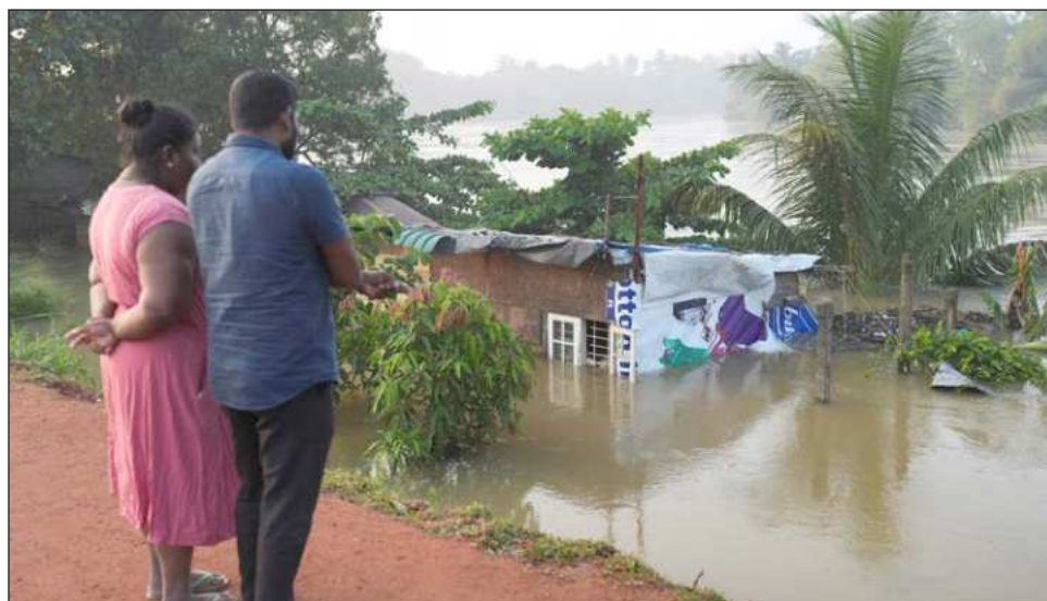
▲ Una torrencial temporada monzónica, junto con dos ciclones tropicales, provocó fuertes lluvias en Sri Lanka, partes de la isla indonesia de Sumatra, el sur de Tailandia y el norte de Malasia.

Un análisis de la Afp de los datos meteorológicos del gobierno estadounidense mostró que varias regiones de Asia afectadas por las