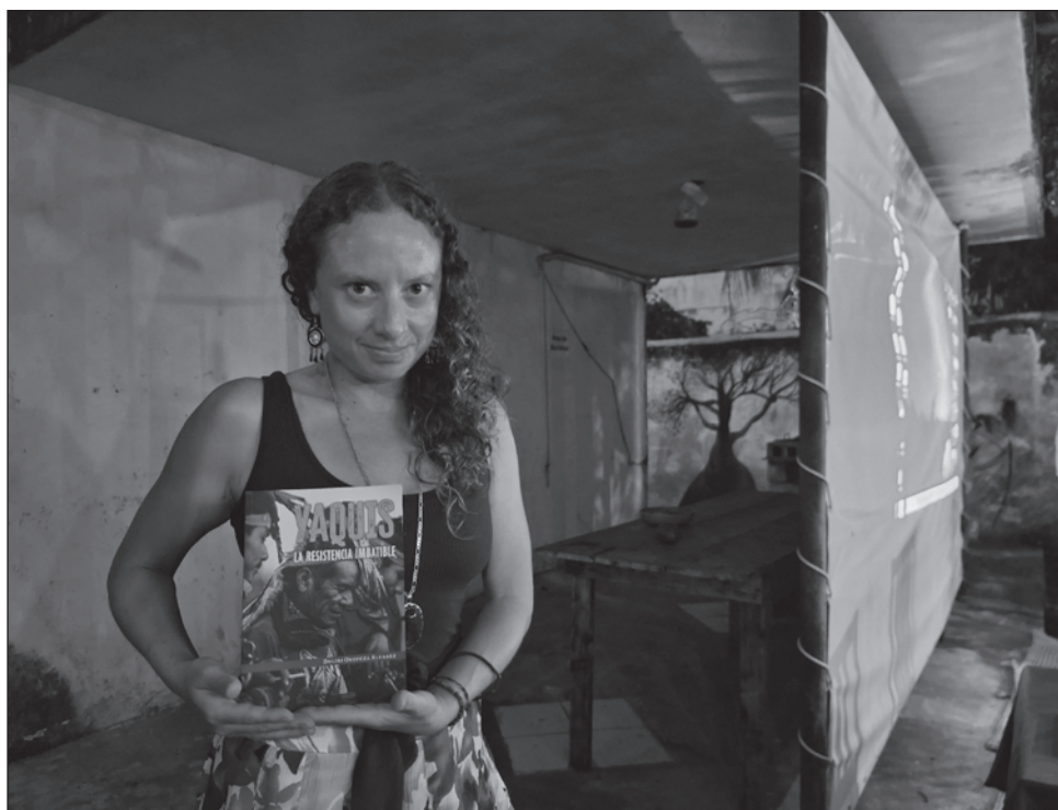
▲ En su Yaquis: La resistencia imbatible , Daliri Oropeza sostiene que los pueblos originarios tienen una coincidencia absoluta en sus cosmovisiones, la defensa del territorio.

"Para el yaqui, la esperanza es un antídoto contra la catástrofe"