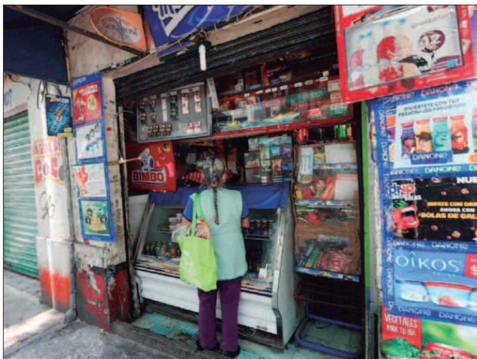
▲ El comerciante de las pequeñas tiendas se está quedando sin herramientas para amortiguar la crisis; el margen ya no alcanza para compensar incrementos: Anpec.

A su vez, son clave las reformas estructurales que reduzcan la burocracia, simplifiquen las normativas y rebajen las barreras de entrada en los sectores de servicios, ya que es la forma de impulsar la competencia, la innovación y el dinamismo empresarial y reforzar de forma sostenible el nivel de vida, de acuerdo con las declaraciones de Cormann.