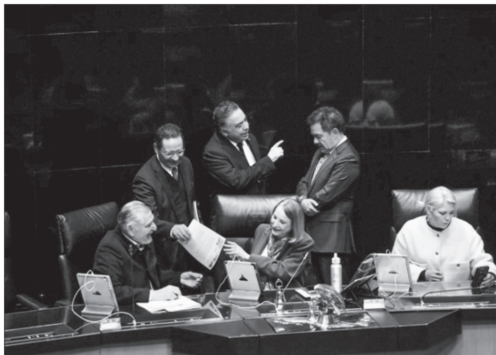
▲ En la comparecencia se llevarán a cabo tres rondas de preguntas, una por cada grupo parlamentario, de dos minutos cada una; cada candidato dispondrá de 20 minutos para exponer sus propuestas y responder los cuestionamientos de los legisladores.