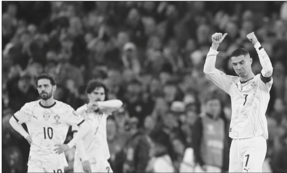
▲ Cristiano Ronaldo y Portugal serán contrincantes del Tricolor en marzo próximo.

Además del duelo ante los portugueses, los mexicanos enfrentarán a Bélgica el 31 de marzo, en el Soldier Field de Chicago.