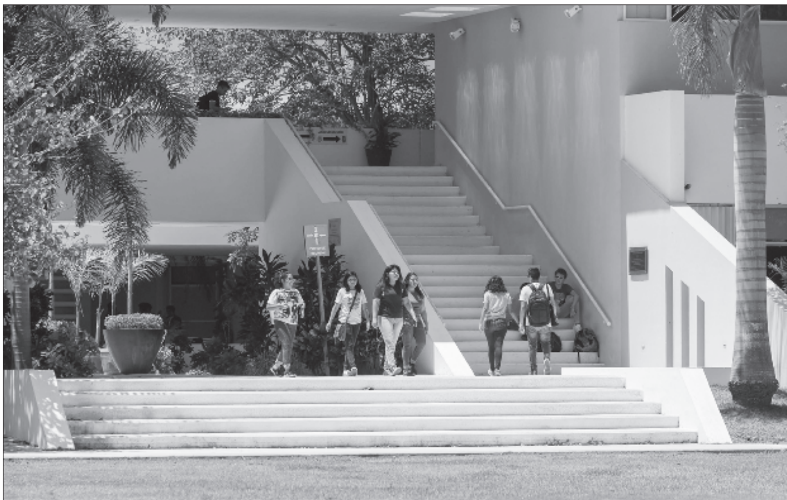
▲ "Una de las áreas que tiene tendencia a reducción es la de educación superior. Si bien Hacienda reconoció que la propuesta original de presupuesto para la UNAM y el IPN fue un error al asignar una reducción importante con respecto al otorgado en 2024, la tendencia no se ha corregido.