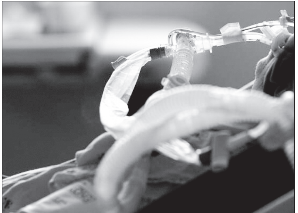
▲ El estudio, conducido por científicos de la Universidad de São Paulo, empezó en 2020, en el inicio de la pandemia de Covid-19, que en Brasil causó unos 700 mil muertos.

Los científicos volvieron a recoger muestras de sangre de esas seis parejas en 2022, después de una segunda infección y cuando los participantes ya habían