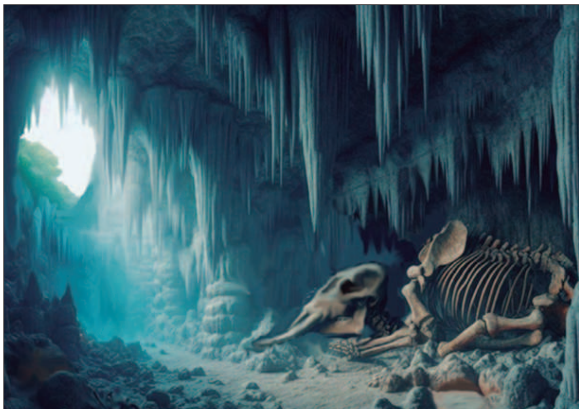
▲ “La enigmática cueva Loltún ha guardado cientos de huesos que recuerdan que la búsqueda de fuentes de agua para sobrevivir siempre ha movido a diferentes especies por el planeta”.

UNA MANADA DE mastodontes de las cordilleras, pertenecientes a la especie Cuvieronius hyodon (primos lejanos de los elefantes), emprendió su marcha desde la costa de Celestún en el oeste de Yucatán en busca de agua. La sequía había agotado el agua de los petenes, y la sed apremiante empujaba a los animales a buscar desesperadamente nuevas fuentes para sobrevivir. La matriarca reunió a su grupo con fuertes sonidos, barritando una y otra vez para indicar que la siguieran. Era momento de partir en búsqueda