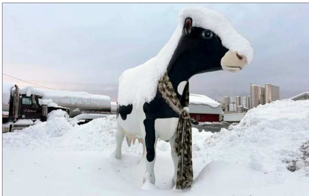
▲ Casi 61 centímetros de nieve ya han caído en partes de Nueva York, Ohio y Michigan, y se registraron unos 73 centímetros de nieve en el extremo noroeste de Pensilvania, y se espera que el aire frío se desplace sobre el tercio oriental de EU.

En Buffalo, funcionarios de los Bills de la NFL buscaron voluntarios para retirar la nieve en el estadio, incluyendo antes del partido del domingo por la noche contra los 49ers de San Francisco.