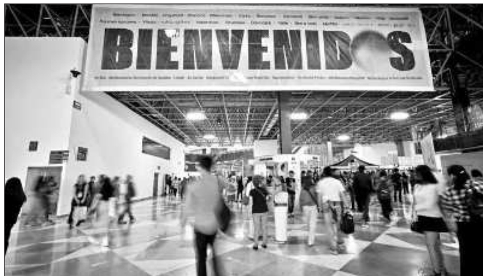
▲ Este sábado, luego de la inauguración del pabellón de España -país invitado de honor- la FIL era un hervidero sobre todo de jóvenes a la caza de libros de romance y fantasía.

"Un poco de agua y a seguirle", dijo con entusiasmo