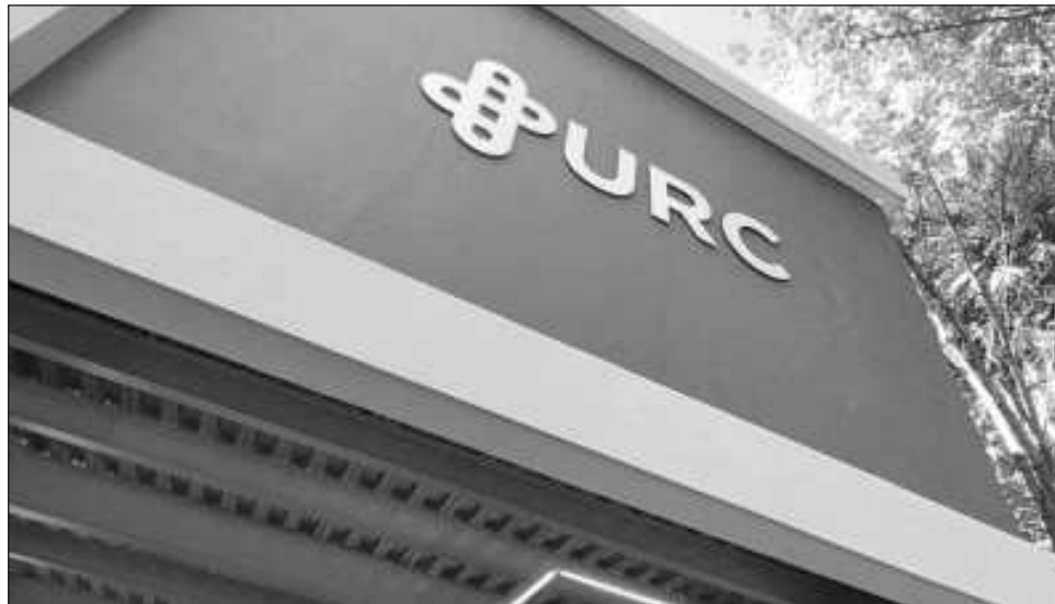
▲ En CDMX esta Universidad tiene 60 mil estudiantes y cuenta con 23 licenciaturas, cinco especialidades, siete maestrías y tres doctorados.

Posteriormente se continuará con Tijuana, Sonora, San Luis Potosí y Puebla, con la creación de nuevos planteles. Ruiz indicó que el esquema inicial es que los gobiernos de los estados