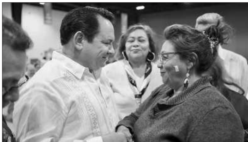
▲ Desde el Centro de Convenciones Yucatán Siglo XXI, Díaz Mena puso en marcha los trabajos de la Comisión Regional II Noreste del COPLEDEY.

El Ejecutivo estatal resaltó que este órgano se enfocará en temas clave, desde mejorar la infraestructura hasta enfrentar los retos en salud, educación y desarro-