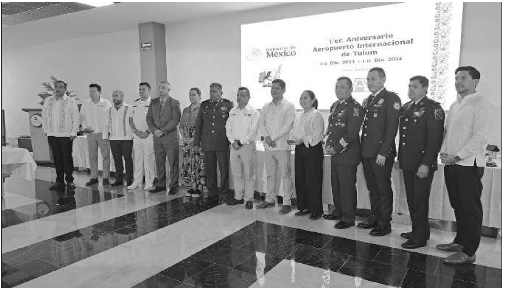
▲ La construcción del aeropuerto “se hizo en tiempo récord de solamente año y medio ha sido una proeza de ingeniería militar”: Campillo.

sarrollo respectivo a fin de ampliar la infraestructura aeroportuaria en el corto, mediano y largo plazo conforme la demanda lo amerite. Esto considerando que se cuenta con una superficie de terreno suficiente con el potencial para atender en su máximo desarrollo alrededor de 40 millones de pasajeros. Hoy después de 365 días de un recorrido lleno de desafíos experiencias y aprendizajes le hemos dado la vuelta al sol y seguimos esforzándonos cada día más, pero por supuesto en este camino no hemos estado solos, hay mucho que agradecer a un sinfín de personas de las diversas dependencias que han trabajado hombro con hombro con nosotros para hacer de este proyecto una realidad incuestionable”, finalizó el general.