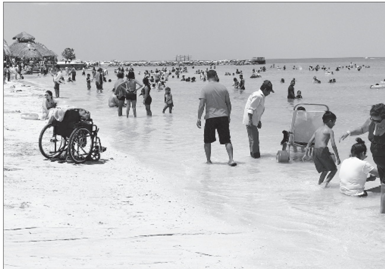
▲ Por grupos de edad, los adultos mayores constituyen 50 por ciento de este sector.

Los estados con las concentraciones más altas de personas de cinco años y más con discapacidad fueron Zacatecas, con 11.2 por ciento, Tabasco con 10.1, Durango con 9.9 y Oaxaca con 8.8 por ciento.