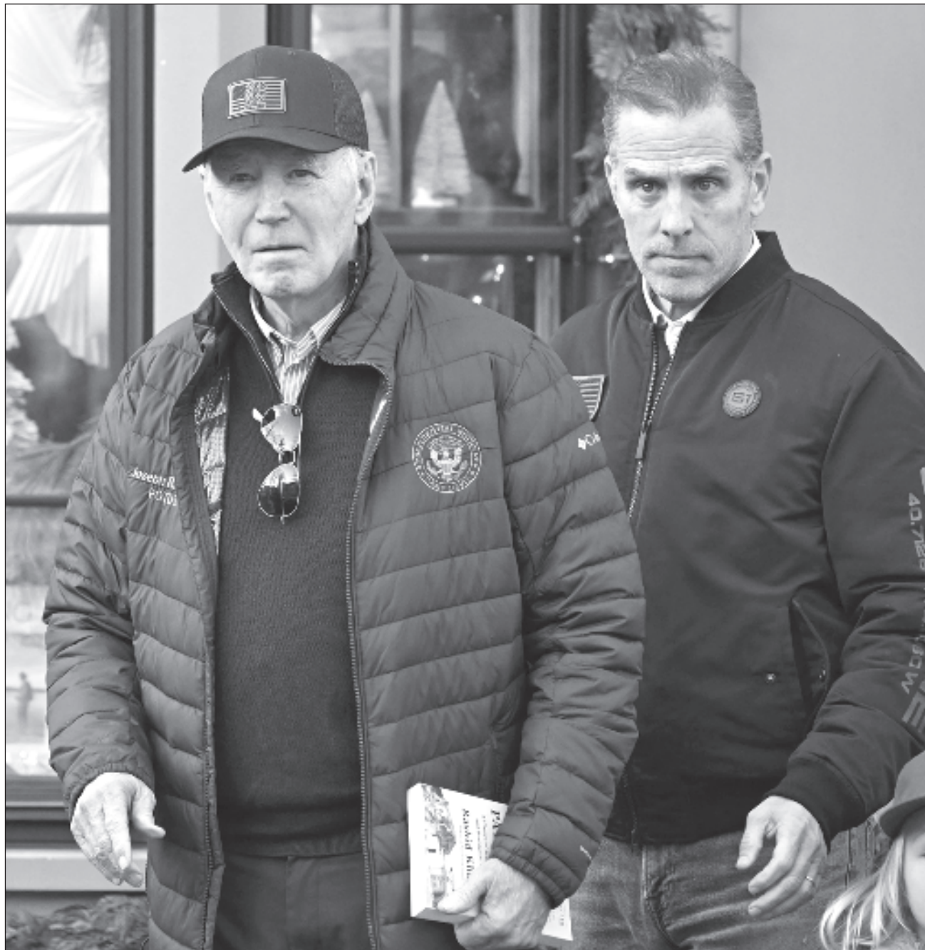
▲ El perdón de la pena total e incondicional emitido por el presidente estadounidense, Joe Biden, abarca 10 años.

Un jurado lo declaró culpable en junio de hacer declaraciones falsas en una verificación de antecedentes de armas.