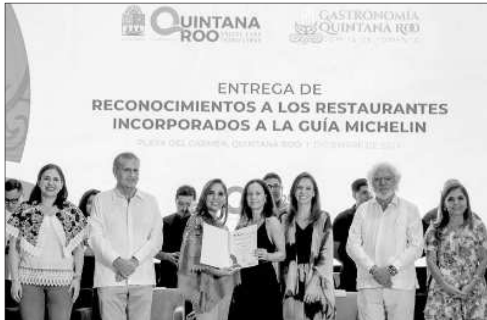
▲ Al entregar los reconocimientos, la gobernadora Mara Lezama hizo énfasis en que es momento de decirle al mundo que existe una gran gastronomía en el Caribe Mexicano.

para lograr que la Guía Michelin hoy esté presente en los restaurantes del estado no es solo un reflejo del talento y la dedicación de los chefs de los restaurantes, sino de todo el equipo de trabajo de cada uno de los galardonados, un esfuerzo colectivo por elevar la gas-