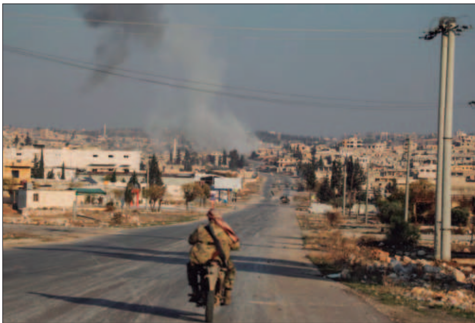
▲ El presidente sirio, Basahr al Asad, denunció que la reciente escalada rebelde en el norte del país es un nuevo intento de redibujar el mapa de Medio Oriente.