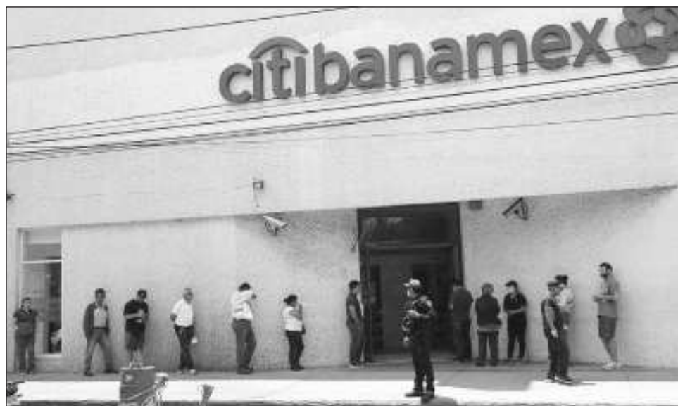
▲ Los clientes de Banamex no recibirán llamadas, correos o mensajes por parte del banco para solicitar que hagan algún trámite, cambio o transacción con motivo de la separación del consorcio financiero estadounidense Citigroup, “podría ser intento de fraude”.

De esta forma, más de 20 millones de clientes que tienen una tarjeta de crédito, uno de nómina, personal, automotriz, hipotecario, productos de ahorro, seguros o sus fondos para el retiro pasarán a manos de Ba-