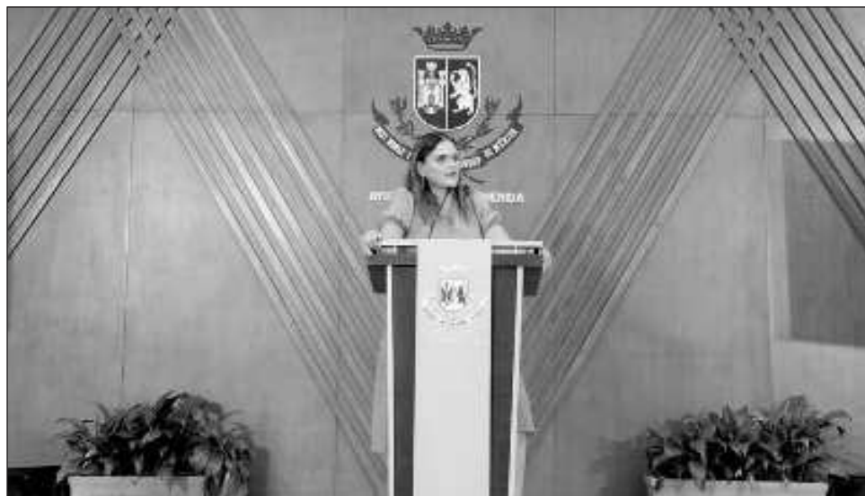
▲ La alcaldesa de Mérida reconoció un trabajo cercano con las empresas y señaló que por eso podrán acceder a préstamos con facilidades para la creación de sus desarrollos.

En el eje de Inclusión, bienestar y desarrollo social hay 23 objetivos. Se busca cubrir temas como la salud, la alimentación, la educación, atención a grupos vulnerables: jóvenes, mujeres, adultos mayores, entre otros. Entre las acciones concretas está el fortalecimiento del