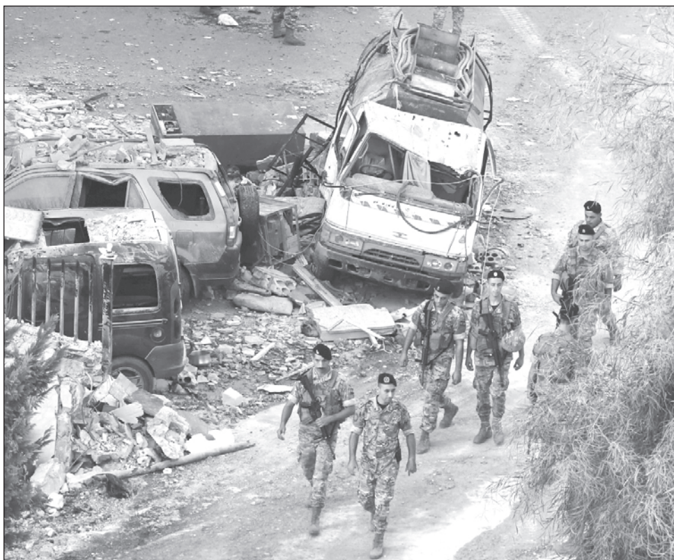
▲ Las tropas israelíes retomaron su ofensiva terrestre en el norte del enclave en octubre, desde entonces, unas 2 mil 700 personas han muerto y cerca de 10 mil han sido heridas.

Desde entonces, Israel ha llevado a cabo una serie de ataques en Líbano, el más reciente este lunes, cuando un ataque de dron mató a un hombre en una motocicleta en el sur de Líbano y otro impactó un bulldozer del ejército libanés en la ciudad nororiental de Hermel, hiriendo a un soldado. El ejército libanés se había mantenido al margen de la guerra entre Israel y Hezbollah. Israel sostiene que los ataques son en respuesta a las violaciones de Hezbollah.