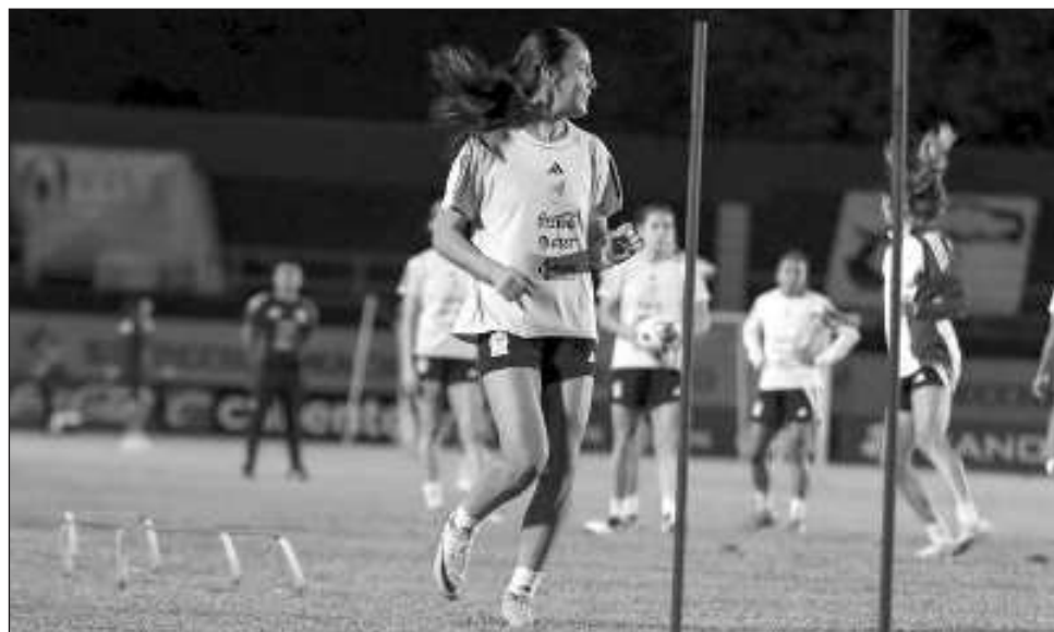
▲ La selección nacional femenil entrenó en el Carlos Iturralde Rivero.