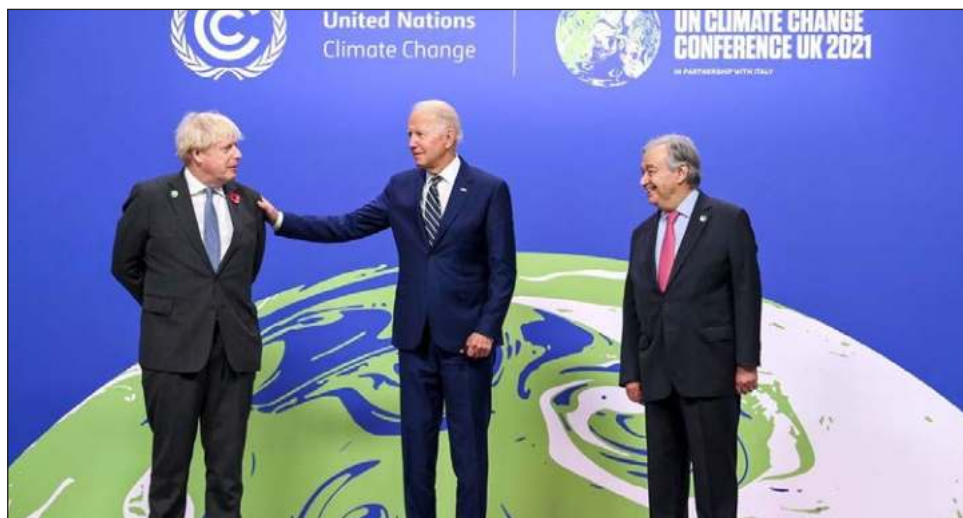
▲ Los 100 países que en principio firmaron la Declaración de Glasgow representan el 85 por ciento de los bosques del mundo. En la imagen, Boris Johnson, primer ministro del Reino Unido; Joe Biden, presidente de Estados Unidos y António Guterres, secretario general de la ONU.

Los principales impulsores de los acuerdos fueron Estados Unidos, con su presidente, Joe Biden, esforzándose por dejar atrás la imagen que dejó su predecesor, Donald Trump, en este tipo de encuentros y que incluso decidió sacar a su país del Acuerdo de París; también el Reino Unido, anfitrión de la COP26 y que ha desplegado toda su maquinaria diplomática para que sea un éxito, y