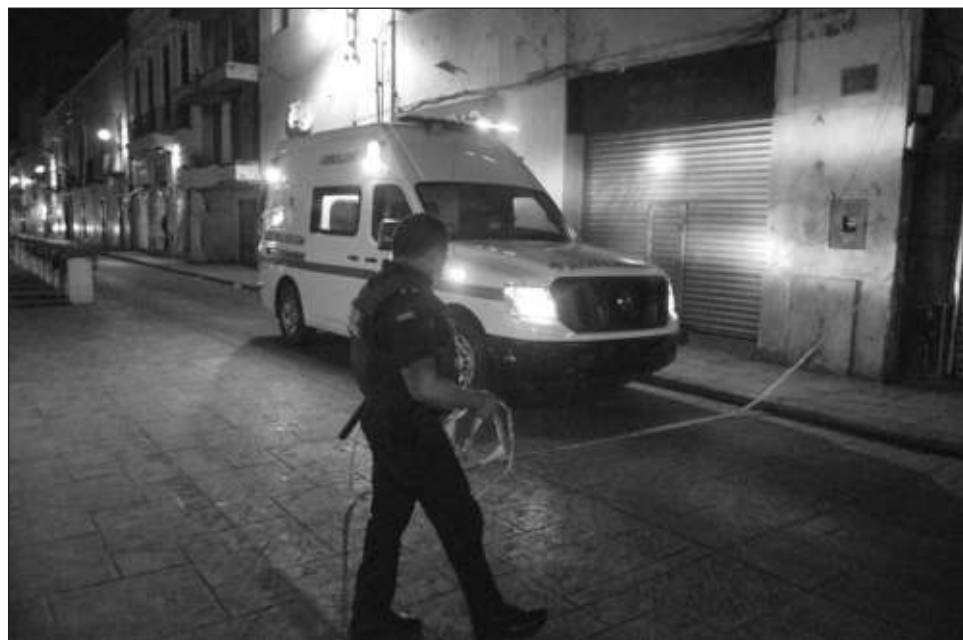
▲ Yucatán, según detalla el informe, tiene la tasa más baja de homicidios de todo el país, según el estudio del INEGI.

Los homicidios son la quinta causa de muerte en