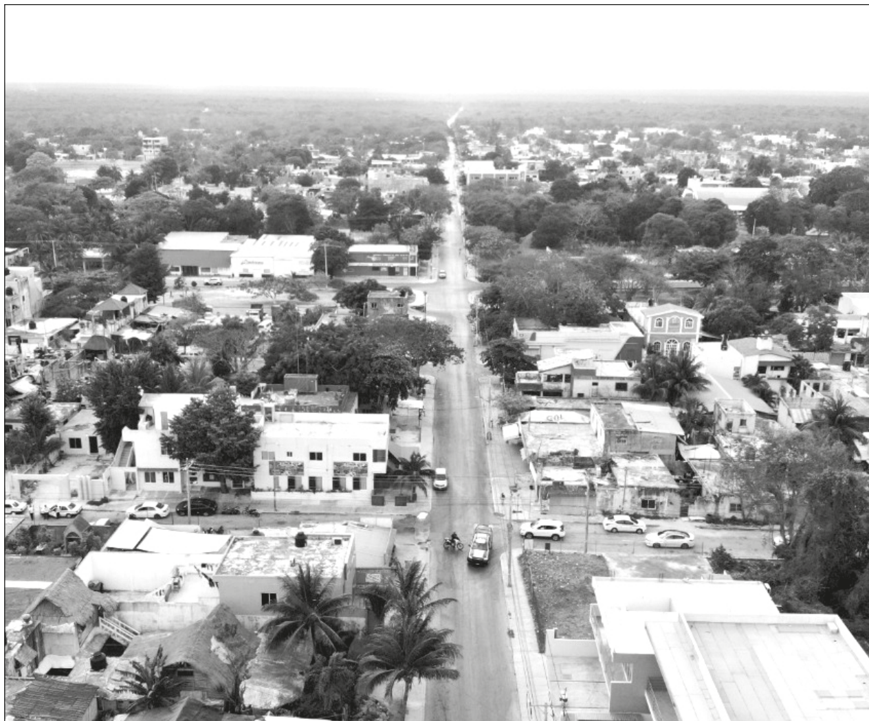
▲ Será la primera gran oportunidad para que los interesados den a conocer los problemas que los aquejan y sus propuestas para atenderlos.

De la misma forma, para contar con más elementos para la integración del PMD, considerando que la participación en los foros estará limitada debido a cuestiones sanitarias, se levantarán encuestas en línea a través del link https://www.puertomorelos.gob.mx/encuestapmd , además de que en el kiosco del Casco Antiguo y en la delegación de Leona Vicario se instalarán buzones con formatos para sugerencias.