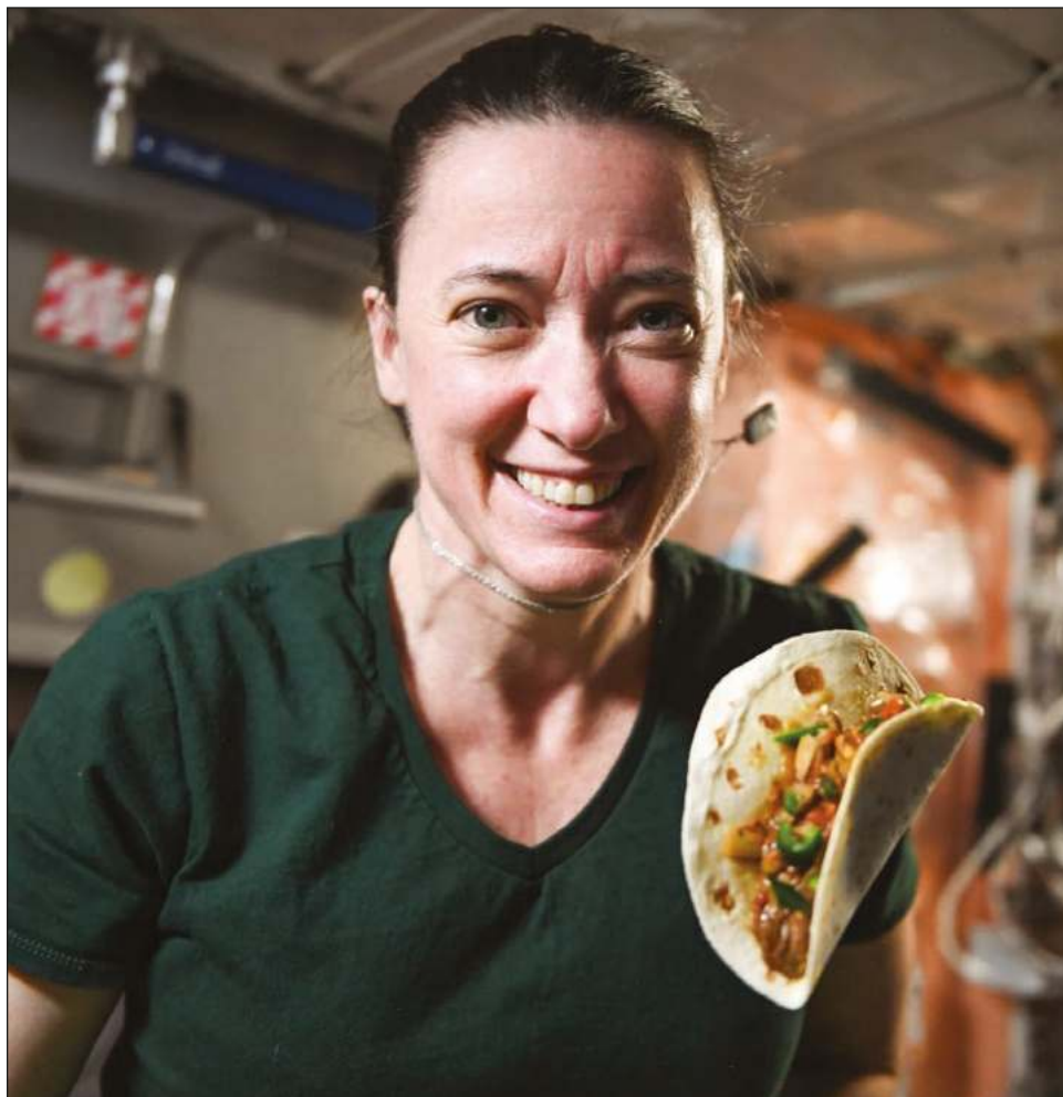
▲ La agencia espacial estadounidense eligió experimentar con los chiles porque son una excelente fuente de vitamina C y son fáciles de cultivar.

La agencia espacial estadounidense eligió experimentar con los chiles porque son una excelente fuente de vitamina C y son fáciles de cultivar.