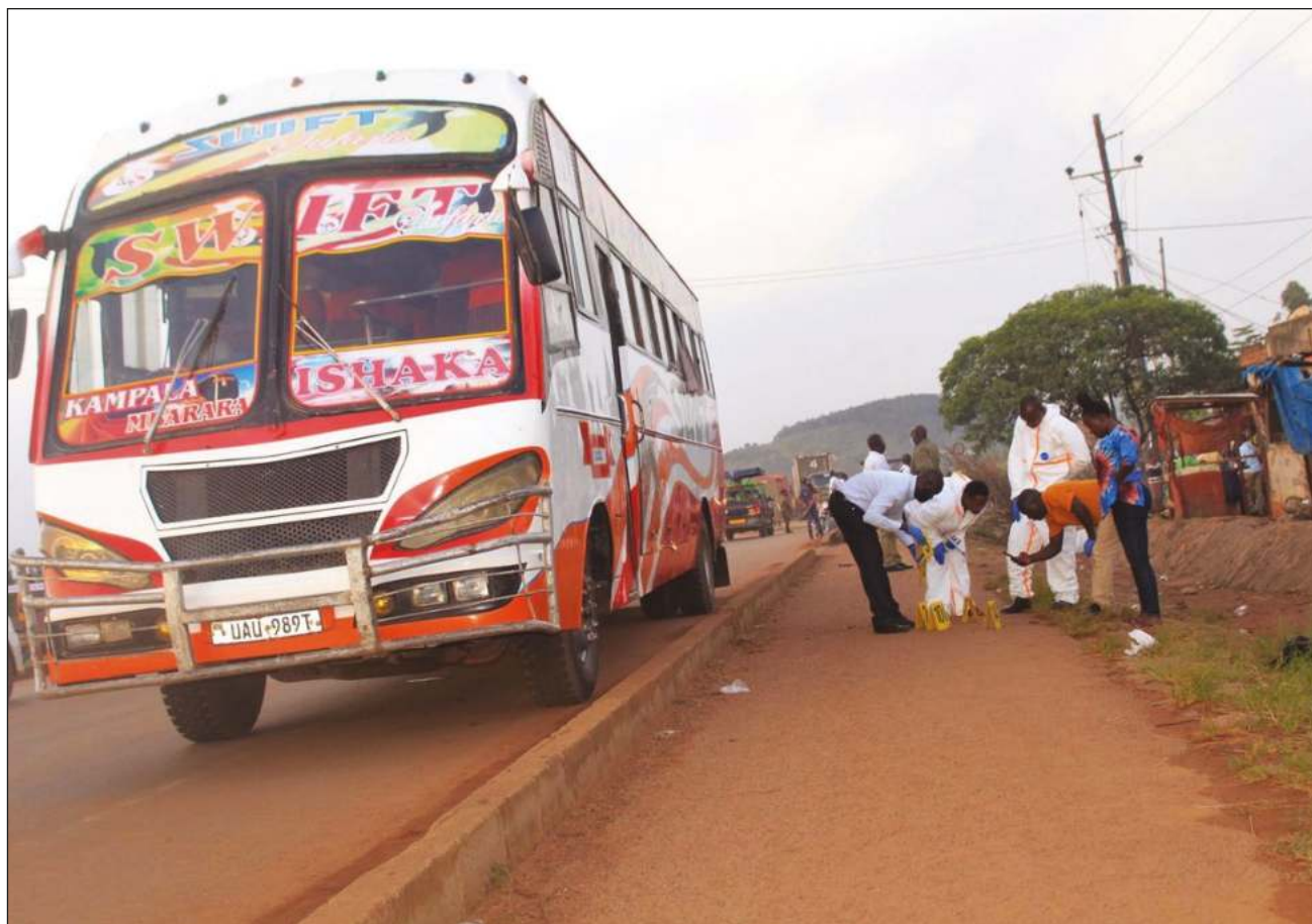
▲ El mes pasado, un suicida atentó contra un autobús en Mpigi, uno de los recientes ataques extremistas orquestados por el Estado Islámico que han golpeado a Uganda.

Mukulu participó en 1991 en ataques contra la Mezquita Antigua de Kampala -ahora la Mezquita Nacional de Uganda- que se saldaron con cuatro muertos, si bien fue liberado dos años después tras ser absuelto de asesinato.