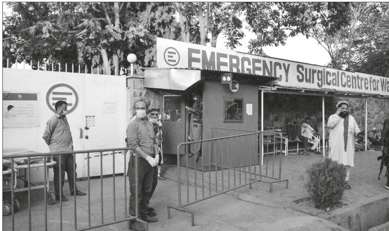
▲ El atentado inició cuando uno de los miembros del EI se inmoló a la entrada del centro médico.

A la vez, otro atacante mató al guardia del centro sanitario y le arrebató su fusil, tras lo cual “otros tres suicidas irrumpieron en el edifi-