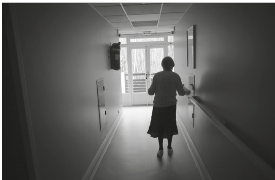
▲ En la investigación utilizaron cerca de 400 muestras cerebrales post mortem de pacientes de Alzheimer, así como 100 tomografías de personas que viven con la enfermedad.

“Una se relaciona con datos muy detallados obtenidos por PET (tomografía por emi-