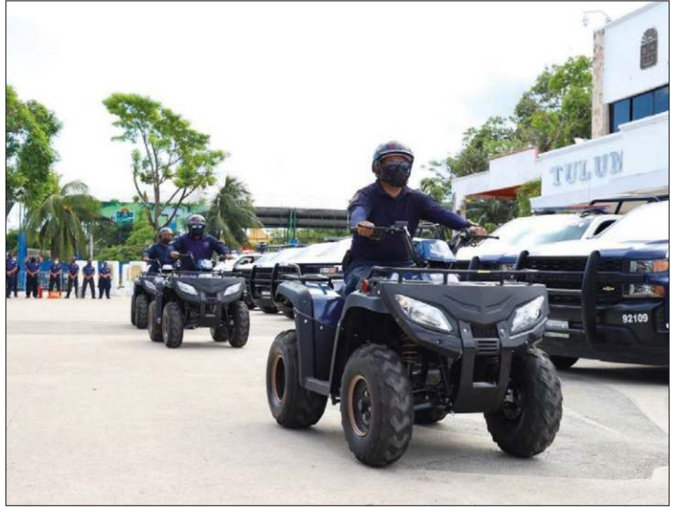
▲ El gobernador Carlos Joaquín atestiguar la entrega de 10 patrullas y seis motopatruillas a la Dirección General de Seguridad Pública y Tránsito de Tulum.

Al atestiguar la entrega de 10 patrullas y seis motopatruillas a la Dirección General de Seguridad Pública y Tránsito de Tulum, Carlos Joaquín insistió en que, de manera coordinada, se requieren incrementar los es-