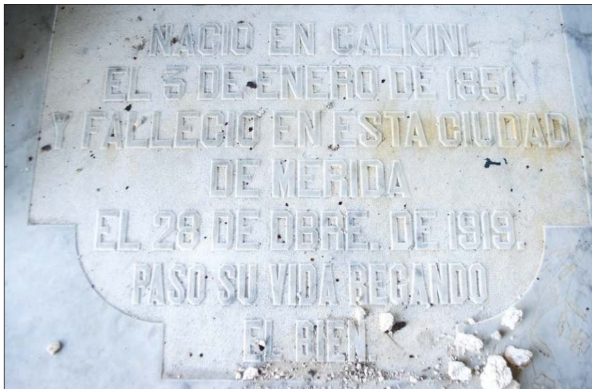
▲ La palabra Obituario terminó por desplazar a los poco elegantes “Avisos fúnebres” que aparecieron, a inicios del siglo pasado, en varias publicaciones.

Estos inicios, implícitamente, remiten a un suicidio o un accidente, una dolencia fulminante, como un infarto, o a una enfermedad que arranca la vida con la paciencia de una araña. Establecer cómo sobrevivió esta conquista silenciosa y