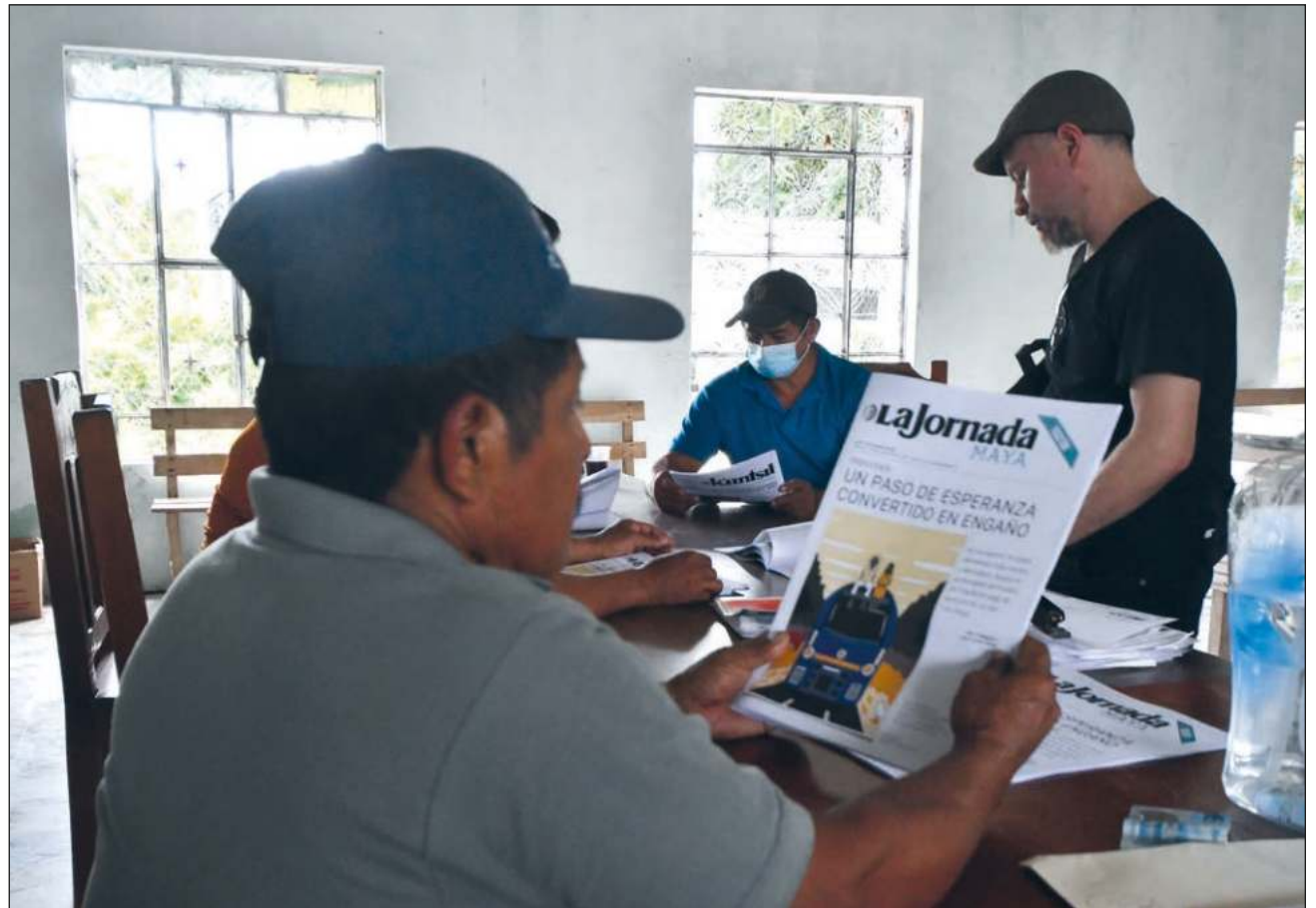
▲ El pasado 18 de octubre, La Jornada Maya informó que el despacho Barrientos y Asociados no pagó alrededor de 60 millones de pesos a unas 14 poblaciones. En la imagen, ejidatarios de Miguel Alemán reciben el periódico.

Así también señalaron que no están en contra del proyecto, sino que desean ser informados de todo proceso jurídico y agrario, pues lo poco que saben les da razón para pensar mal de cualquiera que les ofrezca