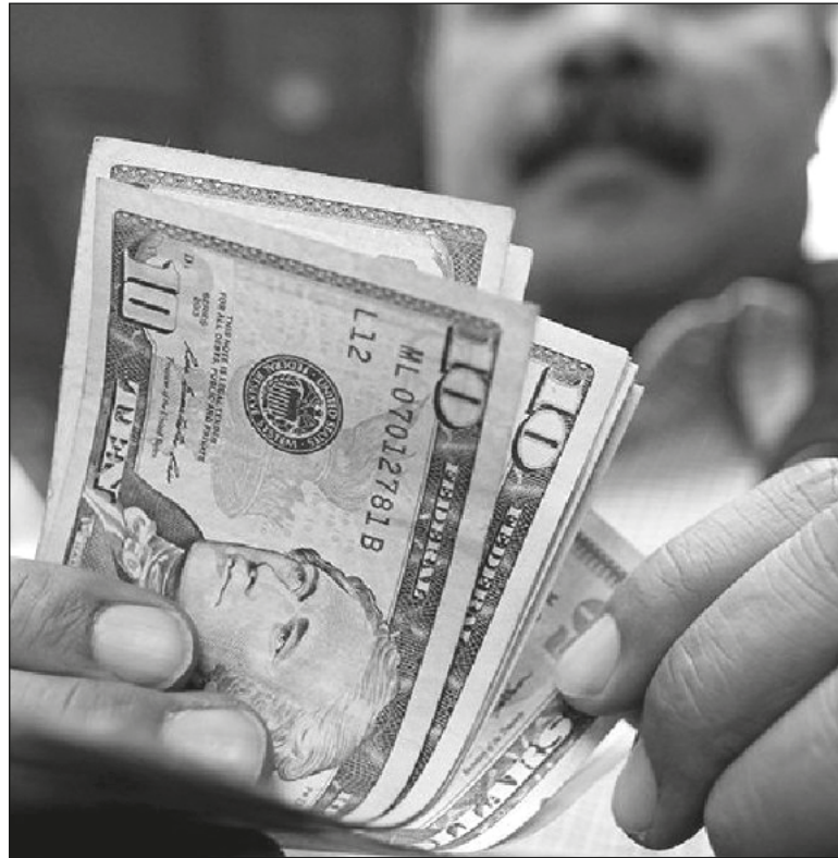
▲ Governments are generally incapable of adapting to create a modern, effective, fair yet simple tax system.

PRIVATE SECTOR LEADERS like Warren Buffet and Bill Gates have devised ways to fund major health, environmental, and educational projects by dives-