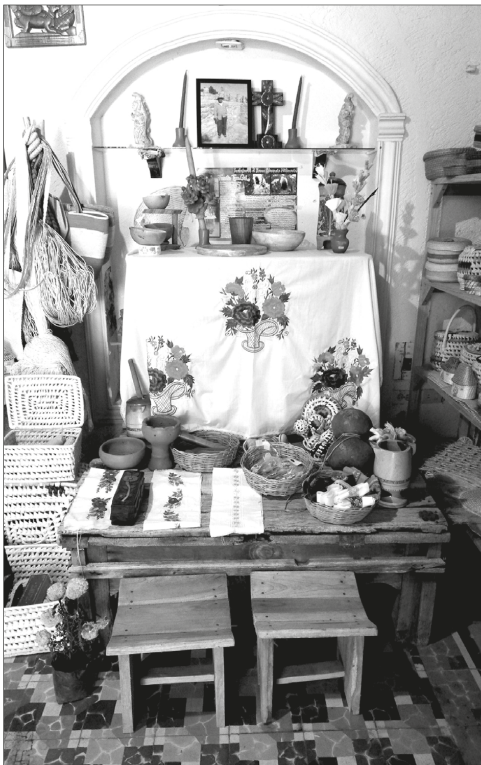
▲ Con un taller y degustación, Múul Meyaj dio a conocer la parte cultural en torno al Janal Pixán.

Conscientes de que la pandemia continúa, este