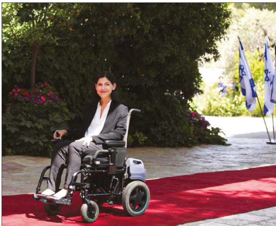
▲ La ministra de Infraestructura, Energía y Recursos Hídricos de Israel, Karine Elharrar, padece de distrofia muscular.

Por su parte, Bennett ha agradecido a Johnson su "rápida intervención en ese desafortunado incidente" y señaló que lo ocurrido debe servir para enseñar "la importancia de la accesibilidad para todos", palabras que Johnson ha respaldado.