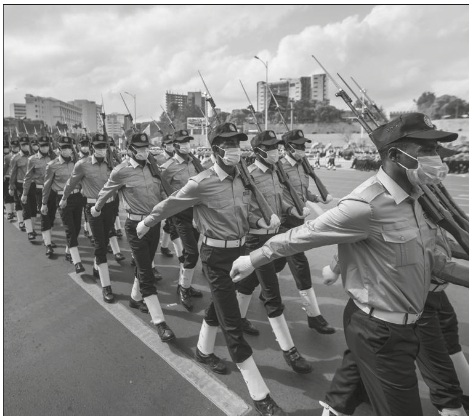
▲ Etiopía se encuentra sumida en una guerra civil desde hace un año.

El primer ministro reiteró su llamado a todos los ciudadanos a combatir a las fuerzas de Tigray, y añadió que "debemos vigilar estrechamente a los que trabajan para el enemigo y viven entre nosotros". El lunes se observó una nueva redada de personas de la etnia tigray en la ciudad.