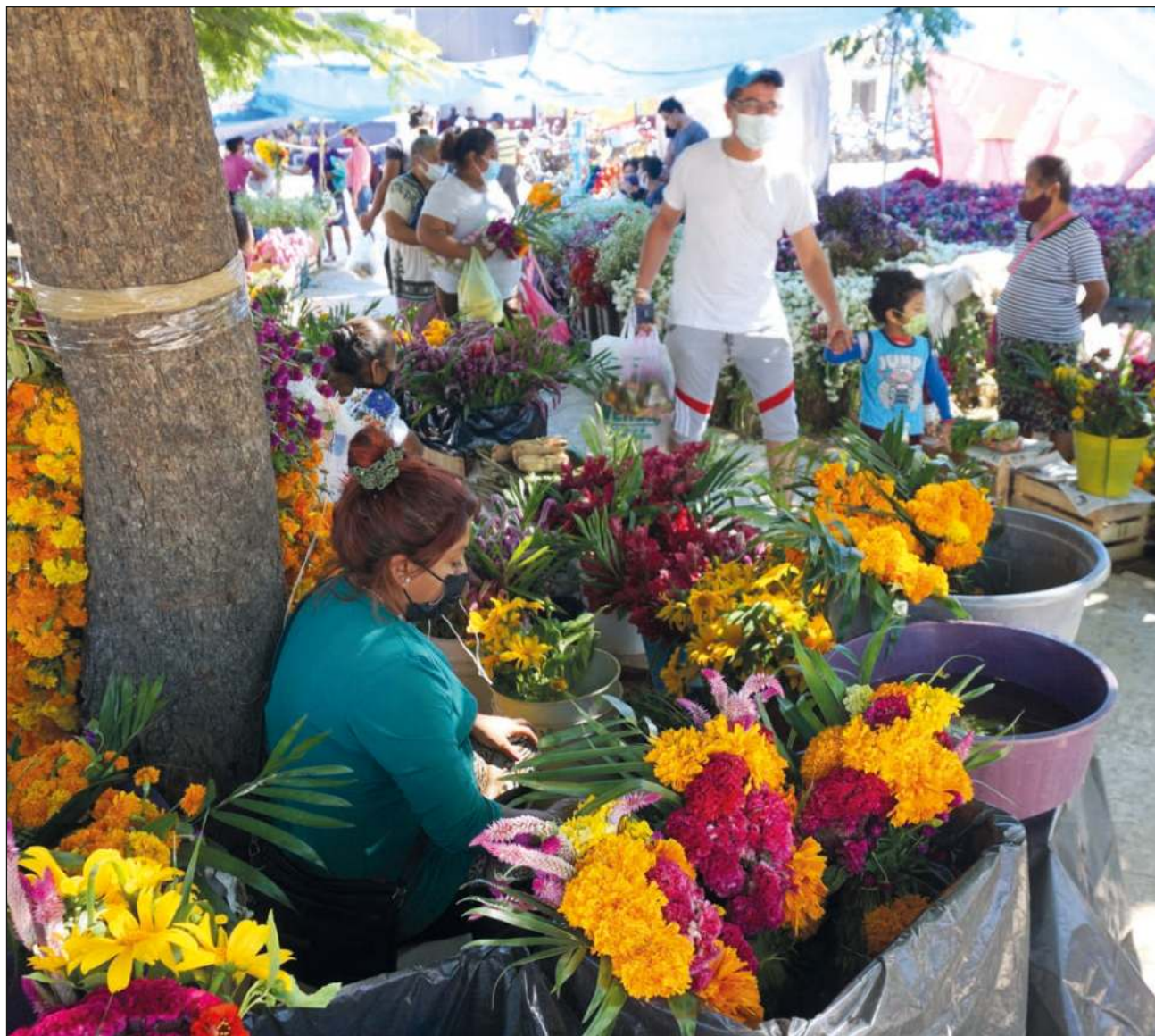
▲ Bajo la orden de proximidad social, la Fiscalía General del estado instaló un módulo itinerante.

También reconoció que estas medidas son para tener cercanía con los ciudadanos y promover con ello una imagen positiva de los ministeriales.