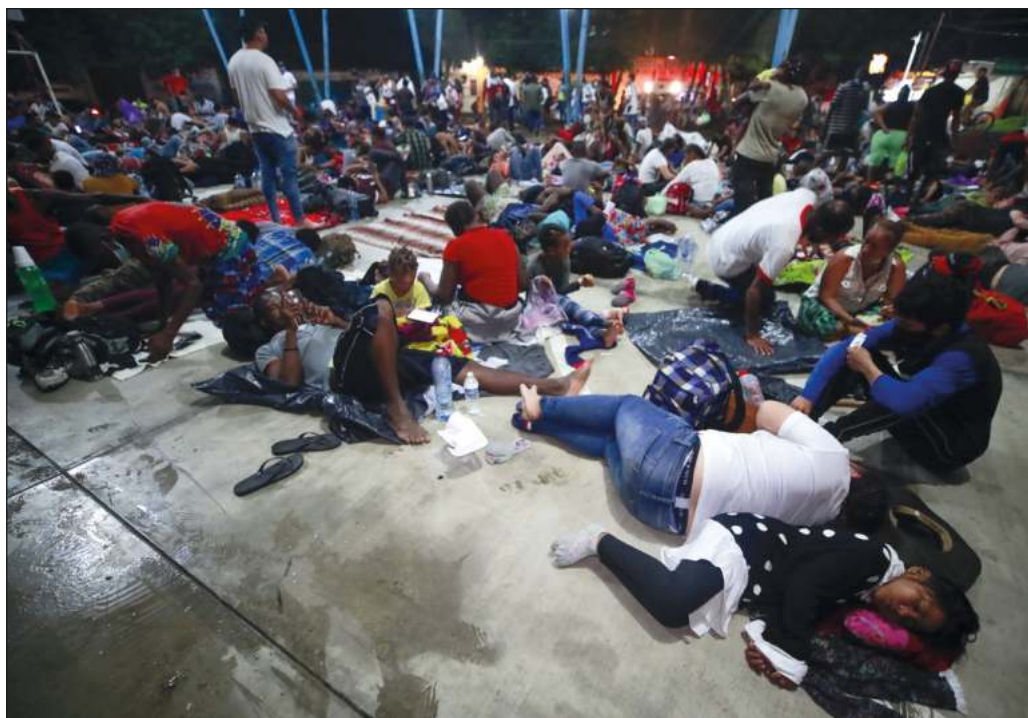
▲ Zacatecas y Michoacán se encuentran entre los estados con mayor índice histórico de expulsión de población hacia Estados Unidos.

Está claro que el apoyo brindado por los migrantes excede por mucho el costo de las dependencias destinadas a atenderlos y que, incluso sin esta consideración, su peso absoluto y relativo en la población, así como el elemental respeto a los derechos humanos, obligan a hacer de sus necesidades una prioridad de primer orden para los gobernantes. Cabe esperar que ni en Morelia ni en Zacatecas se concreten las desapariciones de las secretarías del Migrante y que, por el contrario, Monreal y Ramírez Bedolla refuercen las políticas dirigidas a sus comunidades residentes en Estados Unidos, lo cual resulta de mínima justicia hacia quienes debieron dejar sus tierras de origen para proveer sustento a sus familias.