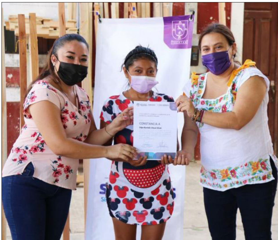
▲ Con la inversión de un millón 80 mil pesos se capacitó a 114 productoras.