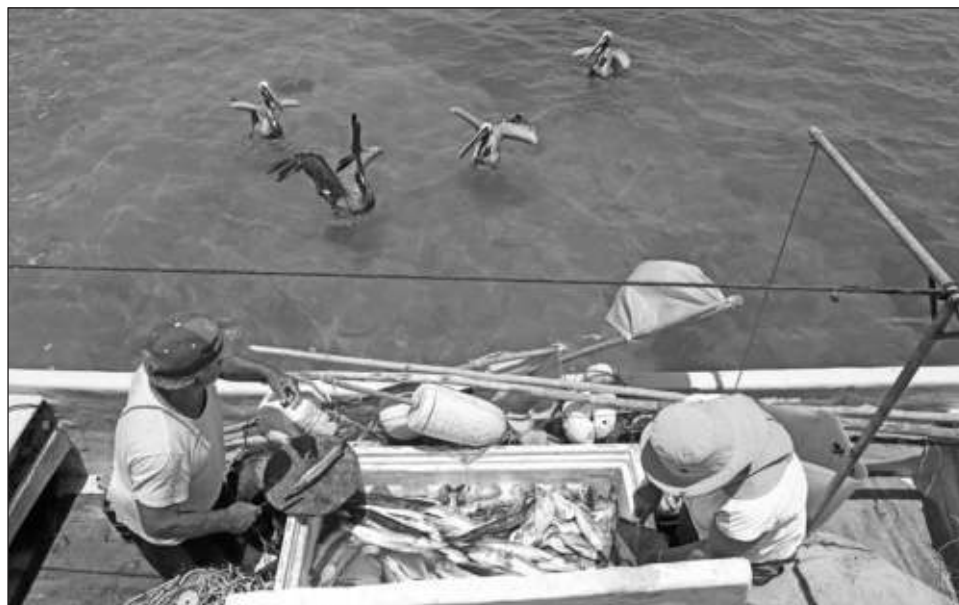
▲ Con la pandemia, los precios se vinieron abajo y las cooperativas no podían pagar los seguros de los pescadores, por lo que muchos se vieron obligados a endeudarse.

“Lo de los seguros realmente no lo podíamos pagar y las cinco cooperativas que somos de la zona oriente, per-