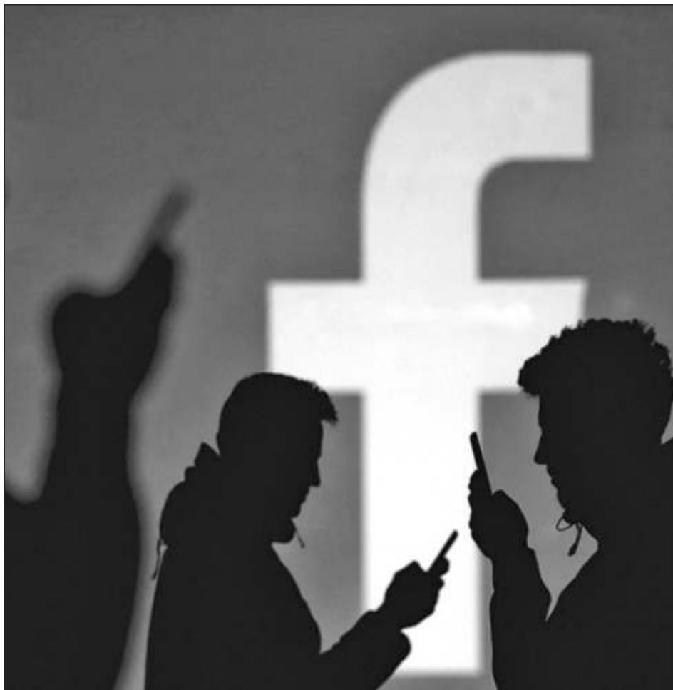
▲ Más de mil millones de perfiles individuales de reconocimiento facial serán cancelados en cuanto entre en vigor el cambio anunciado por Meta.

El cambio “resultará en la cancelación de más de mil millones de perfiles individuales de reconocimiento facial”, indicó en el texto, y agregó que la desconexión del sistema se producirá en las próximas semanas.