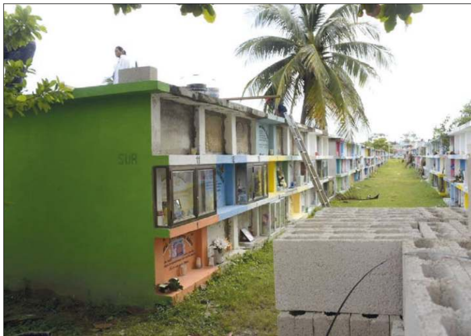
▲ En los cementerios de todo el municipio se levantarán bardas perimetrales y construirán andadores, o se mejorará el alumbrado. Foto Gabriel Graniel

“El Panteón Colonias se va a rehabilitar, vamos a subir la barda perimetral, se harán reparaciones en áreas que se encuentran derrumbadas,