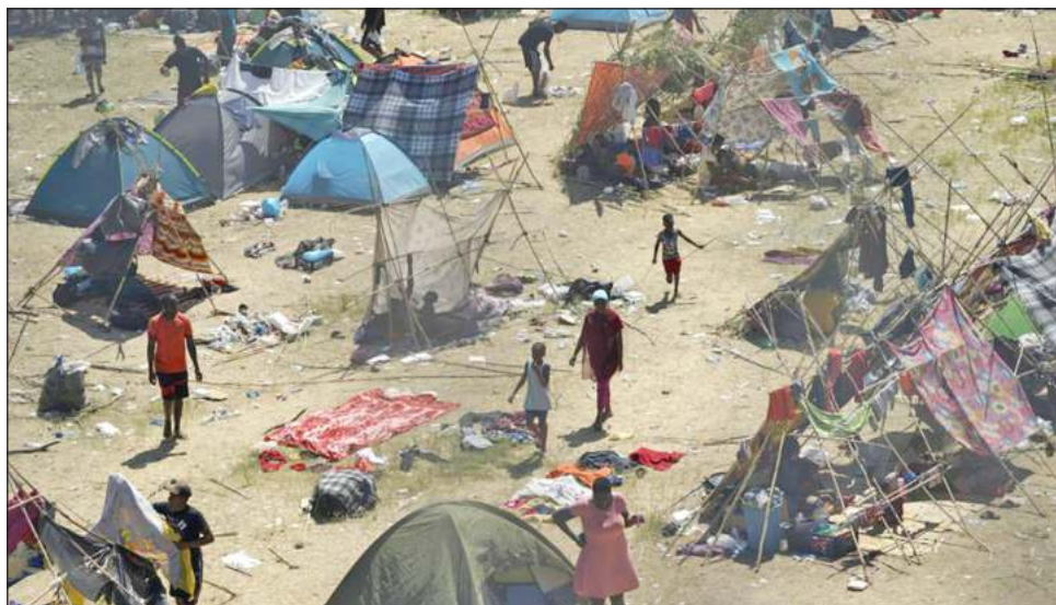
▲ En dos años, más de 70 mil migrantes, principalmente centroamericanos, fueron obligados a permanecer en suelo mexicano, en ciudades con altos índices de inseguridad.

El programa, conocido formalmente como los Protocolos de Protección a Migrantes (MMP, por sus siglas en inglés), fue impuesto por