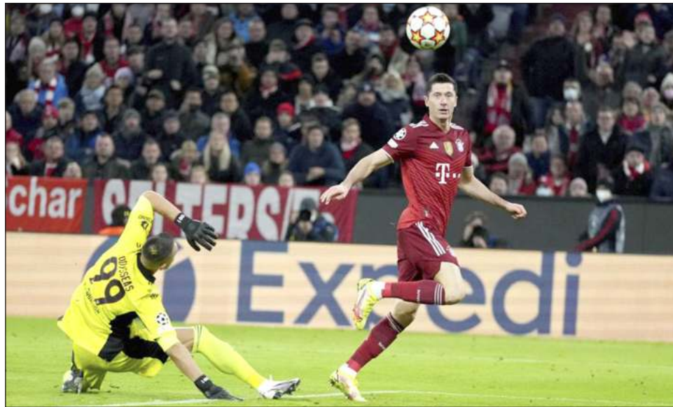
▲ Robert Lewandowski anota el cuarto gol del Bayern Múnich en el choque de ayer con el Benfica por la Liga de Campeones.

En otro encuentro, Cristiano Ronaldo acudió de nuevo al rescate del Manchester United con dos goles, en el empate 2-2 ante el local Atalanta. Los "Red Devils" siguen en el primer sitio del Grupo F, empatados con Villarreal, que se impuso 2-0 a Young Boys. La escuadra de Bérnago marcha dos unidades atrás.