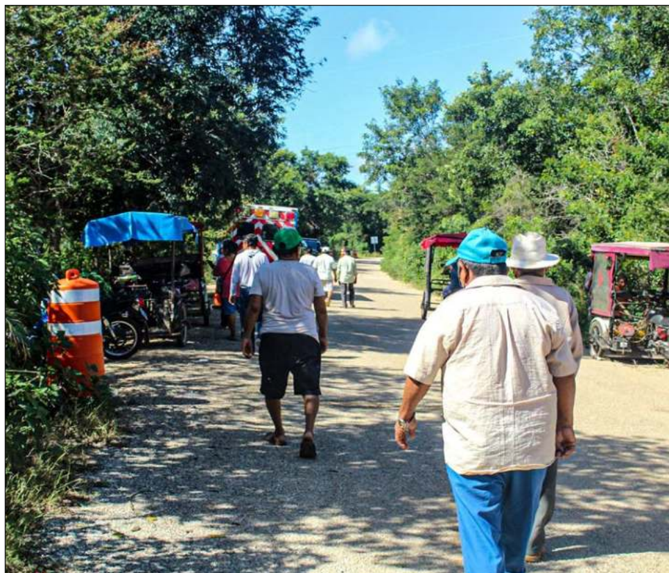
▲ Los sábados son días en que muchos ejidatarios de Maxcanú laboran en Mérida, por lo que es probable que la asamblea no tenga el quórum para ser legal.

Esto, apuntó, es una consecuencia de las acciones de la Procuraduría Agraria “amañada”, ya que le hicieron de conocimiento que esas asambleas suelen realizarse en domingo para po-