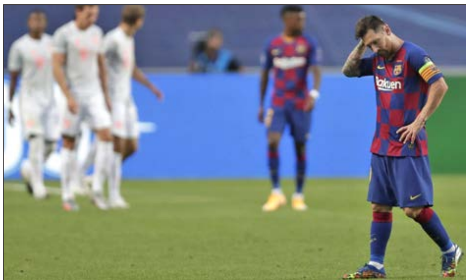
▲ El padre de Messi ve complicado que el astro continúe en el Barcelona.

Otros presentes en la reunión fueron Javier Bordas,