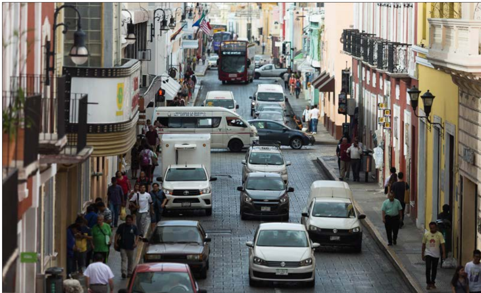
▲ El proceso de reemplazamiento se pospuso, considerando que la pandemia de COVID-19 durará lo que resta de 2020 y parte de 2021.

Para iniciar el trámite en línea, se invita a la población a visitar la página de electrónica reemplazamiento.yucatan.gob.mx.