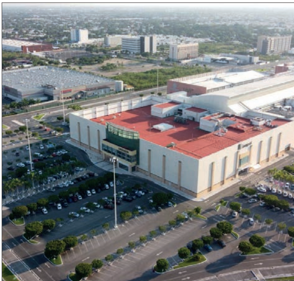
▲ La reapertura de negocios contribuirá a crear una sinergia comercial que encarrilará la economía, asegura el dirigente de la Canirac.

"Este momento traerá a la industria, y en especial a los restauranteros, una inyección de ánimo y energía para recuperar lo perdido en estos tiempos de parálisis económica", añadió y advirtió que la Canirac se mantendrá en pie de lucha por los restauranteros del estado.