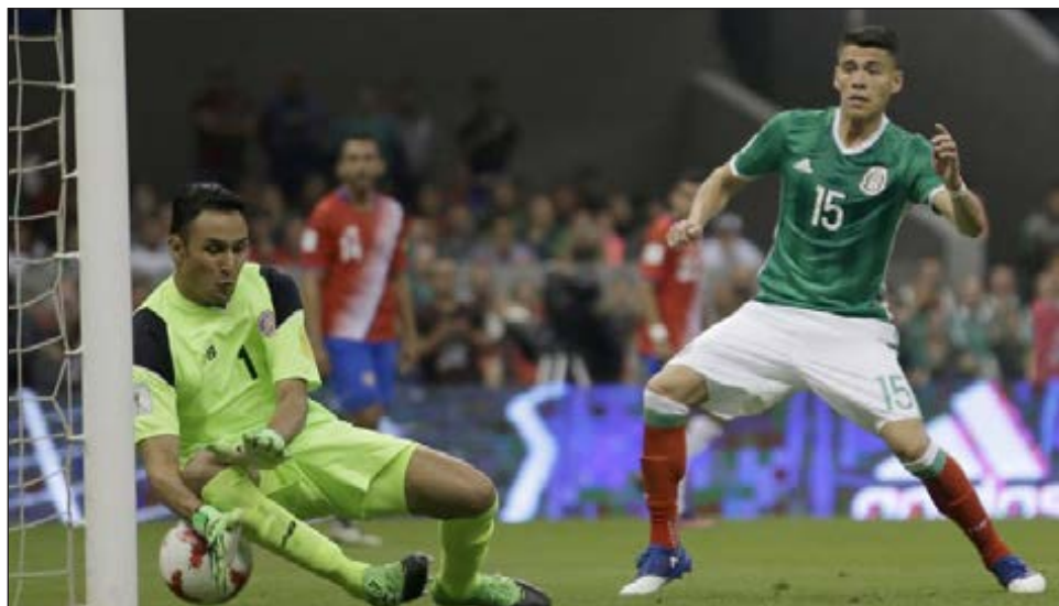
▲ El Tricolor podría enfrentar a Estados Unidos en un duelo de vida o muerte antes de la final en la próxima Copa de Oro.

Pero quizá el cambio más importante es el formato en las rondas definitivas a partir de los cuartos de final, en el que se darán cruces entre ambos lados de la llave, cuando en el pasado eso no ocurría. Ello abriría la puerta a un duelo entre México y Estados Unidos, las dos potencias de la confederación, antes de la final. En las últimas ediciones del certamen, México y Estados Unidos quedaban automáticamente en lados opuestos de la llave.