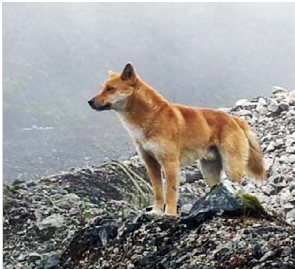
▲ Muchos investigadores temían que el perro salvaje se hubiera extinguido, por la pérdida de hábitat y la mezcla con otras razas caninas exóticas.

Los perros fueron descritos por primera vez después de que se halló un espécimen a una altitud de