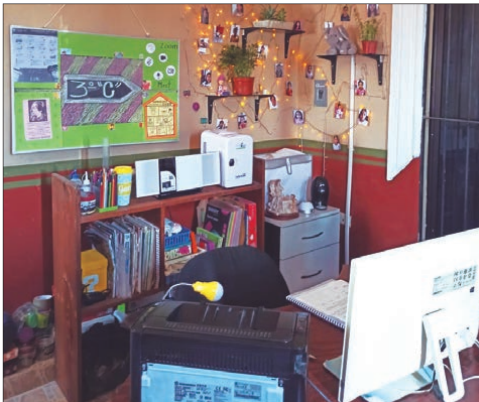
▲ Con el tiempo, la figura del docente se ha modificado por el uso de tecnologías.