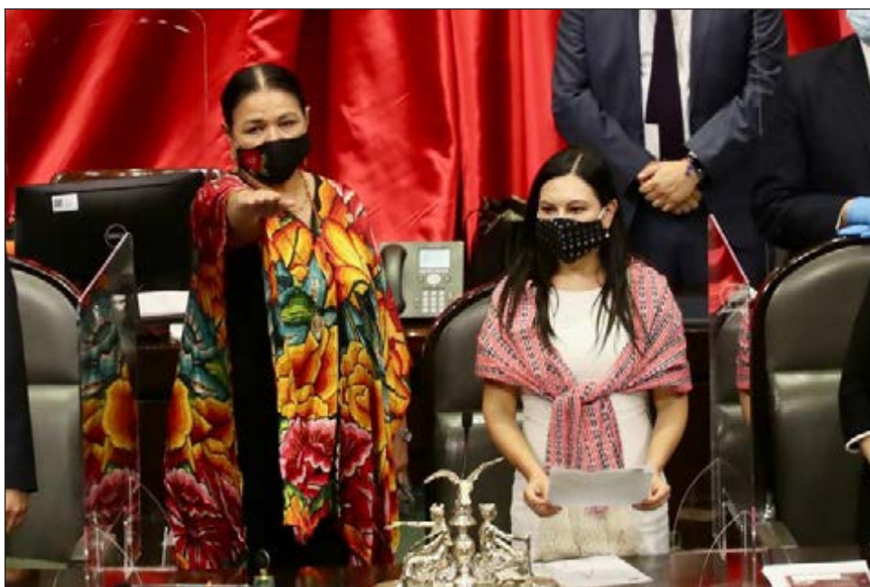
▲ La diputada Dulce María Sauri obtuvo 313 votos a favor, 21 abstenciones y 123 en contra para presidir la Mesa Directiva de la Cámara de diputados.