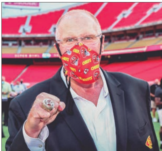
▲ Andy Reid, entrenador de los Jefes, con su anillo.

Por ahora todo es felicidad y confianza en Kansas City, que tiene récord de 77-35 con Reid, sólo superado por los Patriotas desde 2013. Les entregaron sus anillos a