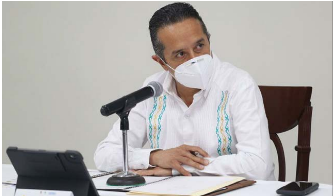
▲ Carlos Joaquín adelantó que en breve habrá buenas noticias para el sur del estado en materia comercial.

En la búsqueda de estas fórmulas de financiamiento, el gobernador de Quintana Roo recordó que hace algunos días se reunió con el secretario de Hacienda Arturo Herrera Gutiérrez para gestionar recursos, bolsas económicas que se puedan