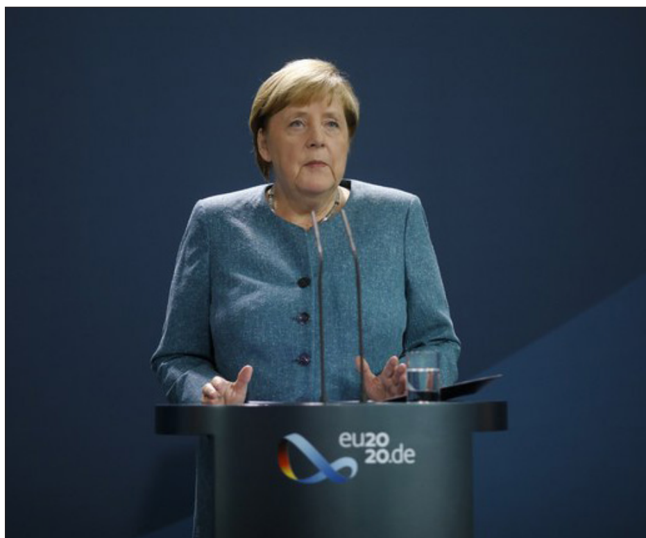
▲ La canciller alemana, Angela Merkel, pidió el miércoles a Rusia que dé respuestas sobre el envenenamiento del opositor ruso Alexéi Navalny, después de que Berlín anunciara que tiene pruebas de que el

político fue envenenado con el potente neurotóxico Novichok. "Esto plantea cuestiones muy serias que solo Rusia puede y debe responder", declaró Merkel.