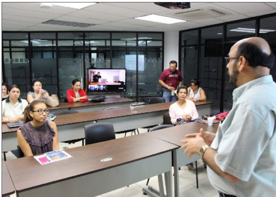
▲ Profesores de instituciones como la UV y Ecosur participarán en el Doctorado en Economía Pública y Desarrollo Local, elevando la vinculación con otros posgrados de calidad.

El doctorado recibirá profesionales con estudios