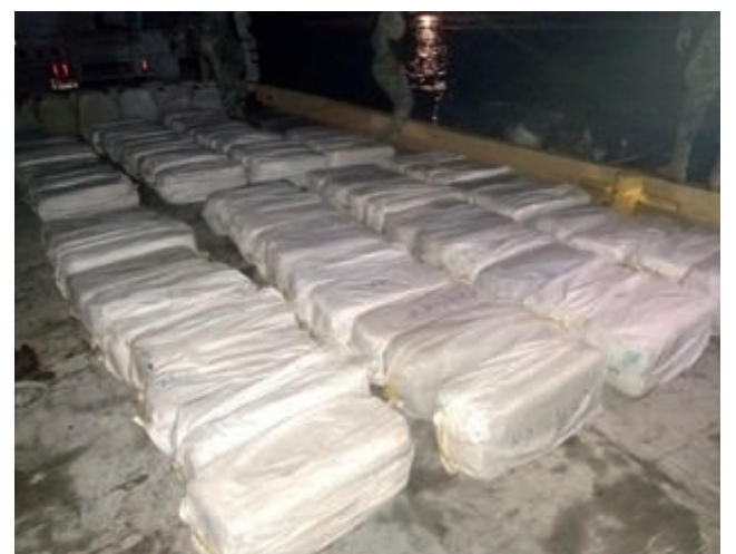
▲ Elementos de la Marina descendieron en rappel hasta la nave infractora asegurando 74 bultos de presunta cocaína.