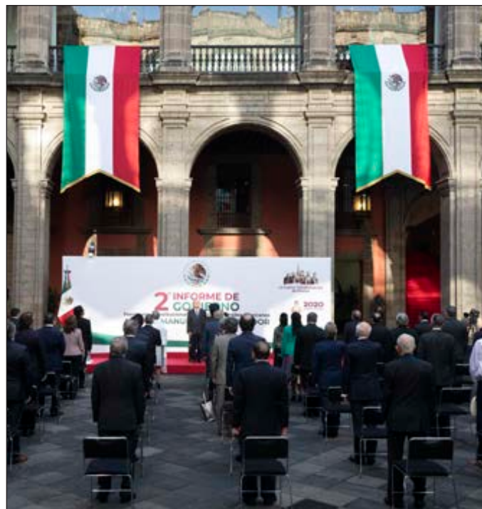
▲ Resultó preocupante la devaluación de los dos principales actores en el Informe Presidencial: la investidura del jefe del Ejecutivo y el Congreso de la Unión.

El informe solía ser una de las principales ceremonias de la política mexicana. No sólo era un día de asueto; de fijo, las clases comenzaban el 2 de septiembre, por lo que para muchos era el fin de las vacaciones. Por unos años también, después