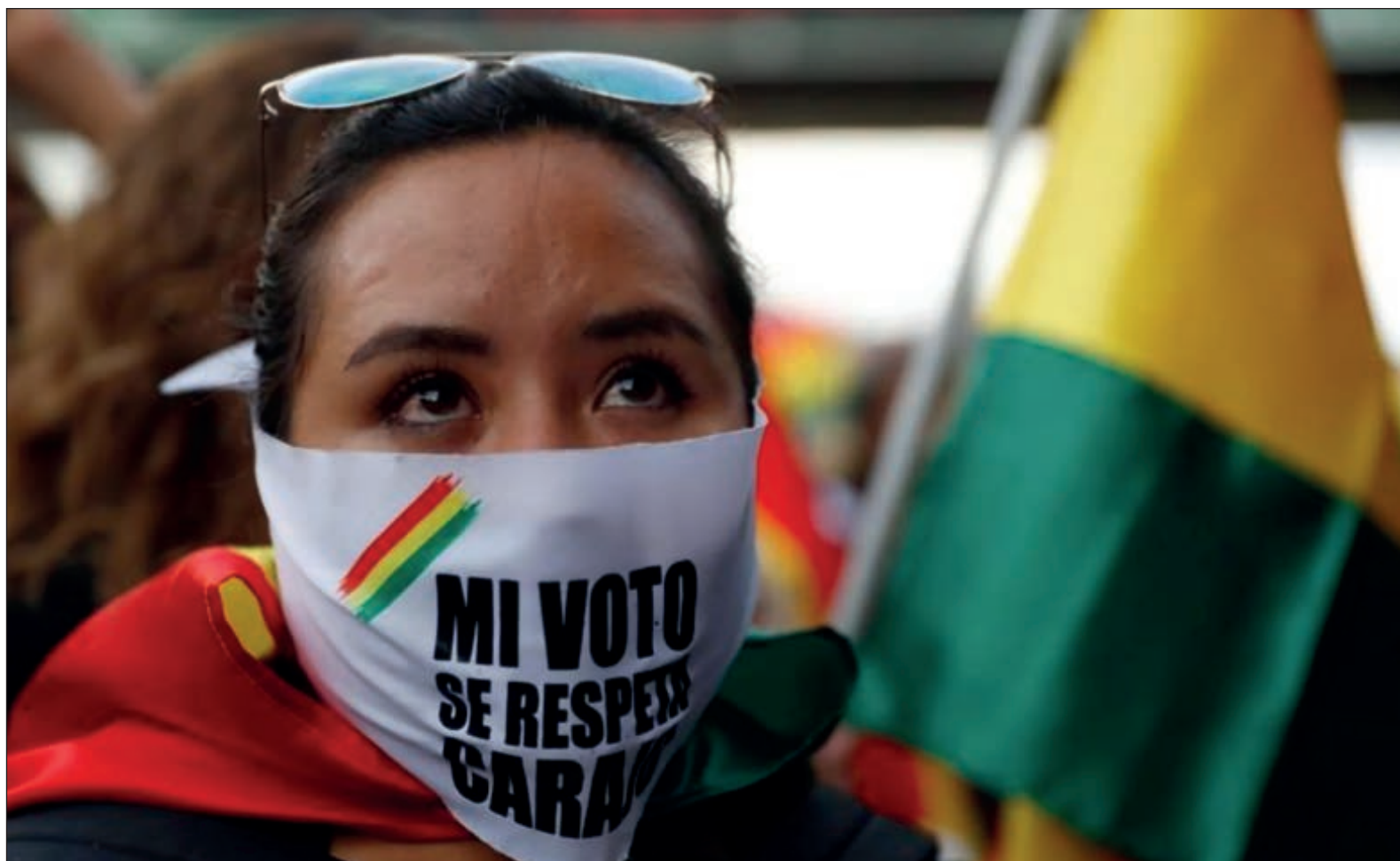
▲ El gobierno de facto, encabezado por Jeanine Añez, pretende mantener la dictadura impuesta tras el golpe contra Evo Morales, postergando por tercera vez las elecciones bolivianas a través de una ley que las reprograma para el 18 de octubre, originalmente estipuladas para el 2 de agosto y luego para el 6 de septiembre.