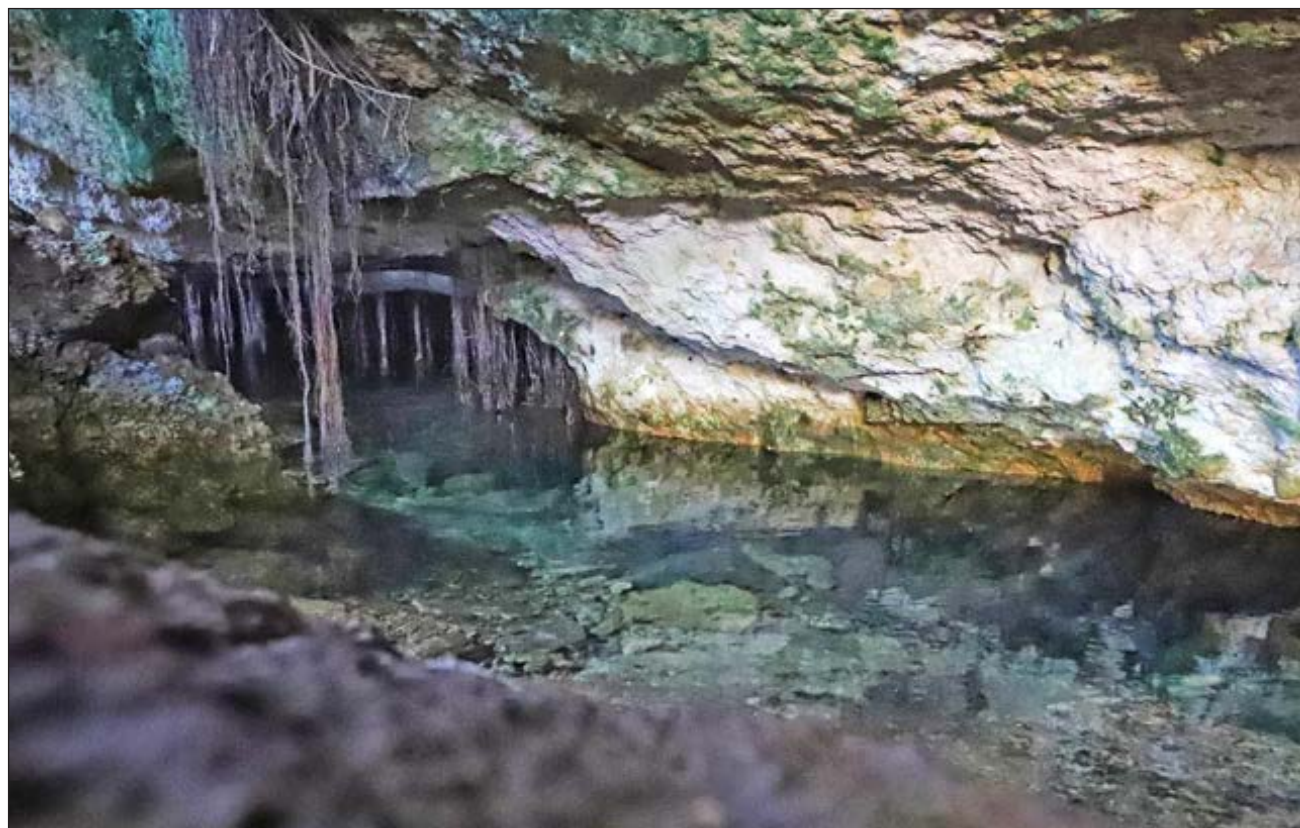
▲ La Sema instruyó a las constructoras crear un plan de manejo de residuos para evitar la contaminación de cenotes.

Al mismo tiempo “iniciamos un proceso para identificación de proyectos de energías renovables, en la zona norte hay un proyecto eólico importante, dos fotovoltaicos que buscan cómo avanzar y un tercero en Cozumel”. Este fomento a la generación de energías renovables, dijo, es una preocupación del gobierno es-