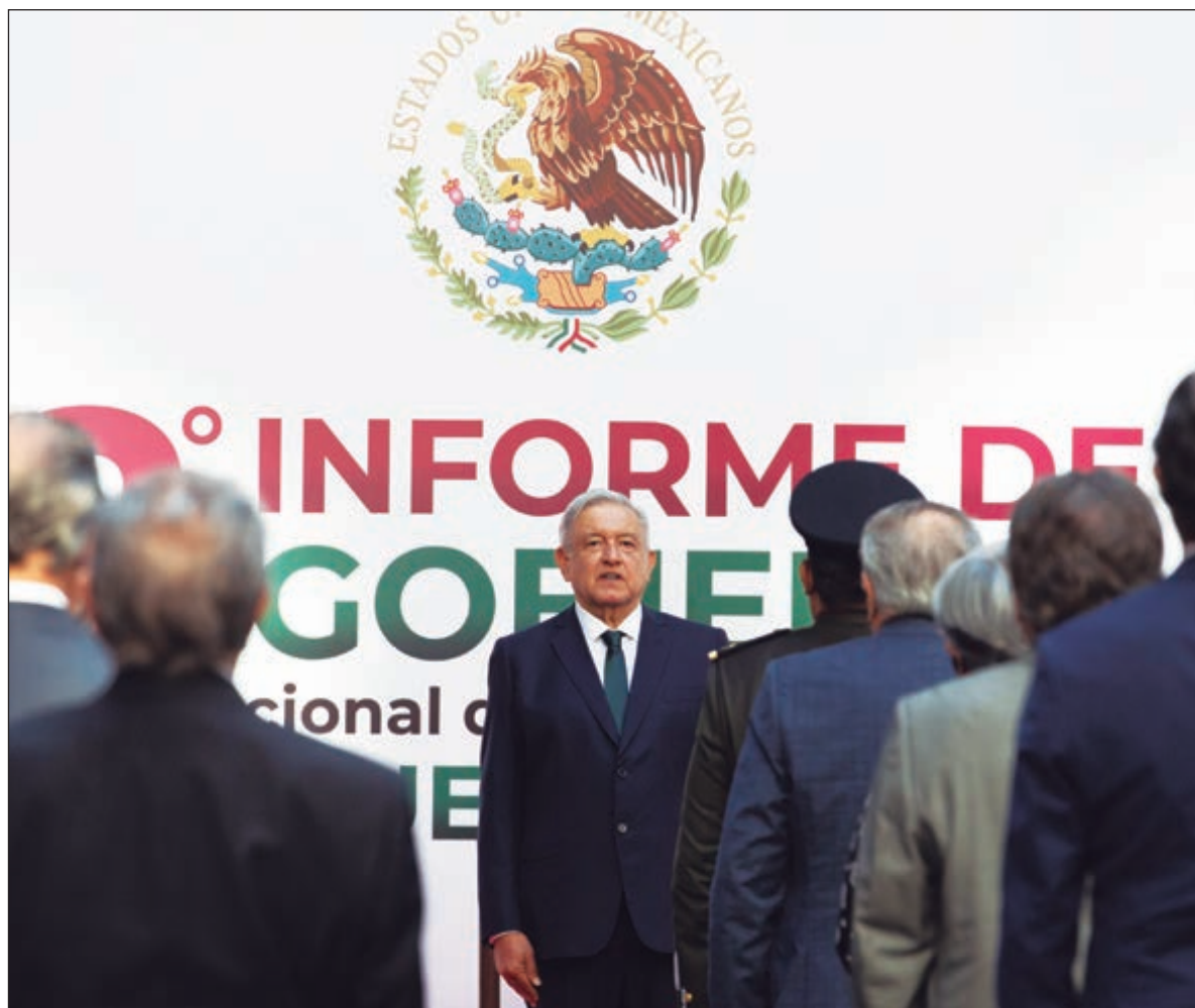
▲ Según una encuesta encargada por el diario español El País , AMLO llegó a su segundo informe con un 65.7 por ciento de aprobación.

LA FALLIDA OPOSICIÓN olvida que tuvo el poder y el gobierno durante muchos años y dejó el país en ruinas, una yaga abierta que donde se le toque sale pus. Le