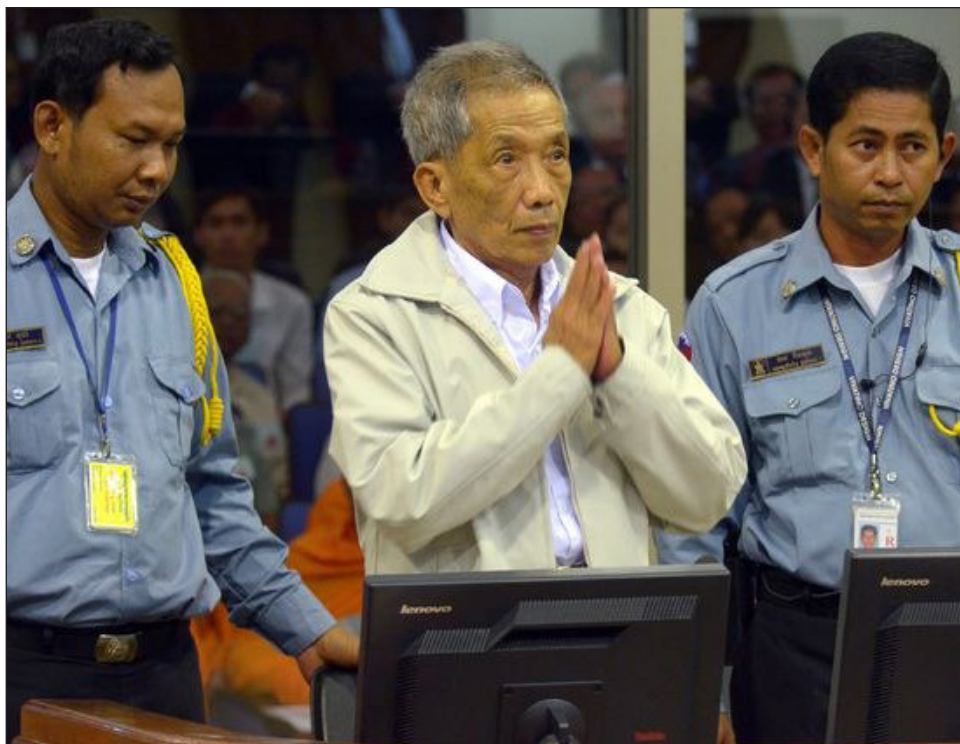
▲ Kaing Guek Eav dirigió Tuol Sleng, conocida como S-21, la prisión central de Phnom Penh, donde 15 mil personas fueron torturadas y luego ejecutadas por los jemerres rojos.

Kaing Guek Eav fue el primer jemer rojo en ser condenado por un tribunal por crímenes de guerra y crímenes contra la humanidad.