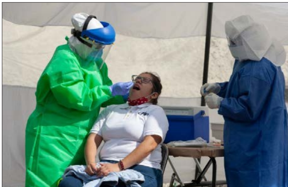
▲ En el continente americano dos terceras partes del personal de salud contagiado con COVID-19 es femenino, asegura Carissa Etienne, directora de la Organización Panamericana de la Salud. Foto Pablo Ramos

“Nuestros datos muestran que casi 570 mil trabajadores de la salud en toda nuestra región han enfermado y más de dos mil 500 han sucumbido al virus. Según estos datos, hasta la fecha tenemos el mayor número de trabajadores de la salud infectados en el mundo”, señaló Carissa Etienne, directora de la Organización Panamericana de la Salud. Foto Pablo Ramos