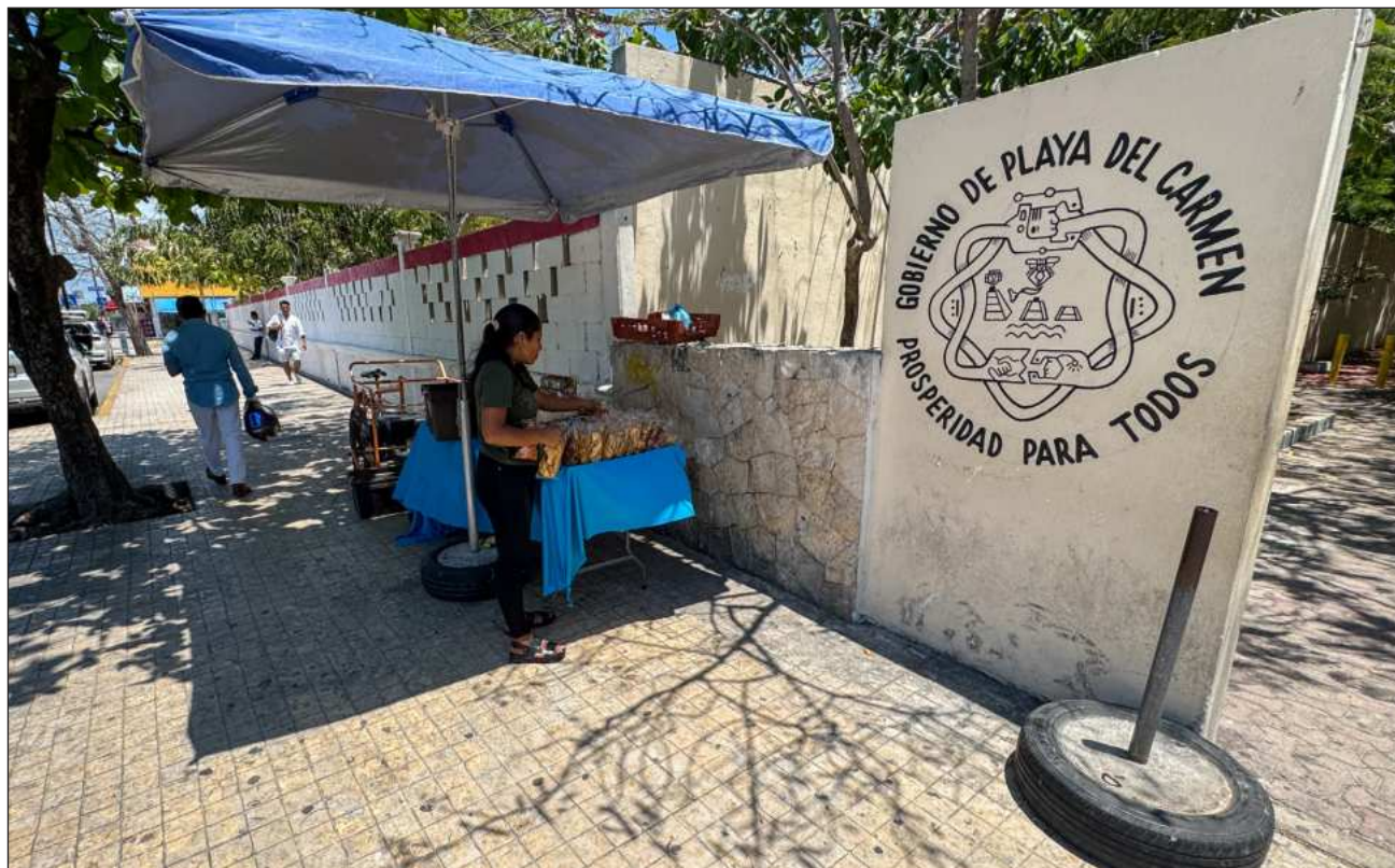
▲ En las ciudades de 250 mil a 500 mil habitantes, Playa del Carmen está en quinto lugar.

Dicho ICU evalúa la capacidad de 72 zonas metropolitanas del país para generar, atraer y retener talento e inversión y pone