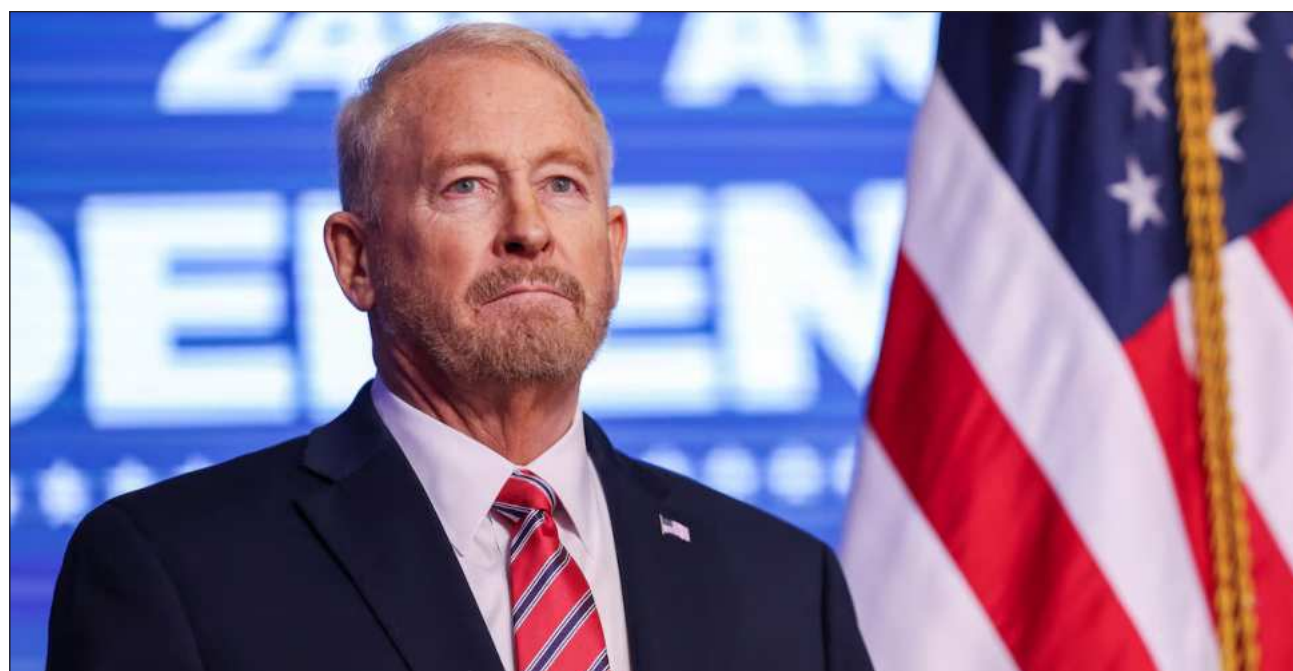
▲ “Los asuntos de México le corresponden a los mexicanos”, dijo la Presidenta, y reiteró su convocatoria “al pueblo a participar en asambleas informativas sobre la transformación y defensa de la soberanía”.

Enfatizó que ninguno de los embajadores de México ya sea en Estados Unidos, en Australia o en cualquier otro país no opinan sobre los problemas internos de los países donde