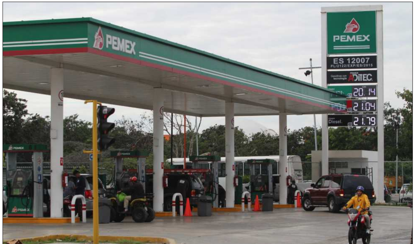
▲ Volatilidad del diesel, vital para el transporte de carga, persiste pese a los beneficios fiscales.

De manera general, opinó, el panorama económico en