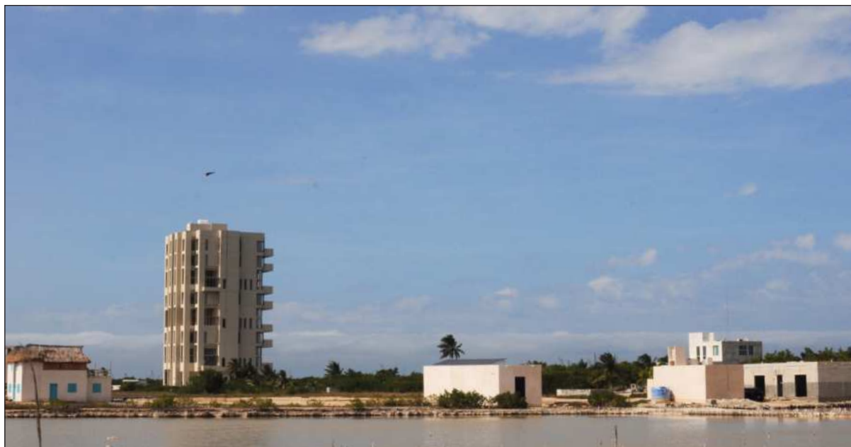
▲ “Quienes tienen el privilegio de usufructuar predios costeros tendrán que entender que no hay soluciones mágicas”.