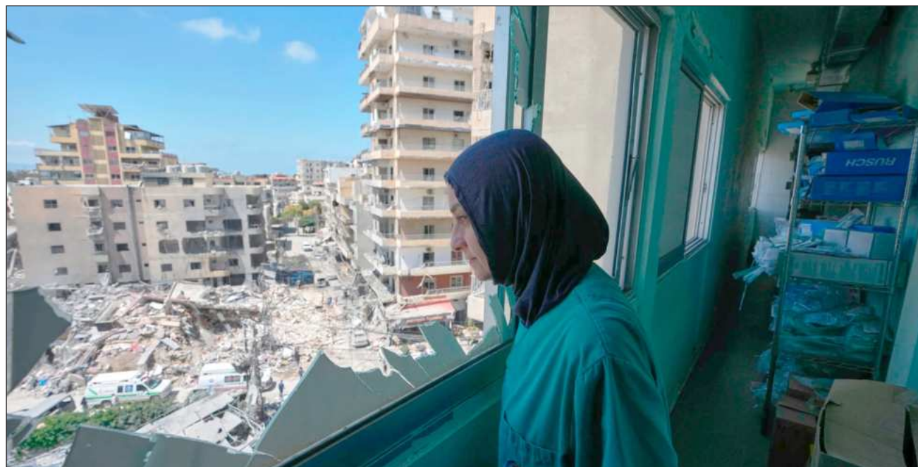
▲ Hezbollah, que cuenta con el respaldo de Irán, lanzó decenas de proyectiles y drones hacia soldados israelíes.

Hezbollah, que cuenta con el respaldo de Irán, lanzó decenas de proyectiles y drones hacia soldados israelíes en el sur de Líbano y hacia ciudades y pueblos israelíes en los últimos días, mientras