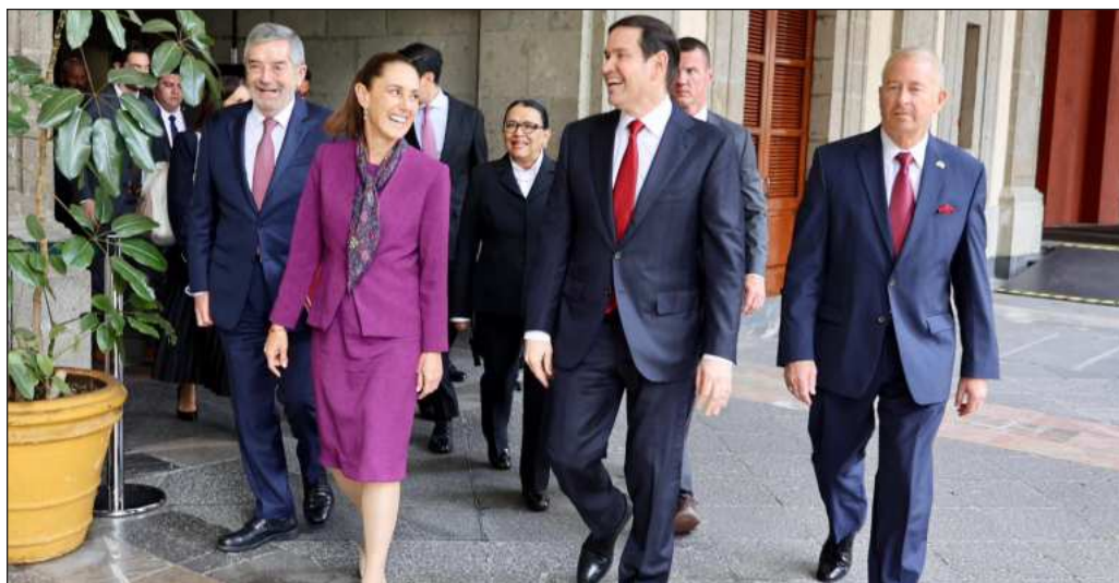
▲ El movimiento magisterial ha mostrado habilidad para buscar aliados llamando a otros grupos inconformes, como los padres de los 43 estudiantes de la Normal de Ayotzinapa o los transportistas.

México se encuentra actualmente en un momento histórico en el cual puede erigirse en dique ante el avance de la ultraderecha en el mundo, si puede evitar caer también en la tentación del otro extremo; para lo que se requiere de inteligencia y habilidad, algo que Claudia Sheinbaum ha sabido aplicar en el escenario internacional, particularmente en la interlocución con Donald Trump. Sin embargo, señalamientos como los del secretario de Estado estadounidense, Marco Rubio, advirtiendo por el uso que los cárteles hacen de drones y que esto podría poner en riesgo los intereses de su país, no dejan de llamar la atención porque precisamente los ataques “misteriosos” también han dado pie a acciones militares de Estados Unidos en otras partes del mundo, como Cuba. La tarea para la diplomacia mexicana también está ahí, para ejercerse con precisión.