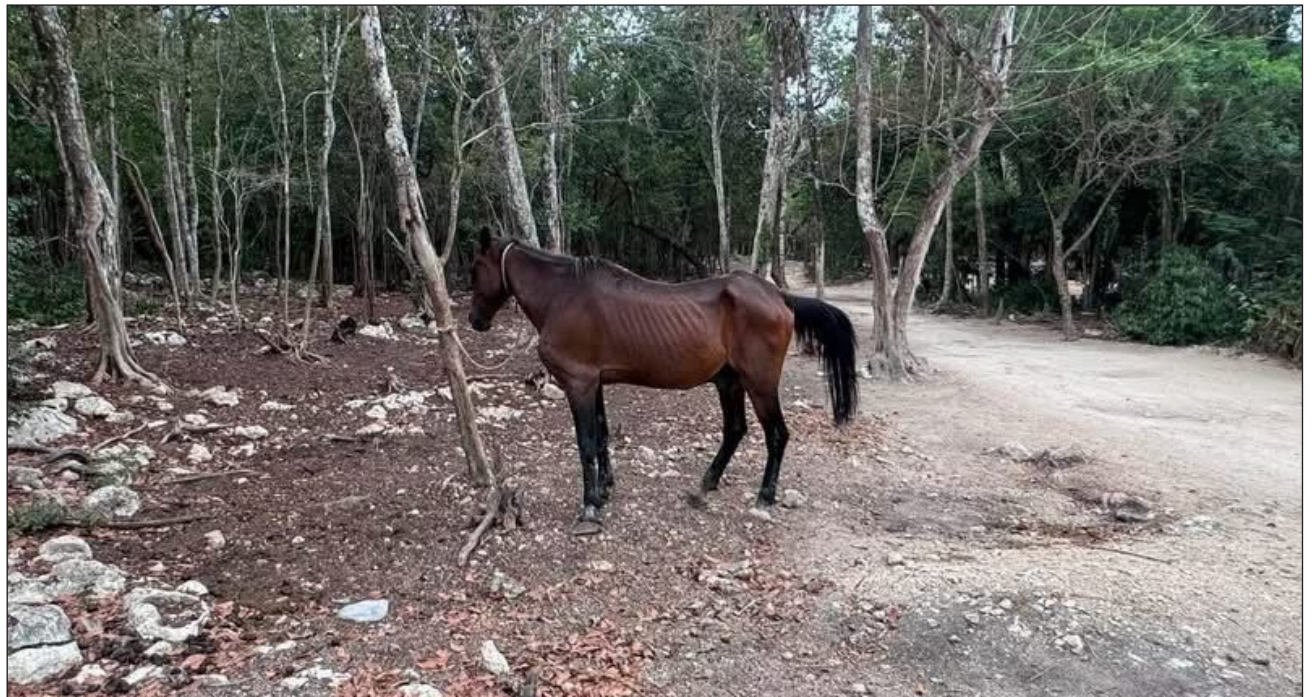
▲ Durante la diligencia en el parque Adrenaline Tours, las autoridades constataron que los caballos permanecían en condiciones inadecuadas, sin acceso suficiente a agua y alimento, además de presentar diversos problemas de salud.

La intervención se llevó a cabo luego de la difusión de una denuncia anónima que alertaba sobre crueldad animal