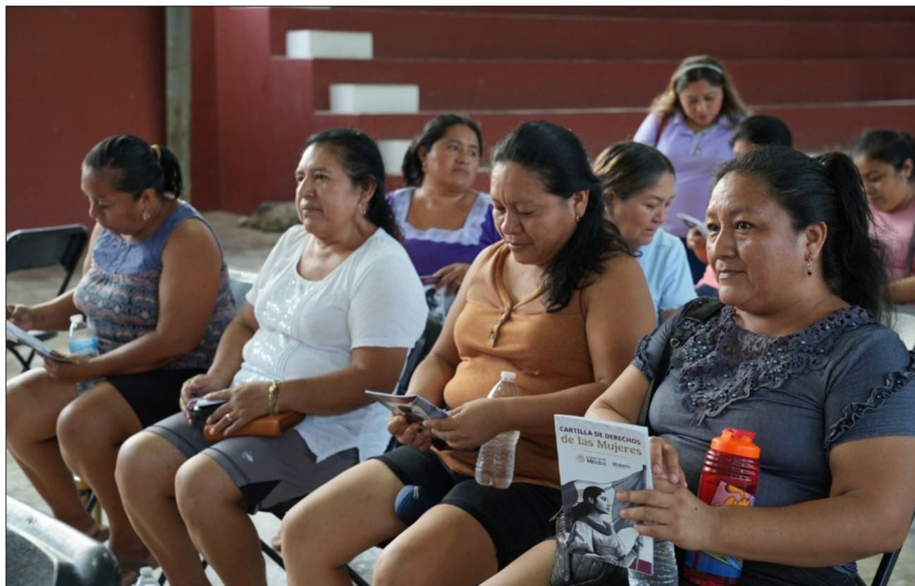
▲ Los 35 millones 147 mil 901 pesos facilitarán el desempeño de los 32 Centros Libre que actualmente operan en 29 municipios de Yucatán y que ofrecen asesoría jurídica y apoyo sicoemocional a las yucatecas.

Estos recursos facilitarán el desempeño de los 32 Centros Libre que actualmente operan en 29 municipios de