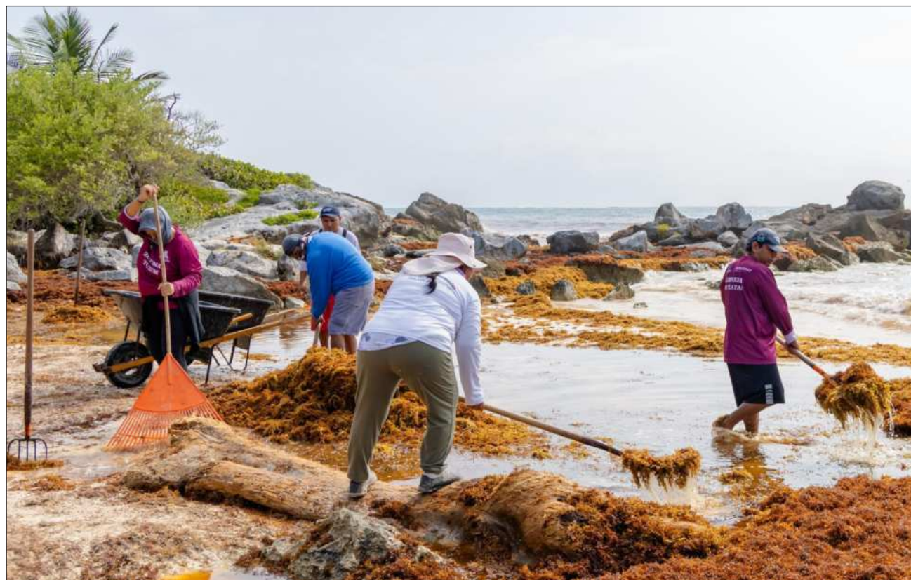
▲ El periodo en el que se desarrollará la justa mundialista coincide con una temporada tradicionalmente baja para destinos como Tulum, que actualmente enfrenta desafíos como el recale masivo de sargazo.

Al ser cuestionado sobre la posibilidad de establecer controles de precios en la hotelería o sobre un eventual beneficio para las plataformas de renta vacacional como Airbnb, el dirigente hotelero señaló que en el Caribe Mexicano no existe una política de