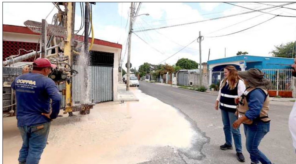
▲ La presidenta municipal escuchó reportes sobre inundaciones, afectaciones a vialidades y acumulación de agua, e instruyó reforzar las labores de desazolve de pozos existentes y la reparación de baches en puntos con mayores daños.

La presidenta municipal destacó que actualmente se construyen 120 nuevos pozos de absorción en diferentes sectores de Mérida con mayores problemas de acumulación de agua, además de continuar con labores de