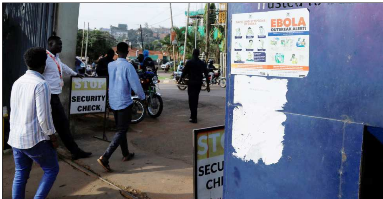
▲ Al 31 de mayo, la OMS registró 116 casos sospechosos del virus en la RDC, frente a 906 reportados la semana pasada.

El Ministerio de Transporte informó que las autoridades habían evaluado cómo se estaba vigilando el brote