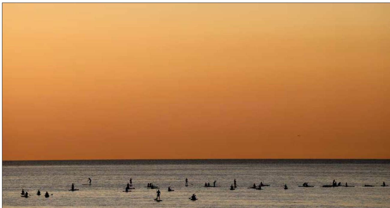
▲ Las probabilidades de que el episodio de El Niño se mantenga al menos hasta noviembre rondan 90 por ciento.

En su última actualización, la OMM prevé un "episodio al menos moderado, e incluso fuerte" de este fenómeno climático de consecuencias planetarias.