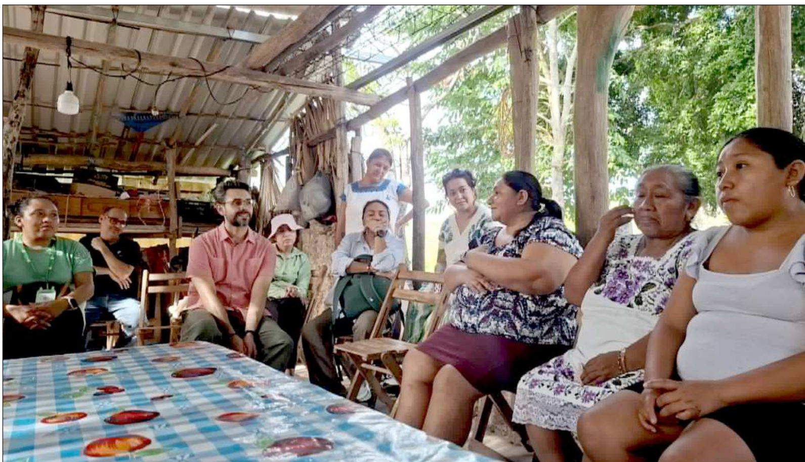
▲ "Un encuentro de más de 150 ahorradores (...) demostró que las personas con discapacidad encuentran en estas cajas un vehículo real de autonomía".

El evento propició que instituciones clave del desarrollo rural, como Handmade to Market, Heifer México, Educampo, Fundación León XIII, Fundación Ko'ox Taani, la Unidad de Proyectos Sociales de la UADY, Trickle Up, Fundación Haciendas del Mundo Maya y ProMazahua, compartieran metodologías para seguir fortaleciendo la autonomía económica de los pueblos indígenas y campesinos de la región.