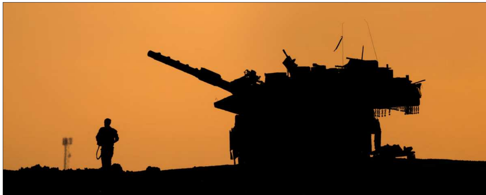
▲ "EU ha suministrado a Israel más de 115 mil 600 toneladas de equipo militar a través de cientos de vuelos y decenas de embarcaciones".

Por su parte, Trump considera a Netanyahu su aliado más fiel en la región y se espera que, como Big Brother, le brinde todo su apoyo durante la campaña, como lo hizo con estridencia en Honduras con el candidato de la derecha y actual presidente, Tito Asfura.