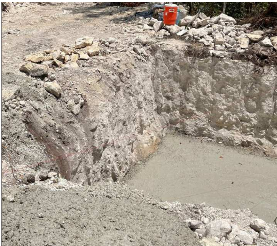
▲ Autoridades acordaron impulsar acciones de compensación ambiental.

La vecina señaló que el proceso de diálogo fue fundamental para encontrar alternativas que permitan conciliar las necesidades de infraestructura y conectividad con la protección del entorno urbano y ambiental que caracteriza a este desarrollo residencial.