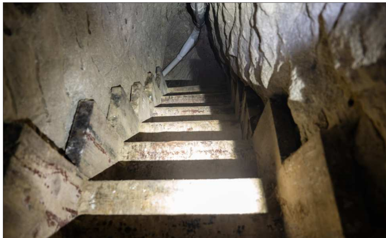
▲ Desde 1993 se han hallado 99 pasajes subterráneos en el Distrito Sur de California. De ellos, 28 se consideraron complejos.

"Esta investigación y la incautación representan un duro golpe para el Cártel