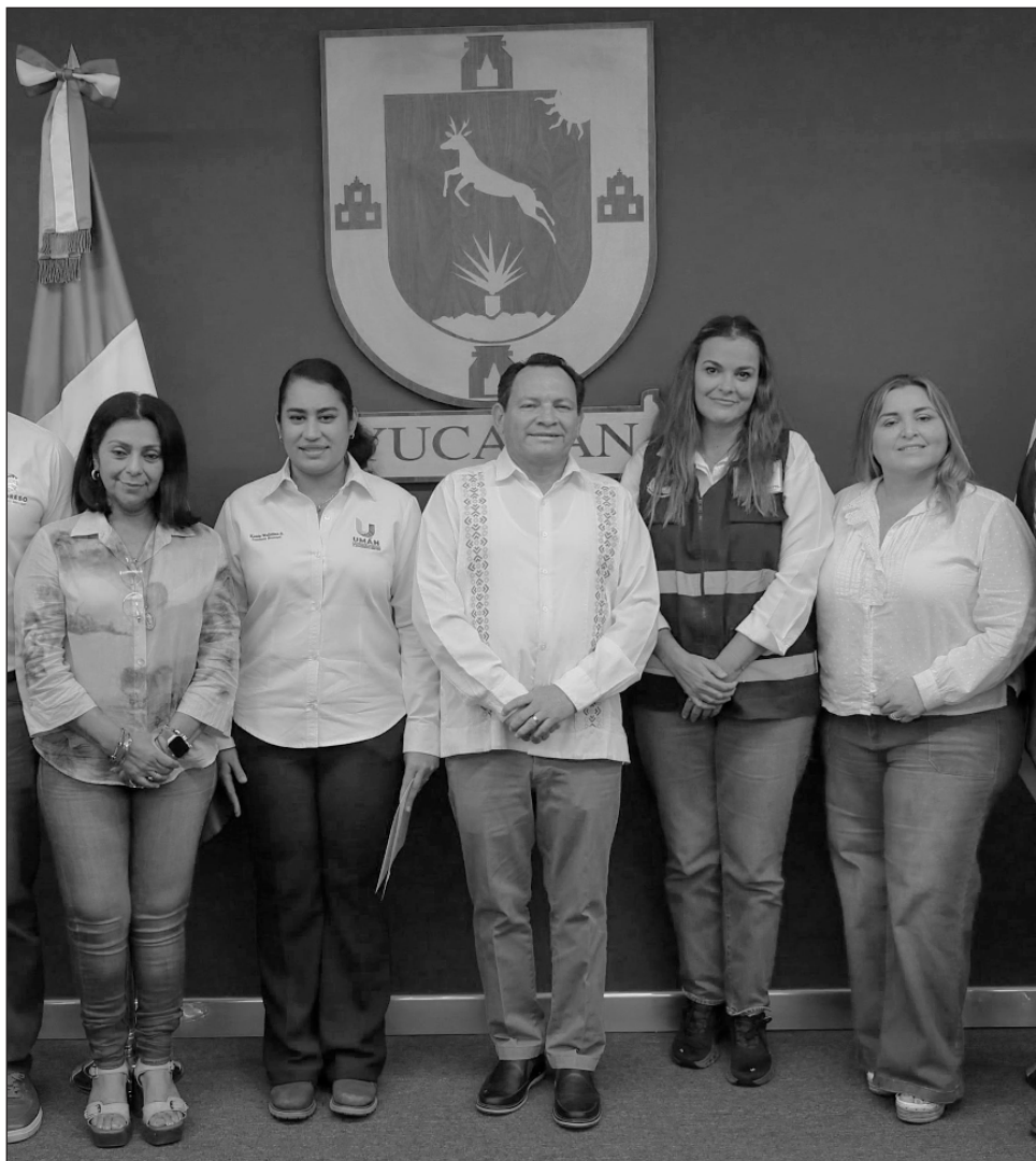
▲ Durante la sesión en el C5i, el mandatario estatal aseguró que se reforzaron las acciones para prevenir riesgos derivados de inundaciones y encharcamientos.

El mandatario estatal informó que, a través del Instituto de Infraestructura Carretera de Yucatán (INCAY), se atenderán las vías de comunicación una vez que disminuyan los encharcamientos, y reiteró que se mantendrá el trabajo de monitoreo y atención de daños.