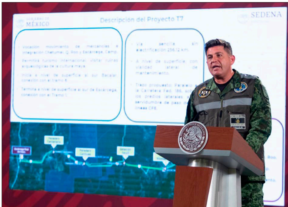
▲ El general Gustavo Vallejo indicó que el aeropuerto de Tulum potenciará los servicios turísticos y la vigilancia del espacio aéreo nacional.

Los trenes serán híbridos, por lo que operarán a diesel y electricidad; en 700 kilómetros (entre Mérida y Chetumal) será eléctrico. Este mismo lunes el presidente López Obrador visitó la planta de la empresa Alstom, en Hidalgo, donde se construyen vagones para el proyecto. La inversión del Tren Maya será de poco más de 36 mil millones de pesos, sin endeudamiento público.