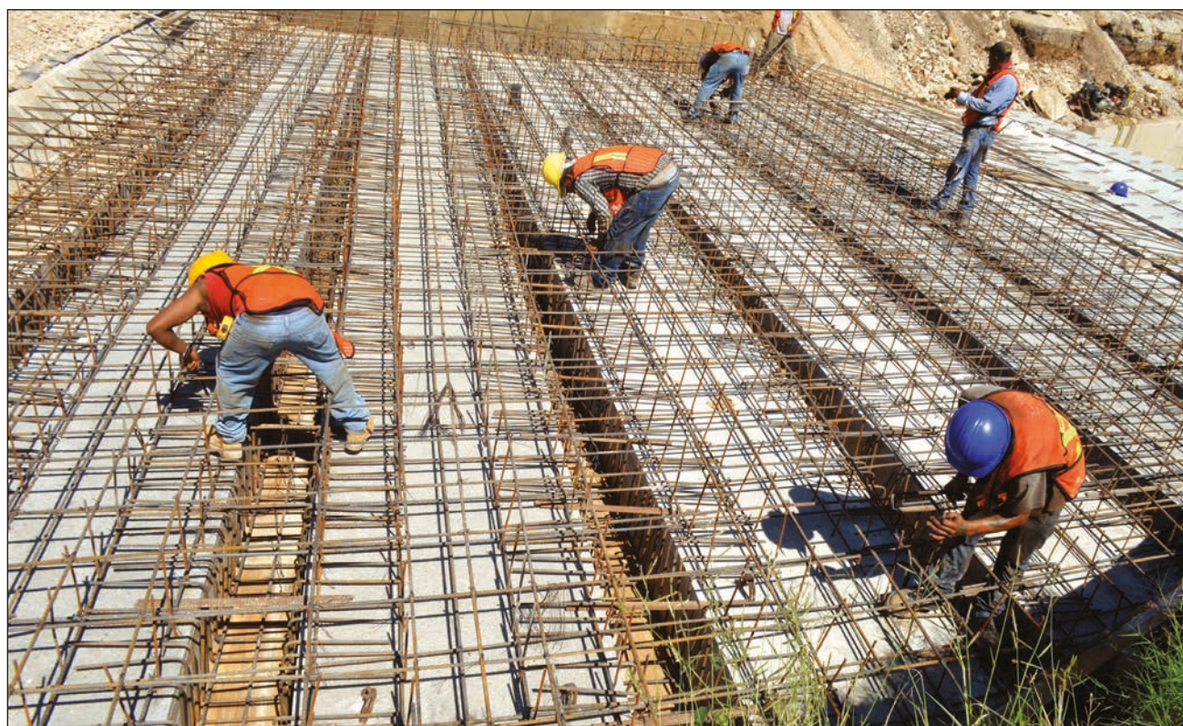
▲ Un maestro albañil, reveló Bernabé Chan Castañeda, puede ganar alrededor de 3 mil pesos; mientras un ayudante de albañil procura cerca de mil 200 a la semana. De los accidentes laborales no hay cifras oficiales.

7 mil albañiles agremiados en el organismo, pero en Yucatán hay más de 120 mil obreros pertenecientes a la industria de la construcción.