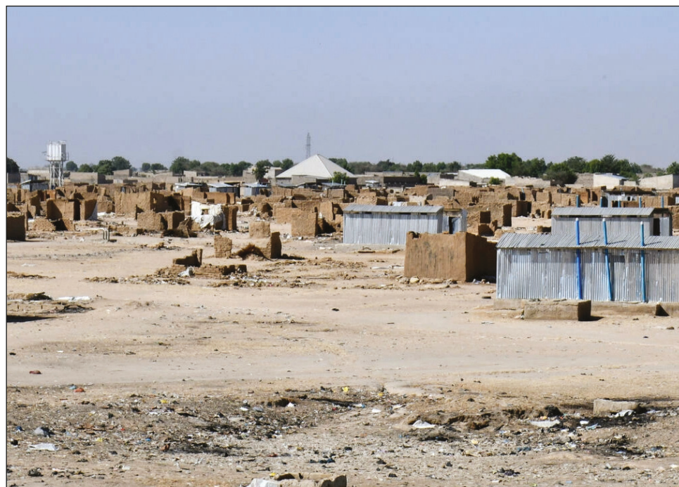
▲ La preocupación de varias ONGs humanitarias es que la vuelta a la aldea de Mallam Fatori en el estado de Borno, ocasione mayores daños y desplazamientos.

"Mataron a unas 45 personas y secuestraron a otras 22", dijo a AFP Malik Samuel del Instituto de Estudios de