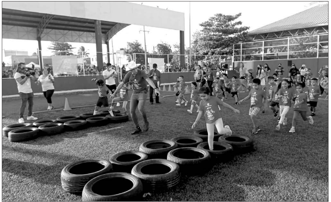
▲ La carrera consistió en un circuito de obstáculos que niños y niñas desde los tres hasta los 12 años debían sortear.

Destacó que se sienten muy orgullosos de organizar esta carrera, la cual es parte de las acciones de vinculación con la comunidad y enseñan a los niños el cuidado del agua y del medio ambiente; “buscamos