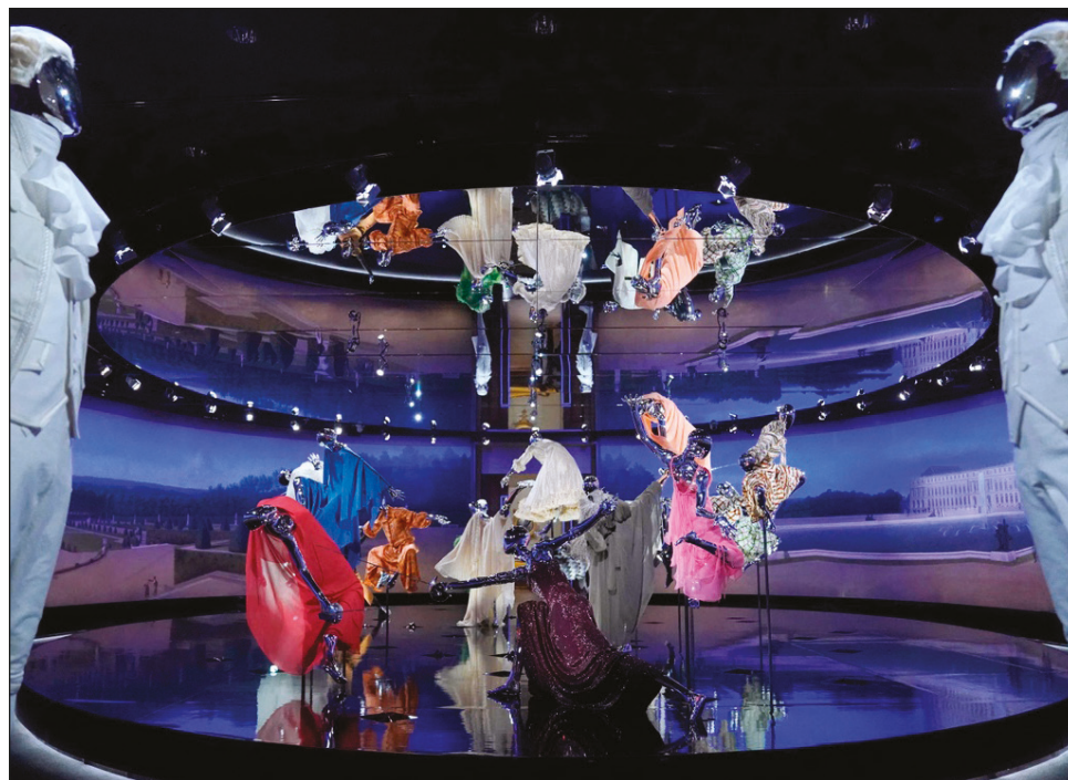
▲ La nueva antología en el Museo Metropolitano de Arte busca encontrar historias no contadas y héroes anónimos en la moda estadounidense temprana.

Se trata de la segunda parte de una exposición más amplia sobre moda estadounidense para conmemorar el 75to aniversario del Instituto del Vestuario. Ideada como de costumbre por el curador estrella Andrew Bolton, la nueva entrega es tanto una secuela como una precursora de In America: A Lexicon of Fashion (En Estados Unidos: Un léxico de la moda), que se inauguró en septiembre pasado y se enfoca más en diseñadores contemporáneos y