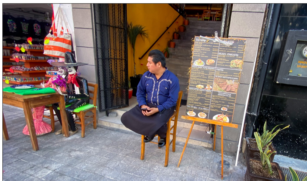
▲ Los egresados en 2022 han tenido dos años de educación en condiciones muy difíciles.