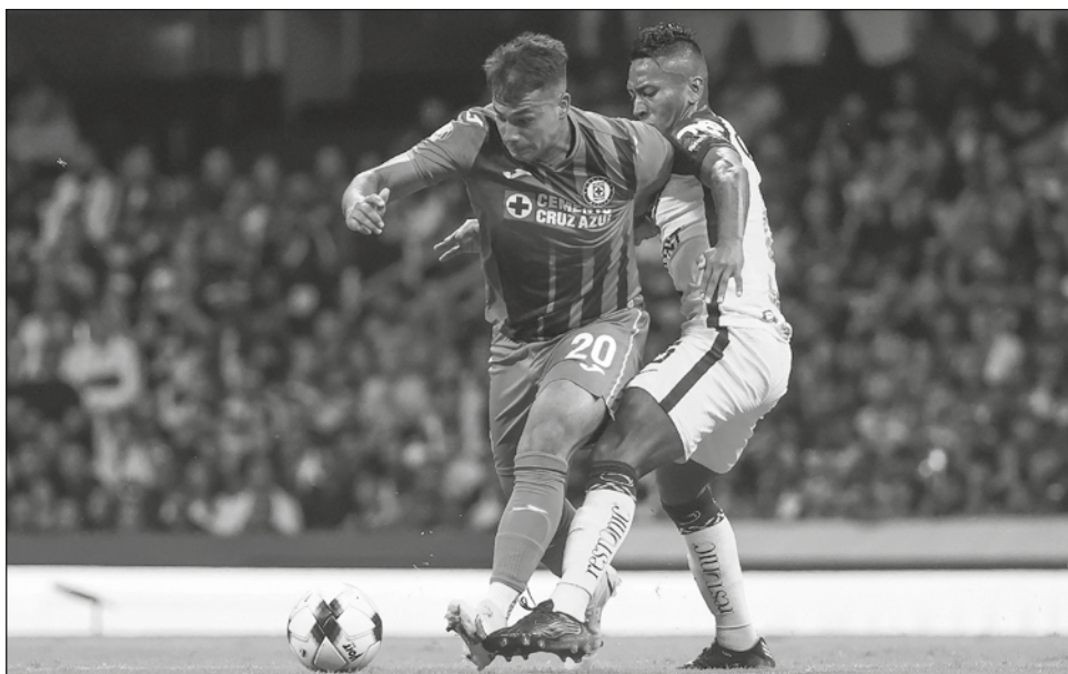
▲ La Máquina cerró con empate a cero ante el América y tendrá que jugar en el repechaje, frente a Necaxa, este sábado en el Estadio Azteca.