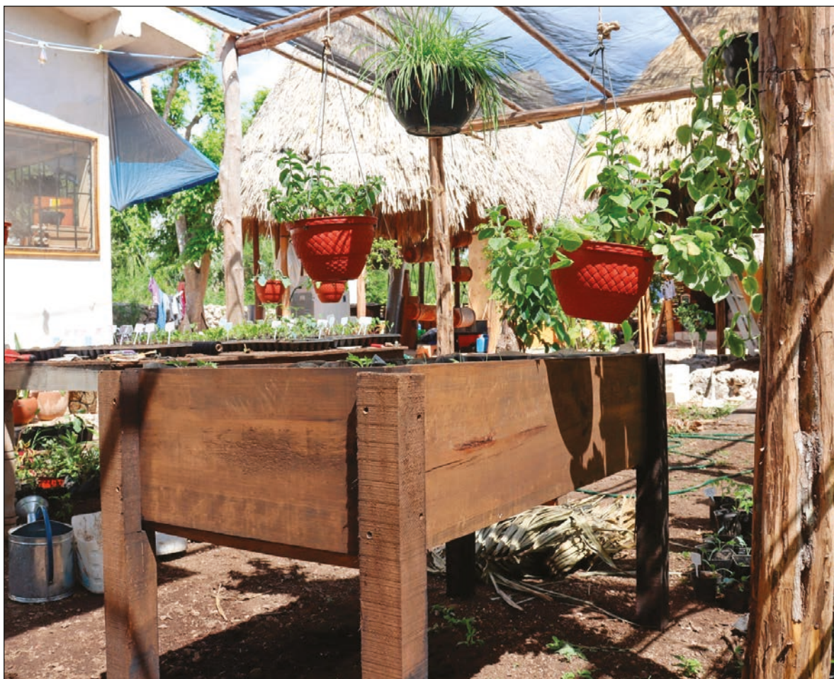
▲ "El territorio es algo más complejo, como nos indicó Valiana: tiene varios sentidos, uno es cuando hablamos de territorio en su sentido legal, que es el territorio comunal, ejidal; el otro aspecto tiene que ver más con nosotros, con la comunidad, con cómo lo sentimos".

Acercarse al proyecto de Suumil Móokt'aan permite cuestionarnos sobre nuestras elecciones de vida, posibilita pensar nuestra posición ante el territorio y preguntarnos ¿cómo elegimos vivir?, si como participes en la reproducción de una forma de vida establecida que mira todo desde la lógica del mercado o si podemos descentrarnos de esa vida y comenzar a defender y construir territorios de vida digna. Siganos en: http://orga.enesmerida.unam.mx/ ; https://www.facebook.com/ORGACovid19/ ; https://www.instagram.com/orgacovid19 y https://twitter.com/ORGACovid19/ .