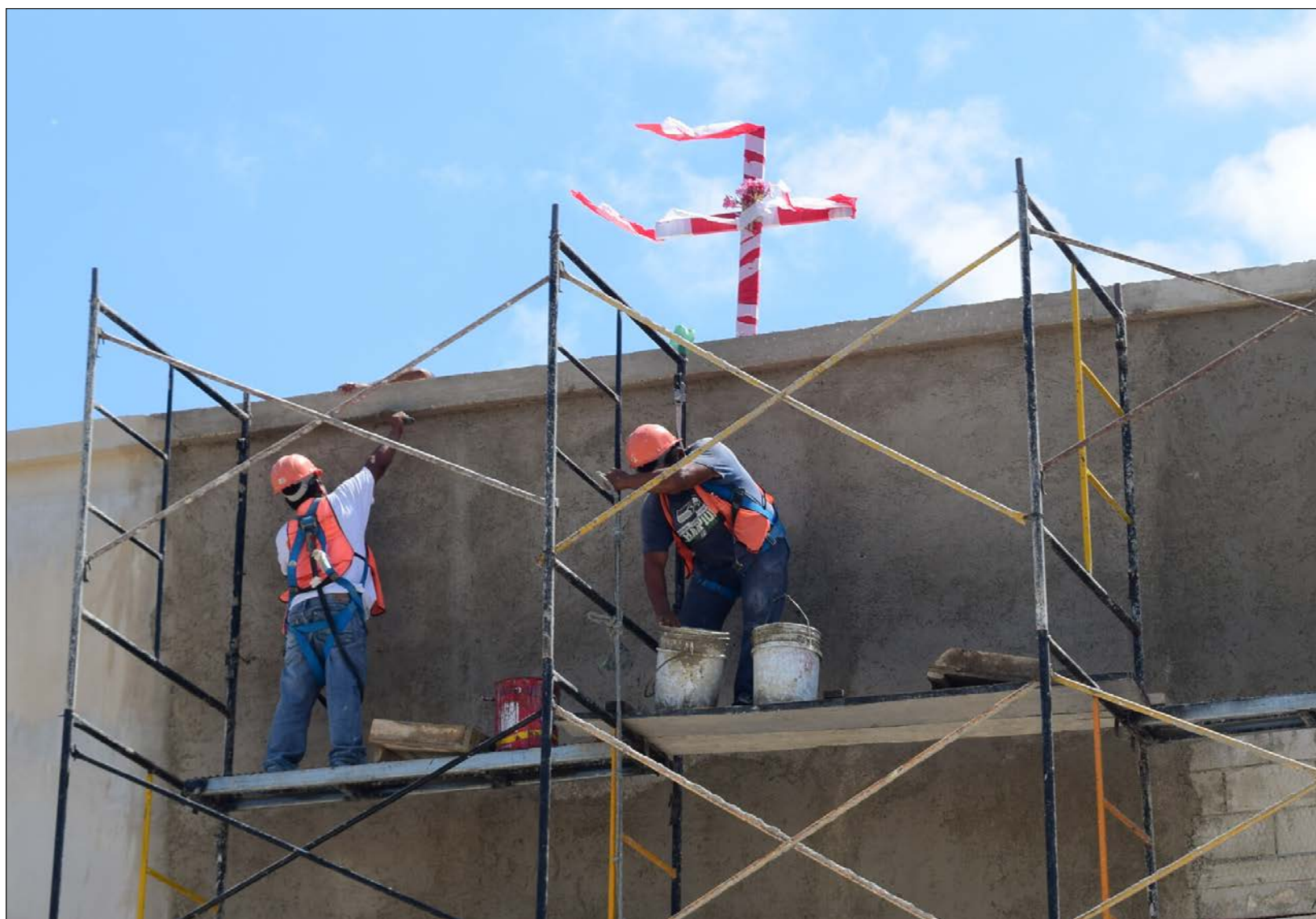
▲ Como parte de la ceremonia de la Santa Cruz, los alarifes hacen rezos en las obras, y los jefes ofrecen comida y bebidas.

“Ante esa situación difícil siempre fui positivo, siempre dije que vendrían tiempos mejores, pero ya con todos esos malos momentos atrás lo que vale y lo importante es cuidarse y respetar las indicaciones de las autoridades de salud”, reflexionó.