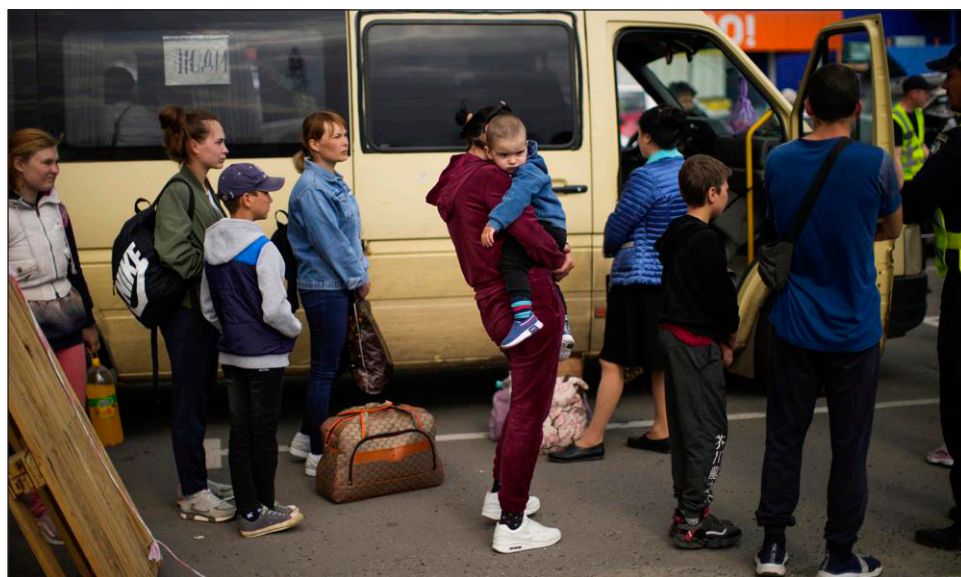
▲ Algunas de las personas desalojadas de la planta el domingo habrían sido trasladadas a una aldea controlada por separatistas respaldados por Moscú.

"Hoy, por primera vez en todos los días de la guerra, este corredor (humanitario) que se requería urgentemente ha co-