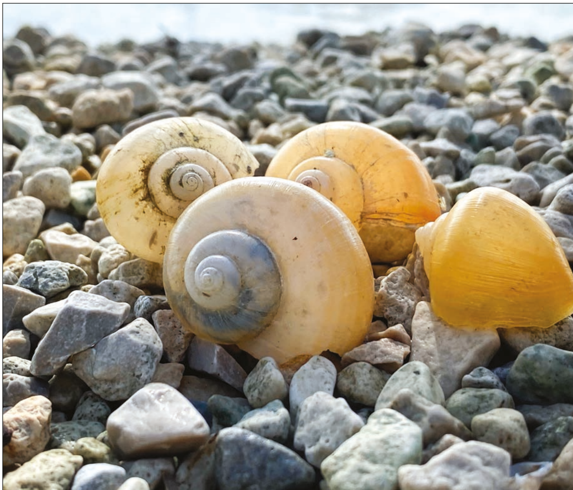
▲ “Caracolo se encontraba a la orilla del mar de Chelem, uno entre mil, en un millón quizá. Teje suspiro, hilvana penas y sus lágrimas, que se resbalan una a una por sus cachetes caracolinos”.

-Gaviotita, ¡pssss! -llamó quedito para no despertar a sus vecinos -¿Te puedo pedir un favor?