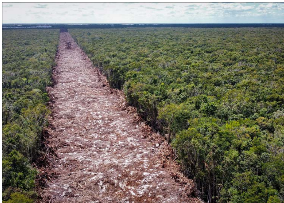
▲ En el tramo 5 Sur, entre Playa del Carmen y Tulum, la Semarnat estima que removerá 300 mil árboles, en su mayoría acahuales, y sembrará 143 millones.

Para los otros tramos (4, 5, 6 y 7) el día 22 de noviembre de 2021 hay un decreto para hacer permisos provisionales; “no quiere