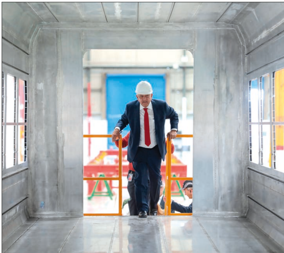
▲ En su cuenta de Twitter, el presidente Andrés Manuel López Obrador anunció la compra de 42 trenes con 210 vagones para el Tren Maya a la empresa Alstom, y recordó que hace 20 años realizó un contrato con

Bombardier, ahora asociada a Alstom, para comprar 45 trenes y 400 vagones del Metro de la Ciudad de México. También indicó que la construcción se realiza en Ciudad Sahagún.