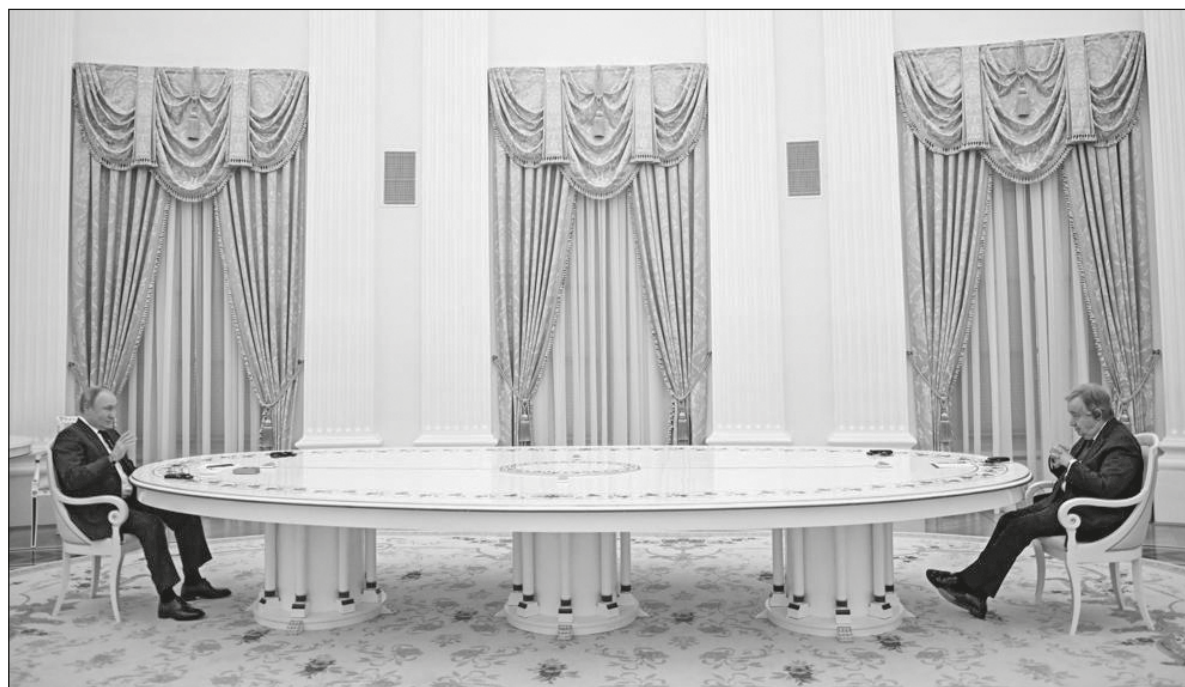
▲ "By visiting Moscow first, many conclude that United Nations Secretary-General, Antonio Guterres, played into Putin's hand, and gave the Russian disinformation system yet another tool to use".

"THIS IS NOT really a time for talking, it's a time for action. International law can't be a passive spectator. It can't be sedentary, it