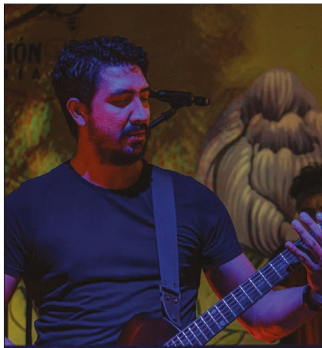
▲ En este primer show, SignalZ interpretó Deafening Silence , que aborda problemas de salud mental.