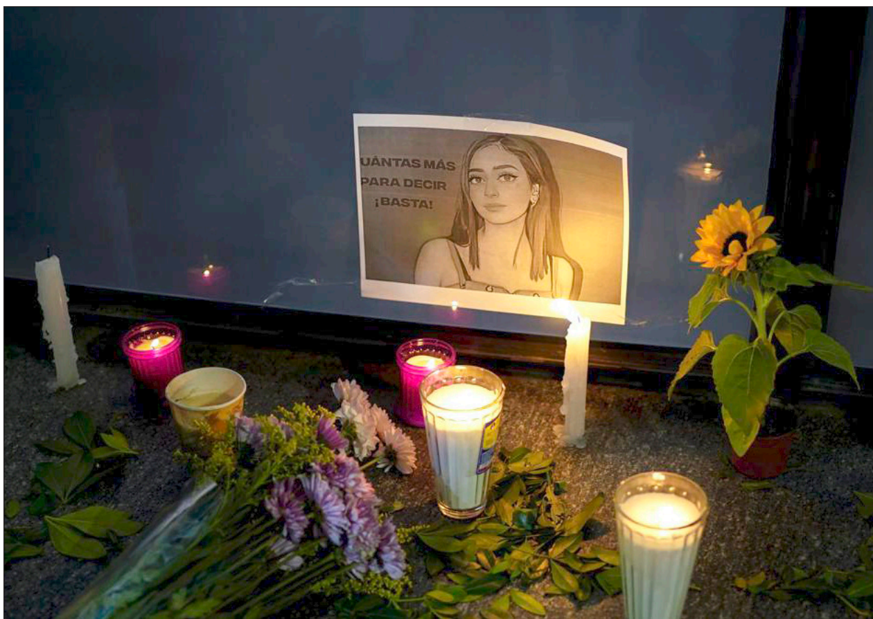
▲ Entre los interrogados por la Fiscalía Especializada en Feminicidios y Delitos contra las Mujeres de Nuevo León se encuentra el conductor del vehículo que llegó al Motel Nueva Castilla la noche que Debanhi Escobar fue vista con vida por última vez.