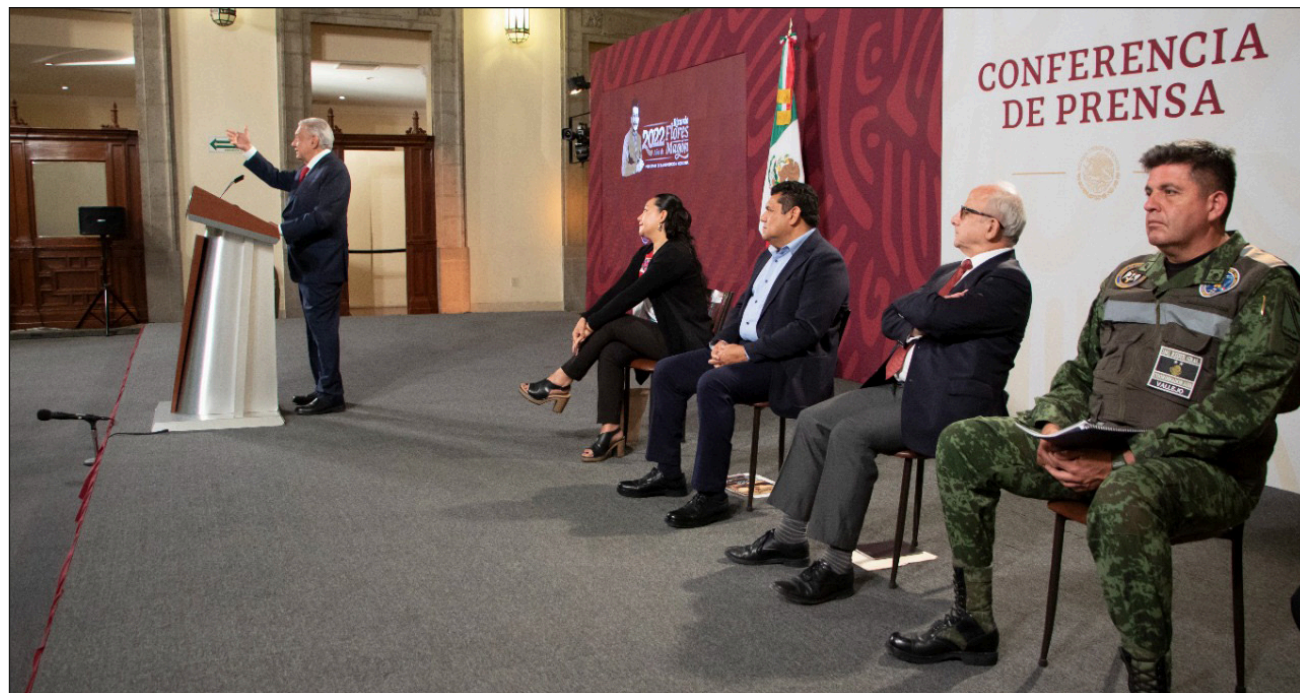
▲ Durante su conferencia diaria, el presidente López Obrador se refirió al proyecto Xibalbá, de Grupo Xcaret, indicando que la empresa está uniendo cenotes. La titular de la Semarnat, María Luisa Albores, amplió lo expresado por el titular del Ejecutivo, señalando que el corporativo “prefiere pedir perdón que pedir permiso”.

Además, expuso que por medio de la Comisión Nacio-