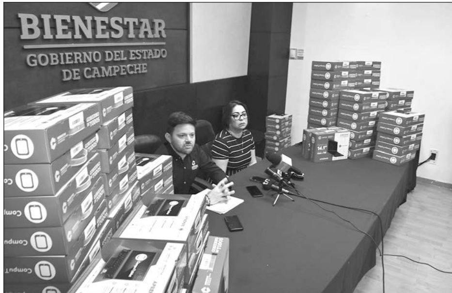
▲ Los equipos que no fueron mencionados en la primera entrega llegarán a estudiantes de excelencia académica del nivel medio superior, anunció la Sebien.

En la sala de juntas de la dependencia también colocaron parte de los 105 equipos restantes para que medios de comunicación revisaran, si así gustaban, las cajas selladas que contienen los equipos referi-