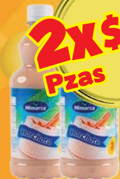
Concentrado arroz horchata MIMARCA de 500 ml