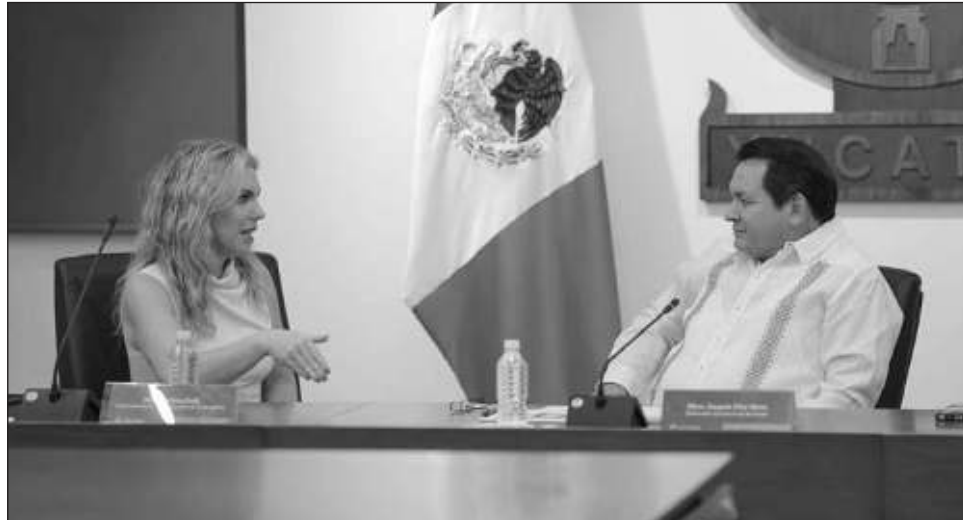
▲ El gobernador de Yucatán, Joaquín Díaz Mena, se reunió con Ninfa Salinas Sada, presidenta del Consejo de Fundación Azteca de Grupo Salinas, para fortalecer la colaboración en materia educativa y de emprendimiento.

En el marco de esta alianza, el gobierno del Renacimiento Maya y Grupo Salinas impulsan la instalación de tres nuevos