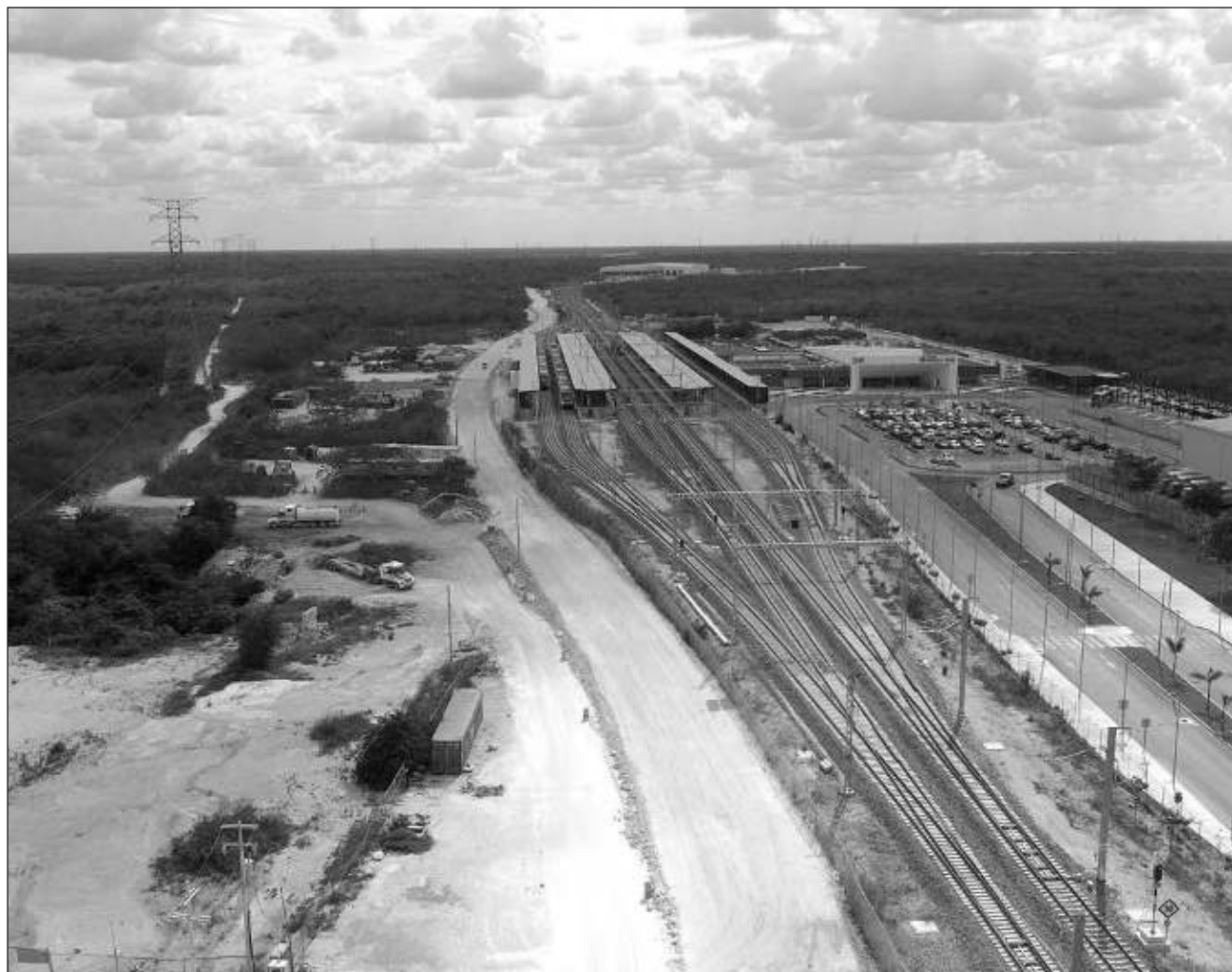
▲ El general Ricardo Vallejo señaló que esperan comenzar este año la construcción de la sección de carga en el Tren Maya.

En año y medio construirán cuatro terminales multimodales de carga,