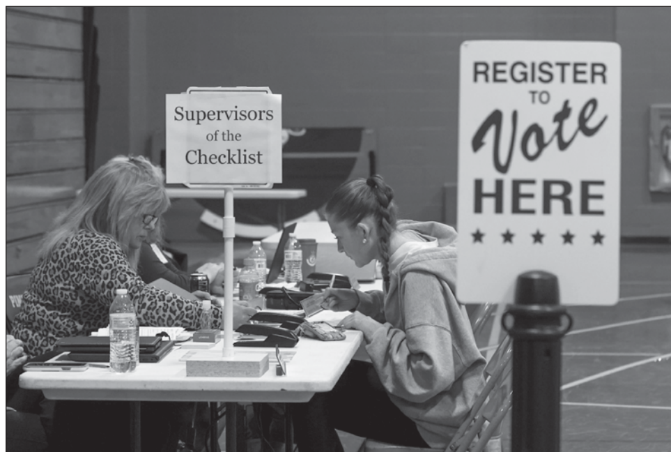
▲ Las elecciones fueron vistas como una medida temprana del sentimiento de los votantes mientras Trump trabaja con una velocidad sin precedentes para alterar el gobierno federal.

En la contienda principal por un puesto en la Corte Suprema de Wisconsin, el juez conservador respaldado por Trump, y apoyado por Musk y sus grupos con 21 millones de dólares, perdió por un margen significativo en un estado que Trump ganó en noviembre. Y aunque los republicanos de Florida mantuvieron dos de los distritos de la Cámara de Representantes que más apoyan a Trump en el país, ambos candidatos también tuvieron un desempeño inferior al margen de Trump en noviembre.