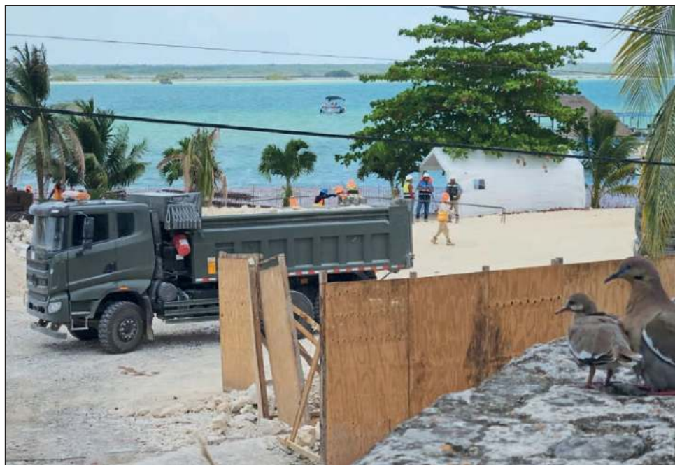
▲ En su petición ante las autoridades ambientales, la Defensa indicó que busca acondicionar un inmueble a su cargo, frente a la laguna, para hacerlo más sustentable.

La obra ha generado manifestaciones de rechazo de los habitantes de Bacalar,