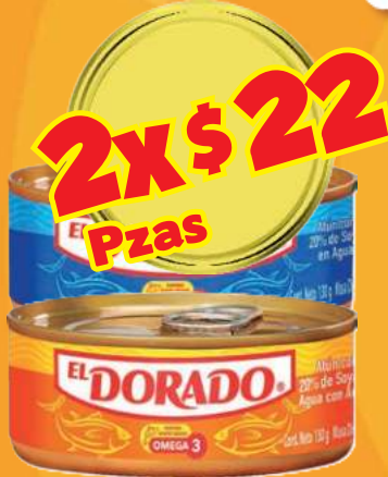
Atún en agua ó en aceite EL DORADO lata de 130 gr (Ármalo como quieras)