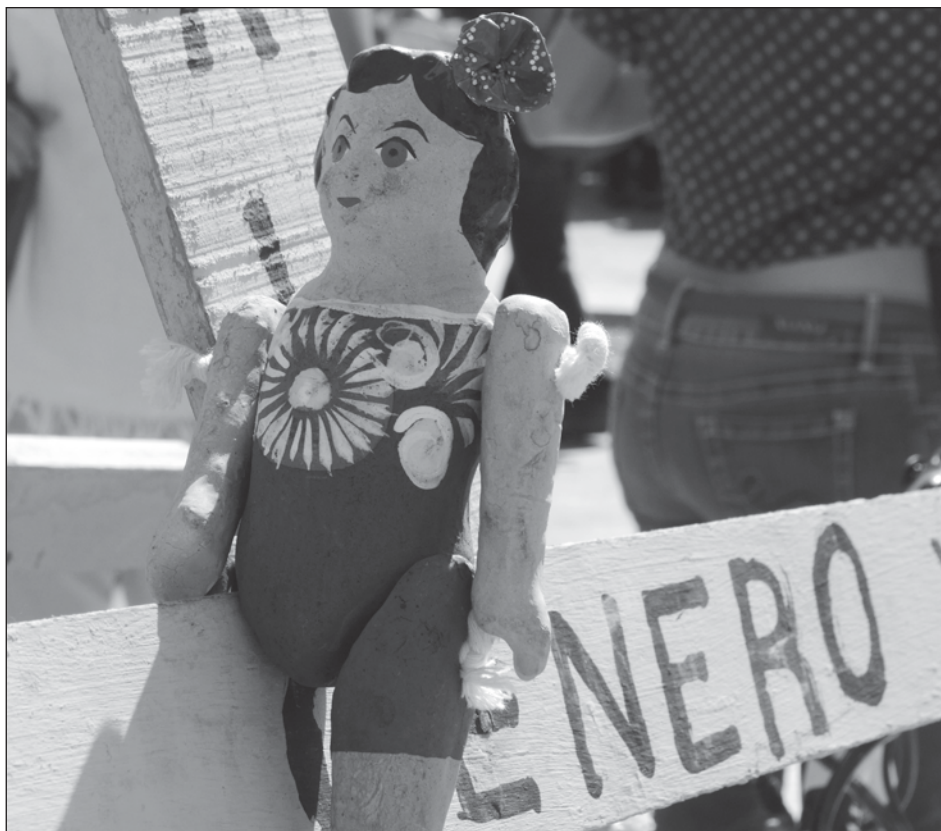
▲ El Congreso local aprobó una reforma al Código Penal para que la mujer o persona que auxilie a una mujer en el momento que sea víctima de violencia física, sexual, homicidio o feminicidio, pueda ejercer la legítima defensa "sin temor a ser castigada por sobrevivir".

En la sesión ordinaria celebrada el 1 de abril, se dio lectura a la iniciativa presentada por el diputado Filiberto