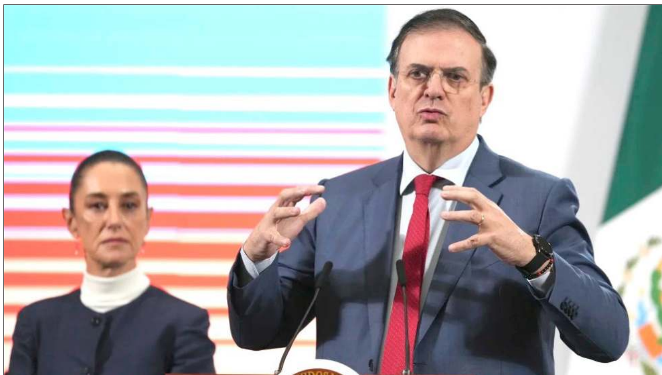
▲ El mensaje del secretario de Economía, Marcelo Ebrard, se da luego de que México y Canadá quedaron exentos de los aranceles recíprocos de Estados Unidos, pero seguirán pagando la tarifa de 25 por ciento en autos, acero, aluminio y derivados, rubro en el que ayer se incluyeron a las cervezas y a las latas de aluminio.

En una orden ejecutiva, EU señaló que “para Canadá y México, las órdenes vigentes sobre fentanilo/migración