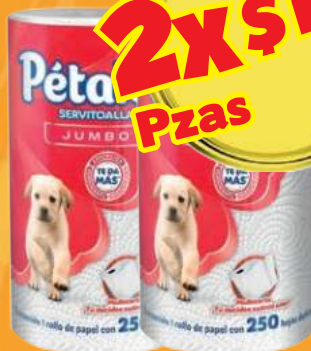
Toalla de papel cocina PÉTALO jumbo (Aplica las primeras 4 ofertas)