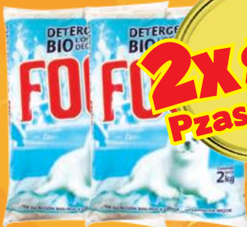
Detergente en polvo FOCA bolsa de 2 kg (Aplica las primeras 4 ofertas)