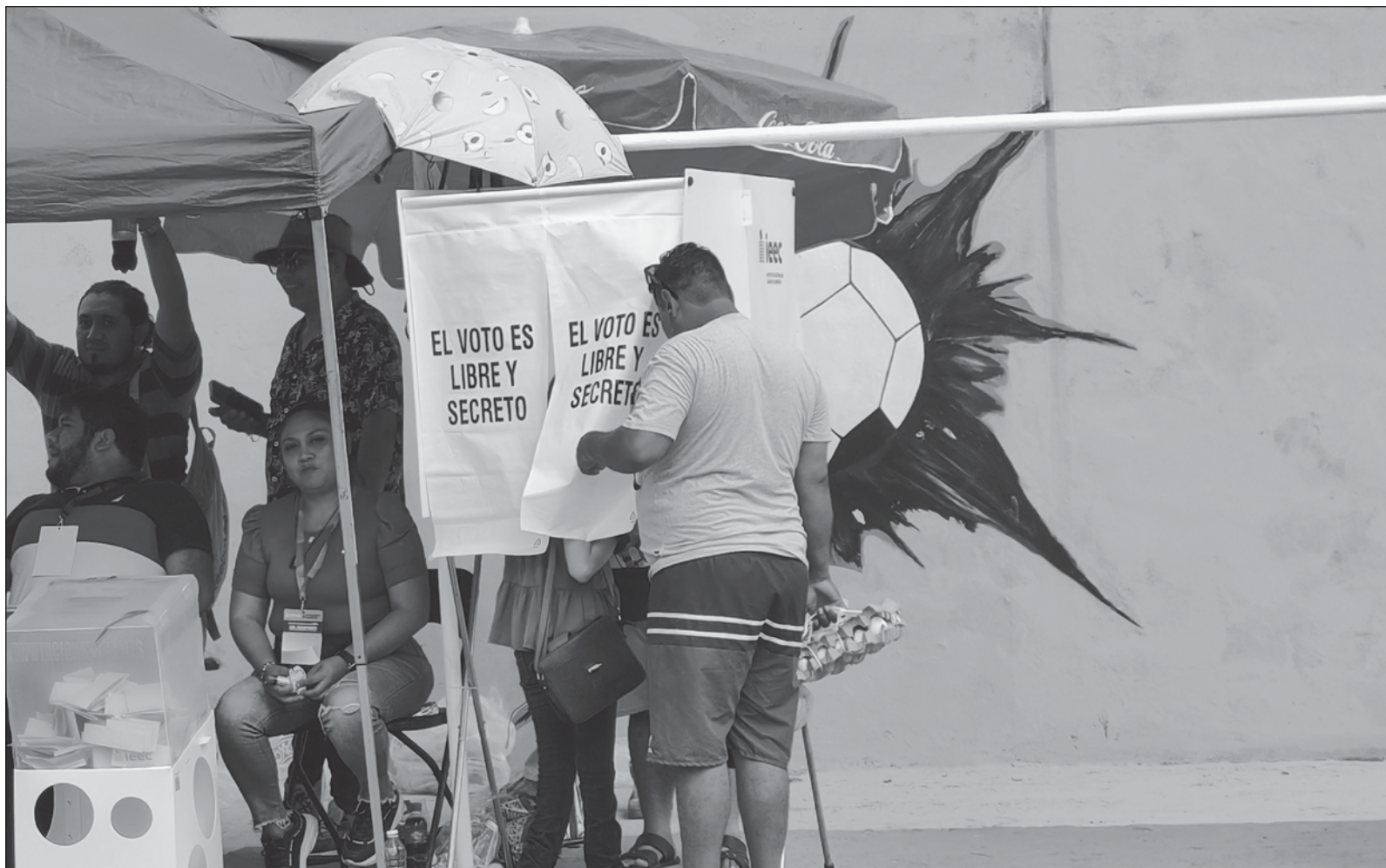
▲ "La democracia se fortalece cuando la ciudadanía se interesa en los asuntos públicos e interviene de manera informada y responsable".

*Magistrado del Tribunal Superior de Justicia del Poder Judicial del Estado de Yucatán.