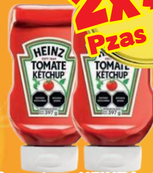
Salsa catsup HEINZ botella up side down de 397 gr (Máximo 3 ofertas por cliente)