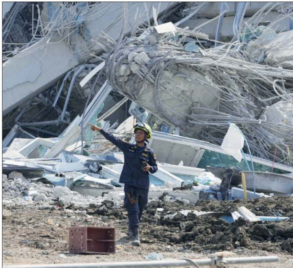
▲ Hasta el momento, el sismo ha dejado cerca de 2 mil 900 muertos en el país.

"No puedes pedir ayuda con una mano y bombardear con la otra", denunció Joe Freeman, especialista sobre Myanmar en Amnistía Internacional.