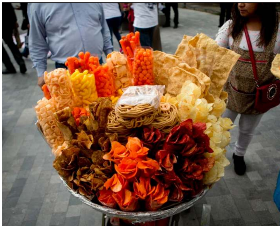
▲ “Debemos vigilar que en las escuelas no se expendan refrescos gasificados, jugos o néctares en envases o latas, chicharrones de cerdo o harina, entre otros alimentos”: Beatriz Cruz.

Indicó que Campeche es una de las entidades en los primeros lugares con los índices más altos de obesidad, no sólo en adultos, sino también en menores de edad.