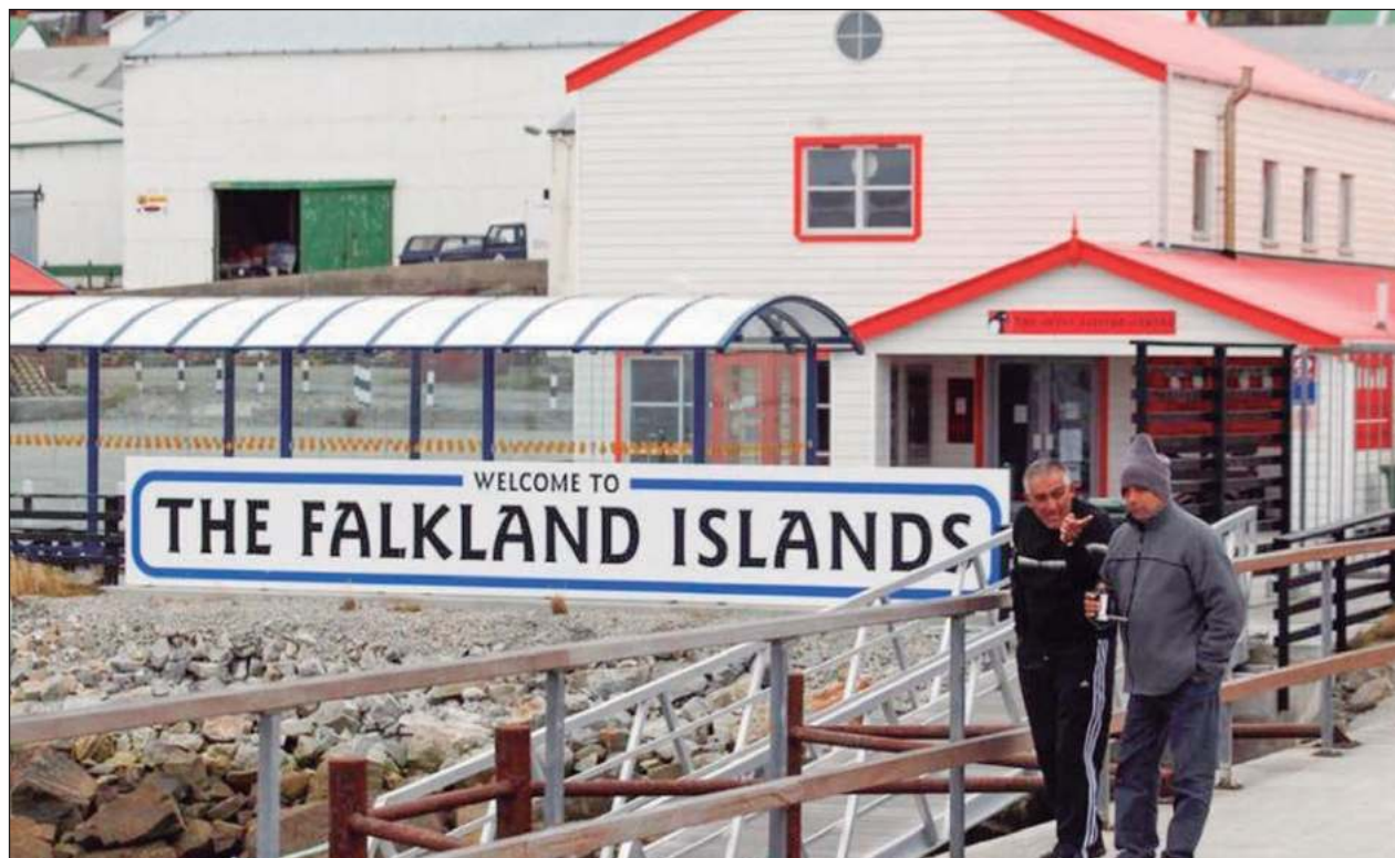
▲ El presidente libertario de Argentina conmemoró el miércoles el aniversario del fallido intento de su nación de arrebatar por la fuerza las islas Malvinas a Reino Unido en 1982 y expresó esperanza de que los residentes de las islas puedan algún día elegir ser argentinos en lugar de británicos. Sus comentarios fueron criticados como excesivamente conciliadores por rivales políticos que argumentan que los residentes de las islas no tienen derecho a la autodeterminación porque no son un pueblo indígena.