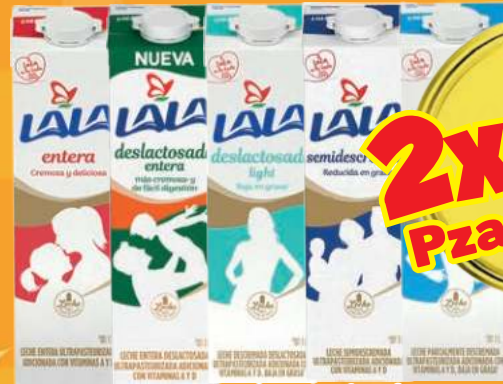
Selección de leches LALA de 1 lt (Ármalo como quieras)

¡Multiplica tu ahorro! CON 2x$ 3x$ 4x$ 5x$ Pzas Pzas Pzas Pzas ¡Llévate más productos y paga menos! * Consulta productos participantes en tienda