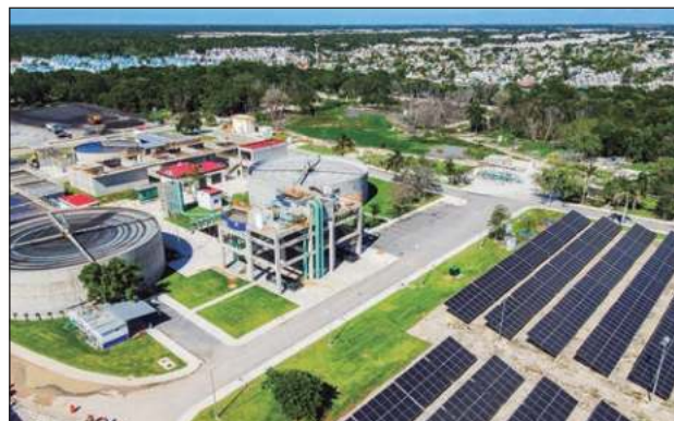
▲ “Aguakan tiene un compromiso con el bienestar de la comunidad que va más allá de la infraestructura”, destacó Borda.

“Tenemos varias obras clave en ejecución. Un proyecto destacable es la ampliación de la red de agua potable en el Sector F de Cancún, con una inversión de 52 millones de pesos. Esta obra beneficiará a más de 300 mil habitantes. También estamos modernizando la Planta de Tratamiento de Aguas Residuales en Isla Mujeres, lo que permitirá aumentar su capacidad de tratamiento de 30 a 60 litros por segundo. Además, la reubicación del colector de aguas residuales en la zona hotelera de Cancún, que ya ha beneficiado a más de 140 mil per-