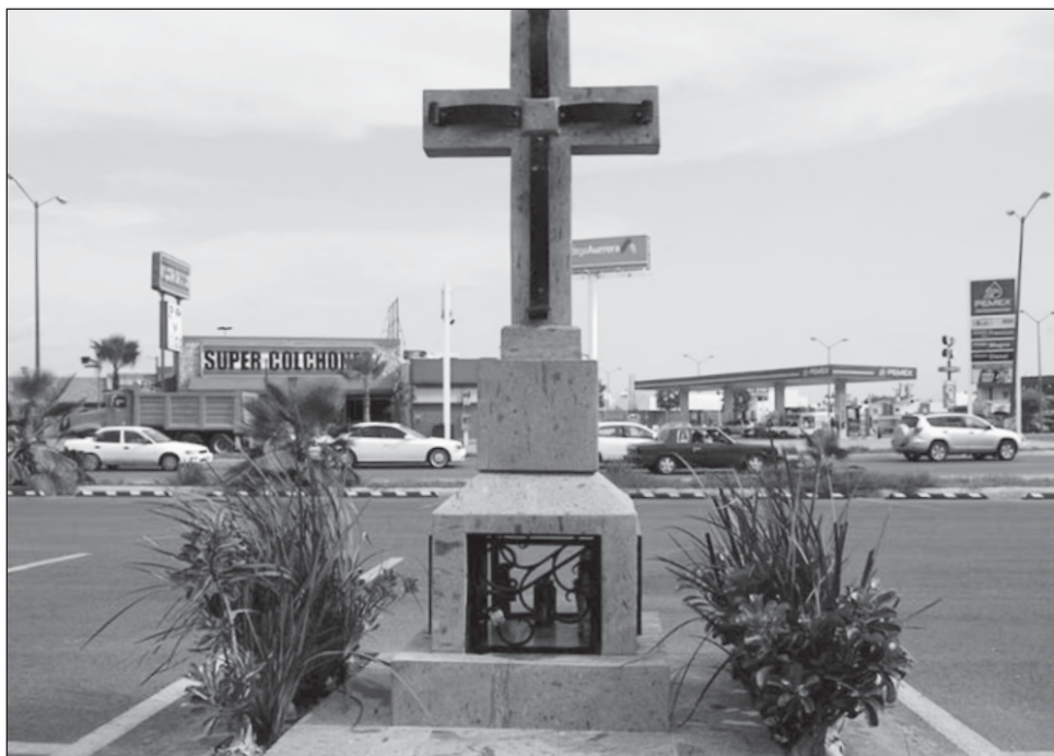
▲ Los cenotafios, en una ciudad repleta de ellos, sirven para que los dolientes honren a sus muertos y al mismo tiempo recuerden el conflicto que viven por el narcotráfico.

El fin de semana del puente, la playa de Altata estuvo llena, y vas a ver en Semana Santa, ejemplifica, con un optimismo más amarrado a sus deseos