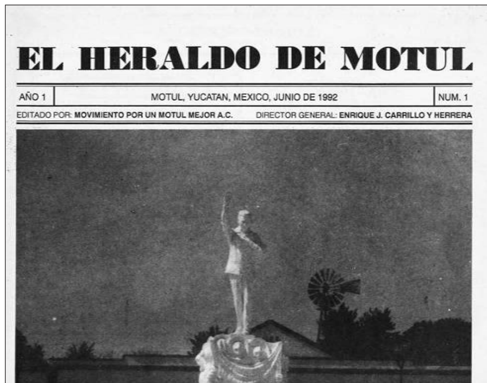
▲ "Las portadas de El Heraldo de Motul de 1992 ostentan imágenes selectas de la ciudad y de sus alrededores: así, la edición de junio tuvo como figura central el monumento al prócer asesinado en 1924, con una veleta que al fondo surca el paisaje". Foto Facsímil

EN LO QUE toca al contenido de este rotativo, en él predominaron notas acerca de temas políticos y otros de orden civil, como el retiro de subsidios oficiales al cultivo del agave y la