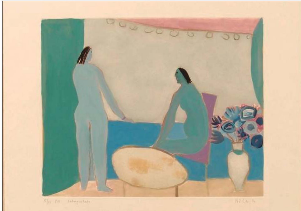
▲ La exhibición El mundo inmaterial, que contará con 126 piezas, será inaugurada el próximo sábado en el Museo Nacional de la Estampa de la capital.