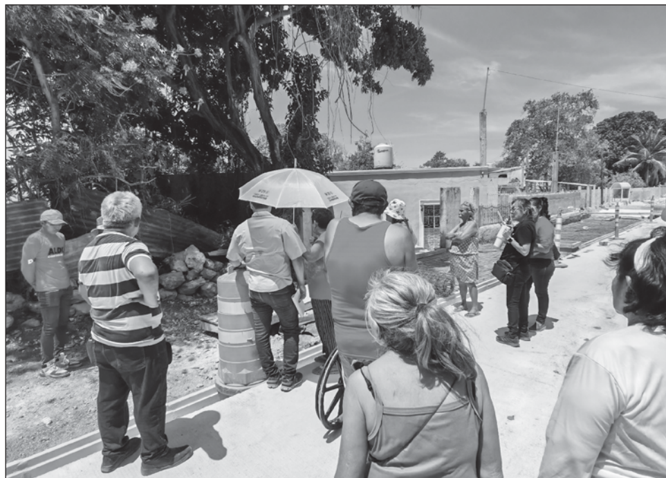
▲ Los habitantes del barrio de Santa Lucía acusan que la construcción en la zona es una venganza de la gobernadora Layda Sansores y que está politizando el tema.

Los vecinos, algunos integrantes del colectivo Tres Barrios, destacaron que nadie les ha informado cuál será el futuro de lo que ahora será la pista para el trayecto del Tren Ligero por esa zona, y pelearon lo mismo que cuando se opusieron al paso del Tren Maya frente a su casa, no se saldrán, y requieren que les aclaren si ya no podrán