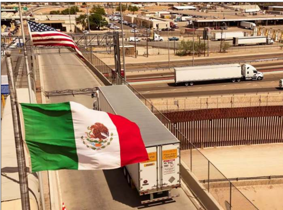
▲ Muchos puestos de trabajo dependen de las exportaciones a EU: “Si las plantas paran por los aranceles, sí perjudicaría a los mexicanos”, opinan algunos paisanos.

La mayoría de estos países también arrastra una historia reciente de inestabilidad política, conflictos armados o aislamiento diplomático. Siria, Irak y Birmania (Myanmar) han estado marcados por guerras y sanciones internacionales, mientras que Sri Lanka y Camboya enfrentan crisis institucionales recurrentes.