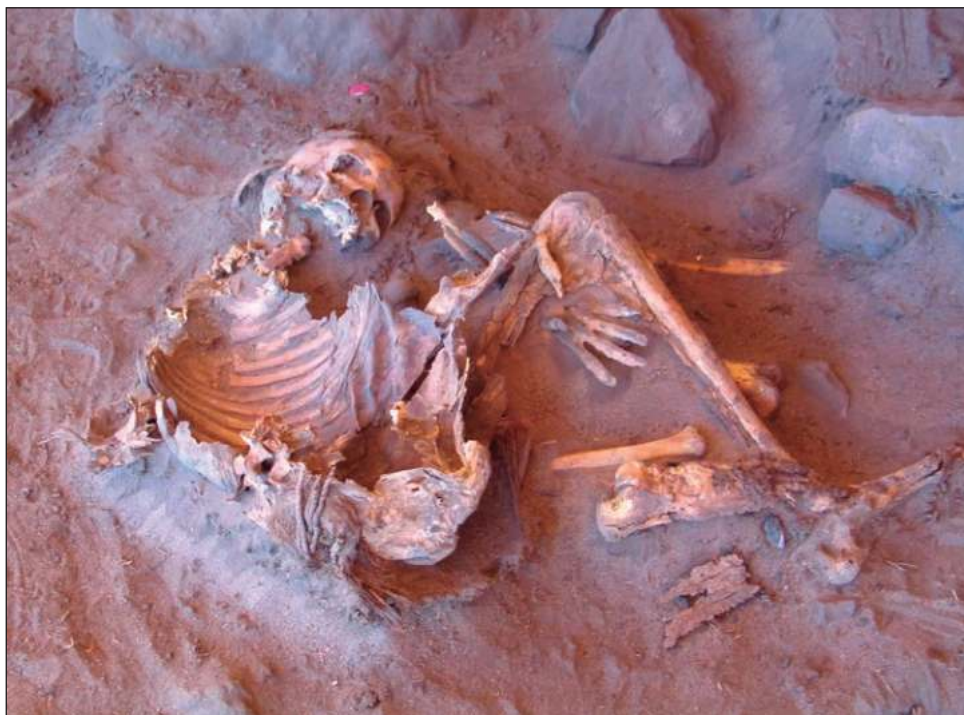
▲ La extrema aridez del desierto dificulta la conservación del ADN.

Este linaje permaneció aislado la mayor parte de su existencia, y aunque ya no existe en forma no mezclada, su ascendencia sigue siendo un componente genético central de la población norteafricana actual.