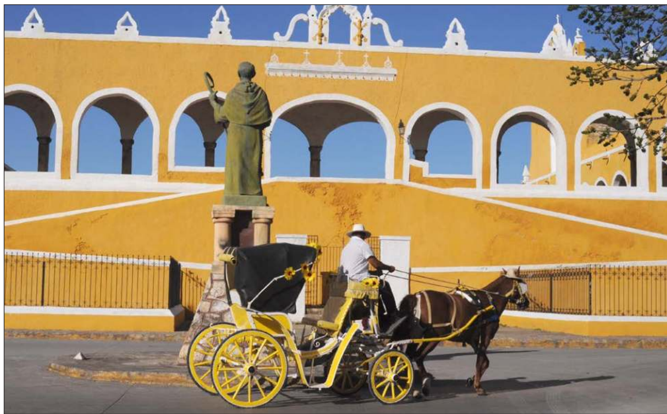
▲ De acuerdo con la presidenta municipal, otro de los objetivos de la estrategia turística es rehabilitar sitios de interés para los visitantes en Izamal, como la pirámide Kinich Kakmó o el convento San Antonio de Padua.

Se espera una derrama económica constante para