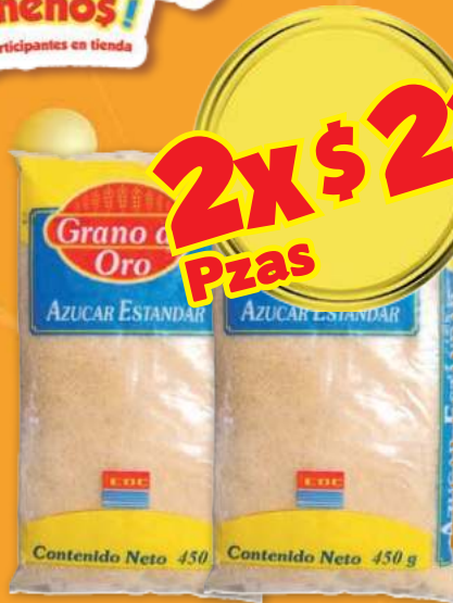
Azúcar estandar GRANO DE ORO bolsa de 450 gr