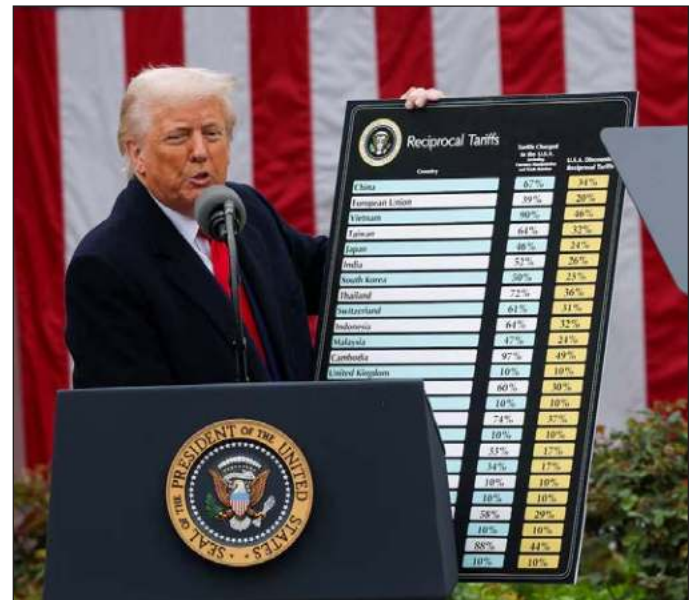
▲ “El golpe al comercio mundial tiene también otra motivación, y es desquitarse de los aranceles a Estados Unidos”.

Contra lo esperado por muchos, los productos de Canadá y México no se encontraban en la lista, ya que son parte del Tratado México-Estados Unidos y Canadá (T-MEC), aunque esto no quita la posibilidad de que sólo se trate de una excepción temporal, considerando que Trump añadió que el T-MEC ha sido “el peor acuerdo comercial jamás hecho por nosotros”; algo de llamar la atención, toda vez que durante su primer mandato se realizó una revisión exhaustiva que llevó incluso al cambio de nombre del convenio. Por lo pronto, aún habrá que esperar