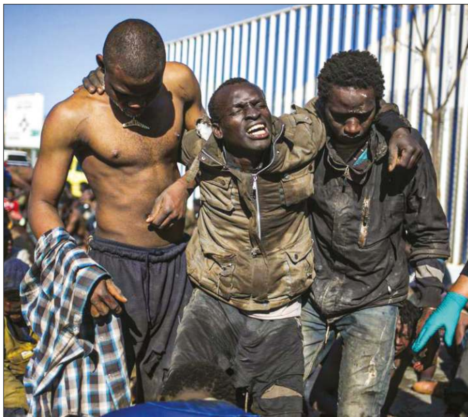
▲ Los guardias fronterizos marroquíes se vieron abrumados por "la gran violencia" de los migrantes, en su mayoría subsaharianos.

La radio publicó en Internet videos de hombres jubilosos celebrando su entrada