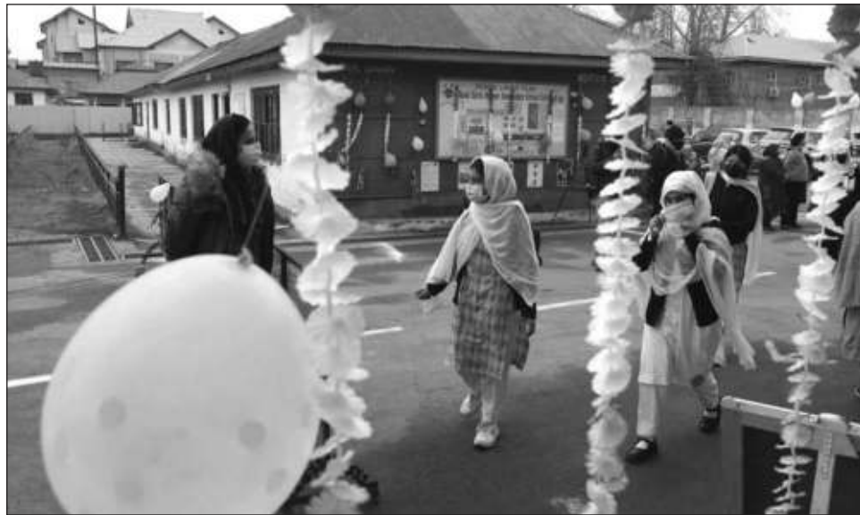
▲ Muchas escuelas de Srinagar amanecieron decoradas con banderas y globos de colores para dar la bienvenida de nuevo a los estudiantes.

Un ambiente festivo al que se sumaron los padres de los alumnos, que acudieron a las puertas de los centros y a las paradas de autobús a despedir a sus hijos por primera vez en 31 meses.