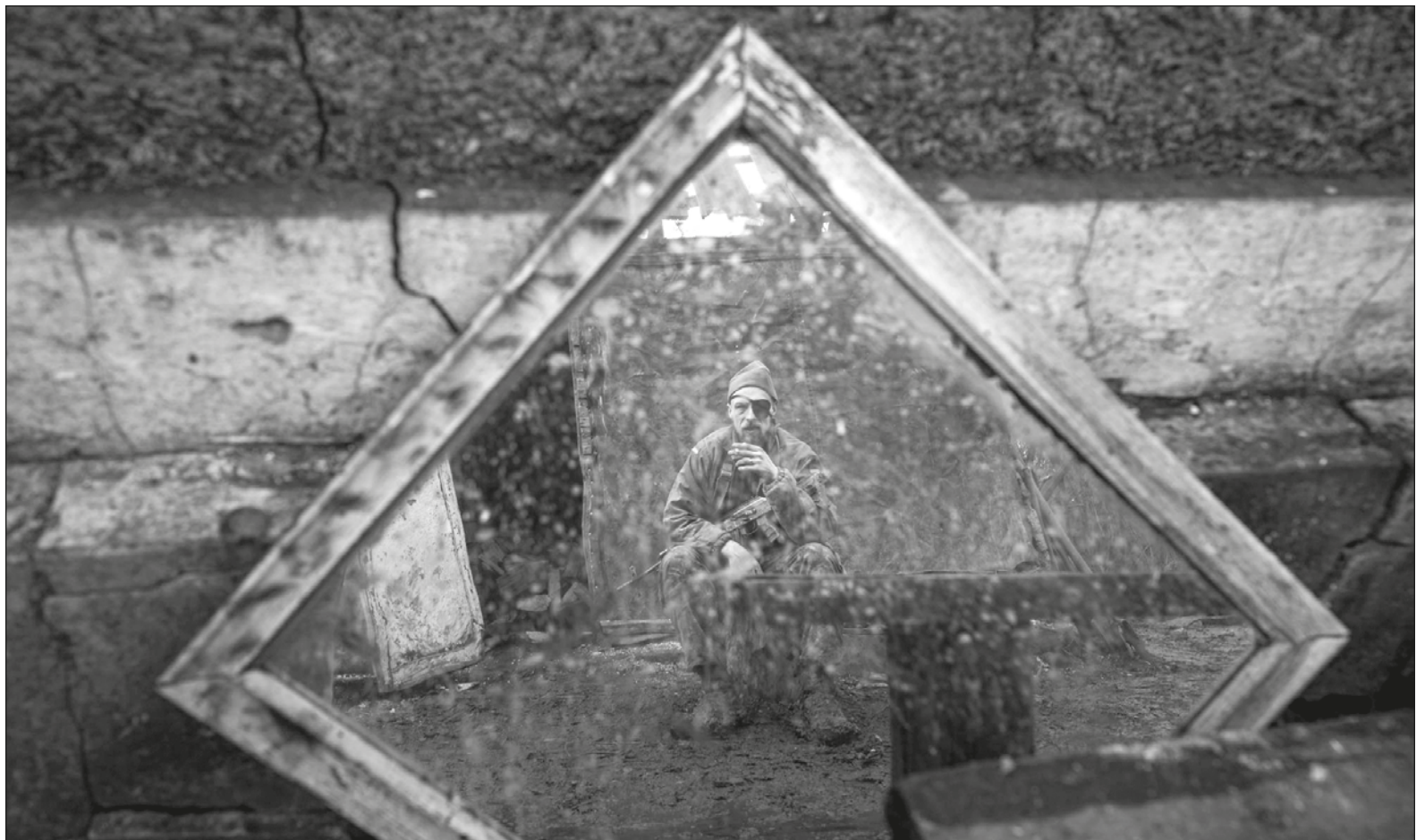
▲ Vivimos tiempos demenciales que marcarán de manera definitiva el destino del mundo.