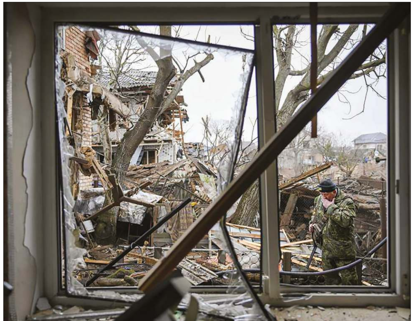
▲ Durante los siete días de la guerra, Rusia ha destruido cientos de infraestructuras de transporte, viviendas, hospitales y guarderías.

En un comunicado, destaca que sus socorristas han conseguido salvar la vida de más de 150 personas, evacuar a otras 500 y sofocar más de 400 incendios provocados por los bombardeos rusos.