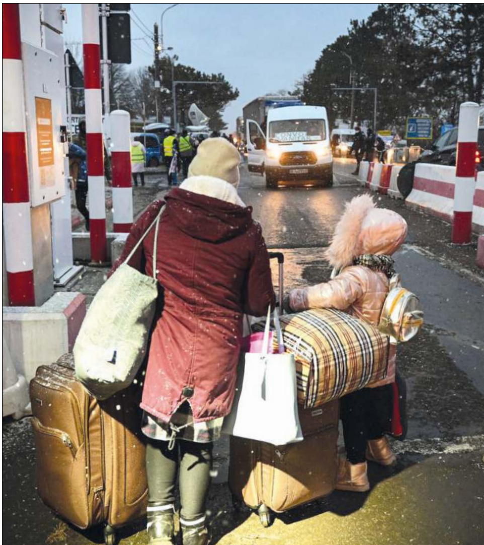
▲ Entre la muchedumbre hay muchas mujeres, con niños en cochecitos, maletas y envueltas en abrigos y capuchas en medio de la nieve que cae con fuerza.

El nigeriano no sabe qué le aguarda en el futuro. "Estoy agotado, voy a descansar unos días" dice, a sabiendas de que le espera aún un largo camino.