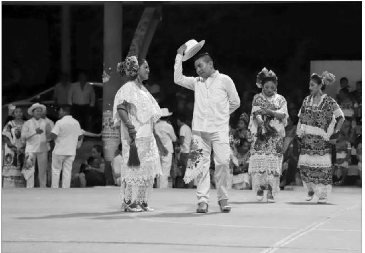
▲ Desde 2019, cuando fue aprobada la legislación que protege a los animales, las organizaciones galleras no han quitado el dedo del renglón, alegando que las peleas y corridas forman parte de los usos y tradiciones de las comunidades.

Sostuvo que se trata de 40 días para examinar, para preparar el camino, para no dejar aquello que no debe convivir en nosotros. También dijo que es momento de reflexión de la situación bélica de Rusia con Ucrania, y en el marco de este acto dijo que el papa Francisco pidió que se sumen a orar por la paz en los países implicados en este conflicto.