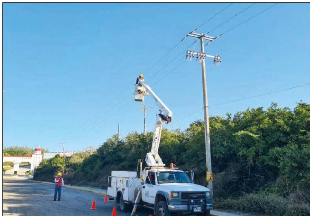
▲ Lo que está en juego es si el sector eléctrico se mantiene como instrumento de lucro para un puñado de trasnacionales o es palanca para el desarrollo.

No puede olvidarse que lo que estará en juego en el Congreso de la Unión es si el sector eléctrico se mantiene como instrumento de lucro para un puñado de trasnacionales locales y foráneas, o si se le devuelve su papel histórico como palanca para el desarrollo nacional.