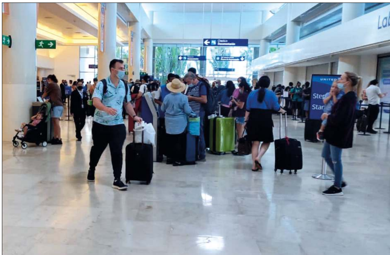
▲ Los vuelos que conectan Cancún con Rusia quedaron cerrados desde el pasado fin de semana, aunque se tenían enlistados entre las operaciones del aeropuerto del destino caribeño.

De acuerdo con la Agencia Federal de Transporte Aéreo de Rusia, los vuelos de repatriación continuarán el próximo 5 de marzo también desde el aeropuerto de Cancún y de manera paulatina en la Ciudad de México. Se proyecta que se movilice a unos mil 500 o dos mil ciudadanos rusos.