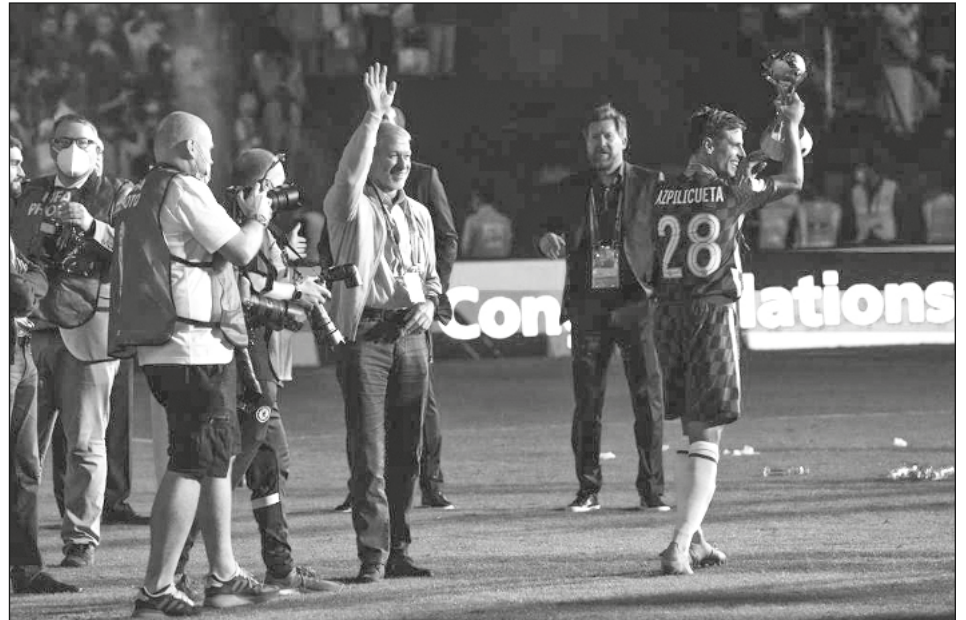
▲ “Me duele separarme del club de esta manera”, expresó Roman Abramovich.

Un posible comprador ya había salido a la palestra para revelar que Abramovich quería vender y que el precio oscilaba en los 2 mil 500 millones de dólares. El multimillonario suizo Hansjörg Wyss aseguró que el martes recibió una oferta para comprar al Chelsea de Abramovich, además de otros tres individuos. Sin embargo, Abramovich señaló que “la venta del club no será