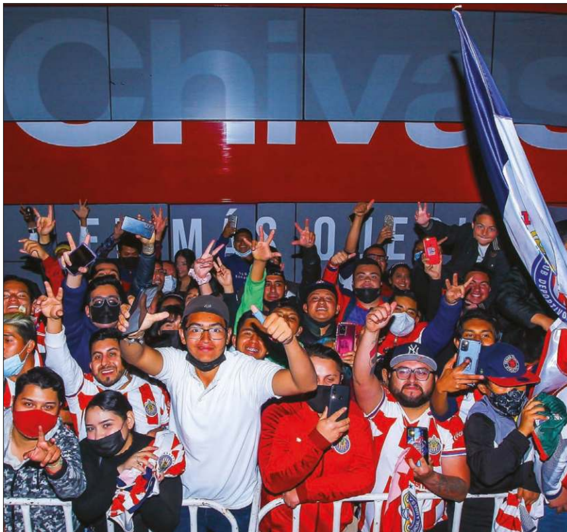
▲ Después de un par de temporadas, el Rebaño Sagrado se vuelve a colocar como el equipo predilecto de la afición mexicana.