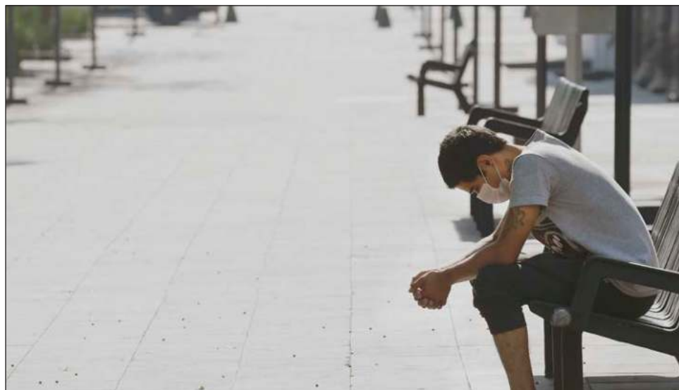
▲ De acuerdo con el informe de la OMS, sólo en 2020 se registró un aumento de 27.6 por ciento en el número de casos de trastorno depresivo grave. Esto a nivel mundial.

Durante el primer año de pandemia también se pudo constatar un 25.6 por ciento más de casos de trastornos de ansiedad a nivel mundial.