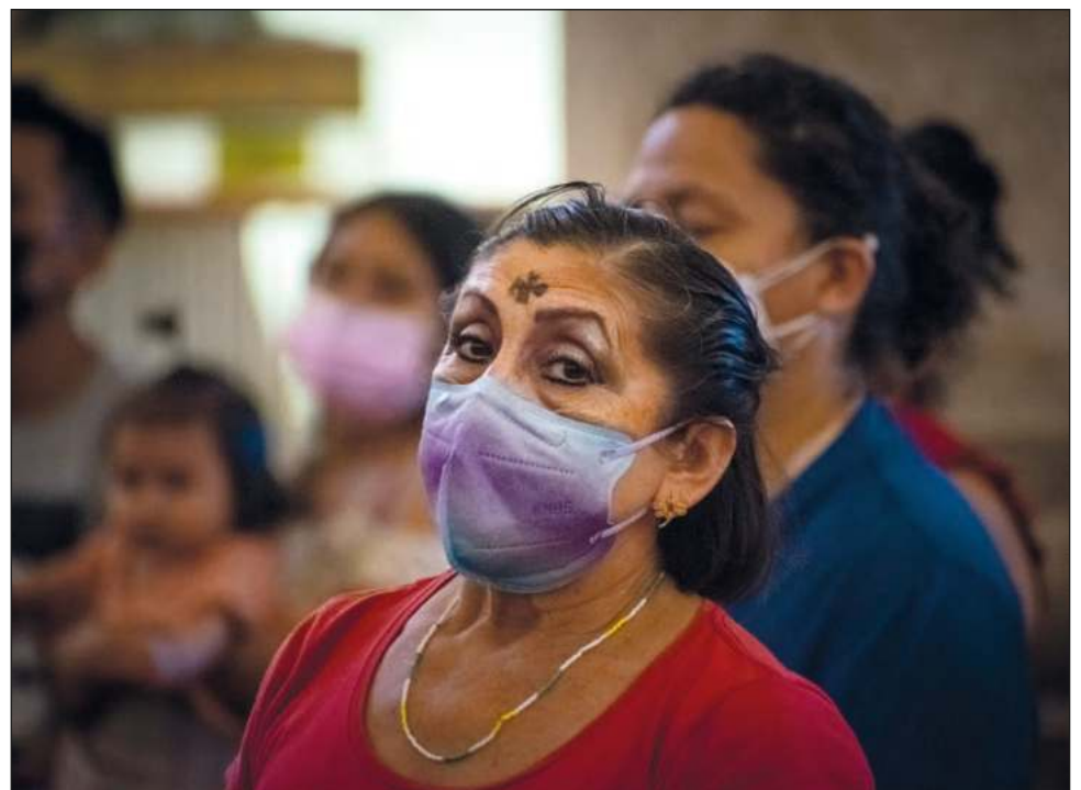
▲ Este miércoles, para los cristianos, inició la Cuaresma. En los templos católicos de Mérida se celebró la imposición de la ceniza, signo que humildad y penitencia, pues los 40 días de este periodo son recordatorio del tiempo que Jesús permaneció en ayuno y oración en

el desierto, como preparación para su etapa de predicación. La arquidiócesis de Yucatán anunció que, a fin de evitar aglomeraciones en las iglesias, este domingo también se impondrá la ceniza durante las misas que se celebren.