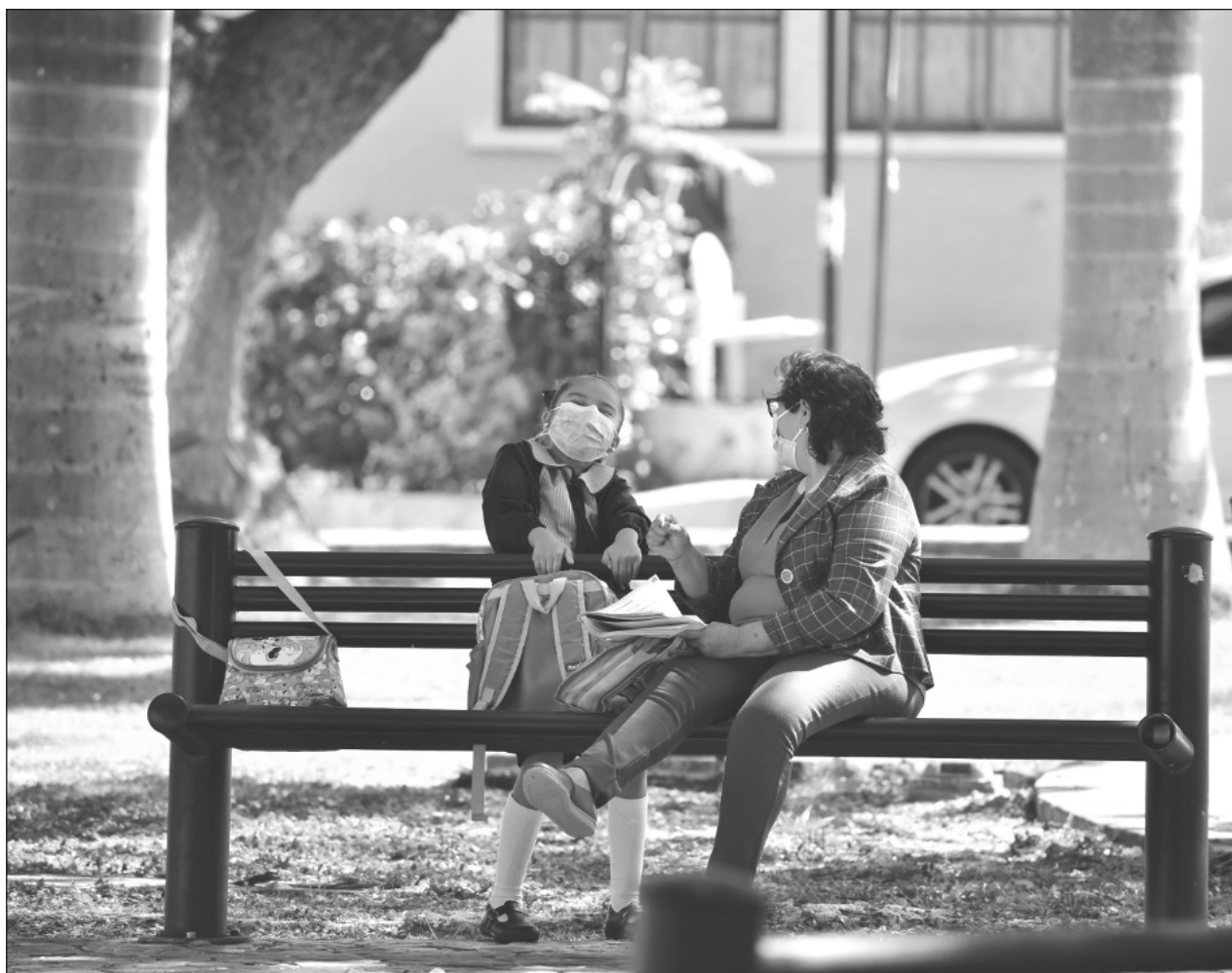
▲ El primer caso de Covid-19 en Yucatán tuvo lugar el 13 de marzo de 2020. Se trató de una mujer que había regresado de España.

"Quien olvida, está borrando con ello una parte de su historia", por ello, pidió conmemorar las pérdidas con este día para recordarlas, rindiéndoles homenaje