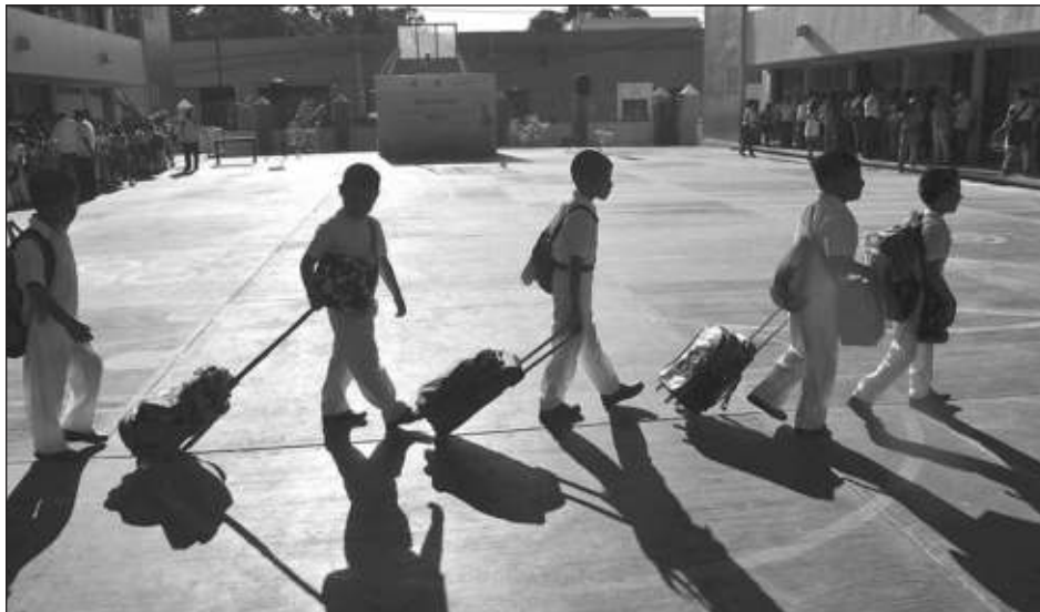
▲ La secretaria de Educación, Delfina Gómez, justificó la desaparición de las escuelas de tiempo completo alegando que de momento hay muchos planteles con necesidades básicas como agua y sanitarios que deben atender.

“Es prioritario darle atención a esas escuelas que tienen esa necesidad, y por eso La Escuela es Nuestra se va a enfocar principalmente a que el recurso que se asigne sea ocupado para esa situación”, indicó.