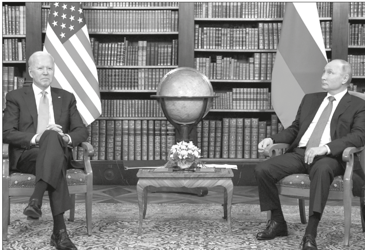
▲ EU y la OTAN han violado sistemáticamente el acuerdo verbal entre potencias establecido durante la negociación de la caída del muro de Berlín.