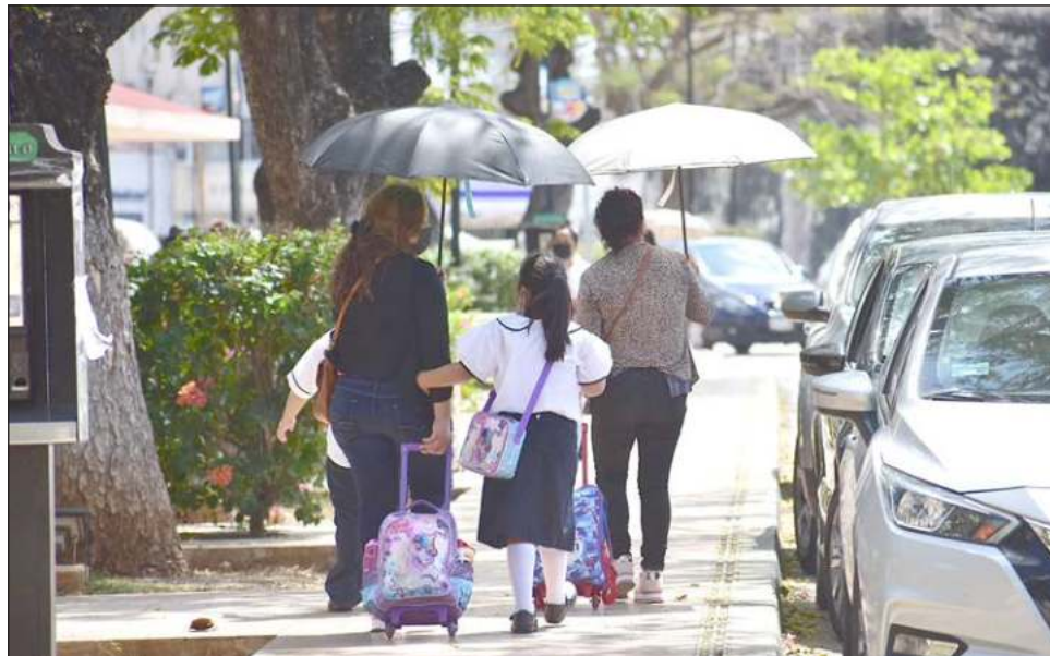
▲ Según algunos docentes, los padres de familia tuvieron poco tiempo para asimilar la propuesta de las secretarías de Salud y Educación de regresar totalmente a clases presenciales.

Desde antes de las vacaciones de invierno, las clases presenciales mantenían un modo escalonado para evitar aglomeraciones, además también tenían ese estatus de volun-