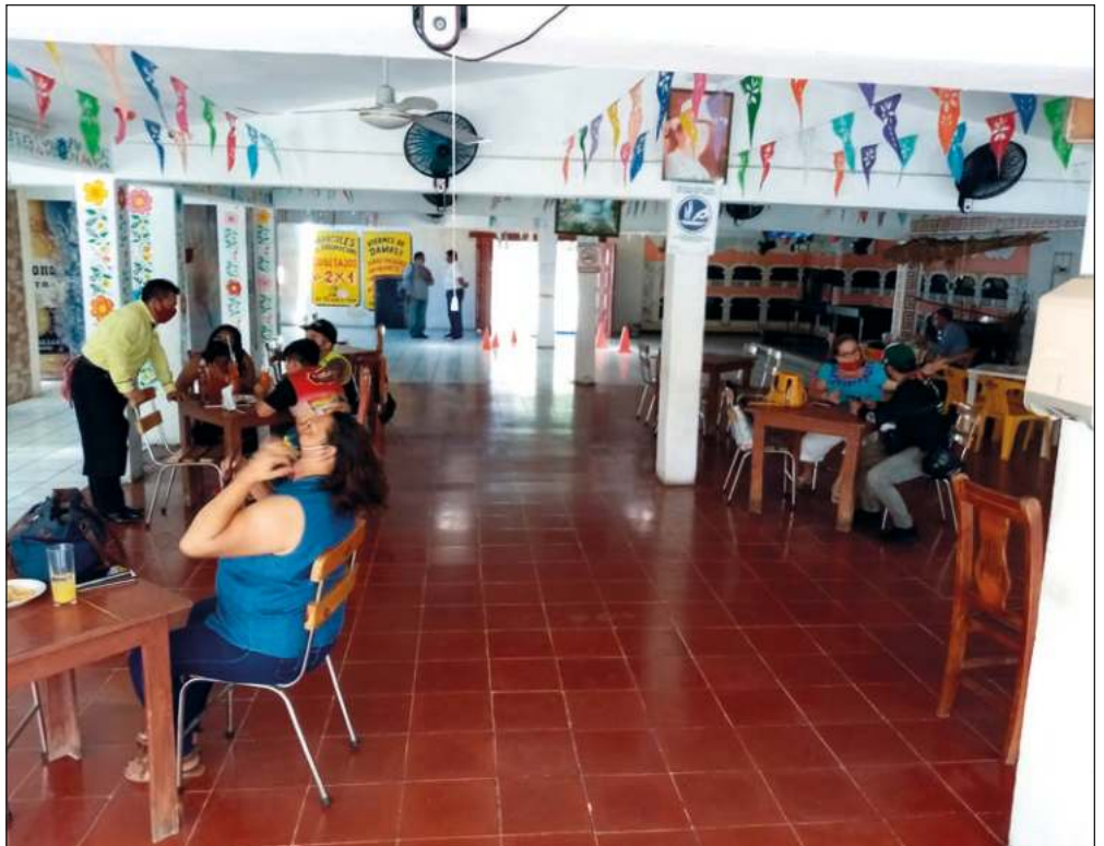
▲ Actualmente el sector restaurantero opera al 75 por ciento de aforo, como parte de las medidas de la estrategia de reactivación económica.

También, indicó que cada vez ven mejor el proceso de recuperación económica en el estado, con las condiciones actuales y el avance de la vacunación “seguiremos viendo mejores resultados. Creo que en la parte comercial, en la parte turística ya se están dando los preparativos”, reiteró.