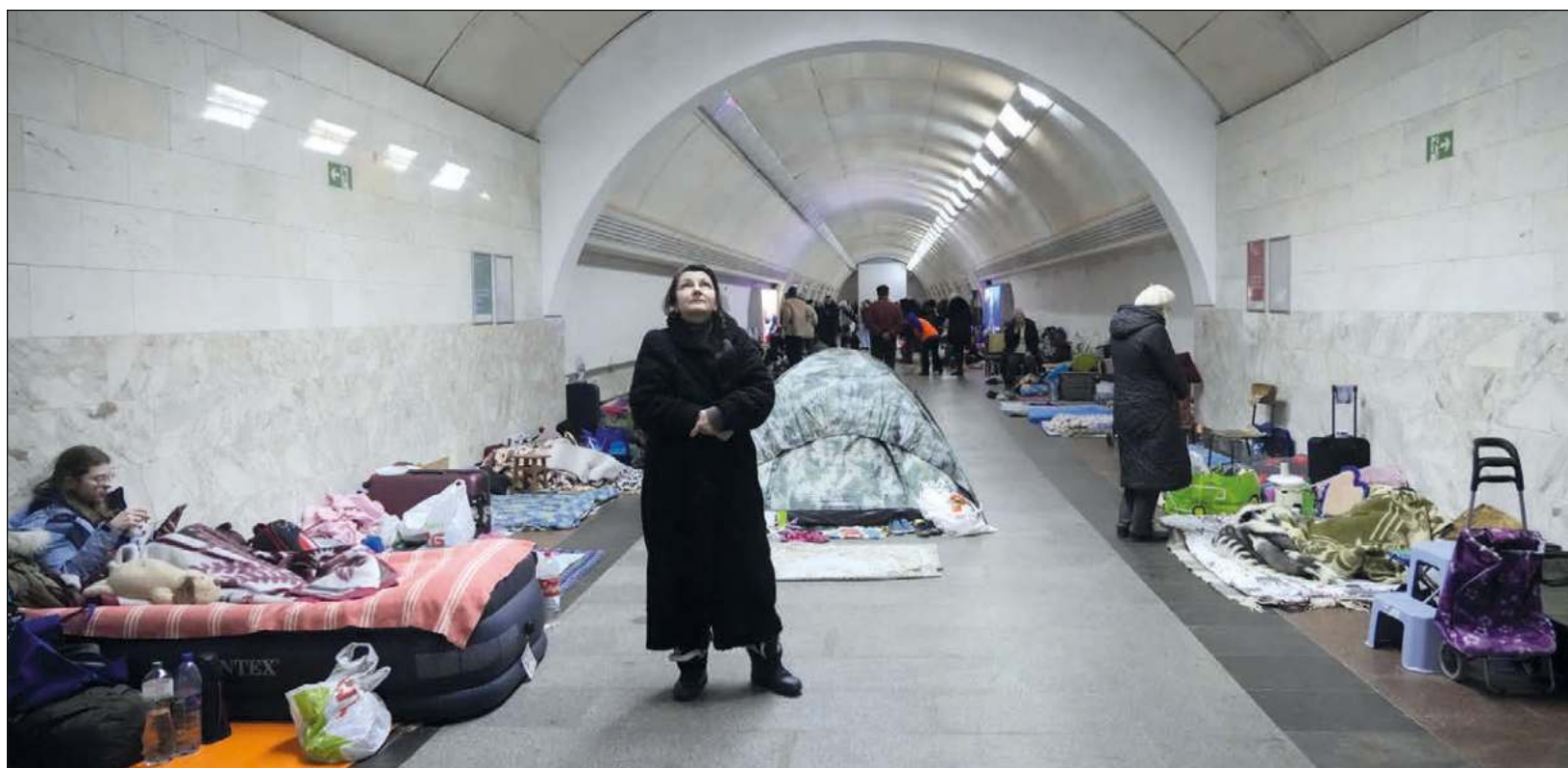
▲ La guerra, a través de los ojos de las mujeres, es signo de angustia. Desde la frágil seguridad contra los bombardeos que puedan ofrecer los sótanos de algún hospital en Kiev, convertidos en área de maternidad, o los andenes del metro, únicamente se espera poder volver al exterior, así sea para sentir el desgarrar de contemplar el camino a casa convertido en escombros a causa de los bombardeos o la artillería.