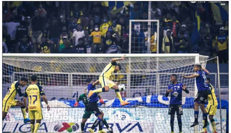
▲ Las Águilas dejaron escapar una victoria ante el Querétaro y se quedaron con seis puntos.

América no dio a conocer quién se hará cargo del equipo, que el fin de semana enfrentará a Monterrey por la novena fecha.