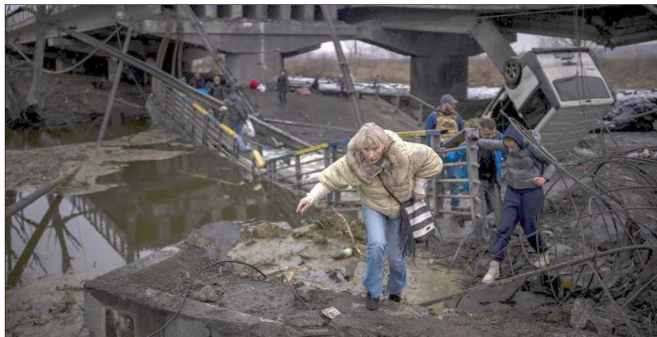
▲ Rusia reportó bajas militares por primera vez desde el inicio del ataque, diciendo que casi 500 de sus soldados habían muerto y que casi mil 600 fueron heridos. Ucrania no reveló de momento las suyas, pero dijo que más de 2 mil civiles han muerto.

"Cuando existe un conflicto, existe por supuesto el riesgo de un impacto accidental", afirmó. Rusia ya tomó el control de la planta