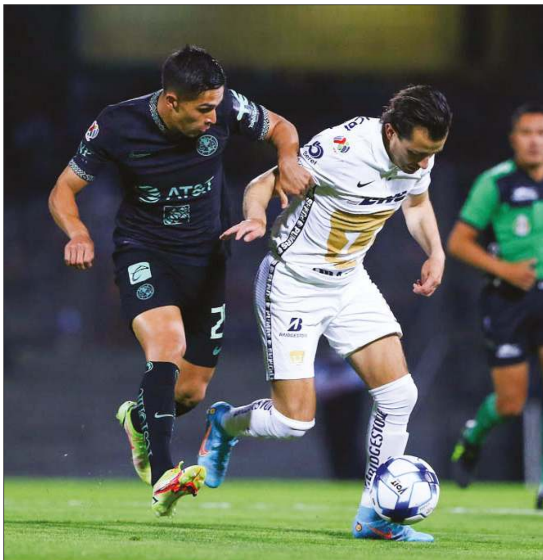
▲ Los llamados “Cuatro Grandes del Fútbol Mexicano”: Chivas, América, Cruz Azul y Pumas se mantienen como los equipos más populares del país; también son el cuarteto más odiado.

Por último, otro aspecto sumamente importante es, sin duda, el aumento en el interés de los partidos de la Liga MX Femenil. Dos datos corroboran este crecimiento: la más reciente final entre Tigres y Monterrey que superó las 143 mil vistas al ser transmitida en el perfil oficial de la competencia. Y dos, a nivel nacional el 66 por ciento de quienes se declaran aficionados al soccer están interesados en los resultados de la liga profesional de mujeres.