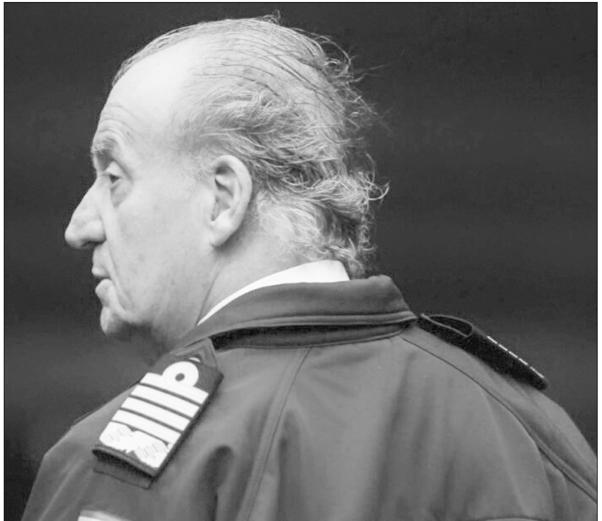
▲ Juan Carlos's legacy could have been brilliant. Instead, he will likely go down in history as a caricature.

JUAN CARLOS WENT on national television late that night to order the troops back to the barracks and the Civil Guard officers to relinquish their control over the Parliament buildings.