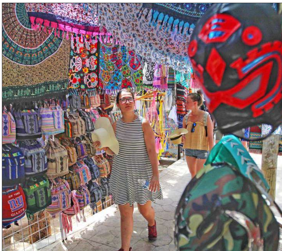
▲ Con estos apoyos, los artesanos mayas podrán adquirir materias primas de calidad que les permitan hacer sus obras para el turismo nacional e internacional.

"Se buscará qué trámites causan más conflictos y cuáles son los que más se prestan a la corrupción. Hasta ahora los más denunciados son los relacionados con la propiedad. Tulum no ha cumplido con la ley de participación ciudadana, hay que buscar soluciones comunes y este tipo de ejercicios deben ser recurrentes y propiciados por la iniciativa privada y la sociedad civil. Es necesario que el Cabildo se comprometa a armar la comisión anticorrupción", asentó.