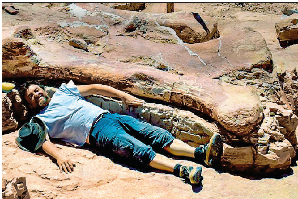
▲ En 2014 fueron encontrados una escápula muy completa, algunos huesos de las patas traseras, una parte del fémur y lo que sería el peroné del animal.

“Por la antigüedad de este material de 140 millones de