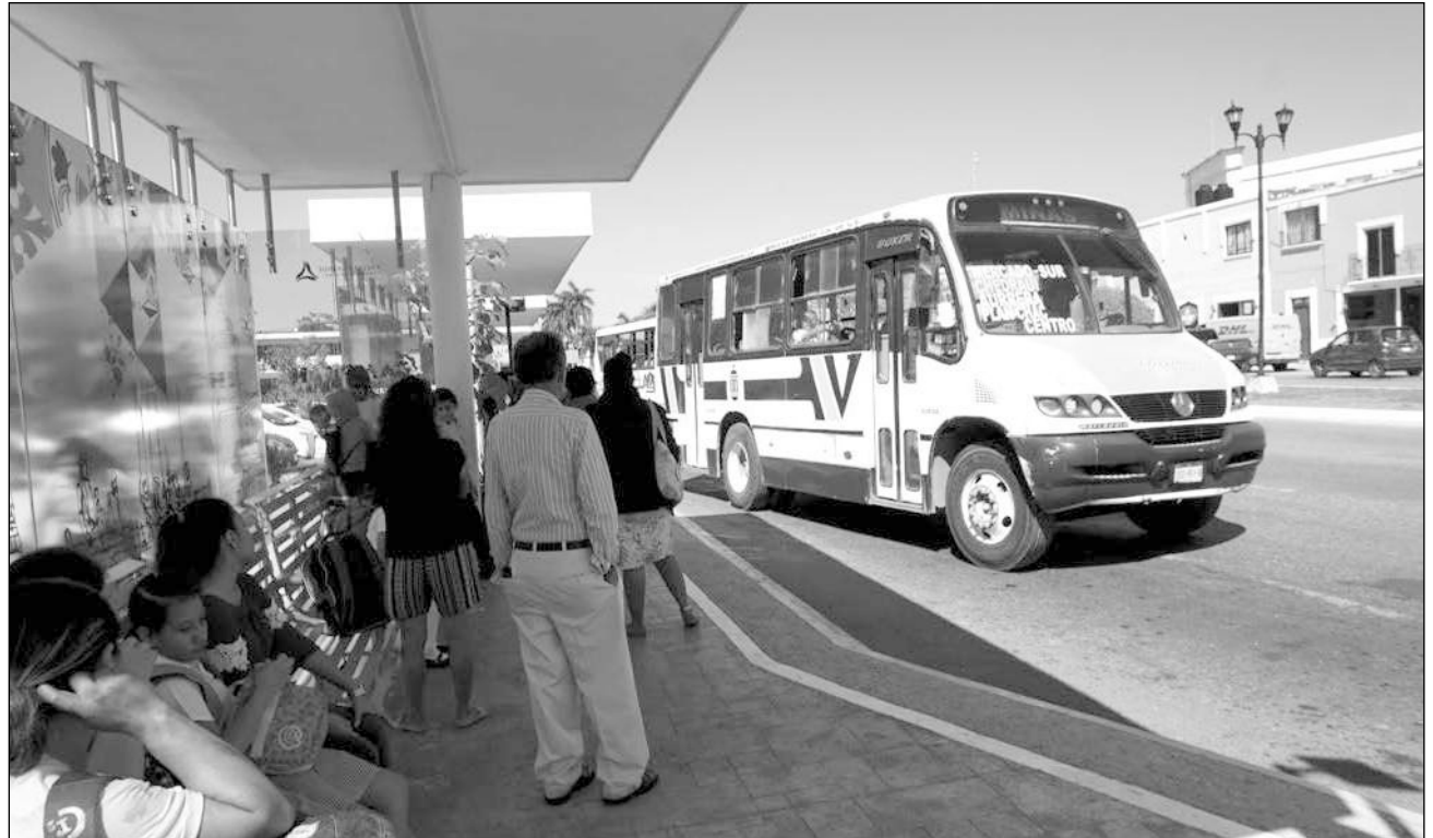
▲ Son 10 unidades de transporte público las que cuentan con el servicio de Internet para los pasajeros.

Grupo Comí también abarca las rutas de Maya-