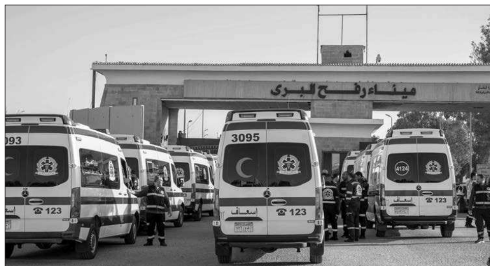
▲ El cruce cerrado desde 2024 -único paso entre Gaza y el mundo exterior que no pasa por Israel- reabrió este lunes en ambas direcciones, pero bajo condiciones muy estrictas.