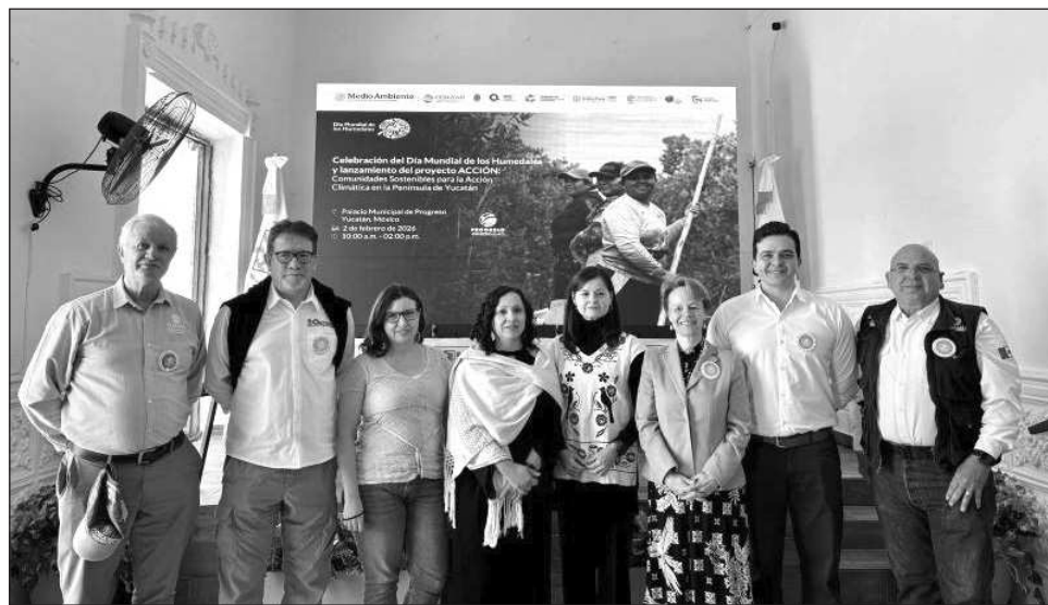
▲ La Conanp reconoció la importancia de los humedales como ecosistemas estratégicos para la conservación de la biodiversidad y el bienestar de la península de Yucatán.

En este contexto, la Conanp reconoció la importancia de los humedales como ecosistemas estratégicos para la conservación de la biodiversidad y el bienestar de las comunidades. Destacó su compromiso con la protección, el manejo sos-