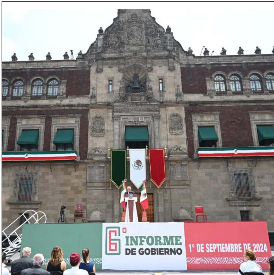
▲ AMLO realizó el acto ante miles de personas en el Zócalo de la CDMX.

También mencionó que “las reservas internacionales del Banco de México suman 224 mil 709 millones de dólares, 29 por ciento más que en 2018. Es récord histórico de reservas internacionales”.