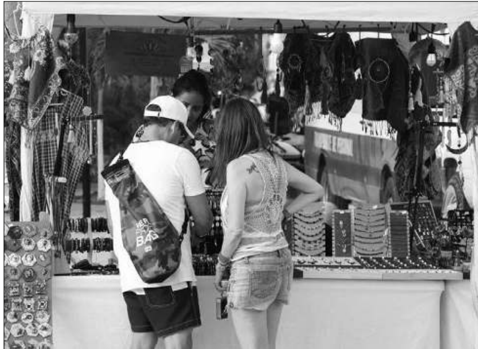
▲ En lo que va del año ya son más de 200 personas beneficiadas en los diversos programas que ofrece la Secretaría de Desarrollo Económico.

Este trabajo ha permitido que proveedores que han comenzado a colocar sus productos en supermercados iniciaran con unos 20 o 40 mil pesos y que hoy en día facturen más de 300 mil, y esa es la meta. Para avanzar en esas estrategias, desde la secretaría hay programas de financiamiento