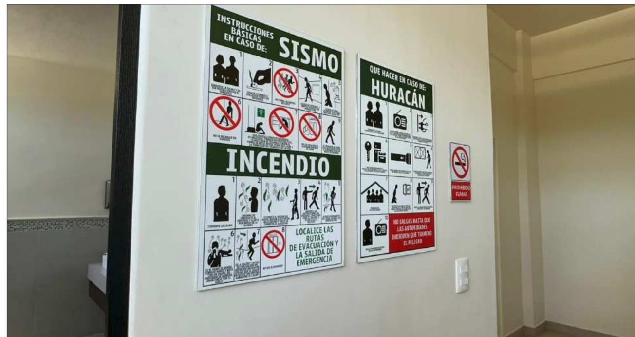
▲ De acuerdo con la Coeproc, históricamente el estado ha registrado dos sismos relevantes: uno en Felipe Carrillo Puerto, en 2002, y otro en Playa del Carmen, en 2015, sin que se reportaran afectaciones de consideración.

Indicó que actualmente la prioridad operativa sigue