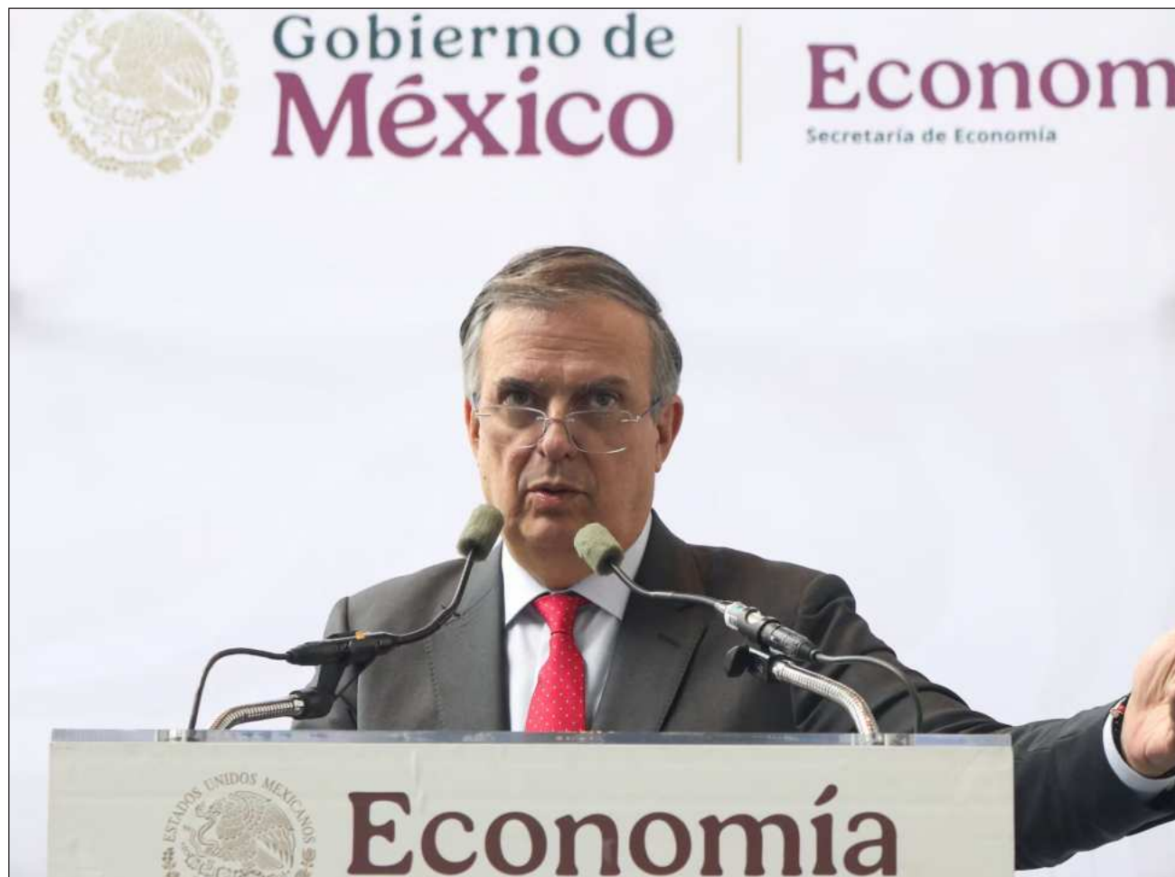
▲ Marcelo Ebrard destacó también la participación de Canadá en la reunión trilateral, la primera de este tipo desde la entrada en vigor del tratado, y precisó que México no mantiene temas de conflicto comercial con ese país.

Sobre las preocupaciones planteadas por Estados Unidos, el funcionario dijo que