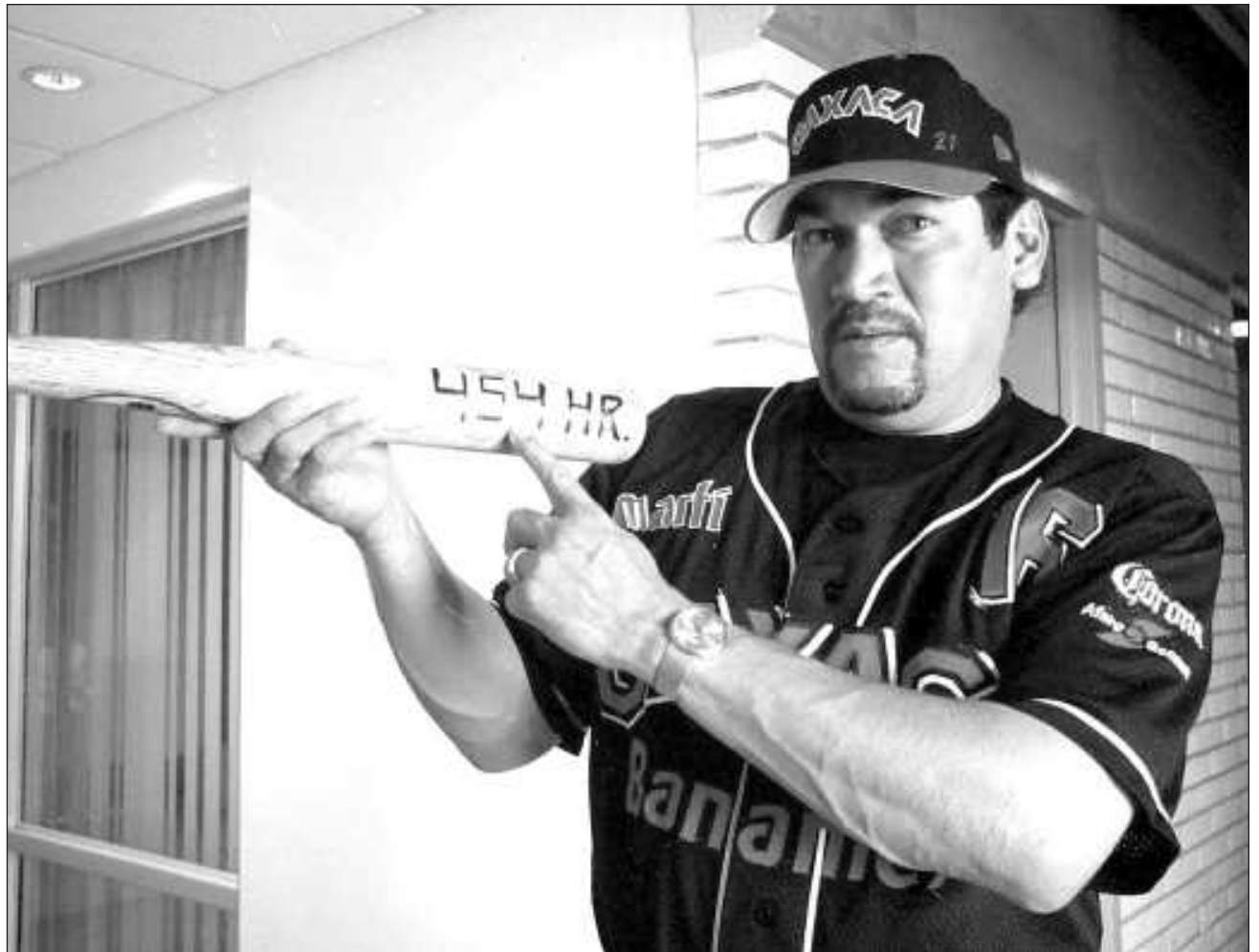
▲ El Almirante tuvo un paso impecable en cuatro de los más grandes equipos de la LMB: Diablos Rojos de México, Tecolotes de Nuevo Laredo, Guerreros de Oaxaca y con el equipo de su estado natal, los Piratas de Campeche.

Merecedor de esta distinción en reconocimiento por ser inspiración de niños, niñas y jóvenes en Carmen