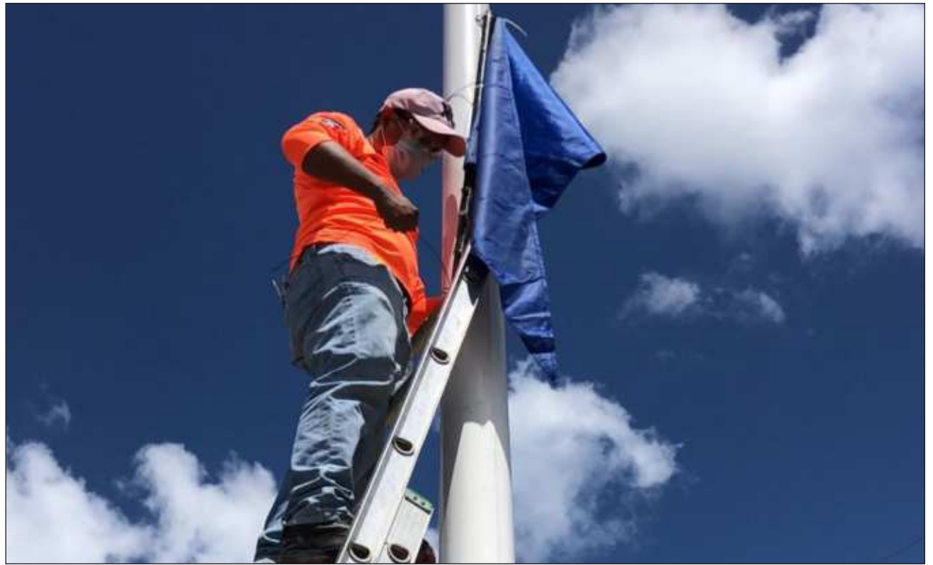
▲ Protección Civil de Yucatán recomienda revisar el estado de puertas, ventanas y techos; además de tener a la mano una radio, lámparas de batería, botiquín de primeros auxilios y almacenar una provisión de alimentos básicos no perecederos y agua para al menos cuatro días. Beryl impactó la mañana de este lunes en Granada.

El Centro Nacional de Huracanes (NHC, por sus siglas en inglés), lo ha catalogado como “extremada-