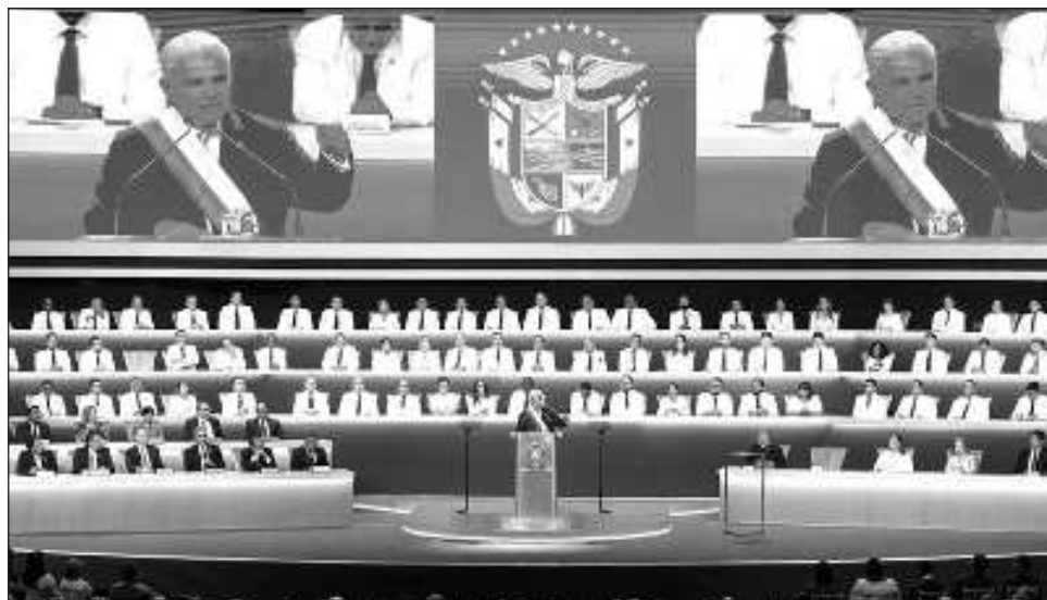
▲ "No permitiré que Panamá sea un camino abierto a miles de personas que ingresan ilegalmente a nuestro país aupados por toda una organización internacional relacionada con el narcotráfico y el tráfico de personas", subrayó el presidente José Raúl Mulino.

El nuevo líder panameño considera que ese flujo mi-