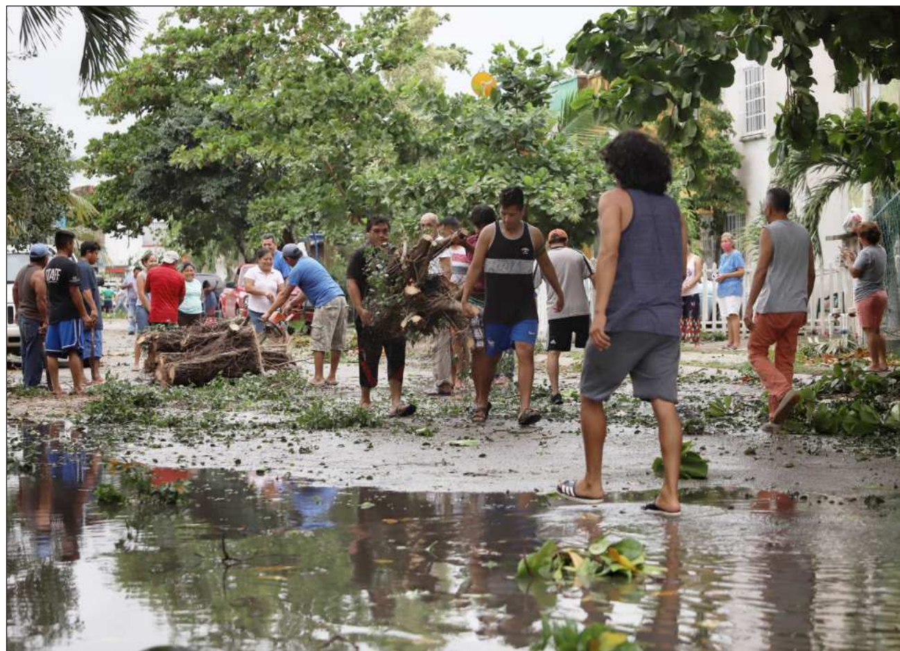
▲ El Comité Operativo para la Temporada de Lluvias y Ciclones Tropicales 2026 fortalecerá la capacidad de respuesta para salvaguardar la vida, el patrimonio y la seguridad de los habitantes de los 11 municipios del estado.

Las redes sociales oficiales del gobierno estatal son: @CoeprocQRoo (Facebook de la Coordinación Estatal de Protección Civil), @GobQuintanaRoo (Facebook del Gobierno de Quintana Roo) y @MaraLezamaOficial (Facebook de la gobernadora de Quintana Roo). En ellas, en caso de contingencia, se darán a conocer los reportes climatológicos.