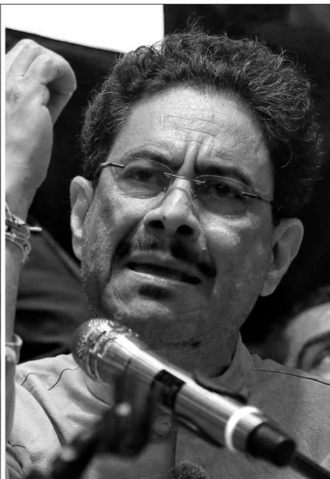
▲ Los resultados del domingo le dieron la ventaja a De la Espriella con 43.74% de los votos, frente a 40.90% de Cepeda.

La presidenta mexicana Claudia Sheinbaum afirmó que se debe atender la denuncia sobre un posible fraude y llegar "hasta lo último". La pri-