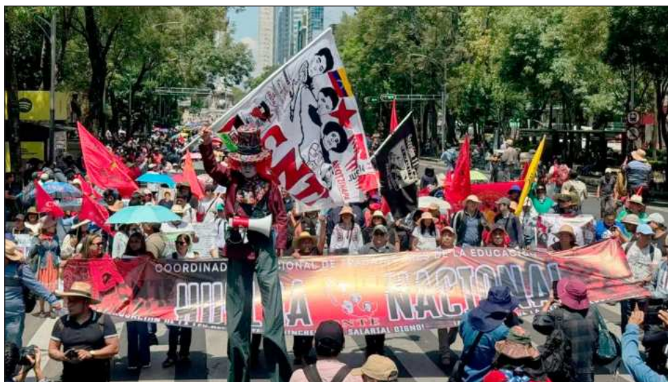
▲ “Hace 20 años el movimiento, que hoy es gobierno, y que tomó este Paseo de la Reforma, hoy nos cierra el zócalo”, señaló un docente de la sección 34 de Zacatecas.