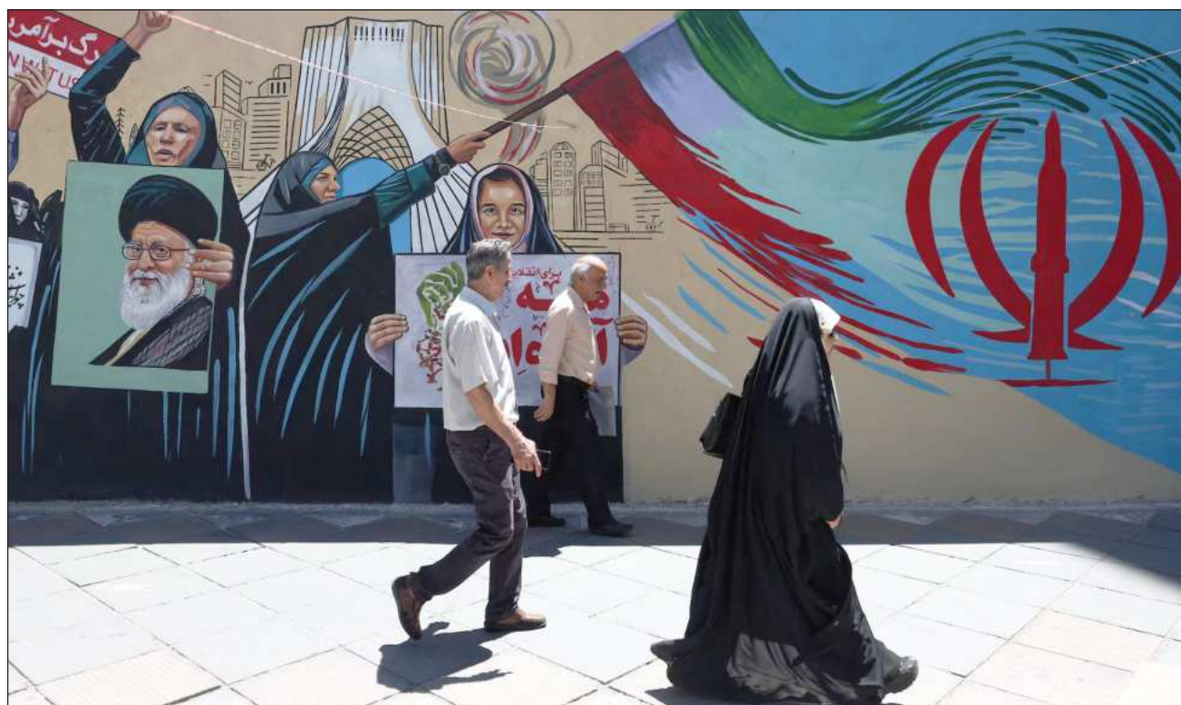
▲ Último intercambio de disparos entre EU e Irán coincidió con una nueva intensificación de la ofensiva de Israel en Líbano.

Israel y Hezbolá habían acordado detener los combates si se firma la paz con Estados Unidos