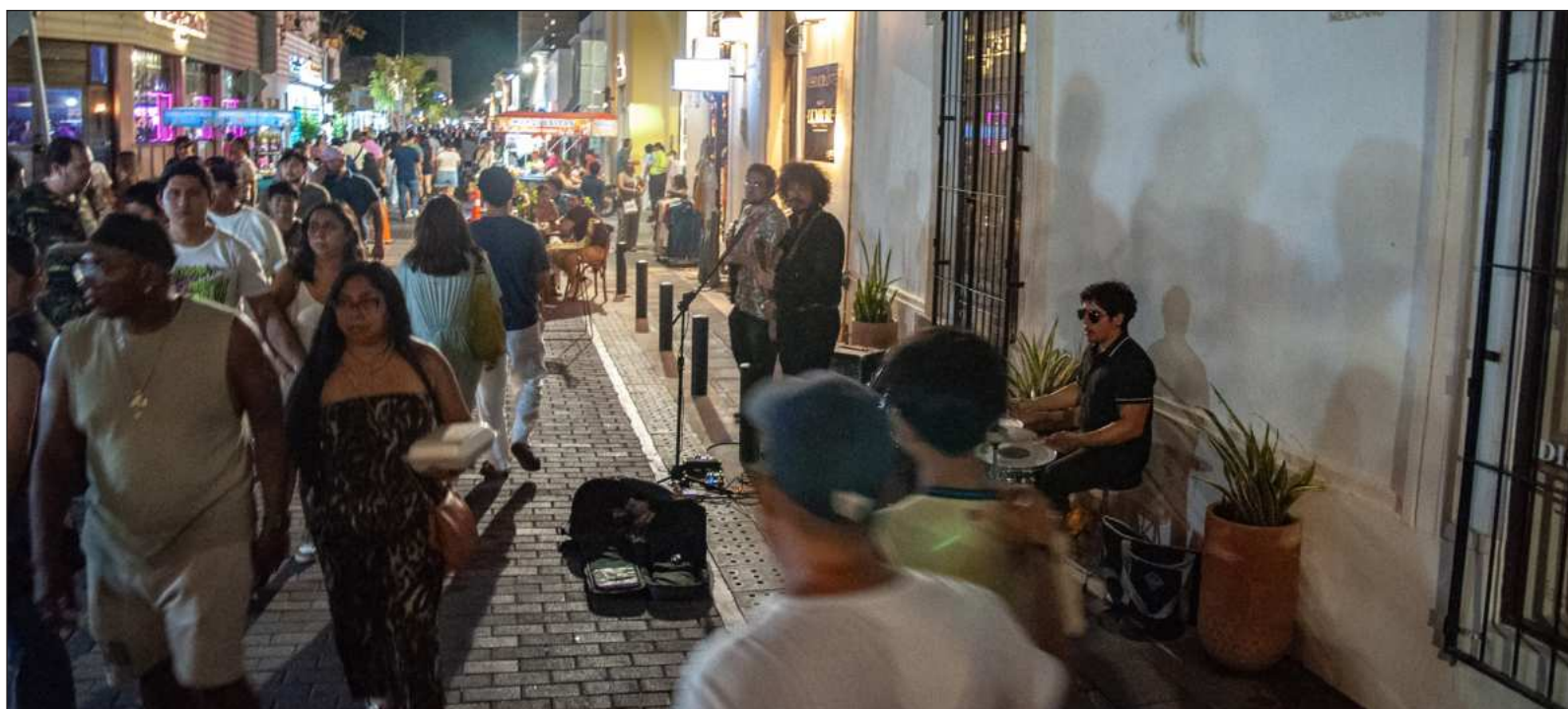
▲ “Algunos gestores y promotores ‘culturales’ confunden con mucha facilidad estos acontecimientos: creen que si ofrecen al público música popular y comercial es porque las audiencias eso esperan, sin ponerse a pensar que la música alternativa tendría más poder socializador y culturizador”.

Otra circunstancia poco afortunada fue que la excesiva cantidad de eventos estuvieran encajados en dos días, el sábado 23 y el domingo 24, cuando bien pudieron suceder a lo largo de una semana, para que los ciudadanos tuvieran la oportunidad de acudir a la mayor diversidad de actos. Para muchos que quisieron asistir a los otros eventos, resultó imposible, lo cual fue realmente frustrante. Ojalá que, en las próximas ediciones de la Noche Blanca, los responsables de la planeación y la operación tomen en cuenta el carácter formativo que deben cumplir los eventos, lo cual eliminaría el enfoque del entretenimiento, y determinen menor cantidad y mayor calidad de los actos.