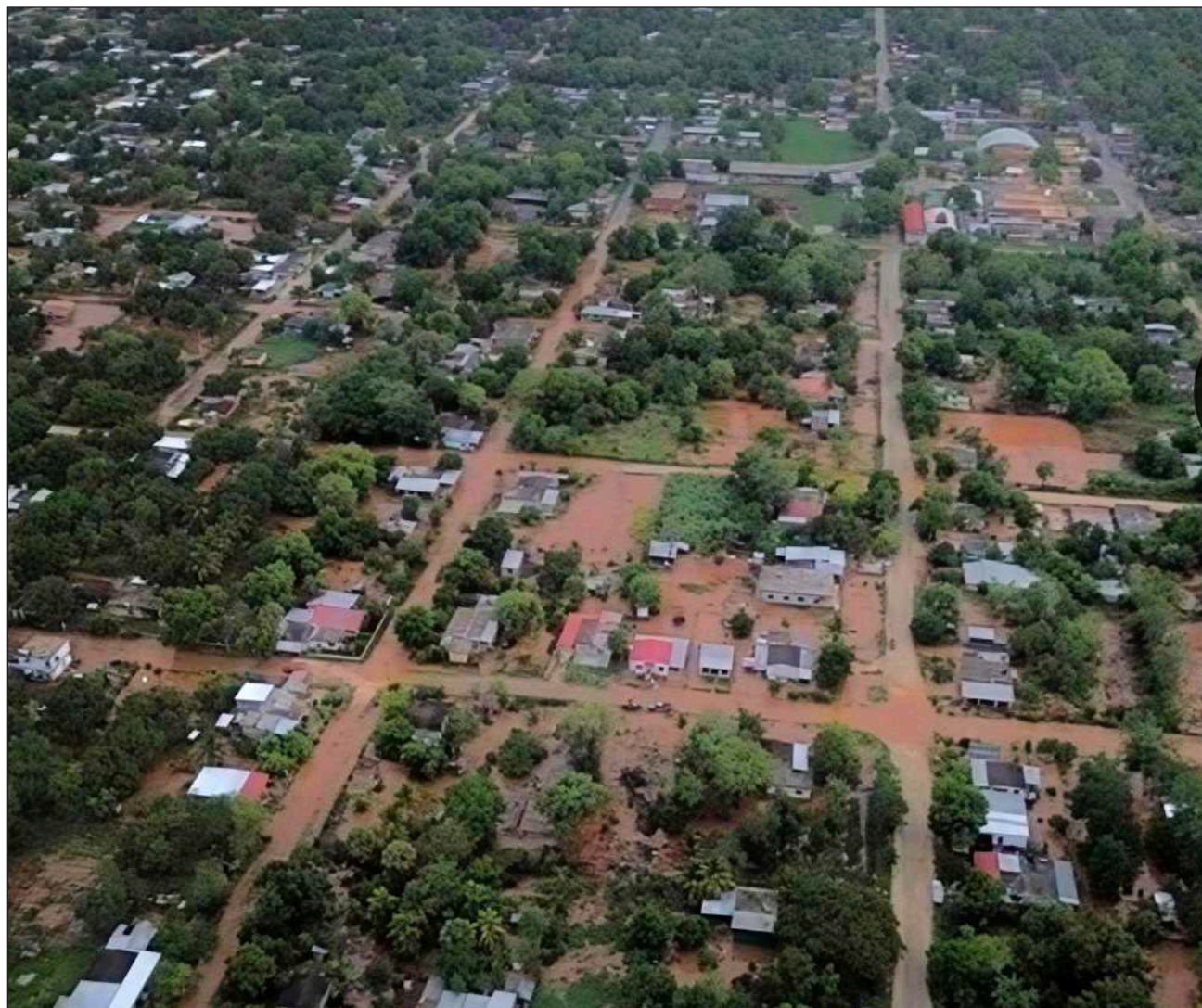
▲ Autoridades desalojaron zonas de la junta municipal Alfredo V. Bonfil y trasladaron a familias al albergue.

"El esquema contempla contratos mixtos y modelos de inversión compartida, permitiendo la participación de empresas nacionales e internacionales ante las limitaciones financieras de Pemex para desarrollar proyectos en solitario".