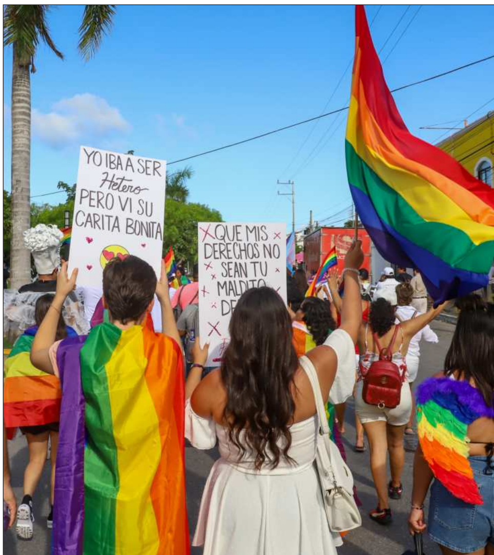
▲ La movilización también busca presionar para que se utilicen adecuadamente los recursos instituidos para la lucha contra la homofobia, lesbofobia y transfobia.

La movilización también busca presionar para que se respeten y utilicen adecuadamente los recursos instituidos para la lucha contra la homofobia, lesbofobia y transfobia en el municipio.