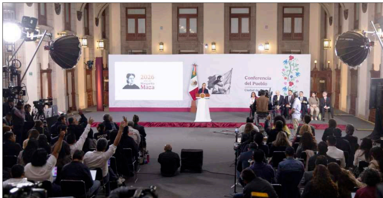
▲ La mandataria federal aseveró que su gobierno no está interviniendo en esta investigación.