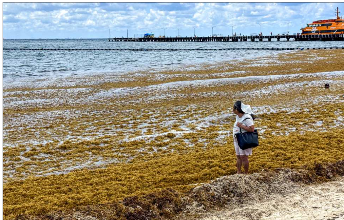
▲ De acuerdo con el más reciente semáforo difundido por las autoridades estatales correspondiente al día 30 de mayo, 34 de las 40 playas monitoreadas tienen arribo excesivo de sargazo y tres, abundante.

"Generalmente vemos con anticipación de dos, tres, cuatro o seis meses como está la cantidad de sargazo desarrollándose allí (frente a la costa africana) y sabemos que en seis, siete u ocho meses,