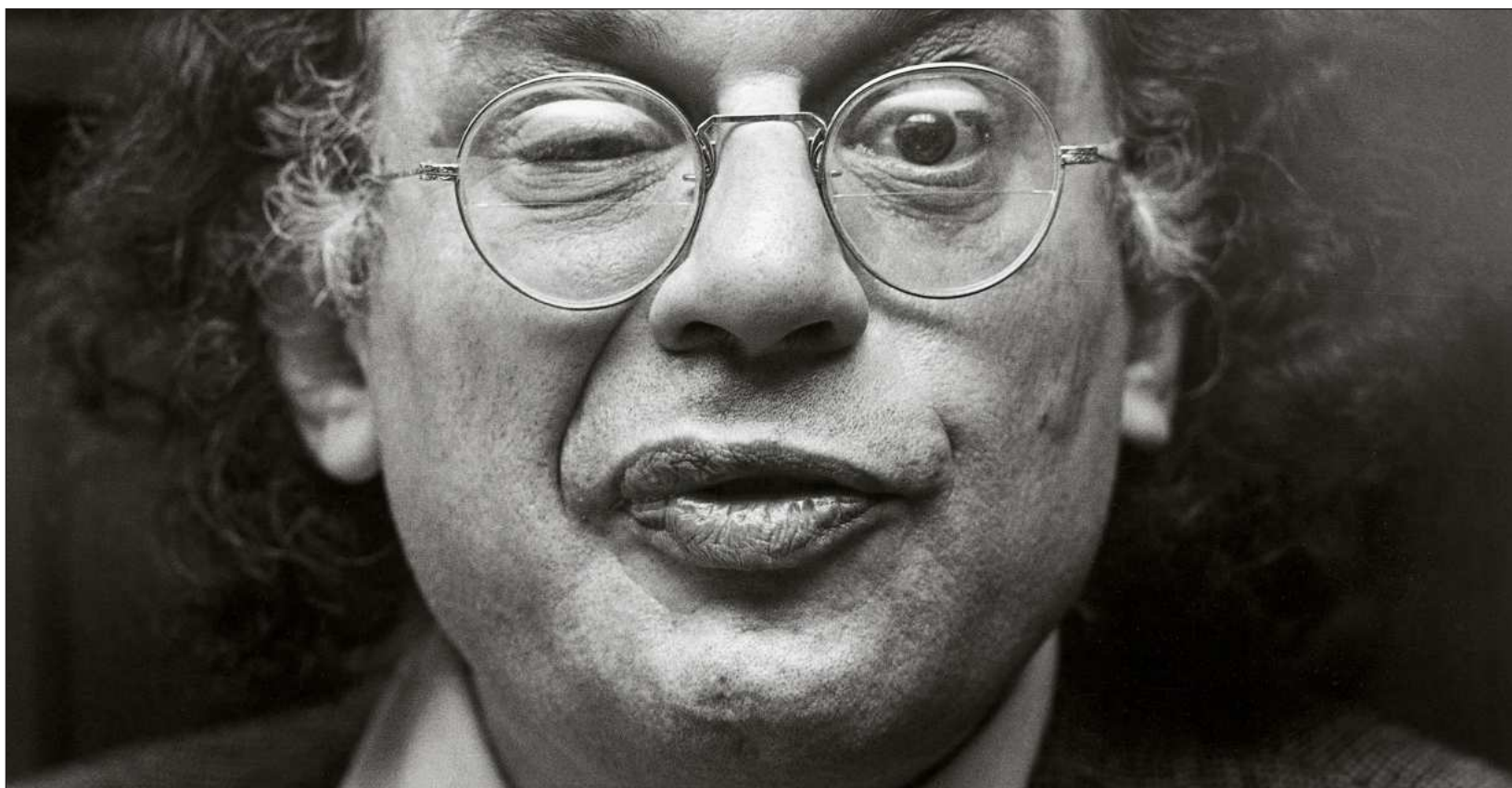
▲ "Los términos 'poético' y 'poéticamente' son malas palabras; deben evitarse", se dijo Moore mientras traducía Aullido de Ginsberg.

Aquellas palabras acompañaron todo el proceso de traducción. Optó por el castellano voseado del Río de la Plata para trasladar aquella oralidad. No quería una lengua rígida ni neutral, sino una lengua capaz de sostener el ritmo del poema.