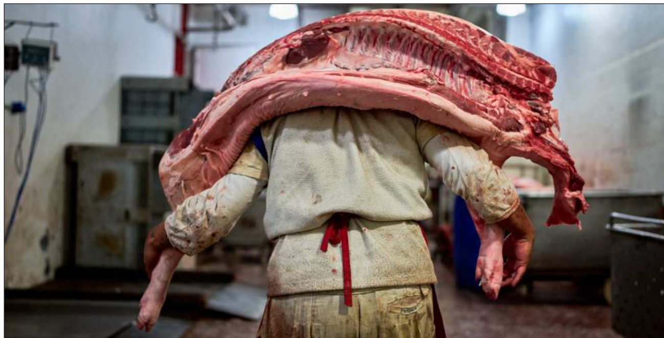
▲ Según el informe, el retroceso obedece a la "existencia de violaciones regulares de los derechos generales".

El informe recordó que "Argentina ha instituido un protocolo antibloqueo para mantener 'el orden público en caso de bloqueos de carreteras', por el cual se autoriza