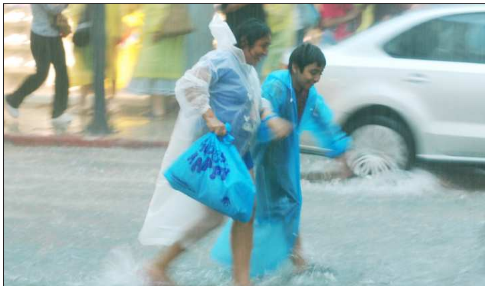
▲ La decisión de suspender las actividades económicas se debe a que actualmente muchas calles, avenidas y carreteras presentan encharcamientos e inundaciones que dificultan la movilidad y representan riesgos para la población.

Asimismo, la Secretaría de Educación del Gobierno del Estado de Yucatán (Segey) de-