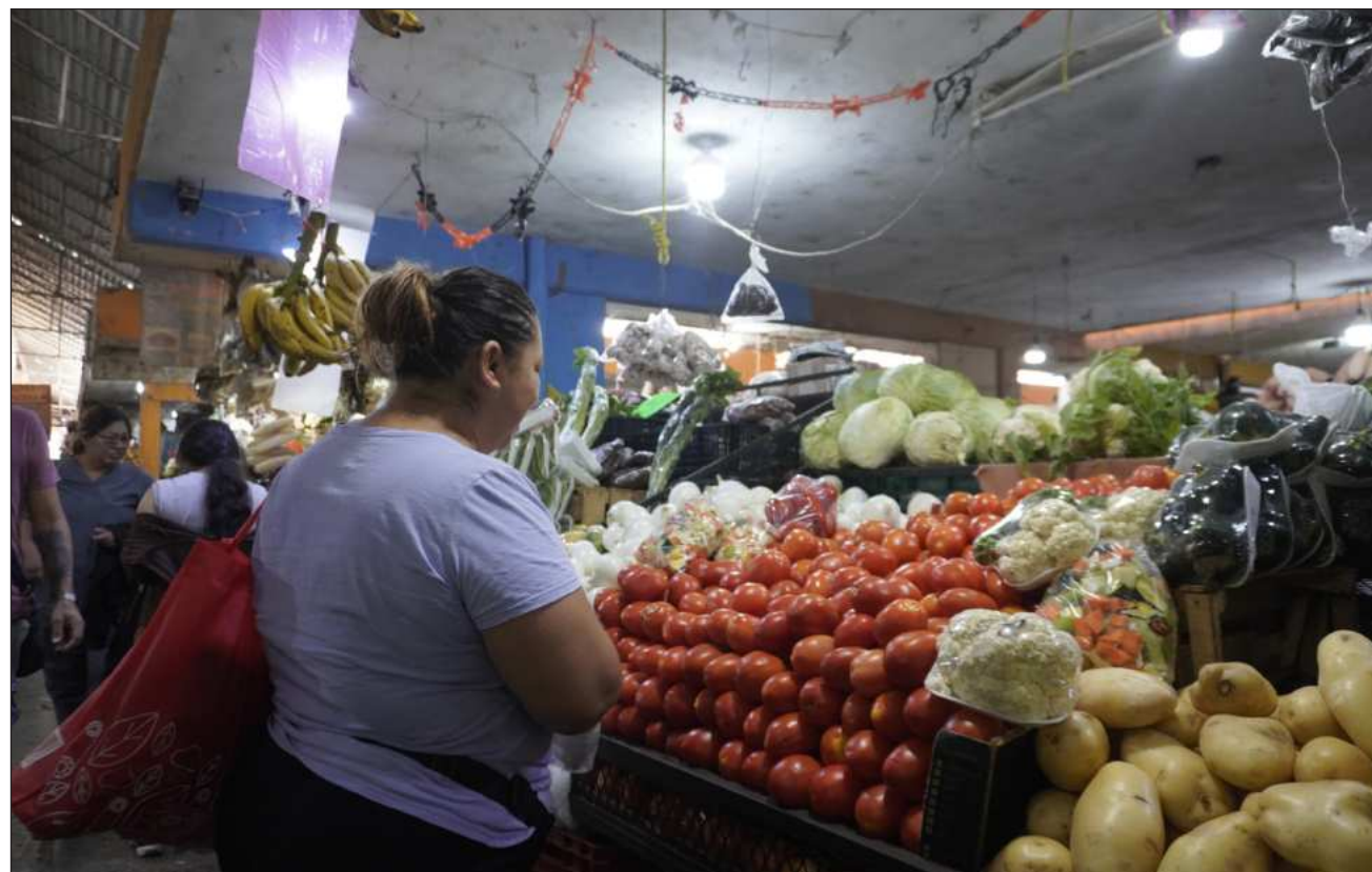
▲ La Presidenta aseguró que se trabaja con las centrales de abasto para evitar intermediarios y con ello disminuir los precios.

Aseguró que se ha trabajado con las centrales