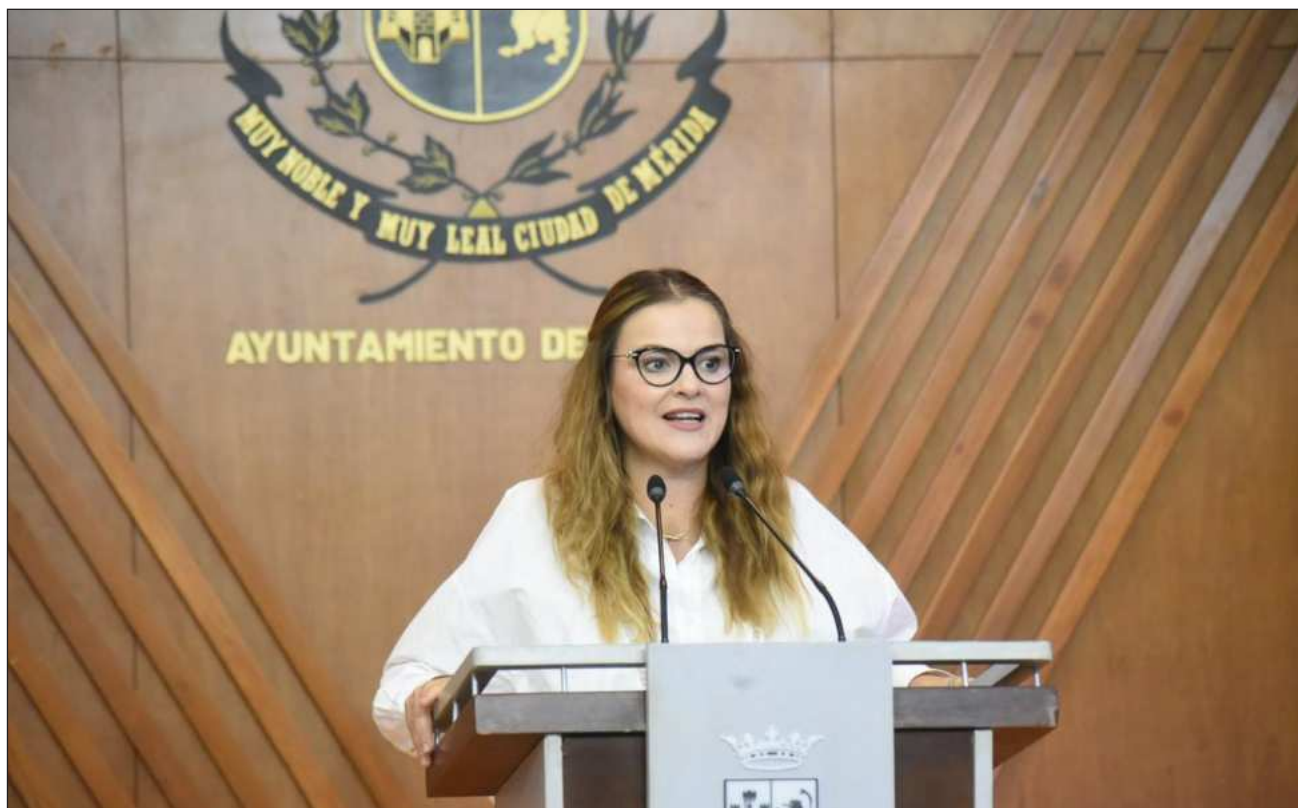
▲ La presidenta municipal recordó que el ayuntamiento cuenta con un refugio para mujeres y sus familias.

Y es que en una semana se registró un feminicidio