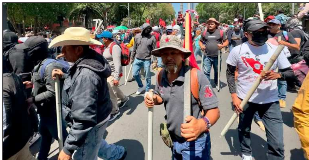
▲ El movimiento magisterial ha mostrado habilidad para buscar aliados llamando a otros grupos inconformes, como los padres de los 43 estudiantes de la Normal de Ayotzinapa o los transportistas.

Eso sí, a estas alturas del ciclo escolar, queda pendiente evaluar si se habrán logrado las metas propuestas al inicio y cuál fue el aprovechamiento real del alumnado, ya que entre huelgas y lluvias, llegaremos al cierre sin clases continuas, lo que obligará a ajustes el próximo año.