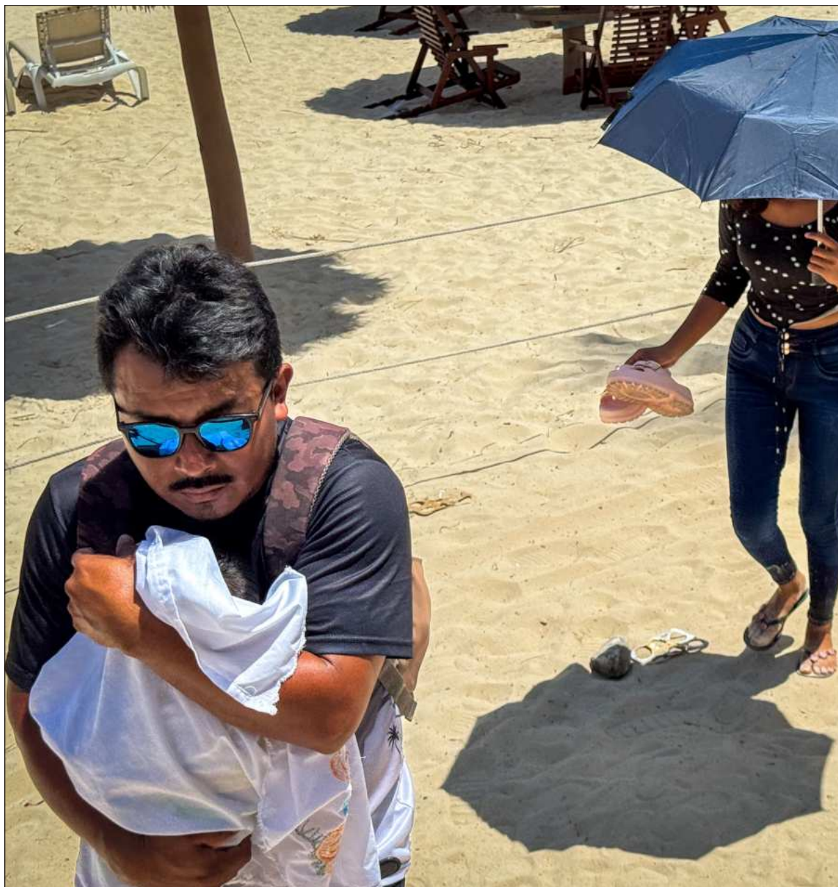
▲ "En México el delito de sustracción ilegal de menores no prescribe; parece lógico dada la gravedad del delito".