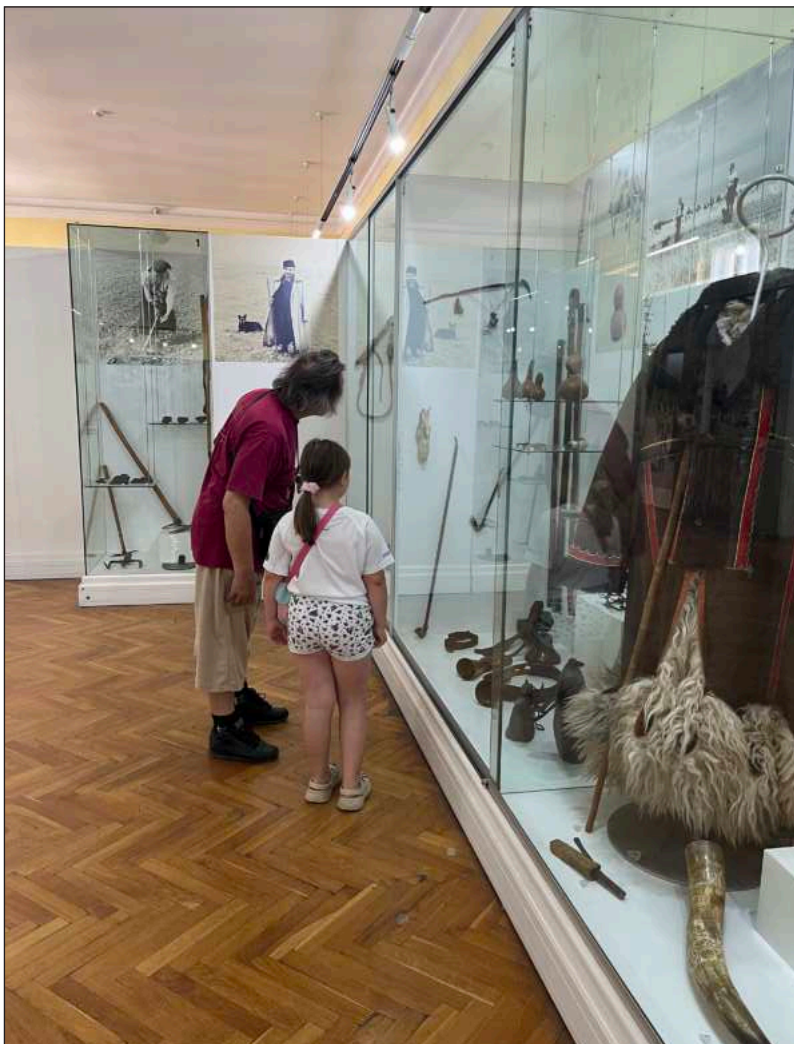
▲ “Si bien el museo inició como un instrumento de dominación (...) el llamado que hacemos ahora es darle un giro y hacerlo mucho más inclusivo”.