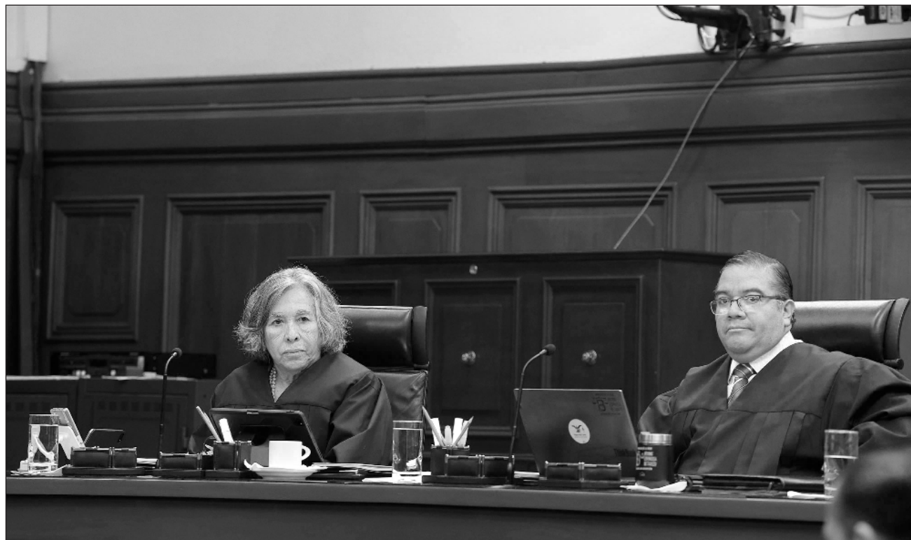
▲ La ministra María Estela Ríos ya tiene listo un proyecto de sentencia sobre desplazamiento forzado.

De aprobarse el proyecto -enlistado para la sesión de este lunes- se negaría el amparo promovido por la asociación civil Consejo Nacional de Litigio Estratégico, que acusó una omisión absoluta del Congreso al no legislar sobre desplazamiento forzado interno, en presunta violación del artículo 73 constitucional y del artículo 2 de la Convención Americana sobre Derechos Humanos.