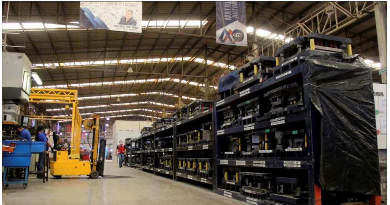
▲ Economía presentará el próximo 16 de junio una serie de propuestas que reflejan los intereses de la planta industria.

“Estamos en una conversación formal, ojalá el día de mañana logremos que Canadá también participe. México en ese sentido tiene una posición muy sólida