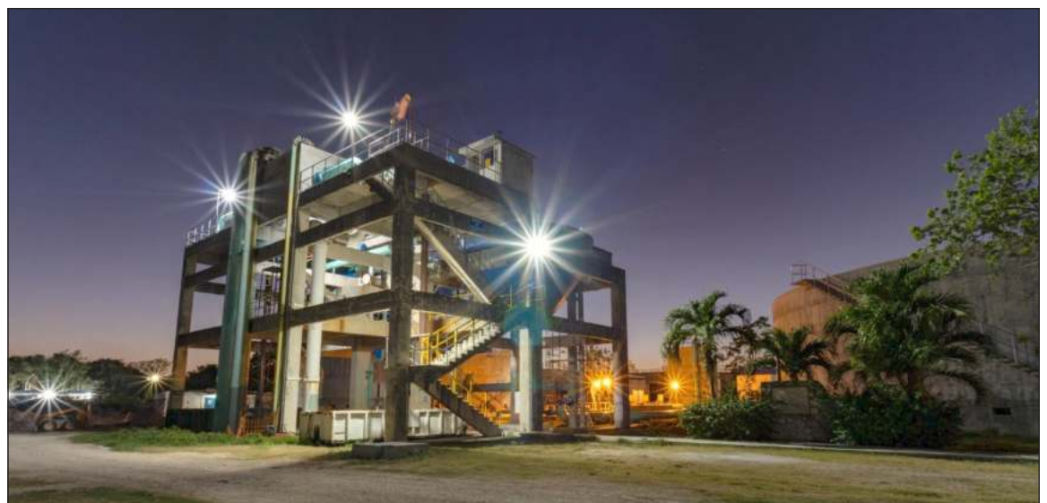
▲ La planta absorberá el incremento de la población hasta llegar a tratar más de 600 litros por segundo.

La planta de tratamiento norponiente actualmente cuenta con una capacidad de tratamiento de 200 litros por segundo, gracias a esta moderniza-