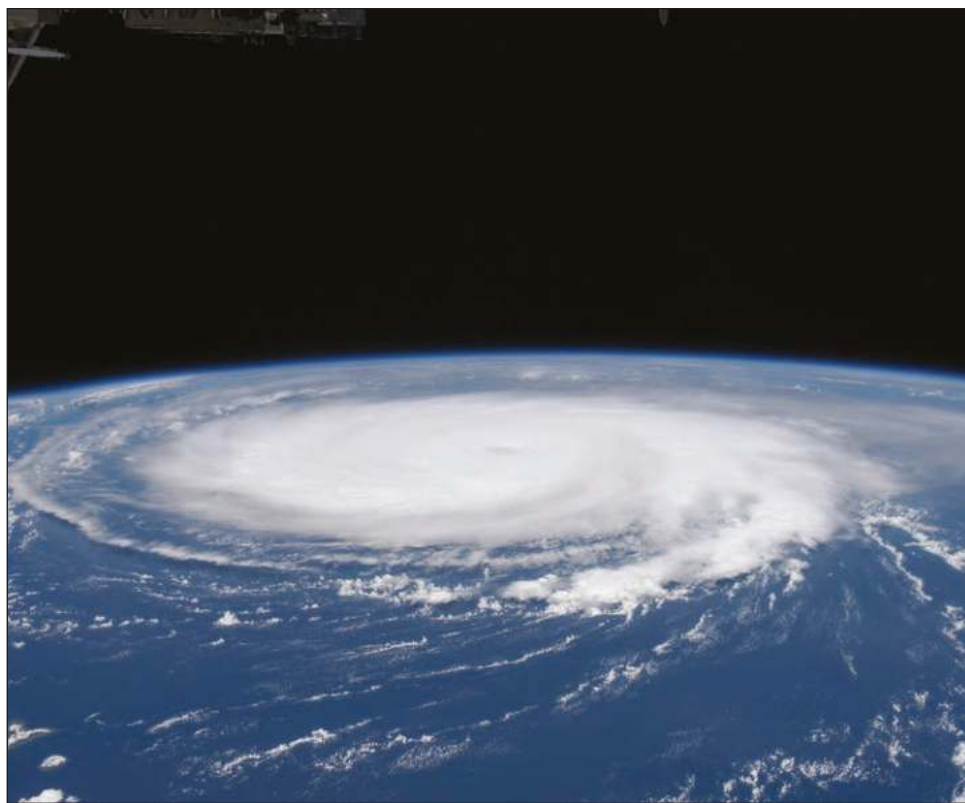
▲ Los expertos de NHC prevén que el remanente de Agatha se fortalecerá de nuevo en aguas del Golfo y se dirigirá al oeste de Cuba para después pasar por Florida.