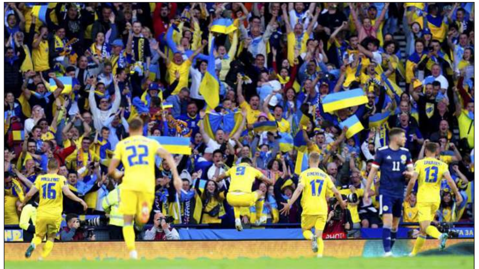
▲ Roman Yaremchuk, de Ucrania, celebra el segundo gol de su equipo frente Escocia, ayer en el emotivo duelo de repechaje que se celebró en Glasgow.