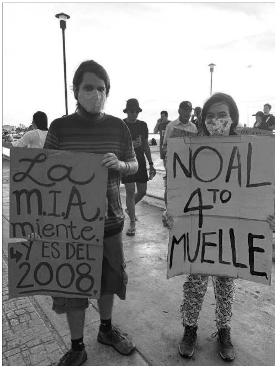
▲ El Colectivo Ciudadano Isla Cozumel anunció que esperará a que se concrete la audiencia constitucional para dar a conocer su postura al respecto.

Dicho amparo se presentó luego de que el 7 de diciembre del 2021 la empresa Muelles del Caribe recibiera la autorización federal en materia ambiental por parte de la Semarnat, así como el título de concesión de la Zona Federal Marítimo Terrestre, publicado en el Diario Oficial de la Federación el pasado 5 de enero del presente año.