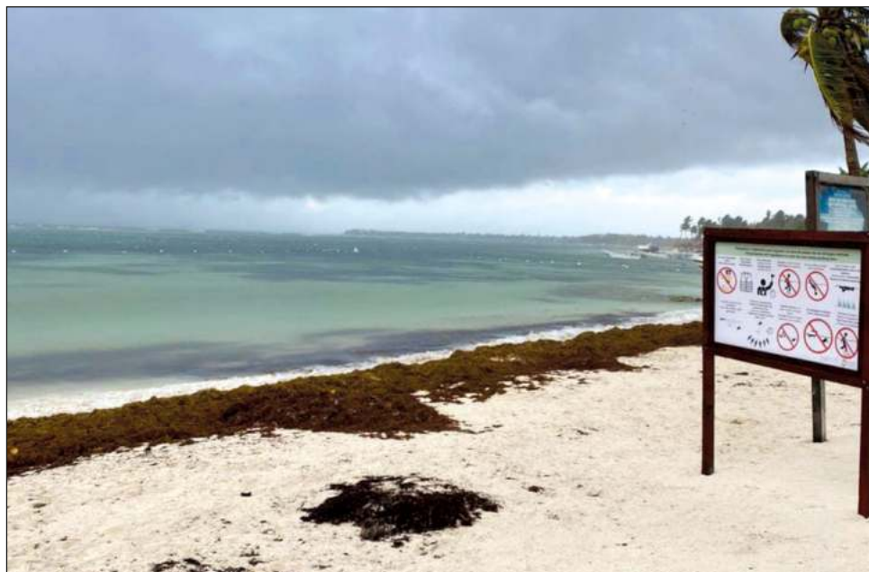
▲ Las lluvias y huracanes ayudan bastante a que el sargazo se mantenga alejado de las costas, pero esta vez no ocurrió así, informó la Red estatal de Monitoreo.

de mayor recale son Puerto Morelos, Punta Esperanza y Playacar, en Solidaridad; Akumal y Xcacel-Xcacelito, en Tulum; así como la costa este de la isla de Cozumel.