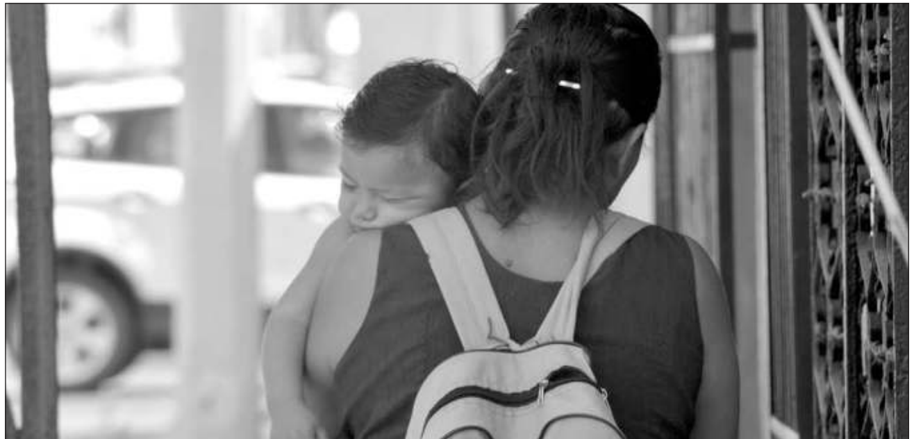
▲ Muchos padres no pagan pensión porque evaden su responsabilidad o no cuentan con el recurso para ofrecer una cantidad digna; incluso algunos prefieren ir a la cárcel, pero el castigo no soluciona la situación de sus hijos.

La especialista indicó que muchos padres no pagan la pensión porque evaden su responsabilidad, otros no cuentan con el recurso para ofrecer una pensión digna, o prefieren ir a la cárcel para evitar este pago. Las mujeres están merced de lo que los hombres les quieran dar, si es que les dan algo.