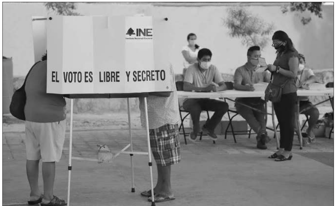
▲ En la jornada electoral del domingo se define al próximo gobernador o gobernadora, así como las diputaciones locales.

Lucio Hernández mencionó que cada una de las estrategias que fueron definidas para este proceso, se han ido implementando