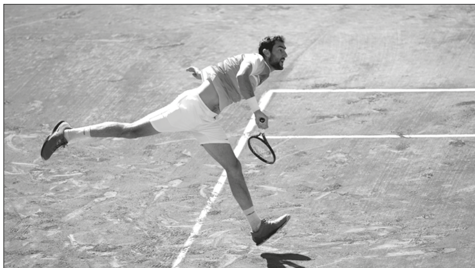
▲ Marin Cilic (foto) dejó fuera al ruso Andrey Rublev en una tremenda batalla de cinco sets.

Cilic, de 33 años, se medirá a Casper Ruud, quien se convirtió en el primer noruego en llegar a semifinales en un torneo grande. Venció 6-1, 4-6, 7-6 (2), 6-3 al danés Holger Rune, de 19 años. El otro partido de semifinales tendrá a Rafael Nadal contra Alexander Zverev.