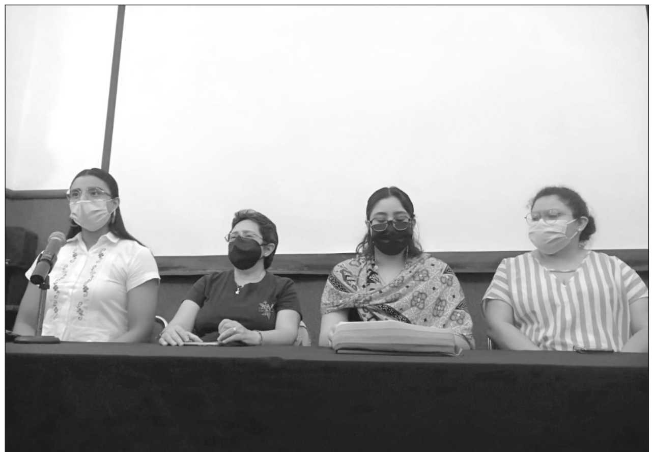
▲ Las representantes de las organizaciones que elaboraron el protocolo indicaron que desde 2019 existía la exigencia de un protocolo funcional para las denuncias de violencia de género y discriminación en la UADY.