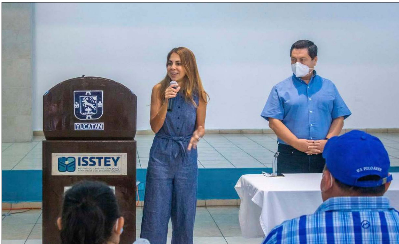
▲ Proponen reunión para viernes 3 de junio a las 11 horas en el recinto del Poder Legislativo, donde cada involucrado expondrá lo que considere pertinente.