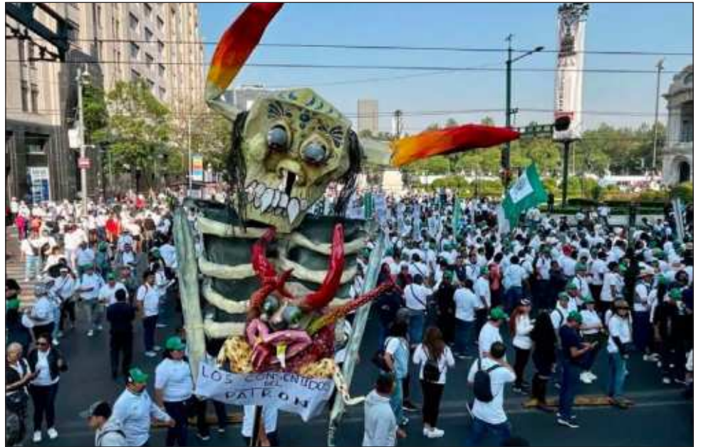
La marcha del Día del Trabajo transcurrió en medio de reclamos y propuestas, entre ellos la mejora de salarios contractuales y la reducción de los impuestos.

En contraparte, la Nueva Central de Trabajadores (NCT) saludó las reformas que han favorecido a los obreros mexicanos; sin embargo, señaló que "han sido insuficientes para reparar los daños ocasionados por las políticas neoliberales", como la democracia e independencia sindical; la recuperación del poder adquisitivo y la resolución de anteriores y