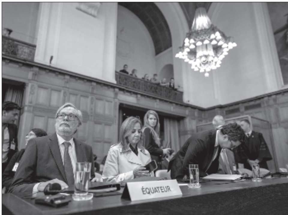
▲ El grupo de abogados de la defensa ecuatoriana ante la Corte Internacional de Justicia, afirmó que se han brindado todas las facilidades para proteger la Embajada de México.