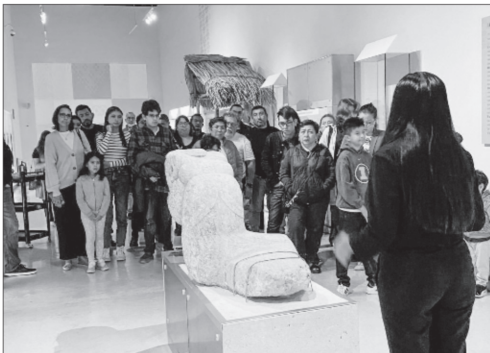
▲ El estado conmemora el Día Internacional de los Museos con actividades como conferencias, conciertos, talleres, exposiciones, bazares y recorridos guiados.